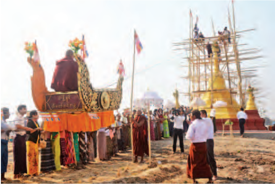
ရေစက်သွန်းချအမျှပေးဝေခဲ့သည်။ စေတီတော် ထီးတော်တင်ပွဲနှင့် သာမဏေ ၁၀၈ ပါး ရဟန်းခံရှင်ပြုပွဲကျင်းပခဲ့ရာ ချောင်းကျိုးကျေးရွာအုပ်စု ၀၀၀ ဒေသခံ ရွာသူရွာသားများ စည်ကားစွာဖူးမြော်သာစရာဆိုခဲ့ကြသည်။

လယ်ယာလုပ်ငန်းတို့ တလင်းသိမ်းချိန်နှင့် နွေရာသီကျောင်းပိတ်ရက်လည်းဖြစ်သော တပေါင်းလတွင် မြန်မာနိုင်ငံအရပ်ရပ်၌ ဗုဒ္ဓဘာသာဝင်တို့ ရဟန်းခံရှင်ပြုပွဲများ၊ တပေါင်းလသပုံစေတီပွဲများ၊ အလှူမင်္ဂလာပွဲများ ကျင်းပကြသည်။