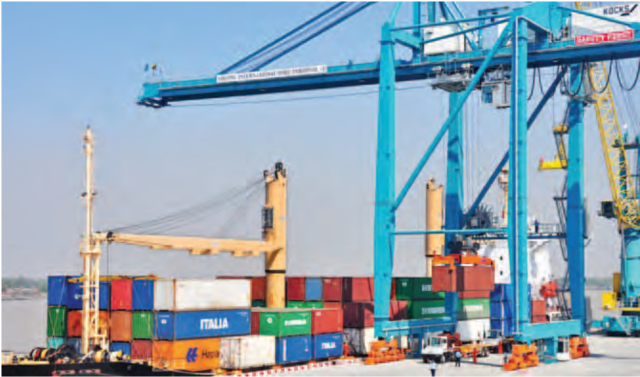
အမှတ်(၁)အလုံအပြည်ပြည်ဆိုင်ရာဆိပ်ကမ်းကို တွေ့ရစဉ်။