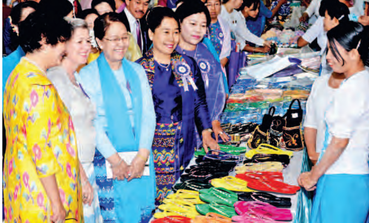
မြန်မာနိုင်ငံအမျိုးသမီးရေးရာအဖွဲ့ချုပ် ဂုဏ်ထူးဆောင်နာယက ဒေါ်ခင်ခင်ဝင်း အမျိုးသမီးသက်မွေးပညာသင်တန်းကျောင်းနှင့် အိမ်တွင်းမှုသက်မွေး လုပ်ငန်းသင်တန်းကျောင်းများမှထုတ်လုပ်သည့် ထွက်ကုန်များကို ကြည့်ရှုအားပေးစဉ်။ (သတင်းစဉ်)

နိုင်ငံတော်သမ္မတ ဦးသိန်းစိန်နှင့် ဇနီး မလေးရှားနိုင်ငံသို့ ချစ်ကြည်ရေးခရီး သွားရောက်မည် နေပြည်တော် မတ် ၉ ပြည်ထောင်စုသမ္မတမြန်မာနိုင်ငံတော် နိုင်ငံတော်သမ္မတ ဦးသိန်းစိန် နှင့်ဇနီး ဒေါ်ခင်ခင်ဝင်းတို့သည် မလေးရှားနိုင်ငံ ဘုရင် ဆူလတန်အဗ္ဗ ဇူဟာလင်မ် မူအက်ဒ်ဇ်ရှားနှင့် မိဖုရား ရာဂျာ ပါမိုင်ဆူရီ အက်ဂွန်တွန်ကူ ဟာဂျာ ဟာမိနာတို့၏ ဖိတ်ကြားချက်အရ မကြာမီကာလအတွင်း မလေးရှား နိုင်ငံသို့ ချစ်ကြည်ရေးခရီး သွားရောက်မည်ဖြစ်သည်။ (သတင်းစဉ်)