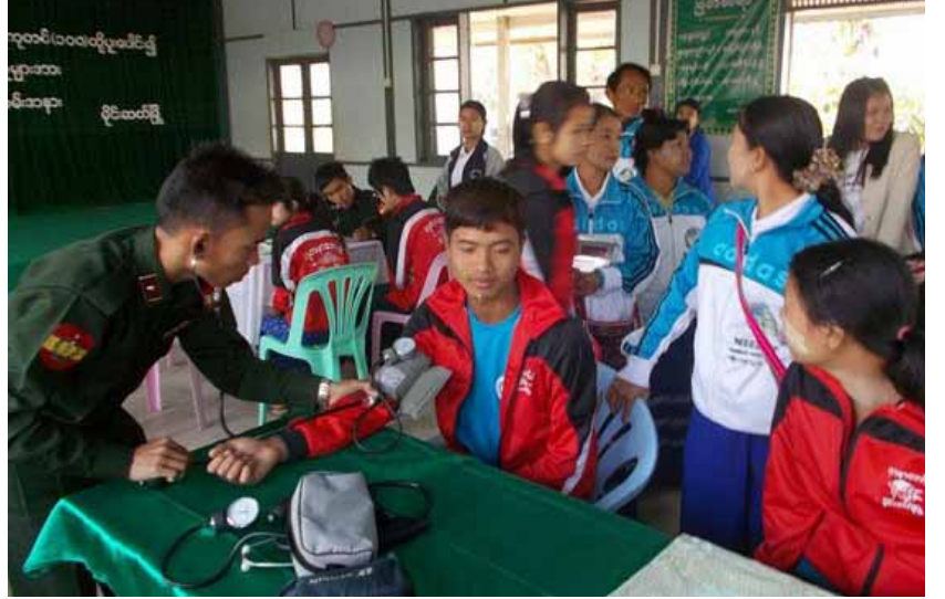
ကျောက်ခုံကြေးကျောင်းသား၊ ကျောင်းသူ စုစုပေါင်း ၂၈၈ ဦးတို့အား ကျန်းမာရေးစောင့်ရှောက်မှုပေးပြီး လိုအပ်သော ဆေးဝါးများထောက်ပံ့ပေးခြင်း

၎င်းတို့နှင့်အတူ မြို့ဦးကျောင်းတိုက် မဇ္ဈိမလူမှုကူညီရေးအသင်းဥက္ကဋ္ဌ