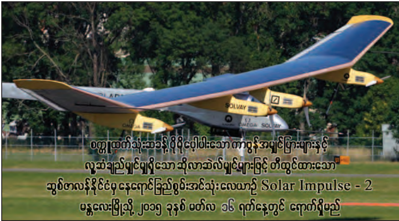
ဝတ္ထုထုတ်သုံးသော ဝီဂိုပေါ့ပါးသော ကာကွန်အမျှင်ဖြားများနှင့် လူသံချည်မျှင်မျှင်မျှင်သော ဆိုလာဆဲလ်မျှင်များဖြင့် တီထွင်ထားသော ဆွစ်ဇာလန်နိုင်ငံမှ နေရောင်ခြည်စွမ်းအင်သုံး လေယာဉ် Solar Impulse - 2 မန္တလေးမြို့သို့ ၂၀၁၅ ခုနှစ် မတ်လ ၁၆ ရက်နေ့တွင် ရောက်ရှိမည်