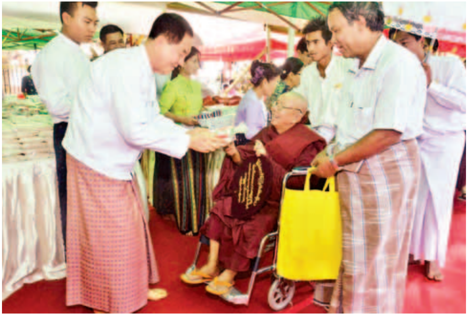
သွေးသည် အသက်