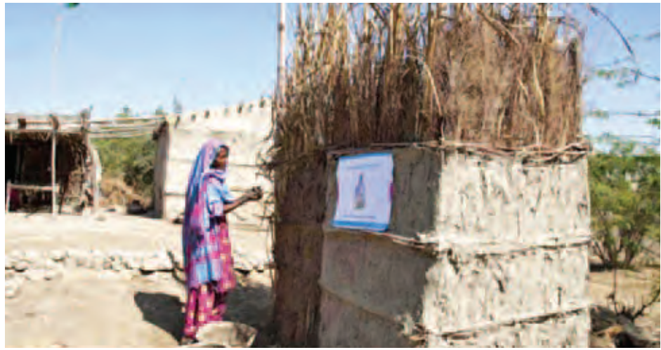
ပါကစ္စတန်နိုင်ငံသူတစ်ဦး ရေအိမ်ဆောက်နေစဉ်။