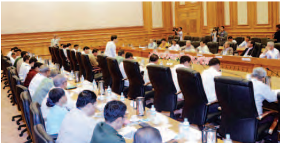
စီနှင့် ငြိမ်းချမ်းရေးပါတီဥက္ကဋ္ဌ ဦးစိုး မောင်၊ ဒီမိုကရက်တစ်ပါတီ(မြန်မာ) ဥက္ကဋ္ဌ ဦးသုဝေ၊ ချင်းဒီမိုကရေစီအဖွဲ့ ချုပ်ပါတီဥက္ကဋ္ဌ ဦးစိုင်းဆော့ခီနှင့် ညီညွတ်သော ဒီမိုကရက်တစ်ပါတီ ဥက္ကဋ္ဌ ဦးလှမြင့်တို့က အမျိုးသားပညာ ရေးဥပဒေကို ပြင်ဆင်သည့်ဥပဒေ ကြမ်းအပေါ် မိမိတို့ပါတီ၏ သဘောထားအမြင်များ၊ အတွေ့အကြုံများ အပေါ် အခြေခံ၍ ဆွေးနွေးအကြံပြု ကြသည်။

နိုင်ငံရေးဆိုင်ရာ၊ လူမှုရေးဆိုင်ရာ၊ စီးပွားရေးဆိုင်ရာ၊ ပညာရေးဆိုင်ရာ မူဝါဒများရှိပါကြောင်း၊ ထိုသို့ မူဝါဒ များရှိသည့် နိုင်ငံရေးပါတီများ၏ အကြံပြုချက်များကို ရယူလို၍ ယခုကဲ့သို့ ဖိတ်ကြားရခြင်းဖြစ်ပါ ကြောင်းဖြင့် ပြောကြားသည်။ ယင်းနောက် ကိုးကန့်ဒီမိုကရေစီနှင့် ညီညွတ်ရေးပါတီဥက္ကဋ္ဌ ဦးထွန်းနိုင်၊ ကယားလူမျိုးစု ဒီမိုကရေစီပါတီ အတွင်းရေးမှူး ဦးစိုင်းနိုင်နိုင်ထွေး၊ ရခိုင်ပြည်နယ်အမျိုးသားအင်အားစု ပါတီဥက္ကဋ္ဌ ဦးအေးကြိုင်၊ အမျိုးသား နိုင်ငံရေးမဟာမိတ်များ အဖွဲ့ချုပ်ပါတီ ဒုတိယဥက္ကဋ္ဌ ဦးသိမ်းကြည် ဒီမိုကရေ