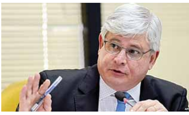
ဘရာဇီးတရားသူကြီးချုပ် ရိုဒရီဂိုဂျာနော့။

သမ္မတ၏ အလုပ်သမားပါတီသည် ပီထရိုဘရာကန်ထရိုက်စာချုပ်များမှ