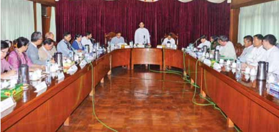
ဥက္ကဋ္ဌနှင့်တာဝန်ရှိသူများ၊ သက်ဆိုင်ရာ ကုမ္ပဏီများမှ တာဝန်ရှိသူများ တက်ရောက်ကြသည်။ အစည်းအဝေးတွင် ခွင့်ပြုနေရာ၌ လုပ်ငန်းစီမံကိန်းများ ဆက်လက် အကောင် အထည်ဖော်နေခြင်းနှင့် စပ်လျဉ်း၍ ပတ်ဝန်းကျင်အပေါ် သက်ရောက်မှုမရှိစေရေး၊ စီမံကိန်း

ကာကွယ်ရေးဝန်ကြီးဌာန စစ် ထောက်ချုပ်ရုံးပိုင်မြေနေရာများတွင် မြန်မာနိုင်ငံရင်းနှီးမြှုပ်နှံမှုကော်မရှင်၏ ခွင့်ပြုမိန့်ဖြင့် ဆောင်ရွက်လျက်ရှိသော လုပ်ငန်းစီမံကိန်းများနှင့် စပ်လျဉ်းသည့် ညှိနှိုင်းအစည်းအဝေးကို ယနေ့နံနက် ၉ နာရီခွဲတွင် ရန်ကုန်တိုင်းဒေသကြီး အစိုးရအဖွဲ့ အစည်းအဝေးခန်းမ၌ ကျင်းပသည်။(ယာပုံ)