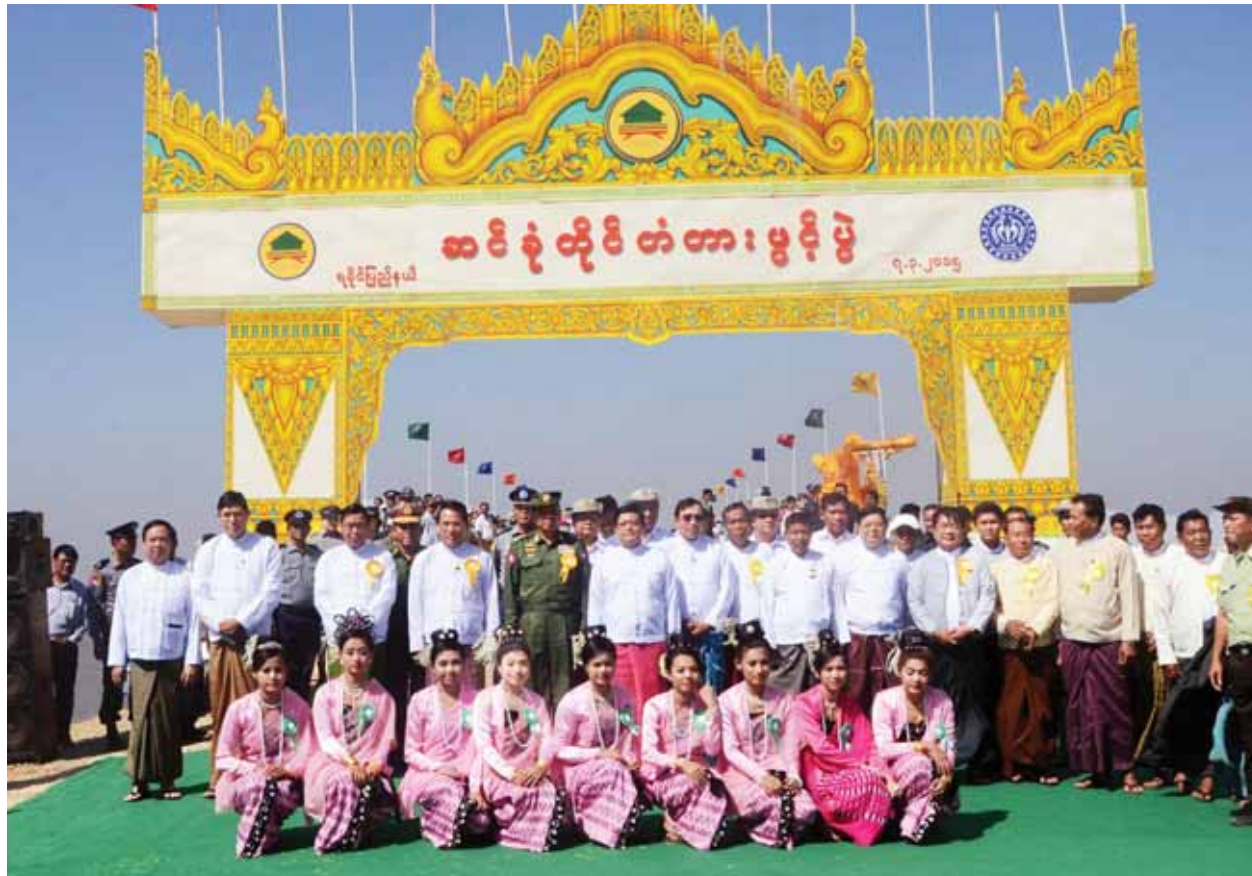
ဒုတိယသမ္မတ ဦးညွှန်ထွန်း ဆင်နွှဲတိုင်တံတားဖွင့်ပွဲအခမ်းအနားသို့ တက်ရောက်လာသူများနှင့်အတူ တံတားမုခ်ဦးရွှေ၌ စုပေါင်းမှတ်တမ်းတင် ဓာတ်ပုံရိုက်စဉ်။

မိမိတို့နိုင်ငံသည် မဟာဗျူဟာအရအချက်အချာကျသည့် ပထဝီအနေ အထားကို ပိုင်ဆိုင်ထားသည့်နိုင်ငံဖြစ်ပါကြောင်း၊ အိန္ဒိယနှင့် အာဆီယံ နိုင်ငံများအကြား၊ အိန္ဒိယနှင့် တရုတ်နိုင်ငံအကြား၊ အိမ်နီးချင်းနိုင်ငံများအကြား၊ အိန္ဒိယသမုဒ္ဒရာနှင့် ပစိဖိတ်သမုဒ္ဒရာအကြား ဆက်သွယ်ပေးမည့်လမ်းကြောင်း များသည် မိမိတို့ နိုင်ငံအတွက်ရော ဒေသတွင်းနိုင်ငံများအတွက်ပါ အကျိုး ဖြစ်ထွန်းစေမည့် စီးပွားရေးစင်္ကြံကြီးများဖြစ်ပါကြောင်း၊ အဆိုပါစီးပွားရေးစင်္ကြံ ကြီးများ၏ အိန္ဒိယ သမုဒ္ဒရာဘက်သို့ထွက်မည့် အနောက်ဘက်တံတားများသည် ရခိုင်ကမ်းရိုးတန်းတစ်လျှောက်တွင် အစီအစဉ်ရှိနေပါကြောင်း၊ ထို့ကြောင့် ရခိုင် ပြည်နယ်၏ လမ်းပန်းဆက်သွယ်မှုဖွံ့ဖြိုးတိုးတက်ရေးသည် နိုင်ငံတော်စီးပွားရေး ဖွံ့ဖြိုး တိုးတက်မှုအတွက် အလွန်အရေးပါလှပါကြောင်း။