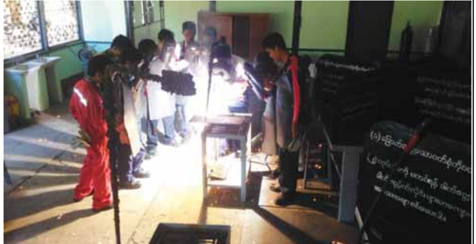
Electric Arc Welding သင်တန်းလက်တွေ့လေ့ကျင့်စဉ်။

ပြည်သူ့အတွက်ရထား ပဟိုပို ဆောင် ဆက် သွယ် ရေးကျောင်း အနေဖြင့် အလုပ်အကိုင်ကျွမ်းကျင်မှု အသိအမှတ်ပြု လုပ်ငန်းအဆင့် များနှင့်အညီ Competency Based Curriculum များ ရေးဆွဲပြီးအဆိုပါ သင်ရိုးညွှန်းတမ်းများနှင့်အညီ သင်တန်းများ ဖွင့်လှစ်ပို့ချလေ့ကျင့်ပေးမည့်အပြင် ကျွမ်းကျင်မှုစစ်သင်စစ်ဆေးရေး အသိအမှတ်ပြုလက်မှတ် များရရှိရေးကိုပါ ဆက်လက်ကြိုးပမ်း ဆောင်ရွက်ပေးသွား မည် ဖြစ်ပါသည်။ ပြည်သူ့အတွက် ရထားပို့ဆောင်ရေးဝန်ကြီးဌာနနှင့် လက်အောက်ဦးစီးဌာန၊ လုပ်ငန်းကျောင်း အသီးသီးတို့