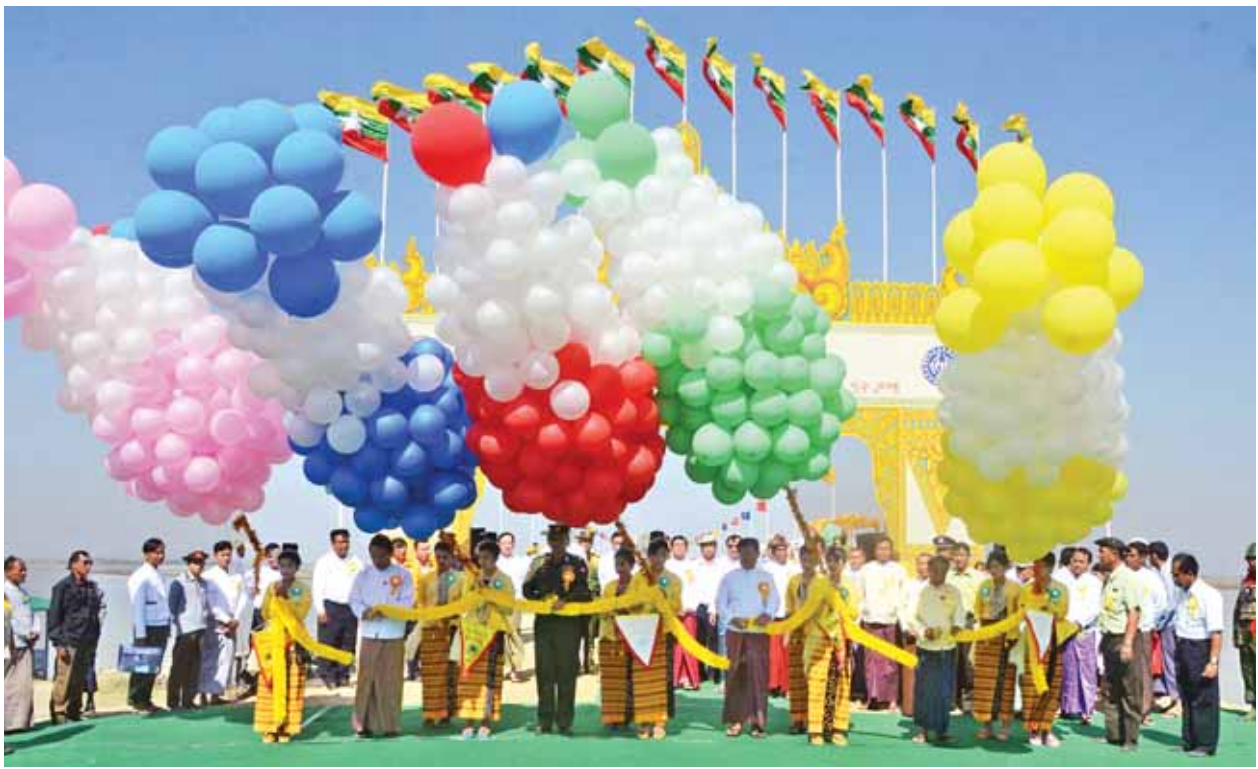
ဒုတိယသမ္မတ ဦးညွှန်ထွန်း စွန့်စားပေးမှု ဖွင့်ပွဲအခမ်းအနားသို့ တက်ရောက်အားပေးစဉ်။ (သတင်းစဉ်)

ထို့ကြောင့် မိမိတို့အစိုးရသည် တာဝန်ယူချိန်ကစပြီး တစ်နိုင်ငံလုံးလမ်းပန်း ဆက်သွယ်မှုကဏ္ဍ ဖွံ့ဖြိုးတိုးတက်ရေးအတွက် တစ်စိုက်မတ်မတ်ကြိုးပမ်း ဆောင်ရွက်ခဲ့ပါကြောင်း၊ တိုင်းဒေသကြီးနှင့် ပြည်နယ်အားလုံး တစ်ပြေးညီ ဖွံ့ဖြိုးတိုးတက်ရေးအတွက် ရည်ရွယ်ပြီး ပြည်ထောင်စုတစ်ခုလုံးအတွက် အကြား အလုပ်မရှိ ဖြန့်ကြက်ချိတ်ဆက်ပေးနိုင်မည့် လမ်းကွန်ရက်စနစ် ပင်မစီမံချက် ကြီးကိုရေးဆွဲခဲ့ပါကြောင်း၊ အဆိုပါစီမံချက်ကြီးကိုအခြေခံပြီး ကာလတိုစီမံကိန်း၊ ကာလလတ်စီမံကိန်းများရေးဆွဲကာ လမ်းပန်းဆက်သွယ်မှုကဏ္ဍ ဖွံ့ဖြိုး တိုးတက်ရန် စနစ်တကျအကောင်အထည်ဖော်လျက်ရှိပါကြောင်း။