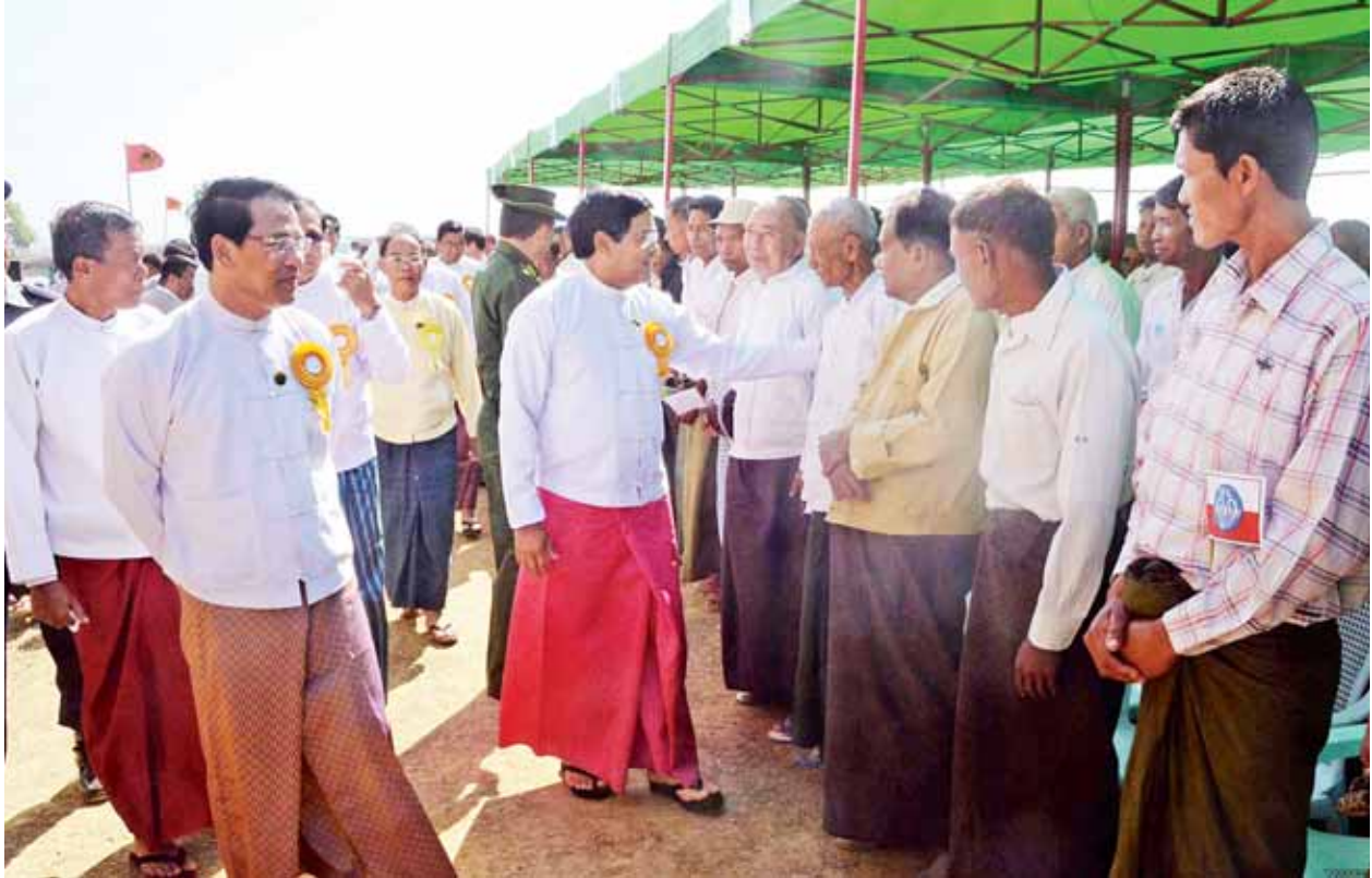
ဒုတိယသမ္မတ ဦးညွှန်ထွန်း၊ စွန်ရဲတံတားနှင့် ဆင်ခုံတိုင်တံတားဖွင့်ပွဲများသို့ တက်ရောက်လာသူများအား ရင်းရင်းနှီးနှီးနှုတ်ဆက်စဉ်။ (သတင်းစဉ်)

စွန်ရဲတံတားနှင့် ဆင်ခုံတိုင်တံတားတို့မှ ရခိုင်ပြည်နယ် တစ်ခုလုံးသို့ လည်းကောင်း၊ ရန်ကုန်-စစ်တွေလမ်းမှတစ်ဆင့် မြန်မာပြည် တစ်နံတစ်လျားသို့လည်းကောင်း ရာသီမရွေး အချိန်အခါမရွေး သွားလာနိုင်တော့မည်ဖြစ်။