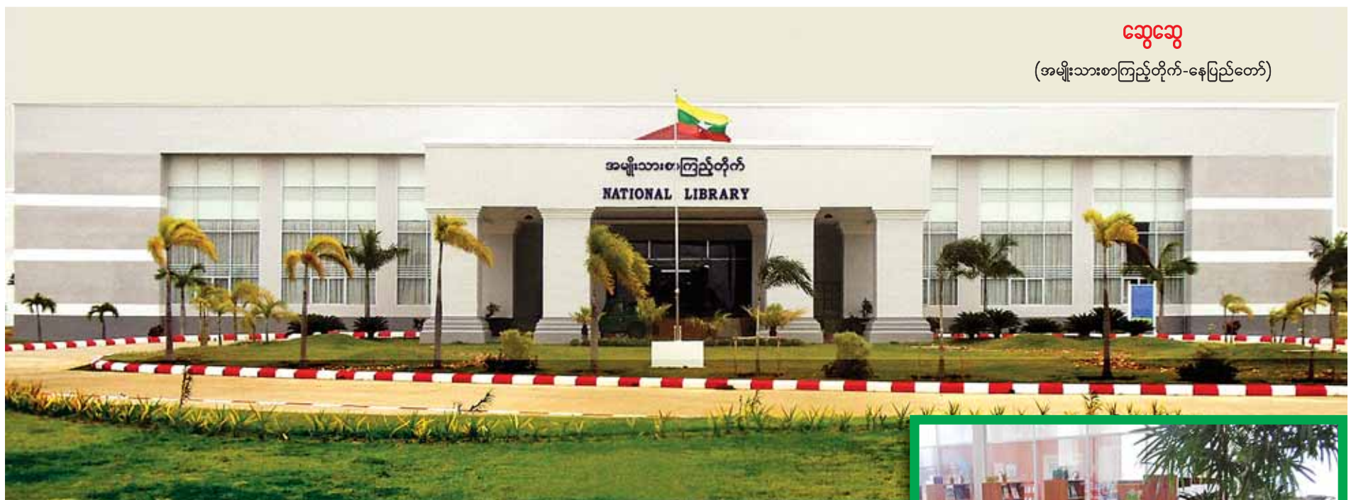
ဆွေဆွ (အမျိုးသားစာကြည့်တိုက်-နေပြည်တော်)