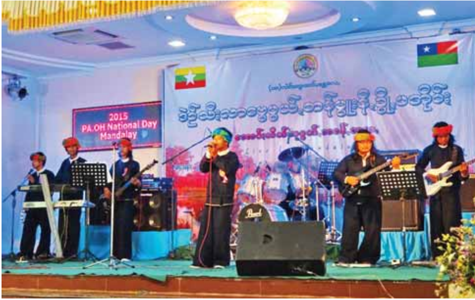
သင်ယူနေကြသော ပအိုဝ်းကျောင်းသား ကျောင်းသူများနှင့် တက္ကသိုလ်ဝင်စာမေးပွဲတွင် ဂုဏ်ထူးဖြင့် အောင်မြင်သော ပအိုဝ်းကျောင်းသားကျောင်းသူများအား တာဝန်ရှိသူများက ဆုများချီးမြှင့်သည်။

မန္တလေး မတ် ၇ ပအိုဝ်းတိုင်းရင်းသား စာပေနှင့် ယဉ်ကျေးမှုကော်မတီက ကြီးမား၍ ပအိုဝ်းအမျိုးသားနေ့နှင့် စာအောင် ဆုနှင့်သဘင်အခမ်းအနားကို မတ် ၅ ရက် နံနက် ၉ နာရီက မန္တလေး မြို့ ချမ်းအေးသာစံမြို့နယ် (၈၁) လမ်းနှင့် (၈၂) လမ်းကြား လမ်း(၃၀) ရှိ ဖူကျင်ကွမ်းရင်ဘုရားကျောင်း ခန်းမ၌ ကျင်းပသည်။ အခမ်းအနားတွင် မန္တလေးမြို့ရှိ စာသင်တိုက်ကြီးများမှ ပအိုဝ်းစာအောင် သံယာဇာတများအား ပအိုဝ်းတိုင်းရင်းသားစာပေနှင့် ယဉ်ကျေးမှုကော်မတီမှ စာအောင်ဆုချီးမြှင့်ပြီး နေ့ဆွမ်း ဆက်ကပ်သည်။