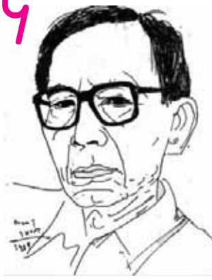
ဒေါ်မလင်ရဲတိုက်၊ နိုဝင်ဘာ ၁၉၊ ၁၇၄၅ ရန်ကင်း