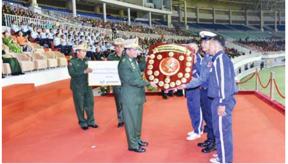
တပ်မတော်ကာကွယ်ရေးဦးစီးချုပ် ပိုလ်ချုပ်မှူးကြီးမင်းအောင်လှိုင် (ကြည်း၊ ရေ၊ လေ)အားကစားပြိုင်ပွဲများတွင် ပထမဆုရရှိသည့် ကာကွယ်ရေးဦးစီးချုပ်(ရေ)အား ခိုင်းဆုချီးမြှင့်စဉ်။ (မြဝတီ)

သက်ဆွေကလည်းကောင်း ငွေသား ဆုနှင့် တစ်ဦးချင်းဆုတံဆိပ်များ အသီးသီးပေးအပ်ချီးမြှင့်သည်။ ထို့နောက် ညှိနှိုင်းကွပ်ကဲရေးမှူး (ကြည်း၊ ရေ၊ လေ) ပိုလ်ချုပ်ကြီး လှဌေးဝင်းက တပ်မတော်(ကြည်း၊ ရေ၊ လေ) ဘောလုံးပြိုင်ပွဲ၊ (ခ)အဆင့် တွင် ပထမဆုရရှိသော ကမ်းရိုးတန်း ဒေသ တိုင်းစစ်ဌာနချုပ်ကိုယ်စားပြု (ယ)အသင်း၊ (က)အဆင့်တွင် ပထမဆုရရှိသော အရှေ့ပိုင်းတိုင်း စစ်ဌာနချုပ်ကိုယ်စားပြုအသင်းနှင့် (က)အဆင့် နေရာလိုက်အကောင်း ဆုံးကစားသမားများအား ငွေသား ဆုနှင့် တစ်ဦးချင်းဆုတံဆိပ်များ ပေးအပ်ချီးမြှင့်သည်။