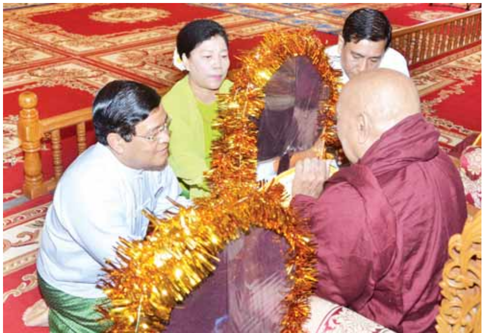
ဒုတိယသမ္မတ ဦးညွှန်ထွန်းနှင့် ဇနီး ဆရာတော်ထံ လှူဖွယ်ဝတ္ထုပစ္စည်းများ ဆက်ကပ်လှူဒါန်းစဉ်။ (သတင်းစဉ်)

ဝ ရှေ့ဖိုးမှ ထို့နောက် နိုင်ငံတော်သမ္မတ ဦးသိန်းစိန်နှင့် တာဝန်ရှိသူများက နိုင်ငံတော်သံယမဟာနာယကအဖွဲ့ ဥက္ကဋ္ဌ