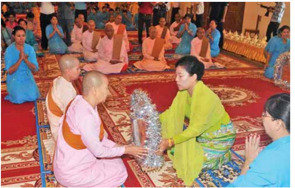
ဒုတိယသမ္မတ ဦးညွှန်ထွန်း၏ ဇနီး ဒေါ်ခင်အေးမြင့် သီလရှင်ဆရာကြီးများအား လှူဖွယ်ဝတ္ထုပစ္စည်းများ ဆက်ကပ်လှူဒါန်းစဉ်။