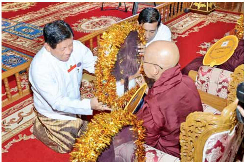
ပြည်ထောင်စုရွေးကောက်ပွဲကော်မရှင်ဥက္ကဋ္ဌ ဦးတင်အေး ဆရာတော်ထံ လှူဖွယ်ဝတ္ထုပစ္စည်းများ ဆက်ကပ်လှူဒါန်းစဉ်။ (သတင်းစဉ်)

အဘိဓမ္မာရသဂုရု အဘိဓမ္မာရသဂုရုအဖွဲ့မှ အဘိဓမ္မာရသဂုရုအဖွဲ့မှ ဒေါက်တာ ဘဒ္ဒန္တ ကုမာရာဘိဝံသ အမျိုးပြုတော်မူသော ဆရာတော် သံယာတော်များနှင့် သီလရှင်ဆရာကြီးများအား လှူဖွယ်ဝတ္ထုပစ္စည်းများ ဆက်ကပ်လှူဒါန်းကြသည်။