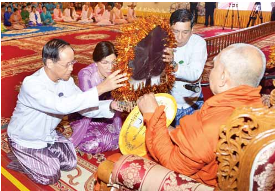
ဒုတိယသမ္မတ ဒေါက်တာစိုင်းမောက်ခမ်းနှင့် ဇနီး ဆရာတော်ထံ လှူဖွယ်ဝတ္ထုပစ္စည်းများ ဆက်ကပ်လှူဒါန်းစဉ်။ (သတင်းစဉ်)