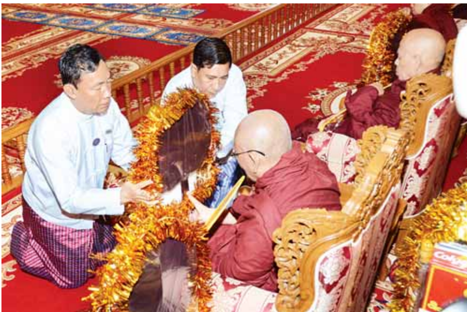
ပြည်သူ့လွှတ်တော်ဥက္ကဋ္ဌ သူရဦးရွှေမန်း ဆရာတော်ထံ လှူဖွယ်ဝတ္ထုပစ္စည်းများ ဆက်ကပ်လှူဒါန်းစဉ်။ (သတင်းစဉ်)

ဦးစီးချုပ် ဗိုလ်ချုပ်မှူးကြီးမင်းအောင်လှိုင်နှင့် ဇနီး၊ နိုင်ငံတော် ဖွဲ့စည်းပုံအခြေခံဥပဒေဆိုင်ရာ ခုံရုံးဥက္ကဋ္ဌ၊ ပြည်ထောင်စု ရွေးကောက်ပွဲကော်မရှင် ဥက္ကဋ္ဌ၊ ဒုတိယတပ်မတော်ကာကွယ်