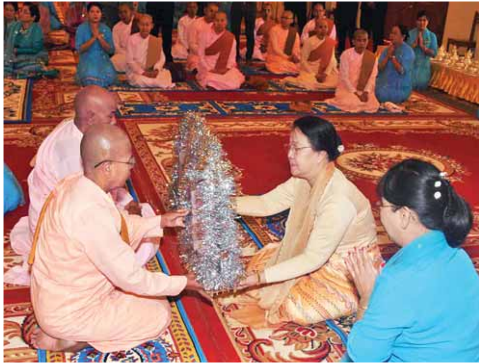
နိုင်ငံတော်သမ္မတ ဦးသိန်းစိန်၏ ဇနီး ဒေါ်ခင်ခင်ဝင်း သီလရှင်ဆရာကြီးများအား လှူဖွယ်ဝတ္ထုပစ္စည်းများ ဆက်ကပ်လှူဒါန်းစဉ်။