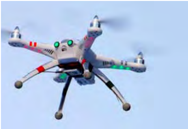
ဒရုန်းများသည် မိတာ ၇၀၀ အမြင့်လောက်အထိပျံသန်းနိုင်ပြီး ကောင်းကင်တွင် ၁၂ မိနစ်လောက် ငြိမ်သက်ကာ အလုပ်လုပ်နေနိုင်သည့် အီလက်ထရွန်းနစ် ပစ္စည်းတစ်မျိုးလည်းဖြစ်သည်။ (မေလဲသင်း)

ထို့အပြင် အဆိုပါယာဉ်များက ကားတာယာအမှတ်အသား၊ ယာဉ်တစ်စီးနှင့် တစ်စီး အကွာအဝေး၊ မြင်ကွင်းရှင်းလင်းမှုတို့ကို ပိုမိုကောင်းမွန်စေသောကြောင့် ရဲတပ်ဖွဲ့ဝင်များအနေဖြင့် ဒရုန်းများကို အသုံးပြုရန် ၂၀၁၄ခုနှစ် ဇန်နဝါရီလကတည်းက စဉ်းစားခဲ့သေးသော်လည်း ကနေဒါသယ်ယူပို့ဆောင်ရေးဌာန၏ ခွင့်ပြုချက်ရရှိရန် ခြောက်လခန့်စောင့်ဆိုင်းခဲ့ရသည်။ အက်ဒမန်တန်မြို့ ယာဉ်တိုက်မှုဖြစ်စဉ် ၁၅ခုကျော်ကို ဒရုန်းများဖြင့် မှတ်တမ်းတင်စစ်ဆေးနိုင်ခဲ့သည်။