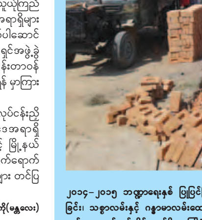
သီဟကိုကို(မန္တလေး)

လိုကြောင်း၊ တရားဥပဒေစိုးမိုးရေး၊ အများပြည်သူယုံကြည် ကိုးစားသော ဥပဒေဘက်တော်သား ဥပဒေအရာရှိများ ဖြစ်အောင် ကြိုးပမ်းဆောင်ရွက်ရေး၊ အမှုလိုက်ပါဆောင် ရွက်ခြင်းကိစ္စများအပြင် ရွေးကောက်ပွဲကော်မရှင်အဖွဲ့ခွဲ လုပ်ငန်းတာဝန်များကိုလည်း မိခင်ဌာနလုပ်ငန်းတာဝန် ကဲ့သို့ ဥပဒေနှင့်အညီ ကူညီပံ့ပိုးဆောင်ရွက်သွားရန် မှာကြား ခဲ့သည်။ အဆိုပါ ခရိုင်နှင့် မြို့နယ်ဥပဒေအရာရှိများလုပ်ငန်းညှိ နှိုင်းအစည်းအဝေးသို့ တိုင်းဒေသကြီးဥပဒေအရာရှိ ဦးစိုးနိုင်၊ တိုင်းဒေသကြီးအတွင်းရှိ ခရိုင်နှင့် မြို့နယ် ဥပဒေအရာရှိ အပါအဝင် စုစုပေါင်း ၅၈ ဦး တက်ရောက် ကြပြီး စီမံရေးရာ၊ တရားစွဲနှင့် အမှုလိုက်ကိစ္စများ တင်ပြ ဆွေးနွေးခဲ့ကြကြောင်း သိရသည်။