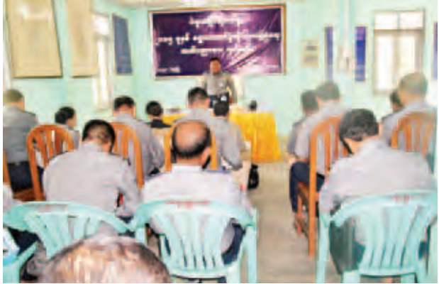
၂၀၁၅ခုနှစ် ရွေးကောက်ပွဲဆိုင်ရာ လုံခြုံရေးအသိပညာပေးသင်တန်းဖွင့်ပွဲကို ပဲခူးခရိုင်ရဲတပ်ဖွဲ့မှူးရုံး အစည်းအဝေးခန်းမ၌ ဖေဖော်ဝါရီ ၂၈ ရက်က ကျင်းပရာ ခရိုင်ရဲတပ်ဖွဲ့မှူး ဒုတိယရဲမှူးကြီးလှဦးက ရွေးကောက်ပွဲတွင် ရဲတပ်ဖွဲ့ဝင်များ လုပ်ဆောင်ရမည့် လုံခြုံရေးကိစ္စများနှင့်ပတ်သက်၍ အသိပညာပေးရင်းလင်းပြောကြားစဉ်။ (၀၇၅)