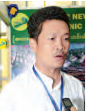
ဦးအောင်နိုင်ဦး နယူးဇော့ကုမ္ပဏီ။