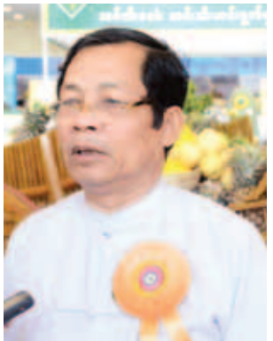
ပြည်ထောင်စုဝန်ကြီးဦးမြင့်လှိုင် လယ်ယာစိုက်ပျိုးရေးနှင့် ဆည်မြောင်းဝန်ကြီးဌာန။

ထည့်ပြီး စိုက်တဲ့စနစ်ဖြစ်ပါတယ်။ မြို့ပြစိုက်ပျိုးနည်းပညာစနစ်လို့လည်း ခေါ်ကြတယ်။ ဒီစနစ်ဟာ မြေဓါတ်၊ နည်းတဲ့သူတွေ၊ လုပ်သားအင်အားနည်းတဲ့သူတွေအတွက် ရည်ရွယ်ပါတယ်။ ဒီစနစ်ဟာ ဆလတ်၊ မုန့်ညင်း၊ ငရုတ်သီးစတဲ့ ဟင်းသီးဟင်းရွက်နဲ့ အသီးပင်တွေကို စိုက်ပျိုးလို့ရပါတယ်။