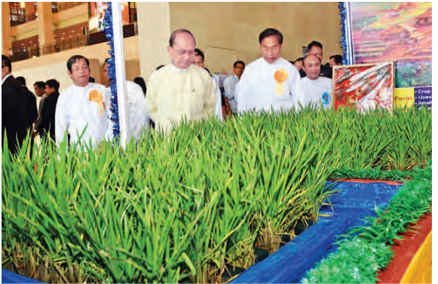
နိုင်ငံတော်သမ္မတ ဦးသိန်းစိန် မြန်မာနိုင်ငံ၏ ဒေသရေမြေ ရာသီဥတုနှင့် ကိုက်ညီသော အထွက်ကောင်းမျိုးစပါး ပြခန်းကို ကြည့်ရှုအားပေးစဉ်။ (သတင်းစဉ်)

ထို့နောက် မြန်မာ့လယ်ယာစီးပွားရေးအများပိုင် လီမိတက်၏ ခေတ်မီအဆင့်မြှင့် ဆန်စက်တည်ဆောက်မှုစီမံ