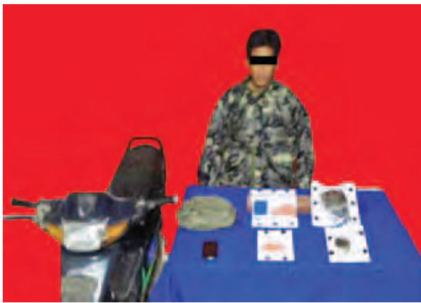
ယာခိုင်လိအား သိမ်းဆည်းရမိ မူးယစ်ဆေးဝါးများနှင့်အတူ တွေ့ရစဉ်။