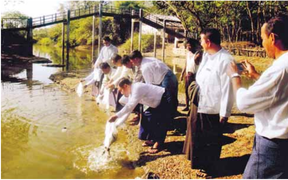
ဦးစီးဌာန မြို့နယ်အုပ်ချုပ်ရေးမှူးအုပ်ချုပ်ရေးမှူးတို့က ကျေးရွာနေ ငါးမွေးတောင်သူများထံ ငါးမျိုးများ ထောက်ပံ့ပေးပြီး လယ်ကြားကန် ဆိုင်ရာအကြီးအကဲများနှင့် ကျေးရွာ မြောင်းများအတွင်း ငါးမျိုးများစိုက်ထည့်ပေးခဲ့ကြောင်း သိရသည်။