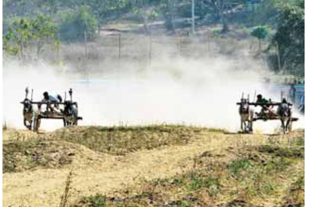
(လှိုင်သန်းတင့်-ရမည်းသင်း)

ကြောင်း သိရသည်။ အောက်မြန်မာပြည်တွင် မြင်းပြိုင်ပွဲ အထက်မြန်မာပြည်တွင် ယခုကဲ့သို့နွားဒုန်းပြိုင်ပွဲများကို ယခင်က အစဉ်အလာ ရှိခဲ့သည့် အတွက် အစဉ်အလာကို ထိန်းသိမ်းစောင့်ရှောက်သည့်အနေဖြင့် ယခုကဲ့သို့ စီစဉ်ဆောင်ရွက် ကျင်းပခြင်းဖြစ်ပြီး နောင်နှစ်များတွင်လည်း နွားဒုန်းပြိုင်ပွဲများအပြင် နွားကျောစီးပြိုင်ပွဲ၊ နွားအလှပြိုင်ပွဲများကိုလည်း ထည့်သွင်းကျင်းပနိုင်ရန် စီစဉ်ဆောင်ရွက်မည်ဖြစ်ကြောင်း နွားဒုန်းပြိုင်ပွဲကျင်းပရေးကော်မတီအဖွဲ့ဝင်တစ်ဦးက ပြောသည်။