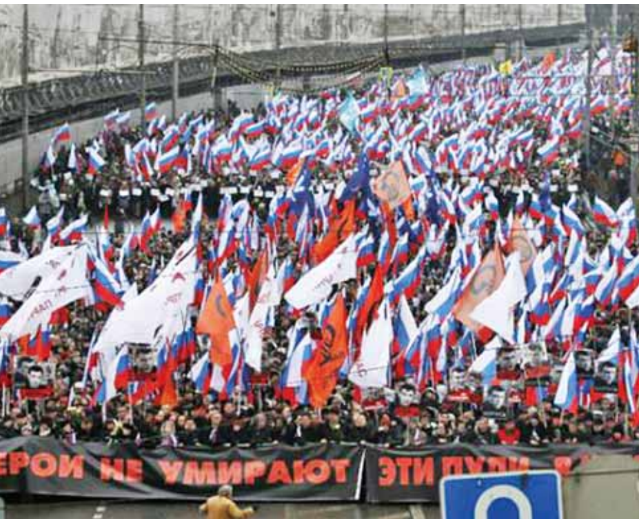
ဦးအိုအေ။

အဆိုပါလုပ်ကြံသတ်ဖြတ်မှုသည် လူငှားသတ်ခြင်း ဖြစ်ဖွယ်ရှိပြီး သွေးထိုးလှုံ့ဆော်သည့် လုပ်ရပ်ဖြစ်ကြောင်း ရုရှားသမ္မတ ဗလာဒီမာပူတင်က ပြောကြားသည်။ လူသတ်မှု စုံစမ်းစစ်ဆေးခြင်းကို ပူတင်ကိုယ်တိုင် ကြီးကြပ်မည်ဟု ကရင်မလင်နန်းတော်ကပြောကြားသည်။မစ္စတာ ပူတင်က နမ်ဆော့ပီ၏ မိခင်ထံသို့ ဝမ်းနည်းကြောင်း သဝဏ်လွှာပေးပို့ပြီး ထပ်တူဝမ်းနည်းကြေကွဲရပါကြောင်း နှင့် နမ်ဆော့ပီသေဆုံးခြင်းသည် ထာဝရဆုံးရှုံးမှုတစ်ခု ဖြစ်ကြောင်း ပြောကြားခဲ့သည်။