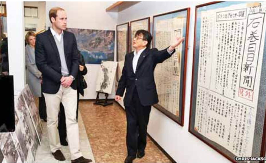
တုန်းပဲ” ဟု ပြောကြားသည်။

မစ္စတာ တာကူချီက “ရုတ်တရက် ငရဲပြည်ရောက်သွားသလိုပဲ။ လမ်းမတွေပေါ်မှာ လူတွေသေကုန်ကြတာ အတုံးအနုံးပဲ။ ခုထိ ကျွန်တော့်မျက်စိထဲမှာ မြင်ယောင်နေ