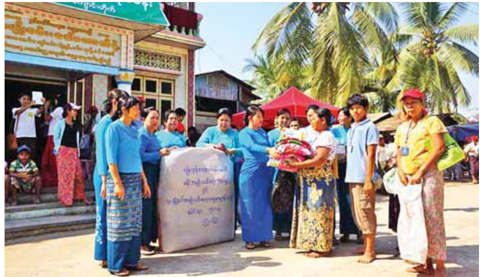
အိမ်အသုံးအဆောင်ပစ္စည်းများကို လိုက်လံကြည့်ရှုပြီး ပေးအပ်လှူဒါန်းခဲ့ရာ နံနက် ၁၁ နာရီတွင် လှူဒါန်းပွဲအခမ်းအနားပြီးစီးခဲ့ကြောင်း သိရသည်။