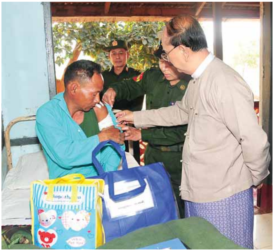
နိုင်ငံတော်သမ္မတ ဦးသိန်းစိန် ဒဏ်ရာရတပ်မတော်သားတစ်ဦးအား ကြည့်ရှုအားပေးစကားပြောကြားစဉ်။

လက်မောင်းကို ဖြတ်မှန်ပြီးတော့ မျက်နှာကို ကျော်ထွက်သွားပါတယ်။ လက်မောင်းတစ်ခုလုံး ပြုတ်ကျသွား သလိုမျိုးဖြစ်သွားပြီးတော့ ကျွန်တော် လုံးဝ မလှုပ်ရှားနိုင်တော့ပါဘူး။ တိုက်ပွဲ ၁၅ မိနစ်လောက်ဖြစ်ပြီး တော့ ငြိမ်သွားပါတယ်။ ကျွန်တော်တို့ အဲဒီမှာ ကြက်ခြေနီအင်တာပျူ သူတို့ ဘက်ကို မြင်အောင်ပြုပြီးတော့ အဲဒီ ကားဘေးနားမှာပဲ မှောက်ပြီးနေလိုက် ပါတယ်။ အဲဒီအချိန်မှာ သူတို့ ၁၅ မိနစ်လောက် ဆက်ပြီးပစ်ပါတယ်။ ဆက်ပစ်တဲ့အချိန်မှာ လက်နက်ကြီး တွေလည်းကျပါတယ်။ လက်နက်ကြီး တွေကျတော့ ကျွန်တော်ကားဆို ကားဘီးတွေရော၊ ဆီတိုင်ကီတွေရော အကုန်လုံး ပွင့်ထွက်သွားပါတယ်။ အဲဒီအချိန် ကားပေါ်မှာ တိုက်ပွဲ ဒုက္ခသည်တွေပေါ့နော်။ အဲဒီအမျိုး