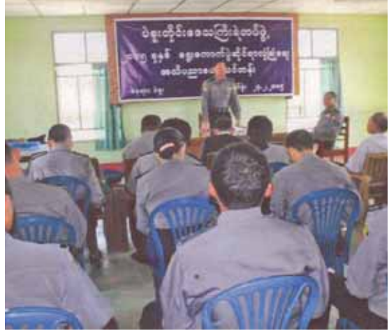
နည်းဥပဒေ၊ ၂၀၁၅ ခုနှစ် လုံခြုံရေးဆိုင်ရာ ပူးပေါင်းဆောင်ရွက်မှုအ လုပ်ရုံဆွေးနွေးပွဲ အစီရင်ခံစာ စသည်တို့ သင်ကြားပို့ချပြီး ဖေဖော်ဝါရီ ၂၈ ရက်အထိ ဖွင့်လှစ်မည်ဖြစ်ကြောင်း သိရသည်။

ယင်းသင်တန်းတွင် ပြည်သူ့လွှတ်တော်ရွေးကောက်ပွဲဥပဒေ၊ နည်းဥပဒေ၊ အမျိုးသားလွှတ်တော်ရွေးကောက်ပွဲဥပဒေ၊ နည်းဥပဒေ၊ တိုင်းဒေသကြီး/ပြည်နယ်လွှတ်တော် ရွေးကောက်ပွဲဥပဒေ၊