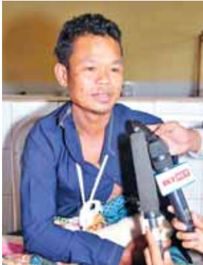
တိုဝင်မင်းအောင်။