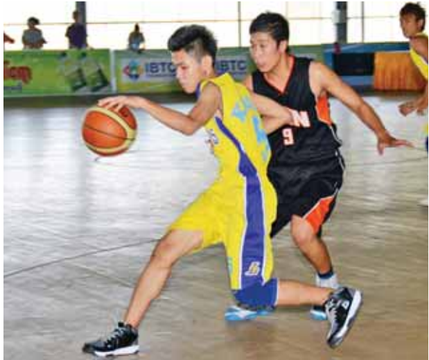
ဘတ်စကက်ဘော အကြိုဗိုလ်လုပွဲ ကျင်းပစဉ်။

အမျိုးသားဘောလုံးပြိုင်ပွဲ တတိယနေရာလုပွဲကို ဝဏ္ဏသိဒ္ဓိကွင်း၌