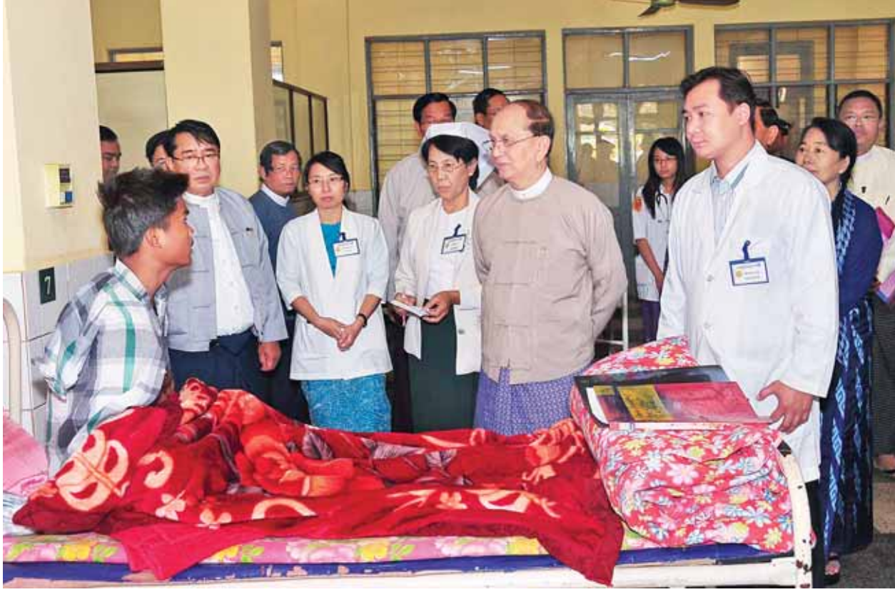
နိုင်ငံတော်သမ္မတ ဦးသိန်းစိန် ကိုးကန့်သောင်းကျန်းသူများ ပစ်ခတ်တိုက်ခိုက်မှုကြောင့် ဒဏ်ရာရရှိခဲ့သည့် အရပ်သားတစ်ဦးအား ကြည့်ရှုအားပေးစကားပြောကြားစဉ်။ (သတင်းစဉ်)