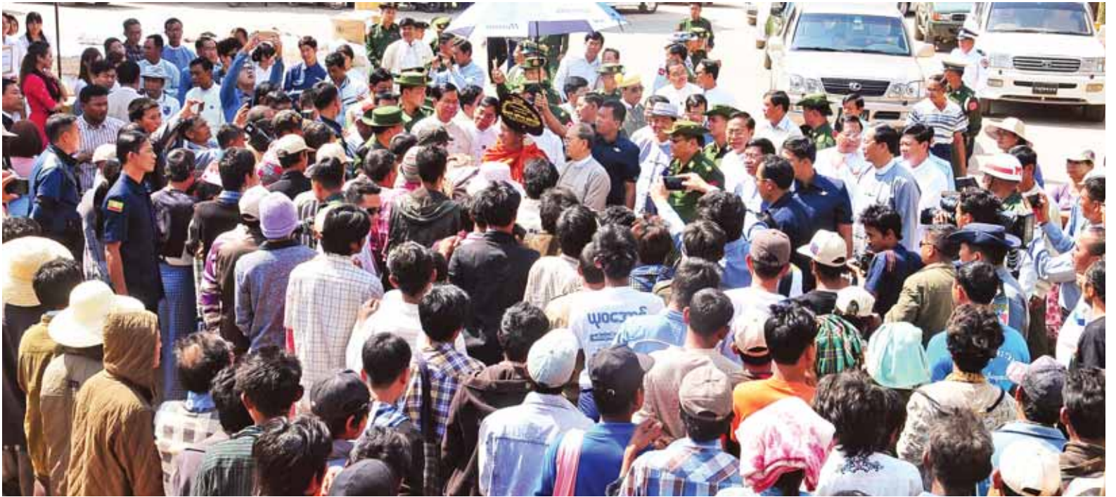
နိုင်ငံတော်သမ္မတ ဦးသိန်းစိန် တိုက်ပွဲရှောင် ဒုက္ခသည်များအား တွေ့ဆုံအားပေးစကားပြောကြားစဉ်။