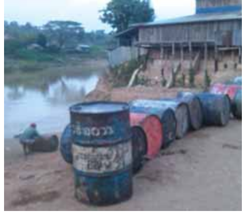
အနည်းဆုံးငွေကျပ် ၆၀၀၀ ခန့်ရရှိတာမို့ မိသားစုရဲ့ စားဝတ် နေရေး အဆင်ပြေတာပေါ့။

“ရေထဲကို ပိပါတွေ ကြီးတဲ့ပြီး ဥရုချောင်း တစ်ဖက်ကမ်း ကို လူအားနဲ့ ကူးခတ်ဆွဲယူရပါတယ်။ တစ်ဖက်ကမ်း သောင်ပြင်ခြံကို ဆီပိပါတစ်လုံးကို ငွေကျပ် ၁၃၀၀ နှုန်း၊ သောင် ပြင်ခြံကနေ ကုန်းပေါ်အရောက်ဆိုရင် ငွေကျပ် ၇၀၀ ဆိုတော့ ချောင်းထဲကနေ ကုန်းပေါ်အရောက် ဆီပိပါတစ်လုံးကို သယ်ယူခငွေကျပ် ၂၀၀၀ ကုန်ကျပါတယ်။ စက်သုံးဆီကို ပို့ ဆောင်ပေးနေတဲ့ လုပ်သားတစ်ဦးရဲ့ တစ်ရက်ဝင်ငွေဟာ