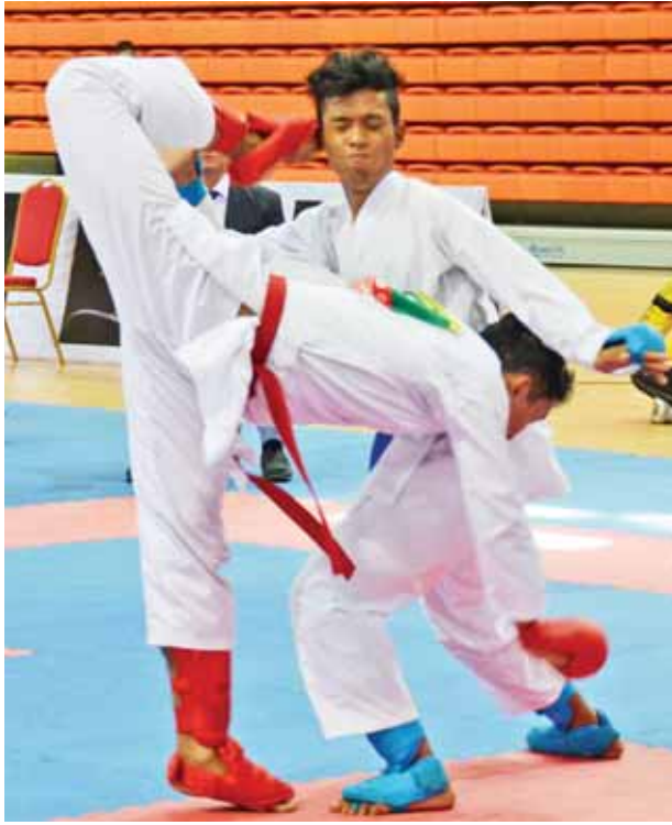
ကရာတေးဒို (ကုမိတ်)ပြိုင်ပွဲကျင်းပစဉ်။

ကျင်းပရာ ပဲခူးက ချင်းကို (၂-၀)ဂိုးဖြင့် အနိုင်ရသည်။