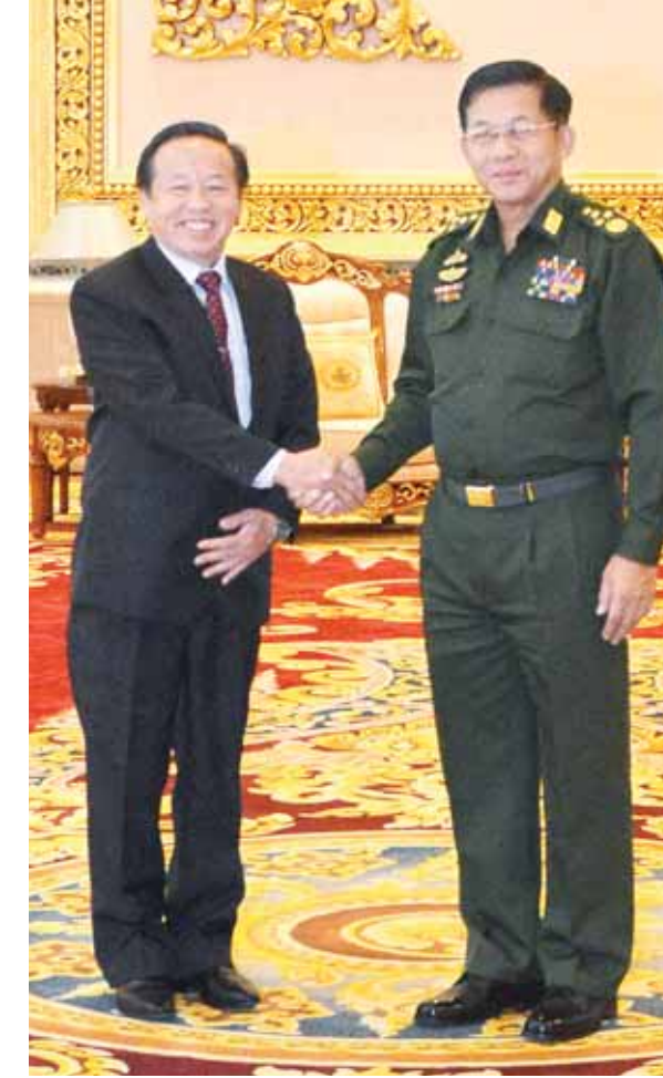
တပ်မတော်ကာကွယ်ရေးဦးစီးချုပ် ဗိုလ်ချုပ်မှူးကြီးမင်းအောင်လှိုင် လာအိုနိုင်ငံ သံအမတ်ကြီး မစ္စတာ လိုင်ရင်းဆိုင်ညဇန်အား ရင်းရင်းနှီးနှီး နှုတ်ဆက်စဉ်။ (မြဝတီ)

ဧည့်သည်တော်သံအမတ်ကြီးက မြန်မာ-လာအို သံတမန်ဆက်ဆံရေးနှစ် ၆၀ ပြည့်အထိမ်းအမှတ်အဖြစ် တပ်မတော်ယဉ်ကျေးမှုအဖွဲ့နှင့် ဘောလုံးအားကစားအဖွဲ့များကို စေလွှတ်သွားလိုပါကြောင်း၊ ရွှေတြိဂံဒေသ မူးယစ်ဆေးဝါးပြဿနာမှာ နှစ်နိုင်ငံလုံးအတွက် အရေးကြီးသောကိစ္စဖြစ်၍ ပူးပေါင်းတိုက်ဖျက်သွားမည်ဖြစ်ကြောင်း၊ ကုန်သွယ်မှုမြှင့်တင်ခြင်းဖြင့် ဆက်ဆံရေးတိုးတက်မှုသာမက နှစ်နိုင်ငံအတွက် အကျိုးအမြတ်များစွာ ရရှိနိုင်မည်ဖြစ်၍ ပူးပေါင်းဆောင်ရွက်သွားမည်ဖြစ်ကြောင်းဖြင့် ပြန်လည်ဆွေးနွေးပြောကြားသည်။ ထို့နောက် တပ်မတော်နှစ်ရပ်အကြား နှစ်နိုင်ငံဘာသာစကား အပြန်အလှန်