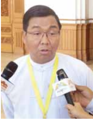
ဒုတိယဝန်ကြီး ဦးပိုင်ထွေး

ကျွန်တော်လေ့လာကြည့်လိုက်တော့ ပြန်ကြားရေးဝန်ကြီးဌာနက သတင်းစာမှာ အမြတ်ရှိတာတွေ့ရပါတယ်။ အစိုးရပိုင်သတင်းစာ မထုတ်သင့်ဘူးလို့ ပြောနေကြတာတွေ ရှိပါတယ်။ ဒါပေမယ့် အစိုးရပိုင်သတင်းစာကမြတ်နေတယ်။ ပြန်ကြားရေးဝန်ကြီးဌာနက တခြားကဏ္ဍမှာ လိုအပ်ချက်အရ စိုက်ပေးရပေမယ့် သတင်းစာမှာ အမြတ်ရရှိပါတယ်။ အဲဒီအတွက် ကြိုဆိုပါတယ်။ ငွေရေးကြေးရေးကဏ္ဍတွေ ကိစ္စတွေမှာ အစိုးရက လုပ်တာထက်စာရင် အများပြည်သူဝန်ဆောင်မှုအနေနဲ့ လုပ်တာပိုကောင်းပါတယ်။ စိတ်ဝင်စားတဲ့သူတွေအနေနဲ့လည်း ရှယ်ယာပါတာမျိုးလေးလုပ်လို့ ရသွားတာပေါ့။ ခေတ်စနစ်တွေကလည်း ပြောင်းသွားပြီ။ မီဒီယာခေတ်ကို ရောက်နေပြီဆိုတော့ ဝန်ဆောင်မှုကို ပိုပြီးတော့ကောင်းအောင် လွတ်လွတ်လပ်လပ်လုပ်နိုင်အောင် အများပြည်သူဝန်ဆောင်မှုမီဒီယာအဖြစ်လုပ်တာ ခေတ်စနစ်နဲ့လည်း လျော်ညီပါတယ်။ အခုက ပုဂ္ဂလိကသတင်းစာတွေမှာ ရှုံးနေတာရှိတယ်။ ဒါပေမယ့် အစိုးရသတင်းစာက မြတ်နေတယ်။ နိုင်ငံတော်အတွက်လည်း ရရှိတဲ့အမြတ်ထဲကနေ နိုင်ငံတော်ကို ပြန်သွင်းနိုင်တယ်။ ဒါမျိုးလေးတွေကို ပြည်သူတွေသိရှိ