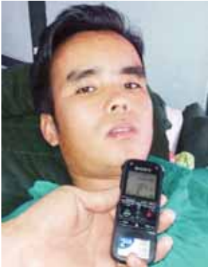
ကိုရန်ရင်းမျိုးလတ်။