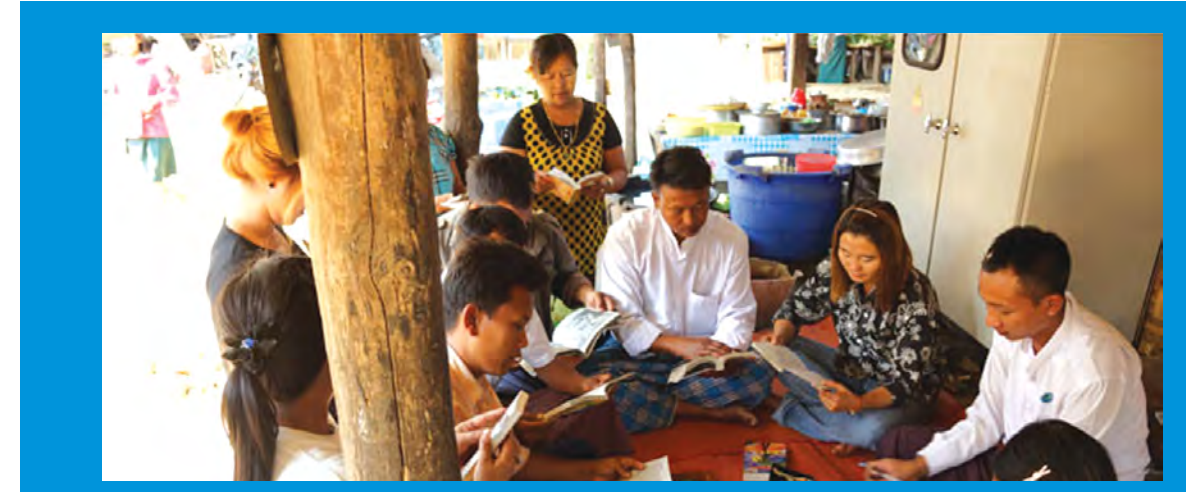
ဥက္ကဋ္ဌရခိုင်၊ ပြန်ကြားရေးနှင့်ပြည်သူ့ဆက်ဆံရေးဦးစီးဌာနသည် ပြည်သူများ အသိပညာတိုးပွားပြီး စာပေဗဟုသုတကြွယ်ဝဖွံ့ဖြိုးရေးကို ရည်ရွယ်၍ ဖေဖော်ဝါရီ ၂၃ ရက် မွန်းလွဲ ၁ နာရီက ဥက္ကဋ္ဌရခိုင်မြို့နယ် မင်းကုန်းအုပ်စု၊ တံတားဦးကျေးရွာသို့ သူတ/ရသ စာအုပ်၊ စာစောင်များဖြင့် သွားရောက်၍ Mobile Library အဖြစ် ကွင်းဆင်းဆောင်ရွက်ပေးခဲ့ကြောင်း သိရသည်။ သတင်းနှင့်စာတိပုံ- ရွှေရဲရင့်