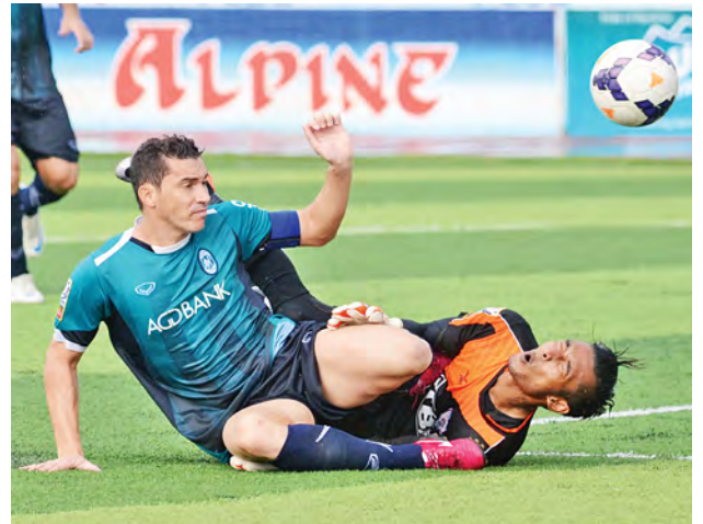
ရန်ကုန်နှင့် ကမ္ဘောဇတို့ ၂၀၁၄ ရာသီက တွေ့ဆုံစဉ်။ အသင်းဖြစ်သည်။ ဒဏ်ရာရကစားသမားများပြားနေသည့် လက်ရှိ ချန်ပီယံ ရတနာပုံအသင်းမှာ အဝေးကွင်း၌ ဧရာဝတီနှင့် ကစားရမည်ဖြစ်ရာ အမှတ်ရရေးခက်ခက်ခဲခဲကစားရဖွယ်ရှိနေသည်။

မဲပေါက်သူများအနေဖြင့် မိမိရရှိသောနေရာအား အမည်ပြောင်းခြင်း၊ တစ်ဆင့်ရောင်းချခြင်းမဏ္ဍပ်မဆောက်လုပ်ခြင်းမပြုလုပ်ကြပါရန်အသိပေးထားကြောင်း သိရသည်။