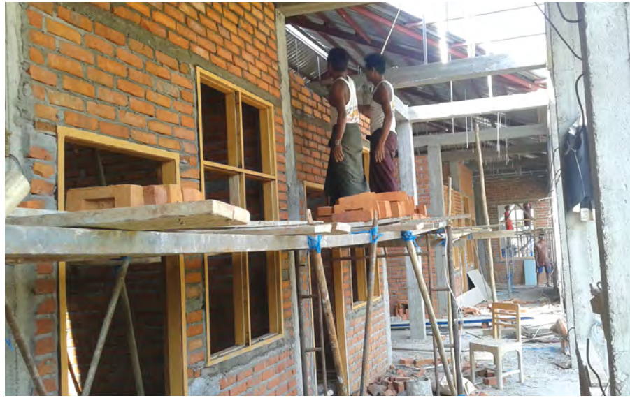
မြင်းမူ ဖေဖော်ဝါရီ ၂၆

ငွေယမင်းကုမ္ပဏီမှတာဝန်ယူတည်ဆောက်နေသော ၁၆ ခုတင်ဆွဲ တိုင်းရင်းဆေးရုံကို ကွင်းအမှတ်(၁-ယ) အောင်ဇေယျရပ်ကွက် မြင်းမူမြို့တွင် တည်ဆောက်လျက်ရှိရာ အလျား ၁၂၄ ပေ၊ အနံ ၇၉