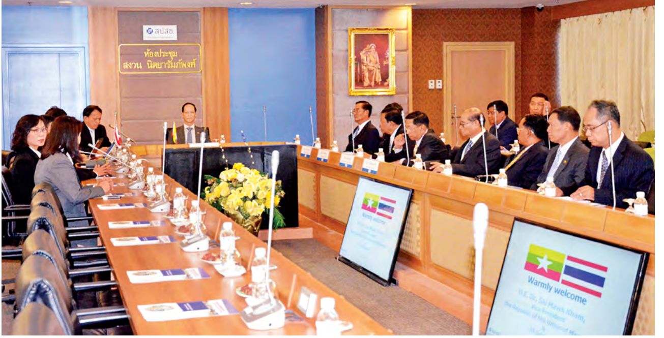
ဒုတိယသမ္မတနှင့်အဖွဲ့ဝင်များက သိရှိလိုသည်များကို မေးမြန်းခဲ့ကြသည်။ ယင်းနောက် ဒုတိယသမ္မတ ဒေါက်တာစိုင်းမောက်ခမ်းသည် ထိုင်းနိုင်ငံ ကျန်းမာရေးဝန်ကြီးထံ အမှတ်တရ လက်ဆောင်ပစ္စည်းပေးအပ်ပြီး ဧည့်သည် တော်များနှင့်အတူ စုပေါင်း၍ မှတ်တမ်းတင်ဓာတ်ပုံရိုက်ကူးကြသည်။

ထို့နောက် ဒုတိယသမ္မတနှင့်အဖွဲ့သည် ထိုင်းနိုင်ငံ ကျန်းမာရေးဝန်ကြီး ဦးဆောင်သော ကိုယ်စားလှယ်အဖွဲ့နှင့် အဆိုပါဝန်ကြီးဌာန အစည်းအဝေးခန်း၌ ဆက်လက်တွေ့ဆုံပြီး ထိုင်းနိုင်ငံ ကျန်းမာရေးဝန်ကြီးဌာနမှ တာဝန်ရှိသူများက အများပြည်သူနှင့် သက်ဆိုင်သည့် ကျန်းမာရေးစောင့်ရှောက်မှုစနစ်နှင့် ကျန်းမာ ရေးစီမံခန့်ခွဲမှု၊ အများပြည်သူနှင့် သက်ဆိုင်သည့် ကျန်းမာရေးစောင့်ရှောက်မှု ကဏ္ဍ၌ ထိုင်း-မြန်မာပူးပေါင်းဆောင်ရွက်မှုနှင့်စပ်လျဉ်း၍ ရှင်းလင်းတင်ပြရာ