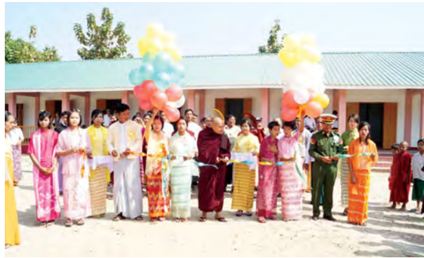
ဆောင်သစ်အလှူရှင်မှ ကျောင်းသား၊ ကျောင်းသူများ ညစာကျက်တန်းဝင် နိုင်ရန်အတွက် ခြောက်သိန်းတန် နှစ်လုံးထိုး အသံငြိမ်မီးစက်တစ်လုံး၊ ကျောင်းတွင် အသုံးပြုနိုင်ရန် ကွန်ပျူတာတစ်စုံတို့ကို ပေးအပ်လှူဒါန်းခဲ့ကြောင်း သိရသည်။ ကျောင်းဆောင်အဆင့်တိုးမြှင့်ဖွင့်လှစ်ခြင်း အထိမ်းအမှတ်အလံနှင့် ကျောင်းဆောင်သစ် လွှဲပြောင်းပေးအပ်ခြင်း အထိမ်းအမှတ်အလံများကို တက်ရောက်လာကြသော ဌာနဆိုင်ရာ ဧည့်သည်တော်များအား ပေးအပ်ခဲ့သည်။