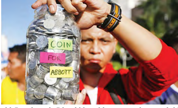
ဘိန်းဖြူသယ်ဆောင်မှုဖြင့် အင်ဒိုနီးရှားနိုင်ငံတရားရုံးတွင် တရားရင်ဆိုင်နေကြသည့် ဩစတြေးလျနိုင်ငံသား ကိုးဦးအား ဩစတြေးလျဝန်ကြီးချုပ်

အင်ဒိုနီးရှားနိုင်ငံတွင် မူးယစ်ဆေးဝါးသယ်ဆောင်မှုဖြင့် သေဒဏ်ချမှတ်ခြင်းခံရမည့် ဩစတြေးလျနိုင်ငံသား ကိုးဦးအား ဆူနာမီဖြစ်ခဲ့သည့် အချိန်တွင် ကူညီခဲ့ဖူးသည့် ကျေးဇူးကို ထောက်ထားသောအားဖြင့် သက်ညှာမှုပေးရန် ဩစတြေးလျဝန်ကြီးချုပ်က အင်ဒိုနီးရှားအစိုးရအား တောင်းဆိုခဲ့သည်ကို ပြည်သူများက မကျေနပ်ဖြစ်ကာ အကြွေးပြန်ဆပ်ရန် နိုင်ငံအဝန်း အကြွေစေ့များ စုဆောင်းကာ ဆန္ဒထုတ်ဖော်လျက်ရှိကြသည်။ ဆန္ဒထုတ်ဖော်သူများက ဩစတြေးလျဝန်ကြီးချုပ်၏ပါးစပ်ကို အနီရောင် တိပ်များဖြင့် ကန့်လန့်ဖြတ်ပိတ်ထားသောဓာတ်ပုံများကို နိုင်ငံအဝန်းလှည့်လည်ဆန္ဒပြကြသည်။ အင်ဒိုနီးရှားနိုင်ငံအား ဩစတြေးလျဝန်ကြီးချုပ်က ဆူနာမီဘေးဒဏ်ဆိုင်နေချိန်တွင် အမေရိကန်ဒေါ်လာ ၁ ဘီလီယံထောက်ပံ့ပေးခဲ့သည်။ ထိုအချိန်က