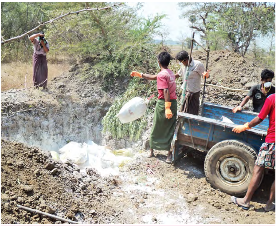
ကြက်၊ ငှက်တုပ်ကွေးရောဂါ ဖြစ်ပွားနေသော ကြက်နှင့် ငှက်များကို မြေကျင်းထဲသို့ သုတ်သင်မြေမြှုပ်နေစဉ်။

စစ်ကိုင်းတိုင်းဒေသကြီး အစိုးရ၏ ကြိုတင်စီစဉ်မှုအဖြစ် မုံရွာမြို့ ပြည်သူ့ဆေးရုံကြီးအတွင်း အဆောင်တစ်ဆောင် သီးသန့်အခန်းထားကာ အကယ်၍ H5N1 ရောဂါ လူကို ကူးစက်မှုဖြစ်လာလျှင် ကုသနိုင်ရန်အတွက် ဆေးဝါးနှင့် အကူပစ္စည်းများကို ထားရှိဆောင်ရွက်ထားပြီး စစ်ကိုင်းတိုင်းဒေသကြီး ကျန်းမာရေး (ကူးစက်)ဌာန တာဝန်ရှိသူများအနေဖြင့်လည်း အကယ်၍ ရောဂါဝင်ရောက်သည်ဟု သံသယဖြစ်ဖွယ် သတင်းဦးကို ရရှိစေရန်အတွက် ကွန်ရက်များကို နည်းမျိုးစုံဖြင့် ချိတ်ဆက်ဆောင်ရွက်လျက်ရှိကြောင်း သိရသည်။ ကြက်၊ ငှက်တုပ်ကွေးရောဂါဖြစ်နေ၍ ကန့်သတ်နယ်မြေအဖြစ် ထိန်းချုပ်ထားသော မုံရွာကြက်၊ ငှက်မွေးမြူရေးအထူးဇန်နယ်အတွင်းမှ ဥစားကြက်အရှင်အကောင်ရေ ၁၂၀ နှင့် ကြက်အသေ ၁၀ ကောင်၊ ငှက်အသေ အကောင် ၃၀၀၀ နှင့် ငှက်အရှင် ၁၀၀၀ တို့အား ဖေဖော်ဝါရီ ၂၅ ရက်က လိုက်ထရပ်ယာဉ် တစ်စီး၊ ဆိုင်ကယ် လေးစီး တို့ဖြင့် ဇန်နဝါရီအတွင်း ခြံသုံးခြံမှ ဝယ်ယူ၍ ဇန်နဝါရီပသို့ သယ်ဆောင်စဉ် သက်ဆိုင်ရာက ထိန်းသိမ်းနိုင်ခဲ့ကြောင်း သိရသည်။ ထိန်းသိမ်းရရှိသော ကြက်၊ ငှက်တုပ်ကွေးရောဂါရှိ ကြက်နှင့် ငှက်များကို ထိုည ၁၁ နာရီတွင် သတ်မှတ်ထားသော ကြက်၊ ငှက်မွေးမြူရေးဇန်နယ်မှ မြေကျင်းသို့ စနစ်တကျ သုတ်သင်မြေမြှုပ်ခဲ့ကြောင်း သိရသည်။ ယနေ့တွင်လည်း ဇန်နဝါရီအတွင်း ကြက်၊ ငှက်တုပ်ကွေး သေဆုံးကြက်နှင့် ငှက်များကို စနစ်တကျမြှုပ်နှံဆောင်ရွက်ခြင်း၊ ဇန်နဝါရီအတွင်း ဝင်သမျှ ထွက်သမျှသော ဆိုင်ကယ်၊ ကားများကို ဇီဝဆေးဖျန်းခြင်း၊ ဇန်နဝါရီအတွင်း ရှိသူများ ပြင်ပသို့သွားလာမှုကန့်သတ်ခြင်းများကို အများစုကျန်းမာရေးအရ အမျိုးသားရေးအသွင်ဖြင့် ဆောင်ရွက်လျက်ရှိကြောင်း တွေ့ရသည်။ သေဆုံးမှုမှာ တစ်ရက်ထက်တစ်ရက်မြင့်လာသောကြောင့် ဖေဖော်ဝါရီ ၂၄ ရက်တွင် တိုင်းဒေသကြီး ကြက်၊ ငှက်တုပ်ကွေးရောဂါ ထိန်းချုပ်ကာကွယ်တား