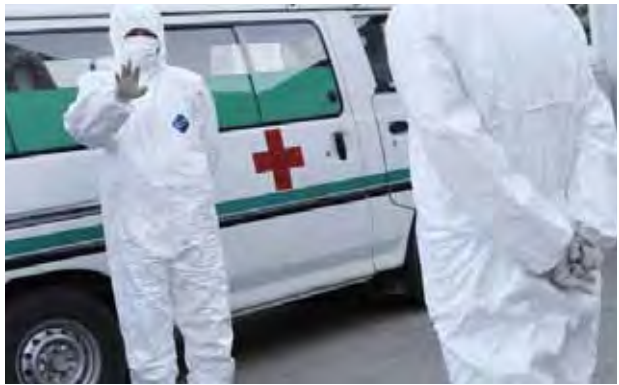
လုပ်ငန်းကုမ္ပဏီများက ပြောကြားကြသည်။ မြောက်ကိုရီးယားနိုင်ငံ၌ ယခုအချိန်အထိ အီဘိုလာဝှမ်းရောင်ကူးစက်မှု ရောဂါ ဖြစ်ပွားသူ လုံးဝမရှိခဲ့ပေ။ မြောက်ကိုရီးယားနိုင်ငံသည် အောက်တိုဘာလတွင် နယ်စပ်ဒေသကို ပိတ်ခဲ့ပြီး နိုင်ငံခြားသား ကမ္ဘာ့လှည့်ခရီးသည်

ဆိုးလ် ဖေဖော်ဝါရီ ၂၄ ဧပြီလတွင် ကျင်းပမည့် နှစ်ပတ်လည် နိုင်ငံတကာ မာရသွန်အပြေးပြိုင်ပွဲ၌ နိုင်ငံခြားသားများ ပါဝင်မှုကို ပိတ်ပင်မည်ဖြစ်ကြောင်း၊ အီဘိုလာ ဝှမ်းရောင်ကူးစက်မှုအန္တရာယ်ကို စိုးရိမ်သည့်အတွက် ယင်းသို့ ပိတ်ပင်ခြင်းဖြစ်ကြောင်း ကမ္ဘာ့လှည့်ခရီးသွားလုပ်ငန်းကုမ္ပဏီများက ပြောကြားသည်။ ပြုယမ်း မာရသွန်အပြေးပြိုင်ပွဲ၌ နိုင်ငံခြားသားများ ပါဝင်ယှဉ်ပြိုင်ရန် ခွင့်ပြုမည်မဟုတ်ဟု မြောက်ကိုရီးယား အစိုးရအဖွဲ့က မိမိတို့ကို အသိပေးအကြောင်းကြားခဲ့ကြောင်း တရုတ်နိုင်ငံအခြေစိုက် ကမ္ဘာ့လှည့်ခရီးသွား