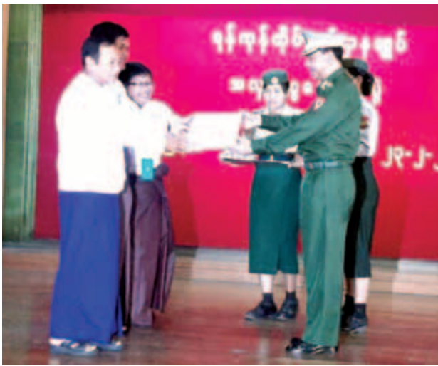
(အပေါ်ပုံ)နှင့် အခြားဒေသအသီးသီး အလှူငွေများ လှူဒါန်းလျက်ရှိကြောင်း မှ အရာရှိမိသားစုဝင်များကလည်း သိရသည်။ (ကြေးမုံ)

နေပြည်တော် ဖေဖော်ဝါရီ ၂၄ လောက်ကိုင်ဒေသတွင် နိုင်ငံတော် ကာကွယ်ရေးတာဝန်များကို ထမ်း ရွက်နေကြသော တပ်မတော်သား များအတွက် အလှူငွေပေးအပ် လှူဒါန်းပွဲအခမ်းအနားကို ဖေဖော်ဝါရီ ၂၃ ရက် နံနက်ပိုင်းက ရန်ကုန်တိုင်း စစ်ဌာနချုပ် အနော်ရထာခန်းမ၌ ကျင်းပရာ ဗိုလ်လောင်းသင်တန်း အမှတ်စဉ်(၆၄)မှ မိသားစုများက အမိနိုင်ငံတော်အတွက် ရွှပ်ရွှပ်ချွံချွံ တာဝန်ထမ်းဆောင်နေသည့် တပ်မ တော်သားများနှင့် တိုက်ပွဲအသီးသီး တွင် အသက်ပေးလှူခဲ့ကြသည့် အရာရှိစစ်သည်များ၏ မိသားစုများ အတွက် ၃၃ သိန်း ငါးသောင်းကျပ် ပေးအပ် လှူဒါန်းခဲ့ကြောင်း