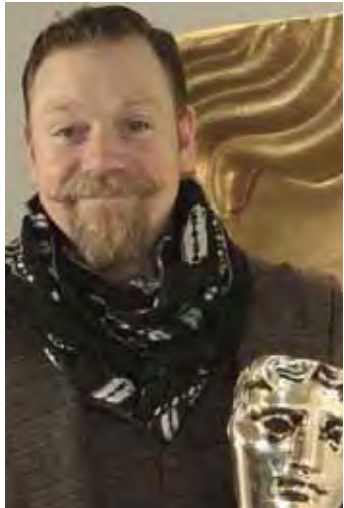
လူရွှင်တော်ကြီး ရုဖက်စ်ဟောင်းဒ်

ယင်းဆုပေးပွဲများကို the British Academy of Film and Television (BAFTA) က ၂၀၀၃ခုနှစ်မှ စတင်ကျင်းပပေးခဲ့ခြင်းဖြစ်ပြီး ယခုနှစ်အတွက် British Academy Games ဆုပေးပွဲကို ရုပ်ရှင်သရုပ်ဆောင်နှင့် လူရွှင်တော်ကြီး ရုဖက်စ်ဟောင်းဒ်က ပထမဆုံးအကြိမ် လက်ခံကျင်းပပေးသွားမည်ဖြစ်ကာ မတ် ၁၂ရက်တွင် လန်ဒန်တိုက်ကင်းဒေါ့ဒ်တွင် ပြုလုပ်သွားမည်ဖြစ်ကြောင်း ဘီဘီစီသတင်းဌာနက ဖော်ပြထားသည်။ (ဇင်ဇင်သက်)