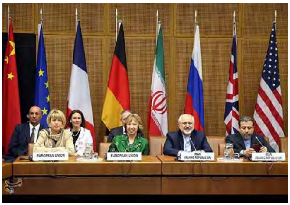
ဆက်လက်ကျင်းပမည်ဖြစ်ကြောင်းသိရသည်။ မည်သည့် နေရာတွင် တွေ့ဆုံညှိနှိုင်းမှုများလုပ်ဆောင်မည်ဆိုသည်ကို မသိရသေးပေ။ နျူကလီးယားဆိုင်ရာ သဘောတူညီမှုရရှိမည်ဆိုလျှင် အီရန်နိုင်ငံအနေဖြင့် စီးပွားရေးပိတ်ဆို့မှုမှ လွတ်မြောက်မည်ဖြစ်သည်။ ဂိုတီအိုင်း။

စရာလေးတွေကျန်နေသေးတယ်”ဟု အမေရိကန်အဆင့်မြင့် အရာရှိတစ်ဦးကပြောသည်။ မည်သည့်အချက်များ ညှိနှိုင်းပြီးပြီဆိုသည်ကိုမူ အသေးစိတ်မသိရသေးပေ။ ညှိနှိုင်းရေးသမားများက မတ်လ ၃၁ ရက်မတိုင်မီ သဘောတူညီမှုရယူနိုင်ရန် မျှော်လင့်နေကြသည်။ သို့သော် ဆွေးနွေးပွဲနောက်ဆုံးရက်ရောက်သည့် တိုင် အမေရိကန်သမ္မတ၏ လိုလားတောင့်တချက်များကို ဖြည့်ဆည်းနိုင်ခြင်းမရှိလျှင် မည်သည့်သဘောတူညီချက်ကို မှု လုပ်ဆောင်မည်မဟုတ်ဟု အမေရိကန်အရာရှိများက ဆိုသည်။ “အီရန်နျူကလီးယားကိစ္စကို နျူကလက်ထုတ်လုပ်ရေး ရပ်ဆိုင်းတဲ့အထိ ဆက်ဆွေးနွေးရမှာပဲ”ဟု အရာရှိများက ဆက်လက်ပြောသည်။ အမေရိကန်နိုင်ငံအပါအဝင် အင်အားကြီးနိုင်ငံများ ဖြစ်သည့် ရုရှား၊ တရုတ်၊ ပြိတိန်၊ ပြင်သစ်နှင့် ဂျာမနီနိုင်ငံများက အီရန်နှင့် နျူကလီးယားလက်နက်ထုတ်လုပ်မှု ရပ်ဆိုင်းရေး သဘောတူညီမှုရရှိရန် အစွမ်းကုန်ကြိုးပမ်းနေကြသည်။ ဂျီနီဗာမြို့တွင် နှစ်ရက်ကြာ ဆွေးနွေးပွဲကျင်းပပြီးနောက် ဆွေးနွေးညှိနှိုင်းမှုကို လာမည့်တနင်္လာနေ့တွင်