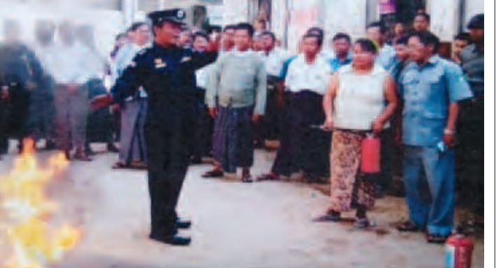
နိုင်စေလျ

လေ့ကျင့်ခြင်းတို့အား ဖေဖော်ဝါရီစတုတ္ထပတ်အတွင်းကပြုလုပ်ခဲ့သည်။ ယင်းသို့ဆောင်ရွက်ရာတွင် စစ်ကိုင်းတိုင်းဒေသကြီးအစိုးရအဖွဲ့စည်ပင်သာယာရေးဝန်ကြီးဌာန ဝန်ကြီး ဦးတင်လှိုင်မြင့်နှင့် မြို့မမြို့ဖများ၊ ခရိုင်မြို့နယ်ဌာနဆိုင်ရာတာဝန်ရှိသူများ တက်ရောက်ကြည့်ရှုခဲ့ပြီး ဝန်ကြီးမှ မီးဘေးကြိုတင်ကာကွယ်ရေးဆောင်ရွက်ထားရှိမှုအခြေအနေများကို လိုက်လံကြည့်ရှုစစ်ဆေး၍ လိုအပ်သည်များကို လမ်းညွှန်မှာကြားခဲ့သည်။