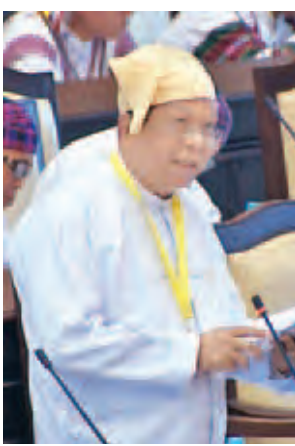
ဒုတိယဝန်ကြီး ဒေါက်တာဝင်းမြင့်။

နေပြည်တော် ဖေဖော်ဝါရီ ၂၄ ပထမအကြိမ် အမျိုးသားလွှတ်တော် (၁၂)ကြိမ်မြောက် ပုံမှန်အစည်းအဝေး ၂၀ ရက်မြောက်နေ့ကို ယနေ့နံနက် ၁၀ နာရီတွင် အမျိုးသားလွှတ်တော် အစည်းအဝေးခန်းမ၌ ကျင်းပသည်။ ရန်ကုန်တိုင်းဒေသကြီး မဲဆန္ဒနယ် အမှတ်(၃)မှ ဦးဖုန်းမြင့်အောင်က ကွမ်းယာစားသုံးသူများ၏ ကျန်းမာ ရေးနှင့် ပတ်ဝန်းကျင်သန့်ရှင်းရေး အတွက် ကွမ်းယာဆိုင်များတွင် သတိ ပေးစာတန်းများ ထားရှိနိုင်ရေးနှင့် စပ်လျဉ်း၍ မေးမြန်းရာ ကျန်းမာရေး ဝန်ကြီးဌာန ဒုတိယဝန်ကြီး ဒေါက်တာ ဝင်းမြင့်က မြန်မာနိုင်ငံသည် အရှေ့တောင်အာရှနိုင်ငံများအတွင်း ဆေးပါသော ကွမ်းစားမှုနှုန်းအများဆုံး ဖြစ်နေပြီး ကွမ်းစားခြင်းနှင့် နို့ဒဿ သော ခံတွင်းကင်ဆာရောဂါအပါ အဝင် ကင်ဆာရောဂါဖြစ်ပွားမှုလည်း များပြားလာသည်ကို တွေ့ရှိရပါ ကြောင်း။ သို့ဖြစ်ပါ၍ ကျန်းမာရေးဝန်ကြီး ဌာနအနေဖြင့် ကွမ်းစားခြင်း၏