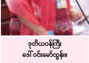
ဒုတိယဝန်ကြီး ဒေါ်ဝင်းမော်ထွန်း။

ဥပဒေသစ်တွင်ပါရှိသော စာချုပ် ဆေးရုံ၊ ဆေးခန်းစနစ်ကို အကျိုးဝင် မြို့နယ်များတွင် အကောင်အထည် ဖော်ခြင်း စသည့် လုပ်ငန်းများ သတ်မှတ်ဆောင်ရွက်ခြင်း၊ သတ်မှတ် လုပ်ငန်းများမှ အလုပ်သမားအားလုံး အကျိုးဝင်လာစေရန် သတ်မှတ် ဆောင်ရွက်ခြင်း လုပ်ငန်းများကို ဆက်လက် ဆောင်ရွက်သွားမည်ဖြစ်ပါ ကြောင်း၊ ထို့ပြင် အလုပ်လုပ်ကိုင် နိုင်စွမ်းမရှိမှု အကျိုးခံစားခွင့်၊ သက်ပြည့် အငြိမ်းစားအကျိုးခံစားခွင့် နှင့် ကျန်ရစ်သူအကျိုးခံစားခွင့်အာမခံ စနစ်နှင့် အခြားလူမှုဖူလုံရေးစနစ်ပါ အိမ်ရာစီမံကိန်းများကို လာမည့် ဘဏ္ဍာရေးနှစ်များတွင် ဘဏ္ဍာငွေ ဖူလုံမှုအပေါ်မူတည်၍ ဆက်လက် အကောင်အထည်ဖော်သွားမည်ဖြစ် ပါကြောင်းဖြင့် ဖြေကြားသည်။ ကျောက်တံတားမဲဆန္ဒနယ်မှ ဦးစိုး ဝင်း၏ “ပြည်ပတွင် သွားရောက် အလုပ်လုပ်ကိုင်နေသော အလုပ်သမား များအတွက် နိုင်ငံတော်က မည်သည့် အကူအညီပေးပေး၍ ပြည်ပအလုပ် အကိုင် ရွာဖွေရေးကိုယ်စားလှယ် လုပ်ငန်းများကို မည်ကဲ့သို့ ထိန်းသိမ်း ကြပ်မတ်နေသည်ကို သိရှိလိုကြောင်း”