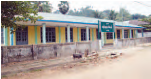
တနင်္သာရီ၊ ဖေဖော်ဝါရီ ၂၄

တနင်္သာရီတိုင်းဒေသကြီး တနင်္သာရီမြို့ ချောင်းငယ်ရပ်ကွက် အာယုလမ်းရှိ (ယခင်) အ. မ. က ချောင်းငယ်ကျောင်းမြေနေရာ၌ အောက်တိုဘာ ၂၀ ရက်မှ စတင်၍ ဆောက်လုပ်လျက်ရှိသည့် အ. မ. က ကျောင်းဆောင်သစ်သည် ရာနှုန်းပြည့် ဆောက်လုပ်ပြီးစီးနေပြီဖြစ်ကြောင်းသိရသည်။