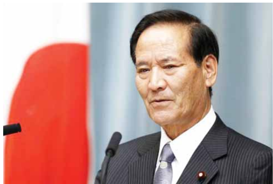
ဂျပန်လယ်ယာစိုက်ပျိုးရေးနှင့်မွေးမြူရေးဝန်ကြီး ကိုယာနိုရှိကာဝါ

“အချို့တွေအနေနဲ့ နားလည်မှုရှိပေမယ့် နားလည်မှု မရှိတဲ့သူတွေ ရှိနေသေးတယ်။ ဒါကြောင့် ရာထူးမှနုတ်ထွက်