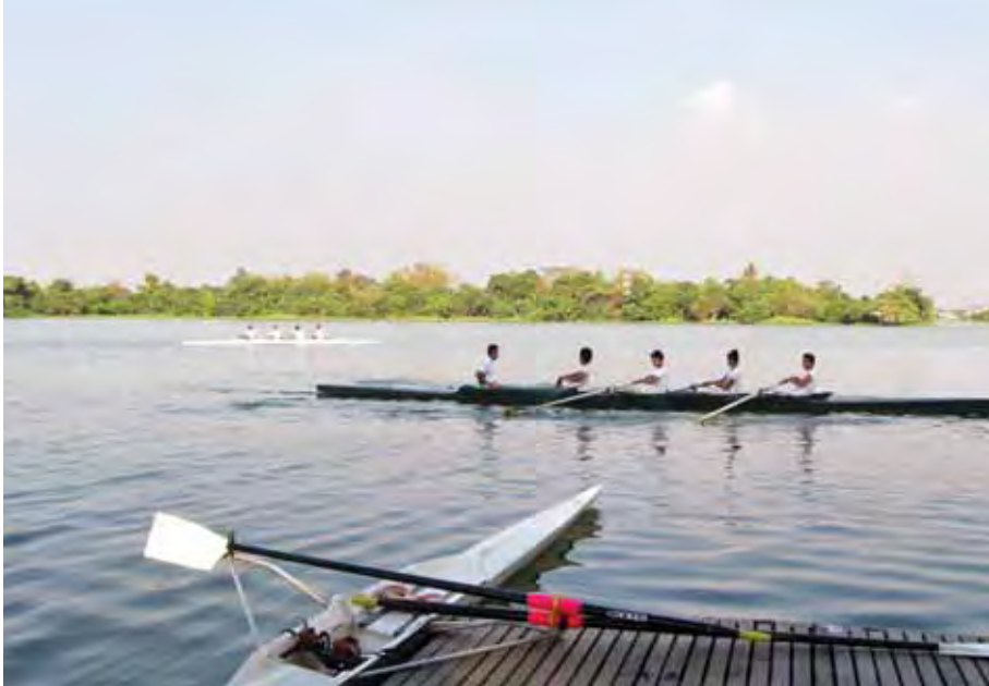
လှေလှော်အားကစားသမားများ လေ့ကျင့်နေစဉ်။

၂၀၁၄ ခုနှစ် စက်တင်ဘာလတုန်း က မလေးရှားမှာကျင်းပတဲ့ အားကစားပြိုင်ပွဲမှာ သွားပြိုင်ဖူးတယ်။ တခြားနိုင်ငံက ကျောင်းသားတွေက လှေနဲ့အရမ်းကျွမ်းဝင်တယ်။ ကျွန် တော်တို့ဆိုမှာကျတော့ လှေရဲ့အား နည်းချက်တွေရှိတယ်။ နိုင်ငံတကာ