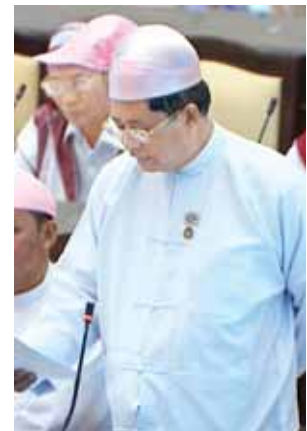
စစ်ကိုင်းတိုင်းဒေသကြီး မဲဆန္ဒနယ် အမှတ်(၈)မှ ဦးသိန်းလှိုင်။

ပဲခူးတိုင်းဒေသကြီး မဲဆန္ဒနယ် အမှတ်(၁၁)မှ ဦးအောင်ချိုဦးက ကျောင်းစာကြည့် တိုက်များသည် အဆိုရှင်တင်ပြသည့်အတိုင်း သင်ယူမှု ဝန်းကျင်ဖြစ်ပါကြောင်း၊ စာကြည့် တိုက်များ၏ အောင်မြင်မှုသည် နေ့စဉ် ရှင်သန်မှုကို ကြည့်ခြင်းအားဖြင့် သိရှိ နိုင်ပါကြောင်း၊ ပညာရေး၊ အလုပ် အကိုင်အခွင့်အလမ်း စသည့်လိုအပ် သည့် အချက်အလက်များ စာကြည့် တိုက်တွင် ရရှိနိုင်အောင် ဆောင်ရွက် ကြရမည်ဖြစ်ပါကြောင်း၊ အထက်တန်း ကျောင်းများ၏ စာကြည့်တိုက်ဖွံ့ဖြိုးမှု ကိုလည်း နည်းမျိုးစုံဖြင့် ပိုင်းခန်း ဆောင်ရွက်ကြရမည်ဖြစ်ပါကြောင်း၊ အသက်အရွယ်အလိုက် ဖတ်ရှုနိုင် သည့် စာပေများကို စာကြည့်တိုက် များတွင် ထားရှိသင့်ပါကြောင်း၊ စာကြည့်တိုက်များကို တက္ကသိုလ်ဟု တင်စားခေါ်ဝေါ်ကြပါကြောင်း၊ စာကြည့် တိုက်များ ဖွံ့ဖြိုးတိုးတက်ရေးအတွက် နည်းပညာများနှင့် ပေါင်းစပ်ဆောင် ရွက်သွားရမည် ဖြစ်ပါကြောင်းဖြင့်