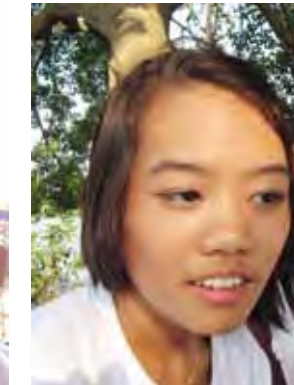
မင်းမင်းမြတ်ချယ် (ဒုတိယနှစ်၊ ရန်ကုန်စီးပွားရေးတက္ကသိုလ်)