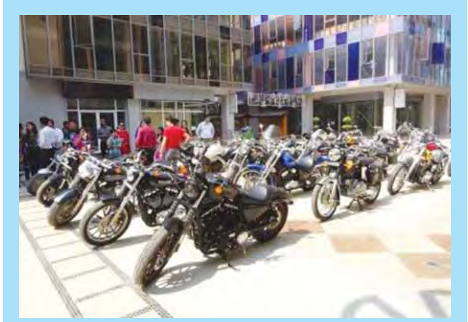
မင်္ဂလာမန္တလေးမှ ကြီးမား၍ EASY BIKE SHOW မော်တော်ဆိုင်ကယ်ပြပွဲအခမ်းအနားကို ဖေဖော်ဝါရီ ၁၉ ရက်နှင့် ၂၀ ရက်များက မန္တလေးမြို့ ရမ်းဗြဲသာစည်မြို့နယ် ၇၃ လမ်း သဇင်လမ်းနှင့် ငှေ့ဝါလမ်းကြား မင်္ဂလာမန္တလေး အိမ်ရာတွင် ကျင်းပရာ မန္တလေးမြို့ရှိ ဆိုင်ကယ်မြတ်နိုးသူများ လာရောက်ကြည့်ရှုအားပေးကြသည်။ ပြပွဲတွင်ပုလဲခိုင်နှင့် အိမ်နီးချင်း ထိုင်း၊ တရုတ်၊ အိန္ဒိယနိုင်ငံများမှထုတ်လုပ်သော အမျိုးသားစီးဆိုင်ကယ်များ ပြသခဲ့သည်။