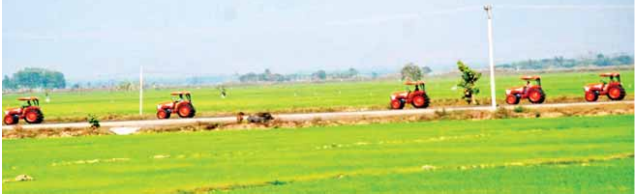
တောင်သူများ၏ စိုက်ပျိုးရေးလုပ်ငန်းအသီးသီးတွင် စိုက်ပျိုးထွန်ယက်ကြမည့် ကိုရီးယားနိုင်ငံထုတ် ထွန်စက်များအား ပဲခူးတိုင်းဒေသကြီး ရေတာရှည်မြို့နယ်၌ ရန်ကုန်-မန္တလေးကားလမ်းအတိုင်း မောင်းနှင်သွားသည်ကို ဖေဖော်ဝါရီ ၂၂ ရက်က တွေ့ရစဉ်။

မိုးပွင့်(အထူး)စီမံချက် ကွင်းဆင်းဆောင်ရွက် ပေါင် ဖေဖော်ဝါရီ ၂၃ မွန်ပြည်နယ် သထုံခရိုင် ပေါင်မြို့နယ် လူဝင်မှုကြီးကြပ်ရေးနှင့် အမျိုးသားမှတ်ပုံတင်ရေးဦးစီးဌာနက ဇင်းကျိုက်မြို့ရှိ ရပ်ကွက်လေးရပ်ကွက်နေ ပြည်သူများအား ဖေဖော်ဝါရီ ၂၂ ရက်နှင့် ၂၃ ရက်တို့တွင် နိုင်ငံသားစိစစ်ရေးကတ်ပြားများ ကွင်းဆင်းဆောင်ရွက်ပေးခဲ့သည်။