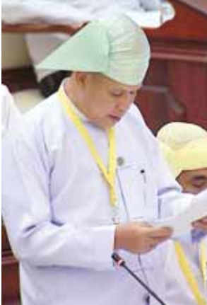
ဒုတိယဝန်ကြီး ဦးအေးမြင့်မောင်။

ဒုတိယဝန်ကြီး ဦးသန်းထွန်းက တရုတ်နိုင်ငံ EXIM Bank မှ ချေးငွေ ရယူဆောင်ရွက်ရာတွင် စိုက်ပျိုး ရာသီချိန်မတိုင်မီ အနီးစပ်ဆုံး ခန့်မှန်းတွက်ချက်၍ အသင်းသား များသို့ ထုတ်ချေးပေးခြင်းဖြစ်ပါ ကြောင်း၊ သမဝါယမဝန်ကြီးဌာနနှင့်