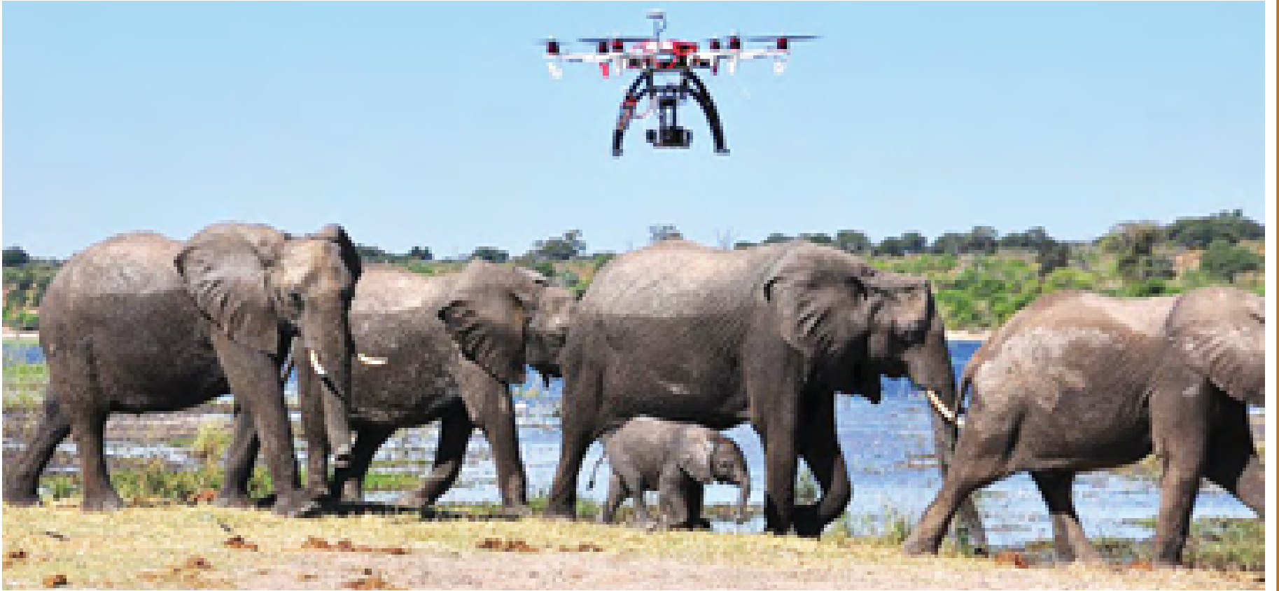
ကင်ညာနိုင်ငံတွင် တောဆင်ရိုင်းများကို ထိန်းသိမ်းစောင့်ရှောက်နိုင်ရန် မောင်းသူမဲ့လေယာဉ်ဖြင့် ကင်းလှည့်စောင့်ကြပ်စဉ်။

အာဖရိကတိုက်သည် သဘာဝသယံဇာတကြွယ်ဝပါလျက် ကမ္ဘာပေါ်တွင် အဆင်းရဲဆုံး တိုက်ကြီးတစ်တိုက်ဖြစ်သည်ဟု ကျွန်ုပ်မှတ်သားခဲ့ရဖူးလေ၏။ အာဖရိကတိုက်သည် “ရွှေမည်း” (ခေါ်)ရေနံ့၊ သဘာဝဓာတ်ငွေ့၊ သစ်၊ စိန်၊ ရွှေနှင့်ဘောက်ဆိုက်စသည့် သယံဇာတများကြွယ်ဝလှစွာစား ပြည်သူများမှာ ဆင်းရဲမဲ့သံသရာအတွင်း ဒေါင်ချာလည်နေကြရဆဲဖြစ်လေသည်။ ကမ္ဘာ့စက်မှုနိုင်ငံများသည် အာဖရိကတိုက်၏ သဘာဝအရင်းအမြစ်များကို ထုတ်ယူခွင့်ရရှိနိုင်ရန် ယှဉ်ပြိုင်နေကြသည်။ သဘာဝပတ်ဝန်းကျင် အဆင့်အတန်းနိမ့်ကျလာသည့် ပြဿနာ၊ အဂတိလိုက်စားမှုပြဿနာ၊ လူ့အခွင့်အရေး ချိုးဖောက်မှု ပြဿနာ၊ နည်းပညာမရှိသည့် ပြဿနာ၊ ပြည်တွင်းစစ်မီးလျှံများ တောက်လောင်နေသည့် ပြဿနာ၊ အစွန်းရောက်မှုနှင့် အကြမ်းဖက်မှု ပြဿနာ စသည့်ပြဿနာများကြောင့် ပြည်သူတို့မှာ ဖြူခါပြာခါကျကြရလေသည်။ တစ်ချိန်တည်းမှာပင် အာဖရိကတိုက်သည် နှုတ်စွဲလဲရာ သူ့ဆိုးထောင်းဟုဆိုသည့် တောရိုင်းမြေကျွဲလာသည့် အခြေအနေတွင် ထွေးလုံးရစ်ပတ်ရှိနေသည်။ အာဖရိကတိုက်သည် တစ်ချိန်တစ်ခါက တောရိုင်းတိရစ္ဆာန်တို့ပျော်စရာ ဒေသအဖြစ် ကမ္ဘာကျော်ခဲ့သည်။ ကျွန်ုပ်ငယ်စဉ်က အမေရိကန်စာရေးဆရာကြီး အက်ဒဂါရိုက်ဘားရီး၏ လက်ရာ တောတွင်းလူသား “တာင်” ဝတ္ထုများကို ဖတ်ရှုရသည့်အခါ ဝိရသနှင့် သင်္ဂြိုဟ်သည့် ခံစားခဲ့ရဖူးလေသည်။ တောတွင်းလူသားတာင်ကို လုပ်ကြီးတိုက် မွေးစားခဲ့ကြပြီး လူသားယဉ်ကျေးမှု သွတ်သွင်းမခံသည့် တောတွင်းလူသား အဖြစ်လည်းကောင်း၊ စွန့်စားသွားလာမှု၌သာ မွေ့လျော်သူအဖြစ်လည်းကောင်း သရုပ်ဖော်ကျူးလေသည်။