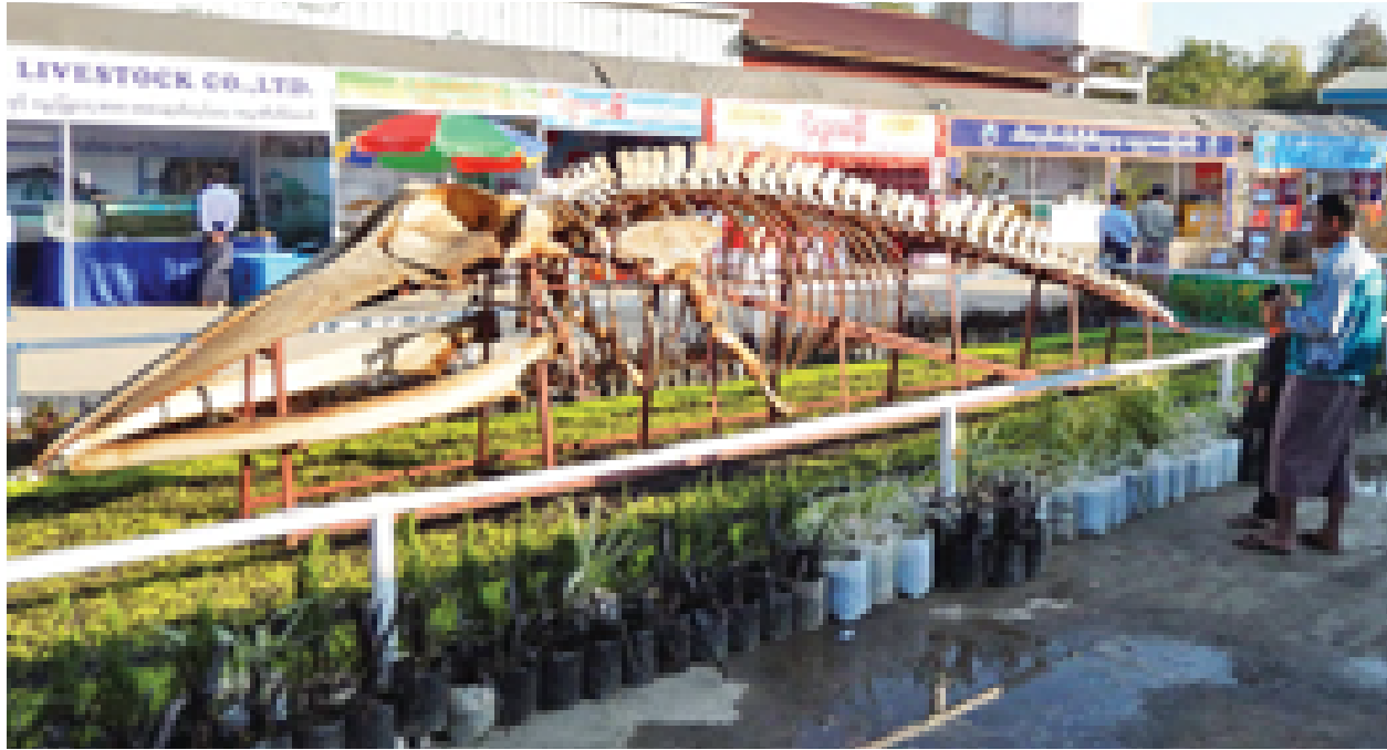
မန္တလေးတိုင်းဒေသကြီး အမရပူရမြို့နယ် နတ်ရေကန်ငါးလုပ်ငန်းစခန်းတွင် ကျင်းပသော မြန်မာနိုင်ငံငါးလုပ်ငန်းဆိုင်ရာ ပြပွဲပြိုင်ပွဲတွင် ပြသထားသော ဝေလငါးအဖိုးစုပြပွဲကို ဇန်နဝါရီ ၂၅ ရက်က တွေ့ရစဉ်။ (ဓာတ်ပုံ-၀၀၂)

၂၀၁၅ ခုနှစ် ဇန်နဝါရီလ ၂၆ ရက်နေ့တွင် ကျရောက်သည့် ဩစတြေးလျ ဓနသဟာယနိုင်ငံ၏ အမျိုးသားနေ့တွင် ပြည်ထောင်စုသမ္မတမြန်မာနိုင်ငံတော် နိုင်ငံတော်သမ္မတ ဦးသိန်းစိန်ထံမှ ဩစတြေးလျဓနသဟာယနိုင်ငံ ဘုရင်ခံချုပ် ဗိုလ်ချုပ်ကြီး ပီတာ ကော့စ်ဂရုနှင့် ဝန်ကြီးချုပ် မစ္စတာ တိုနီအဘော့ ထံသို့ ဝမ်းမြောက်ကြောင်း သဝဏ်လွှာများ ပေးပို့သည်။ (သတင်းစဉ်)