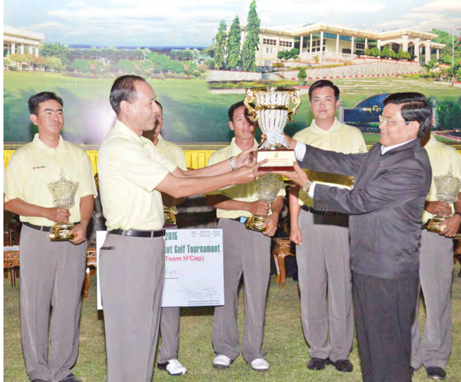
ဒုတိယသမ္မတ ဦးညွှန်ထွန်း ဂေါက်သီးရိုက်ပြိုင်ပွဲ အသင်းလိုက် အကျောပေးနှင့် အကျောမဲ့ပြိုင်ပွဲများတွင် ပထမရရှိသော ကာကွယ်ရေးဝန်ကြီးဌာနအသင်းအား ဆုပေးအပ်ပေးအပ်ခဲ့ခြင်း (သတင်းစဉ်)

❖ ရှေ့မှ ဆုတံဆိပ်အဖြစ် ငွေစားများပြုလုပ် ပေးနေကြရသည်။