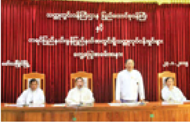
အဆင့်ဆင့်ရှင်းလင်းခြင်း၊ သတ္တု တွင်းဝန်ကြီးဌာနမှ တာဝန်ရှိသူများ၊ သတ္တုလုပ်ငန်းရှင်များက သတ္တုကဏ္ဍ ဖွံ့ဖြိုးတိုးတက်ရေးအတွက် အပြန်အလှန် ဆွေးနွေးညှိနှိုင်းခဲ့ကြခြင်း၊ အခက်အခဲများ တင်ပြဖြေရှင်းခြင်း များ ပြုလုပ်ကြသည်။ ထို့နောက် ပြည်ထောင်စုဝန်ကြီးနှင့် မွန်ပြည်နယ် ဝန်ကြီးချုပ်တို့သည် အဖွဲ့ဝင်များနှင့်အတူ မွန်ပြည်နယ် သံဖြူဇရပ်မြို့နယ် ပင်ဆားကွင်း သို့ရောက်ရှိပြီး ဆားတောင်သူ လုပ်ငန်းရှင်များနှင့် တွေ့ဆုံ၍ လိုအပ် သည့်များ ညှိနှိုင်းပေါင်းစပ်ဆောင်ရွက် ပေးခဲ့ကြောင်း သတင်းရရှိသည်။ (သတင်းစဉ်)