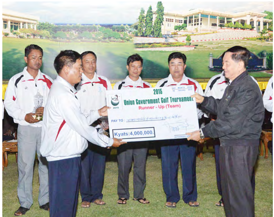
ပြည်ထောင်စုဝန်ကြီး ဦးသိန်းညွန့် ဂေါက်သီးရိုက်ပြိုင်ပွဲတွင် ဆုရရှိသူများအား ဆုများပေးအပ်ပေးအပ်ခဲ့ခြင်း (သတင်းစဉ်)

ဆုချီးမြှင့်ပွဲအပြီးတွင် တက်ရောက်လာကြသည့် ဧည့်သည်တော်များနှင့် ပြိုင်ပွဲဝင်အသင်း ၃၄ သင်းမှ အားကစားသမားများအား နေပြည်တော် မြို့တော် ဂေါက်တွင်းမြက်ခင်းပြင်၌ ဂုဏ်ပြုညစာစားပွဲပြု၍ တည်ခင်းဧည့်ခံသည်။ (သတင်းစဉ်)