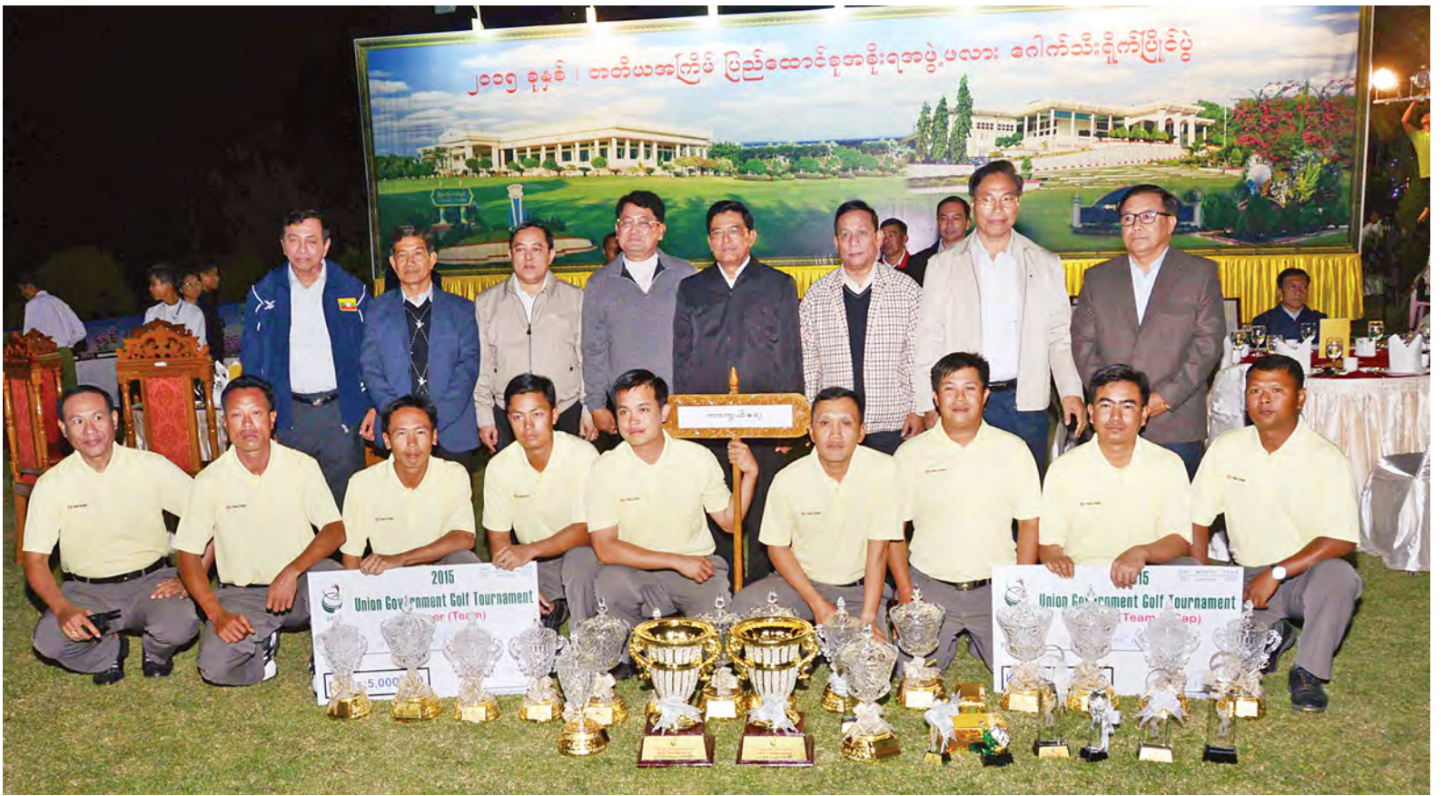
ဒုတိယသမ္မတ ဦးညွှန်ထွန်းနှင့် အဖွဲ့ဝင်များ ဂေါက်သီးရိုက်ပြိုင်ပွဲအသင်းလိုက် အကျောပေးနှင့် အကျောမဲ့ပြိုင်ပွဲများတွင် ပထမဆုရရှိသော ကာကွယ်ရေးဝန်ကြီးဌာနအသင်းနှင့်အတူ စုပေါင်းမှတ်တမ်းတင် ဓာတ်ပုံရိုက်စဉ်။ (သတင်းစဉ်)

နေပြည်တော် ဇန်နဝါရီ ၂၅ တတိယအကြိမ်မြောက် ပြည်ထောင်စု အစိုးရအဖွဲ့ဖလား ဂေါက်သီးရိုက် ပြိုင်ပွဲ ဆုပေးပွဲအခမ်းအနားကို ယနေ့ညပိုင်းတွင် နေပြည်တော်ရှိ မြို့တော်ဂေါက်တွင်း မြက်ခင်းပြင်၌ ကျင်းပရာ ဒုတိယသမ္မတ ဦးညွှန် ထွန်း တက်ရောက်၍ ဂုဏ်ပြုဆုများ ပေးအပ်ခဲ့ခြင်းဖြစ်သည်။ အခမ်းအနားသို့ ပြည်ထောင်စု ဝန်ကြီးများ၊ ဒုတိယဝန်ကြီးများ၊ ဌာန ဆိုင်ရာအကြီးအကဲများ၊ ပြိုင်ပွဲဝင် အသင်း ၃၄ သင်းမှ အားကစားသမား များ၊ ဖိတ်ကြားထားသူများနှင့် တာဝန် ရှိသူများ တက်ရောက်ကြသည်။ အခမ်းအနားတွင် ပြိုင်ပွဲကျင်းပရေး ဦးစီးကော်မတီဥက္ကဋ္ဌ ပြည်ထောင်စု ဝန်ကြီး ဦးတင့်ဆန်းက ပြိုင်ပွဲကျင်းပရ ခြင်းနှင့်စပ်လျဉ်း၍ ရှင်းလင်းတင်ပြ သည်။ ထို့နောက် ဆုချီးမြှင့်ပွဲအခမ်း အနားကို ဆက်လက်ကျင်းပရာ ပြည်ထောင်စုဝန်ကြီးများနှင့် ဒုတိယ ဝန်ကြီးများက အကောင်းဆုံးအဖွဲ့ သမား အကျောပေးနှင့် အကျောမဲ့ဆုရ အသင်းများအား လည်းကောင်း၊ စာမျက်နှာ ၃ ကော်လံ ၄ သို့ □