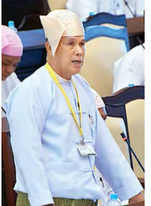
ပတ်ဝန်းကျင်ထိခိုက်သိမ်းဆီးရေးနှင့် သစ်တောရေးရာဝန်ကြီးဌာန ဒုတိယဝန်ကြီး ဦးအေးမြင့်မောင်။

နေပြည်တော် ဇန်နဝါရီ ၂၄ - အမျိုးသားလွှတ်တော် (၁၂)ကြိမ်မြောက်ပုံမှန်အစည်းအဝေး ပဋိပက္ခမဟုတ်ဘဲ ယနေ့နံနက် ၁၀ နာရီတွင် ကျင်းပရာ မေးခွန်း(၆)ခု မေးမြန်းဖြေကြားခြင်း၊ ပြင်ဆင်ချက်ဖြင့် ပြန်လည်ပေးပို့လာသည့် ဥပဒေကြမ်း (၁)ခု တင်ပြခြင်းနှင့် အဆို(၁)ခု ဆွေးနွေးခြင်းတို့ ဆောင်ရွက်ခဲ့ကြသည်။ အစည်းအဝေးတွင် လွှတ်တော်ကိုယ်စားလှယ်နှစ်ဦး၏ သဘာဝပတ်ဝန်းကျင်ထိခိုက်သိမ်းဆီးရေးဆိုင်ရာ မေးခွန်းများနှင့်စပ်လျဉ်း၍ ပတ်ဝန်းကျင်ထိခိုက်သိမ်းဆီးရေးနှင့် သစ်တောရေးရာဝန်ကြီးဌာန ဒုတိယဝန်ကြီး ဦးအေးမြင့်မောင်က ပြန်လည်ဖြေကြားသည်။ တနင်္သာရီတိုင်းဒေသကြီး မဲဆန္ဒနယ် အမှတ်(၁)မှ ဦးစိုးသက်၏ “ဝန်ကြီးဌာနတစ်ခုကြောင့် သဘာဝပတ်ဝန်းကျင် ပျက်ယွင်းနေမှုများကို မည်သို့ထိန်းသိမ်းညှိနှိုင်းဆောင်ရွက်ရန်ရှိသည်ကို သိရှိလိုကြောင်း” မေးခွန်းနှင့် စပ်လျဉ်း၍ ကျောက်တောင်အား မိုင်းခွဲ၍ လမ်းချင်းဆောင်ရွက်ရာတွင် ထွက်ရှိလာသောကျောက်များကို လမ်းခင်းရာတွင် အသုံးပြုပါကြောင်း၊ သဘာဝအတိုင်း ကျောက်တောင်များကို ပျက်စီးမှုနည်းနိုင်သမျှနည်းအောင် ထိန်းသိမ်းဆောင်ရွက်လျက် ရှိပါကြောင်း၊ မိုင်းခွဲသည့်အခါ ကျောက်အချို့မှာ မတ်တော်သည်ချောင်းအတွင်းသို့ ကျရောက်မှုရှိခဲ့သော်လည်း ချောင်းတိမ်ကောသည်အထိ ဖြစ်ပေါ်ခြင်း မရှိပါကြောင်း။ သဘာဝပတ်ဝန်းကျင် ထိခိုက်မှုနည်းပါးအောင် တာဝန်ရှိသူအဆင့်ဆင့်က ကြီးကြပ်ဆောင်ရွက်