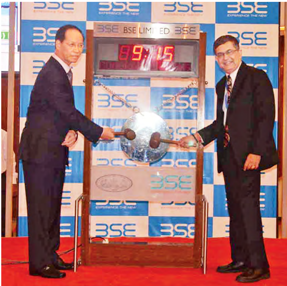
ဒုတိယသမ္မတ ဒေါက်တာစိုင်းမောက်ခမ်းနှင့် ဦးဆောင်ညွှန်ကြားရေးမှူးတို့ စတော့အိတ်ချိန်းအား ဖွင့်လှစ်ပေးစဉ်။ (သတင်းစဉ်)

အဆိုပါတွေ့ဆုံပွဲသို့ ဒုတိယသမ္မတနှင့်အဖွဲ့ ပြည်ထောင်စုဝန်ကြီး၊ ဒုတိယ ဝန်ကြီးများ၊ ချင်းပြည်နယ်နှင့်စစ်ကိုင်းတိုင်းဒေသကြီးအစိုးရအဖွဲ့ဝန်ကြီးများ၊ အိန္ဒိယနိုင်ငံဆိုင်ရာမြန်မာသံအမတ်ကြီးနှင့် UMFCFI တို့မှ တာဝန်ရှိသူများ တက်ရောက်ကြသည်။ (သတင်းစဉ်)