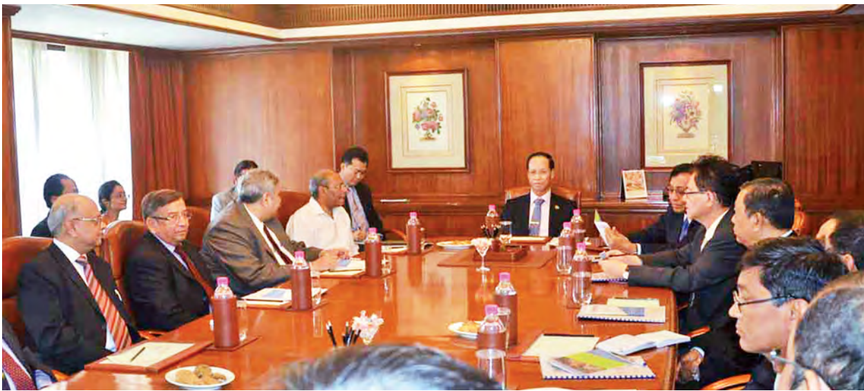
ဒုတိယသမ္မတ ဒေါက်တာစိုင်းမောက်ခမ်း အင်ဒို-မြန်မာ စီးပွားရေး လုပ်ငန်းရှင်များအား လက်ခံတွေ့ဆုံစဉ်။ (သတင်းစဉ်)

မွမ်ဘိုင်း ဇန်နဝါရီ ၂၃ အိန္ဒိယသမ္မတနိုင်ငံ မွမ်ဘိုင်းမြို့တွင် ချစ်ကြည်ရေးခရီးရောက်ရှိနေသော ဒုတိယသမ္မတ ဒေါက်တာစိုင်းမောက်ခမ်းနှင့် အဖွဲ့ဝင်များသည် ယနေ့ဒေသစံတော်ချိန် နံနက် ၉ နာရီတွင် ဘုံဘေစတော့အိတ်ချိန်းသို့ ရောက်ရှိရာ ဘုံဘေစတော့အိတ်ချိန်း ဦးဆောင်ညွှန်ကြားရေးမှူး မစ္စတာ အာရှီကူးမား ရော့ဟန်က ခရီးဦးကြိုဆိုသည်။ ထို့နောက် ဒုတိယသမ္မတ ဒေါက်တာစိုင်းမောက်ခမ်းနှင့် ဦးဆောင်ညွှန်ကြားရေးမှူးတို့သည် ဘုံဘေစတော့အိတ်ချိန်း ဧည့်ခန်းမ၌ ဇန်နဝါရီ ၂၃ ရက် စတော့အိတ်ချိန်းအား အမှတ်စဉ်ရေတွက်စတင်ပြီး အမှတ်စဉ် သုည အရောက်တွင် စတင်ဖွင့်လှစ်ပေးကြသည်။ ယင်းနောက် ဒုတိယသမ္မတက နှုတ်ခွန်းဆက်စကားပြောကြားပြီး အမှတ်တရလက်ဆောင်ပစ္စည်းများ အပြန်အလှန်ပေးအပ်ကြကာ စုပေါင်းမှတ်တမ်းတင်ဓာတ်ပုံရိုက်ကြသည်။ ဆက်လက်၍ ဒုတိယသမ္မတသည် ဘုံဘေစတော့အိတ်ချိန်းအတွင်း လှည့်လည်ကြည့်ရှုလေ့လာသည်။