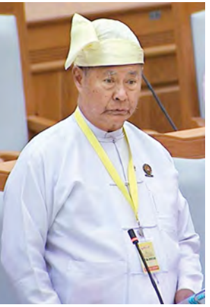
ဒုတိယဝန်ကြီး ဒေါက်တာတင်ရွှေ

မှုများ မြှင့်တင်နိုင်ခြင်း၊ အစိုးရနှင့် ပုဂ္ဂလိကတို့အကြား ခရီးသွားလုပ်ငန်း ဖွံ့ဖြိုးတိုးတက်မှုတွင် ပိုမိုထိရောက်စွာ ပူးပေါင်း ဆောင်ရွက်နိုင်ခြင်း၊ အာဆီယံနိုင်ငံများအတွင်း ခရီး သွားလာခြင်း၊ ခရီးသွားဝန်ဆောင်မှု လုပ်ငန်းများနှင့် အထောက်အကူပြု လုပ်ငန်းများ၌ ရင်းနှီးမြှုပ်နှံမှုများ ပိုမို ဝင်ရောက်နိုင်စေခြင်းစသည့် အကျိုး များ ရရှိနိုင်မည်ဖြစ်ပါကြောင်းဖြင့် ရှင်းလင်းတင်ပြသည်။