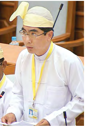
ဒုတိယဝန်ကြီး ဦးသောင်းတင်

ဝန်ကြီးဌာနအတွက် ဂျပန်နိုင်ငံ အပြည်ပြည်ဆိုင်ရာပူးပေါင်းဆောင် ရွက်ရေးအဖွဲ့ဝင်ဖွဲ့စည်းမှု ဂျပန်ယန်း(၁၀ ဒသမ ၅၀၀) ဘီလီယံချေးယူခွင့် နှင့်စပ်လျဉ်း၍ လွှတ်တော်ကိုယ်စား လှယ်နှစ်ဦးတို့က ဆွေးနွေးကြရာ ဆက်သွယ်ရေးနှင့် သတင်းအချက် အလက်နည်းပညာ ဝန်ကြီးဌာန ဒုတိယဝန်ကြီး ဦးသောင်းတင်က ပြန်လည်ရှင်းလင်းဆွေးနွေးသည်။