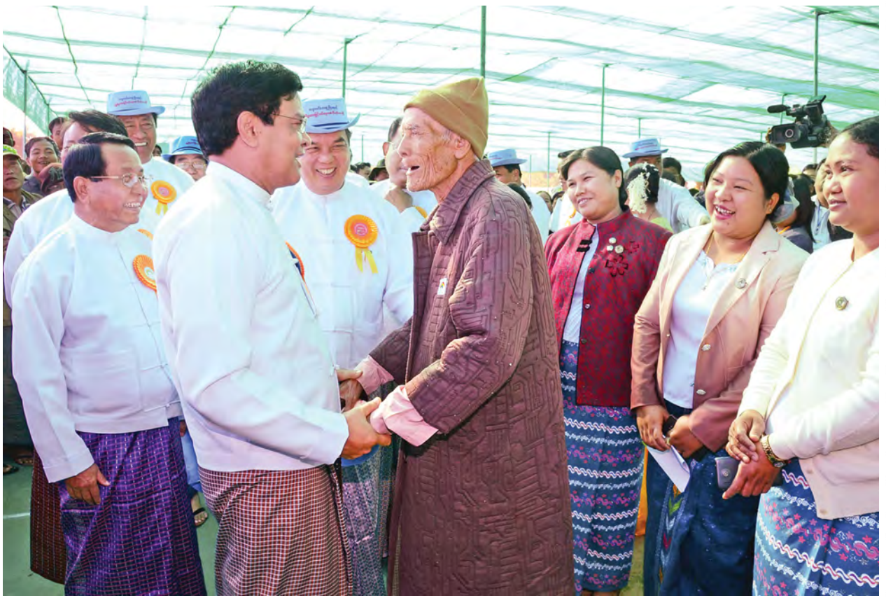
ဒုတိယသမ္မတ ဦးညွှန်ထွန်း စစ်ကိုင်းတိုင်းဒေသကြီး ကျေးလက်ဖွံ့ဖြိုးရေးနှင့် လူမှုစီးပွားဘဝမြှင့်တင်ရေးအခမ်းအနားသို့ တက်ရောက်လာကြသော ဒေသခံများအား ရင်းရင်းနှီးနှီး နှုတ်ဆက်စဉ်။ (သတင်းစဉ်)

အခမ်းအနားတွင် သမဝါယမဝန်ကြီးဌာန ပြည်ထောင်စုဝန်ကြီး ဦးကျော်ဆန်းက သမဝါယမလုပ်ငန်းများနှင့် စပ်လျဉ်း၍ ရှင်းလင်းတင်ပြရာ၌ ယနေ့အခမ်းအနားတွင် စစ်ကိုင်းတိုင်းဒေသကြီးအတွင်းရှိ ကျေးလက်နှင့် မြို့ပြနေအခြေခံပြည်သူများအတွက် ၂၀၁၅ ခုနှစ် ဆောင်းသီးနှံ ချေးငွေကျပ် သန်းပေါင်း ၂၃၈၅၂ သန်းကျော်ကို ထုတ်ချေးမည်ဖြစ်ပြီး လာမည့်မေလနှင့် ဇွန်လအတွင်း ချေးငွေမရကြသေးသည့် ကျေးရွာပေါင်း ၁၁၇၀ ရွာမှ အသင်းသား အသစ် ၆၅၀၀၀ ကျော်အတွက် ငွေကျပ်သန်းပေါင်း ၆၅၆၀ သန်းကျော်ကို ထုတ်ချေးပေးမည်ဖြစ်ပါကြောင်း၊ ထို့ပြင် ပြည်သူများအနေဖြင့် မိမိတို့လုပ်ငန်းများကို ပိုမိုရင်းနှီးလုပ်ကိုင်နိုင်စေရန်အတွက် ချေးငွေရရှိပြီးဖြစ်သည့် ကျေးရွာ ၂၁၆၉ ရွာမှ သတ်မှတ်ချက်နှင့်ညီညွတ်သော အသင်းသားဟောင်း ၆၉၄၀၀ ကျော်ကိုလည်း တိုးမြှင့်ချေးငွေကျပ်သန်း ၁၁၁၄၀ကျော်ကို ထုတ်ချေးပေးသွားမည်ဖြစ်ပါကြောင်း၊ စစ်ကိုင်းတိုင်းဒေသကြီးမှ ပြည်သူများအဆိုပြုထားသည့် ငွေကျပ်သန်းပေါင်း ၁၁၅၉၅ သန်းကျော်တန်ဖိုးရှိ လက်တွန်းထွန်းစက် ၁၃၈ စီး၊ ထွန်းစက်အမျိုးမျိုး ၄၂၃ စီးနှင့် ရိတ်သိမ်းခြွေလှေစက် ၃၉ စီးတို့ကိုလည်း အရစ်ကျငွေချေစနစ်ဖြင့် စာမျက်နှာ ၆ ကော်လံ ၁ သို့