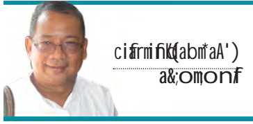
ci firmi fik (abm'aA') a&omorf

၂၀၁၄ နှစ်မတုန်ခင်မှာ ကျွန်တော် အလွန် သွားချင်တဲ့ ခရီးတစ်ခုကိုသွားပြီး ကိုယ်ဝါသနာ ပါတဲ့အလုပ်တွေကို လုပ်ခွင့်ရခဲ့ပါတယ်။ ပြီးခဲ့ တဲ့နှစ်ထဲမှာ တံတားဦးနိုင်ငံတကာလေဆိပ် ကိုဖြတ်ပြီး ဇာတိရပ်ရွာကို လေးခေါက်လောက် ရောက်ပေမယ့် မိဘများခေါင်းချခဲ့တဲ့ ကိုယ် လည်းနေခဲ့တဲ့ မန္တလေးကို မရောက်ဖြစ်ခဲ့ ပါ။ အခုတော့တံတားဦး နိုင်ငံတကာ လေဆိပ် ကနေပြီးတော့ မန္တလေးမြို့ထဲကို ဝင်ခဲ့ပါတယ်။ မွေးစားသမီးတစ်ယောက်ရဲ့အိမ်မှာ တည်းပါ တယ်။