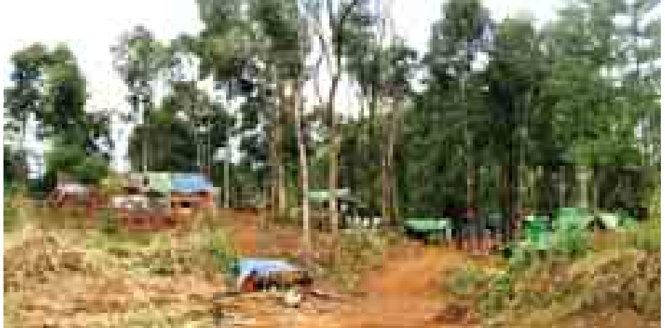
ပွိုင့်-၇၀၉ တစ်ပိုက်အား တွေ့ရစဉ်။