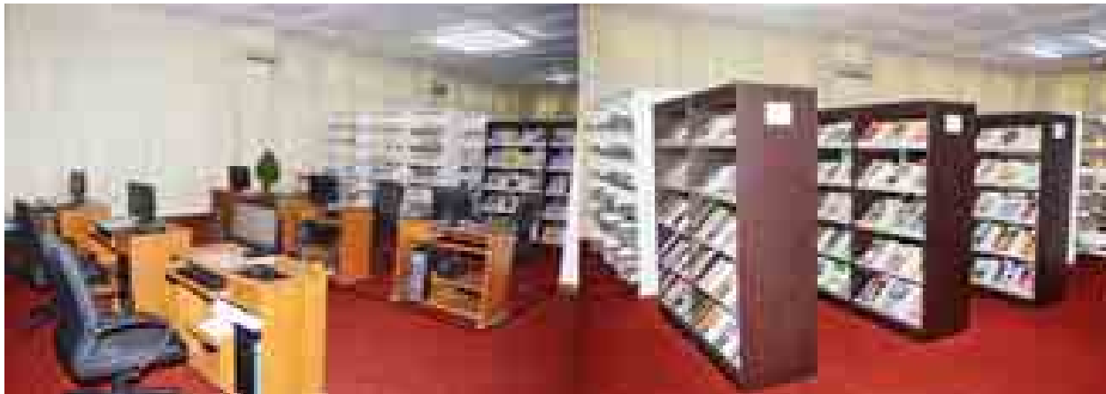
အမျိုးသားစာကြည့်တိုက်ခွဲ(ရန်ကုန်)အတွင်း စာအုပ်၊ စာနယ်ဇင်းများ၊ Online Public Sccess Catalogue၊ ကလေးစာဖတ်ခန်းများ တွေ့ရစဉ်။

ရန်ကုန် ဇန်နဝါရီ ၂၀ ကြည့်မြင်တိုင်တစ်ဖက်ကမ်း စက်ဆန်းရပ်ကွက် ဘုန်းတော်ကြီးကျောင်းအနီးတွင် ၂၀၀၃ ခုနှစ်ကတည်ထောင်ထားသော ရပ်ကွက်စာကြည့်တိုက်သည် နာဂစ်မတိုင်မီက လူများတက်ရောက်၍ အိမ်သဖွယ်နေထိုင်ခဲ့ခြင်းနှင့် နာဂစ်တိုက်ခတ်ခြင်းများကြောင့် ပျက်စီးယိုယွင်းမှုများရှိနေကြောင်း ရပ်ကွက်နေသူတစ်ဦးက ပြောကြားသည်။ တက္ကသိုလ်ကျောင်းသားတစ်ဦးက “ရဲစခန်း၊ ကျန်းမာရေးဌာန၊ အထက်တန်းကျောင်း၊ မိတာရုံးနဲ့ ဘုန်းတော်ကြီးကျောင်း၊ နောင်ဖွင့်လှစ်မယ့် တိုက်နယ်ဆေးရုံစတဲ့ အချက်အချာနေရာတွေ စာကြည့်တိုက်တစ်ခုတွေ ရှိသင့်ပါတယ်။ စာကြည့်တိုက်ရှိနေဖို့ကိုလည်း စာကြည့်တိုက်ပညာကျွမ်းကျင်သူများနဲ့ သက်ဆိုင်ရာအဖွဲ့အစည်းတွေက စနစ်တကျကိုင်တွယ်ပြီး စက်ဆန်းရပ်ကွက်မှာရှိနေတဲ့ ယခင်စာကြည့်တိုက်ဟောင်းကို ပြန်လည်ရှင်သန်တင်တယ်စေပါတယ်” ဟု ပြောကြားသည်။ ထိုစာကြည့်တိုက်အား သက်ဆိုင်ရာတာဝန်ရှိသူများက ပြန်လည်မွမ်းမံပြီး စာကြည့်တိုက်အသွင်သဏ္ဍာန်ကို ဖော်ဆောင်ရှင်သန်စေလိုကြောင်းလည်း ရပ်ကွက်အတွင်းနေထိုင်သူ သက်ကြီးတစ်ဦးက ၎င်း၏ဆန္ဒကိုပြောပြခဲ့သည်။ စာကြည့်တိုက်များသည် ဘဝ၏ ဒုတိယတက္ကသိုလ်ဟုတင်စား၍ နိုင်ငံတော်မှ စာကြည့်တိုက်လုပ်ငန်းများဖွံ့ဖြိုးတိုးတက်ရှင်သန်ရေးကို ကြိုးစားနေချိန်တွင် ယခုကဲ့သို့ တည်ရှိပြီးစာကြည့်တိုက်များ ပျက်စီးပျောက်ဆုံးသွားစေရန် သက်ဆိုင်ရာတာဝန်ရှိသူများနှင့် ရပ်ကွက်နေပြည်သူများက စုပေါင်းထိန်းသိမ်းသင့်ပါသည်။ (ရွှေတိုင်လွင်)