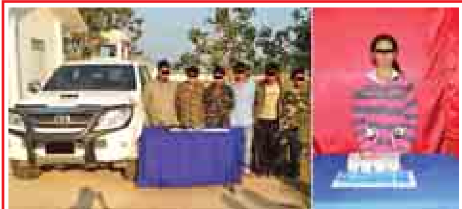
ကျဖီး၊ ကျလော၊ ရေလာမြင့် (ခ) ကျတော၊ အိုက်ကျော်၊ အိုက်ခမ်း၊ ကျဝနှင့် မအဲလစ်ဇာတ်တို့ ခုနစ်ဦးအား သိမ်းဆည်းရမိ မူးယစ်ဆေးဝါးများနှင့်အတူ တွေ့ရစဉ်။