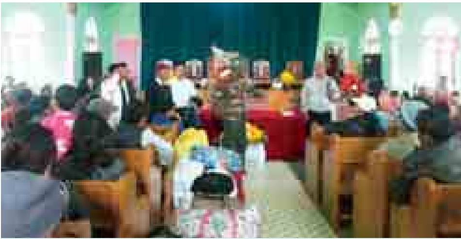
အောင်ဘာလေးကျေးရွာ ခရစ်ယာန်ဘုရားရှိခိုးကျောင်းတွင် ရွာသူရွာသားများအား အားပေးစကား ပြောကြားစဉ်။

အေ (ကချင်)အဖွဲ့မှ အင်အား ၁၅ ဦး ခန့်သည် စောင့်ကြိုတိုက်ခိုက်ခဲ့သဖြင့် ထိတွေ့မှုဖြစ်ပွားခဲ့ပြီး လိုက်လံ ရှင်းလင်းရာ ပွိုင့်-၅၂၂ တောင်ကုန်း၌ ကေအိုင်အေ အင်အား ၃၀ ခန့်နှင့် ထပ်မံထိတွေ့မှုဖြစ်ပွားခဲ့သည်။ ဇန်နဝါရီ ၁၆ ရက်တွင် ဆက်လက်၍ နယ်မြေရှင်းလင်းခဲ့ရာ ပွိုင့်-၆၇၁ အနီး ရောက်ရှိစဉ် ကေအိုင်အေ(ကချင်) အဖွဲ့မှ အင်အား ၃၀ ခန့်နှင့် ထိတွေ့ တိုက်ပွဲဖြစ်ပွားခဲ့ပြီး KIA(ကချင်)အဖွဲ့ သည် အရှေ့မြောက်ဘက်သို့ ဆုတ်ခွာ သွားခဲ့သည်။ ဇန်နဝါရီ ၁၇ ရက် နံနက်ပိုင်းတွင် ပွိုင့်-၆၇၁ အနီး အခြေပြုနေသော တပ်မတော်စစ်ကြောင်းအား ကေအိုင် အေ (ကချင်)အဖွဲ့ အင်အား ၃၀ ခန့်မှ တိုက်ခိုက်လာသဖြင့် မိမိတပ်မတော် စစ်ကြောင်းက ပြန်လည်တိုက်ခိုက်ရာ