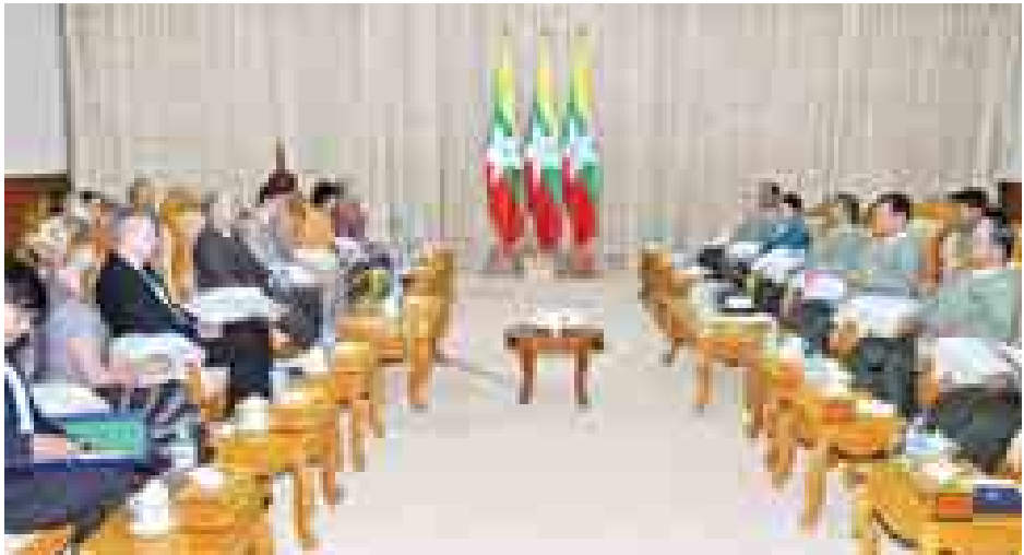
များနှင့်ပတ်သက်၍ နိုင်ငံတကာစံချိန် စံညွှန်းများနှင့် အညီ လိုက်နာရေး၊ ရေးသားနိုင်ရေး၊ ဘက်လိုက်ခြင်းမရှိဘဲ သတင်းပေးနိုင်ရေး စသည့် ဆောင်ရွက်မည့်လုပ်ငန်းစဉ် များအား Powerpoint ဖြင့် ရှင်းလင်းတင်ပြဆွေးနွေးခဲ့ပြီး EU သံအမတ်ကြီးက EU အနေဖြင့် ရွေးကောက်ပွဲ လေ့လာစောင့်ကြည့်ရေးအဖွဲ့ စေလွှတ်မည်ဖြစ်သဖြင့် ဖိတ်ကြားစာပေးပို့ပေးပါရန် ပြောကြားခဲ့သည်။ ပြည်ထောင်စုရွေးကောက်ပွဲကော်မရှင်ဥက္ကဋ္ဌက တင်ပြ ချက်များအပေါ် ပူးပေါင်းဆောင်ရွက်သွားမည်ဖြစ်ကြောင်း ရင်းနှီးပွင့်လင်းစွာ ဆွေးနွေးခဲ့သည်။ (သတင်းစဉ်)

ဆောင်ရွက်နေမှုများနှင့် ဆက်လက်ဆောင်ရွက်မည့် လုပ်ငန်းစဉ်များအား ရှင်းလင်းပြောကြားသည်။ အဆိုပါ အဖွဲ့မှ Ms.Leena Rikkila Tamang နှင့် Ms.Ashley Pritchardတို့က EU အနေဖြင့် ပြည်ထောင်စုရွေးကောက်ပွဲ ကော်မရှင်နှင့် ပူးပေါင်းဆောင်ရွက်ရာတွင် ရွေးကောက်ပွဲ လုပ်ငန်းစဉ်များအောင်မြင်ရေး ရွေးကောက်ပွဲကော်မရှင် နှင့် Stakeholder များပူးပေါင်းဆောင်ရွက်နိုင်ရေး၊ Voter Education ဆောင်ရွက်ရာတွင် Workshop များ၊ သင်တန်းများပြုလုပ်ခြင်း၊ နိုင်ငံရေးပါတီများအနေဖြင့် ပြည်ထောင်စုရွေးကောက်ပွဲကော်မရှင်နှင့် အပြု သဘောဆောင် ပူးပေါင်းဆောင်ရွက်ရေး၊ နိုင်ငံရေးပါတီ များ၏ Capacity မြှင့်တင်ပေးခြင်း၊ လူမှုအဖွဲ့အစည်း များအနေဖြင့် အများပြည်သူ အသိပညာပေးခြင်းလုပ်ငန်း များ လုပ်ဆောင်နိုင်ရေးအတွက် သင်တန်းများပေးခြင်း၊ ၎င်းတို့၏ Capacity အားမြှင့်တင်ပေးခြင်း၊ မီဒီယာ