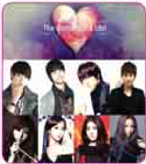
The Romantic & Idol

အမျိုးသမီးများအတွက်ရည်ရွယ်သော ချစ်ခြေရေး၊ အလှအပရေးရာ ဝေးသွားအစီအစဉ်၊ ဆန်းသစ်သော ဂီမ်းအစီအစဉ်၊ ဟင်းချက်ကဏ္ဍ အစရှိသော နိုင်ငံတကာအစီအစဉ်များကို မြန်မာစာတန်းထိုက်ဖြင့် ထုတ်လွှင့်ပေးမည့် HD ရုပ်သံလိုင်းသစ်အား 4TV HD Receiver တွင် ဝမ်းလျှင်ကြည့်ရှုနိုင်ပြီ ဖြစ်ပါသည်။