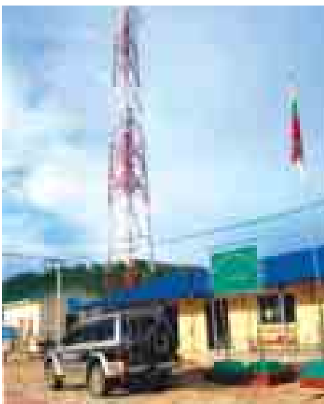
အချက်အလက် နည်းပညာဝန်ကြီးဌာနအနေဖြင့် ပြည်တွင်း ပြည်ပမှ အော်ပရေတာများကို လုပ်ကိုင်ခွင့်များပေးကာ သုံးစွဲ သူများအား ဝန်ဆောင်မှုပေးထားပြီဖြစ်သည်။

ဆက်သွယ်ရေးကဏ္ဍသည် ပြည်သူတို့၏ ပညာရေး၊ ကျန်း မာရေး၊ စီးပွားရေး၊ လူမှုရေး၊ အုပ်ချုပ်ရေး၊ လုံခြုံရေး စသည့် ကဏ္ဍစုံကို အထောက်အကူပြုစေပြီး ကျေးလက်နှင့် မြို့ပြ ကွာဟမှု လျှော့ချရေးတို့အတွက် တစ်နိုင်လုံး ဆက်သွယ်ရေး ကွန်ရက်များ ဖြန့်ကြက်နိုင်ရန် ဆက်သွယ်ရေးနှင့် သတင်း