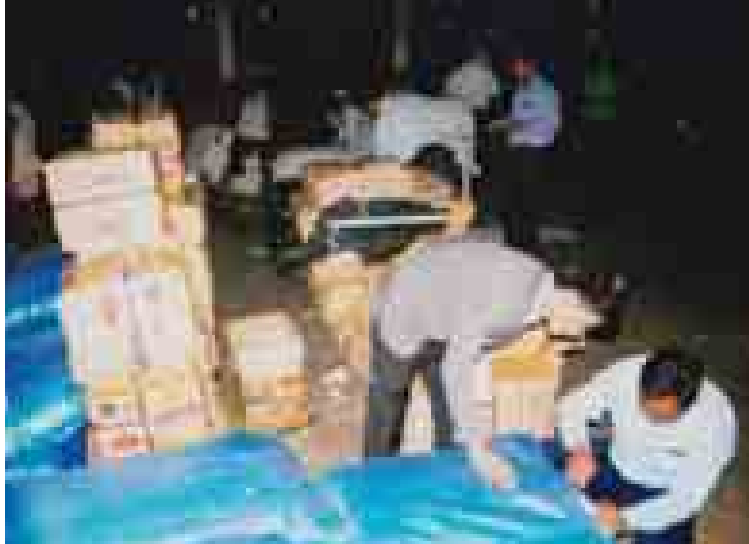
များကိုလည်း အကောက်ခွန်အမှုတွဲဖွင့် လှစ်ခြင်း၊ အကောက်ခွန်ဦးစီးဌာနသို့ လွှဲပြောင်းအပ်နှံခြင်းနှင့် တရားမဝင်ကုန်သွယ်မှု လုပ်ထုံးလုပ်နည်းများနှင့်အညီ ဆက်လက် ဆောင်ရွက်သွားမည်ဖြစ်ကြောင်း သိရသည်။ ကျော်ဆန်းမြင့် (မြန်/ဆက်)

ထို့ကြောင့် ၄-ကက (လရ-ရထား)/ ၂၀၁၅(၀၀၁)ဖြင့် အမှုတွဲ ဖွင့်လှစ်ခဲ့ပြီး ရန်ကုန်မြို့ အကောက်ခွန်ဦးစီးဌာန သို့လှောင်ရုံသို့ လွှဲပြောင်းအပ်နှံခဲ့ပြီး တန်ဖိုး မသင့်နိုင်သေးသည့် တရားမဝင် ကုန်ပစ္စည်း