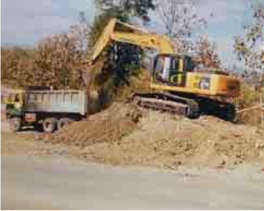
ရာသီကျောက်ထုမြို့ အုပ်ချုပ်ရေးမှူး သည် ဇန်နဝါရီ ၁၄ ရက်က သွား သိရသည်။

ပခုက္ကူ - ကျောက်ထု - မင်းတပ် ကားလမ်း ကျောက်ထု - မင်းတပ် လမ်းပိုင်းလမ်းအဆင့်မြှင့်တင်ပြုပြင်