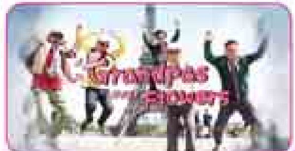
Grandpas Over Flowers

19 January (Tuesday) 7:00 PM အိမ်ထောင်ရေး၊ ချစ်ခြေရေး အကျဉ်းချုပ်၊ အိမ်ထောင်ရေး၊ ချစ်ခြေရေး အကျဉ်းချုပ်