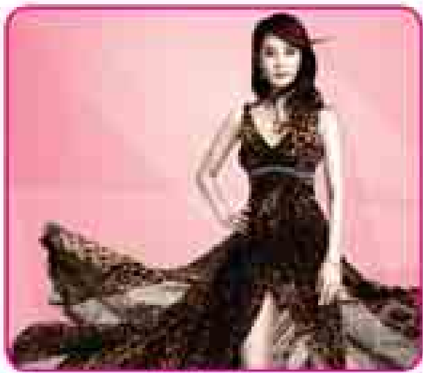
She is Wow!

18 January (Sunday) 8:30 PM အိမ်ထောင်ရေး၊ ချစ်ခြေရေး အကျဉ်းချုပ်၊ အိမ်ထောင်ရေး၊ ချစ်ခြေရေး အကျဉ်းချုပ်