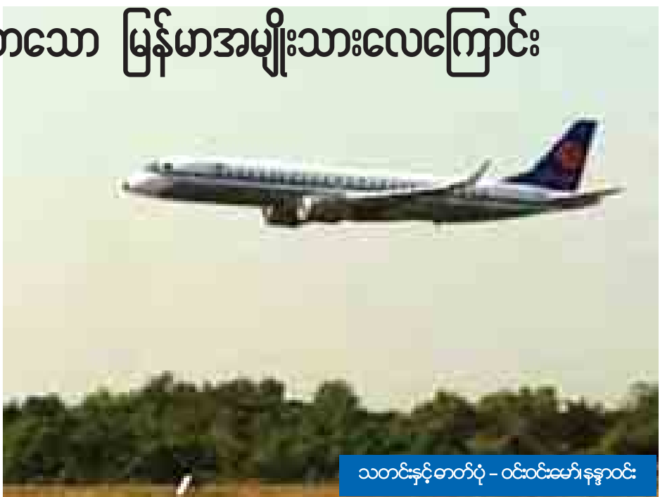
သတင်းနှင့်တက်ပုံ - ဝင်းဝင်းမော်နုနာဝင်း

ပထမဆုံး ကိုယ်ပိုင်ဘတ်ဂျက်ဖြင့် ရပ်တည်နေသည့်