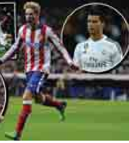
ပွဲစဉ်တွင် ဘာစီလိုနာအသင်းက နှစ်ကျောပေါင်းရလဒ် ကိုးဂိုး-ဂိုးမရှိဖြင့် အနိုင်ရရှိခဲ့ပြီး ကွာတားဖိုင်နယ်အဆင့်သို့ တက်လှမ်းနိုင်ခဲ့ပြီဖြစ်သည်။ ထို့ကြောင့် ဘာစီလိုနာအနေဖြင့် အက်သလက်တီကိုမက်ဒရစ်အသင်းနှင့် ကွာတားဖိုင်နယ်အဆင့်တွင် ထိပ်တိုက်ရင်ဆိုင်ရမည်ဖြစ်သည်။

စီရိုနယ်လ်ဒို၏ ရီးယဲလ်မက်ဒရစ် အသင်းကို နှစ်ဂိုးသွင်းယူပေးနိုင်ခဲ့ခြင်းကြောင့် ၂၀၁၅ ခုနှစ်၏ တစ်နှစ်တာကမ္ဘာ့အကောင်းဆုံး ကစားသမားဆုကို ရယူဆွတ်ခူးနိုင်မည့် ကစားသမားအဖြစ် ထင်ကြေးပေးမှုများလည်း ရှိလာခဲ့သည်။ တောရက်စ်သည် ၂၀၀၁ မှ ၂၀၀၇ ခုနှစ်အထိ အက်သလက်တီကိုမက်ဒရစ် အသင်းတွင် ကစားခဲ့ရာ၌ ရီးယဲလ်မက်ဒရစ်အသင်းနှင့် ဘာနေဗျူးကွင်း၌ ဆုံတွေ့ခဲ့ရာတွင် သွင်းဂိုးတစ်ဂိုးမျှ မသွင်းယူနိုင်ခဲ့ဘဲ အငှားစာချုပ်ဖြင့် ပြန်လည်ရောက်ရှိလာသည့် ယခုနှစ်တွင်မူ ရီးယဲလ်မက်ဒရစ်၏ ဘာနေဗျူးကွင်းထဲတွင် နှစ်ဂိုးသွင်းယူကာ အက်သလက်တီကိုမက်ဒရစ်အသင်း၏ ကွာတားဖိုင်နယ်အဆင့်တက်လှမ်းရေးကို အကောင်းဆုံးပုံဖော်ပေးနိုင်ခဲ့သည်။ အခြားစပိန်ကိုပါဒယ်ရေးဖလား(၁၆)သင်းအဆင့် ပွဲစဉ်တစ်ပွဲဖြစ်သည့် ဘာစီလိုနာအသင်းနှင့် အဲချီအသင်းတို့၏