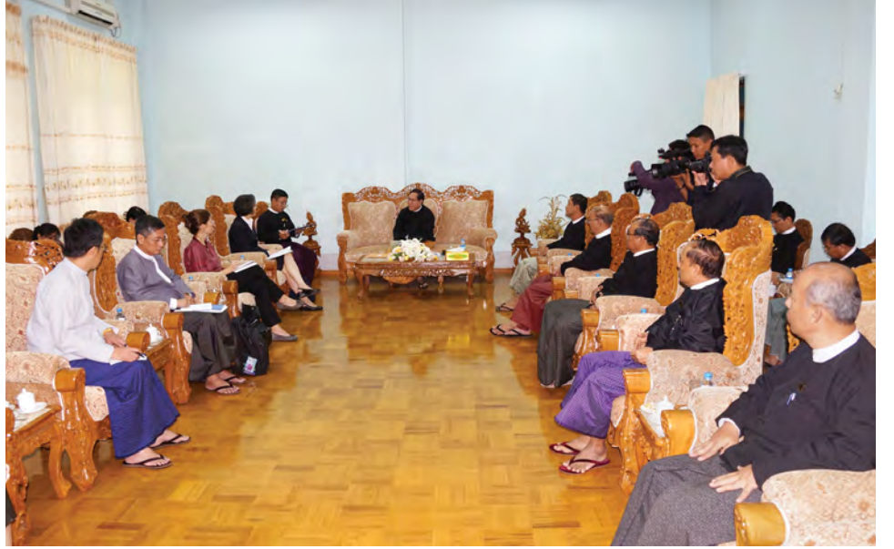
တရားစီရင်ရေးအတွက် ဆောင်ရွက်မှုများ၊ အကျဉ်းထောင်၊ အကျဉ်းစခန်းနှင့် ရဲတပ်ဖွဲ့အချုပ်စခန်းများအား ပြည်ထောင်စုတရားလွှတ်တော်ချုပ်၊ တရားလွှတ်တော်နှင့် ခရိုင်တရားရုံးတရားသူကြီးများက သွားရောက်စစ်ဆေးခြင်းအပါအဝင် တရားစီရင်ရေးကိစ္စရပ်များကို ဆွေးနွေးကြသည်။ အဆိုပါတွေ့ဆုံပွဲသို့ ပြည်ထောင်စုတရားသူကြီးချုပ် (သတင်းစဉ်)

ထို့နောက် ပြည်ထောင်စုတရားလွှတ်တော်ချုပ်၏ စာချွန်တော်အမိန့်ဆိုင်ရာ ဆောင်ရွက်မှုများ၊ လွတ်လပ်စွာ