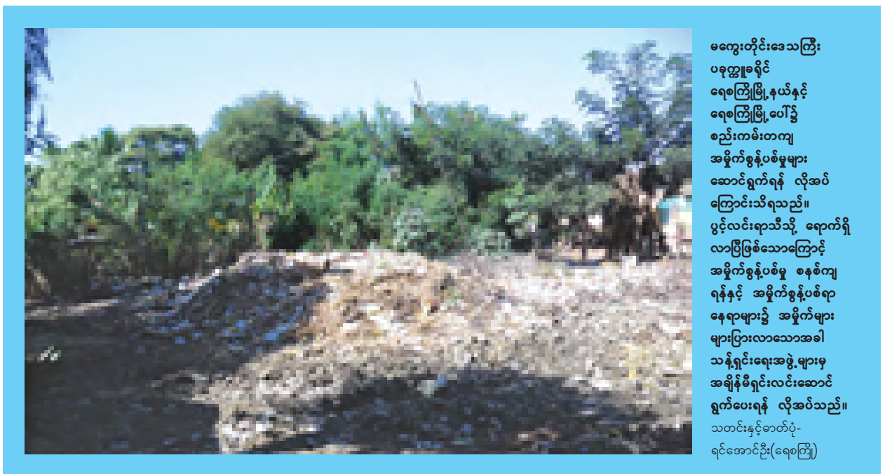
မကွေးတိုင်းဒေသကြီး ပခုက္ကူခရိုင် ရေစကြိုမြို့နယ်နှင့် ရေစကြိုမြို့ပေါ်၌ စည်းကမ်းတကျ အမှိုက်စွန့်ပစ်မှုများ ဆောင်ရွက်ရန် လိုအပ်ကြောင်း သိရသည်။ ပွင့်လင်းရာသီသို့ ရောက်ရှိလာပြီဖြစ်သောကြောင့် အမှိုက်စွန့်ပစ်မှု စနစ်ကျ ရန်နှင့် အမှိုက်စွန့်ပစ်ရာ နေရာများ၌ အမှိုက်များ များပြားလာသောအခါ သန့်ရှင်းရေးအဖွဲ့များမှ အချိန်မီရှင်းလင်းဆောင်ရွက်ပေးရန် လိုအပ်သည်။