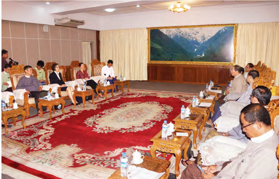
ပုဂ္ဂိုလ်များနှင့် လည်းကောင်း၊ (အပေါ်ပုံ) မွန်းလွဲ ၁ နာရီတွင် ပြည်သူ့လွှတ်တော်ရေးရာဆောင် I-1 ၌ဖွဲ့စည်းပုံအခြေခံဥပဒေ ပြင်ဆင်နိုင်ရေးအကောင်အထည်ဖော်မှုကော်မတီ အတွင်းရေးမှူးနှင့် ကော်မတီဝင်များအားလည်းကောင်း၊ ညနေ ၅ နာရီတွင် ပြည်သူ့လွှတ်တော်တရားဥပဒေစိုးမိုးရေးနှင့် တည်ငြိမ်အေးချမ်းရေး ကော်မတီဥက္ကဋ္ဌနှင့် လည်းကောင်းတွေ့ဆုံခဲ့ကြောင်း သိရသည်။ (ကြေးမုံ)

ကုလသမဂ္ဂ၏ မြန်မာနိုင်ငံလူ့အခွင့်အရေးအခြေအနေဆိုင်ရာ အထူးအစီရင်ခံစာတင်သွင်းသူ မစ္စ ရန်ဟီလီသည် ယနေ့နံနက် ၉ နာရီတွင် အမျိုးသားလွှတ်တော်ရေးရာဆောင် I-20 ၌ အမျိုးသားလွှတ်တော် ဥပဒေကြမ်းကော်မတီဥက္ကဋ္ဌနှင့် ရေးရာကော်မတီဥက္ကဋ္ဌများ၊ ဥပဒေကြမ်းကော်မတီများနှင့် လည်းကောင်း၊ နံနက် ၁၀ နာရီတွင် ပြည်သူ့လွှတ်တော်ရေးရာဆောင် I-1 ၌ ပြည်သူ့လွှတ်တော် ဥပဒေကြမ်းကော်မတီဥက္ကဋ္ဌ၊ အတွင်းရေးမှူးနှင့် အဖွဲ့ဝင်များ၊ ဥပဒေရေးရာအထူးကိစ္စရပ်များ လေ့လာဆန်းစစ်သုံးသပ်ရေးကော်မရှင်၊ လယ်ယာမြေနှင့် အခြားမြေများ သိမ်းဆည်းခံရမှုစစ်ဆေးရေးကော်မရှင်တို့မှ တာဝန်ရှိသူများနှင့်လည်းကောင်း နံနက် ၁၁ နာရီတွင် ရုံးအမှတ်(၁၈)နိုင်ငံတော်သမ္မတရုံး၌ နိုင်ငံတော်သမ္မတ၏ ဥပဒေ၊ နိုင်ငံရေးနှင့်စီးပွားရေးအကြံပေး