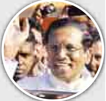
ပီတီအိုင်၊ အတိုက်အခံ သမ္မတလောင်း ဖီသရီပါလာ သီရိဆေနာ။

ရာဇပဝန်ဆေးသည် တတိယမြောက် ရာထူးသက်တမ်းအဖြစ် ဆက်လက်တာဝန် ထမ်းဆောင်ခွင့်ရရှိရန် မဲဆွယ်စည်းရုံးခဲ့သည်။ သီရိလင်္ကာနိုင်ငံတွင် အဂတိလိုက်စားမှု ကင်းဝေးရေးနှင့် အမျိုးသားပြန်လည်သင့်မြတ်မှုရရှိရေးတို့အတွက် မိမိကြိုးပမ်းဆောင် ရွက်မည်ဟု အတိုက်အခံ သမ္မတလောင်းက တတိယပြောသည်။ ရွေးကောက်ပွဲအကြို ပြည်သူ့သဘောထား စစ်တမ်းများအရ အကြိတ်အနယ် ယှဉ်ပြိုင်ရ မည့်ရွေးကောက်ပွဲအဖြစ် ရှုမြင်ရကြောင်း သတင်းထွက်ဖော်ပြသည်။ နိုင်ငံတစ်ဝန်း၌ မဲရုံပေါင်း ၂၀၀၀ ကျော် ဖွင့်လှစ်ထားပြီး ဒေသစံတော်ချိန် နံနက် ၇ နာရီမှ ညနေ ၄ နာရီအထိ ပြည်သူများ မဲပေးနိုင်သည်။ မဲပေးခွင့်ရှိသူ ပြည်သူ ၁၅ သန်းရှိပြီး ရွေးကောက်ပွဲရလဒ်ကို ဇန်နဝါရီ ၉ ရက် အစော ပိုင်းတွင် ထုတ်ပြန်ကြေညာနိုင်မည်ဟု မျှော်လင့်ရသည်။