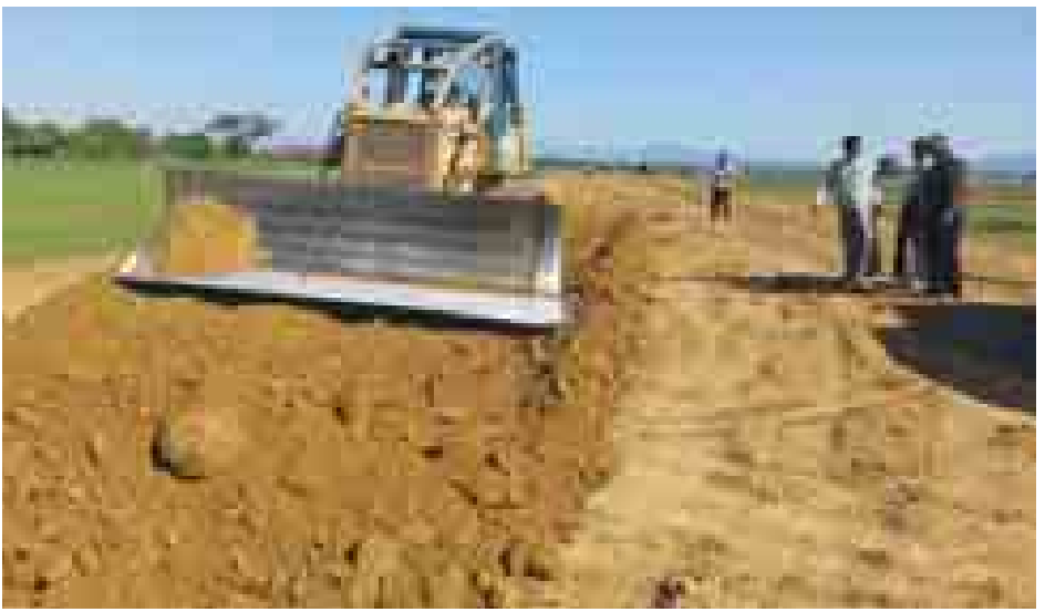
ဝန်းသို လုပ်ဆောင်မှုကိုလည်းကောင်း၊ မိုင်တိုင် ၅/၀-၁၈/၀ တွင်အမာခံလမ်း မှုအခြေအနေများကိုလည်းကောင်း မိုင်တိုင် ၃၂/၅-၃၅/၅ အတွင်း ခင်းခြင်းလုပ်ငန်းကိုလည်းကောင်း၊ သွားရောက်စစ်ဆေးခဲ့ကြောင်း သိရ ကျောက်ခင်းခြင်းကိုလည်းကောင်း၊ မဲဇာချောင်းကူးတံတားတည်ဆောက် သည်။