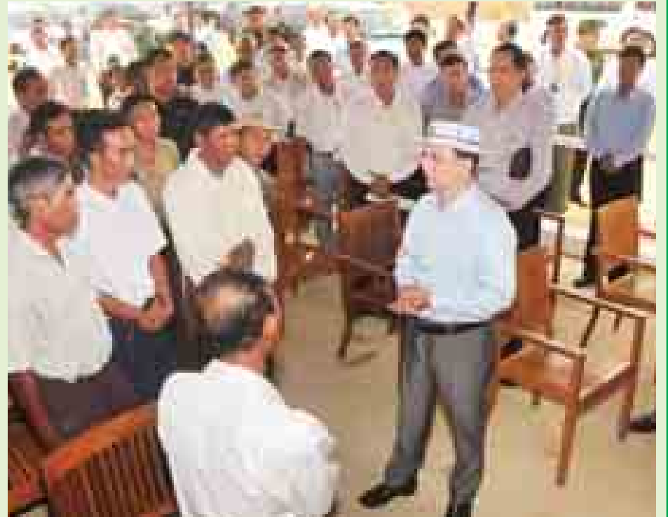
နိုင်ငံတော်သမ္မတ ဦးသိန်းစိန် အုတ်တွင်းမြို့နယ်ရှိ ခပေါင်းဆည်ရေသောက် ရေလှုံ့ကျေးရွာမှ အဆင့်မြင့်စက်မှုလယ်ယာ ၁၀၃ ဧက ဖော်ထုတ်ခြင်းလုပ်ငန်းကို ကြည့်ရှုစစ်ဆေးစဉ်။(အောက်ပုံ) နှင့် တက်ရောက်လာသည့်တောင်သူများအား ရင်းရင်းနှီးနှီးနှုတ်ဆက်စဉ်။(အပေါ်ပုံ)