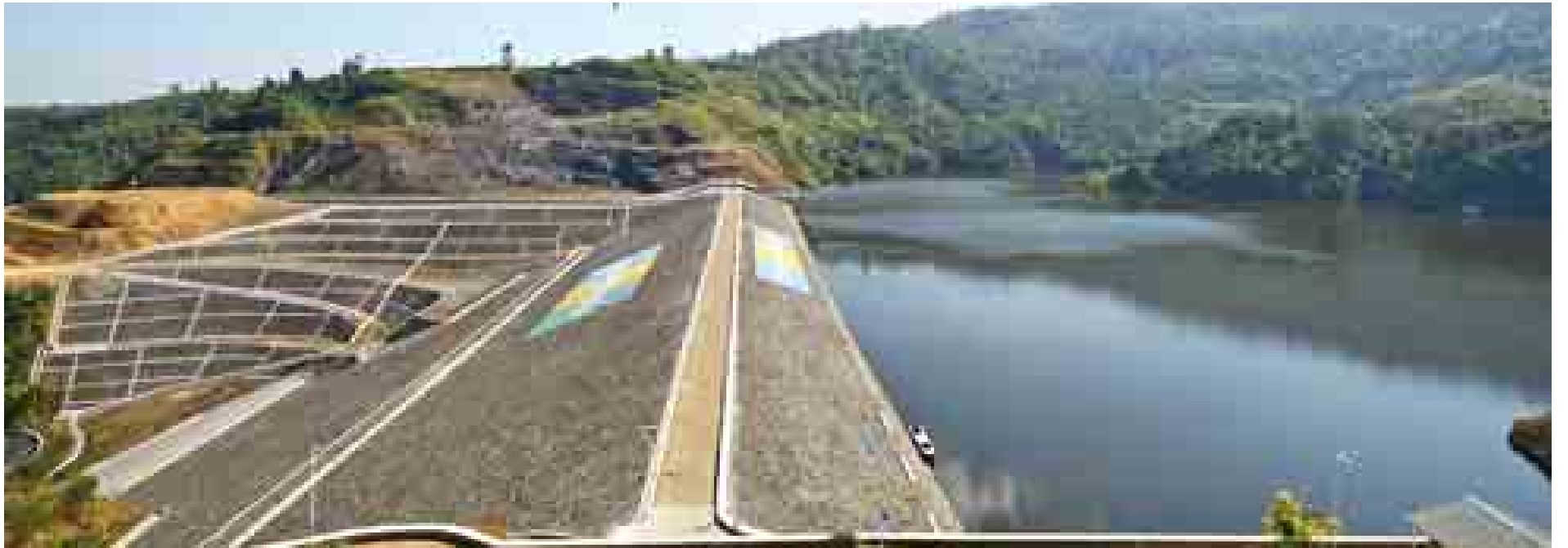
ဖြူးချောင်းရေလှောင်တံဆဲခံကို တွေ့ရစဉ်။

ဆက်လက်၍ သမဝါယမဝန်ကြီးဌာန ပြည်ထောင်စုဝန်ကြီး ဦးကျော်ဆန်းက တောင်သူလယ်သမားများ စိုက်ပျိုးထုတ်လုပ်မှုကဏ္ဍတိုးတက်မြှင့်တင်ရေး၊ လယ်ယာကဏ္ဍဖွံ့ဖြိုးတိုးတက်ရေးတို့အတွက် သမဝါယမဝန်ကြီးဌာနအနေဖြင့် လယ်ယာသုံးစက်ပစ္စည်းများ အရစ်ကျချေးငွေစနစ်ဖြင့် ရောင်းချပေးနေမှုနှင့် ဆက်လက်ဆောင်ရွက်ပေးသွားမည့် စာမျက်နှာ ၃ ကော်လံ ၁ သို့