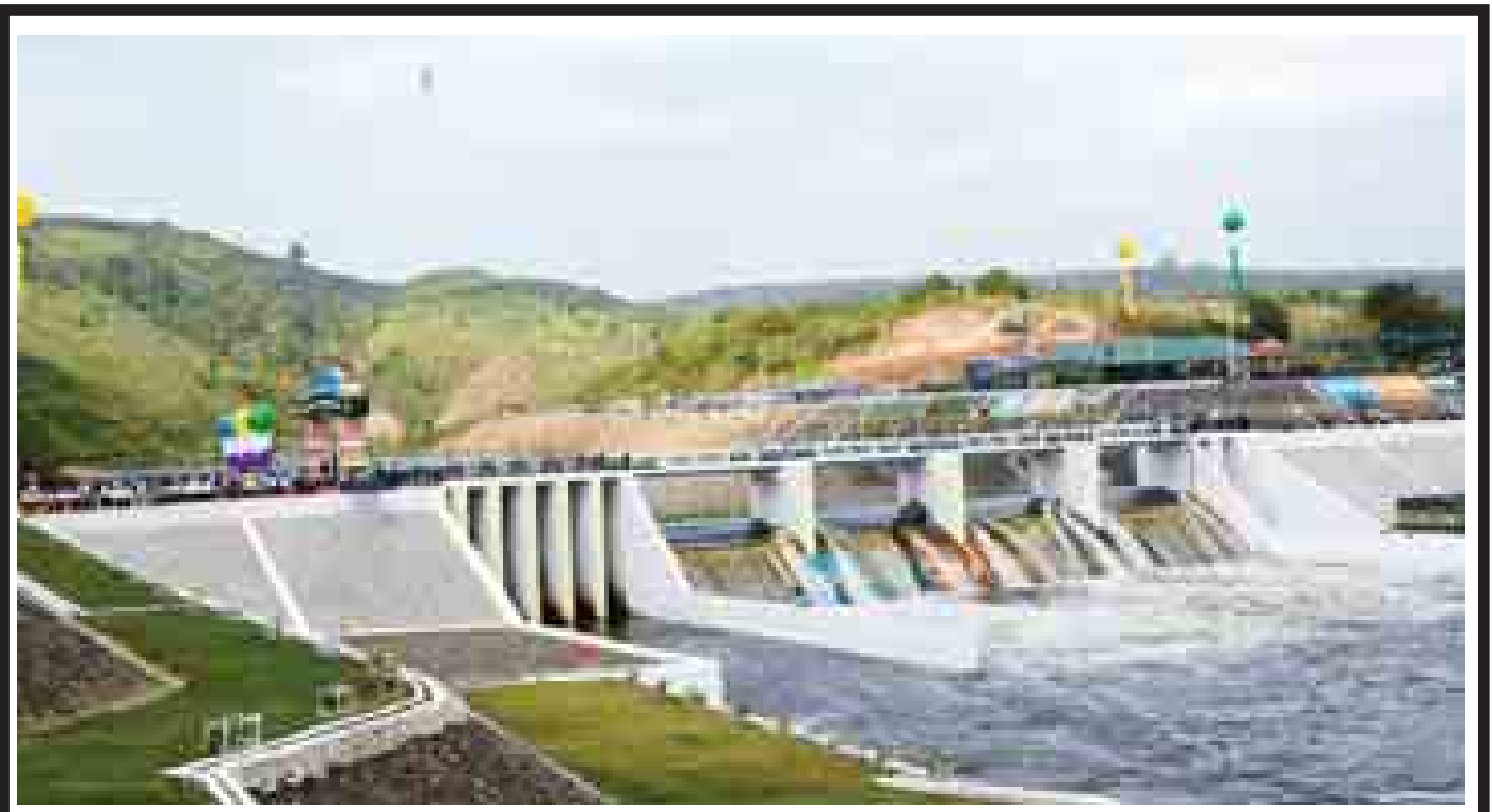
ပဲခူးတိုင်းဒေသကြီး မြူးမြို့နယ်ရှိ မြူးချောင်းရေလှောင်တံဆံ့နှင့် ရေလွှဲသည်ကို တွေ့ရစဉ်။ (သတင်း-ရှေ့ဖို့)(ဓာတ်ပုံ - အေဝမ်းစိုး)

စတီပင်ဂျာရတ် အယ်လ်အေဂလက်ဆီသို့ ပြောင်းရွှေ့ကစားမည် စာမျက်နှာ - ၁၃