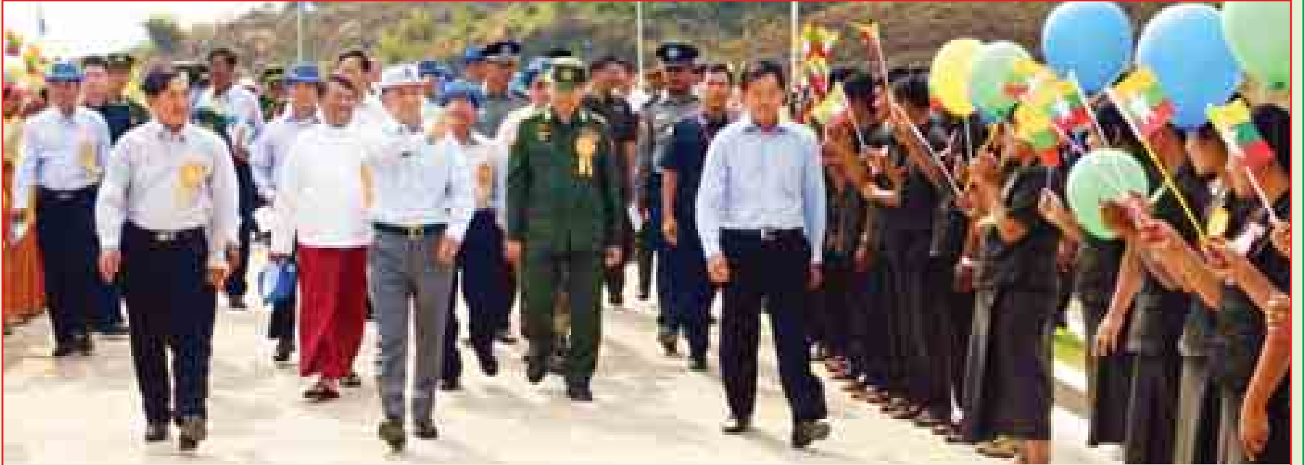
နိုင်ငံတော်သမ္မတ ဦးသိန်းစိန် ဖြူးချောင်းရေလှောင်တံနှင့် ရေလွှဲဆည်ဖွင့်ပွဲအခမ်းအနားသို့ တက်ရောက်လာသူများအား ရင်းရင်းနှီးနှီးနှုတ်ဆက်စဉ်။