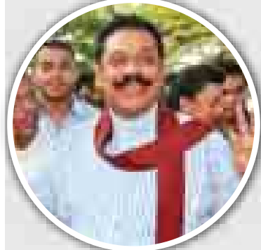
သီရိလင်္ကာနိုင်ငံသမ္မတ မဟိန္ဒြာ ရာဇပဝန်ဆေး။

ကိုလံဘို ဇန်နဝါရီ ၈ သီရိလင်္ကာနိုင်ငံ၌ ဆယ်စုနှစ်ပေါင်းအတန်ကြာကာလအတွင်း အကြိတ်အနယ်ယှဉ်ပြိုင်ရဆုံး ရွေးကောက်ပွဲအဖြစ် သမ္မတရွေးကောက်ပွဲကို ဇန်နဝါရီ ၈ ရက်က ကျင်းပသည်။ ရွေးကောက်ပွဲတွင် လက်ရှိသမ္မတ မဟိန္ဒြာ ရာဇပဝန်ဆေးနှင့် အတိုက်အခံ သမ္မတလောင်း ဖီသရီပါလာ သီရိဆေနာတို့ အကြိတ်အနယ် ယှဉ်ပြိုင်လျက်ရှိကြသည်။