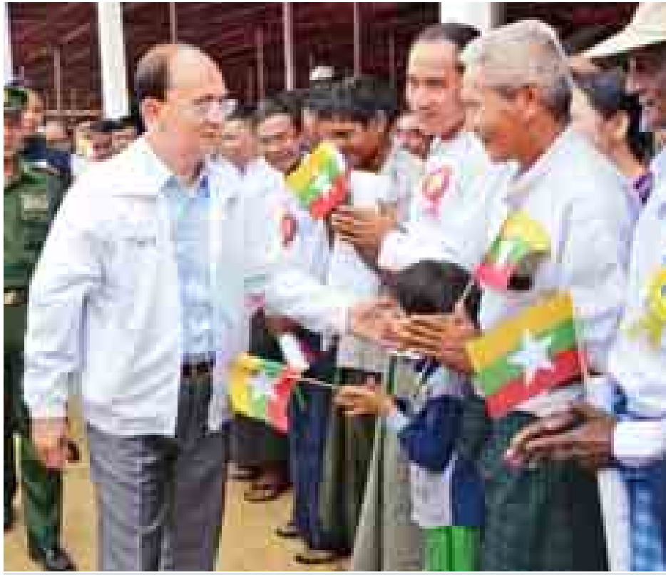
နိုင်ငံတော်သမ္မတ ဦးသိန်းစိန် ဖြူးချောင်းရေလှောင်တံဆဲခံနှင့် ရေလွှဲဆည်ဖွင့်ပွဲအခမ်းအနားသို့ တက်ရောက်လာသူများအား ရင်းရင်းနှီးနှီးနှုတ်ဆက်စဉ်။ (သတင်းစဉ်)

လက်မှုလယ်ယာစိုက်ပျိုးရေးစနစ်မှ ပိုမိုထုတ်လုပ်နိုင်ရန် စက်မှုလယ်ယာစိုက်ပျိုးရေးစနစ်သို့ ကူးပြောင်းကြရမည်