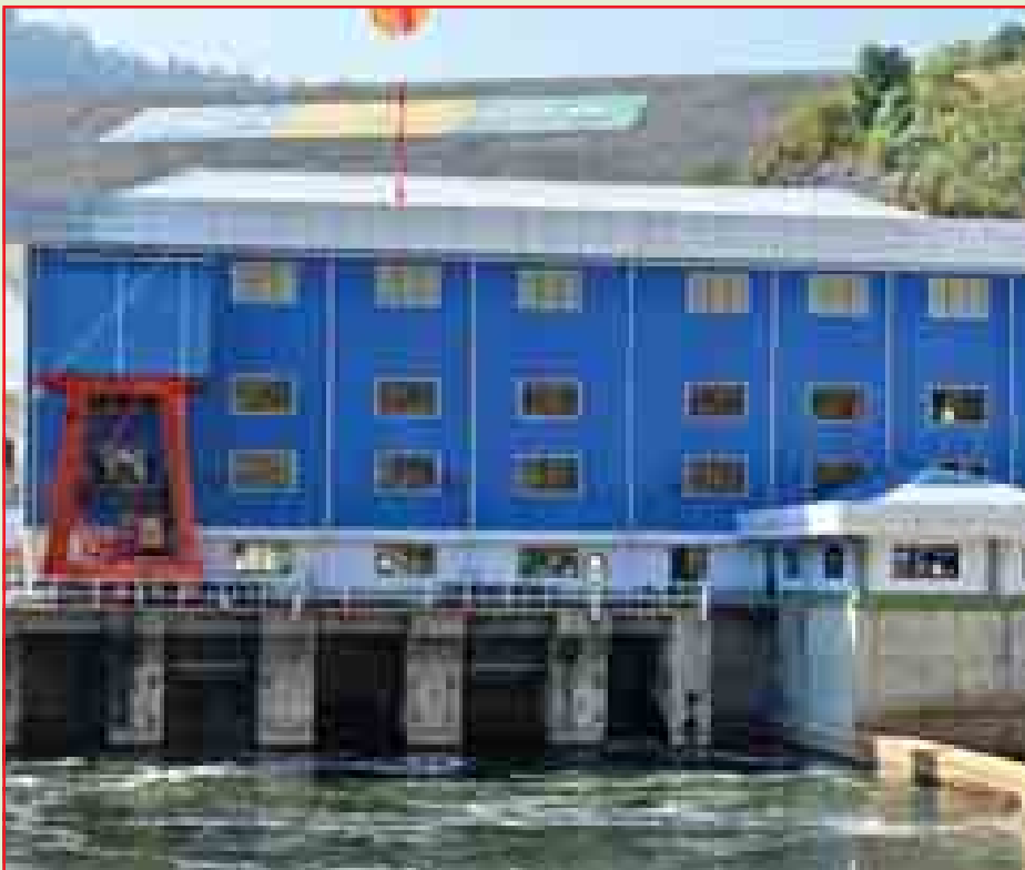
ဖြူးချောင်းရေအားလျှပ်စစ်ဓာတ်အားပေးစက်ရုံနှင့် ဖြူးချောင်းရေလှောင်တံတို့အား တွေ့ရှိစဉ်။