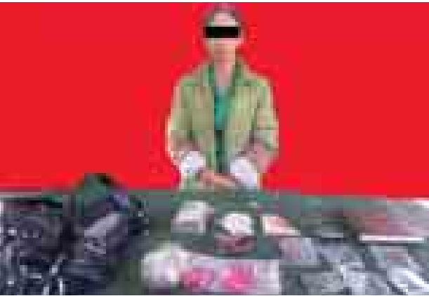
မချိန်ငွေချမ်းအား သိမ်းဆည်းရမိ မူးယစ်ဆေးဝါးများနှင့်အတူ တွေ့ရစဉ်။