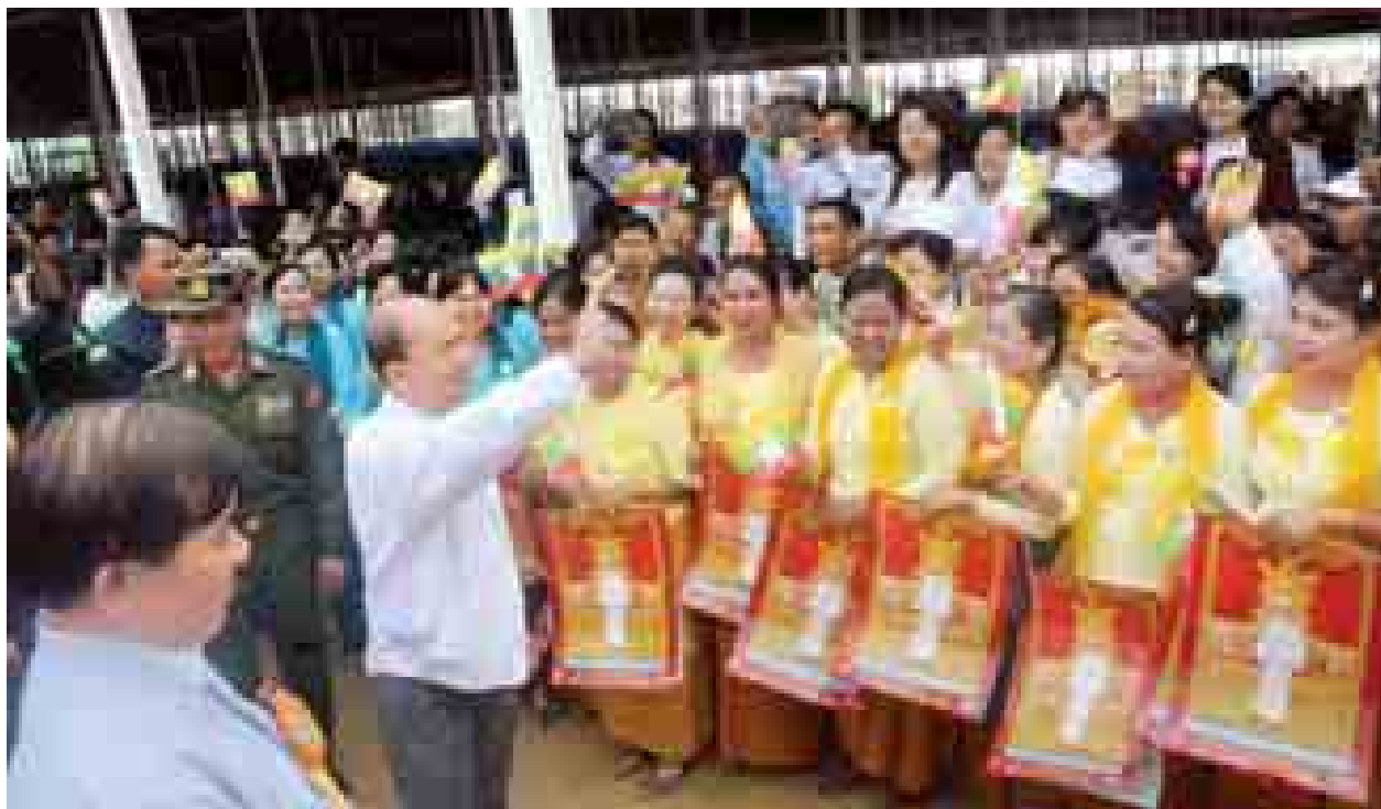
နိုင်ငံတော်သမ္မတ ဦးသိန်းစိန် ဖြူချောင်းရေလှောင်တံခံနှင့် ရေလွှဲ ဆည်ဖွင့်ပွဲ အခမ်းအနားသို့ တက်ရောက်လာသူများအား ရင်းရင်းနှီးနှီး နှုတ်ဆက်စဉ်။ (သတင်းစဉ်)

◆ ရှေ့ဖုံးမှ အခြေအနေများကိုလည်းကောင်း၊ တိုင်းဒေသကြီးဝန်ကြီးချုပ် ဦးညက်ဝင်းက တိုင်းဒေသကြီးအစိုးရအဖွဲ့အနေဖြင့် ဒေသတွင်းရှိ တောင်သူများအတွက် လယ်ယာစိုက်ပျိုးရေးကဏ္ဍဖွံ့ဖြိုးတိုးတက်ရေး၊ စိုက်ပျိုးရေးရရှိရေး၊ လယ်ယာမြေများ ရေကြီးနစ်မြုပ်မှုလျော့ပါးစေရေးအတွက် ဆောင်ရွက်ပေး နေမှုအခြေအနေများကိုလည်းကောင်း ရှင်းလင်းတင်ပြကြသည်။