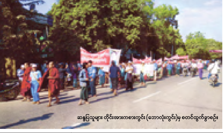
ဆန္ဒပြသူများ တိုင်းအားကစားကွင်း (ဘောလုံးကွင်း)မှ စတင်ထွက်ခွာစဉ်။

ခုနှစ်တွင် CSR ရန်ပုံငွေမှ အမေရိကန်ဒေါ်လာ တစ်သန်း အကုန်အကျခံ ဆောင်ရွက်ပေးလျက်ရှိကြောင်း၊ ဒေသခံ ၁၉၉၄ ဦးကို စီမံကိန်းလုပ်ငန်းခွင်များတွင် အလုပ်ခန့်ထားပေးပြီးဖြစ်သည့်အပြင် ထပ်မံအလုပ်အကိုင်ရရှိရေးအတွက်လည်း စီစဉ်ဆောင်ရွက်လျက်ရှိကြောင်း၊ ထုတ်လုပ်မှုကာလမရောက်မီ အလုပ်အကိုင်စောင့်ဆိုင်းဆဲကာလတွင် ထောက်ပံ့ကြေး (Discount Salary) ကို မြေယာဆုံးရှုံးမှုပမာဏအပေါ် မူတည်ပြီး လယ်/ယာမြေတစ်ဧကမှ ၁၀ ဧကအထိ တစ်လလျှင် အမေရိကန်ဒေါ်လာ ၇၀၊ လယ်/ယာမြေ ၁၁ ဧကမှ ၈၀ အထိ တစ်လလျှင် အမေရိကန်ဒေါ်လာ ၁၂၀ နှင့် လယ်/ယာမြေ ၈၀ အထက် တစ်လလျှင် အမေရိကန်ဒေါ်လာ ၁၆၀ နှုန်းထားဖြင့် ခြောက်လတစ်ကြိမ် ကြိုတင်ထုတ်ပေးစနစ်ဖြင့် ဆောင်ရွက်ပေးလျက်ရှိရာ ဒေသခံများစုမှာ အကျိုးခံစားရရှိနေပြီ ဖြစ်ကြောင်း သိရှိရသည်။ (သတင်းစဉ်)