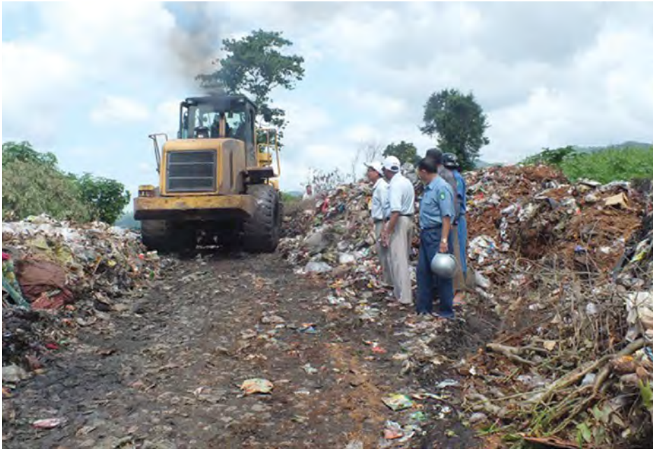
သောအမှိုက်များကို မြို့နယ်စည်ပင်သာယာရေးဌာနပိုင် အမှိုက်သိမ်းယာဉ်သုံးစီးဖြင့် နေ့စဉ်လိုက်လံသိမ်းဆည်းခဲ့သည်။

သီပေါ၊ ဇန်နဝါရီ ၇ သီပေါမြို့၏ နိုင်ငံခြားသားဧည့်သည်များ သွားရောက်လည်ပတ်ရာ တစ်ခုဖြစ်သော နမ့်တုတ်သဘာဝရေတံခွန်သို့ သွားရာလမ်းရှိ အမှိုက်ပုံကြီးများကို သီပေါမြို့နယ်စည်ပင်သာယာကော်မတီနှင့် စည်ပင်သာယာရေးဌာနတို့မှ စက်ယန္တရားကြီးများအကူအညီရယူပြီး ဖယ်ရှားရှင်းလင်းနေကြောင်း သိရသည်။