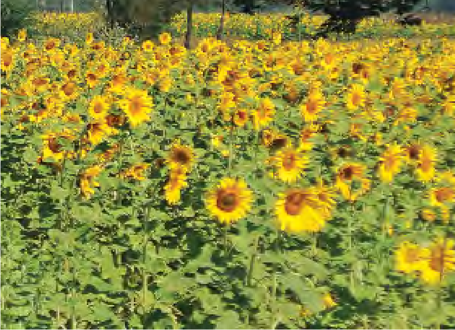
ကျေးရွာနှင့်ပန်းသွင်း၊ ရွာသစ်၊ ကြာ ကုန်းများအပြင် အိုင်ကြီးလည်း၊ ကုက္ကို ကုန်း၊ ငွေ့ချို၊ မုန်တိုင်း၊ ရေဝေ၊ ဇရပ် ကုန်း၊ လောင်ကုန်း၊ လောင်ဇောက်၊ အဖြစ် စိုက်ပျိုးလေ့ရှိကြောင်း သိရ သည်။

မိတ္ထီလာတွင်နေကြာကို ကွက်ငယ် ကျေးရွာအုပ်စုအတွင်းရှိ ဒဟတ္တန်း