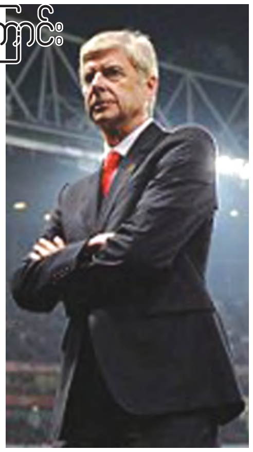
ထို့သို့ တိုက်စစ်မှူးများကို ရောင်းချခြင်း၊ အငှားချခြင်းများကို ပြုလုပ်ရန် စီစဉ်ထားသော်လည်း နောက်တန်း ခံစစ်ကြောင်းအတွက် စီနီအက်စ်တီယန်နောက်တန်းကစားသမား လွိုက်ပါရင်အား ယခုဇန်နဝါရီဈေးကွက်တွင် ခေါ်ယူသွားမည်ဖြစ်ကြောင်း နည်းပြ အာစင်ဝင်းဂါးက ထုတ်ဖော်ပြောကြားခဲ့သည်။

အာဆင်နယ်အသင်းသည် ဒဏ်ရာရကစားသမားအများအပြားရှိနေခြင်းကြောင့် ရလဒ်များဆိုးရွားနေခဲ့သော်လည်း ဟားစီးတီးအသင်းနှင့်ပွဲစဉ်တွင် ဝဲလ်ကော့ ချက်ဖီစီနေရာတွင် ဒေးဗစ်အိုစပီနာအား အစားထိုးကစားစေခဲ့သည့်အပြင် အသင်း၏ တိုက်စစ်မှူးတစ်ဦးဖြစ်သည့် ပိုဒေါ့စကို အင်တာမီလန်အသင်းသို့ ရောင်းချခဲ့သည်။ ထို့ပြင် လူငယ်တိုက်စစ်မှူး ဆာနီဂိုကိုလည်း ပြိုင်ပွဲအတွေ့အကြုံများရရှိစေရန်အတွက် ယခုဇန်နဝါရီအပြောင်းအရွှေ့ကာလတွင် အငှားချရန် မျှော်လင့်ထားကြောင်း ဝင်းဂါးက ပြောကြားခဲ့သည်။