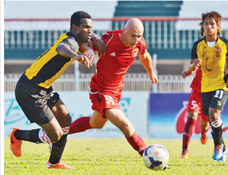
ဧရာဝတီနှင့် နေပြည်တော်တို့ ၂၀၁၄ ရာသီက တွေ့ဆုံခဲ့စဉ်။

၂၀၁၅ ရာသီ MNL အမှတ်ပေးဘောလုံးပြိုင်ပွဲကို ဇန်နဝါရီ ၁၀ ရက်မှစ၍ ကျင်းပတော့မည်ဖြစ်သည်။ ပြိုင်ပွဲကို အသင်း ၁၂ သင်း ဝင်ရောက်ယှဉ်ပြိုင်မည်ဖြစ်ပြီး အပတ်စဉ် စနေ၊ တနင်္ဂနွေနေ့များနှင့် အချို့အပတ်များတွင် သောကြာ၊ တနင်္လာနေ့များ၌ ကျင်းပသွားမည်ဖြစ်သည်။