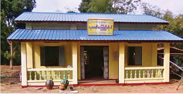
ဆောက်လုပ်ပြီး ဒီဇင်ဘာ ၃၁ ရက် တွင် ပြီးစီးကြောင်း သိရသည်။

အဖွဲ့ ဖြစ်သည်။ ယင်းစာကြည့်တိုက်ကို လယ်တီကျောင်းတိုက်ရှိ ဆရာတော် များ၊ တိုင်းဒေသကြီး အစိုးရအဖွဲ့နှင့် ပြည်သူများ ပူးပေါင်း၍ ဆောက်လုပ် လှူဒါန်းခဲ့ခြင်းဖြစ်ကြောင်း သိရ သည်။ ကြွေတိုက်ချောင်းကျေးရွာသည် မြို့နယ်အလယ်ပိုင်းဒေသဖြစ်၍ ဗဟုသုတမျိုးစုံတိုးပွားရန်လိုလားသူ အတတ်ပညာ၊ အသိပညာများရှာဖွေ လိုသော ရပ်ရွာအတွင်းရှိ ကျောင်း သား ကျောင်းသူများနှင့် စာတတ်သူ တိုင်း စာဖတ်နိုင်ရန် ရည်ရွယ်ပြီး ဖွင့် လှစ်ခဲ့ကြောင်း လယ်တီကျောင်းတိုက် ဆရာတော် ဥဇာသုဒ္ဓက ပြော သည်။ သတင်းနှင့် ဓာတ်ပုံ-အေးအေးမြင့်