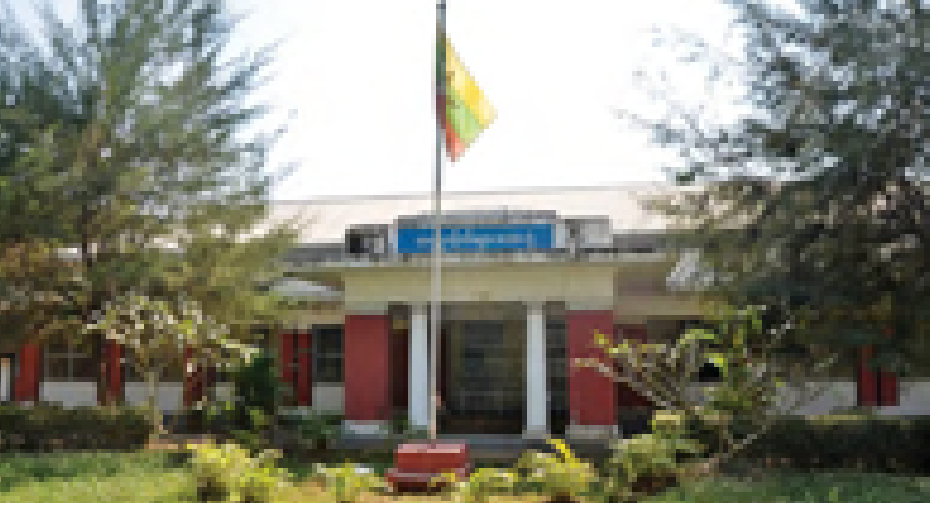
တက္ကသိုလ်များဆေးရုံ(ရန်ကုန်)။

အခုလို အဆင့်မြင့်တင်ပြီး စက် ပစ္စည်းကိရိယာ ပြည့်ပြည့်စုံစုံနဲ့ ကုသ ပေးနိုင်မယ်ဆိုရင် ကျောင်းသား ကျောင်း သူတွေ၊ ဝန်ထမ်းတွေ၊ ဒီအနီးနား ဝန်းကျင်က နေထိုင်သူတွေအတွက် အားကိုးရတဲ့ ဆေးရုံကြီးဖြစ်လာမှာ ပေါ့။ တက္ကသိုလ်တွေမှာ စာကြည့်တိုက် တွေ၊ recreation center တွေ ဓာတ်ခွဲ ခန်းတွေ၊ ဆွေးနွေးပွဲခန်းမတွေရှိဖို့ လိုသလို တက္ကသိုလ်စာတိုက်၊ တက္ကသိုလ် ဆေးရုံတွေလည်း ရှိဖို့လိုအပ်တယ်။ တက္ကသိုလ်များ ပုံနှိပ်တိုက်စတာတွေ ရှိဖို့လိုအပ်တယ်။ တက္ကသိုလ်ဆေးရုံဆိုတာ ကျောင်းသား ကျောင်းသူတွေအတွက် ရော ဝန်ထမ်းတွေအတွက်ပါ ပိုပြီး တော့ ဝန်ဆောင်မှုတွေပေးလာနိုင်မယ် ဆိုရင် အထောက်အကူပြုတဲ့ ဆေးရုံ ဖြစ်လာမှာပေါ့။ အဲဒီလိုဖြစ်လာဖို့ အတွက်တော့ တစ်ဆင့်ပြီးတစ်ဆင့် ကြိုးစားသွားရမှာပေါ့။