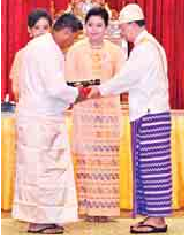
နိုင်ငံတော်သမ္မတ ဦးသိန်းစိန် သူရဘွဲ့ရရှိသူ ပြန်တမ်းဝင်အမှတ် ကြည်း-၅၉၅၁၆ ဗိုလ်သန့်ဇင်ဦး(ကျဆုံး)ကိုယ်စား ဖခင် ဦးကျော်ဌေးအား ဂုဏ်ထူးဆောင်ဘွဲ့ ချီးမြှင့်အပ်နှင်းစဉ်။ (သတင်းစဉ်)