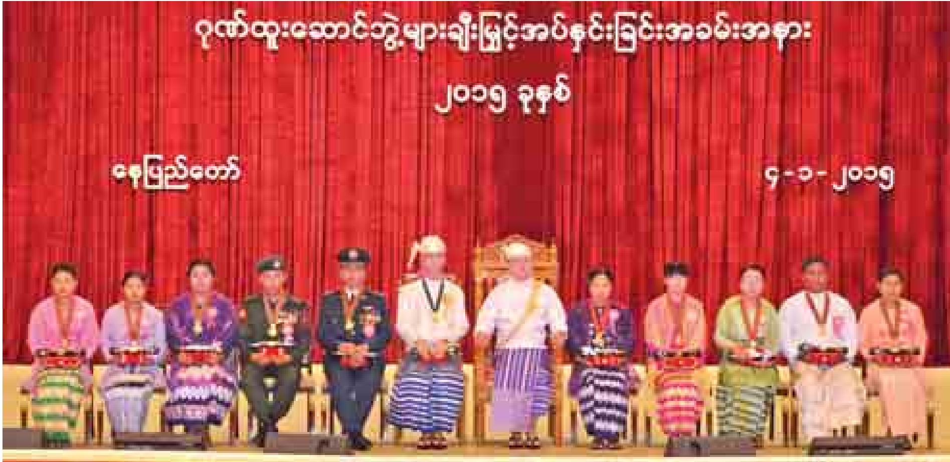
နိုင်ငံတော်သမ္မတ ဦးသိန်းစိန် သီဟသူရဘွဲ့ရရှိသူ ကိုယ်ပိုင်အမှတ်- ၈၉၉၁၂၈ တပ်ကြပ်အောင်သိမ်း(ကျဆုံး)ကိုယ်စား ဇနီးဒေါ်မိုးမိုးစံအား ဂုဏ်ထူးဆောင် ဘွဲ့ချီးမြှင့်အပ်နှင်းစဉ်။ (သတင်းစဉ်)