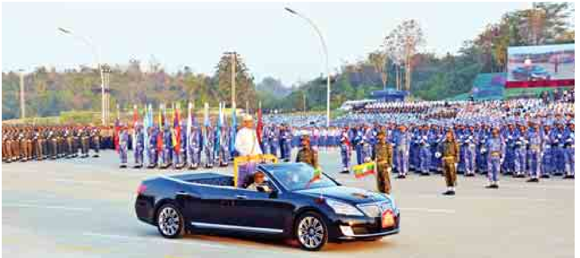
နိုင်ငံတော်သမ္မတ ဦးသိန်းစိန် (၆၇)နှစ်မြောက် လွတ်လပ်ရေးနေ့ ဗိုလ်ရှင်အခမ်းအနားတွင် စစ်ကြောင်းများအား မော်တော်ယာဉ်ဖြင့် စစ်ဆေးစဉ်။