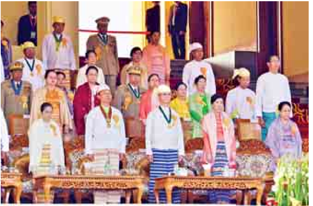
၂၀၁၅ ခုနှစ် (၆၇)နှစ်မြောက် လွတ်လပ်ရေးနေ့ နိုင်ငံတော်အလံတင်အခမ်းအနားနှင့် ဗိုလ်ရှင်အခမ်းအနားသို့ တက်ရောက်လာသူများအား တွေ့ရစဉ်။ (သတင်းစဉ်)

များ တက်ရောက်ကြသည်။ နံနက် ၄ နာရီ မိနစ် ၂၀ တွင် အလံတင်အခမ်းအနားကို ကျင်းပရာ ဂုဏ်ပြုတပ်ဖွဲ့က ပြည်ထောင်စုသမ္မတမြန်မာနိုင်ငံတော်အလံကို လွှင့်တင်ပြီး တိုင်းရင်းသား တိုင်းရင်းသူများက ဂုဏ်ပြုတပ်ဖွဲ့နှင့်အတူ နိုင်ငံတော်အလံကို အလေးပြုကြသည်။ နံနက် ၆ နာရီတွင် နိုင်ငံတော်သမ္မတအား အလေးပြုကြမည့် စစ်ကြောင်းများက ဗိုလ်ရှင်အခမ်းအနားကျင်းပမည့် ဥပစာသို့ ချီတက်နေရာယူကြသည်။ ထိုအချိန်တွင် ယဉ်ကျေးမှုဝန်ကြီးဌာန အနုပညာဦးစီးဌာနမှ တေးသံရှင်များက သမိုင်းတစ်ခေတ် ပြန်လည်ထင်ဟပ်စေမည့် ဇာတိသွေး၊ ဇာတိမာန် တက်ကြွဖွယ်တေးသီချင်းများဖြင့် သီဆိုဖျော်ဖြေကြသည်။ ထို့နောက် နိုင်ငံတော်သမ္မတက ဗိုလ်ရှင်အခမ်းအနားသို့ ရောက်ရှိလာပြီး ဂုဏ်ပြုတပ်ဖွဲ့နှင့် စစ်ကြောင်းများ၏ အလေးပြုခြင်းကို ခံယူသည်။ ယင်းနောက် နိုင်ငံတော်သမ္မတသည် စစ်ကြောင်းများအား မော်တော်ယာဉ်ဖြင့် စစ်ဆေးရာ အမြောက်စာမျက်နှာ ၉ ကော်လံ ၁ သို့*