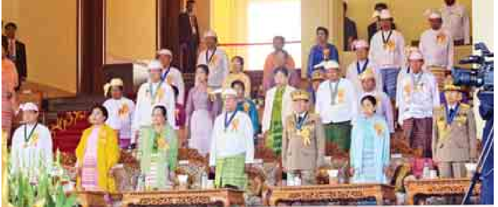
၂၀၁၅ ခုနှစ် (၆၇)နှစ်မြောက် လွတ်လပ်ရေးနေ့ နိုင်ငံတော်အလံတင်အခမ်းအနားနှင့် ဝိုင်းပန်းချုပ်သက်ပုံ တက်ရောက်လာကြသူများအား တွေ့ရစဉ်။ (သတင်းစဉ်)

လည်း Arrow Headခေါ် မြားဦးသဏ္ဍာန်အုပ်ဖွဲ့ပျံသန်းအလေးပြုခြင်း၊ ဘက်စုံသုံးတိုက်ခိုက်ရေး လေယာဉ်ငါးစင်းပါဝင်သည့် ရာဇာအုပ်ဖွဲ့က Arrow Head ခေါ် မြားဦးသဏ္ဍာန်အုပ်ဖွဲ့ပျံသန်းအလေးပြုခြင်း၊ ရဲမာန်အုပ်ဖွဲ့၊ ဂျက်တိုက်ခိုက်ရေးလေယာဉ်ငါးစင်းတို့က အရောင်စုံမီးခိုးများပစ်လွှတ်၍ Fan Break ခေါ် ယပ်တောင်ပုံစံခွဲထွက်၍ သရုပ်ပြပျံသန်း အလေးပြုခြင်းနှင့် ရာဇာအုပ်ဖွဲ့ ဘက်စုံသုံး တိုက်ခိုက်ရေးလေယာဉ်ငါးစင်းတို့က Flare ခေါ်