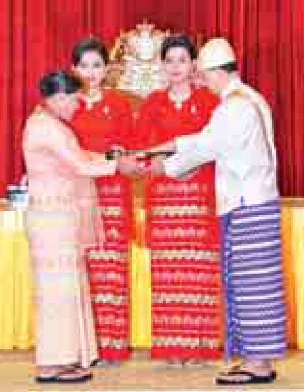
နိုင်ငံတော်သမ္မတ ဦးသိန်းစိန် သူရဘွဲ့ရရှိသူ ကိုယ်ပိုင်အမှတ်-၅၀၉၅၆၉ တပ်ကြပ်ကြီးသန်းနွဲ့(ကျဆုံး)ကိုယ်စား ဇနီး ဒေါ်ခင်စိန်အား ဂုဏ်ထူးဆောင် ဘွဲ့ ချီးမြှင့်အပ်နှင်းစဉ်။ (သတင်းစဉ်)