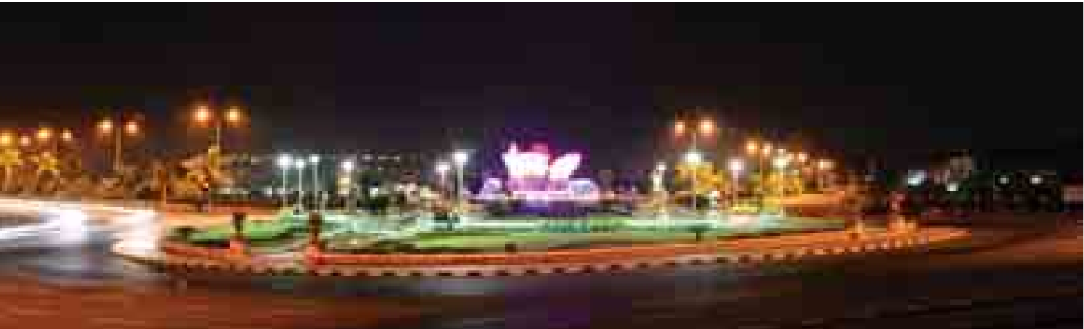
ဇန်နဝါရီ ၄ ရက် ညပိုင်းက (၆၇)နှစ်မြောက် လွတ်လပ်ရေး နေ့တွင် နေပြည်တော်ကောင်စီ နယ်မြေရှိ အင်ကြင်းပန်း အပိုင်၌ ရောင်စုံမီးများဖြင့် အလှဆင်ထားသည်ကို တွေ့ရ စဉ်။ (သတင်းစဉ်)