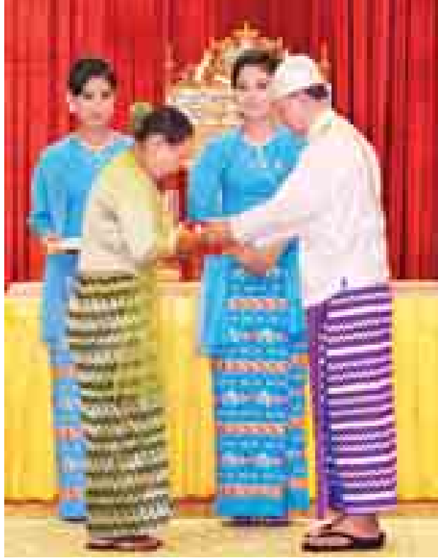
နိုင်ငံတော်သမ္မတ ဦးသိန်းစိန် သူရဘွဲ့ရရှိသူ ပြန်တမ်းဝင်အမှတ် ကြည်း-၅၇၉၇၉ ဗိုလ်ကျော်ဇေယျ(ကျဆုံး)ကိုယ်စား မိခင် ဒေါ်ခင်ဌေးဝင်းအား ဂုဏ်ထူးဆောင်ဘွဲ့ ချီးမြှင့်အပ်နှင်းစဉ်။ (သတင်းစဉ်)

အပ်နှင်းခဲ့သည့် ပြည်ထောင်စုစည်သူ သင်္ဂဟဘွဲ့ဖြစ်သော သရေစည်သူ ဘွဲ့ရရှိသူတစ်ဦး၊ ၂၀၁၃ ခုနှစ်တွင် သူရဘွဲ့ရရှိသူ သုံးဦး၊ ၂၀၁၄ ခုနှစ် တွင် သိဟသူရဘွဲ့ရရှိသူ တစ်ဦးနှင့်