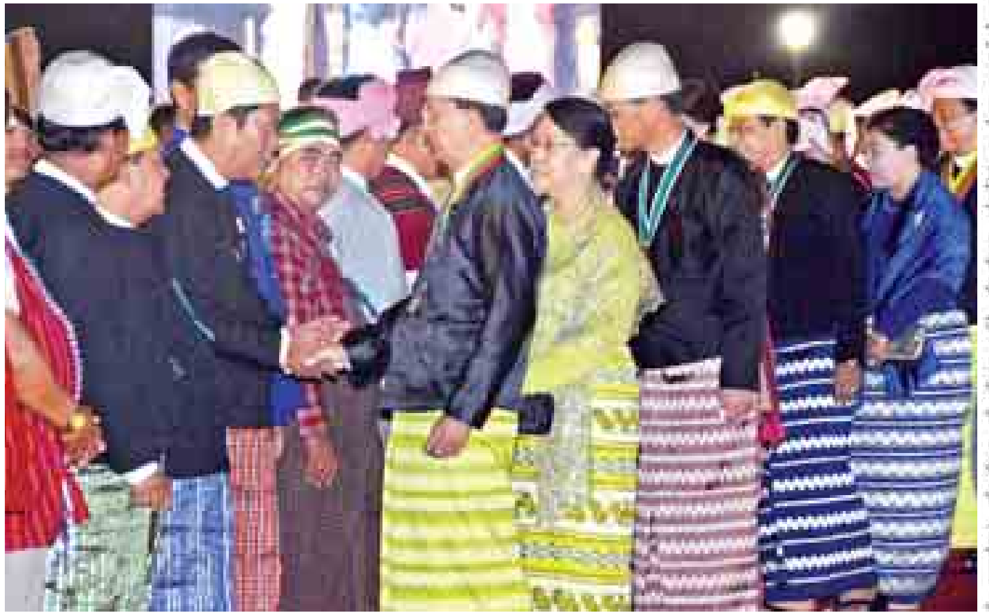
နိုင်ငံတော်သမ္မတ ဦးသိန်းစိန်နှင့် ဇနီး ဒေါ်ခင်ခင် ဝင်း (၆၇)နှစ်မြောက် လွတ်လပ်ရေးနေ့ အထိမ်းအမှတ် ညွှန်ကြားခွင့်နှင့် ညစာစားပွဲအခမ်းအနားသို့ တက်ရောက် လာကြသူများအား ရင်းရင်းနှီးနှီးနှုတ်ဆက်စဉ်။ (သတင်းစဉ်)

အဆိုပါ (၆၇)နှစ်မြောက် လွတ်လပ်ရေးနေ့ အထိမ်း အမှတ်ညွှန်ကြားခွင့်နှင့် ညစာစားပွဲသို့ ဒုတိယသမ္မတ ဒေါက်တာ စိုင်းမောက်ခမ်းနှင့် ဇနီး ဒုတိယသမ္မတ ဦးညွှန်ထွန်းနှင့် ဇနီး၊ ပြည်ထောင်စုလွှတ်တော်နာယက ပြည်သူ့လွှတ်တော်ဥက္ကဋ္ဌ သူရဦးရွှေမန်းနှင့် ဇနီး၊ စာမျက်နှာ ၆ ကော်လံ ၁ သို့ ၂