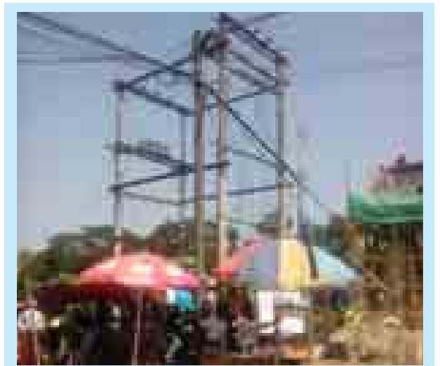
ပဲခူးမြို့ အထက အမှတ်(၃) ကျောင်းရှေ့ ပဲခူး-ရန်ကုန်ကားလမ်းမကြီးဘေး ကျားရိုးထောင့်ရှိ မြို့တွင်းသုံးထရန်စဖော်မာကြီး၏ဘေးကပ်လျက် ယုံကျ ဆိုင်များ ဖွင့်လှစ်ရောင်းချနေသည့်အတွက် အန္တရာယ်အလွန်များ ဖွဲ့စည်းစောင့်ကြည့် နေ၍ သက်ဆိုင်ရာတို့မှ ကြိုတင်ကာကွယ်ရှင်းလင်းသင့်ပါသည်။ (၅၈၇)