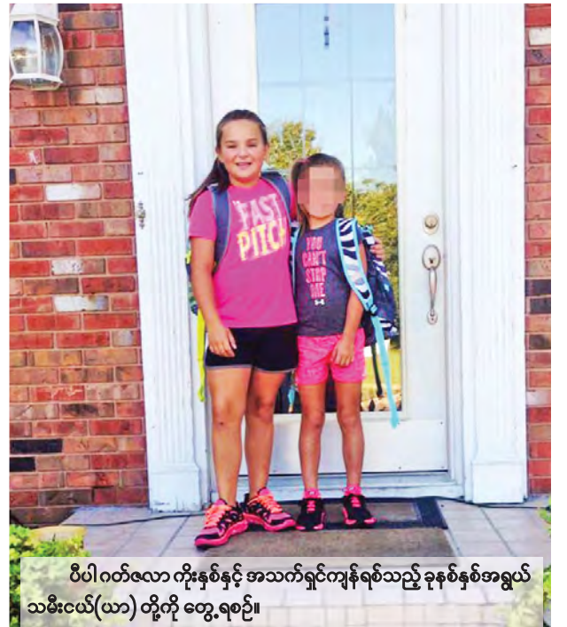
ပီပါဂတ်ဇလာ ကိုးနှစ်နှင့် အသက်ရှင်ကျန်ရစ်သည့် ခုနစ်နှစ်အရွယ် သမီးငယ်(ယာ) တို့ကို တွေ့ရစဉ်။