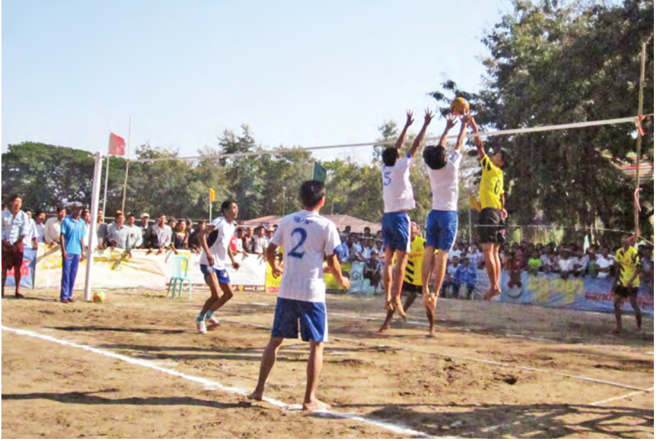
နှင့် ကာယပညာဦးစီးဌာနမှ တာဝန်ရှိ သူများ၊ ဒေသပြည်သူများနှင့် အားကစားဝါသနာရှင်ပရိသတ်များ ကြောင်း သိရသည်။