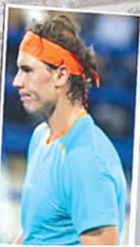
မေလဲသင်း

မာရေးက “ဒီနေ့ တိုးတက်လာတယ်လို့ ခံစားရတဲ့အတွက် ကျွန်တော် ကျေနပ်ပါတယ်။ နာဒယ်ကလည်း ကောင်းကောင်းကစားနိုင်ခဲ့ပါတယ်။ ဒါပေမယ့် ကျွန်တော်က အရေးကြီးရမှတ် တွေကို ရအောင်ကစားနိုင်ခဲ့တယ်”ဟု ပြောကြားခဲ့သည်။