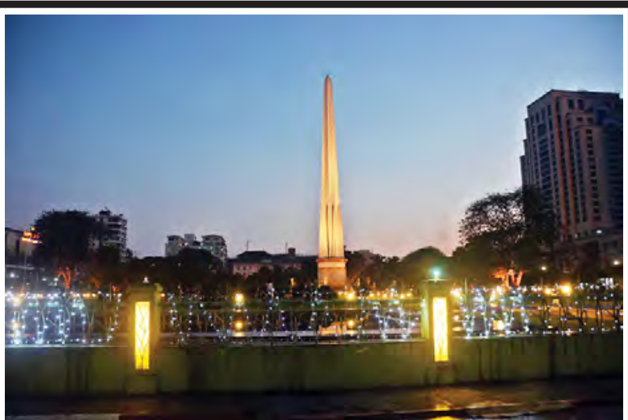
ဇန်နဝါရီ ၃ ရက်ညပိုင်းက (၆၇)နှစ်ပြောက် လွတ်လပ်ရေးနေ့အကြိုအဖြစ် ရန်ကုန်မြို့ရှိ မဟာပန္နလမ်း၌ ရောင်စုံမီးများဖြင့် အလှဆင်ထားသည်ကို ဤသို့ တွေ့ရစဉ်။ (ဇော်မင်းလတ်)