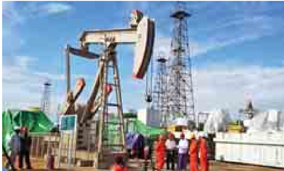
စွမ်းအင်ဝန်ကြီးဌာန ဒုတိယဝန်ကြီး ဦးမြင့်ဇော် မြန်မာ့ရေနံနှင့်သဘာဝဓာတ်ငွေ့လုပ်ငန်း ချောက်ရေနံမြေတွင်းသစ်အမှတ်(၁၁၉၅) အောင်မြင်စွာ တူးဖော်ထုတ်လုပ်မှုလုပ်ငန်းများ ကြည့်ရှုစစ်ဆေးစဉ်။ (စွမ်းအင်)