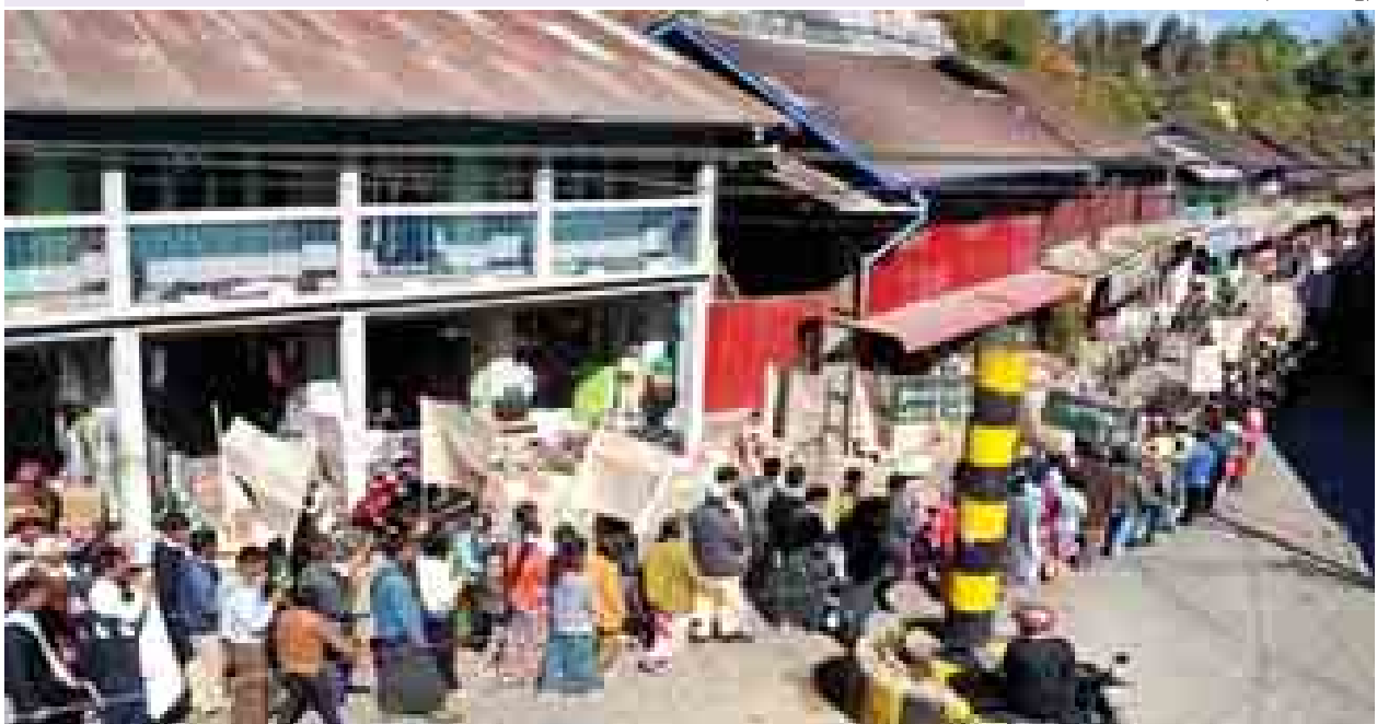
နန်ဆန်မြို့တွင် ပလောင်တိုင်းရင်းသားများ ငြိမ်းချမ်းစွာစီတန်းလှည့်လည်၍ စုပေါင်းဆန္ဒထုတ်ဖော်ကြစဉ်။ (သတင်းစဉ်)

သက်ဆိုင်ရာ၏ ကြိုတင်ခွင့်ပြုချက်ရယူကာ ပြည်တွင်းငြိမ်းချမ်းရေး လုပ်ငန်းစဉ်များကို အောင်မြင်ပြီးဆုံးသည်အထိ အမြန်ဆုံးဆောင်ရွက်ပေးရေး၊ နိုင်ငံတော်ဖွံ့ဖြိုးတိုးတက်ရေးနှင့် ပြုပြင်ပြောင်းလဲရေးကို အစိုးရက အမြန်ဆုံး ဆောင်ရွက်ပေးရေး၊ တိုင်းရင်းသားများ၏ အခွင့်အရေးနှင့် လိုလားတောင်းဆိုချက်များကို အစိုးရက ဦးဆောင်ဖြေရှင်းပေးရေး၊ ဖွဲ့စည်းပုံအခြေခံဥပဒေပြင်ဆင်ရေးတွင် တိုင်းရင်းသားအားလုံး ကျယ်ကျယ်ပြန့်ပြန့် ပါဝင်နိုင်ရေး၊ ခြောက်ပွင့်ဆိုင် အလိုမရှိ၊ တောင်းဆိုချက်များ အမြန်ဆုံး အကောင်အထည်ဖော်ဆောင်ရွက်ပေးရေးတို့ကို နိုင်ငံတော်အစိုးရသို့ အသိပေးလိုသည့်အတွက် ယခုကဲ့သို့ ဆန္ဒထုတ်ဖော်ခြင်းဖြစ်ကြောင်း သိရသည်။ (သတင်းစဉ်)