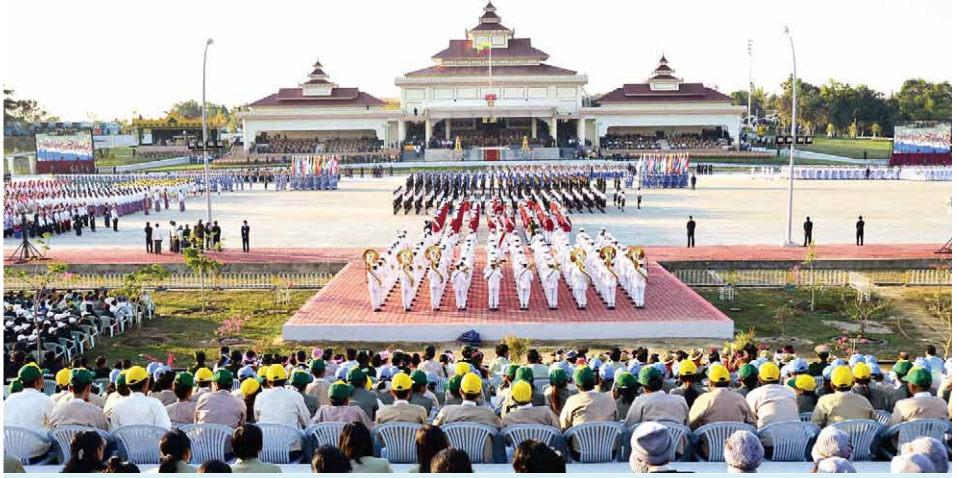
၂၀၁၅ ခုနှစ် (၆၇)နှစ်မြောက် လွတ်လပ်ရေးနေ့ နိုင်ငံတော်အလံတင်အခမ်းအနားနှင့် ဗိုလ်ရှင်အခမ်းအနား ဝတ်စုံပြည့်အစမ်းလေ့ကျင့်နေမှုကို တွေ့ရစဉ်။ သန်းဦး(လေးမျက်နှာ)

ဗိုလ်ရှင်အခမ်းအနားကျင်းပရေး ဗဟိုကော်မတီဥက္ကဋ္ဌ ဒုတိယသမ္မတ ဦးညွှန်ထွန်းသည် ယနေ့နံနက်ပိုင်းတွင် နေပြည်တော်ရှိဗိုလ်ရှင်မဏ္ဍပ်ရှေ့ဥပစာ၌ ပြုလုပ်သည့် ၂၀၁၅ ခုနှစ် (၆၇) နှစ်မြောက် လွတ်လပ်ရေးနေ့ နိုင်ငံတော် အလံတင်အခမ်းအနားနှင့် ဗိုလ်ရှင်အခမ်းအနား ဝတ်စုံပြည့်အစမ်းလေ့ကျင့်နေမှုများကို ကြည့်ရှုစစ်ဆေးသည်။ အခမ်းအနားတွင် နံနက် ၄ နာရီ မိနစ် ၂၀ ၌ ဂုဏ်ပြုတပ်ဖွဲ့က တိုင်းရင်းသူလေးများက ဂုဏ်ပြုတပ်ဖွဲ့နှင့်အတူ နိုင်ငံတော်အလံကို အလေးပြု ထိုးနှောက် အခမ်းအနားတွင် သရုပ်ပြချီတက်ကြမည့် စစ်ကြောင်းများက ပြည်ထောင်စုသမ္မတမြန်မာနိုင်ငံတော်အလံကို လွှင့်တင်ကြရာ တိုင်းရင်းသား၊ ကြသည်။ ထို့နောက် အခမ်းအနားတွင် သရုပ်ပြချီတက်ကြမည့် စစ်ကြောင်းများက ဗိုလ်ရှင်မဏ္ဍပ်ရှေ့သို့ စာမျက်နှာ ၈ ကော်လံ ၁ သို့ ❖