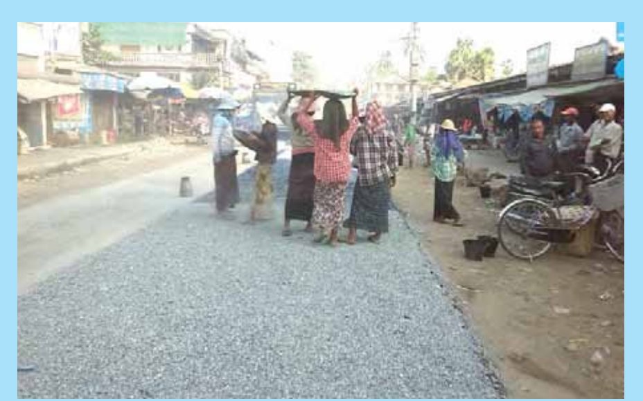
ရန်ကုန်တိုင်းဒေသကြီး တောင်ပိုင်းခရိုင် သုံးစွဲဖြန့်ဖြူးမှုနှင့် ပြည်သူ့ဆောက်လုပ်ရေးလုပ်ငန်း ဖြန့်ဖြူးမှုလက်ထောက်အင်ဂျင် နီယာရုံးမှ မြို့တွင်းလမ်းများ ကောင်းမွန်၍ ပြည်သူများသွားလာရေးအဆင်ပြေစေရန် အောင်စေယူလမ်းမကြီး မြို့မရေး ရှေ့တွင် ကတ္တရာထပ်ပိုးလွှာခင်းမြင်းလုပ်ငန်းကို ဒီဇင်ဘာ ၂၇ ရက်က ဆောင်ရွက်ခဲ့သည်။