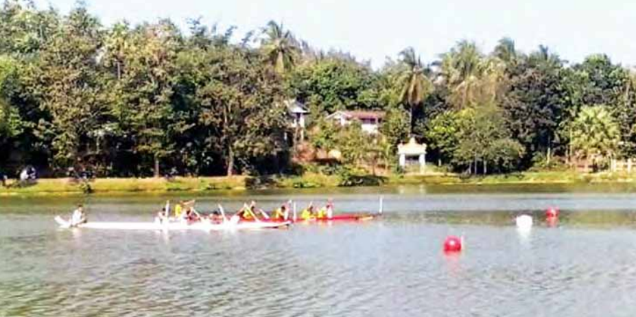
ထွန်းထွန်း(ဇော်)

ရေမြို့နယ် အားကစားနှင့် ကာယပညာဦးစီးဌာနနှင့် မြို့နယ်အားကစားနှင့် ကာယပညာကော်မတီတို့ ကြီးမှူး ကျင်းပသော (၆၇)နှစ်မြောက် လွတ်လပ်ရေးနေ့ အထိမ်းအမှတ် မြန်မာ့ရိုးရာလှေသဘင်ပွဲ ဖွင့်ပွဲအခမ်းအနားကို မွန်ပြည်နယ် ရေမြို့ ရှေးဟောင်းမြောက်ဘက်ကျားတော်ကြီး၌ ဇန်နဝါရီ ၁ ရက် နံနက် ၈ နာရီက ဖွင့်ပွဲအခမ်းအနားကို ကျင်းပခဲ့ကြောင်း သိရသည်။