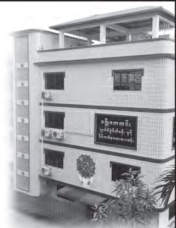
ဆေးရုံလီဒီဆာ... မဏ္ဍိပုဂံရည်ပဟာစည်သာသနာ့ရိပ်သာ ၁၀ တောင်၊ ၁၁ ရပ်ကွက်၊ သာဓကတပြုနယ်၊ ရန်ကင်းမြို့။ ဖုန်း- ၀၁-၅၅၅၀၆၈