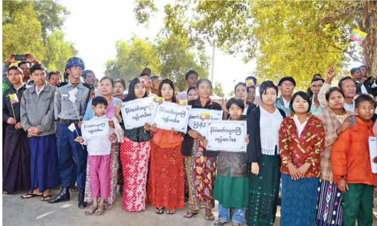
နိုင်ငံတော်သမ္မတ ဦးသိန်းစိန်အား ကျောက်တော်မြို့၌ ကြိုဆိုနေကြသော ဒေသခံပြည်သူများကို တွေ့ရစဉ်။ (သတင်းစဉ်)

နိုင်ငံတော်သမ္မတ ဦးသိန်းစိန် စစ်တွေမြို့သို့ ရောက်ရှိလာရာ မြို့မိမြို့ဖများနှင့် ရခိုင်ရိုးရာယဉ်ကျေးမှုအဖွဲ့ဝင်များက ကြိုဆိုကြစဉ်။ (သတင်းစဉ်)