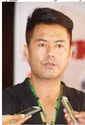
အကယ်ဒမီလူမင်း

လုံခြုံရေးနှင့်ပတ်သက်၍ မြန်မာနိုင်ငံရဲတပ်ဖွဲ့နှင့် ရန်ကုန်တိုင်းဒေသကြီးရဲတပ်ဖွဲ့မှ ရဲအရာရှိများ၊ တပ်ဖွဲ့ဝင် များအပါအဝင် အင်အား စုစုပေါင်း ၂၀၀ ကျော် လုံခြုံရေး တာဝန်ချထားကြောင်း ရဲအရာရှိတစ်ဦးက ပြောသည်။