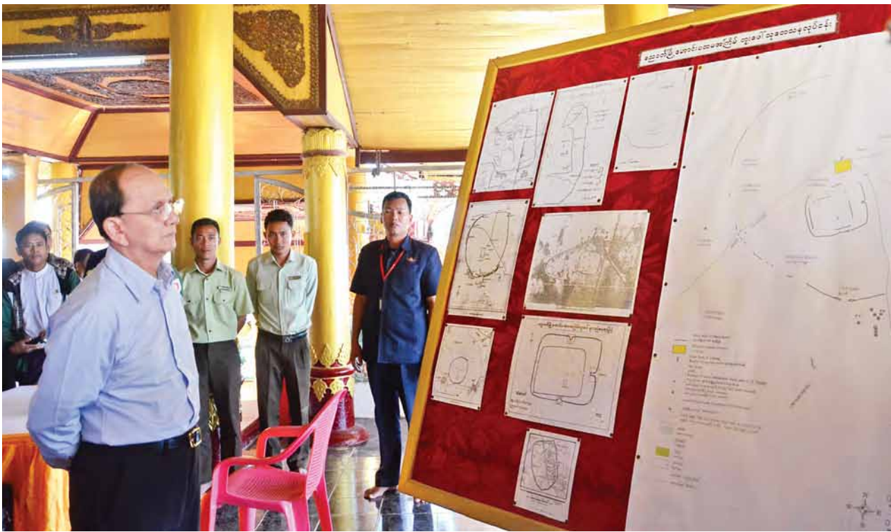
နိုင်ငံတော်သမ္မတ ဦးသိန်းစိန် ညောင်တီမြို့ဟောင်း ပထမအကြိမ် တူးဖော်မှုသုတေသနလုပ်ငန်းဆောင်ရွက်ခဲ့မှုများနှင့်စပ်လျဉ်း၍ တင်ပြချက်များကို ကြည့်ရှုစဉ်။

မိမိတို့ အစိုးရသက်တမ်းကာလအတွင်း ပြည်သူ့ပဟိုပြု၍ ပြည်သူ့အကျိုးပြုလုပ်ငန်းများကို ဆောင်ရွက်ပေးလျက်ရှိနေပါကြောင်း၊ ပြုပြင်ပြောင်းလဲမှုများကို ဆောင်ရွက်ရာတွင် ပြည်သူတို့၏ ဆန္ဒများကို အဓိကထားဆောင်ရွက်လျက်ရှိနေပါကြောင်း၊ မိမိတို့အနေဖြင့် ဒီမိုကရေစီစနစ်သို့ ပြုပြင်ပြောင်းလဲရာတွင် ညင်သာစွာပြုပြင်ပြောင်းလဲနိုင်ခဲ့ပါကြောင်း၊ ဒီမိုကရေစီစနစ် ပြုပြင်ပြောင်းလဲရေးကို မိမိတို့ကဲ့သို့ ညင်သာစွာ မဆောင်ရွက်နိုင်သေးသည့် နိုင်ငံများကိုလည်း တွေ့မြင်ကြရမည်ဖြစ်ပါကြောင်း၊ ပြည်သူများ၏ တူညီညီညီဆန္ဒသည် တရားဥပဒေစိုးမိုးရေး၊ တည်ငြိမ်အေးချမ်းရေးနှင့် လူမှုစီးပွားဖွံ့ဖြိုးတိုးတက်ရေးတို့ပင်ဖြစ်ပါကြောင်း၊ မိမိတို့နိုင်ငံအနေဖြင့် ပေါများကြွယ်ဝသည့် သဘာဝသယံဇာတများနှင့် လူ့စွမ်းအား အရင်းအမြစ်များကို အသုံးပြု၍ အဆင်းရဲဆုံးနိုင်ငံများ