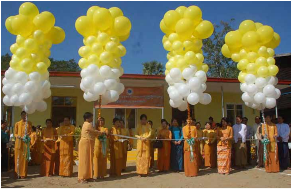
ထောက်ကူပစ္စည်းများ ကစားစရာအရပ်များ ကျောင်း အရွယ်ကလေးများ ကျောင်းအပ်နှံပေးခြင်းတို့ကို နှစ်စဉ် ဝတ်စုံများ၊ သင်ထောက်ကူပစ္စည်းများ ထောက်ပံ့ပေးအပ် ဆောင်ရွက်လျက်ရှိသည်။ သတင်း-သီသီမင်း၊ ဓာတ်ပုံ-စိမ်းခက်

တွင် ပျော်ရွှင်မှုရှိစေရေးအတွက် ကစားစရာအရပ်များ နှင့် သင်ထောက်ကူပစ္စည်းများ ပြည့်စုံမှုရှိမှသာ ကလေးငယ် များ၏ကာယ၊ စာရိတ္တ၊ အသိပညာ အလိမ္မာတိုးပွားစေပြီး ဘက်စုံထူးချွန်တိုးတက်လာစေရေးအတွက် ရည်ရွယ်ဖွင့်လှစ် ရခြင်းဖြစ်ကြောင်းပြောကြားသည်။ ရန်ကုန်တိုင်းဒေသကြီး မိခင်နှင့် ကလေးစောင့်ရှောက် မှု ကြီးကြပ်ရေးအဖွဲ့နှင့် အလှူရှင်များက အဆောက်အအုံ တန်ဖိုး ၂၃၁ သိန်းတန်ဖိုးရှိ မူကြို ကျောင်းဆောင်သစ်နှင့် ၂၇၀ သိန်း ရှစ်သောင်းတန်ဖိုးရှိ ထောက်ပံ့ပစ္စည်း ၁၈မျိုး လှူဒါန်းခဲ့ပြီး မူကြိုကျောင်းလေးငယ်များအား အအေး၊ မုန့်နှင့် ကစားစရာ အရပ်များပေးအပ်ခဲ့သည်။ ရန်ကုန်တိုင်းဒေသကြီးမိခင်နှင့်ကလေးစောင့်ရှောက်မှု ကြီးကြပ်ရေးအဖွဲ့သည် မူကြိုဆရာမများအား အရည်အသွေး မြင့်တင်မှု လုပ်ငန်းများကို လူမှုဝန်ထမ်းဦးဌာနနှင့် ပူးပေါင်းပြီး အရည်အသွေးမြင့်တင်မှု သင်တန်းများ ပို့ချလျက်ရှိသည့်အပြင် မူကြိုကျောင်းလေးငယ်များအား သင်