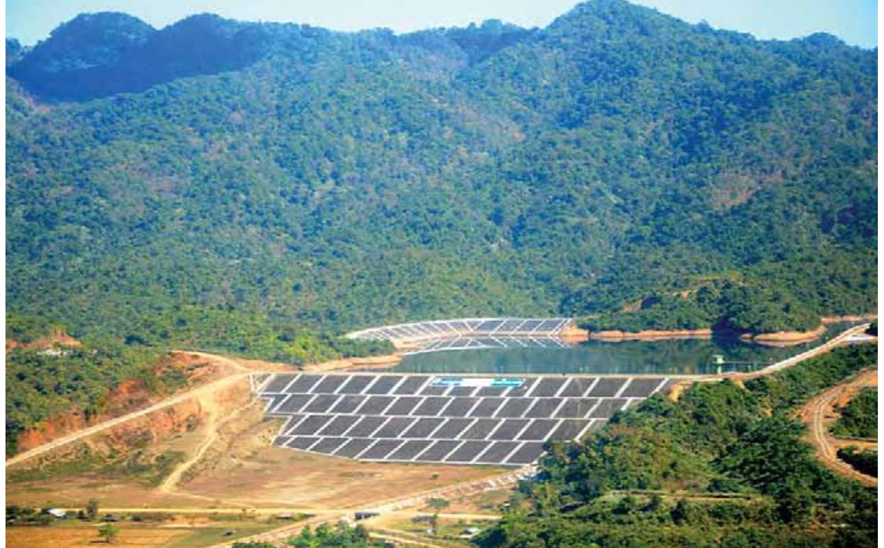
ရခိုင်ပြည်နယ် ကျောက်တော်မြို့ရှိ ဇီ-ချောင်းရေလှောင်တံမံကို တွေ့ရစဉ်။ (သတင်းစဉ်)

သည်ကို တွေ့မြင်ရမည်ဖြစ်ပါကြောင်း၊ ရခိုင်ပြည်နယ်ဖွံ့ဖြိုးတိုးတက်ရန် လမ်း ပန်းဆက်သွယ်ရေး ကောင်းမွန်ရန် ဆောင်ရွက်လျက်ရှိနေပါကြောင်း၊ ဒေသဖွံ့ဖြိုးတိုးတက်ရေးအတွက် လမ်း ပန်းဆက်သွယ်ရေး၊ လျှပ်စစ်မီးရရှိ ရေးသည် အရေးကြီးပါကြောင်း၊ ရခိုင် ပြည်နယ်ဖွံ့ဖြိုးတိုးတက်ရေးအတွက် သာမန်ခွင့်ပြုပေးသည့် ဘဏ္ဍာငွေများ အပြင် သီးသန့်ရန်ပုံငွေများ ခွင့်ပြုပံ့ပိုး ပေးခဲ့ပါကြောင်း၊ လျှပ်စစ်မီးကို အခြေ ပြု၍ ဒေသဖွံ့ဖြိုးရေးကို ဆောင်ရွက်ကြ ရမည်ဖြစ်ပါကြောင်း၊ အိမ်တွင်းစက်မှု လုပ်ငန်းများ၊ အသေးစား၊ အလတ်စား စက်မှုလုပ်ငန်းများနှင့် သားငါးကဏ္ဍ ဖွံ့ဖြိုးတိုးတက်ရေးကိုလည်းဆောင်ရွက် ကြရမည်ဖြစ်ပါကြောင်း၊ ဒေသဖွံ့ဖြိုး တိုးတက်ရန် အလုပ်အကိုင်အခွင့်အလမ်း များရရှိရေးသည်အရေးကြီးပါကြောင်း၊ အလုပ်အကိုင်အခွင့်အလမ်းများနှင့် ပတ်သက်၍ ရခိုင်ပြည်နယ်တွင် အား သာချက်များရှိနေပါကြောင်း၊ ကျောက် ဖြူစက်မှုဇုန်၊ မဒဲကျွန်းရေနက်ဆိပ်ကမ်း၊ သဘာဝဓာတ်ငွေ့တင်ပို့မှုနှင့်ရေနံစိမ်း တင်ပို့နိုင်မည့် အခြေခံလုပ်ငန်းများကို စာမျက်နှာ ၉ သို့