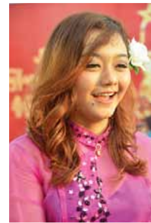
အဆိုတော် ဝင်းလှသူ