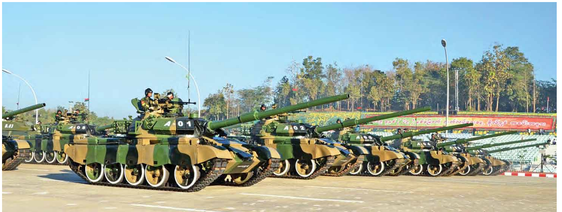
(၆၇)နှစ်မြောက်လွတ်လပ်ရေးနေ့ ဗိုလ်ရှစ်အခမ်းအနားတွင် ပါဝင်သရုပ်ပြချီတက်အလေးပြုကြမည့် စစ်ကြောင်းများ ဝတ်စုံပြည့်အကြိုလေ့ကျင့်မှုများပြုလုပ်ကြစဉ်။ (သတင်းစဉ်)

★(၆၇)နှစ်မြောက်မှ ကြက်ခြေနီ၊ မီးသတ်တပ်ဖွဲ့နှင့် ဌာနဆိုင်ရာကိုယ်စားပြုစစ်ကြောင်းများ၊ တိုင်းဒေသကြီးနှင့်ပြည်နယ်ကိုယ်စားပြုစစ်ကြောင်းများ၊ မြန်မာနိုင်ငံကင်းထောက်တပ်ဖွဲ့ဝင်စစ်ကြောင်း၊ တပ်မတော်သံချပ်ကာ၊ အမြောက်နှင့် ယန္တရားစစ်ကြောင်းများက စစ်ကြောင်းများအလိုက် ဝတ်စုံပြည့်ချီတက်အလေးပြုလေ့ကျင့်မှုများကို ပြုလုပ်ကြသည်။