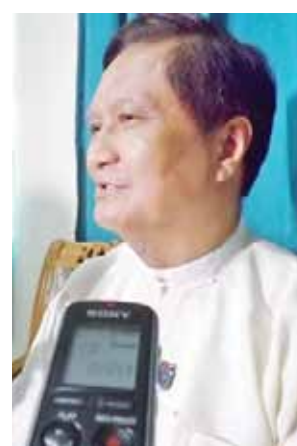
ပါမောက္ခချုပ် ဒေါက်တာ သိန်းကြူ

ဒီအခမ်းအနားမှာပျော်ပွဲရွှင်ပွဲတွေ၊ တေးသီချင်းဆိုပွဲတွေပါဝင်မှာပါ။ ပြုံးအလှစကရီပြိုင်ပွဲလည်း ပါဝင်ပါတယ်။ ပြုံးအလှစကရီပြိုင်ပွဲက ဒီမှာက သွားဆရာဝန်တွေမှူးထုတ်ပေးတယ်လို့လူတွေ လှလှပပ ပြုံးနိုင်ရယ်နိုင်ဖို့ဆိုတာ သွားလေးတွေကောင်းမှ လှ မှာ။ ဒီလို လူတွေလှလှပပပြီးနိုင်အောင် ကုသပေးရတဲ့ ဆရာဝန်တွေအနေနဲ့ ပိုပြီးတော့သိလာအောင် နားလည်လာအောင် ရည်ရွယ်ပြီး