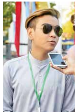
ကလေးသရုပ်ဆောင် ဟဲဗီးဗြိုး