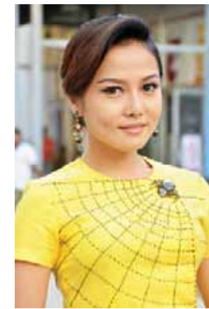
ဆုဝင် (MRTV-4 သရုပ်ဆောင်)