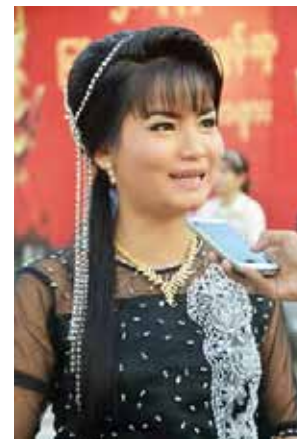
ချောသီရိစံ