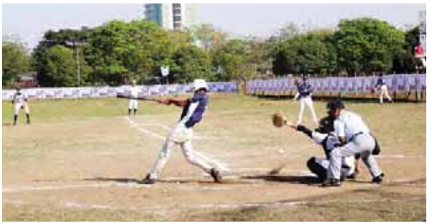
ရိုက်၍ ပြိုင်ပွဲကို ဖွင့်လှစ်ပေးပြီး ယှဉ်ပြိုင်မှုအား ကြည့်ရှုအားပေးခဲ့ မြန်မာ-ဂျပန် နှစ်ဖက်အသင်းတို့ ကြောင်း သတင်းရရှိသည်။ (ကြေးမုံ)