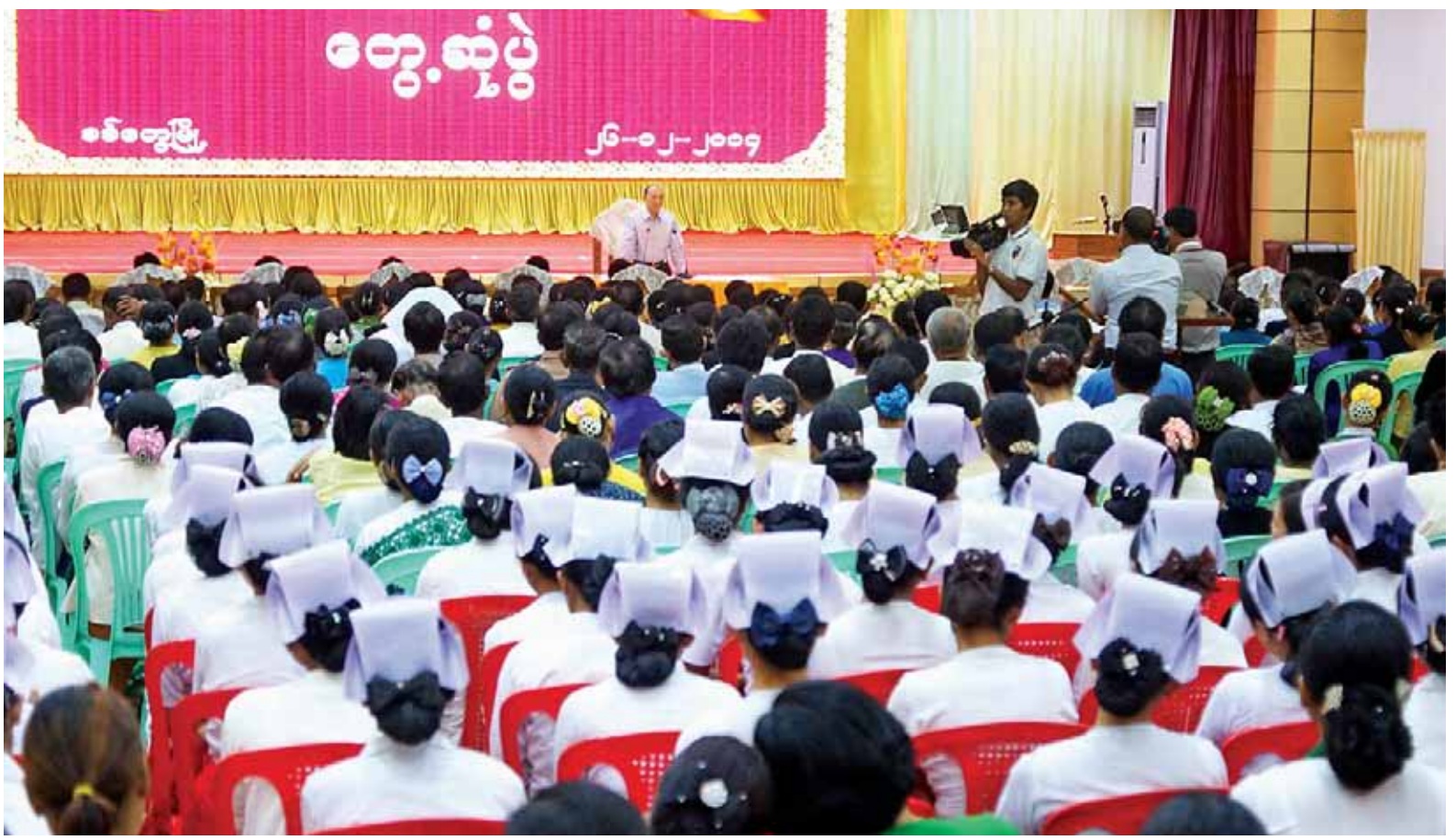
နိုင်ငံတော်သမ္မတ ဦးသိန်းစိန် စစ်တွေမြို့ ဦးဥတ္တမခန်းမ၌ ပြည်နယ်၊ ခရိုင်၊ မြို့နယ်အဆင့် ဌာနဆိုင်ရာအကြီးအကဲများ၊ နိုင်ငံရေးပါတီများ၊ လူမှုရေးအသင်းအဖွဲ့များ၊ ရုပ်မိရပ်ဖများ၊ ဒေသခံပြည်သူများအား တွေ့ဆုံအမှာစကားပြောကြားစဉ်။ (သတင်းစဉ်)

စစ်တွေ ဒီဇင်ဘာ ၂၆ နိုင်ငံတော်သမ္မတ ဦးသိန်းစိန် နှင့် အဖွဲ့ဝင်များသည် သံတွဲမြို့မှ အထူးလေယာဉ်ဖြင့် ယနေ့ နံနက် ပိုင်းတွင် ထွက်ခွာခဲ့ရာ စစ်တွေမြို့ သို့ ရောက်ရှိပြီး ထိုမှတစ်ဆင့် ရဟတ်ယာဉ်များဖြင့် ထွက်ခွာခဲ့ရာ ကျောက်တော်မြို့သို့ ရောက်ရှိ သည်။ ယင်းနောက် နိုင်ငံတော်သမ္မတ သည် မဟာမြတ်မုနိရုပ်ရှင်တော် မြတ်အား ပန်း၊ ရေခဲခဲ၊ ဆီမီးနှင့် ရွှေသင်္ကန်းများကပ်လှူပူဇော်ပြီး အလှူငွေများ ပေးအပ်လှူဒါန်း သည်။ ထို့နောက် နိုင်ငံတော်သမ္မတ သည် မဟာမြတ်မုနိရုပ်ရှင်တော် မြတ်ကြီး၏ အရှေ့ဘက်အာရုံခံ တန်ဆောင်းအတွင်း၌ ကျောက် တော်မြို့မှ မြို့မိမြို့ဖများနှင့် တွေ့ဆုံ၍ တစ်မြို့နယ်ချင်းဖွံ့ဖြိုး တိုးတက်မှု ဒေသဖွံ့ဖြိုးတိုးတက် မည်ဖြစ်ပြီး ဒေသဖွံ့ဖြိုးတိုးတက်မှု တိုင်းပြည်ဖွံ့ဖြိုးတိုးတက်မည်ဖြစ် ပါကြောင်း၊ သဘာဝအခြေခံ စာမျက်နှာ ၈ ကော်လံ ၁ သို့ ၀