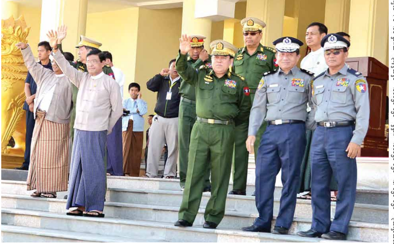
ဒုတိယသမ္မတ ဦးညွှန်ထွန်း ၂၀၁၅ ခုနှစ် (၆၇)နှစ်မြောက် လွတ်လပ်ရေးနေ့ ပိုလ်ရှင်အခမ်းအနား အကြိုလေ့ကျင့်နေမှုများအား ကြည့်ရှုအားပေး စဉ်။ (သတင်းစဉ်)

ယင်းနောက် ဒုတိယသမ္မတသည် ၂၀၁၅ ခုနှစ် (၆၇)နှစ်မြောက်လွတ်လပ် ရေးနေ့ ပိုလ်ရှင်အခမ်းအနားအစီအစဉ်များဖြစ်သည့် အလံကိုင်တပ်ဖွဲ့များ၊ စစ်တီးပိုင်းတပ်ဖွဲ့များနှင့် စစ်ရေးပြတပ်ဖွဲ့များ စုရပ်ကွင်းသို့ ချီတက်နေရာယူ ခြင်း၊ နိုင်ငံတော်သမ္မတအား အလေးပြုခြင်းနှင့် တပ်စစ်ဆေးခံခြင်း၊ နိုင်ငံတော် အလံအား အလေးပြုခြင်း၊ ကျဆုံးလေပြီးသော အာဇာနည်ခေါင်းဆောင်ကြီး များနှင့် တပ်မတော်သားများအား အလေးပြုခြင်းနှင့် အောက်မေ့သတိရသော အားဖြင့် နှစ်မိနစ်ငြိမ်သက် ဂါရဝပြုခြင်း၊ နိုင်ငံတော်သမ္မတ၏ (၆၇)နှစ်မြောက် လွတ်လပ်ရေးနေ့မိန့်ခွန်းနာယူခြင်း၊ စာမျက်နှာ ၈ ကော်လံ ၁ သို့ ၂