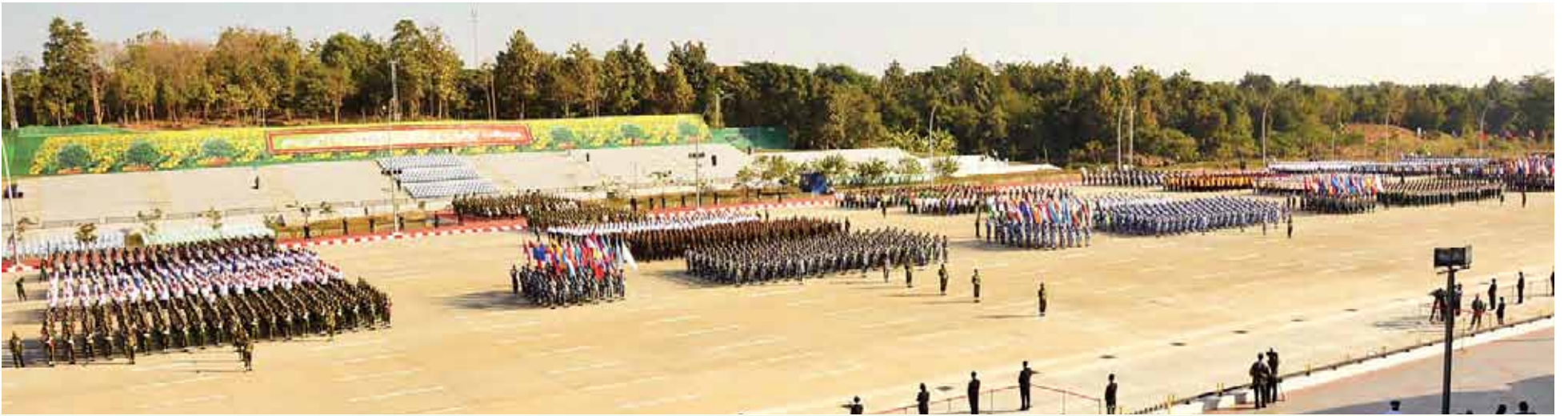
၂၀၁၅ ခုနှစ် (၆၇) နှစ်မြောက် လွတ်လပ်ရေးနေ့ ဗိုလ်ရှင်အခမ်းအနားအတွက် ကြိုတင်ပြင်ဆင်လေ့ကျင့်နေမှုများကို တွေ့ရစဉ်။(အပေါ်ပုံနှင့် အောက်ပုံများ)