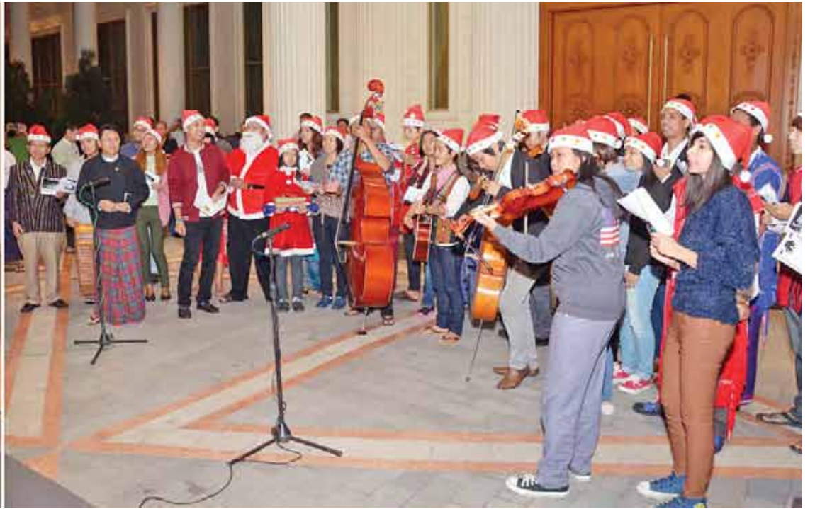
နိုင်ငံတော်သမ္မတ ဦးသိန်းစိန်၊ ဇနီးဒေါ်ခင်ခင်ဝင်းနှင့် မိသားစုတို့အား ခရစ်တော်မွေးနေ့အကြိုအဖြစ် ခရစ်ယာန်လူငယ်များ ဓမ္မတေးအဖွဲ့က ဓမ္မတေးသီချင်းများသီဆို၍ မေတ္တာပို့ဆောင်ကောင်းချီးပေးကြစဉ်။ (သတင်း-ရှေ့ဖုံး) (သတင်းစဉ်)