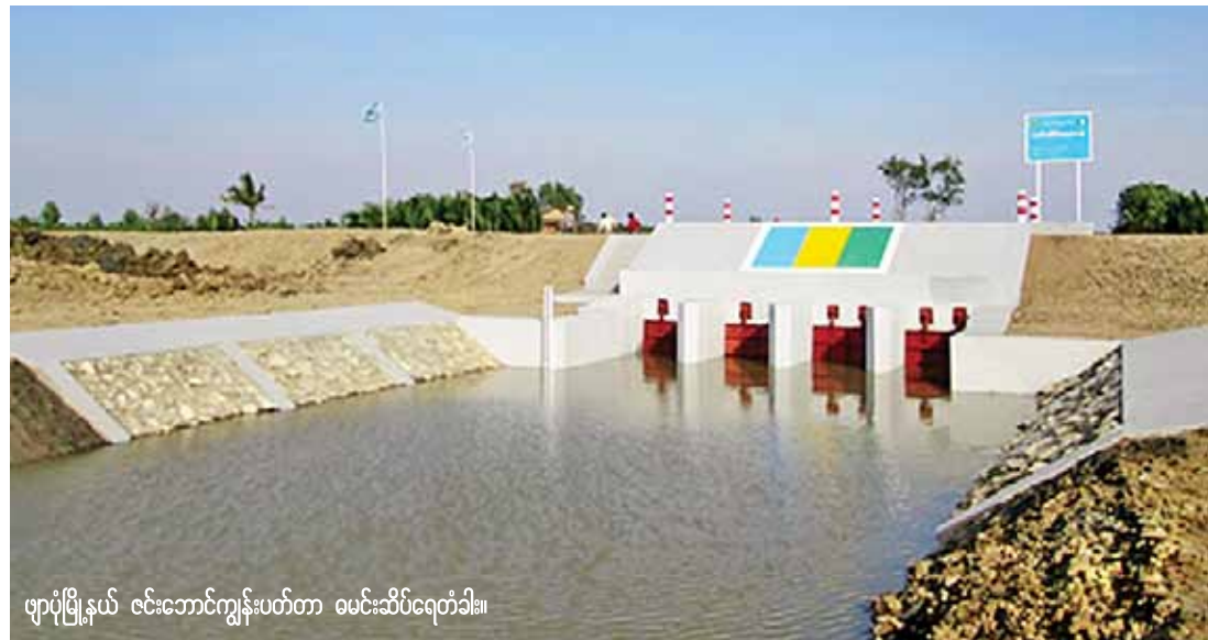
ဖျာပုံမြို့နယ် ဇင်းဘောင်ကျွန်းပတ်တာ ဓမ္မင်းဆိပ်ရေတံခါး။