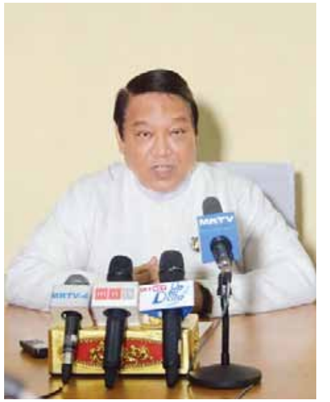
လူဝင်မှုကြီးကြပ်ရေးနှင့် ပြည်သူ့အင်အားဝန်ကြီးဌာန ပြည်ထောင်စုဝန်ကြီး ဦးခင်ရီ။

ဒါကြောင့် ယာယီသက်သေခံလက်မှတ်ကိုင်ဆောင်သူ နိုင်ငံခြားသားတွေကို မဲပေးခွင့်ပြုဖို့ စဉ်းစားနေတယ် ဆိုပြီး လွဲမှားစွာသုံးသပ်မိမှာစိုးပါတယ်။ ဆိုလိုရင်းကတော့ ဖွဲ့စည်းပုံအခြေခံဥပဒေကို ပြင်ဆင်တဲ့ဥပဒေကြမ်း အတည်ပြုရေး ပြည်လုံးကျွတ်ဆန္ဒခံယူပွဲဥပဒေမှာ ယာယီသက်သေခံလက်မှတ်ကိုင်ဆောင်သူတွေကို မဲပေးခွင့်မပြုဘဲ ချန်လှပ်ထားခဲ့မိရင် ယာယီသက်သေခံလက်မှတ် ကိုင်ဆောင်ထားသူတွေထဲမှာ လူမျိုးခြားတစ်မျိုးတည်းကိုသာ ရည်ရွယ်ဆောင်ရွက်လို့မရနိုင်ဘဲ နိုင်ငံသားအဖြစ် စိစစ်နေဆဲ မိမိတိုင်းရင်းသားအချို့လည်း ရောနှောပါရှိနေနိုင်တာဖြစ်လို့ မိမိတိုင်းရင်းသားတွေ နှစ်မှာမူမရှိစေဖို့ ကို ဦးတည်ရည်ရွယ်ပြီး ယခင်ဆောင်ရွက်ပေးခဲ့တဲ့ သမိုင်းကြောင်းနဲ့ တည်ဆဲဥပဒေတွေကို ကိုးကားပြီး စဉ်းစားသုံးသပ်နိုင်ဖို့အတွက်သာ နိုင်ငံတော်ဘက်က အကြံပြု/အသိပေး သဘောထားမှတ်ချက်ပြုခြင်းမျိုးသာ ဖြစ်ပါတယ်။ အဆုံးအဖြတ်ပေးခြင်းမျိုးလည်း မဟုတ်တာကို ဂရုပြုစေလိုပါတယ်။