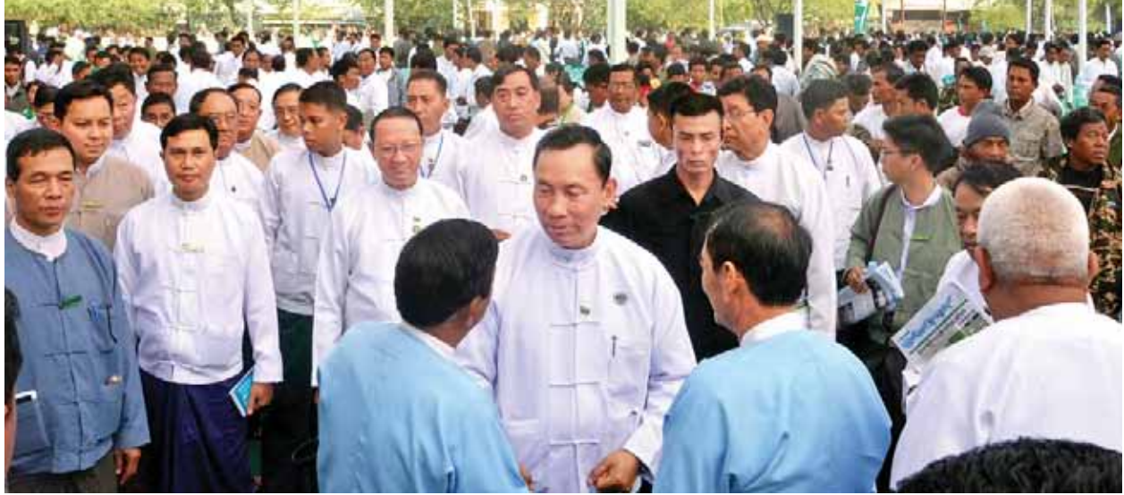
ပြည်ထောင်စုလွှတ်တော်နာယက ပြည်သူ့ လွှတ်တော်ဥက္ကဋ္ဌ သူရဦးရွှေမန်း တောင်သူလယ်သမားများအား ရင်းရင်းနှီးနှီး တွေ့ဆုံစဉ်။ (သတင်းစဉ်)

မန္တလေး ဒီဇင်ဘာ ၂၄ မန္တလေးတိုင်းဒေသကြီး မန္တလေး ခရိုင်၊ ပြင်ဦးလွင်ခရိုင်၊ ကျောက်ဆည် ခရိုင်၊ မိတ္ထီလာခရိုင်၊ မြင်းခြံခရိုင်၊ ညောင်ဦးခရိုင်နှင့် ရမည်းသင်းခရိုင်တို့ အတွင်းရှိ မြို့နယ်များမှ တောင်သူ လယ်သမားကြီးများ တက်ရောက်ကြ သည့် တောင်သူလယ်သမားရေးရာ လူထုတွေ့ဆုံပွဲအခမ်းအနားကို ယနေ့ နံနက် ၈ နာရီတွင် မန္တလေးတိုင်း ဒေသကြီး စဉ်တိုင်မြို့ စံပြကျေးရွာ ကွင်း၌ ကျင်းပရာ ပြည်ထောင်စု လွှတ်တော်နာယက ပြည်သူ့ လွှတ်တော်ဥက္ကဋ္ဌ သူရဦးရွှေမန်း တက်ရောက်အမှာစကား ပြောကြား သည်။