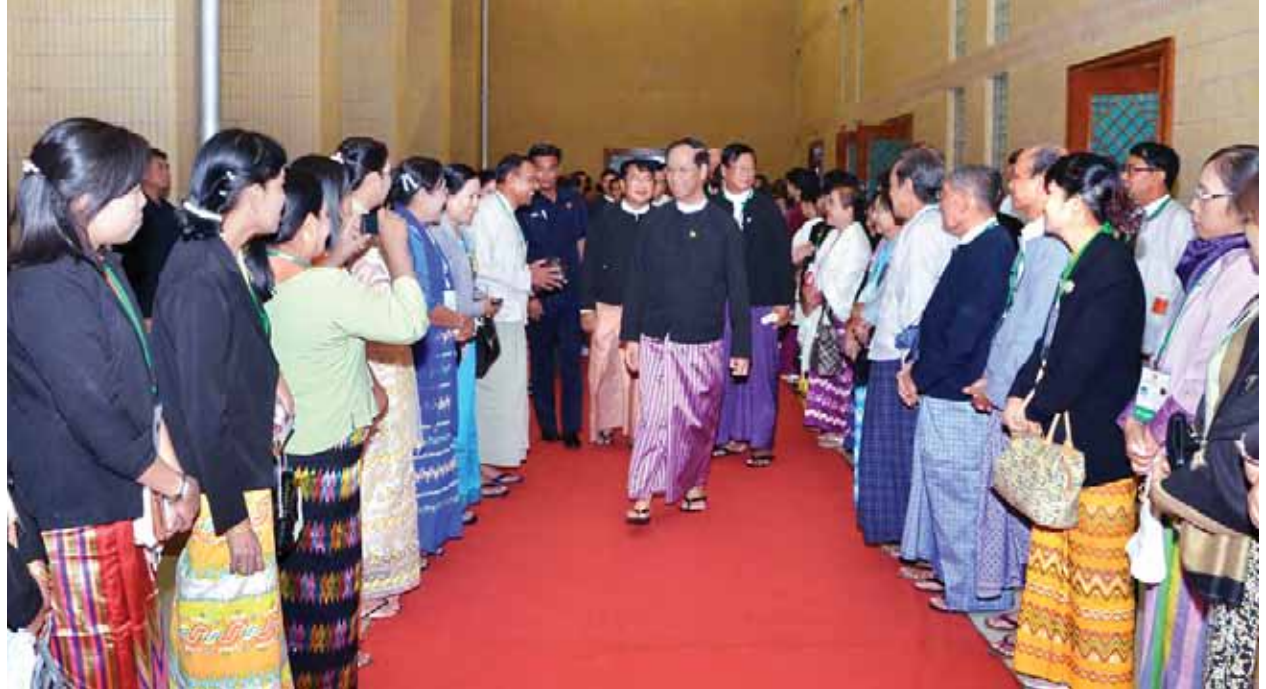
ဒုတိယသမ္မတ ဒေါက်တာစိုင်းမောက်ခမ်း တိုင်းဒေသကြီးနှင့် ပြည်နယ်များမှ တိုင်းရင်းဆေးသမားတော်ကြီးများအား မြန်မာအပြည်ပြည်ဆိုင်ရာ ကွန်ဗင်းရှင်းဗဟိုဌာန(၂)၌ တည်ခင်းစဉ်ခံသည့် ညစာစားပွဲသို့တက်ရောက်စဉ်။

ဆေးပညာရပ်ကို ပဏာမကျန်းမာရေးစောင့်ရှောက်မှုတွင် ကဏ္ဍတစ်ခုအနေဖြင့် ဆောင်ရွက်ပြီး လူတိုင်းလက်လှမ်းမီနိုင်သည့် သာတူညီမျှ ကျန်းမာရေးလွှမ်းခြုံမှုစနစ်တွင် ပါဝင်ဖြည့်ဆည်းပေးရေး ကြိုးပမ်းဆောင်ရွက်ရန်၊ အာဆီယံတိုင်းရင်းဆေးနယ်ပယ်တွင်