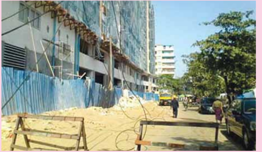
ရန်ကုန်တိုင်းဒေသကြီး အနောက်ပိုင်းခရိုင် အလုံမြို့နယ် ဆင်မင်းရပ်ကွက် ဆင်မင်းလမ်းနှင့် အလုံလမ်းကြားရှိ သိပ္ပံလမ်းအတွင်း၌ ဟောင်းနွမ်းလျက်ရှိသော လျှပ်စစ်ကြိုးများအား ခေတ်မီကာဗာပါရှိသည့် လျှပ်စစ်ကြိုးအသစ်များဖြင့် အလုံမြို့နယ်လျှပ်စစ်အုပ်ချုပ်ရေးမှူး၏ လမ်းညွှန်ချက်အရ လိုက်လံလဲလှယ်ခြင်းများ ဆောင်ရွက်နေကြောင်းသိရသည်။