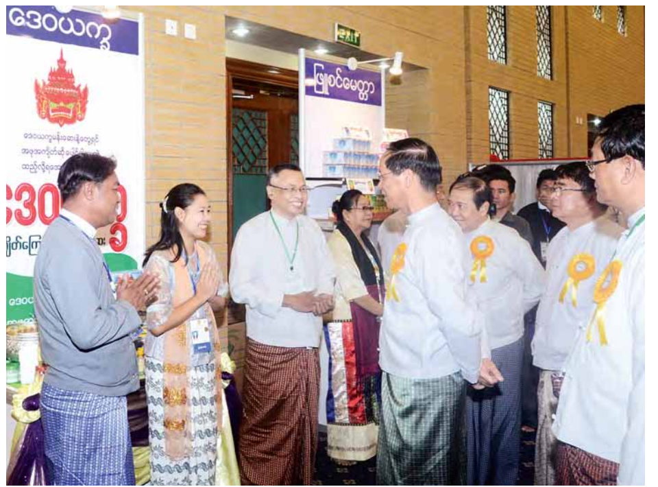
ဒုတိယသမ္မတ ဒေါက်တာစိုင်းမောက်ခမ်း တိုင်းရင်းဆေးသမားတော်များ၏ ထုတ်လုပ်ထားသော တိုင်းရင်းဆေးဝါးများပြသထားသည့်ပြခန်းများကို လှည့်လည်ကြည့်ရှုစဉ်။

ပတ်သက်ပြီး စံချိန်စံညွှန်းများ သတ်မှတ်ခြင်း၊ ဆေးဝါးများ မှတ်ပုံတင်ခြင်းနှင့် ပညာရပ်ဆိုင်ရာ၊ သုတေသနဆိုင်ရာဆောင်ရွက်ခြင်းတို့ကို အဖွဲ့ဝင်နိုင်ငံများနှင့်ဆောင်ရွက်ရပါကြောင်း။ အာဆီယံနိုင်ငံအတွင်းရှိ နိုင်ငံတစ်နိုင်ငံချင်း၊ လူမျိုးတစ်မျိုးချင်း တိုင်းရင်းဆေးများသည် အခြေခံအားဖြင့် မတူညီကြသည့်အတွက် မိမိနိုင်ငံ၏ တိုင်းရင်းဆေးပညာအခြေခံ သီအိုရီများကို မိမိ၏မူပိုင်အဖြစ် ထိန်းသိမ်းကြရမည်ဖြစ်သလို ယင်းအခြေခံသီအိုရီများ ခိုင်မာမှန်ကန်ကြောင်း သက်သေပြရန်မှာလည်း ပညာရှင်များ၏ တာဝန်သာဖြစ်ပါကြောင်း။ မြန်မာ့တိုင်းရင်းဆေးဝါးများ၏ အန္တရာယ်ကင်းရှင်းမှု၊ အရည်အသွေးမီ ကြာရှည်ခံနိုင်မှု၊ အာနိသင်ထက်မြက်မှုများသည် သတ်မှတ် "စ" အတိုင်းမှတ်ကျောက်တင်ခံနိုင်အောင် ကြိုးပမ်းကြမသာ အာဆီယံနိုင်ငံများမှ မြန်မာ့တိုင်းရင်းဆေးဝါးများကို အသိအမှတ်ပြုလာကြမည်ဖြစ်ပါကြောင်း။ ယခုညီလာခံတွင် နယူးလေးပီးထဲမှ အမျိုးအစားအလိုက် လူနာချဉ်းကပ်