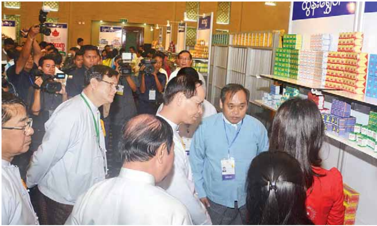
ဒုတိယသမ္မတ ဒေါက်တာစိုင်းမောင်ခမ်း (၁၅)ကြိမ်မြောက် မြန်မာ့တိုင်းရင်းဆေးသမားတော်များ ညီလာခံဖွင့်ပွဲတွင် ခင်းကျင်းပြသထားသည့် တိုင်းရင်းဆေးဝါးများအား လှည့်လည်ကြည့်ရှုစဉ်။