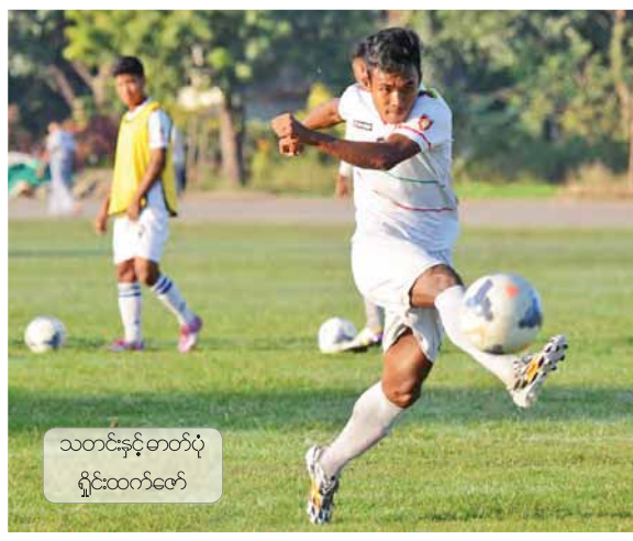
သတင်းနှင့်တော်ပုံ ရှင်းထက်တော်

မန္တလေးတိုင်းဒေသကြီးအစိုးရအဖွဲ့၏ ညွှန်ကြားချက်ဖြင့် မန္တလေးမြို့တော်စည်ပင်သာယာရေးကော်မတီမှ မြရည်နန္ဒာတန်ဖိုးနည်းအိမ်ရာများကို ချထားပေးခဲ့ရာ ဝယ်ယူခွင့်ရရှိသူများအား တိုက်ခန်းနေရာများကို လူကိုယ်တိုင်မဲစနစ်ဖြင့် သတ်မှတ်ရောင်းချပေးခြင်းကို ဒီဇင်ဘာ ၂၂ ရက် နံနက် ၉ နာရီက မန္တလေးမြို့ ချမ်းမြသာစည်မြို့နယ် ၄၈လမ်းနှင့် ယုဒနလမ်းထောင့်ရှိ မြရည်နန္ဒာတန်ဖိုးနည်းအိမ်ရာ(အပေါ်ပုံ) ရှင်းလင်းဆောင်၌ ကျင်းပသည်။ စာမျက်နှာ ၈ ကော်လံ ၅ သို့