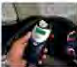
Waiting up phone will