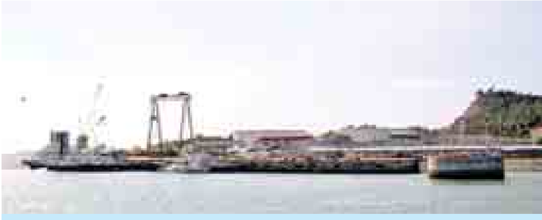
ရခိုင်ပြည်နယ် မခွဲကျွန်းတွင် မကြာမီဖွင့်လှစ်တော့မည့် ရေနံတင်/ချဆိပ်ကမ်းနှင့်သိုလှောင်ကန်များအား တွေ့ရစဉ်။