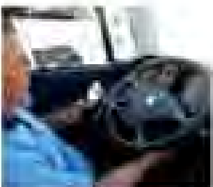
Let's drive safely with Scania technology