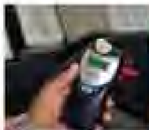
Ready for test, please blow