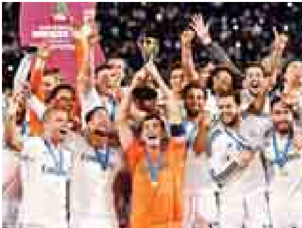
ရေးဖလားနှင့် စပိန်စူပါဖလားတို့ကို ဆွတ်ခူးထားပြီးဖြစ်သည်။ ရိုးယဲလ်မက်ဒရစ်အသင်းသည် ယခုဆန်လော်ရန်ဆိုအသင်းနှင့် ပွဲစဉ်တွင် စီရိုနယ်လီဒို၊ ဘင်ဇီမာ၊ ဘေးလီရိုဒရိုဂက်စ်၊ အစ္စကို၊ မာဆယ်လို့

စပိန်လာလီဂါကလပ် ရိုးယဲလ်မက်ဒရစ်အသင်းသည် မိုနာကိုမြို့ရှိ မာရာကက်ရှ်အားကစားပြိုင်ကွင်း၌ ယှဉ်ပြိုင်ကစားခဲ့သည့် ကလပ်အသင်းများ ကမ္ဘာ့ဖလားနောက်ဆုံး ဗိုလ်လုပွဲတွင် အာဂျင်တီးနားမှ တောင်အမေရိကချန်ပီယံ ဆန်လော်ရန်ဆိုအား နှစ်ဂိုး-ဂိုးမရှိဖြင့် အနိုင်ရရှိခဲ့ပြီးနောက် ကလပ်အသင်းများကမ္ဘာ့ဖလားကို ဆွတ်ခူးနိုင်ခဲ့ပြီဖြစ်သည်။