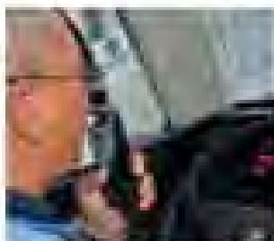
Driver is having trouble through a mobile phone when starting the engine