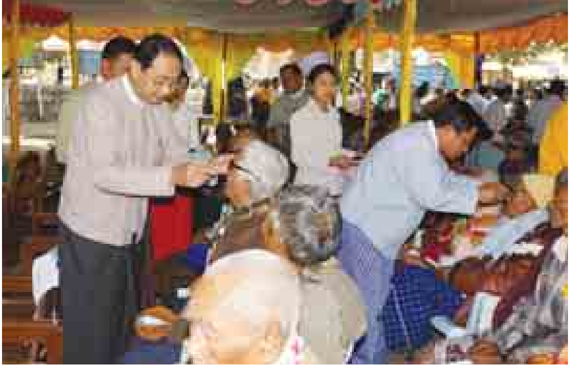
အဖွဲ့(၃)မှ ဆောင်ရွက်လျက်ရှိသော အရှည် ပေ ၃၅၄၀ အရှည်ရှိ အုန်းတောတံတားသို့ ရောက်ရှိ၍ အထူးစီမံကိန်းကြီးအဖွဲ့(၃) တာဝန်ခံ အင်ဂျင်နီယာမှူးကြီးက အုန်းတော တံတားနှင့်ပတ်သက်၍ တည်ဆောက်နေမှု များကို ရှင်းလင်းတင်ပြပြီး တိုင်းဒေသကြီး ဝန်ကြီးချုပ်က တံတားတည်ဆောက်ရေး အတွက် လုံခြုံရေးဘေးအန္တရာယ်ကင်းရှင်း ရေး၊ ပစ္စည်းများအလေအလွင့်မရှိရေး၊ သတ်မှတ်စံချိန်စံညွှန်းနှင့်အညီ အချိန်မီ ပြီးစီးရေးပြောကြားခဲ့ပြီးလုပ်ငန်းခွင်အတွင်း လှည့်လည် ကြည့်ရှုခဲ့သည်။ သန်းစိုစို(ခေ)

ပေါက်မြို့တွင် တိုင်းဒေသကြီးဝန်ကြီးချုပ် ၏ စီစဉ်မှုဖြင့် အလှူရှင်များ၊ တိုင်းဒေသကြီး ဖောင်ဒေးရှင်းနှင့် တိုင်းဒေသကြီး ကျန်းမာရေး ဦးစီးဌာနတို့ ပူးပေါင်းဆောင်ရွက်သော မျက်စိဝေဒနာရှင်များအား အခမဲ့ကုသ ဆောင်ရွက်ပေးခြင်းတွင် အကြီးစားခွဲစိတ် ကုသမှု ၇၅ ဦး၊ အသေးစားခွဲစိတ်ကုသမှု ၃၇ ဦး ဆောင်ရွက်နိုင်ခဲ့ကြောင်း သိရသည်။ ယင်းနောက် တိုင်းဒေသကြီးဝန်ကြီးချုပ် သည် ပေါက်မြို့နယ်တွင် အထူးစီမံကိန်းကြီး