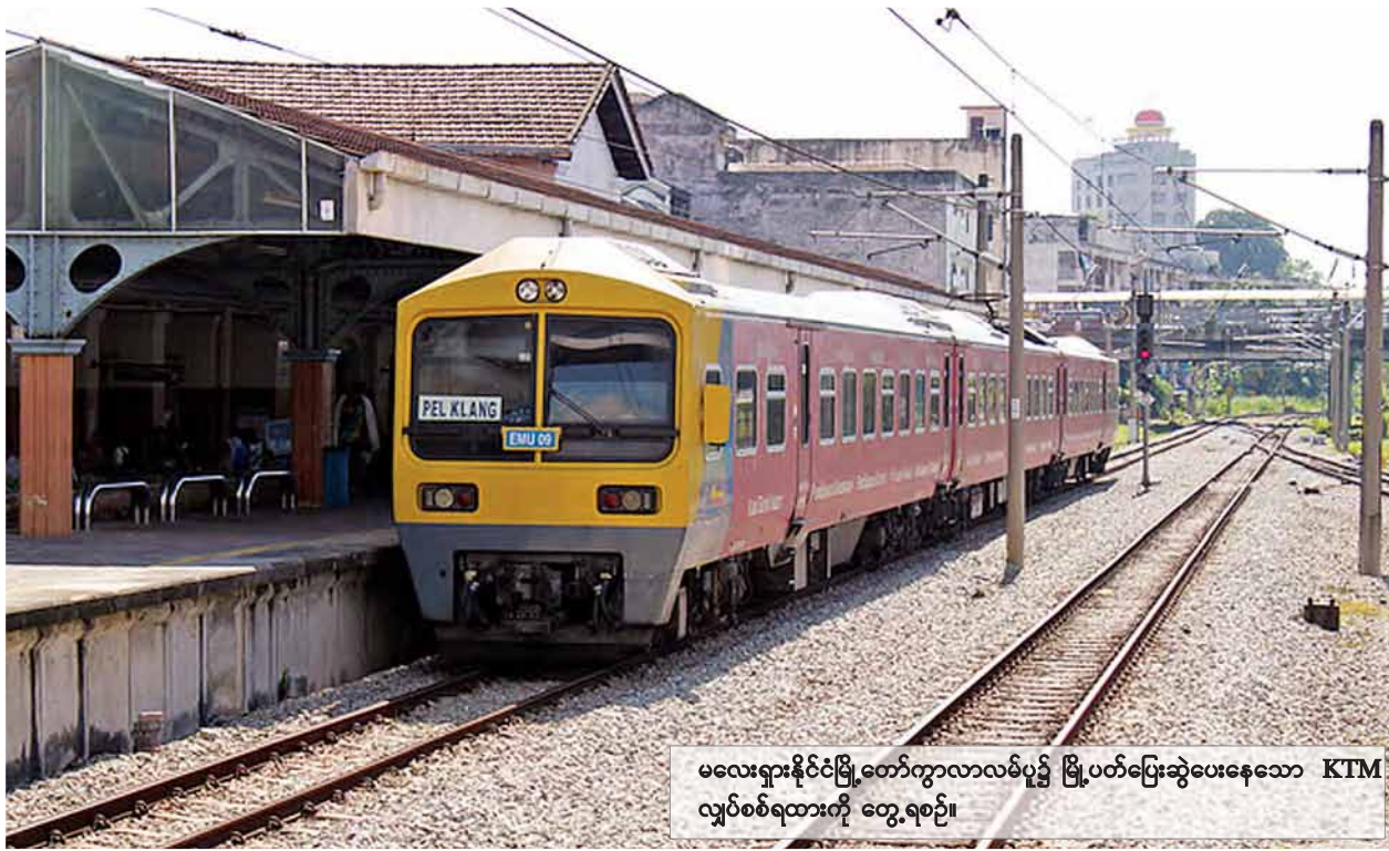
မလေးရှားနိုင်ငံမြို့တော်ကွာလာလမ်ပူ၌ မြို့ပတ်ပြေးဆွဲပေးနေသော KTM လျှပ်စစ်ရထားကို တွေ့ရစဉ်။