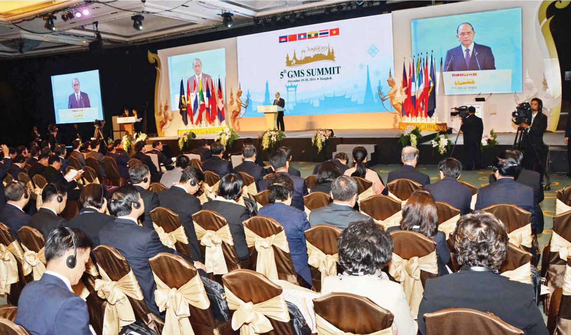
နိုင်ငံတော်သမ္မတ ဦးသိန်းစိန် ပဉ္စမအကြိမ် မဟာမဲခေါင်ဒေသခွဲ စီးပွားရေးပူးပေါင်းဆောင်ရွက်မှု မျက်နှာစုံညီအစည်းအဝေးဖွင့်ပွဲအခမ်းအနားတွင် ပိန့်ခွန်းပြောကြားစဉ်။ (သတင်းစဉ်)

ဘင်္ဂလားပင်လယ်အော်အခြေအနေ ဘင်္ဂလားပင်လယ်အော်တောင်ပိုင်းတွင် တိမ်အသင့်အတင့်မှ တိမ်ထူထပ်နေပြီး ကပ္ပလီပင်လယ်ပြင်နှင့် ကျန်ဘင်္ဂလားပင်လယ်အော်တို့တွင် တိမ်အသင့်အတင့်ဖြစ်ထွန်းနေသည်။