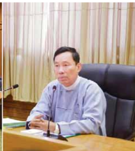
စည်းမျဉ်း(မူကြမ်း)တို့နှင့် စပ်လျဉ်း၍ တင်ပြဆွေးနွေးကြသည်။ ယင်းနောက် ပြည်ထောင်စုလွှတ်တော်နာယက က နိရုံးချုပ်အမှာစကား ပြောကြား၍ အစည်းအဝေးကို ရုပ်သိမ်းလိုက်သည်။ (သတင်းစဉ်)