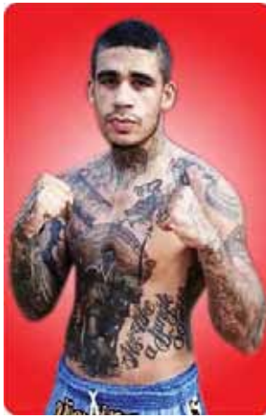
အက်ဝင်(အမေရိကန်)

ရွှေဆုရှင် ရဲမြတ်အောင်(အဖြူရောင်သွေးသစ်)နှင့် ၂၀၁၃ ကမ္ဘာ့လက်တွေ့