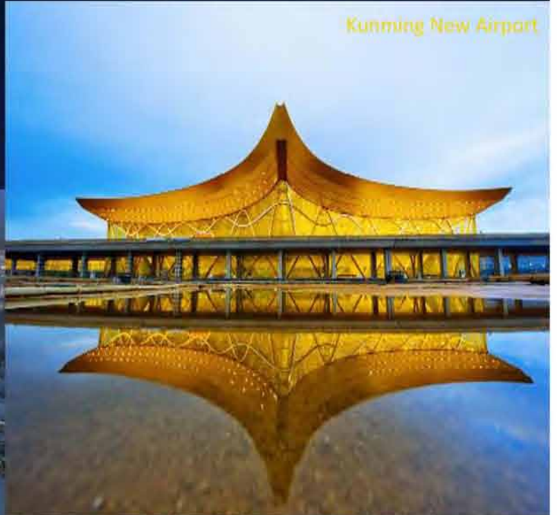
Kunming New Airport