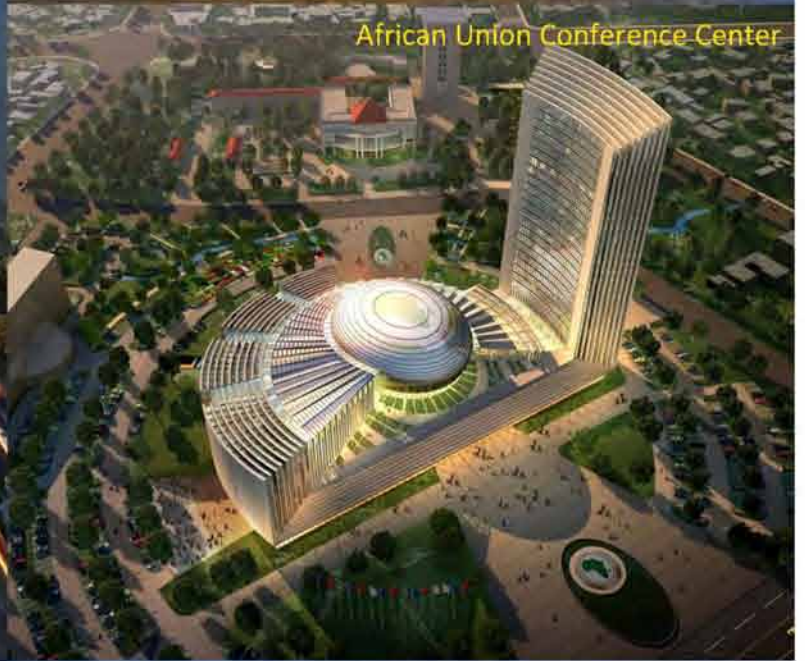
African Union Conference Center

As World's Largest Main Contractor, China State Construction Engineering Corp. Ltd Undertakes the First Project in Myanmar --Polo Club (Asian) Residence Project.