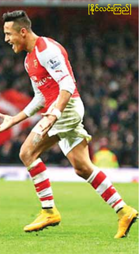
[နိုင်လင်းကြည်]

အာဆင်နယ်အသင်းမှ ခေါ်ယူလိုက်စစ်မှန်အလက်ဇန် ဆန်းချက်င်သည် ပြီးခဲ့သည့် နွေရာသီ အပြောင်းအရွှေ့ကာလအတွင်းက စပိန်ကလပ် ဘာစီလိုနာအသင်းမှ အာဆင်နယ်အသင်းသို့ ပြောင်းရွှေ့ကြားယူရန် ၄၀ သန်းဖြင့် ပြောင်းရွှေ့လာခဲ့သော်လည်း အင်္ဂလန်မြေတွင် စတင်ခြေချခဲ့သည့် ယခုနှစ်ဘောလုံးရာသီတွင် အာဆင်နယ်အသင်းနှင့်အတူ ပွဲပေါင်း ၂၄ ပွဲကစားခဲ့ရာတွင် သွင်းဂိုး ၁၄ ဂိုးအထိ သွင်းယူထားနိုင်ခဲ့ပြီဖြစ်သည်။