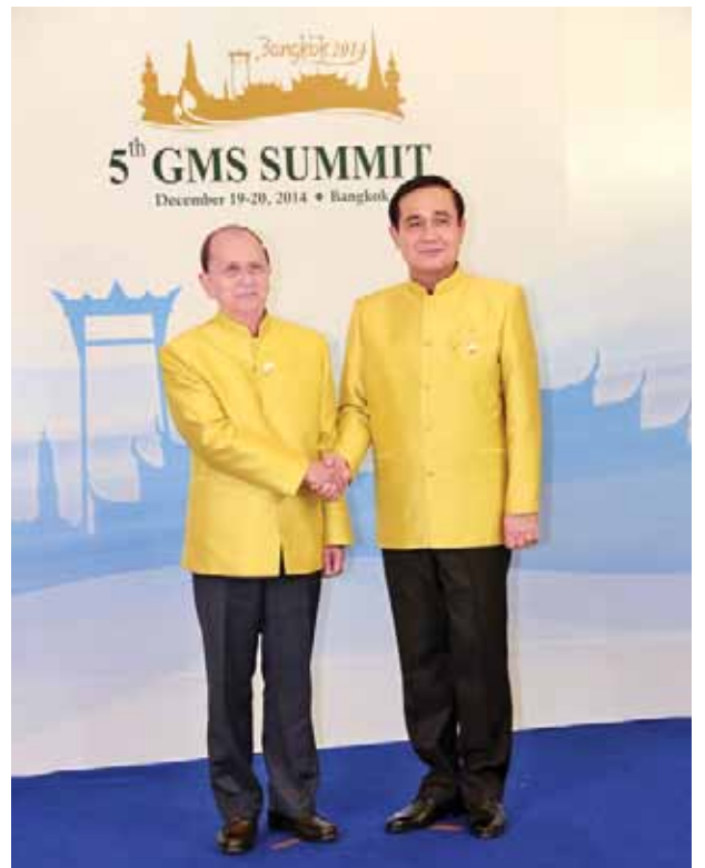
နိုင်ငံတော်သမ္မတ ဦးသိန်းစိန်အား ထိုင်းနိုင်ငံဝန်ကြီးချုပ် ဗိုလ်ချုပ်ကြီး ပရာယွတ် ချန်အိုချာက ရင်းရင်းနှီးနှီးနှုတ်ဆက်စဉ်။ (သတင်းစဉ်)