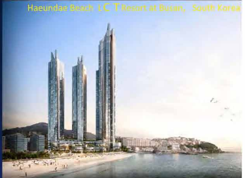
Haeundae Beach LCT Resort at Busan, South Korea

As World's Largest Main Contractor, China State Construction Engineering Corp. Ltd Undertakes the First Project in Myanmar --Polo Club (Asian) Residence Project.