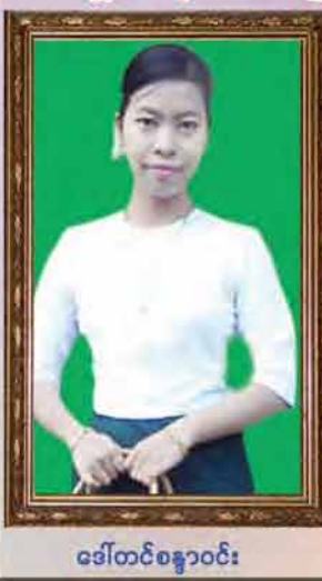
ခေါ်တင်ခန္ဓာဝင်း

www.myanmar.com... Hic Lane No. 28-30000109... 09-25272300-2300-2300