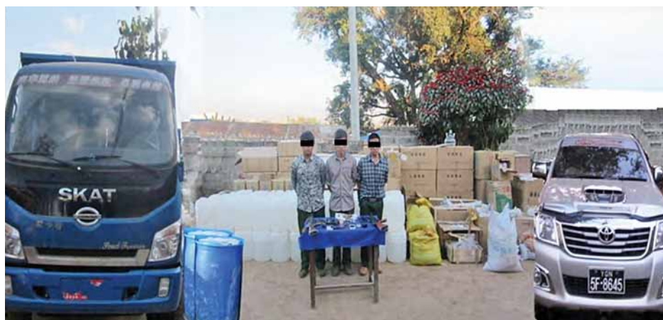
ရှုံ့ကျင်းပူ၊ ရှုံ့တာကျီးနှင့် ရှုံ့တာစေးတို့ သုံးဦးအား သိမ်းဆည်းရမိ မူးယစ်ဆေးဝါးများ၊ ထိန်းချုပ်ဓာတုပစ္စည်းများ၊ လက်နက်ခဲယမ်းများနှင့်အတူ တွေ့ရစဉ်။ (သတင်းစဉ်)