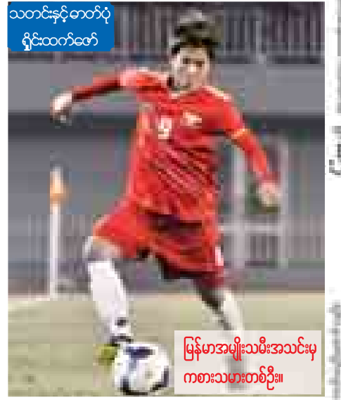
သတင်းနှင့်တတ်ပုံ ရှင်းထက်တော်

မြန်မာနိုင်ငံဘောလုံးအဖွဲ့ချုပ်မှာ ခြေစမ်းပွဲကစားရန်အတွက် အာဆီယံဒေသတွင်း နိုင်ငံများကို လိုက်လံဖိတ်ကြားခဲ့ပြီး ဗီယက်နမ် အမျိုးသမီးကလပ်အသင်းဖြစ်သည့် Ha Nam အသင်းနှင့် သဘောတူညီမှု ရရှိခဲ့သည်။ မြန်မာအမျိုးသမီးအသင်းနှင့် Ha Nam အသင်းတို့၏ ခြေစမ်းပွဲကို ဒီဇင်ဘာ ၂၇ ရက် ညနေ ၅ နာရီတွင် သုဝဏ္ဏကွင်း၌ ကျင်းပသွားမည်ဖြစ်သည်။ Ha Nam အသင်းမှာ ဗီယက်နမ်အမျိုးသမီးလိဂ်ပြိုင်ပွဲတွင် ဒုတိယရရှိထားသည့်အသင်းဖြစ်ရာ မြန်မာအမျိုးသမီးအသင်းအတွက် အကျိုးရှိစေမည်ဖြစ်ပါကြောင်း။