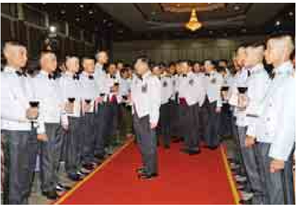
တပ်မတော်ကာကွယ်ရေးဦးစီးချုပ် ပိုလ်ချုပ်မှူးကြီးမင်းအောင်လှိုင် သင်တန်းဆင်းအရာရှိများအား တစ်ဦးချင်းရင်းရင်းနှီးနှီးလိုက်လံနှုတ်ဆက်ပြီး အားပေးစကားပြောကြားစဉ်။ (မြဝတီ)

သင်တန်းဆင်းအရာရှိများ၏ မိဘဆွေမျိုးများ တက်ရောက်ကြသည်။ ရှေးဦးစွာ တပ်မတော်ကာကွယ်ရေးဦးစီးချုပ်ပိုလ်ချုပ်မှူးကြီးမင်းအောင်လှိုင်က သင်တန်းဆင်းအရာရှိများအား တစ်ဦးချင်းရင်းရင်းနှီးနှီး လိုက်လံနှုတ်ဆက်ပြီး အားပေးစကား ပြောကြားသည်။ ထို့နောက် တပ်မတော်ကာကွယ်ရေးဦးစီးချုပ်နှင့်အဖွဲ့ဝင်များသည် သင်တန်းဆင်းအရာရှိများ၊ မိဘဆွေမျိုးများနှင့်အတူ ညစာသုံးဆောင်ကြသည်။ သင်တန်းဆင်းဂုဏ်ပြုညစာစားပွဲအပြီးတွင် ပိုလ်ချုပ်မှူးကြီး မင်းအောင်လှိုင်နှင့်အဖွဲ့ဝင်များသည် ဘွဲ့နှင့်သဘင်ခန်းမဆောင်၌ မြဝတီတေးဂီတနှင့် အငြိမ့်အဖွဲ့၏ဖျော်ဖြေတင်ဆက်မှုများကို ကြည့်ရှုအားပေးခဲ့ကြကြောင်း သတင်းရရှိသည်။ (မြဝတီ)