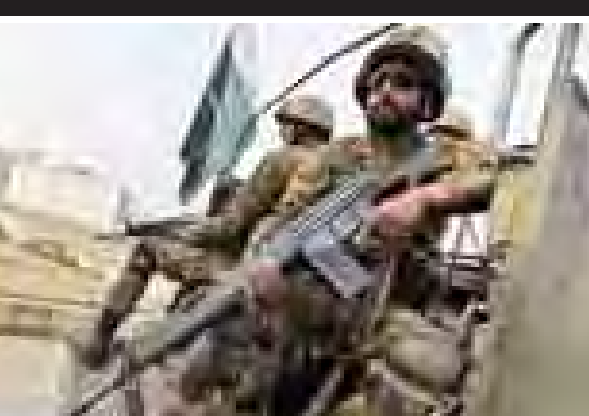
အစွလာမ္မာဘတ် ဒီဇင်ဘာ ၁၉

အာဖဂန်နစ္စတန်နိုင်ငံနှင့် နယ်စပ်ဒေသအနီးရှိ တာလီဘန်တပ်ဖွဲ့များအား ပါကစ္စတန်တပ်ဖွဲ့များက မြေပြင်နှင့် လေကြောင်းတို့မှ တိုက်ခိုက်ချေမှုန်းခဲ့ရာ တာလီဘန်စစ်သွေးကြွ ၅၇ ဦး သေဆုံးသွားကြောင်း ပါကစ္စတန်စစ်ဘက်က ဒီဇင်ဘာ ၁၉ ရက်တွင် ပြောကြားသည်။