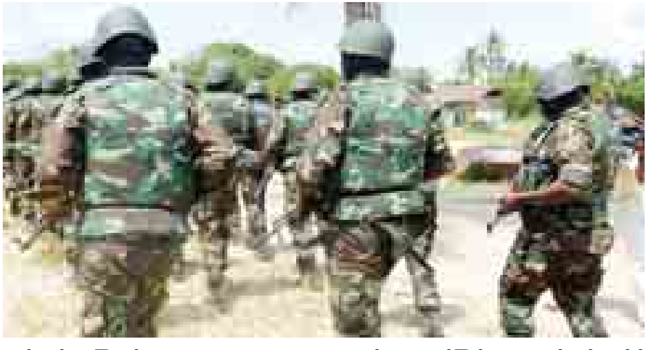
သည်ဟု သိထားကြသည်။ ၂၀၀၉ခုနှစ်ကစပြီး ဘိုကိုဟာရမ်များက အစွလာမ္မစ်နိုင်ငံတည်ထောင်ရန် စစ်ဆင်ရေးများ ဆင်နွှဲခဲ့ပြီး ထိုစစ်ပွဲများကြောင့် လူ့ဝေဒနာဆုံးခဲ့ရကြောင်း လူ့အခွင့်အရေး စောင့်ကြည့်ရေး အဖွဲ့ကဆိုသည်။ အဆိုပါ ငါးနှစ်ကြာစစ်ပွဲကြောင့် လူပေါင်း ၁ ဒသမ ၃ သန်း နေရပ်စွန့်ခွာထွာခွာနေကြရသည်။ စတိုင်းနယူးစ်။

စစ်သားများအား လက်နက်လုံလုံလောက်လောက် ပေးထားကြောင်း ကာကွယ်ရေးအရာရှိများက ဆိုသည်။ သမ္မတတို့နုသန်က ယခုနှစ်အစောပိုင်းတွင် နိုင်ဂျီးရီးယားစစ်တပ်အား အဆင့်မြှင့်တင်ရန် ဒေါ်လာ ၁ ဘီလီယံ ချေးငွေရယူနိုင်ရန် ကြိုးပမ်းခဲ့ကြောင်း သိရသည်။ ဘိုကိုဟာရမ်များသည် လက်နက်အင်အားတောင့်တင်း