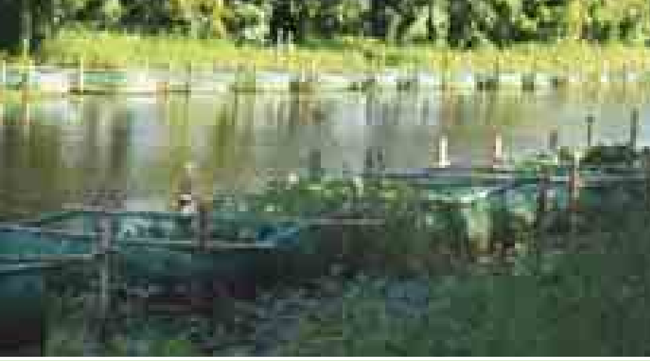
မအူပင်မြို့နယ်၌ ငါးရှဉ့်အသားတိုး စမ်းသပ်သုတေသနပြုမွေးမြူထားသည့် ခြင်ထောင်ကန်များအားတွေ့ရစဉ်။

သုတေသနပြု စမ်းသပ်မွေးမြူရာတွင် ရေကန်အတွင်း ခြောက်ပေပတ်လည် အနက် သုံးပေ ဇာခြင်ထောင်များကို ရေပေါ်တစ်ပေ၊ ရေအောက်နှစ်ပေအမြင့်ချန်၍ ခြင်ထောင်တစ်လုံးတွင် ခုနစ်ပိဿာနှင့် ၁၀ ပိဿာကြား