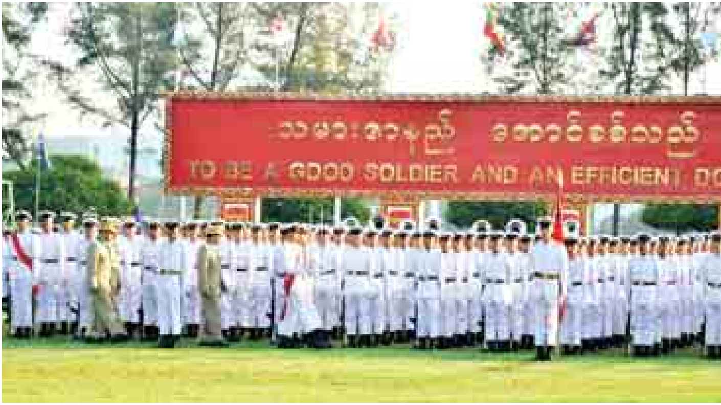
တပ်မတော်ကာကွယ်ရေးဦးစီးချုပ် ဗိုလ်ချုပ်မှူးကြီးမင်းအောင်လှိုင် ကျောင်းဆင်းခိုလ်လောင်းတပ်ခွဲများကို စစ်ဆေးစဉ်။