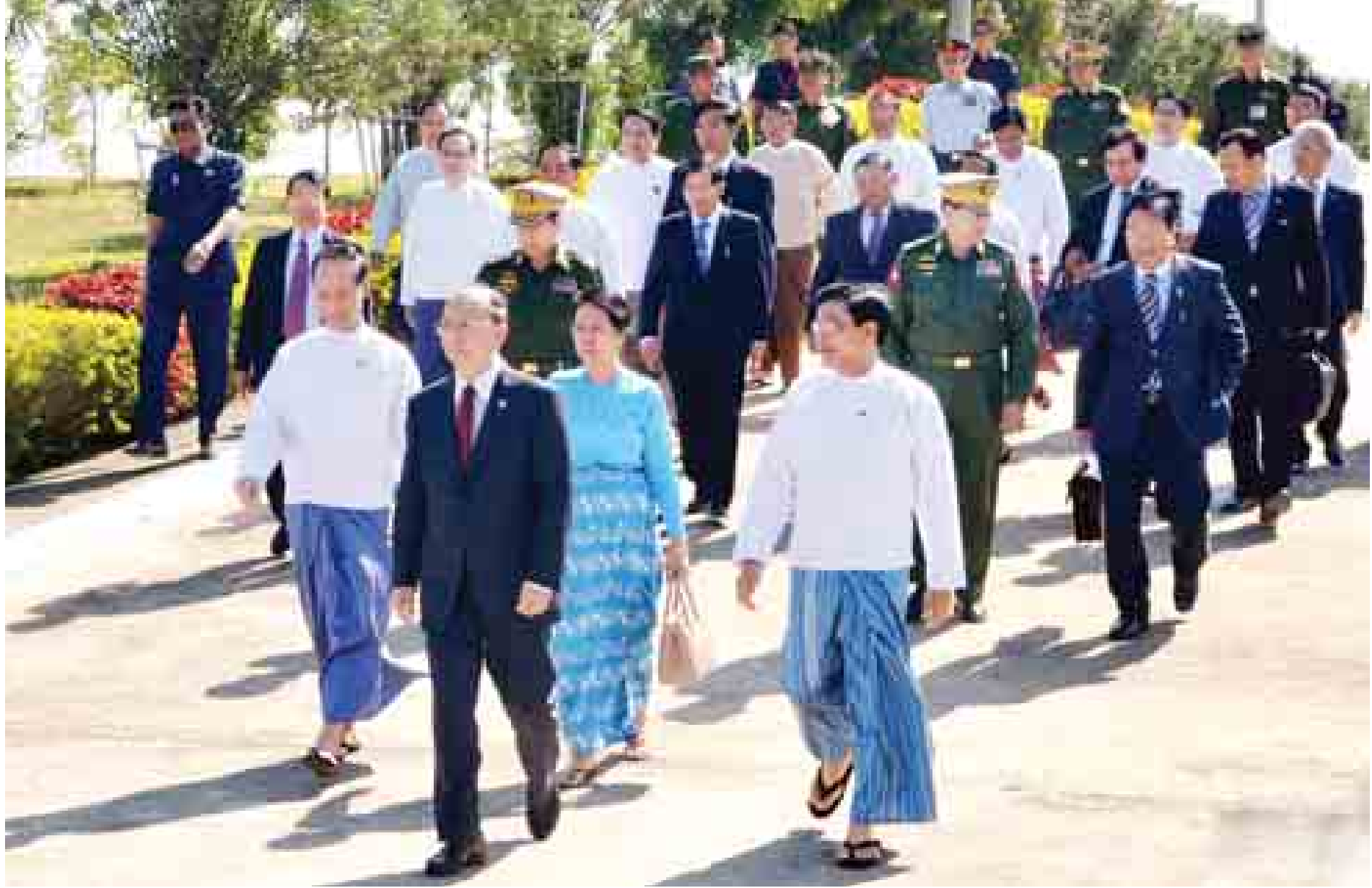
နေပြည်တော် ဒီဇင်ဘာ ၁၉

ပြည်ထောင်စုသမ္မတမြန်မာနိုင်ငံတော် နိုင်ငံတော်သမ္မတ ဦးသိန်းစိန်နှင့် ဇနီး ဒေါ်ခင်ခင်ဝင်း ဦးဆောင်သည့် ကိုယ်စားလှယ်အဖွဲ့သည် ထိုင်းနိုင်ငံ ဗန်ကောက်မြို့၌ ကျင်းပမည့် (၅)ကြိမ်မြောက် ဂျီအမ်အက်စ်ထိပ်သီးအစည်းအဝေးတက်ရောက်ရန်အတွက် ယနေ့မုန်းတည့် ၁၂ နာရီတွင် နေပြည်တော်အပြည်ပြည်ဆိုင်ရာလေဆိပ်မှ ထွက်ခွာသွားသည်။ ထိုသို့ထွက်ခွာစဉ် နိုင်ငံတော်သမ္မတ ဦးသိန်းစိန်နှင့် ဇနီး ဒေါ်ခင်ခင်ဝင်းနှင့်အဖွဲ့အား ဒုတိယသမ္မတ ဒေါက်တာစိုင်းမောင်ခမ်းနှင့် ဦးဉာဏ်ထွန်း၊ ဒုတိယတပ်မတော်ကာကွယ်ရေးဦးစီးချုပ် ကာကွယ်ရေးဦးစီးချုပ်(ကြည်း) ဒုတိယဗိုလ်ချုပ်မှူးကြီးစိုးဝင်း၊ ပြည်ထောင်စုဝန်ကြီးများ၊ ပြည်ထောင်စုသမ္မတမြန်မာနိုင်ငံဆိုင်ရာ ထိုင်းနိုင်ငံသံရုံးမှ