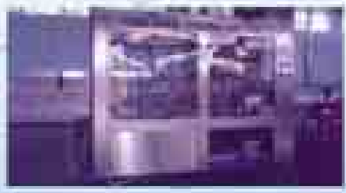
6 Bottle, 12 Bottle Shrinkage Machine RO 30000 GPD 20 liter Auto Filling 1 liter Auto Filling 4000 l/hr

ရန်ကင်း - အမှတ်(၄) - ၂၀ / ၂၂၊ နယ်သာ ကိုလမ်း၊ တွင်းရေအောင် ဂိမ်းရုံတန်း၊ မရမ်းကုန်း၊ ဩ-နယ်၊ မုန်-၆၈ ၂၄၃၊ ၆၈ ၂၅၈၊ ၆၈၆၀၃၊ ၆၈၆၀၄ မန္တလေး - ၀၂-၃၄၅၇၀၊ ၆၈၆၂၆၊ ၀၂-၅၅၅၅၅၅၅၅၊ ၀၅-၅၀၀၀၀၀၀၀၀၊ ၀၅-၅၀၀၀၀၀၀၀၀ နေပြည်တော် - ၀၆၅-၄၂၈၀၄၅၊ ၀၅-၄၅၂၀၀၀၀၀၊ ၀၅-၄၅၂၀၆၀၀၀