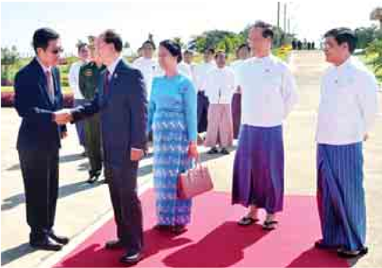
နိုင်ငံတော်သမ္မတ ဦးသိန်းစိန်အား မြန်မာနိုင်ငံဆိုင်ရာ ထိုင်းနိုင်ငံသံရုံးမှတာဝန်ရှိသူက လေဆိပ်၌ ပို့ဆောင်နှုတ်ဆက်စဉ်။ (သတင်းစဉ်)