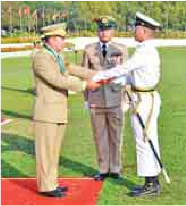
တပ်မတော်ကာကွယ်ရေးဦးစီးချုပ် ဗိုလ်ချုပ်မှူးကြီး သရေစည်သူမင်းအောင်လှိုင် ထူးချွန်ဆုရရှိသူ ဗိုလ်လောင်းတစ်ဦးအား ဆုပေးအပ်ချီးမြှင့်စဉ်။

ယနေ့နိုင်ငံတော်ရှေ့ဆက်လျှောက်လှမ်းရမည့် လမ်းကြောင်းခိုင်မာရန်အတွက် တည်ငြိမ်အေးချမ်းရေး၊ စည်းလုံးညီညွတ်ရေးနှင့် ဖွံ့ဖြိုးတိုးတက်ရေးသည် အရေးကြီးသည့်အတွက် တပ်မတော်က အမျိုးသားရေးမှအနေဖြင့် ခံယူအကောင်အထည်ဖော်ဆောင်ရွက်လျက်ရှိကြောင်း၊ ပြည်ထောင်စုတပ်မတော်ဖြစ်သည်နှင့်