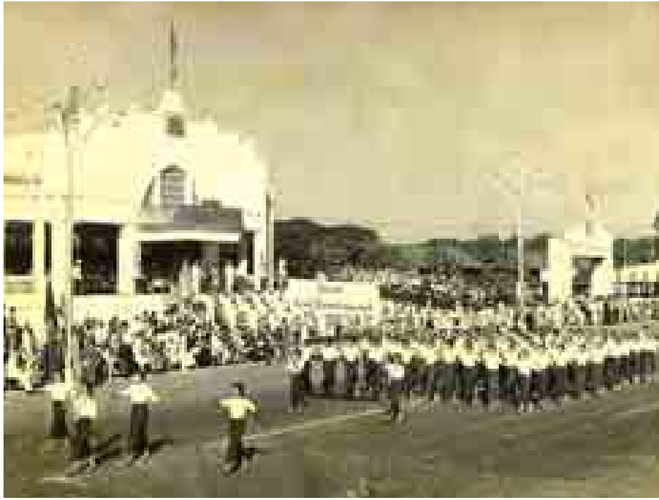
၁၉၅၉ ခုနှစ် လွတ်လပ်ရေးနေ့ အခမ်းအနားတွင် သမ္မတကြီး မန်းဝင်းမောင်အား စံပြုအမျိုးသမီးအထက်တန်းကျောင်းမှ ချီတက်အလေးပြုနေစဉ်။

ပုံမှန်အားဖြင့် နိုင်ငံတော်သမ္မတကြီး ဦးစိုးမောင်နှင့်ဇနီးတို့သည် ဝန်ကြီးချုပ် ဦးနုနှင့်ဇနီးတို့နှင့်အတူ သမ္မတအတွင်းဝန်၊ အိမ်တော်ဝန်များနှင့် သမ္မတကိုယ်ရံတော်ဗိုလ်ကြီးများခြံရံလျက် မြင်းတပ်ဖွဲ့နှင့် မော်တော်ဆိုင်ကယ်တပ်ဖွဲ့များခြံရံလျက် လင့်ခ်လမ်း(ယခုရွှေဂုံ