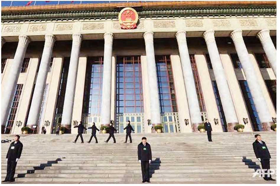
ကို ကြည့်ရှုနိုင်မည်ဖြစ်သည်။ သည်အချိန်မှစပြီး ပါတီ၏အကျင့်ပျက်ခြစားမှုတိုက်ဖျက်ရေး နှစ်နှစ်အကြာက သမ္မတ ရှီကျင့်ဖျင်အာဏာရလာ လှုပ်ရှားမှုကို စတင်ခဲ့ကြောင်းသိရသည်။

စုံစမ်းစစ်ဆေးရေးသမားများအနေဖြင့် အဆင့်မြင့် အရာရှိကြီးများ၏ အကျင့်ပျက်မှုများကို စုံစမ်းစစ်ဆေးရမည်ဖြစ်ပြီး အရာရှိကြီးများ၏ ပုဂ္ဂိုလ်ရေးအချက်အလက်များ၊ မိသားစု၊ ပိုင်ဆိုင်မှုနှင့်လုပ်ဆောင်ချက်မှတ်တမ်းများ