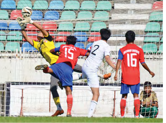
ဧရာဝတီအသင်းဘက်သို့ တိုကျိုတက္ကသိုလ်(က)အသင်း ဂိုးသွင်းရန် ကြိုးပမ်းနေစဉ်။

(ဒုတိယပွဲ) တိုကျိုတက္ကသိုလ်(ခ)-ငါးဂိုး နည်းပညာတက္ကသိုလ် ညွန့်ပေါင်း-တစ်ဂိုး တိုကျိုတက္ကသိုလ်(က)အသင်းနှင့် (ခ) အသင်းမှာ ဒီဇင်ဘာ ၁၁နှင့် ၁၂ ရက်တို့တွင် ခြေစမ်းပွဲလေးပွဲယှဉ်ပြိုင်ကစားခဲ့ရာ သုံးပွဲနိုင်၊ တစ်ပွဲသာရကျခဲ့သည်။