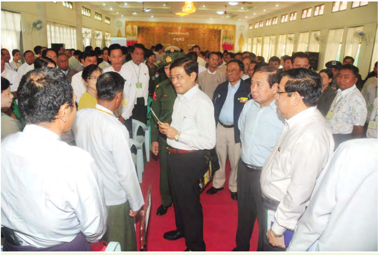
ဒုတိယသမ္မတ ဦးညွှန်ထွန်း ဒေသခံတောင်သူများအား ရင်းရင်းနှီးနှီး နှုတ်ဆက်စဉ်။ (သတင်းစဉ်)

ရေရှည်အတွက် ဒေသကြီးတစ်ခုလုံး ဖွံ့ဖြိုးတိုးတက်လာစေရန် နှစ်တို၊ နှစ်ရှည်စီမံချက်များ ချမှတ်ကာ တစိုက်မတ်မတ် ဆောင်ရွက်ပေးသွားကြရမည် ဖြစ်ပါကြောင်း။