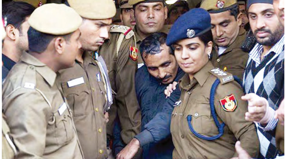
ပြစ်မှုကျူးလွန်ခဲ့သည့် ယာဉ်မောင်းအား ရုံးထုတ်လာစဉ်။

အွန်လိုင်းမှ အလုပ်လက်ခံပြီး မှတ်ပုံတင်ထားသော မည်သည့်ပို့ဆောင်ရေးလုပ်ငန်းမဆိုနှင့် တက္ကစီဝန်ဆောင် မှုလုပ်ငန်းများအားလုံးကို ပို့ဆောင်ရေးဌာနမှ ခွင့်ပြုချက် (သို့) လုပ်ငန်းလိုင်စင်တစ်ခုခုရရှိမှသာ လုပ်ငန်းလည်ပတ် ခွင့်ပြုမည်ဖြစ်ကြောင်း ဒေလီပို့ဆောင်ရေးဌာန ဒုတိယ