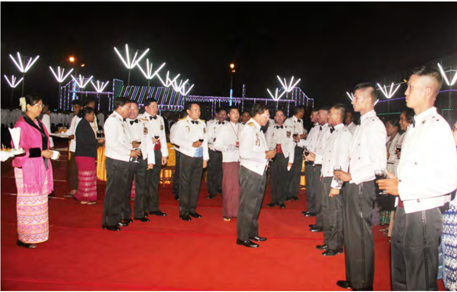
တပ်မတော်ကာကွယ်ရေးဦးစီးချုပ် ဗိုလ်ချုပ်မှူးကြီး မင်းအောင်လှိုင် ကျောင်းဆင်းဗိုလ်လောင်းများအား ရင်းရင်းနှီးနှီးလိုက်လံနှုတ်ဆက်စဉ်။