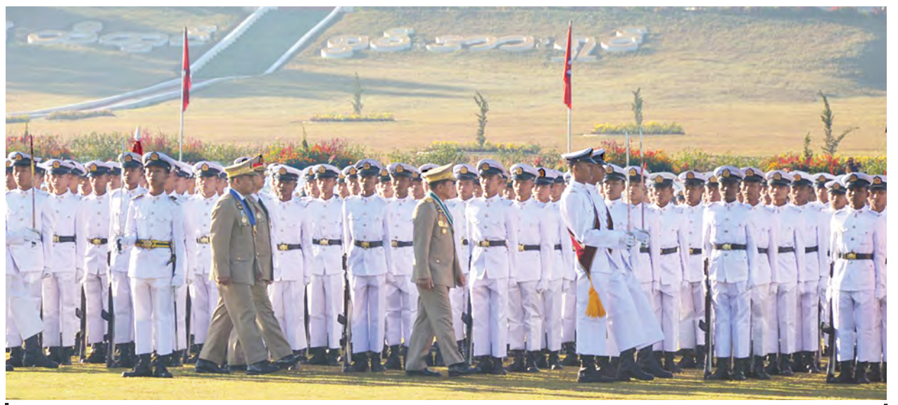
တပ်မတော်ကာကွယ်ရေးဦးစီးချုပ် ဗိုလ်ချုပ်မှူးကြီးမင်းအောင်လှိုင် တပ်မတော်နည်းပညာတက္ကသိုလ် ဗိုလ်လောင်းသင်တန်းအမှတ်စဉ်(၁၇) သင်တန်းဆင်း ဂုဏ်ပြုစစ်ရေးပြအခမ်းအနားတွင် ကျောင်းဆင်းဗိုလ်လောင်းတပ်ခွဲများအား စစ်ဆေးစဉ်။

ကျင်ပြီးပညာရပ်များကို အတွေ့အကြုံ များနှင့် ပေါင်းစပ်ကာ လက်တွေ့ လုပ်ငန်းများတွင် စနစ်တကျလိုက်နာ ကျင့်သုံးတီထွင်နိုင်မှု စွမ်းပကားများ တိုးတက်ရရှိလာမည် ဖြစ်ကြောင်း၊ “ကျင့်ဝတ်၊ တီထွင်၊ စွမ်းအားရှင်” ဆိုသည့် တပ်မတော်နည်းပညာ တက္ကသိုလ်၏ လမ်းညွှန်ဆောင်ပုဒ် အတိုင်း အရာရာကိုတီထွင်ဖန်တီးလို သည့်စိတ်ကူးစိတ်သန်းဖြင့် လက်တွေ့ အကောင်အထည်ဖော်နိုင်သည့် စွမ်း ရည်များရှိရမည်အပြင် တီထွင်ဖန်တီးမှု ရလဒ်များကိုလည်း ကိုယ်ကျင့်တရား ကျင့်ဝတ်နှင့်အညီ လူ့ဘောင်လောက ကို ကောင်းကျိုးဖြစ်ထွန်းအောင် အသုံးချနိုင်ရမည်ဖြစ်ကြောင်း။ မိမိတို့တပ်မတော်၏ အဓိက တာဝန်ဖြစ်သည့် နိုင်ငံတော်ကာကွယ်ရေး တာဝန်ကို ကာကွယ်စောင့်ရှောက်ရန်၊ တော်ကို ကာကွယ်စောင့်ရှောက်ရန်၊ ခွဲတာဝန်အရေးသုံးပါးကို ကာကွယ် စောင့်ရှောက်ရန်၊ ပြည်သူ့လူထုအကျိုး ကို ကာကွယ်စောင့်ရှောက်ရန်နှင့် ဖွံ့စည်းပုံအခြေခံဥပဒေကို ကာကွယ် စောင့်ရှောက်ရန် လိုအပ်ကြောင်း၊ တိုင်းပြည်ဖွံ့ဖြိုးတိုးတက်ရန်အတွက် ဆိုလျှင် တည်ငြိမ်အေးချမ်းရေးသည် အလွန်အရေးကြီးကြောင်း၊ တည်ငြိမ် အေးချမ်းမှုရှိမှသာ တိုင်းရင်းသား အချင်းချင်းတီထွင်ဆက်ဆံမှု ပိုမို များပြားလာပြီး တိုင်းရင်းသားစည်းလုံး ညီညွတ်မှုကို ဖော်ဆောင်နိုင်မည်ဖြစ် သကဲ့သို့ နိုင်ငံရေးအရ စုစည်းညီညွတ် မှုကိုလည်း တည်ဆောက်နိုင်မည်ဖြစ် ကြောင်း၊ ထိုကဲ့သို့ တည်ငြိမ်အေးချမ်းမှု၊ နိုင်ငံရေးအရ စုစည်းညီညွတ်မှုများရှိလာလျှင် စီးပွား ရေးစွမ်းအားများ ဖော်ဆောင်နိုင်ပြီး ဆောင်ရွက်သွားကြရန်လိုကြောင်း။ ယခု သင်ကြားပေးလိုက်သည့် ပညာရပ်များသည် အခြေခံသီရိရိ မျှသာဖြစ်ပြီး ဆက်လက်လေ့လာ သုတေသနပြုရန် လိုအပ်သကဲ့သို့ လေ့လာရရှိသည့် ပညာရပ်များကို ကျွမ်းကျင်မှုရှိအောင် လေ့ကျင့်ရန် လည်း လိုအပ်ကြောင်း၊ ထိုသို့ကျွမ်း