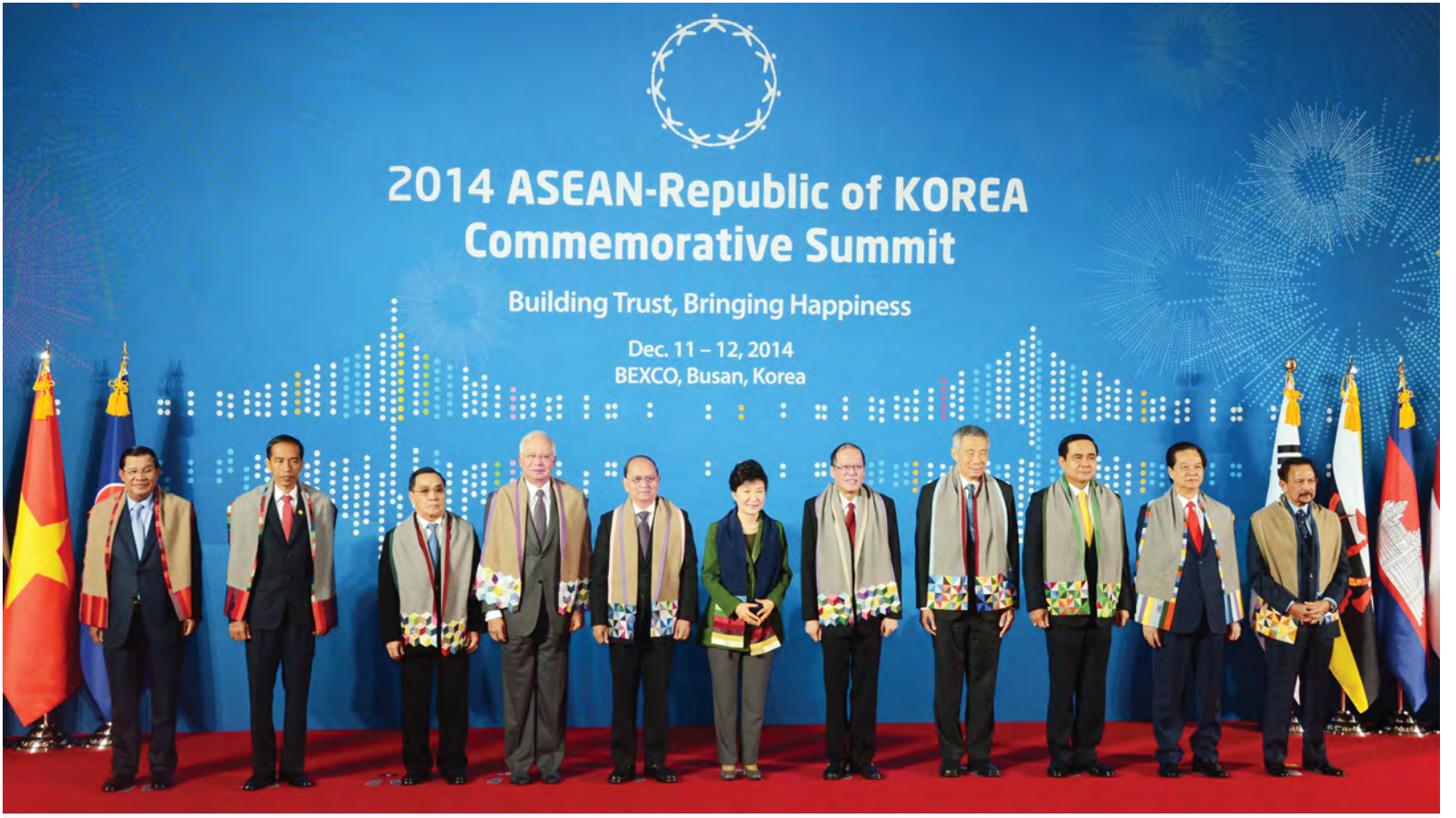
အာဆီယံ-ကိုရီးယားဆက်ဆံရေးအထိမ်းအမှတ် ထိပ်သီးအစည်းအဝေးသို့ တက်ရောက်လာသော နိုင်ငံခေါင်းဆောင်များ စုပေါင်းမှတ်တမ်းတင်ဓာတ်ပုံရိုက်ကြစဉ်။

အပြန်အလှန်ယုံကြည်မှု၊ လေးစားမှုနှင့် ဘက်စုံပူးပေါင်းဆောင်ရွက်မှုတို့ အပေါ် အခြေပြုပြီး အနှစ်သာရပြည့်ဝသည့် အောင်မြင်မှု၊ တိုးတက်မှုများနှင့်အတူ ရင့်ကျက်လာသည်ကို မြင်တွေ့ရ သည့်အတွက် အားရမိပါကြောင်း၊ ယခုနှစ်သည် ကိုရီးယားသမ္မတနိုင်ငံမှ အာဆီယံဒေသတွင်းဖိုရမ်ကို ဝင်ရောက် ခဲ့သော နှစ်(၂၀)ပြည့်အထိမ်းအမှတ် နှင့် အရှေ့တောင်အာရှချစ်ကြည်ရေး နှင့် ပူးပေါင်းဆောင်ရွက်ရေးစာချုပ်သို့ ဝင်ရောက်ခဲ့သော (၁၀)နှစ်ပြည့် အထိမ်းအမှတ်တို့နှင့် တိုက်ဆိုင်နေ သည့်အတွက် အာဆီယံ-ကိုရီးယား ဆွေးနွေးပတ်ဆက်ဆံရေးတွင် ထူးခြား သည့် နှစ်တစ်နှစ်ဖြစ်ပါကြောင်း။ ထိပ်သီးအစည်းအဝေး၏ဆောင်ပုဒ် နှင့်အညီ “ယုံကြည်မှုတည်ဆောက် ခြင်း၊ ပျော်ရွှင်မှုဖော်ဆောင်ခြင်း”တို့၏ အရေးပါမှုကို အလေးအနက်ထားရန် ပြောကြားလိုပါကြောင်း၊ ယုံကြည်မှု သည် ငြိမ်းချမ်းရေးအတွက် အဖိုး တန်ပြီး ရေရှည်တည်တံ့သည့်ပျော်ရွှင် မှု၊ ချစ်ကြည်ရင်းနှီးမှုနှင့် ပူးပေါင်း ဆောင်ရွက်ရေးတည်ဆောက်ရေး အတွက် မရှိမဖြစ်လိုအပ်သည်ဟု ယုံကြည်ပါကြောင်း။