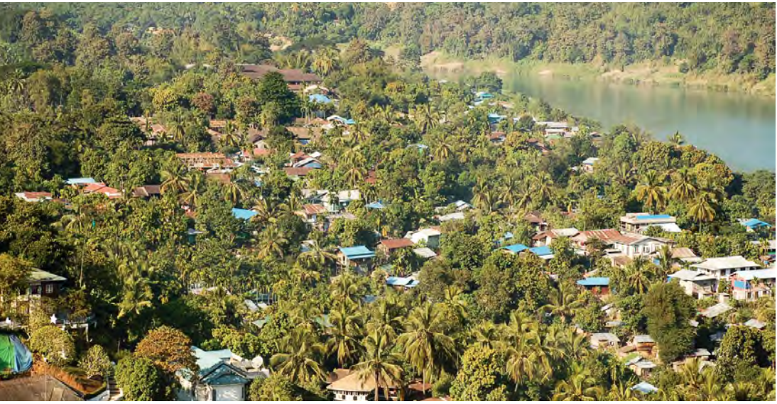
ပလက်ဝမြို့အား အပေါ်စီးမှ မြင်ရစဉ်။

သတင်း-နေလင်း(သတင်းစဉ်) ❖ စာတိုပုံ-မင်းသစ် ချင်းပြည်နယ်တောင်ပိုင်း ပလက်ဝမြို့သည် ဧရိယာ စတုရန်းမိုင် ၃၁၂၇ ဒသမ ၀၄ ကျယ်ဝန်းပြီး ရပ်ကွက် ခြောက်ခု၊ ကျေးရွာအုပ်စု ၉၆ အုပ်စုနှင့် ကျေးရွာပေါင်း ၃၈၅ ရွာရှိကာ လူဦးရေ ကိုးသောင်းကျော်နေထိုင်ပြီး အိန္ဒိယနိုင်ငံ၊ ဘင်္ဂလားဒေ့ရှ်နိုင်ငံတို့နှင့် နယ်နိမိတ်ချင်း ထိစပ်လျက်ရှိသည်။ ပလက်ဝမြို့တွင် ချင်းတိုင်းရင်းသား ခုမီးလူမျိုး အများဆုံးနေထိုင်ပြီး ရခိုင်၊ ဗမာ၊ အနုခေါင်စို့၊ လီခန်၊ မတူ၊ မာရာနှင့် မြို(ခေါ်)ခမိ လူမျိုးများနေထိုင်ကြကာ တောင်ယာလုပ်ငန်းကို အဓိကထား လုပ်ကိုင်ကြသည်။ တောတောင်ထူထပ်ပြီး လမ်းပန်းဆက်သွယ်ရေးခက်ခဲ လှသည့် ပလက်ဝမြို့နယ်တွင်နေထိုင်သည့် ဒေသခံပြည်သူ များသည် ကုလားတန်မြစ်ကြောင်းမှ စက်တပ်သမ္မန်များကို အသုံးပြုကာ ဒေသထွက်ကုန်များကိုရောင်းချရန် ကျောက် တော်မြို့မှတစ်ဆင့် အခြားမြို့နယ်များသို့ ဖြန့်ဖြူးရောင်းချ ရကြောင်းသိရသည်။ စာမျက်နှာ ၁၀ ကော်လံ ၅ သို့ ✪