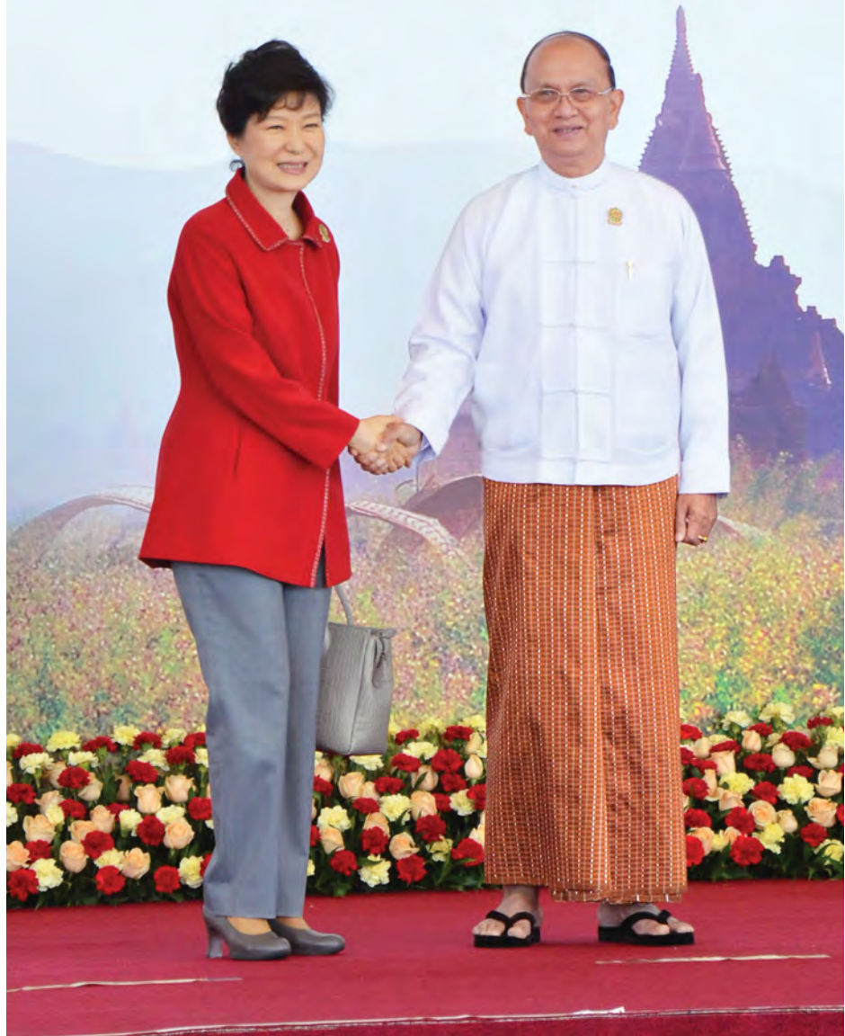
၂၀၁၄ ခုနှစ် နိုဝင်ဘာ ၁၃ ရက်က နိုင်ငံတော်သမ္မတ ဦးသိန်းစိန် (၉)ကြိမ်မြောက် အရှေ့အာရှထိပ်သီးအစည်းအဝေးသို့တက်ရောက်လာသော တောင်ကိုရီးယားသမ္မတနိုင်ငံ သမ္မတ မဒမ်ပတ်ဂွန်ဟေးအား ကြိုဆိုနှုတ်ဆက်စဉ်။ (သတင်းစဉ်)