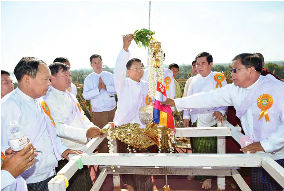
တပ်မတော်ကာကွယ်ရေးဦးစီးချုပ် ဗိုလ်ချုပ်မှူးကြီးမင်းအောင်လှိုင်နှင့်အဖွဲ့ဝင်များ ရတနာစိန်ဖူးတော်အား တရော်ကင်ပွန်းရည်၊ ရေစင်ရေသန့်များဖြင့် သန့်စင်သွန်းလောင်းပူဇော်စဉ်။ (မြဝတီ)

ငှက်မြက်နားတော်နှင့် ရွှေထီးတော်ဘုံအဆင့်တို့ကို ပင့်ဆောင်၍စေတီတော်အား လက်ယာရစ်လှည့်လည်၍ ပူဇော်ကြသည်။ ယင်းနောက် ရွှေထီးတော်ဘုံအဆင့်ကို မင်္ဂလာရထား ပျံဖြင့် တင်လှူပူဇော်၍ တပ်မတော်ကာကွယ်ရေးဦးစီးချုပ် နှင့် ဘုရားဒါယကာများက စေတီတော်အထွတ်တွင် တပ် ဆင်ကပ်လှူပူဇော်ကြသည်။ ထို့နောက် ကျန်ရွှေထီးတော်ဘုံ အဆင့်တို့အား အစီအစဉ်အတိုင်း မင်္ဂလာရထားပျံဖြင့် တင်လှူပူဇော်ကြသည်။ ဆက်လက်၍ တပ်မတော်ကာကွယ်ရေးဦးစီးချုပ် အမှူးပြုသော ဘုရားဒါယကာများက သာသနာ့အောင်လံတော် ကို လှူငှာပူဇော်၍ ရွှေထီးတော်မြတ်အား တရော်ကင် ပွန်းရည်၊ ရေစင်ရေသန့်များဖြင့် သန့်စင်သွန်းလောင်း ပူဇော်ခြင်း၊ ပရိတ်နံ့သာရည် ပက်ဖျန်းပူဇော်ခြင်းတို့ ဆောင် ရွက်ကြသည်။ ရွှေနန်းတိုးစေတီတော်ကို သာသနာ့သက္ကရာဇ် ၂၀၈ ခုနှစ်တွင် သီရိဓမ္မာသောကမင်းကြီးက ရွှေမုဋ္ဌောစေတီ အမည်ဖြင့် တည်ထားခဲ့၍ မင်းအဆက်ဆက် ကိုးကွယ် တော်မူခဲ့သည်။ ကောဇာသက္ကရာဇ် ၄၇၇ ခုနှစ်တွင် အလောင်းစည်သူမင်းတရားကြီးက ရွှေမုဋ္ဌောစေတီတော်ကို ရွှေနန်းတိုးစေတီအဖြစ် ဌာပနာလျက် အသစ်တစ်ဖန် တည်ထားကိုးကွယ်တော်မူခဲ့သည်။ အဆိုပါစေတီတော် သည် ၂၀၁၂ခုနှစ် နိုဝင်ဘာလ ၁၁ ရက်နေ့နံနက် ၇ နာရီ ၄၅ မိနစ်တွင် မြေငလျင်လှုပ်ခတ်မှုကြောင့် ပျက်စီးခဲ့ရသည်။