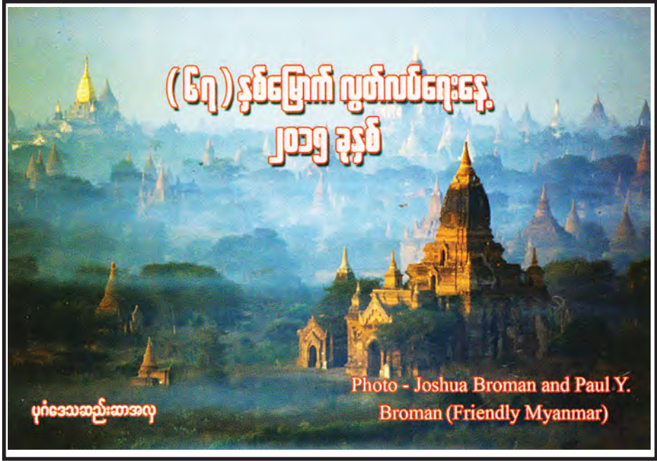
(၆၇) နှစ်မြောက် လွတ်လပ်ရေးနေ့ ၂၀၁၅ ခုနှစ် ပုဂံဒေသဆည်းဆာအလှ

ထို့နောက် ပြည်ထောင်စုဝန်ကြီး၊ မြန်မာ့မီးရထား ဦးဆောင်ညွှန်ကြားရေးမှူး၊ ဂျပန်နိုင်ငံ သံအမတ်ကြီးနှင့် Mr. Masao Tabuchi တို့က အဆောက်အအုံသစ်ကို ဖဲကြိုးဖြတ်ဖွင့်လှစ်ပြီး အဆောက်အအုံသစ်အား ကြည့်ရှုကြသည်။ ယင်းအဆောက်အအုံသစ်၌ မြန်မာ့မီးရထား ခေတ်မီဖွံ့ဖြိုးတိုးတက်ရေးအတွက် စီမံခန့်ခွဲမှုများ ခေါင်းစဉ်ဖြင့် မြန်မာ့မီးရထားမှ သင်တန်းသား ၄၀ အား ဂျပန်ပညာရှင်များက ဒီဇင်ဘာ ၁၀ရက်တွင် စတင်၍ ရထားဆိုင်ရာ သင်တန်းများ သင်ကြားပေးသွားမည် ဖြစ်ကြောင်း သိရသည်။ (ကြေးမုံ)