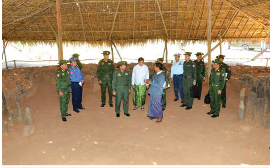
တပ်မတော်ကာကွယ်ရေးဦးစီးချုပ် ဗိုလ်ချုပ်မှူးကြီးမင်းအောင်လှိုင်နှင့်အဖွဲ့ဝင်များ ကုန်းအမှတ်(၂) တာသာရေးအဆောက်အအုံနေရာအား ကြည့်ရှုလေ့လာစဉ်။ (မြဝတီ)

ရွှေနန်းတိုးစေတီတော်ကို တပ်မတော်ကာကွယ်ရေးဦးစီးချုပ် အမှူးပြု၍ စေတနာရှင်၊ အလှူရှင်များ၏ လှူဒါန်းမှု အစုစုတို့ဖြင့် မူလစေတီတော်အား ပြုပြင်မွမ်းမံကာ ဉာဏ်တော် ကိုးပေ ထပ်မံမြှင့်တင်တည်ထားပူဇော်ခဲ့ပြီး ယနေ့တွင် ရွှေထီးတော်တင်လှူခြင်း၊ အနောက်ဘက်ခြမ်း နှင့် ရေစက်ချမင်္ဂလာအခမ်းအနားတို့ကို ကျင်းပခဲ့ခြင်းဖြစ် ကြောင်း သိရှိရသည်။ ထို့နောက် တပ်မတော်ကာကွယ်ရေးဦးစီးချုပ် ဦးဆောင် သည့်အဖွဲ့သည် ကျောက်မြောင်းမြို့ရှိ အလောင်းမင်းတရား ကြီးတည်ထားကိုးကွယ်ခဲ့သော အောင်မြေ ဆုတောင်း ပြည့်စေတီသို့ ရောက်ရှိပြီး ပန်း၊ ရေချမ်းနှင့် ဆီမီးကပ်လှူ ပူဇော်ခဲ့ကြကြောင်း သတင်းရရှိသည်။ (မြဝတီ)