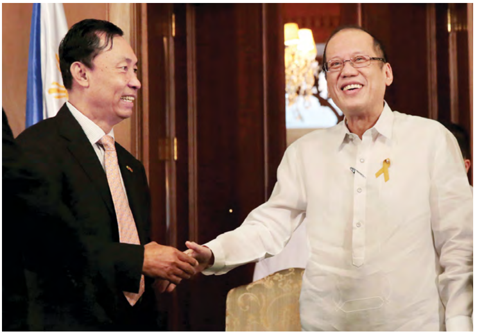
ပြည်သူ့လွှတ်တော်ဥက္ကဋ္ဌ သူရဦးရွှေမန်းနှင့် ဖိလစ်ပိုင်သမ္မတနိုင်ငံ သမ္မတတို့ ရင်းရင်းနှီးနှီးတွေ့ဆုံနှုတ်ဆက် ကြစဉ်။ (သတင်းစဉ်)

ပြည်ထောင်စုလွှတ်တော်နာယကက မြန်မာနိုင်ငံတွင် ပြုပြင်ပြောင်းလဲရေးဆောင်ရွက်နေခြင်းအား ဖိလစ်ပိုင် သမ္မတက အားပေးကူညီသဖြင့် ကျေးဇူးတင်ရှိပါကြောင်း၊ မိမိတို့နိုင်ငံသည်လည်း အတိတ်သမိုင်း၏ သင်ခန်းစာများ ကို ရယူလျက် လွှတ်တော်အတွင်းတွင် ပါတီအချင်းချင်း