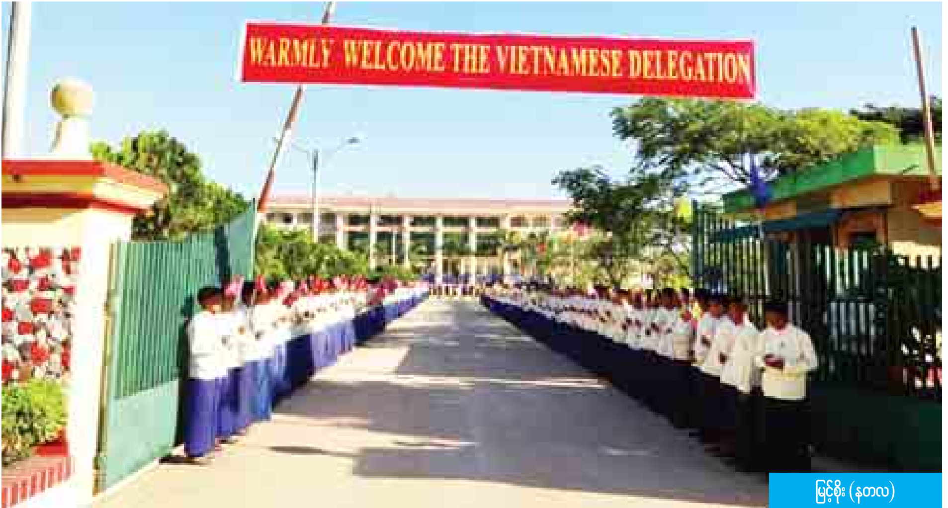
မြင့်စိုး (နတလ)