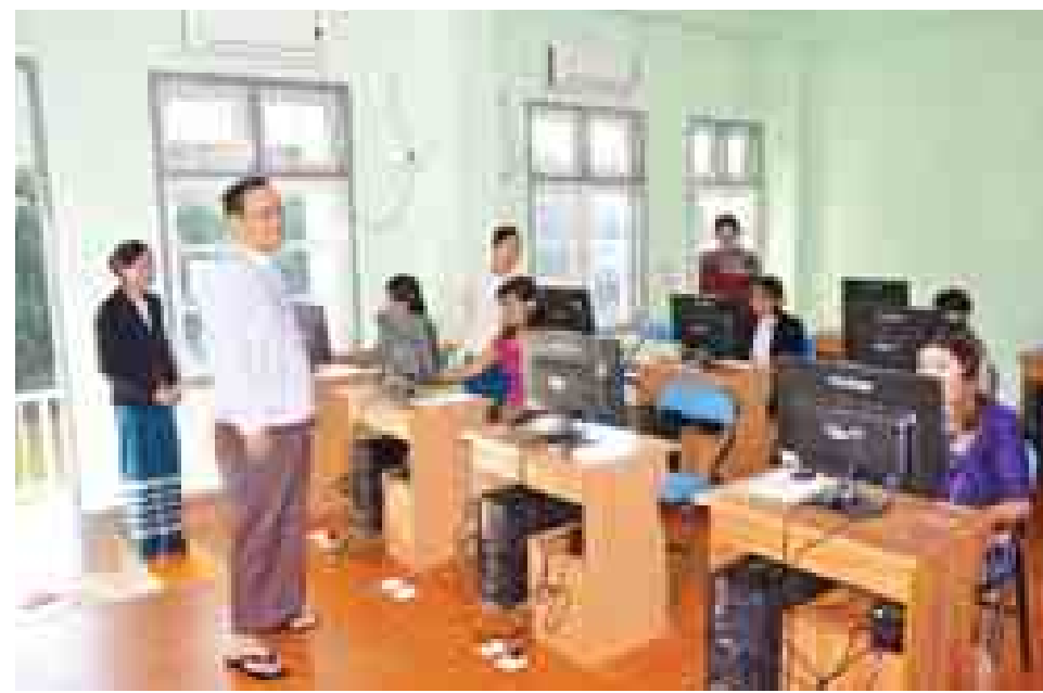
မြန်မာစာစိမ်းစာရင်းစာရင်းအုပ်စု အခြေခံသင်တန်း ဖွင့်ပွဲအခမ်းအနား အတွင်း မန္တလေးတိုင်းဒေသကြီးအတွင်းရှိ နိုင်ငံတော်သမ္မတ၏ ပညာတော်သင်ဆု အရည်အချင်းစစ်စစ်စာမေးပွဲ စာစစ်ခန်းများကို ကြည့်ရှုစဉ်။ (သတင်းစဉ်)

များကို ဝန်ထမ်းတိုင်း အခြေခံအနေဖြင့်မလွဲမသွေ သိရှိထားရမည့် ကိစ္စများဖြစ်ကြောင်း၊ သင်တန်းကပို့ချမည့် ဥပဒေ၊ နည်းဥပဒေ၊ အမိန့်၊ ညွှန်ကြားချက်များကို အခြေခံ ပြီး ဆက်လက်ထမ်းပို့ဖတ်ရှုလေ့လာ သိရှိနားလည်ဆောင် ရွက်ခြင်းဖြင့် ဝန်ထမ်းကောင်းများ ဖြစ်လာမည်ဖြစ်ကြောင်း၊ အခြေခံဝန်ထမ်းကောင်းများ ရရှိမှုသာလျှင် မြင့်မားကြီး လေးသည့် တာဝန်များ ထမ်းဆောင်ရာတွင် သော်လည်း ကောင်း၊ ဥပဒေလုပ်ထုံးလုပ်နည်းနှင့် ညီညွတ်လာပြီး ကျန်းမာရေးဝန်ကြီးဌာန၏ စွမ်းဆောင်ရည်များ မလွဲမသွေ တိုးတက်လာမည်ဖြစ်ကြောင်း ပြောကြားသည်။ သင်တန်းသို့ စာရေးဝန်ထမ်းသင်တန်းသား သင်တန်း သူ ၁၅၂ ဦးတက်ရောက်ကြောင်း သိရသည်။(ကြေးမုံ)