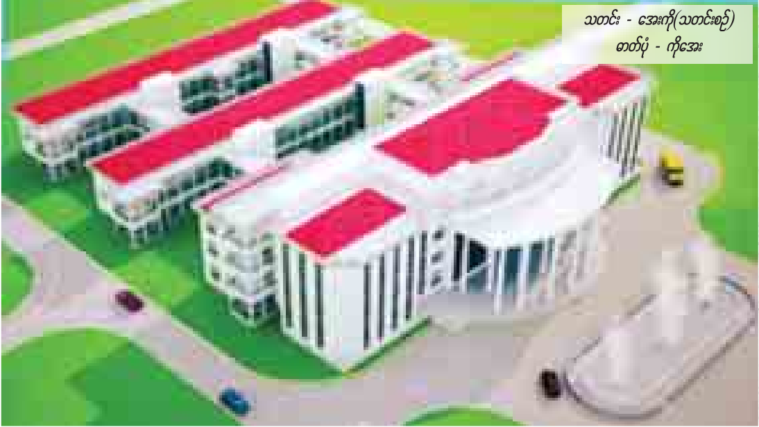
သတင်း - အေးကို(သတင်းစဉ်) တတ်ပုံ - ကိုအေး

ဖောင်းလုပ်ငန်း၊ ပြင်ပလျှပ်စစ်မီးသွယ်တန်းခြင်းလုပ်ငန်း၊ ပြင်ပရေရရှိရေးလုပ်ငန်း၊ Landscaping လုပ်ငန်း၊ မြေသားလုပ်ငန်း၊ ခြံစည်းရိုးလုပ်ငန်းနှင့် အဝင်မုခ်ဦးတို့ ပါဝင်ကြောင်း သိရသည်။ အားကစားတက္ကသိုလ် တည်ဆောက်ရေးစီမံကိန်းပုံစံအရ အဆောက်အအုံ မြေညီထပ်တွင် ပါမောက္ခချုပ်ရုံးခန်း၊ ဒုတိယပါမောက္ခချုပ်ရုံးခန်း၊ မော်ကွန်းထိန်းရုံးခန်း၊ ကျောင်းသားရေးရာဌာန၊ ဘဏ္ဍာရေးနှင့် ငွေစာရင်းဌာန၊ စာကြည့်တိုက်၊ Department အခန်း သုံးခန်း၊ အစည်းအဝေးခန်း၊ စာသင်ခန်း ခုနစ်ခန်း၊ Utility အခန်း၊ ခြောက်ခန်းနှင့် သန့်စင်ခန်းများ ပါဝင်သည်။