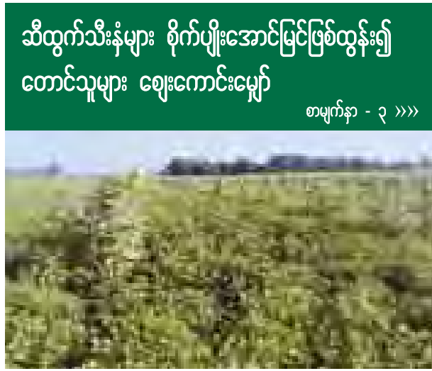
သီထွက်သီးနှံများ စိုက်ပျိုးအောင်မြင်ဖြစ်ထွန်း၍ တောင်သူများ ဈေးကောင်းမျှော်