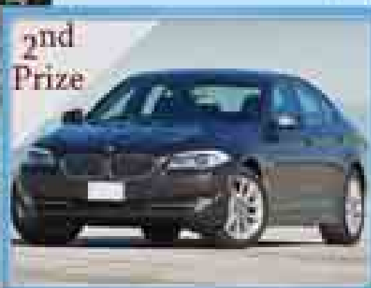
2nd Prize BMW 528 BRAND NEW