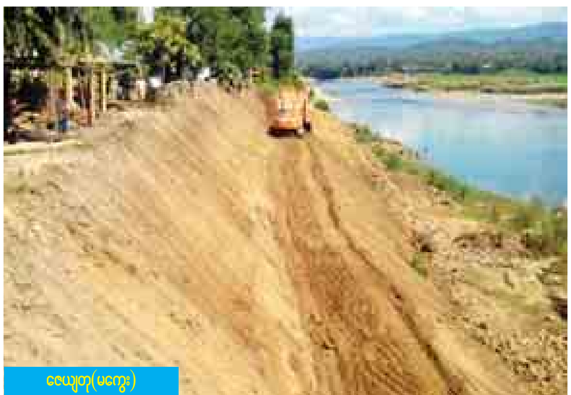
လေ့တု(မကွေး)

မကွေးတိုင်းဒေသကြီးအတွင်း ရောဂါတစ်မြစ်ကြောင်းကို အမှီပြု၍ အသက်မွေးဝမ်းကျောင်းပြုသူများ၊ ခရီးသွားများ၊ မြစ်ကြောင်းဝဲယာတွင် နေထိုင်ကြသူများအတွက် အခက်အခဲများဖြစ်သည့် သောင်ထွန်းခြင်း၊ ကမ်းပါးဖြိုခြင်း ကိစ္စရပ်များအပြင် နိုင်ငံ၏ပုံရိပ်တစ်ခုဖြစ်သော ရောဂါတစ်အား ထိန်းသိမ်းနိုင်ရေးအတွက် ရေအရင်းအမြစ်နှင့်မြစ်ကြောင်းများ ဖွံ့ဖြိုးတိုးတက်ရေးဦးစီးဌာနမှ ငွေကျပ်သန်း ၅၉၀ ကျော်အသုံးပြု၍ ထိန်းသိမ်းရေးလုပ်ငန်းများ ဆောင်ရွက်လျက်ရှိကြောင်း သိရသည်။