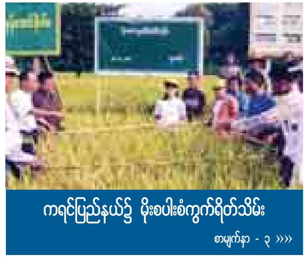
ကရင်ပြည်နယ်၌ မိုးစပါးစံကွက်ရိတ်သိမ်း