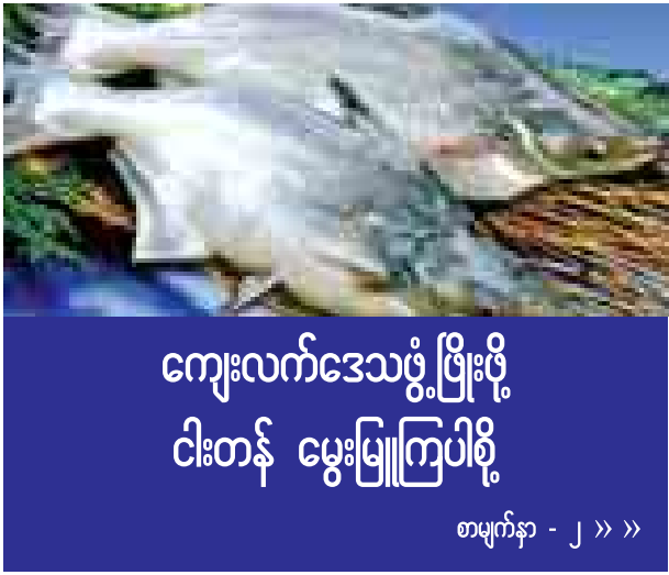
ကျေးလက်ဒေသဖွံ့ဖြိုးဖို့ ငါးတန် မွေးမြူကြပါစို့