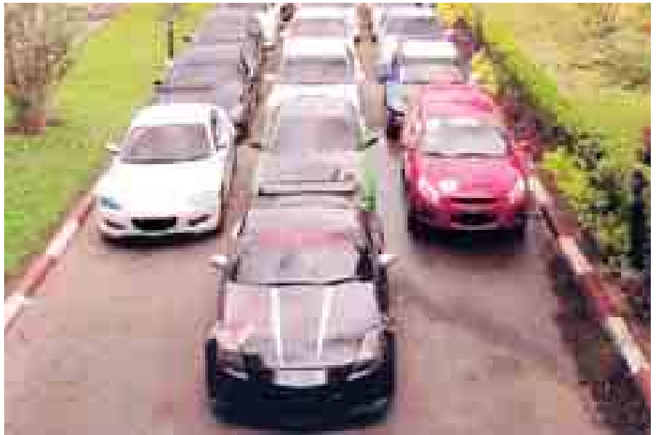
စစ်ဆေးတွေ့ရှိပါက ထိရောက်စွာ အရေးယူ ဆောင်ရွက်သွားမည်ဖြစ်သဖြင့် မိမိတို့၏မော်တော်ယာဉ်များ၌ ပါဝါအိပ်ဇောများတပ်ဆင်မောင်းနှင်ခြင်းမပြုရန်နှင့် ယာဉ်စည်းကမ်း၊ လမ်းစည်းကမ်းများနှင့်အညီမောင်းနှင်ကြရန် အသိပေးထားကြောင်း ရန်ကုန်တိုင်းဒေသကြီး ရဲတပ်ဖွဲ့မှ သတင်းရရှိသည်။ (သတင်းစဉ်)

ထိခိုက်စေသည့်အပြင် အသံဆူညံစွာ စည်းကမ်းမဲ့မောင်းနှင်မှုကြောင့် အများပြည်သူတို့၏စိတ်တွင် အနှောင့်အယှက်ဖြစ်စေပြီး ယာဉ်အန္တရာယ်များဖြစ်ပေါ်လာနိုင်သဖြင့် ထိရောက်စွာအရေးယူနိုင်ရန်အတွက် ရန်ကုန်တိုင်းဒေသကြီး ရဲတပ်ဖွဲ့က စီမံချက်ချမှတ်ကာ ထိထိရောက်ရောက် ဖမ်းဆီးအရေးယူဆောင်ရွက်နေခြင်းဖြစ်သည်။ ယခုကဲ့သို့ စည်းကမ်းမဲ့ မောင်းနှင်သော ပြိုင်ကားများနှင့် ပါဝါအိပ်ဇောတပ်ဆင်ထားသည့် မော်တော်ယာဉ်များအား နေ့စဉ်ဖမ်းဆီးအရေးယူဆောင်ရွက်သွားမည်ဖြစ်ကြောင်း၊