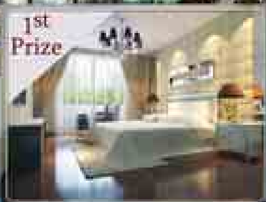
1st Prize (၂၃)ထပ်ခေါင်းခရီးစဉ် CONDOMINIUM တံခါး