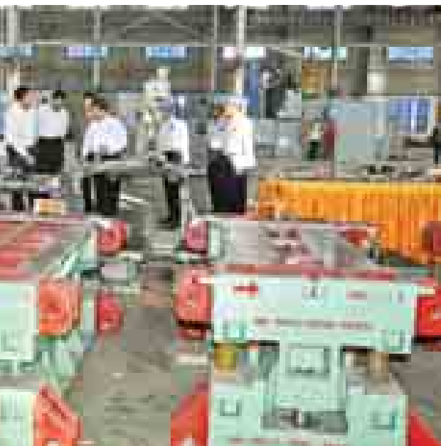
စက်မှုဝန်ကြီးဌာန ပြည်ထောင်စုဝန်ကြီး ဦးမောင်မြင့် အမှတ်(၂၅)အကြီးစားစက်ရုံ(မြိုင်)အား ကြည့်ရှုစစ်ဆေးစဉ် (စက်ရုံ)

အမှတ်(၂၅)အကြီးစားစက်ရုံ(မြိုင်)သည် နိုင်ငံတော်၌ တစ်ခုတည်းသာရှိသော စက်ရုံတစ်ရုံဖြစ်ပြီး အဆိုပါစက်ရုံမှ CNC Lathe (ML-258)၊ CNC Lathe (ML-260)၊ Semi CNC Lathe (DL-660)၊ Heavy Duty Precision Lathe (HG-720)၊ Radial Drilling Machine(TF-1100S)၊ Radial Drilling Machine(TF-1700H)၊ Bed Type Vertical & Horizontal Milling M/C(JYVH-480)၊ Universal Cylindrical Grinding M/C(G&Y 55 AGC)၊ Pression Surface Grinting M/C(C&Y 50100 AHR)၊ Double Column Plano Milling M/C (CI 900 x 2500) နှင့် Plate Rolling Machine (HR-0613) တို့ကို ထုတ်လုပ်လျက်ရှိသည်။ ထို့အပြင် Automobile Mould & Die Manufacturing စီမံကိန်းကိုလည်း အကောင်အထည်ဖော်ဆောင်ရွက်လျက်ရှိပြီး Automobile Mould & Die များအပြင် စက်မှုလုပ်ငန်းသုံး Mould & Die အမျိုးမျိုးတို့ကိုလည်း ထုတ်လုပ်ပေးသွားနိုင်မည်ဖြစ်သည်။ ထို့နောက် ပြည်ထောင်စုဝန်ကြီးသည် Mould များ စမ်းသပ်ထုတ်လုပ်ထားသော ထုတ်ကုန်နမူနာများကို ကြည့်ရှုစစ်ဆေးပြီး Mould & Die Manufacturing Project တွင် ပါဝင်