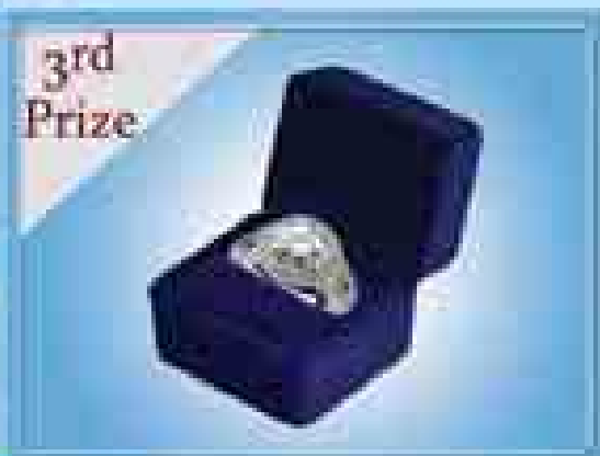
3rd Prize GIA (၁) ကုတ်ပိုင်ဆိုင်ခွင့်ရရှိသည့်