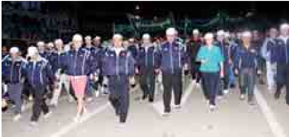
နေပြည်တော် ဒီဇင်ဘာ ၆

၂၀၁၄ ခုနှစ် နေပြည်တော် ဒီဇင်ဘာ လူထုစုပေါင်းလမ်းလျှောက်ပွဲကို ယနေ့နံနက် ၆ နာရီက မြို့မဈေးရှေ့သတ်မှတ်နေရာမှ စတင်တာလွှတ်ကျင်းပခဲ့သည်။ အဆိုပါ လူထုစုပေါင်းလမ်းလျှောက်ပွဲသို့ မြန်မာနိုင်ငံအိုလံပစ်ကော်မတီဥက္ကဋ္ဌ အားကစားဝန်ကြီးဌာန ပြည်ထောင်စုဝန်ကြီး ဦးတင့်ဆန်းက ဦးဆောင်ကာ မြန်မာနိုင်ငံအိုလံပစ်ကော်မတီ ဒုတိယဥက္ကဋ္ဌ ဒုတိယဝန်ကြီး ဦးသောင်းထိုက်နှင့် မြန်မာနိုင်ငံ အိုလံပစ်ကော်မတီဝင်များ၊ ပြည်ထောင်စုဝန်ကြီးဌာနအသီးသီးမှ အရာထမ်း၊ အမှုထမ်းများ၊ နေပြည်တော်ဗဟိုရုံး၊ နယ်အတွင်းမှ ကျန်းမာရေးလိုက်စားကြသူ မိဘပြည်သူများအပါအဝင် စုစုပေါင်းအင်အား ၇၁၉၀ တို့ ပါဝင်ဆင်နွှဲကြသည်။ ရှေးဦးစွာ နံနက် ၆ နာရီတွင် သေနတ်ပစ်ဖောက်