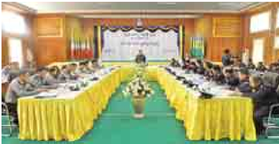
မြင့်တင်သွားကြရန်နှင့် မီးသတ်ဆက်လက်ထိန်းသိမ်းပြီး ဆတတ်ပြောကြားခဲ့ကြောင်း သတင်းရရှိသည်။ (ကြေးမုံ)