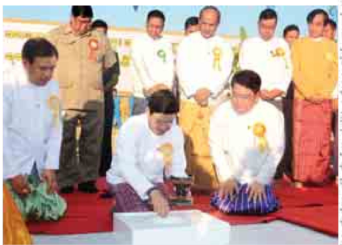
အားကစားတက္ကသိုလ်တည်ဆောက်ရေးစီမံကိန်း ရတနာပန္နက်တော်တင်နှင့် တွင်းတော်ဝန်း မင်္ဂလာအခမ်းအနား ကျင်းပစဉ်။ (သတင်းစဉ်)

ရှင်းလင်းတင်ပြချက်များနှင့်စပ်လျဉ်း၍ ဒုတိယသမ္မတက လိုအပ်သည်များကို လမ်းညွှန် မှာကြားခဲ့သည်။