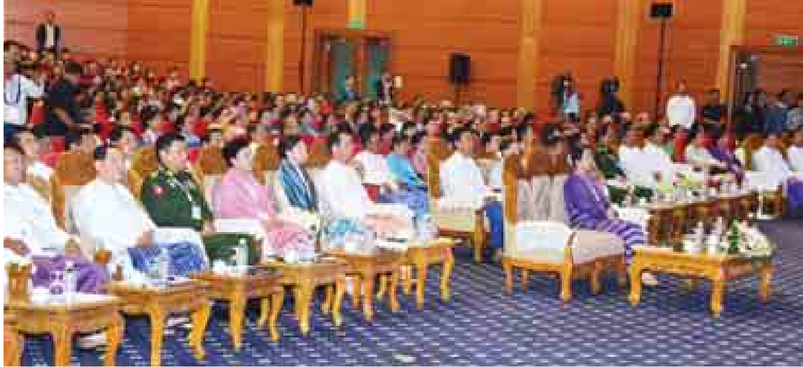
နိုင်ငံတော်သမ္မတ ဦးသိန်းစိန် ကမ္ဘာလုံးဆိုင်ရာ အမျိုးသမီးများ ဖိုရမ်ဖွင့်ပွဲအခမ်းအနား၌ အမှာ စကားပြောကြားစဉ်။ (သတင်းစဉ်)

ကုလသမဂ္ဂ ပဋိညာဉ်စာတမ်းတွင် ပါဝင်သည့် အခြေခံအချက်ကြီး(၅)ချက် အနက် အမှတ်စဉ်(၂)၌ “လူတိုင်း ကျား၊ မ မဟုတ် နိုင်ငံကြီးငယ်မရွေး အခြေခံလူ့အခွင့်အရေးများနှင့် တန်းတူ ရည်တူ အခွင့်အရေးရှိသည်ကို အလေး အနက်ဂရုပြုရန်” ဟူသည့် အချက်