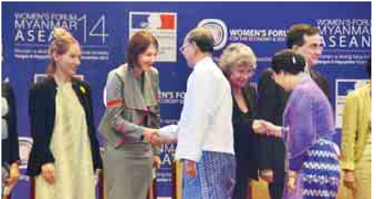
နိုင်ငံတော်သမ္မတ ဦးသိန်းစိန်နှင့်ဇနီး ဒေါ်ခင်ခင်ဝင်း ဧည့်သည်တော်များအား ရင်းရင်းနှီးနှီး နှုတ်ဆက်စဉ်။

မြန်မာအမျိုးသမီးများ ဖွံ့ဖြိုးတိုးတက်ရေးကိစ္စရပ်များကို ဆောင်ရွက်နိုင်ရန် မြန်မာနိုင်ငံလုံးဆိုင်ရာ အမျိုးသမီးရေးရာကော်မတီကို ၁၉၉၆ ခုနှစ် ဇူလိုင်လ ၃ ရက်တွင် ဖွဲ့စည်းခဲ့ပါကြောင်း၊ အလားတူ မြန်မာအမျိုးသမီးများကို အကြမ်းဖက်မှုမှ တားဆီးကာကွယ်ရန်၊ ဆင်းရဲနွမ်းပါးမှုလျော့ချရန်၊ အမျိုးသမီးများ၏ အသက်