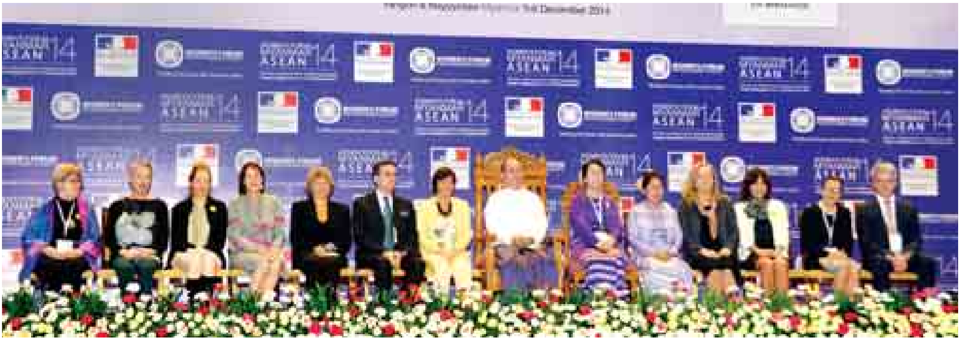
နိုင်ငံတော်သမ္မတဦးသိန်းစိန်နှင့်ဇနီး ဒေါ်ခင်ခင်ဝင်း ဧည့်သည်တော်များနှင့်အတူ စုပေါင်း၍မှတ်တမ်းတင်ဓာတ်ပုံရိုက်ကြစဉ်။