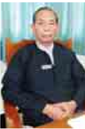
ရန်ကုန်မြို့တော် ကော်မရှင် ဥက္ကဋ္ဌ ဦးတင်အေး။

ရန်ကုန်မြို့တော်စည်ပင်သာယာ ရေးကော်မတီ အဆင့်ဆင့်ရွေးကောက် ပွဲကို ယခုနှစ် ဒီဇင်ဘာ ၂၇ ရက်တွင် ကျင်းပတော့မည်ဖြစ်သည်။ ၁၉၄၉ ခုနှစ် ဖေဖော်ဝါရီ ၁၆ ရက်တွင် ရန်ကုန်မြို့နယ်စည်းရုံးရေးကော်မတီ အဖွဲ့အစည်းကို နောက်ဆုံးကျင်းပခဲ့ပြီး ထိုနောက်ပိုင်းမှစ၍ ရွေးကောက်ပွဲများ ကျင်းပခြင်းမရှိဘဲ အဆင့်ဆင့်ပြောင်းလဲ ဖွဲ့စည်းခြင်းများကိုသာ ပြုလုပ်ခဲ့ သည်။ နှစ်ပေါင်း ၆၀ ကျော်ကြာ မကျင်းပနိုင်ခဲ့သည့် စည်ပင်သာယာ ရွေးကောက်ပွဲများ ပြန်လည်ကျင်းပ တော့မည်ဖြစ်ရာ ရန်ကုန်မြို့တော် ကော်မရှင် ဥက္ကဋ္ဌ ဦးတင်အေးနှင့် တွေ့ဆုံမေးမြန်းမှုများကို ဖော်ပြလိုက် ပါသည်။