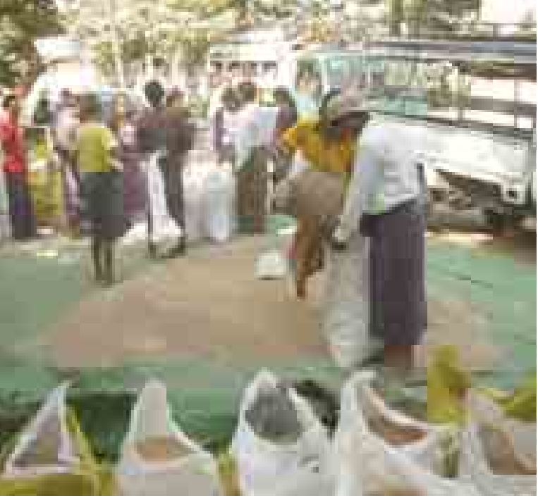
ခိုင်များကလည်း သယ်ယူစရိတ်နှင့် အလုပ်သမားခတွက်ပြီး မန္တလေးဈေးကွက်နှင့် အနည်းငယ်ကွာ၍ အရောင်းအဝယ်ဖြစ်ကြပြီး တောင်ချိုဝင်း(စစ်ကိုင်း) သူကြီးများလက်ဝယ်၌သာ နှမ်းရှိတော့ကြောင်း ကုန်အဝယ်ဗိုင်းတစ်ဦး ကပြောသည်။

ခြောက်လက်မခန့်တွင် မိုးရွာသွန်းမှုများခဲ့သဖြင့် အပင်ပေါက်အချို့ ယိုင်လဲ၍ အမြစ်များပေါ်ပြီး သေဆုံးခဲ့သည်။ စာရေး၊ ပဉ္စမ တောင်ရင်း၊ ကျောင်းဖြူကဲ့သို့ ရွာများရှိ ယာမြေများသည် မိုးနှမ်းပြီးဆင်ခြေလျှောယာကွက်များဖြစ်သဖြင့် သင့်တင့်သော အကျိုးအမြတ် ရရှိခဲ့ကြသည်။ မိုးနှမ်းများကို ကနဦးပေါ်ချိန် စစ်ကိုင်းကုန်အဝယ်ဗိုင်းလားတွင် နှမ်းဖြူသန့်စင်ပြီး သုံးတင်းတစ်အိတ်ကို ကျပ်တစ်သိန်းခြောက်သောင်း အရောင်းအဝယ်ဖြစ်ခဲ့သော်လည်း ယခုနောက်ပိုင်းတွင် သန့်စင်ပြီးနှမ်းဖြူဈေးမှာ စစ်ကိုင်းဈေးကွက်တွင် ကျပ်တစ်သိန်းတစ်သောင်းခွဲ၊ တစ်သိန်းနှစ်သောင်းဖြင့်သာ အရောင်းအဝယ်ဖြစ်ကြောင်း၊ သန့်စင်ပြီးနှမ်းနက်မှာ သုံးတင်းတစ်အိတ်ဈေး ကျပ်တစ်သိန်းခြောက်သောင်းမှ ကျပ်တစ်သိန်းကိုးသောင်းအထိ အရောင်းအဝယ်ဖြစ်ကြောင်း၊ ကုန်အဝယ်