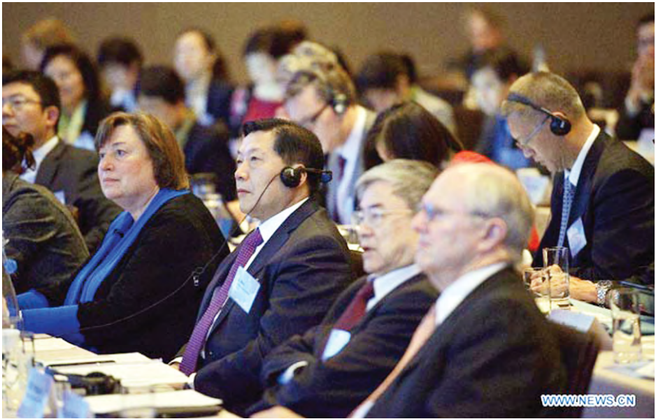
ခုနစ်ကြိမ်မြောက် တရုတ်-အမေရိကန်အင်တာနက် လုပ်ငန်းဖိုရမ်ကျင်းပစဉ်။

အင်တာနက်သတင်းရုံးမှ ဌာနမှူး မစ္စတာလူဝိုင်က ပြောသည်။ တရုတ်နှင့် အမေရိကန်တို့သည် တစ်နိုင်ငံနှင့်တစ်နိုင်ငံကြား ထိပ်တိုက်ရင်ဆိုင်တွေ့ဆုံမှုများနှင့် အချင်းချင်း စွပ်စွဲမှုများ ပြုလုပ်နေမည့်အစား အချင်းချင်း နားလည်မှုအပြန်အလှန်ရှိစေရန် လိုအပ်ကြောင်း ၎င်းကဆက်လက် ပြောသည်။ တရုတ်နိုင်ငံသည် ဝက်ဘ်ဆိုက်ပေါင်း သန်း ၄၀၀ ကျော်၊ အင်တာနက်အသုံးပြုသူ သန်း ၆၀၀ နှင့် ကမ္ဘာ့ထိပ်တန်းအင်တာနက်ကုမ္ပဏီ ၁၀ခုန့်ရှိသောကြောင့် ကမ္ဘာ့အကြီးဆုံးအင်တာနက်ဈေးကွက်တစ်ခုဖြစ်လာခဲ့သည်။ နှစ်ရက်ကြာကျင်းပခဲ့သော ဖိုရမ်ကို ဝါရှင်တန်အခြေစိုက် မိုက်ခရိုဆော့ဖ်ကုမ္ပဏီနှင့် တရုတ်နိုင်ငံ၏ အင်တာနက်အဖွဲ့အစည်းတို့က ပူးပေါင်းကျင်းပခဲ့ခြင်း ဖြစ်သည်။