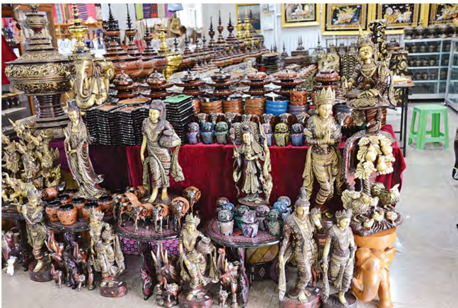
အမှတ်တရပစ္စည်းအရောင်းဆိုင်တွင် ခင်းကျင်းထားမှုကိုတွေ့ရစဉ်။