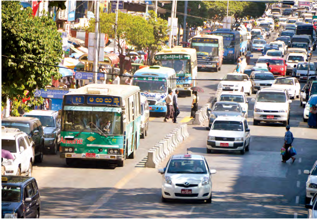
ခရီးသည်တင်ယာဉ်များအတွက် မျှော်လင့်အပြင် ကွန်ကရစ်တုံးများချ၍ လမ်းကြောင်းသတ်မှတ်ထားသည်ကိုတွေ့ရစဉ်။

ရန်ကုန်မြို့ရှိ မြို့လယ်ဧရိယာများတွင် ခရီးသည်တင်ယာဉ်များအတွက် လမ်းယာဘက်အခြမ်းမှ ကပ်မောင်းရန် မျှော်လင့်ကိုရေးဆွဲပြီး လမ်းကြောင်းသတ်မှတ်ခဲ့ကြောင်း၊ တစ်လလောက်ကြာမြင့်သည်အထိ လိုက်နာမှု အားနည်းခြင်းကြောင့် ကွန်ကရစ်တုံးများချကာ လမ်းကြောင်းသတ်မှတ်၍ စီစဉ်ဆောင်ရွက်ပေးလာကြောင်း၊ မီးပွင့်ဧရိယာများအနီးတွင်လည်း လမ်းပြောင်းပြန်ကျော်တက်မောင်းနှင်လာကာ ရွေ့မြတ်ဝင်ခြင်းမျိုးမရှိစေရန် ကွန်ကရစ်တုံးများချကာ စီစဉ်ထားလျက်ရှိကြောင်း သိရသည်။