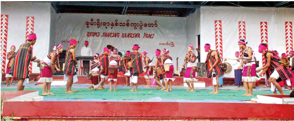
ချင်းတိုင်းရင်းသား ခူမီးမျိုးနွယ်စုတို့၏ ရိုးရာနှစ်သစ်ကူးပွဲတော်တွင် ရိုးရာအကများဖြင့် ဖျော်ဖြေစဉ်။