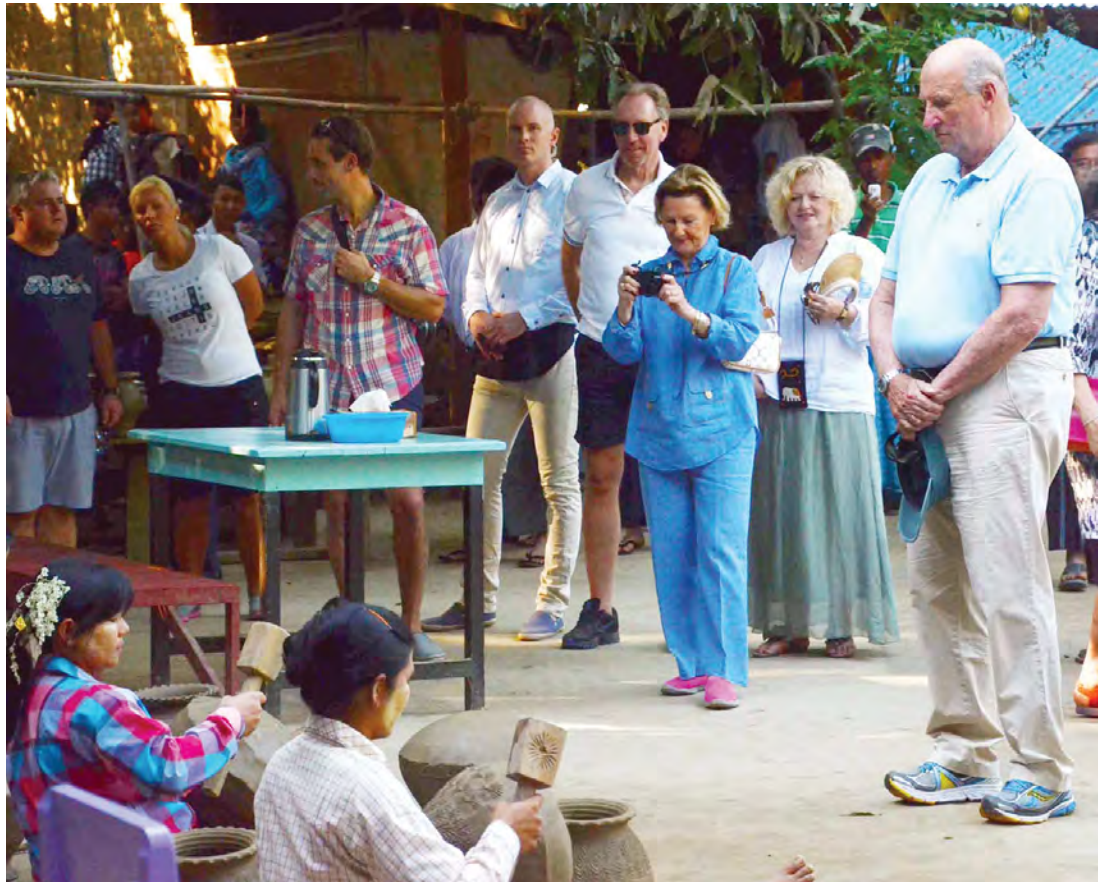
နော်ဝေနိုင်ငံ ပဉ္စမမြောက် ဟာရယ်ဘုရင်နှင့် မိဖုရား ဆွန်ယာတို့ ရန္တပိုကျေးရွာရှိ အိုးလုပ်ငန်းကို ကြည့်ရှုလေ့လာစဉ်။ (သတင်းစဉ်)