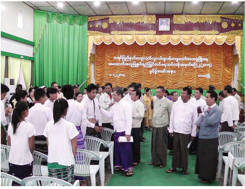
ကရင်ပြည်နယ် ကျေးလက်ဒေသဖွံ့ဖြိုးရေးအထောက်အကူပြု စွမ်းရည်မြှင့်တင်ရေးသင်တန်း(၂/ ၂၀၁၄) ဖွင့်ပွဲတွင် တက်ရောက်ကြမည့် သင်တန်းသား သင်တန်းသူများအား ကရင်ပြည်နယ်ဝန်ကြီးချုပ် ဦးဇော်မင်း ရင်းရင်းနှီးနှီး နှုတ်ဆက်အားပေးစဉ်။

ဦးစောခရစ္စတိုဖာက သင်တန်းသား သင်တန်းသူများအား လမ်းညွှန်အမှာစကားပြောကြားပြီး ပြည်နယ်ကျေးလက်ဒေသဖွံ့ဖြိုးတိုးတက်ရေးဦးစီးဌာန ပြည်နယ်ဦးစီးမှူး ဦးနေဦးက သင်တန်းဖွင့်လှစ်ခြင်းနှင့်ပတ်သက်၍ ရှင်းလင်းတင်ပြသည်။ အဆိုပါသင်တန်းကို ဒီဇင်ဘာ ၁ ရက် မှ ၁၂ ရက်အထိ သင်ကြားမည်ဖြစ်ပြီး ကရင်ပြည်နယ်အတွင်းရှိ မြို့နယ်ခုနစ်မြို့နယ်နှင့် ကျေးရွာ ၁၂ ရွာမှ သင်တန်းသား ၂၄ ဦး၊ ပြည်နယ်/ခရိုင်/ မြို့နယ်ကျေးလက်ဒေသဖွံ့ဖြိုးတိုးတက်ရေးဦးစီးဌာနများမှ သင်တန်းသားခြောက်ဦး စုစုပေါင်း ၃၀ တို့ တက်ရောက်ကြောင်းနှင့် သင်တန်းတွင် ကျေးလက်ဦးစီးဌာန၊ မွေးမြူရေးနှင့် ကုသရေးဦးစီးဌာန၊ ငါးဦးစီးဌာနများနှင့် အခြားနှီးနွယ်သော ဌာနများနှင့် သက်ဆိုင်သောသင်တန်းစာများ၊ ကျေးလက်ဒေသဖွံ့ဖြိုးရေးဆိုင်ရာ သင်ခန်းစာများ၊ မြစ်မီးရောင်စီမံကိန်းများ၊ CDD Project အသက်မွေးဝမ်းကျောင်းအထောက်အကူပြုအဆောက်အအုံဆောက်လုပ်ခြင်းပညာရပ်များ၊ ကျေးလက်လက်စွဲစာအုပ် (Village Development Plan) ပြုစုခြင်းလုပ်ငန်းများ သင်ကြားပို့ချသွားမည်ဖြစ်ကြောင်း သိရသည်။