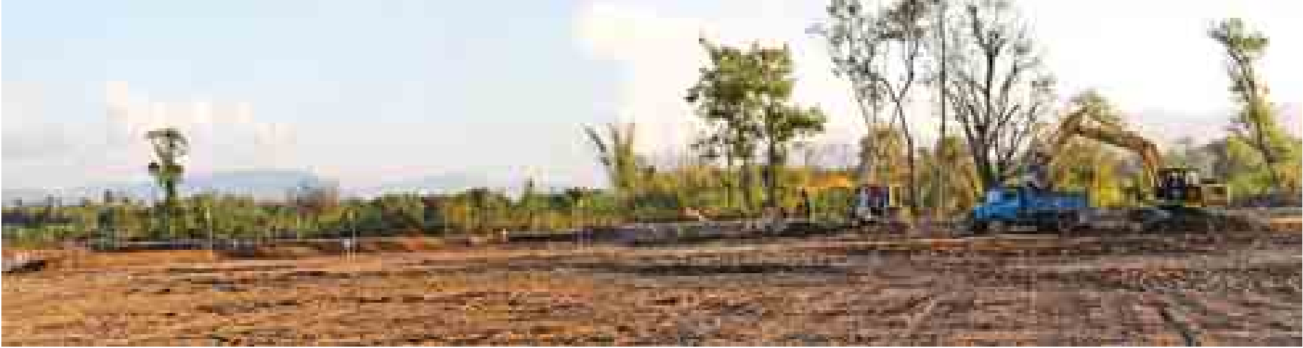
ကျိုင်းတုံမြို့ ကတ်ထိုက်၊ ဝပ်ဆောင်းအုပ်စုတို့ အဆင့်မြင့် လယ်ယာမြေ ဖော်ထုတ်ခြင်းလုပ်ငန်းကို တွေ့ရစဉ်။