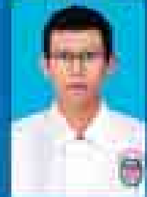
မေဇော်သီရိဇင် ( ၂၀၀၁-၀၅ ) ( ဇူလိုင် )