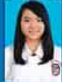
မေဇော်သီရိဇင် ( ၂၀၀၁-၀၅ ) ( ဇူလိုင် )