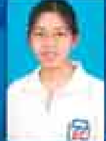
မေဇော်သီရိဇင် ( ၂၀၀၁-၀၅ ) ( ဇူလိုင် )