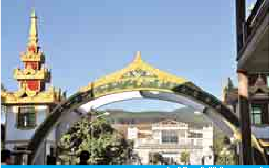
ပန်ဆန်းမြို့ နယ်စပ်ဂိတ်အား တွေ့ရစဉ်။