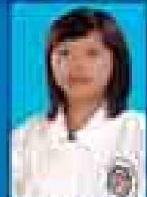
မေဇော်သီရိဇင် ( ၂၀၀၁-၀၅ ) ( ဇူလိုင် )