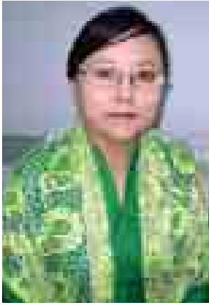
ဒေါက်တာခင်ဖုန်းမြင့်ကြူ

အမျိုးသားပညာရေး ဥပဒေကို တော့ ၂၀၁၃ ခုနှစ် နိုဝင်ဘာလက တည်းက စတင်ပြီးတော့ ရေးဆွဲခဲ့ တာပါ။ အမျိုးသားပညာရေးဥပဒေကို အကောင်အထည်ဖော်နိုင်ဖို့ စတင် ကတည်းက ပြည်သူလူထုတွေဆီက အကြံဉာဏ်တွေရယူတယ်။ ပညာရှင် တွေဆီကနေ အကြံဉာဏ်တွေရယူပါ တယ်။ အဲဒီရရှိလာတဲ့ အကြံဉာဏ်တွေ ပေါ်မှာ မူတည်ပြီးတော့ စိန်ရတု ခန်းမမှာ ဆွေးနွေးပွဲတွေလုပ်ပါတယ်။ ရရှိလာတဲ့ ဘယ်အချက်ကိုတော့ ကဏ္ဍအလိုက် ဥပဒေထဲမှာထည့်မယ်။ ဘယ်အချက်ကိုတော့ နည်းဥပဒေထဲ မှာ ထည့်သွင်းမယ်။ ဘယ်အချက်ကို တော့ ရေးဆွဲနေတဲ့အမျိုးသားပညာ ရေးဥပဒေမှာ ထည့်သွင်းရေးဆွဲ ပေးမယ်ဆိုပြီးတော့ ဆွေးနွေးမှုတွေ လုပ်တယ်။ နည်းဥပဒေရေးဆွဲတာ မူကြမ်းအဖြစ်နဲ့ကတော့ ထွက်နေပါပြီ။ မကြာမီအချိန်အတွင်းမှာ ပြီးသွား မယ်လို့ပဲ ပြောလို့ရပါတယ်။