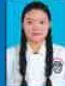
မေဇော်သီရိဇင် ( ၂၀၀၁-၀၅ ) ( ဇူလိုင် )

EC (၁၃)နှစ်ပြည့်ပထမဆုံးမှာ နှစ် ဆုရှင်သံတော်ကို ၁၅-၁၂-၂၀၁၄ တွင် Sedona Hotel Grand Ballroom ၌ ကျင်းပပွဲပြုခဲ့ပါသည်။