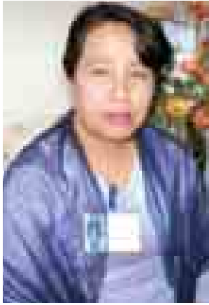
ဒေါက်တာကြူကြူဆွေ

အမျိုးသားပညာရေးဥပဒေဆိုတာ ကတော့ Policy Law ပင်မဥပဒေ တစ်ရပ်ဖြစ်ပြီးတော့မှ မြန်မာနိုင်ငံ