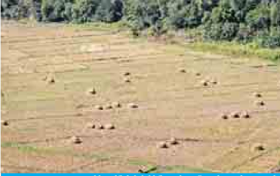
မိုင်းဆတ်မြို့ရှိ ရိတ်သိမ်းပြီး လယ်ယာမြေများကို ဝေဟင်မှ တွေ့ရစဉ်။