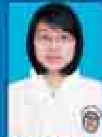
မေဇော်သီရိဇင် ( ၂၀၀၁-၀၅ ) ( ဇူလိုင် )