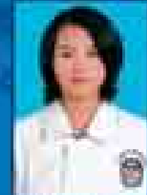
မေဇော်သီရိဇင် ( ၂၀၀၁-၀၅ ) ( ဇူလိုင် )