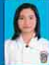
မေဇော်သီရိဇင် ( ၂၀၀၁-၀၅ ) ( ဇူလိုင် )