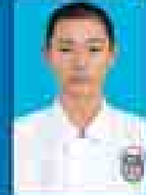
မေဇော်သီရိဇင် ( ၂၀၀၁-၀၅ ) ( ဇူလိုင် )