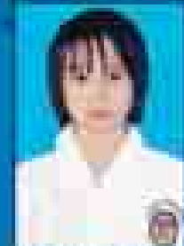
မေဇော်သီရိဇင် ( ၂၀၀၁-၀၅ ) ( ဇူလိုင် )