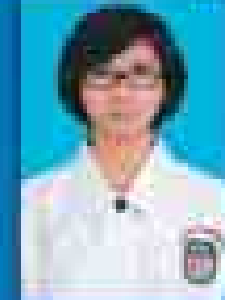
မေဇော်သီရိဇင် ( ၂၀၀၁-၀၅ ) ( ဇူလိုင် )