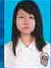
မေစင်စယ်တက္ကသိုလ် ( ၂၀၀၁-၀၅ ) ( ဇူလိုင် )