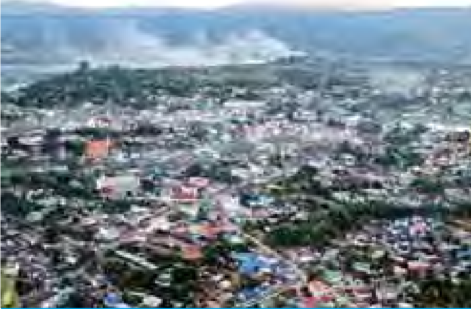
ကျိုင်းတုံမြို့အား ဝေဟင်မှ တွေ့ရစဉ်။