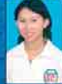
မေဇော်သီရိဇင် ( ၂၀၀၁-၀၅ ) ( ဇူလိုင် )