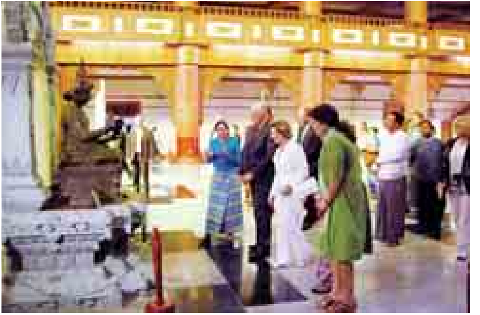
နော်ဝေဘုရင်နှင့် မိဖုရားတို့ ပုဂံရှေးဟောင်း သုတေသနပြုတိုက်အတွင်း ပြသထားမှုများကို ကြည့်ရှုလေ့လာစဉ်။

ညောင်ဦး ဒီဇင်ဘာ ၃ မြန်မာနိုင်ငံ၌ ချစ်ကြည်ရေးအလည်အပတ်ခရီးရောက်ရှိနေသော နော်ဝေနိုင်ငံပဉ္စမမြောက် ဘုရင်ဟာရယ်နှင့် မိဖုရားဆွန်ယာ ဦးဆောင်သော ချစ်ကြည်ရေးကိုယ်စားလှယ်အဖွဲ့သည် ပုဂံရှေးဟောင်းယဉ်ကျေးမှုနယ်မြေအား လေ့လာရန်အတွက် ယနေ့နံနက် ၁၁ နာရီခွဲတွင် အထူးလေယာဉ်ဖြင့် ညောင်ဦးလေဆိပ်သို့ ရောက်ရှိလာကြရာ ဟိုတယ်နှင့် ခရီးသွားလာရေး လုပ်ငန်းဝန်ကြီးဌာန ပြည်ထောင်စုဝန်ကြီး ဦးဌေးအောင်၊ ဒုတိယဝန်ကြီး ဒေါက်တာ ဒေါ်သက်သက်ဇင်၊ ဒေါ်စန္ဒာခင်၊ နော်ဝေနိုင်ငံဆိုင်ရာ မြန်မာသံအမတ်ကြီး၊ မန္တလေးတိုင်းဒေသကြီးအစိုးရအဖွဲ့ ဝန်ကြီးများနှင့် တာဝန်ရှိသူများက ကြိုဆိုနှုတ်ဆက်ကြပြီး လေဆိပ်အထွက်လမ်းတစ်လျှောက်၌ ညောင်ဦး အခြေခံပညာအထက်တန်းကျောင်းနှင့် ပုဂံအခြေခံပညာအထက်တန်းကျောင်းမှ ကင်းထောက်လူငယ် မောင်မယ်များနှင့် ကျောင်းသား