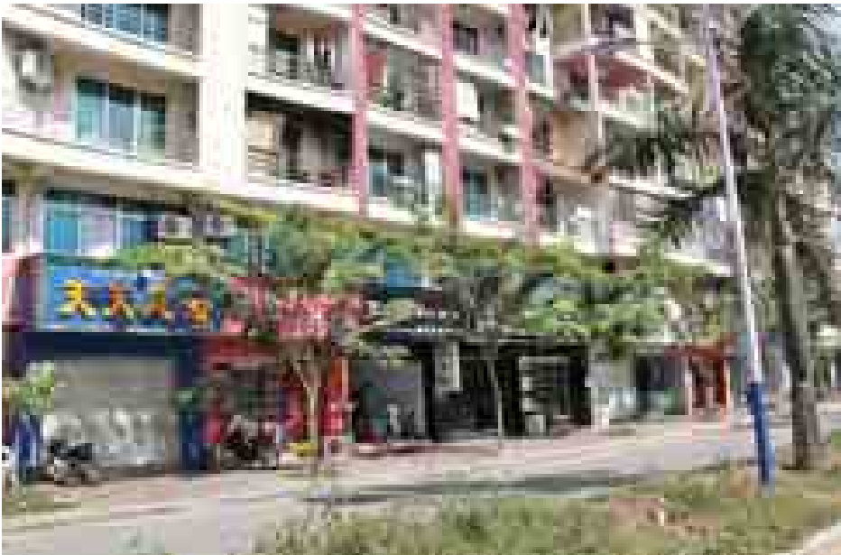
မိုင်းလားအထူးဒေသ(၄)ရှိ အတပ်မြင့် လူနေတိုက်ခန်းများကို တွေ့ရစဉ်။