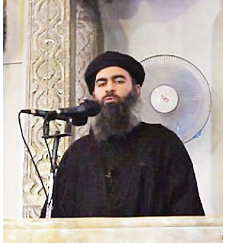
အိုင်အက်စ်ခေါင်းဆောင် အယ်လ်ဘက်ဒါဒီ။ လိမ္မန်းက အိုင်အက်စ်ခေါင်းဆောင် အယ်လ်ဘက်ဒါဒီအား အယ်ဒိုင်ဒါအဖွဲ့အား နှစ်ပေါင်းများစွာ ဦးဆောင်ခဲ့သည့် ဘင်လာဒင်နှင့်ခိုင်းနိုင်းကာ ဘင်လာဒင်လက်သစ်ဟု ဖော်ပြသည်။

ဘေရွတ် ဒီဇင်ဘာ ၂ အစ္စလာမစ်နိုင်ငံထူထောင်ရေးအဖွဲ့ (အိုင်အက်စ်)၏ ခေါင်းဆောင်အဘူဘေဂါအယ်လ်ဘက်ဒါဒီ၏ ဇနီးနှင့်သား ဖြစ်သူတို့အား လက်ဘနွန်နိုင်ငံက ဖမ်းဆီးထားကြောင်း ဒေသဆိုင်ရာသတင်းများက ဖော်ပြသည်။ ၎င်းတို့အား ဖမ်းဆီးထားသည်ဟု အင်န်ဘီဘီသတင်းဌာန၏ ဖော်ပြချက်အား လက်ဘနွန် ကာကွယ်ရေးဝန်ကြီးဌာနက အတည်ပြုခဲ့ပြီး လက်ဘနွန်ကာကွယ်ရေးဝန်ကြီးဌာန ပြောရေးဆိုခွင့်ရှိသူ ဗိုလ်မှူးကြီး အနစ်ခါယူရီက ၎င်းတို့အား လက်ဘနွန် စစ်ဘက်က စုံစမ်းစစ်ဆေးရန် စီစဉ်ထားကြောင်း ပြောကြားပြီး အသေးစိတ်အချက်အလက်များကိုမူ ထုတ်ဖော်ပြောကြားခြင်း မရှိပေ။ လက်ဘနွန်နိုင်ငံတွင် ထုတ်ဝေသော နေ့စဉ်သတင်းစာ အက်စ်ဘာမီယာ၌ အိုင်အက်စ်ခေါင်းဆောင် ဘက်ဒါဒီ၏ ဇနီးနှင့်သားဖြစ်သူတို့အား ဆီးရီးယားနယ်စပ်အနီး နယ်စပ် ဖြတ်ကျော်စခန်း၌ ဖမ်းဆီးခံခဲ့ရသည်ဟု ဖော်ပြပြီး ယင်းသို့ ဖမ်းဆီးခြင်းမှာ နိုင်ငံခြားထောက်လှမ်းရေးအေဂျင်စီများနှင့် ပူးပေါင်းဆောင်ရွက်ခဲ့ခြင်းကြောင့်ဖြစ်ကြောင်း ဖော်ပြသည်။ ပြင်သစ်နိုင်ငံတွင် ထုတ်ဝေသည့် နေ့စဉ်သတင်းစာ