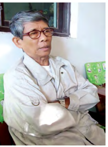
ဦးစိန်လှိုင်(မဟာဝိဇ္ဇာ)

မြန်မာနိုင်ငံ၏ ပထမဦးဆုံးသော သမ္မတကြီး စစ်ရွှေသိုက်လက်ထက် ၁၉၅၀ ပြည့်နှစ် ဇန်နဝါရီ ၄ ရက်တွင် “ဗိုလ်ရှု”သဘင်အခမ်းအနားစတင်ကျင်းပခဲ့သည်။ လွတ်လပ်ရေးနေ့ နေ့ထူးနေ့မြတ်အခါသမယ လွတ်လပ်ရေးနေ့ကို အလေးအနက်ထားသောအားဖြင့် သမ္မတ စစ်ရွှေသိုက်မှ သမ္မတမန်းဝင်းမောင်(၁၉၆၂)အထိ “ဗိုလ်ရှု”သဘင်ကျင်းပခဲ့ပြီး တော်လှန်ရေးကောင်စီလက်ထက် (၁၉၆၃)ခုနှစ်မှစ၍ လွတ်လပ်ရေးနေ့အထိမ်းအမှတ်အလံတင်အခမ်းအနားနှင့် ဗိုလ်ရှုသဘင်မကျင်းပနိုင်ခဲ့သည်မှာ နှစ်ပေါင်း ၅၀ ကျော်ရှိခဲ့ပြီဟု သိရသည်။ လက်ရှိအစိုးရသစ်လက်ထက်တွင် လွတ်လပ်ရေးနေ့အထိမ်းအမှတ်အလံတင်အခမ်းအနားနှင့်အတူ “ဗိုလ်ရှု”သဘင်ပြန်လည်ကျင်းပတော့မည်ဖြစ်ရာ “ဗိုလ်ရှု”သဘင်ဆိုသည့် အဓိပ္ပာယ်နှင့် “ဗိုလ်ရှုသဘင်”ကို ကိုယ်တိုင်ပါဝင်ဆင်နွှဲခဲ့သည့် ပုဂ္ဂိုလ်များနှင့် တွေ့ဆုံမေးမြန်းမှုကို ဖော်ပြအပ်ပါသည်။