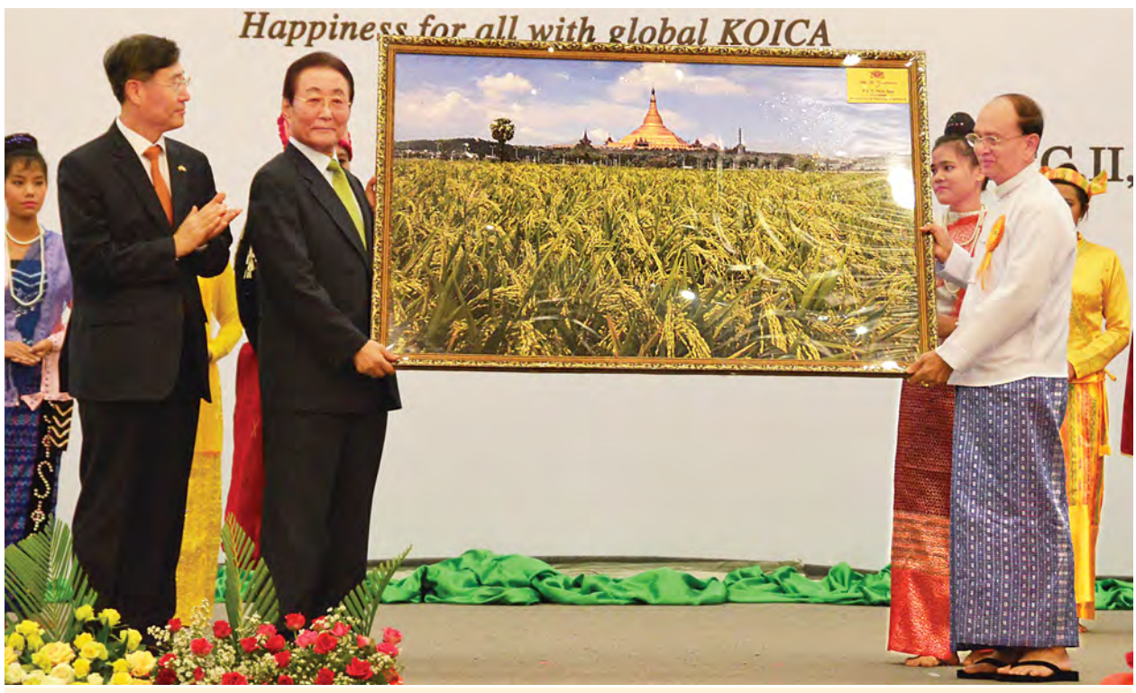
နိုင်ငံတော်သမ္မတ ဦးသိန်းစိန် ကိုရီးယားသမ္မတနိုင်ငံ ဝန်ကြီးချုပ်ဟောင်း မစ္စတာဂိုခွန်ထံ အမှတ်တရစပေးပန်းချီကားကို လက်ဆောင်ပေးအပ်စဉ်။ (သတင်းစဉ်)

အခမ်းအနားအပြီးတွင် နိုင်ငံတော်သမ္မတနှင့် ဧည့်သည်တော်များသည် ခန်းမအတွင်း၌ ပြသထားသော ကိုရီးယားအပြည်ပြည်ဆိုင်ရာ ပူးပေါင်းဆောင်ရွက် ရေးအေဂျင်စီ၏ သမိုင်းကြောင်းနှင့် ကျေးရွာသစ်လှုပ်ရှားမှု မှတ်တမ်း ဓာတ်ပုံများကို လှည့်လည်ကြည့်ရှုခဲ့ကြသည်။ (သတင်းစဉ်)