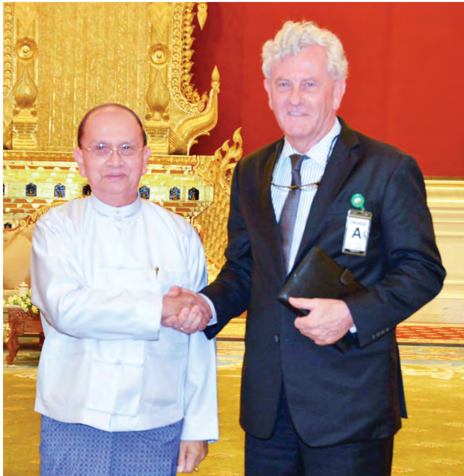
နိုင်ငံတော်သမ္မတ ဦးသိန်းစိန် နယ်သာလန်နိုင်ငံ သံအမတ်ကြီး မစ္စတာယိုအန်ဘူးရ်အား ရင်းရင်းနှီးနှီး နှုတ်ဆက်စဉ်။