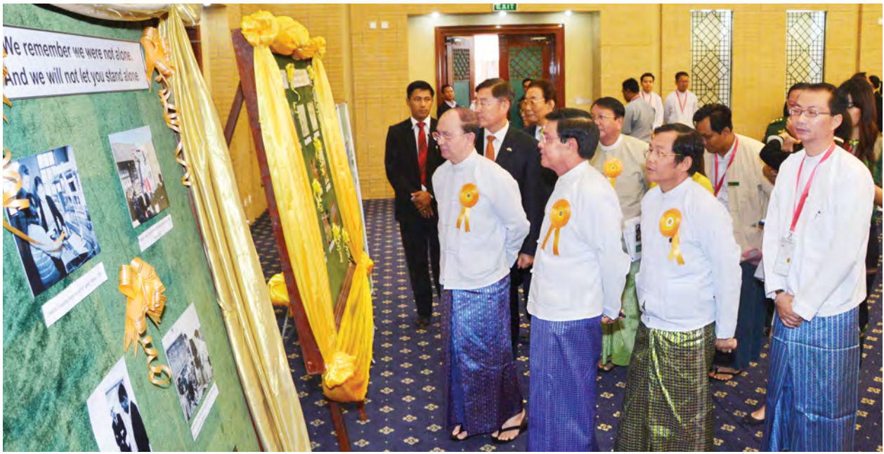
နိုင်ငံတော်သမ္မတ ဦးသိန်းစိန်နှင့် ဧည့်သည်တော်များ ခန်းမအတွင်း၌ပြသထားသော ကိုရီးယားအပြည်ပြည်ဆိုင်ရာ ပူးပေါင်းဆောင်ရွက်ရေး အေဂျင်စီ၏သမိုင်းကြောင်းနှင့် ကျေးရွာသစ်လှုပ်ရှားမှု မှတ်တမ်းဓာတ်ပုံများကို လှည့်လည်ကြည့်ရှုစဉ်။ (သတင်းစဉ်)

နိုင်ငံတိုင်းအတွက် နိုင်ငံဖွံ့ဖြိုးတိုးတက်ရေးနှင့် ပြည်သူတို့၏ လူမှုစီးပွား ဖွံ့ဖြိုးတိုးတက်ရေးတို့ကို ဆောင်ရွက်ရာတွင် ဖွံ့ဖြိုးတိုးတက်ရေးမူဝါဒနှင့် ဖွံ့ဖြိုး တိုးတက်ရေး မဟာဗျူဟာတို့ မှန်ကန်ကောင်းမွန်စေရန်အတွက် လိုအပ်သည် များရရှိမည်ဖြစ်ပါကြောင်း၊ မှန်ကန်ကောင်းမွန်စေရန်အတွက် ပညာရှင်များ၏ လေ့လာသုတေသနပြုမှုများနှင့် တိုင်းရင်းသားပြည်သူအားလုံး၏ အကြံပြု ဆွေးနွေးချက်များ မရှိမဖြစ်လိုအပ်ပါကြောင်း။