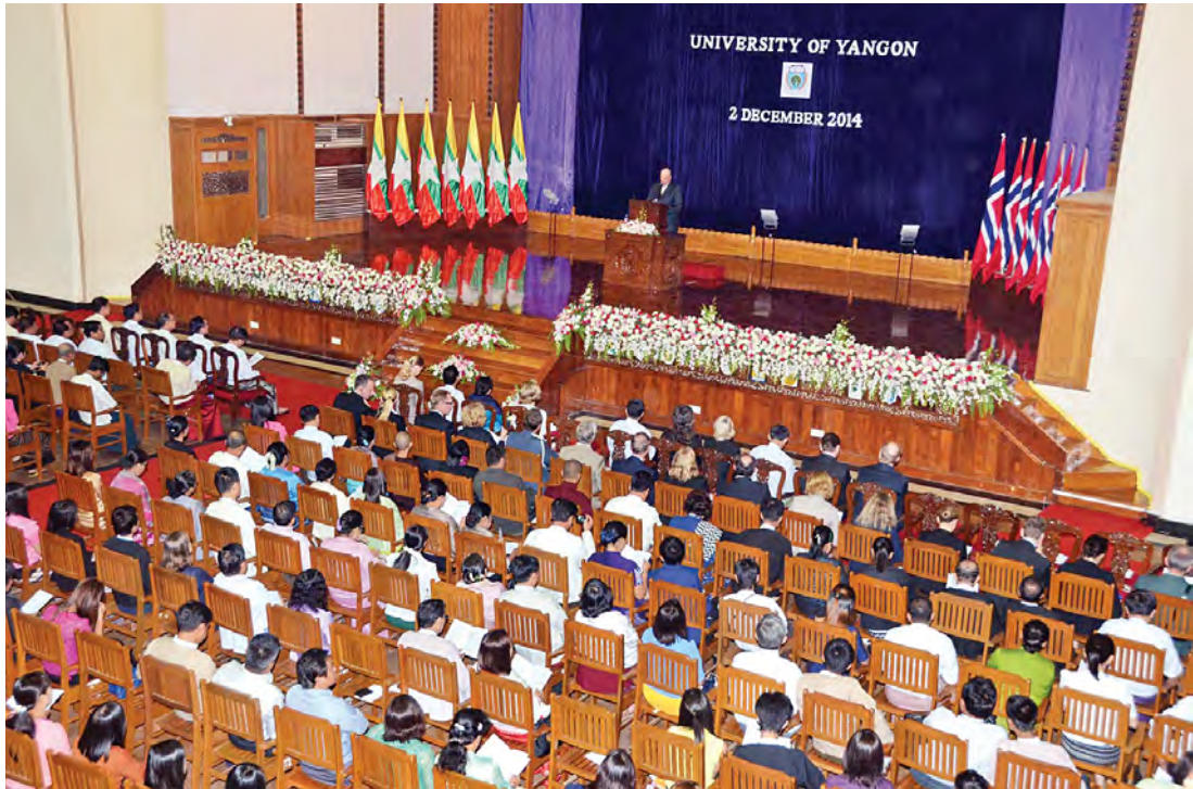
နော်ဝေနိုင်ငံ ပဉ္စမမြောက် ဟာရယ်ဘုရင် ရန်ကုန်တက္ကသိုလ်ဘွဲ့ နှင်းသဘင်ခန်းမ၌ မိန့်ခွန်းပြောကြားစဉ်။

နော်ဝေနိုင်ငံ ပဉ္စမမြောက်ဘုရင်က “ဤသမိုင်းဝင်ဘွဲ့ နှင်းသဘင်ခန်းမဆောင်ကြီးမှာ လူကြီးမင်းတို့ကို မိန့်ခွန်းပြောကြားခွင့်ရတဲ့အတွက် ဂုဏ်ယူမိပါတယ်” ဟူသည့် စာမျက်နှာ ၈ ကော်လံ ၁ သို့ ၀