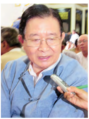
ပြည်ထောင်စုဝန်ကြီး ဦးအောင်မင်း။

ဆက်လုပ်သွားမှာပါ။ တိုင်းပြည်၏ မျက်စိဖြစ်သော သက်ကြီးစာပေပညာရှင်များအား ပူဇော်ကန်တော့ပွဲမှသည် မျိုးဆက်သစ်များအနေဖြင့် ရှေးယခင် စာပေပညာရှင်များကဲ့သို့ နိုင်ငံနှင့်လူမျိုးအကျိုးပြုစာပေများ ရေးသားနိုင်သူများဖြစ်လာကြစေရန် ရည်သန်၍ စုစည်းရေးသားလိုက်ရပါသည်။