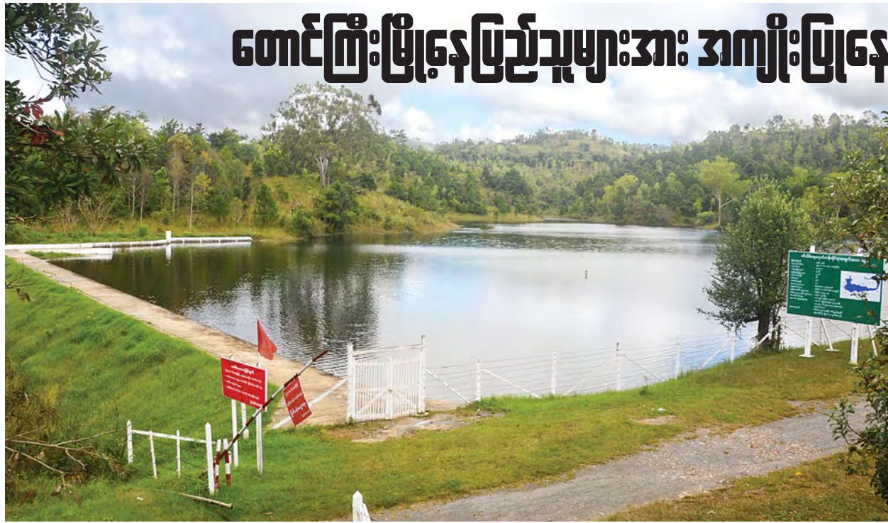
တောင်ကြီးမြို့အား သောက်သုံးရေထောက်ပံ့ပေးနေသော ထီသိမ်ရေလှောင်ကန်ကို တွေ့ရစဉ်။

သတင်းမှတ်စု - စိုးစိုးနိုင်(ကြေးမုံ) ❖ ဓာတ်ပုံ-ဌေးအောင်(ကြေးမုံ)