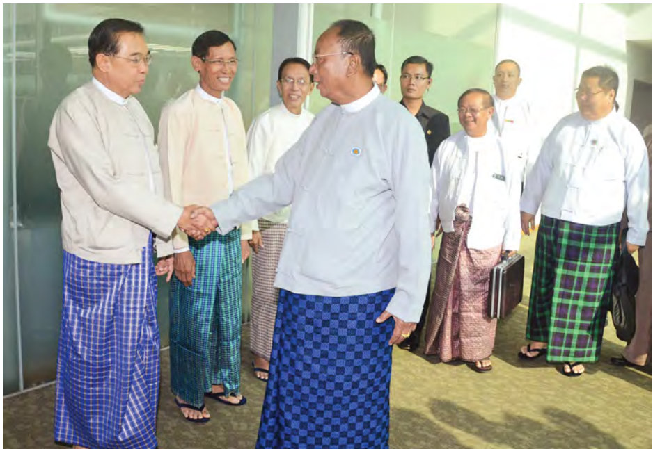
အမျိုးသားလွှတ်တော်ဥက္ကဋ္ဌ ဦးခင်အောင်မြင့်နှင့် အမျိုးသားလွှတ်တော်ကိုယ်စားလှယ်အဖွဲ့ဝင်များသည် ထိုင်းနိုင်ငံသို့ ထွက်ခွာသွားရာတွင် အချစ်ကြည်ရေးခရီးထွက်ခွာနေကြောင်း ဖော်ပြရန် ရုပ်ပုံများကို ဖော်ပြထားပါသည်။

ထိုင်းနိုင်ငံ အမျိုးသားဥပဒေပြု ညီလာခံဥက္ကဋ္ဌ H.E. Prof. Pompech Wichitcholchai ၏ ဖိတ်ကြားချက်အရ နိုဝင်ဘာ ၂၃ ရက်မှ ၂၅ ရက်အထိ ချစ်ကြည်ရေး ခရီးသွားရောက်ရန် ယနေ့မနက် ၂ နာရီ မိနစ် ၅၀ တွင် လေကြောင်း ခရီးဖြင့် ထိုင်းနိုင်ငံသို့ထွက်ခွာသွား ကြသည်။