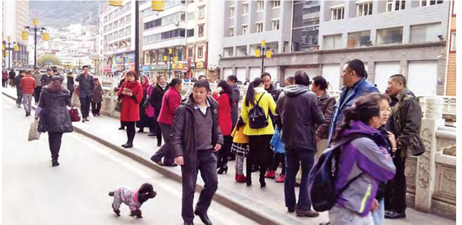
လျှင်လျှင်ခတ်ပြီးနောက် လမ်းပေါ်ထွက်နေသည့် ဒေသခံများကို တွေ့ရစဉ်။