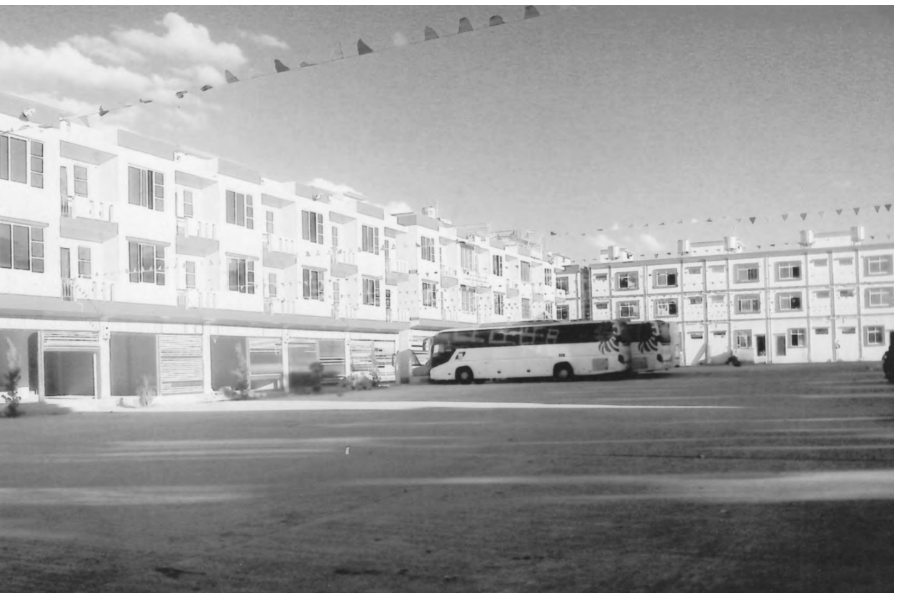
သိန်း ၆၅၀ နှင့် အတွင်းနှစ်ထပ်ခန်းကို သိန်း ၂၅၀ ဖြင့် ရောင်းချပေးခဲ့ ကြောင်း သိရသည်။ မူဆယ်အဝေးပြေး ယာဉ်ရပ်နား စခန်းတွင် ဘဏ်လေးခု ပါရှိမည် ဖြစ်ပြီး စားသောက်ဆိုင်၊ လက်ဖက် ရည်ဆိုင်၊ ဈေးဆိုင်ခန်းများပါဝင် သည်။ မူဆယ် ယာဉ်ရပ်နားစခန်း တည်ဆောက်ထားသည့် အတွက် ယာဉ်မူ၊ ယာဉ်နောက်လိုက်နှင့် ခရီး သည်များမှာ လုံခြုံစိတ်ချစွာ တည်းခို နိုင်မည်ဖြစ်သည်။ ယင်းအပြင် နယ်စပ် ကုန်သွယ်ရေးဖြစ်သော မိမိနိုင်ငံ ထွက်ကုန်များကို ကြိုက်စေ့ဖြင့် ပြည် ပသို့ အမြန်ဆုံး တင်ပို့သွားနိုင်မည် ဖြစ်သည်။ တင်လွင်(မိတ္ထီလ)

ခြောက်ခန်းတွဲ သုံးထပ် ခုနှစ်လုံး၊ ခုနှစ် ခန်းတွဲ သုံးထပ် လေးလုံး၊ ငါးခန်းတွဲနှစ် ထပ်နှင့် ခေတ်မီအာစီတိုက်ခန်းများ ပါဝင်ပြီး အခန်းတိုင်းတွင် ရေ၊ မီး၊ သန့် စင်ခန်းများ ပါဝင်သည်။ အဆောက် အအုံ ၄၄ လုံး ရှိပြီး အခန်းပေါင်း ၂၀၂ ခန်းရှိ၍ အမြင့် ၃၅ ပေ၊ မျက်နှာစာ ပေ ၂၀ ရှိ တိုက်ခန်းများဖြစ်သည်။ တိုက်ခန်းများတွင် သောက်သုံး ရေ လုံလောက်စွာ ရရှိရေးအတွက် မြို့ရေပေးရေး ရေပိုက်လိုင်းမှ အဝေး ပြေး ယာဉ်ရပ်နားစခန်းသို့ H.D.PE 99MM ပိုက် ၅၄၄၈ ပေဖြင့် သွယ်တန်း ထားသည်။ တိုက်ခန်းတိုင်းတွင် သောက်သုံးရေ လုံလောက်စွာရရှိရေး၊ ရေဆိုးစွန့်ထုတ်မှုနှင့် မိလ္လာစနစ်များ ကို နောက်ဆုံးပေါ် နည်းစနစ်များဖြင့် တပ်ဆင်ထားသည်။ မူဆယ် အဝေး ပြေး ယာဉ်ရပ်နားစခန်းကို သိန်းသန်း ချီဆောက်လုပ်ရေး ကုမ္ပဏီ လီမိ တက်က ကျပ်သိန်းပေါင်း ၂၂၇၄၉ ဒသမ ၉၈၅ ရင်းနှီးမြုပ်နှံ ဆောက် လုပ်ခဲ့ခြင်းဖြစ်ပြီး ၂၀၁၂ ခုနှစ်၊ နိုဝင် ဘာလမှ စတင်တည်ဆောက်ခဲ့ရာ ၂၀၁၄ ခုနှစ် မေလအထိ တစ်နှစ်နှင့် ခြောက်လအတွင်း အပြီးတည် ဆောက်ခဲ့ခြင်းဖြစ်သည်။ မူဆယ်မြို့အဝေးပြေး ယာဉ်ရပ် နားစခန်းတွင် ကားဂိတ် ၂၉ ခုရှိပြီး မျက်နှာစာတိုက်ခန်းများကို သိန်း ၇၅၀၊ အတွင်းခန်း သုံးထပ်ခန်းကို