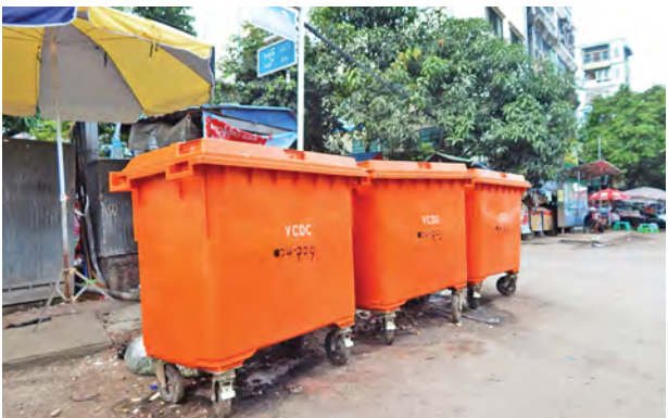
အမှိုက်သိမ်းယာဉ်၊ ယန္တရားနှင့် ကြောင်း ရန်ကုန်မြို့တော်စည်ပင် ထွန်စက်အပါအဝင် စုစုပေါင်း ၃၂၈ စီး ချထားပေးကြောင်းနှင့် လမ်းပေါ်ရှိ စွန့်ပစ်အမှိုက်သိမ်းဆည်းသော အဝါ ရောင်ဝတ်ဆင်ကြသည့် ဝန်ထမ်း အင်အားမှာ စုစုပေါင်း ၃၇၇၂ ဦးရှိ ကြောင်း သိရသည်။

ထပ်မံတိုးချဲ့ချထားပေးကြောင်းနှင့် လမ်းမများရှိ မူလကထားရှိသော စွန့်ပစ်အမှိုက်ပုံးအစိမ်းရောင်များကို သိမ်းဆည်းပြီး လမ်းသွယ်များတွင် တိုးမြှင့်ချထားပေးကြောင်း သိရသည်။ လောလောဆယ်တွင် ၂၄၀ လီတာ ဆုံ စွန့်ပစ်အမှိုက်ပုံး အစိမ်းရောင် ၂၉၄၈လုံး၊ ၆၆၀ လီတာဆုံ စွန့်ပစ် အမှိုက်ပုံးအစိမ်းရောင် ၂၅၉၅ လုံးနှင့် ၆၆၀ လီတာဆုံ စွန့်ပစ်အမှိုက်ပုံး လိမ္မော်ရောင် ၁၅၁၂ လုံး ချပေးထား ပြီးဖြစ်ကြောင်း သိရသည်။ ထို့အပြင် ဘီးတပ်အမှိုက်သိမ်း လှည်း ၄၈၂ စီးကို မြို့တော်စည်ပင် နယ်နိမိတ်အတွင်းရှိ ၃၃ မြို့နယ်တွင် မြို့တော်အလိုက် ခွဲဝေချထားပေး ကြောင်း၊ ရန်ကုန်မြို့တော်အတွင်း