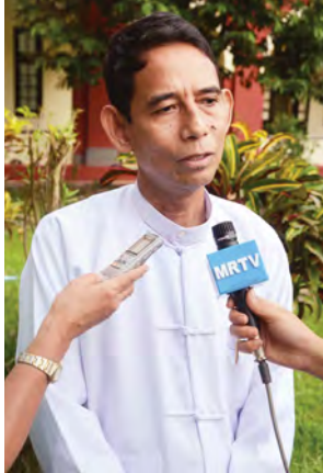
ဒေါက်တာအောင်သူ ရန်ကုန်တက္ကသိုလ်ပါမောက္ခချုပ်

၂၀၁၄-၂၀၁၅ ပညာသင်နှစ်အဆောင်တွေပြုပြင်တာနဲ့ပတ်သက်လို့ ကျောင်းတွေက ဒီဇင်ဘာလဆန်းပြန်ဖွင့်မှာလေ။ အဆောင်မှာပြုပြင်ရေးလုပ်ငန်းဆောင်ရွက်နေသူအားလုံးကို မှာထားတာက အတွင်းပိုင်းပြင်ဆင်မှုကိုတော့ လမကုန်မီ အပြီးပြင်ပေးရမယ်လို့ပြောထားတယ်။ အတွင်းပိုင်းပြင်ဆင်မှုကတော့ ရာခိုင်နှုန်းပြည့်ပြီးပြီ။ ဆေးသုတ်တာတို့၊ ဘာတို့ကတော့ နည်းနည်းပဲကျန်တာပါ။ ကျောင်းသားလက်ခံမှုအနေနဲ့ ဘာသာရပ်အသီးသီးမှာ ထူးချွန်တဲ့ ကျောင်းသားတွေ သတ်မှတ်တဲ့အမှတ်တွေနဲ့ အဆင့်မြင့်ပညာဦးစီးဌာနအနေနဲ့ ကြေညာပေးပြီး ထူးချွန်တဲ့ ကျောင်းသားတွေ အကုန်လုံးကိုလက်ခံပါမယ်။ လက်ခံတဲ့ ဘာသာရပ်အနေနဲ့ ဘာသာရပ်ကြီး ၁၂ ခုပါ။ ဘာသာတစ်ခုကို အများဆုံး ၅၀ လက်ခံပါမယ်။ အဲဒီအထဲက အမှတ်တွေကို ထပ်မံပေးသေးတယ်။ သတ်မှတ်တယ်ဆိုတာ အမှတ်စုစုပေါင်းရခြင်းဆိုတာရယ်၊ ဥပမာ ဓာတုဗေဒယူတယ်ဆိုရင် ဓာတုဗေဒရမှတ်ကအနည်းဆုံး ၉၀ ရရင်၊ အမှတ် စုစုပေါင်းက ၄၉၀ ရရင် နိုင်ငံတော်က လစဉ် တစ်သိန်းချီးမြှင့်တယ်။ ဟိုအရင်တုန်းက ရှိခဲ့ဖူးပါတယ်။