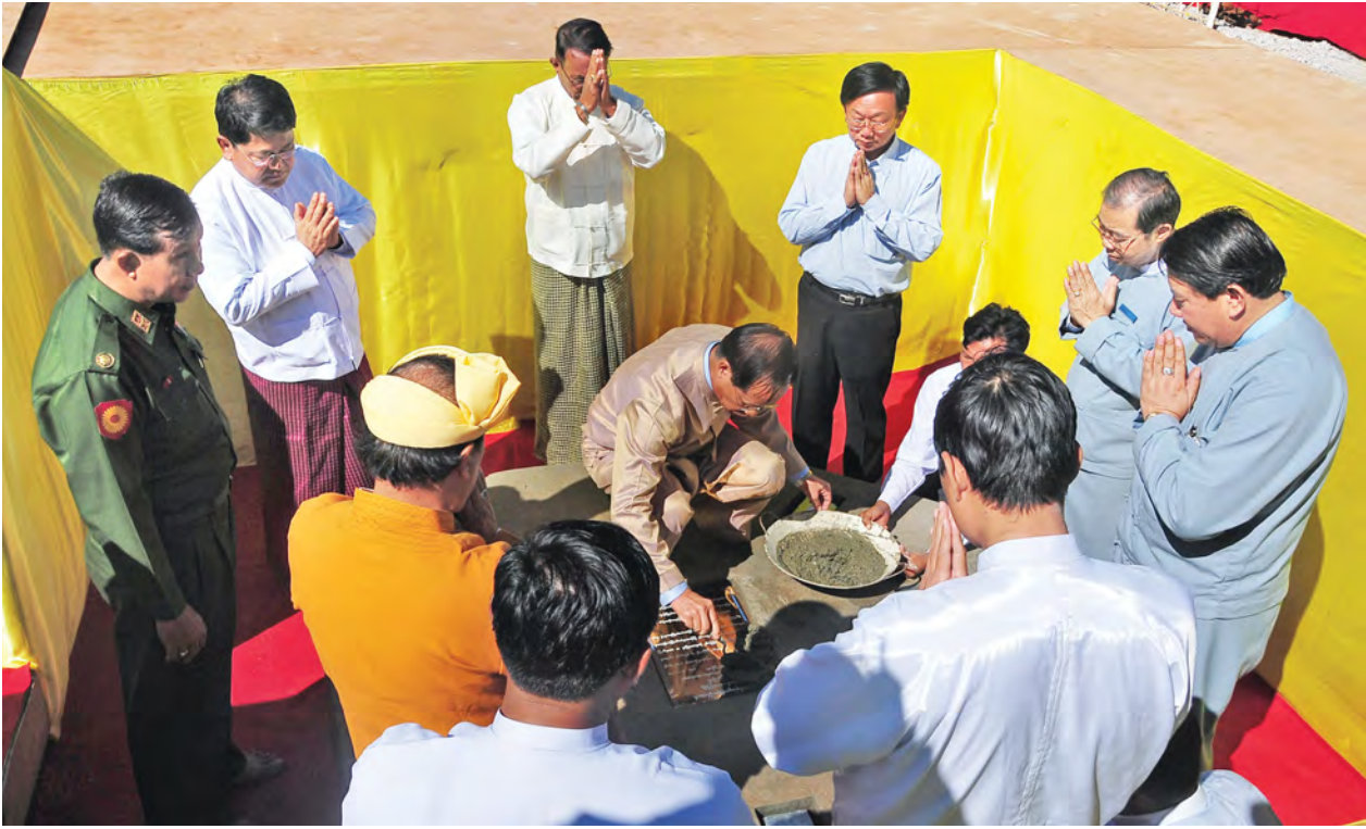
ဒုတိယသမ္မတ ဒေါက်တာစိုင်းမောက်ခမ်း ရတနာအုတ်မြစ်တော်များ စီသွင်းပေးစဉ်။

ယင်းနောက် ရတနာအုတ်မြစ်တော်စီမံကိန်းလာအခမ်းအနားကို ဆက်လက်ကျင်းပရာ ဒုတိယသမ္မတ ဒေါက်တာစိုင်းမောက်ခမ်း၊ ပြည်ထောင်စုဝန်ကြီး၊ ပြည်နယ်ဝန်ကြီးချုပ်၊ တိုင်းမှူးနှင့် တာဝန်ရှိသူများက ရတနာကြွတ်တော်နှင့် ရတနာအုတ်မြစ်တော်များကို ပင့်ဆောင်၍ မင်္ဂလာအချိန်၌ သတ်မှတ်နေရာများအလိုက် စာမျက်နှာ ၃ ကော်လံ ၁ သို့ ၂