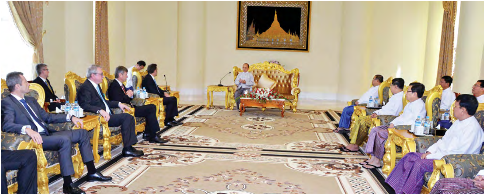
အရင်းအမြစ် ဖွံ့ဖြိုးတိုးတက်ရေး လေ့ကျင့်သင်ကြားမှု လုပ်ငန်းများ များ၊ စက်ပစ္စည်းကိရိယာများဖြင့် ရေရှည်စွမ်းအားပြည့်ထုတ်လုပ်နိုင်ရေး၊ အင်ဂျင်နီယာပညာရပ်ဆိုင်ရာ တို့ကို ရင်းနှီးပွင့်လင်းစွာ ဆွေးနွေးခဲ့ကြ ပညာတော်သင်များ စေလွှတ်နိုင်ရေး သည်။ (သတင်းစဉ်)

နေပြည်တော် နိုဝင်ဘာ ၂၀ ပြည်ထောင်စုသမ္မတမြန်မာနိုင်ငံတော် နိုင်ငံတော်သမ္မတ ဦးသိန်းစိန်သည် ဩစတြီးယားနိုင်ငံ ANDRITZ HYDRO ၏ဥက္ကဋ္ဌ မစ္စတာ ဝယ်ကန်စမ်ပါ ဦးဆောင်သည့် ကိုယ်စားလှယ်အဖွဲ့အား ယနေ့နံနက် ၁၁ နာရီ ၁၅ မိနစ်တွင် နိုင်ငံတော်သမ္မတအိမ်တော် ဧည့်ခန်းမ၌ လက်ခံတွေ့ဆုံသည်။(ယာဝုံ) အဆိုပါတွေ့ဆုံပွဲသို့ ပြည်ထောင်စုဝန်ကြီး ဦးဝဏ္ဏမောင်လွင်၊ ဦးစိုးသိန်း၊ ဦးတင်နိုင်သိန်း၊ ဦးခင်မောင်စိုး၊ ဦးဇေယျာအောင်နှင့် တာဝန်ရှိသူများ တက်ရောက်ကြပြီး ဩစတြီးယားနိုင်ငံ ANDRITZ HYDRO ဥက္ကဋ္ဌ ဦးဆောင်သည့် ကိုယ်စားလှယ်အဖွဲ့နှင့် အတူ မြန်မာနိုင်ငံဆိုင်ရာ ဩစတြီးယားနိုင်ငံ သံအမတ်ကြီး မစ္စတာ အန်နိုရီဖီနစ်လည်း တက်ရောက်သည်။ ထိုသို့ တွေ့ဆုံစဉ် ရေအားလျှပ်စစ်ထုတ်ယူရေးကဏ္ဍများတွင် ရင်းနှီးမြှုပ်နှံရေး၊ ပတ်ဝန်းကျင်ထိန်းသိမ်းရေးလုပ်ငန်းများနှင့် လူမှုရေးလုပ်ငန်းများ ပြည့်စုံစွာဆောင်ရွက်ရေး၊ လူ့စွမ်းအားအတွက်