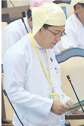
ဒုတိယဝန်ကြီး ဒေါက်တာပွင့်ဆန်း။

ရှေးဦးစွာ လွှတ်တော်ဥက္ကဋ္ဌက အမျိုးသားလွှတ်တော်က အတည်ပြုပြီးပေးပို့ထားသော ပြည်ထောင်စုအဆင့်ပုဂ္ဂိုလ်များ၏ ချီးမြှင့်ငွေ၊ စရိတ်နှင့် အဆောင်အယောင်များဆိုင်ရာ ဥပဒေကို ပြင်ဆင်သည့်ဥပဒေကြမ်း၊ နေပြည်တော်ကောင်စီဥက္ကဋ္ဌနှင့် ကောင်စီဝင်များ၏ ချီးမြှင့်ငွေ၊ စရိတ်နှင့် အဆောင်အယောင်များ ဆိုင်ရာ ဥပဒေကို ပြင်ဆင်သည့်ဥပဒေကြမ်းနှင့် ကိုယ်ပိုင်အုပ်ချုပ်ခွင့်ရတိုင်း သို့မဟုတ် ကိုယ်ပိုင်အုပ်ချုပ်ခွင့်ရဒေသ ဥက္ကဋ္ဌနှင့် အလုပ်အမှုဆောင်ကော်မတီဝင်များ၏ ချီးမြှင့်ငွေ၊ စရိတ်နှင့် အဆောင်အယောင်များဆိုင်ရာ ဥပဒေကို ပြင်ဆင်သည့်ဥပဒေကြမ်းတို့အား ပြည်သူ့လွှတ်တော်က ပြင်ဆင်ချက်မပြုဘဲ သဘောတူကြောင်း ဆုံးဖြတ်ချက် ပေးပို့လာခြင်းကို လွှတ်တော်သို့ အသိပေးတင်ပြသည်။