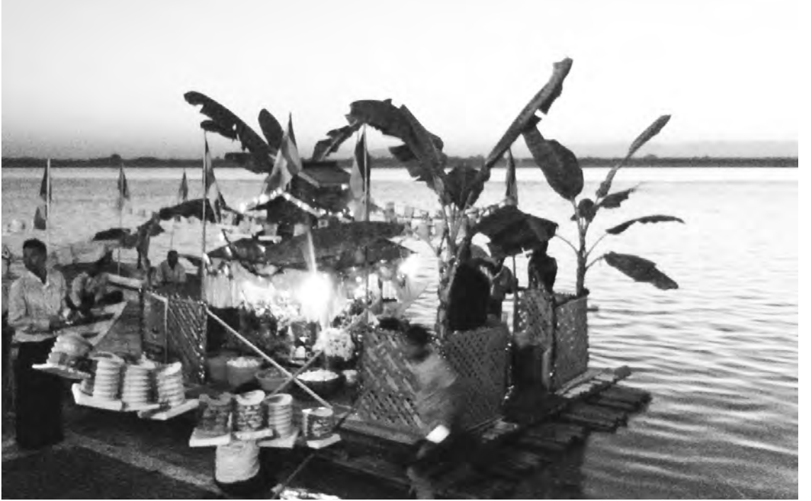
ကို မြစ်ညာသို့ ပင့်ဆောင်ခြင်းတို့ကို မင်္ဂလာအခါတော်ပေး ဦးသန်းငွေက ပါဝင်ဆောင်ရွက်ပေး၍ ရွှေဖောင်တော်အား မီးရှူးမီးပန်းများ လွှတ်တင်ပူဇော်ခြင်းနှင့်အတူ ရွှေဖောင်တော်လွှတ်ပူဇော်ကြသည်။ ထို့နောက် ဆရာတော်နှင့်အတူ ဝန်ကြီးချုပ်အမှူးပြုသော ဧည့်သည်တော်များ၊ ကိုးဆယ်ဆ အနန္တမေတ္တာ လူမှုကူညီရေးအသင်းသူ၊ အသင်းသားများနှင့် တက်ရောက်လာကြသူများက ရွှေကြာဆီမီး ၂၇၀၀ ကို ရေမျှောပူဇော်၍ အရပ် ၁၀ မျက်နှာမေတ္တာပို့ဖြင့် အနန္တသတ္တဝါများအားလုံးကို မေတ္တာပို့အမှုဝေကာ အခမ်းအနားကို အောင်မြင်စွာရုပ်သိမ်းခဲ့ကြောင်း သိရသည်။ မြင့်နိုင်နိုး (ဖိုးလှိုင်မြေ)

ဆ အနန္တမေတ္တာ လူမှုကူညီ ရေးအသင်းသူ၊ အသင်းသားများ၊ မြို့နယ်အတွင်းရှိ ကျေးရွာ အသီးသီးတို့မှ ပြည်သူများ၊ ဆရာ၊ ဆရာမများနှင့် ကျောင်းသား၊ ကျောင်းသူများ တက်ရောက်ခဲ့ကြသည်။ အစီအစဉ်အရ ကောင်းမြတ်သော ညချမ်းမဟာမင်္ဂလာအချိန်တွင် ရန်ကုန်တိုင်းဒေသကြီး သံဃနာယကဥက္ကဋ္ဌဆရာတော်၊ စစ်ကိုင်းတိုင်းဒေသကြီး ဝန်ကြီးချုပ် ဦးသာအေး၊ ပြည်သူ့လွှတ်တော်ကိုယ်စားလှယ် ဦးအုန်းငွေ၊ တိုင်းဒေသကြီး စည်ပင်ဝန်ကြီး ဦးတင်လှိုင်မြင့်၊ တိုင်းဒေသကြီးလွှတ်တော် ကိုယ်စားလှယ် ဦးဝင်းနိုင်၊ ဦးညွန့်ရွှေတို့က ဖဲကြီးဖြတ်ဖွင့်လှစ်ပေးခဲ့သည်။ ယင်းနောက် ကိုးဆယ်ဆ အနန္တမေတ္တာလူမှုကူညီရေးအသင်းနှင့် တာဝန်ရှိသူများက မီးပုံးပုံအလုံးရေ ၅၄၀ နှင့် မီးရှူးမီးပန်းများကို လွှတ်တင်ပူဇော်ခြင်း၊ ထီးလှိုင်ရှင်စေတီတော်မြတ်ကြီးအား ဆီးမီး၁၀၀၀ ပူဇော်ခြင်းတို့ ပြုလုပ်ခဲ့ကြသည်။ ထို့နောက် ဒေဝနိမန္တနဂါထာဖြင့် နတ်ဗြဟ္မာများအား ပင့်ဖိတ်၍ ဆရာတော်နှင့်ဧည့်သည်တော်များက ဘောဂဝတီနဂါးပြည်မှ နဂါးမင်းကြီးများအား နဂါးစာဖြင့် အစာအာဟာရကျွေးမွေးလှူဒါန်းခဲ့ကြောင်း သိရသည်။ ဆက်လက်၍ ရှင်ဥပဂုတ္တမထေရ်မြတ်ကြီးအား စံမြန်းတော်မူမည့် ရွှေဖောင်တော်ပေါ်သို့ ပင့်လျှောက်ခြင်း၊ ရွှေဖောင်တော်