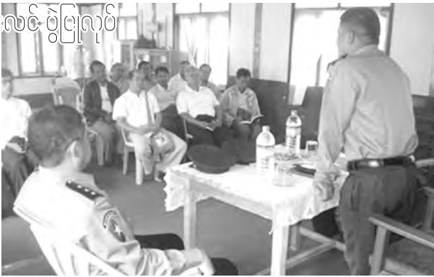
အနေ၊ ပြည်သူများအနေဖြင့်လည်း အချိန်နှင့်တစ်ပြေးညီ သတင်းများ ပေးပို့ကြစေလိုကြောင်းနှင့် တရားခံပြေးများအား လက်သင့်ခံခြင်းတို့၏ ပြစ်မှု၊ ပြစ်ဒဏ်များကို ချပြရှင်းလင်းခဲ့သည်။ ဆက်လက်၍ ရှင်းလင်းပွဲတက်ရောက်လာကြသူများမှ အကြံပြုချက်များ ဆွေးနွေးတင်ပြကြပြီး သိရှိလိုသည်များကို မေးမြန်းခဲ့ရာ တာဝန်ရှိသူများက ပြန်လည်ဖြေကြားခဲ့ကြောင်း သိရသည်။ သူရအောင်(မြန်/ဆက်)

မြို့ပေါ်ရပ်ကွက် အုပ်ချုပ်ရေးမှူးများ၊ နိုင်ငံရေးပါတီများ၊ ဘာသာရေးအဖွဲ့အစည်းများ၊ လူမှုရေးအဖွဲ့အစည်းများနှင့် ပြည်သူလူထုများ တက်ရောက်ခဲ့ကြသည်။ ရှင်းလင်းပွဲတွင် မြို့နယ်ရဲတပ်ဖွဲ့မှူး၊ ရဲမှူးရဲလွင်ဦးက အဖွင့်အမှာစကားပြောကြားပြီး မြို့မရဲစခန်းစခန်းမှူး၊ ဒုရဲမှူးတင်မောင်လေးက မြို့မရဲစခန်းပိုင်နယ်မြေအတွင်း မှုခင်းများအခြေအနေနှင့် မှုခင်းဖော်ထုတ်နိုင်မှု အခြေအနေများ ရှင်းလင်းခြင်း၊ ပြည်ထဲရေးဝန်ကြီးဌာနနှင့် မြန်မာနိုင်ငံရဲတပ်ဖွဲ့ဌာနချုပ်တို့မှ ချမှတ်ပေးသည့် တရားခံပြေးများ ဖမ်းဆီးရမိရေး ညွှန်ကြားချက်အပေါ် ဆောင်ရွက်မှု အခြေ