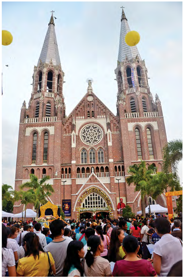
မြန်မာနိုင်ငံသို့ ကက်သလစ်ဘာသာဝင်များရောက်ရှိခြင်း နှစ် ၅၀၀ ပြည့် အထိမ်းအမှတ်ပွဲတော် ကျင်းပစဉ်။