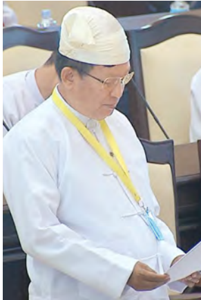
ဒုတိယဝန်ကြီး ဦးတင်ဦးလွင်။

ယင်းရုပ်သိမ်းသည့် ဥပဒေကြမ်းနှင့်စပ်လျဉ်းသည့် အစီရင်ခံစာကို အမျိုးသားလွှတ်တော် ဥပဒေကြမ်း