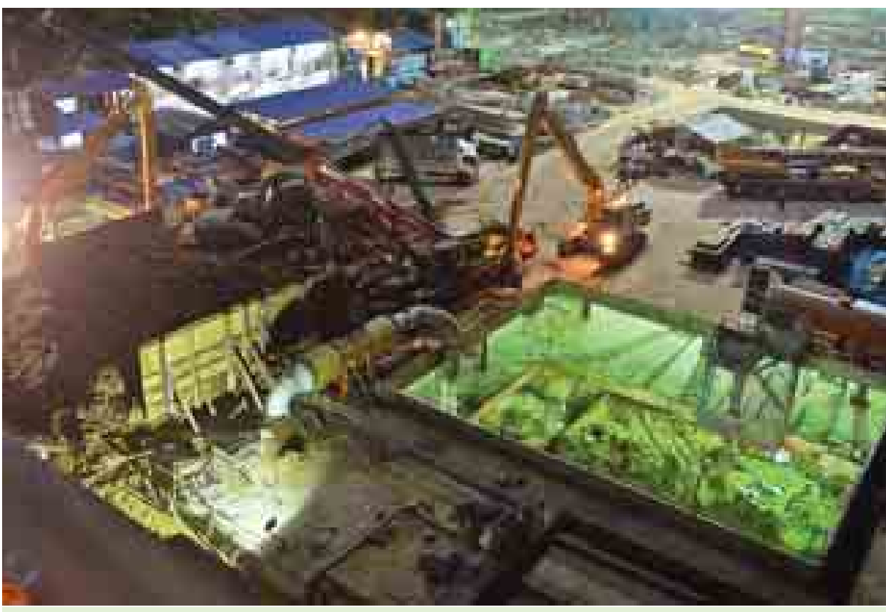
ဗိုလ်ချုပ်ဈေးရှိ ဆောက်လုပ်ရေးလုပ်ငန်းခွင်အတွင်း မြေကြီးများ မတော်တဆပိတ်စဉ်မှုဖြစ်ပွားရာနေရာကို တွေ့ရစဉ်။

ရန်ကုန် နိုဝင်ဘာ ၂၀ ပန်းဘဲတန်းမြို့နယ်အတွင်းရှိ ဗိုလ်ချုပ်ဈေးလုပ်ငန်းခွင်ဖြစ်သည့် Shwe Taung Development Co., Ltd မှ တည်ဆောက်လျက်ရှိ သော ဆောက်လုပ်ရေးလုပ်ငန်းခွင် အတွင်း မတော်တဆ မြေပိတ်စဉ်မှု နိုဝင်ဘာ ၂၀ ရက် ညနေပိုင်းက ဖြစ်ပွားခဲ့သည်။