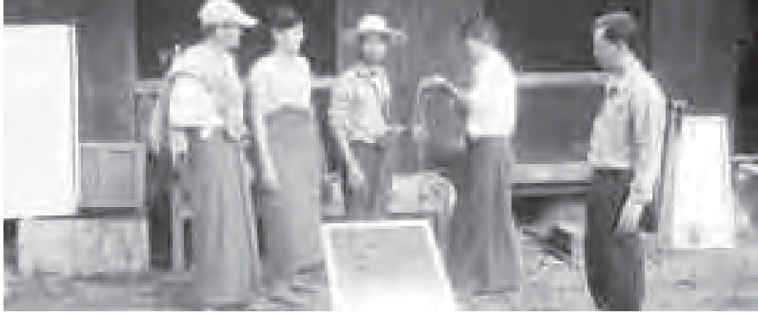
ကံမ၊ နိုဝင်ဘာ ၂၀

ကျေးလက်နေပြည်သူများ လူမှုစီးပွားဘဝတိုးတက်ရေးတွင် လျှပ်စစ်မီးရရှိရေးသည် အဓိကဖြစ်သည့်အလျောက် နိုင်ငံတော်မှ စီမံချက်များချမှတ်၍ အကောင်အထည်ဖော် ဆောင်ရွက်လျက်ရှိရာ ကံမမြို့နယ် ဖရုံလှကျေးရွာတွင် နိုဝင်ဘာ ၁၉ ရက်က ကျေးလက် ဒေသ ဖွံ့ဖြိုးတိုးတက်ရေးဦးစီးဌာနမှ နေရောင်ခြည်စွမ်းအင်သုံး