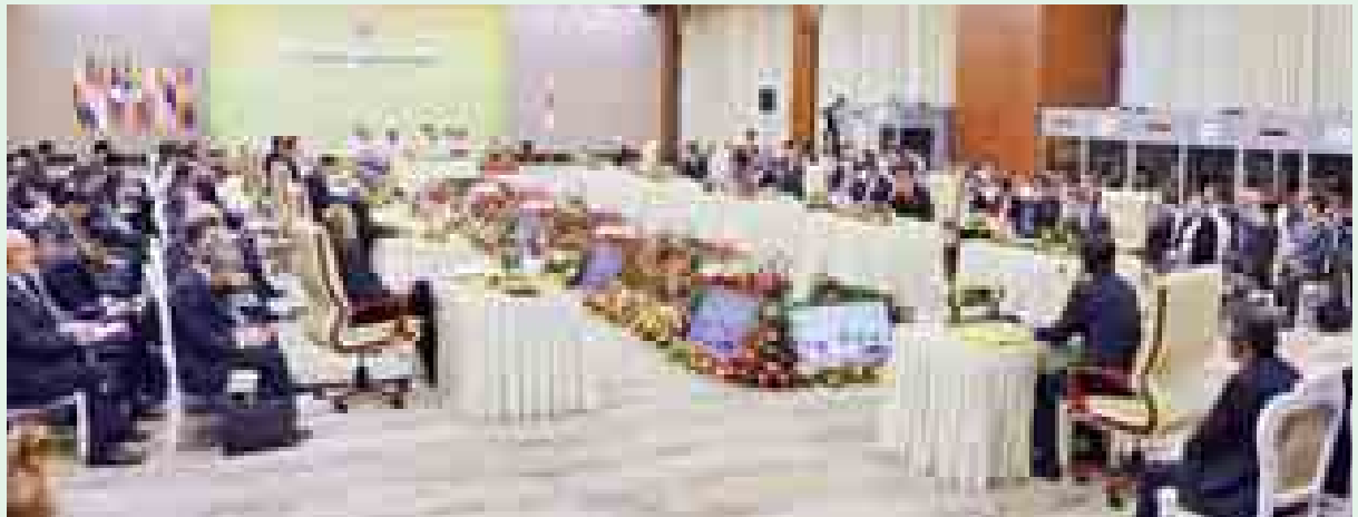
နိုဝင်ဘာ ၁၂ ရက်က (၁၇)ကြိမ်မြောက် အာဆီယံ-ဂျပန် ထိပ်သီးအစည်းအဝေး ကျင်းပစဉ်။