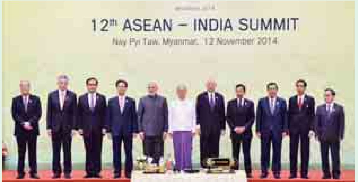
နိုဝင်ဘာ ၁၂ ရက်ကျင်းပသော (၁၂)ကြိမ်မြောက် အာဆီယံ-အိန္ဒိယ ထိပ်သီးအစည်းအဝေးတွင် နိုင်ငံတော်သမ္မတ ဦးသိန်းစိန်နှင့် အာဆီယံ နိုင်ငံများမှ နိုင်ငံ့ခေါင်းဆောင်များ၊ အစိုးရအဖွဲ့အကြီးအကဲများ၊ အိန္ဒိယဝန်ကြီးချုပ် နရန်ဒရာမိုဒီနှင့် အာဆီယံအတွင်းရေးမှူးချုပ်တို့ စုပေါင်း မှတ်တမ်းတင်ဓာတ်ပုံရိုက်စဉ်။