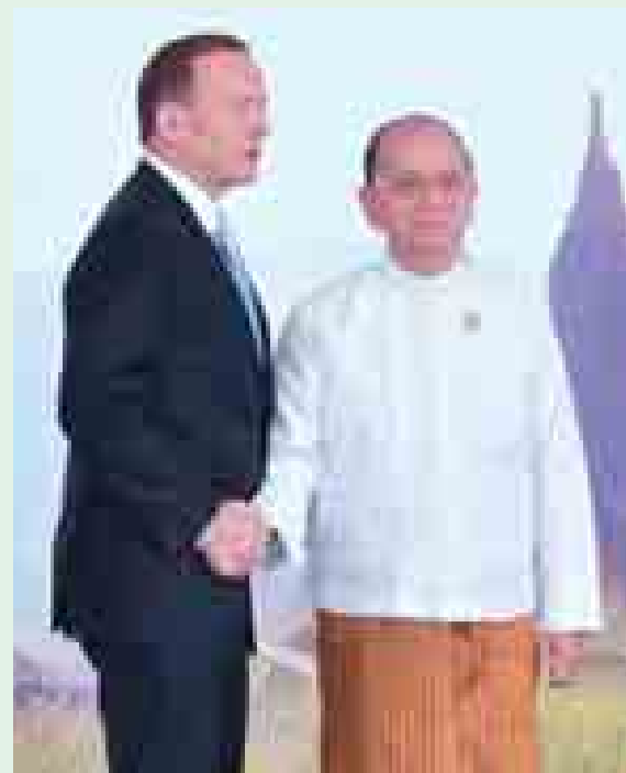
နိုင်ငံတော်သမ္မတ ဦးသိန်းစိန် နိုဝင်ဘာ ၁၇ ရက်ကကျင်းပသော (၉)ကြိမ်မြောက် အရှေ့အာရှထိပ်သီးအစည်းအဝေးတွင် ဩစတြေးလျနိုင်ငံ ဝန်ကြီးချုပ် တိုနီအဲဘော့တ်အား ကြိုဆိုနှုတ်ဆက်စဉ်။