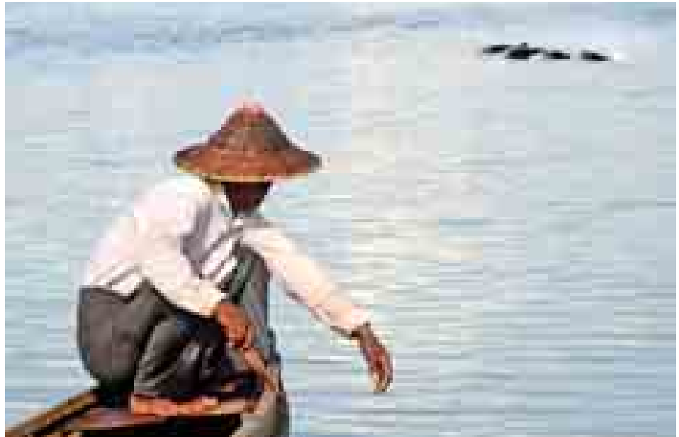
ရေလှုပ်သားက သစ်သားတုတ်တံလေးဖြင့် လှေဘောင်နံရံကို ခိုက်ခတ်သံပေး၍ လင်းပိုင်အား ခေါ်ယူနေစဉ်။

အရင်ဦးဆုံး လင်းပိုင်တွေရှိတတ်တဲ့ နေရာတွေကို လိုက်ရှာရပါတယ်။ လင်းပိုင်ဟာ ရေနေနို့တိုက်သတ္တဝါဖြစ်ပေမယ့် ငါးတွေလို့ ရေအောက်မှာ မနေနိုင်လို့ မကြာခဏရေပေါ်ခေါင်းဖော်ပြီးအသက်ရှူဖို့ တက်တတ်ပါတယ်။ ဒီလို လိုက်ရှာရင်း လင်းပိုင်ကို လှမ်းတွေ့တဲ့အခါ ဒါမှမဟုတ် လင်းပိုင်ခိုအောင်းတတ်တဲ့နေရာကို ခန့်မှန်းမိတဲ့အခါ လင်းပိုင်ကိုခေါ်ဖို့ သစ်သားတုတ်တံလေးနဲ့ လှေဘောင်နံရံကို တစ်ချက်ချင်းဖြည်းဖြည်းခိုက်ခတ်ပေးရပါတယ်။ အဲဒီခိုက်ခတ်သံကို လင်းပိုင်ကြားတဲ့အခါ အသံလာရာဆီသို့ ရောက်လာတတ်ပါတယ်။ တစ်ခါတစ်ရံလင်းပိုင်က အသံကြားပေးမယ့် ရေလှုပ်သားခေါ်သံဟုတ်၊ မဟုတ်သံသယရှိတတ်ပါတယ်။ ဒါဆိုရင် ကျွန်တော်တို့က လက်ပစ်ကွန်နဲနဲ့ခါလောက်ကွန်ချက်ပြရပါတယ်။ လှေဆီသို့ လင်းပိုင်တဖြည်းဖြည်းကပ်လာပြီး အမြီးကို ရေပေါ်ပြားလိုက်ဖော်၊ အထက်အောက်လှုပ်ယမ်းပြီး ကူးခတ်ပြတယ်။ ပြီးတော့အမြီးကို ပြားလိုက်လှုပ်ခတ်ပြီး ငါးရနိုင်မယ့် နေရာကို ရှေ့ကနေ ဦးဆောင်ပြီးမှန်မှန် ကူးခတ်သွားရာနောက်ကို လှေနဲ့ လိုက်ရပါတယ်။ ငါးရနိုင်မယ့်နေရာကို ရောက်ချိန်မှာ လင်းပိုင်ကအမြီးခေါင်လိုက်တည့်တည့်ထောင်ပြီး အချက်ပြပါတယ်။ အဲဒီဝန်းကျင်မှာ လှေကိုရပ်ထားရပါတယ်”ဟု အစချီကာပြောပြသည်။