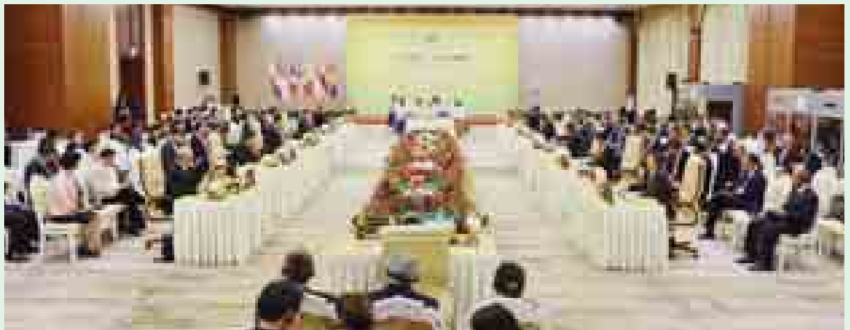
နိုဝင်ဘာ ၁၂ ရက်က (၆)ကြိမ်မြောက် အာဆီယံ-ကုလသမဂ္ဂ ထိပ်သီးအစည်းအဝေး ကျင်းပစဉ်။