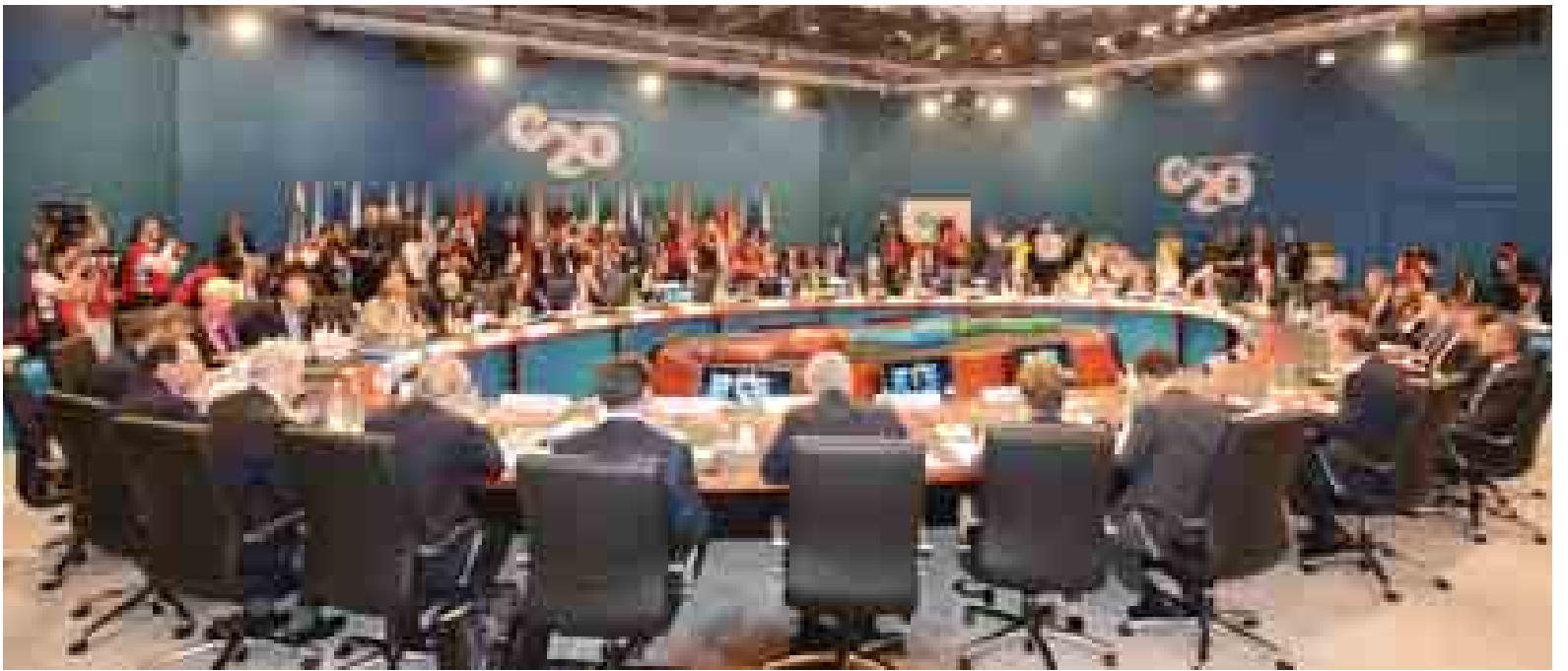
ထိပ်သီးအစည်းအဝေးတွင် အခွန်စနစ် ဆွေးနွေးခဲ့ကြောင်း သတင်းရရှိသည်။ (သတင်းစဉ်)