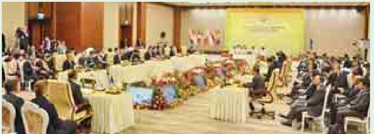
နိုဝင်ဘာ ၁၂ ရက်က (၄၀)နှစ်မြောက် အာဆီယံ-ဩစတြေးလျ ဆွေးနွေးဖက်အထိမ်းအမှတ် ထိပ်သီးအစည်းအဝေး ကျင်းပစဉ်။