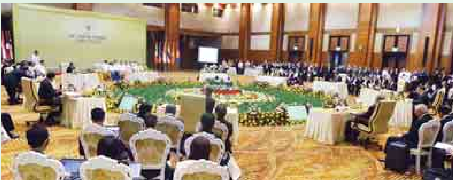
နိုဝင်ဘာ ၁၂ ရက်က (၂၅)ကြိမ်မြောက် အာဆီယံထိပ်သီး မျက်နှာစုံညီအစည်းအဝေး ကျင်းပစဉ်။