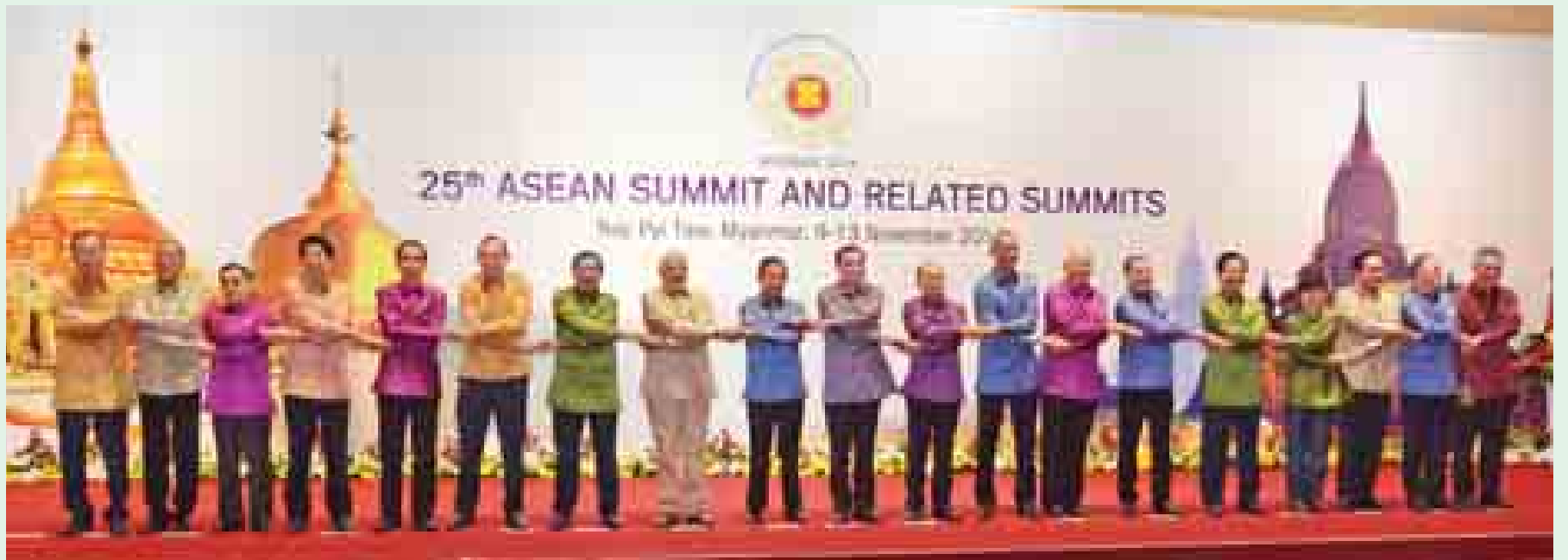
နိုင်ငံတော်သမ္မတ ဦးသိန်းစိန်၊ အာဆီယံနှင့် အရှေ့အာရှထိပ်သီးအဖွဲ့ဝင်နိုင်ငံများမှ နိုင်ငံခေါင်းဆောင်များနှင့် အစိုးရအဖွဲ့အကြီးအကဲများ နိုဝင်ဘာ ၁၂ ရက်က ကျင်းပသော ဂါလာညစာစားပွဲတွင် စုပေါင်းမှတ်တမ်းတင်ဓာတ်ပုံရိုက်စဉ်။