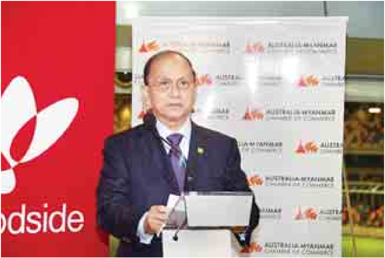
နိုင်ငံတော်သမ္မတ ဦးသိန်းစိန် ဩစတြေးလျ-မြန်မာ ကုန်သည်ကြီးများအသင်းဥက္ကဋ္ဌက တည်ခင်းစဉ်ခံသည့် ညစာစားပွဲတွင် မိန့်ခွန်းပြောကြားစဉ်။