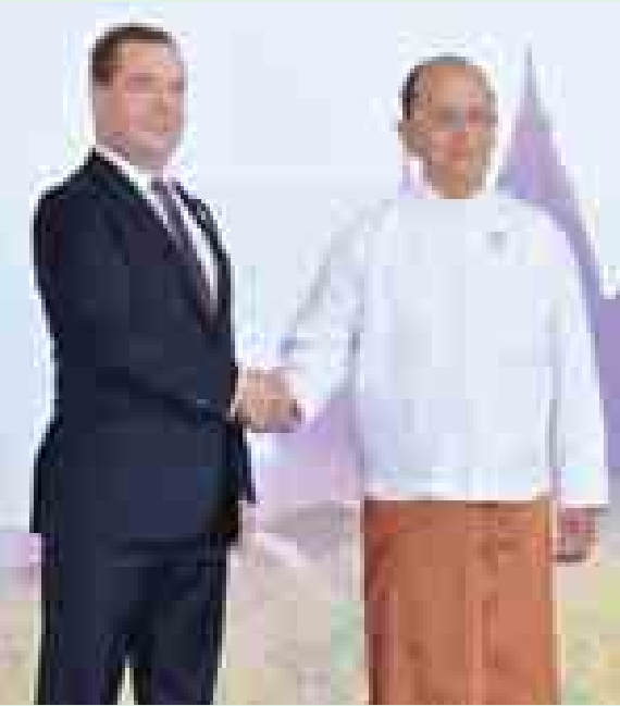
နိုင်ငံတော်သမ္မတ ဦးသိန်းစိန် နိုဝင်ဘာ ၁၇ ရက်ကကျင်းပသော (၉)ကြိမ်မြောက် အရှေ့အာရှထိပ်သီးအစည်းအဝေးတွင် ရုရှား ဖက်ဒရေးရှင်းနိုင်ငံ ဝန်ကြီးချုပ် ဒီမီထရီမက်ပီဒက်အား ကြိုဆိုနှုတ်ဆက်စဉ်။