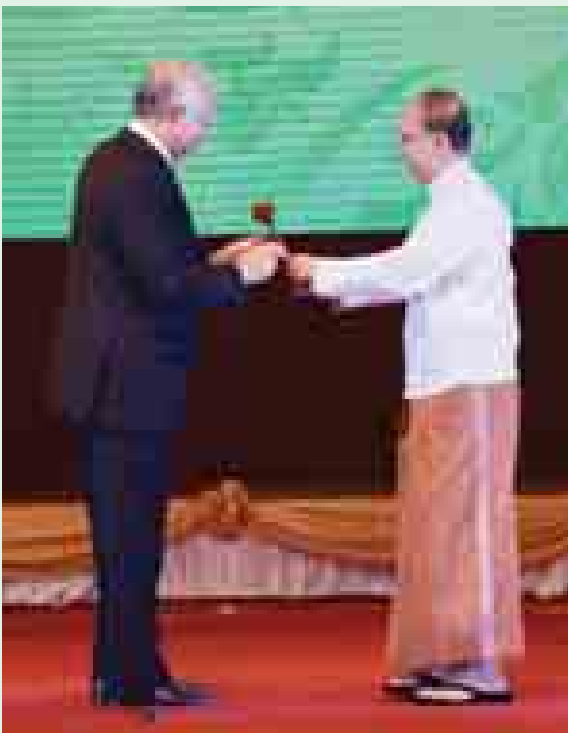
နိုဝင်ဘာ ၁၃ ရက်က အာဆီယံအလှည့်ကျဥက္ကဋ္ဌ နိုင်ငံတော် သမ္မတ ဦးသိန်းစိန် ၂၀၁၅ ခုနှစ် အာဆီယံအလှည့်ကျဥက္ကဋ္ဌ တာဝန်ယူ ဆောင်ရွက်မည့် မလေးရှားနိုင်ငံဝန်ကြီးချုပ် ဒါတိုဆရီ ဟာဂျီမိုဟာမက် နာဂျစ်ထံ အာဆီယံဥက္ကဋ္ဌ၏ အဆောင်အယောင်တူငယ်ကို လွှဲပြောင်း ပေးအပ်စဉ်။