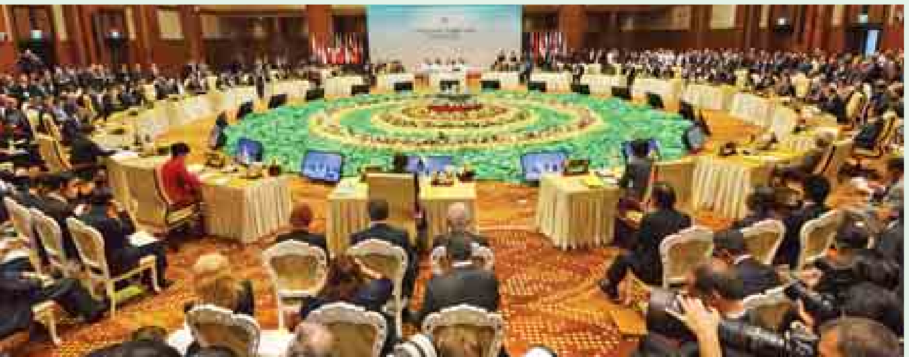
နိုဝင်ဘာ ၁၃ ရက် (၉) ကြိမ်မြောက် အရှေ့အာရှ ထိပ်သီးအစည်းအဝေးကျင်းပစဉ်။