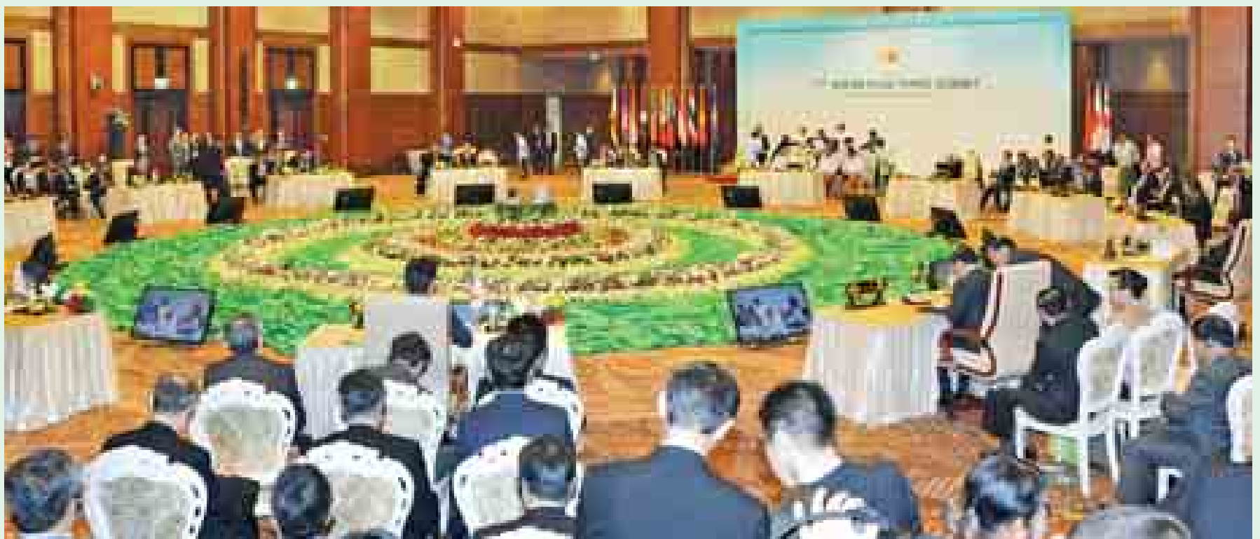
နိုဝင်ဘာ ၁၃ ရက်က (၁၇)ကြိမ်မြောက် အာဆီယံအပေါင်းသုံး ထိပ်သီးအစည်းအဝေးကျင်းပစဉ်။