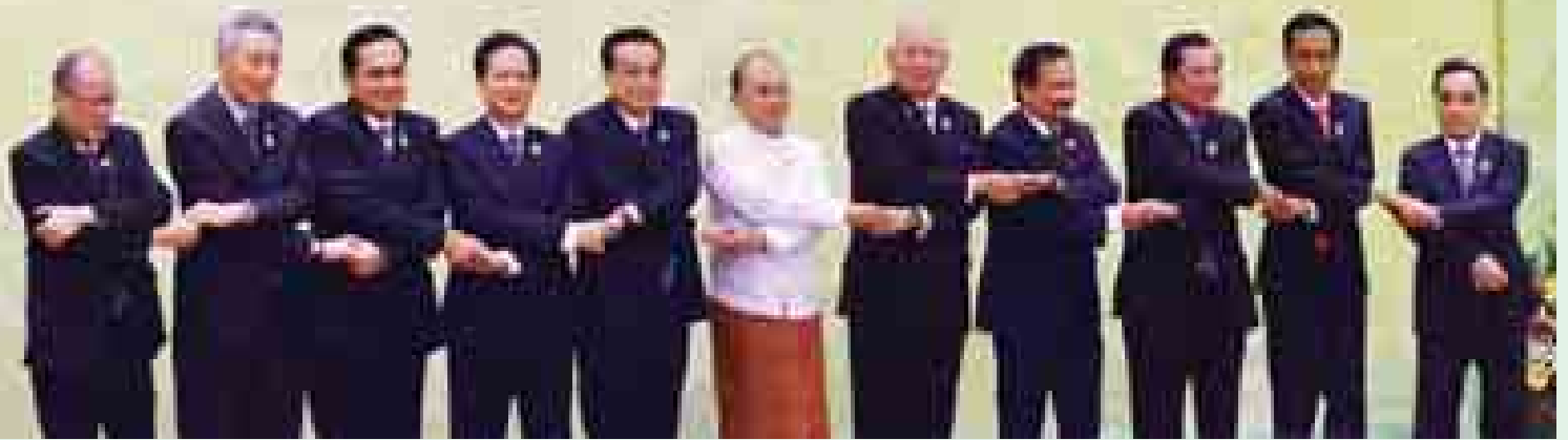
နိုဝင်ဘာ ၁၃ ရက်ကကျင်းပသော (၁၇)ကြိမ်မြောက် အာဆီယံ-တရုတ် ထိပ်သီးအစည်းအဝေးတွင် နိုင်ငံတော်သမ္မတ ဦးသိန်းစိန်နှင့် အာဆီယံနိုင်ငံများမှ နိုင်ငံခေါင်းဆောင်များ၊ အစိုးရအဖွဲ့အကြီးအကဲများ၊ တရုတ်ပြည်သူ့သမ္မတနိုင်ငံ ဝန်ကြီးချုပ် လီခချန်းနှင့် အာဆီယံအတွင်းရေးမှူးချုပ်တို့ စုပေါင်းမှတ်တမ်းဓာတ်ပုံရိုက်စဉ်။