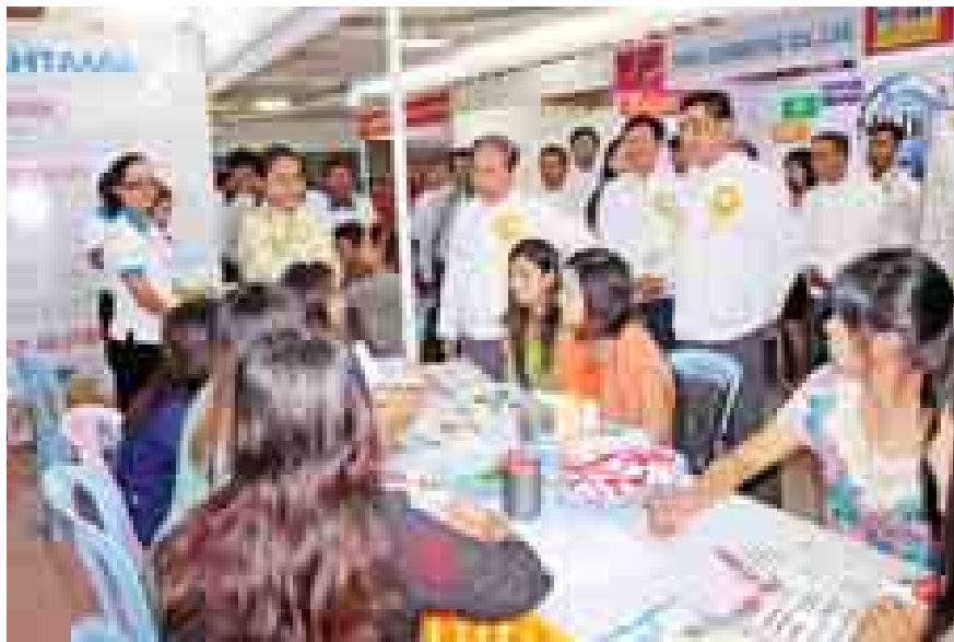
အလုပ်သမား၊ အလုပ်အကိုင်နှင့် လူမှုဖူလုံရေးဝန်ကြီးဌာန ပြည်ထောင်စုဝန်ကြီး ဦးအေးမြင့် မန္တလေးမြို့ ဆဋ္ဌမအကြိမ်မြောက် မြန်မာ့အလုပ်အကိုင်ပြပွဲ ဖွင့်ပွဲအခမ်းအနားတွင် ခင်းကျင်းပြသထားသော ပြခန်းများ အား ကြည့်ရှုစဉ်။

ထို့နောက် ပြည်ထောင်စုဝန်ကြီး ဦးဝင်းမြင့်နှင့် တာဝန်ရှိသူများက စက်ခလုတ်နှိပ်၍ အခမ်းအနားကို ဖွင့်လှစ်ပေးခဲ့ကြောင်း သတင်းရရှိသည်။ (ကြေးမုံ)