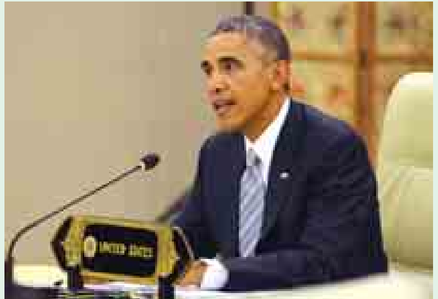
နိုဝင်ဘာ ၁၃ ရက်ကျင်းပသော ဒုတိယအကြိမ်မြောက် အာဆီယံ-အမေရိကန်ထိပ်သီးအစည်းအဝေးတွင် နိုင်ငံတော်သမ္မတ ဦးသိန်းစိန်နှင့် အမေရိကန်ပြည်ထောင်စုသမ္မတ မစ္စတာ ဘားရက်အိုဘားမားတို့ ဆွေးနွေးကြစဉ်။