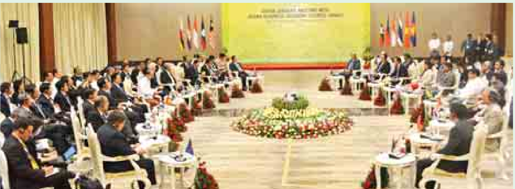
နိုဝင်ဘာ ၁၃ ရက်က အာဆီယံခေါင်းဆောင်များနှင့် အာဆီယံစီးပွားရေးအကြံပေးကောင်စီ ထိပ်သီးအစည်းအဝေးကျင်းပစဉ်။