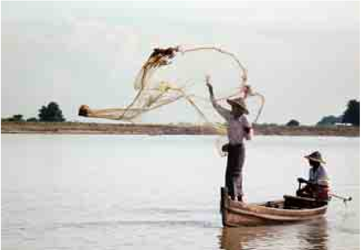
ဧရာဝတီမြစ်အတွင်း ငါးဖမ်းနေသော မြေစွန်းကျေးရွာမှ ကွန်ရေလုပ်သား လုပ်ငန်းခွင်ဝင်နေမှုကို တွေ့ရစဉ်။

တွေ့ဆုံမေးမြန်း စိုးစိုးနိုင်(ကြေးမုံ)