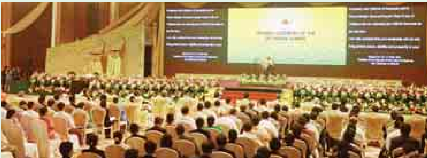
နိုင်ငံတော်သမ္မတ ဦးသိန်းစိန် နိုဝင်ဘာ ၁၂ ရက် ကျင်းပသော (၂၅) ကြိမ်မြောက် အာဆီယံထိပ်သီး အစည်းအဝေး ဖွင့်ပွဲအခမ်းအနားတွင် မိန့်ခွန်းပြောကြားစဉ်။