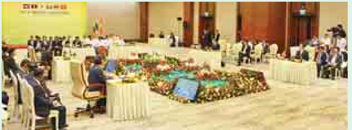
နိုဝင်ဘာ ၁၂ ရက်က (၆)ကြိမ်မြောက် မဲခေါင်-ဂျပန် ထိပ်သီးအစည်းအဝေး ကျင်းပစဉ်။