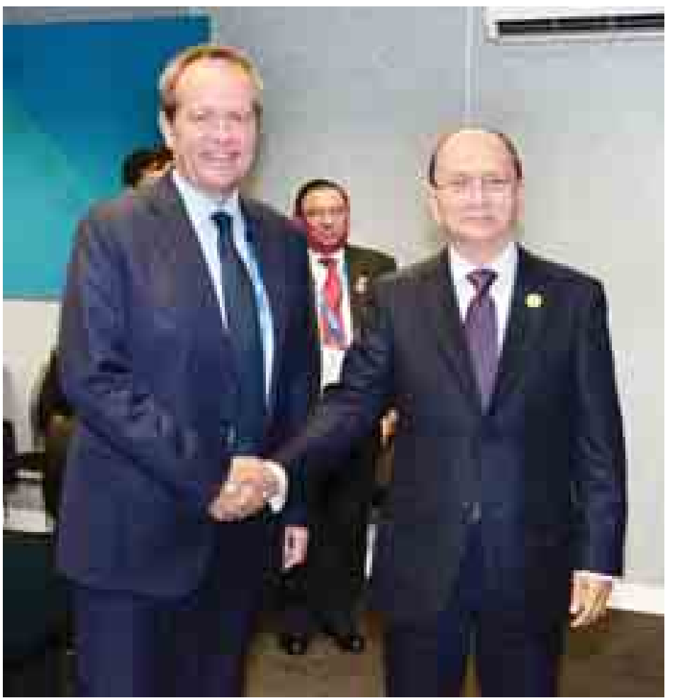
နိုင်ငံတော်သမ္မတ ဦးသိန်းစိန် ဩစတြေးလျနိုင်ငံ အတိုက်အခံ လေဘာပါတီခေါင်းဆောင် မစ္စတာ ဘီလ်ရှော့တန်အား ရင်းနှီးနှီးနှီးနှုတ်ဆက်စဉ်။ (သတင်းစဉ်)