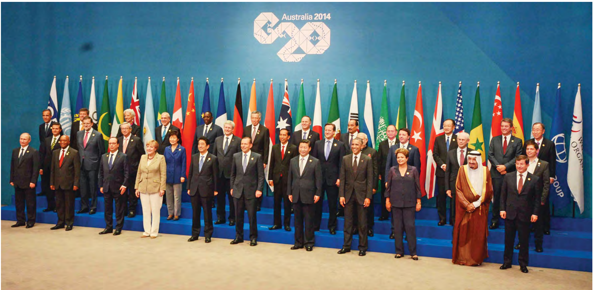
နိုင်ငံတော်သမ္မတ ဦးသိန်းစိန် ဂျီ-၂၀ ထိပ်သီးအစည်းအဝေးသို့ တက်ရောက်လာကြသည့် နိုင်ငံအကြီးအကဲခေါင်းဆောင်များနှင့်အတူ စုပေါင်းမှတ်တမ်းတင်ဓာတ်ပုံရိုက်စဉ်။