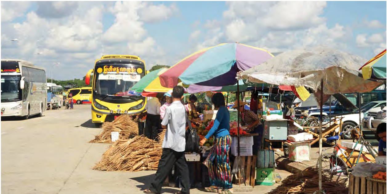
မိတ္ထီလာမြို့နယ် သီးကုန်းယာဉ်ရပ်နားစခန်းမှ စည်းကမ်းမဲ့ရောင်းချနေသော ဈေးဆိုင်များ။