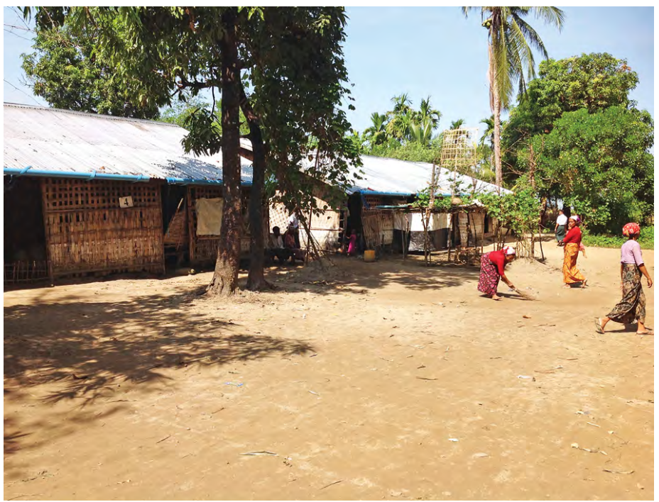
အနောက်ပြင် ကယ်ဆယ်ရေးစခန်းကို တွေ့ရစဉ်။