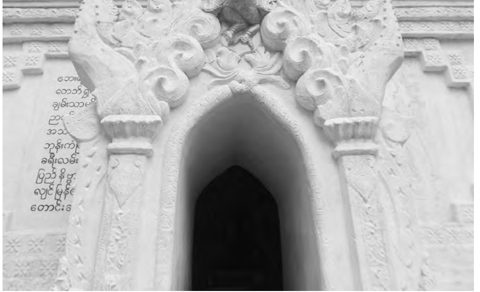
ရှိသော စေတီပုထိုးများတွင် အံ့ဖွယ် ကျောက်သေတ္တာ လိုက်ဂူကျဉ်းများ ဆူအဖြစ် ဖူးမြော်နိုင်ကြောင်း သိရ ဆယ်ပါး ရတနာသိုက်ဘုရားမှာ ဖြင့် စိတ်ဝင်စားဖွယ်ရာ စေတီတစ် သည်။ တိမ်တမန်

စေတီများ ကပ်လျက်ရှိပြီး ထိုစေတီများထဲတွင် အဓိဋ္ဌာန်ပြုကာ ထွက်ရသည့် လိုက်ဂူကျဉ်းပါသော အံ့ဖွယ် ဆယ်ပါးရတနာသိုက်ဘုရားမှာ စိတ်ဝင်စားဖွယ်ရာဖြစ်သည်။ ထူးခြားသောလက်ရာများပါရှိပြီး စေတီတည်ထားပုံမှာ ဆန်းလှသည်။ အံ့ဖွယ်ဆယ်ပါးပြုလုပ်ထားပုံမှာ ဗောဓိပင်နှင့် ရွှေပလ္လင်အောင်တော်မူပုံ၊ ဒက္ခိဏသာခါ၊ ဇိနသုခရန်အောင်ချမ်းသာ၊ ဇမ္ဗူပတိချွတ်ခန်း၊ ရှစ်မျက်နှာပြိုင်ပြေန်ပြေဘုရား၊ ကျောက်သေတ္တာရတနာသိုက်၊ အထက် သိကြားစောင့်၊ အလယ်ဂဠုန်၊ အောက်နဂါး၊ အဓိဋ္ဌာန်ပြုထွက်ရသော ဒုက္ခအပေါင်းမှ လွတ်မြောက်ရာ ထွက်ပေါက်လိုက်ဂူကျဉ်းဟူသော အံ့ဖွယ်ဆယ်ပါးကို စေတီအထက်မှ စကာ အတွင်းအပြင်စီရင် ပြုလုပ်တည်ထားသည်။ ယခုအခါ လက်ရာမျိုးစုံဖြင့် တည်