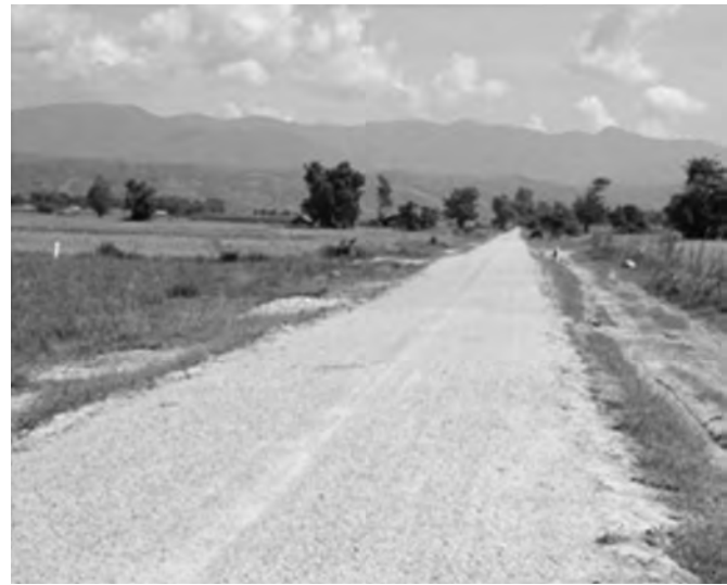
ကရင်ချောင်း- ရေတာရှည်မြို့ကို အချိန်တိုအတွင်း ရောက်ရှိနိုင်မည်ဖြစ်၍ ဒေသတွင်း စီးပွားရေးလုပ်ငန်းများ အဆင်ပြေချောမွေ့နိုင်သည့်အပြင် လူမှုရေး၊ စီးပွားရေး၊ ကျန်းမာရေး၊ ပညာရေးလုပ်ငန်းများအတွက်များစွာ အထောက်အကူပြုနိုင်မည်ဖြစ်သည်။ “လမ်းကကောင်းလာတော့ အခုရွာ