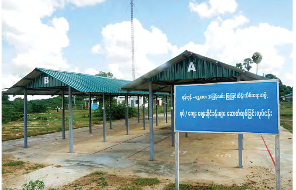
မိတ္ထီလာမြို့နယ် သီးကုန်းယာဉ်ရပ်နားစခန်းတွင် ပျံကျဈေးသည်များ စနစ်တကျရောင်းချနိုင်ရန် တည်ဆောက်ပေး ထားသော ရပ်၊ ကျေးဇူးကို တွေ့ရစဉ်။

ပါးသွားမလားဆိုပြီး စိုးရိမ်စိတ်ကြောင့် မပြောင်းရွှေ့သေးဘဲ ရှိနေကြပါတယ်။ ဒါပေမယ့် မကြာခင်မှာ အားလုံး အဆင်ပြေသွားမယ်လို့ ကျွန်တော်တို့ ယုံကြည်ထားပါတယ်။