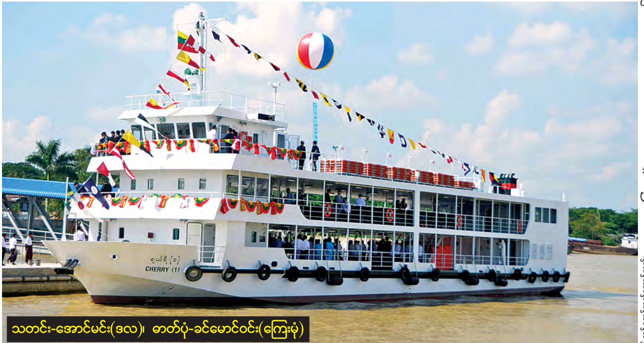
သတင်း-အောင်မင်း(ဒလ)၊ ဓာတ်ပုံ-ခင်မောင်ဝင်း(ကြေးမုံ)

ပန်းဆိုးတန်း-ဒလကူးတို့ရေယာဉ်လိုင်းတွင် ဂျပန်နိုင်ငံ JICA မှ ပူးပေါင်း သည့် ချယ်ရီကူးတို့ရေယာဉ်သုံးစင်း၊ ဒလမြို့ဆိပ်ကမ်းရှိ ခရီးသည်နားနေ ဆောင်နှင့် ဆိပ်ခံတံတားနှစ်စင်း လွှဲပြောင်းပေးအပ်ပွဲအခမ်းအနားကို ယနေ့ နံနက် ၉ နာရီခွဲတွင် နန်းသီတာဆိပ်ခံတံတားခန်းမ၌ ကျင်းပသည်။ ရှေးဦးစွာ ပို့ဆောင်ရေးဝန်ကြီးဌာန ပြည်ထောင်စုဝန်ကြီး ဦးဉာဏ်ထွန်း အောင်က အဖွင့်အမှာစကားပြောကြားသည်။ မြန်မာနိုင်ငံဆိုင်ရာ ဂျပန် သံအမတ်ကြီး မစ္စတာ တာတဲရီ ဟိဂုချိက "ပြည်တွင်းရေးကြောင်း ညွှန်ကြားရေး များချုပ်နဲ့ ဂျပန်နိုင်ငံမှ ညွှန်ကြားရေးများချုပ်တို့ တွေ့ဆုံညှိနှိုင်းပြီး အခုလို ခရီးသည်များပြားလွန်းတဲ့ ရန်ကုန်-ဒလကူးတို့သင်္ဘောလိုင်းမှာ ကူညီ ထောက်ပံ့ခြင်းဖြစ်ပါတယ်။ ဒါကလည်း နာဂစ်မုန်တိုင်းဒဏ်ခံရပြီးတဲ့ နောက်ပိုင်း မှ ကူညီရတာပါ။ နောက်ပြီး ဂျပန်-မြန်မာချစ်ကြည်ရင်းနှီးစွာ ဆက်ဆံခဲ့တဲ့နှစ် (၆၀)ပြည့်အထိမ်းအမှတ်အဖြစ် ပို့ဆောင်ရေးကဏ္ဍကို ကူညီလှူဒါန်းခြင်းဖြစ်ပါ တယ်" ဟု ပြောသည်။ စာမျက်နှာ ၆ ကော်လံ ၁ သို့