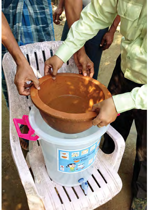
ကယ်ဆယ်ရေးစခန်း၌ သောက်သုံးရေရရှိသည့် သောက်ရေသန့်။

လယ်ယာမြေများအား ထွန်ယက်စိုက်ပျိုးနိုင်ရေးအတွက် ထွန်စက်များ၊ လက်တွန်းထွန်စက်များ၊ စက်သုံးဆီများ၊ ဖျိုးစပါးများ၊ ငါးလုပ်ငန်းများအတွက် ပိုက်ကွန်များစသည်ဖြင့် ထောက်ပံ့ဖြည့်ဆည်းပေးခဲ့သည်။ ကျန်းမာရေးစောင့်ရှောက်မှုအဖြစ် အနောက်ပြင်၊ ညောင်ပင်ကြီး၊ ကိုးတန်ကောက်၊ ချိန်ခါလီကယ်ဆယ်ရေးစခန်းများမှ ဒုက္ခသည်များအား မြို့နယ်ကျန်းမာရေးဌာနနှင့် နယ်စည်းမခြားဆရာဝန်များအဖွဲ့တို့မှ တစ်ပတ်တစ်ကြိမ် ဆေးဝါးကုသပေးလျက်ရှိသည်။ ပညာရေးအဖြစ် အနောက်ပြင်ကယ်ဆယ်ရေးစခန်းတွင် မူလတန်းလွန်ကျောင်းတစ်ကျောင်းနှင့် ညောင်ပင်ကြီးကယ်ဆယ်ရေးစခန်းတွင် ယူနီဆက်မှ ဆောက်လုပ်ပေးသည့် ကျောင်းတစ်ကျောင်းတို့၌ ဘင်္ဂါလီဒုက္ခသည် ကျောင်းသား ကျောင်းသူများအား ပညာသင်ကြားပေးလျက်ရှိသည်။ ဒုက္ခသည်များအနေဖြင့် သက်ဆိုင်ရာမှ လစဉ်ပုံမှန်ရရှိသည့် ထောက်ပံ့ပစ္စည်းများစားသုံးကာ စိုက်ပျိုးထွန်ယက်ခြင်းမှ ထွက်ရှိသည့် သီးနှံရောင်းရငွေများ စုဆောင်းပြီး အခြားလိုအပ်သည့် အိမ်သုံးပစ္စည်းများ ဝယ်ယူအသုံးပြုလျက်ရှိနေသည့်အတွက် ယခင်ရရှိခဲ့ပြီးဖြစ်သည့် နေထိုင်မှုအခြေအနေထက် မလျော့ကျဘဲ အဆင်ပြေလျက်ရှိသည်။ (ဇေယျာ(ခိုင်ရာ))