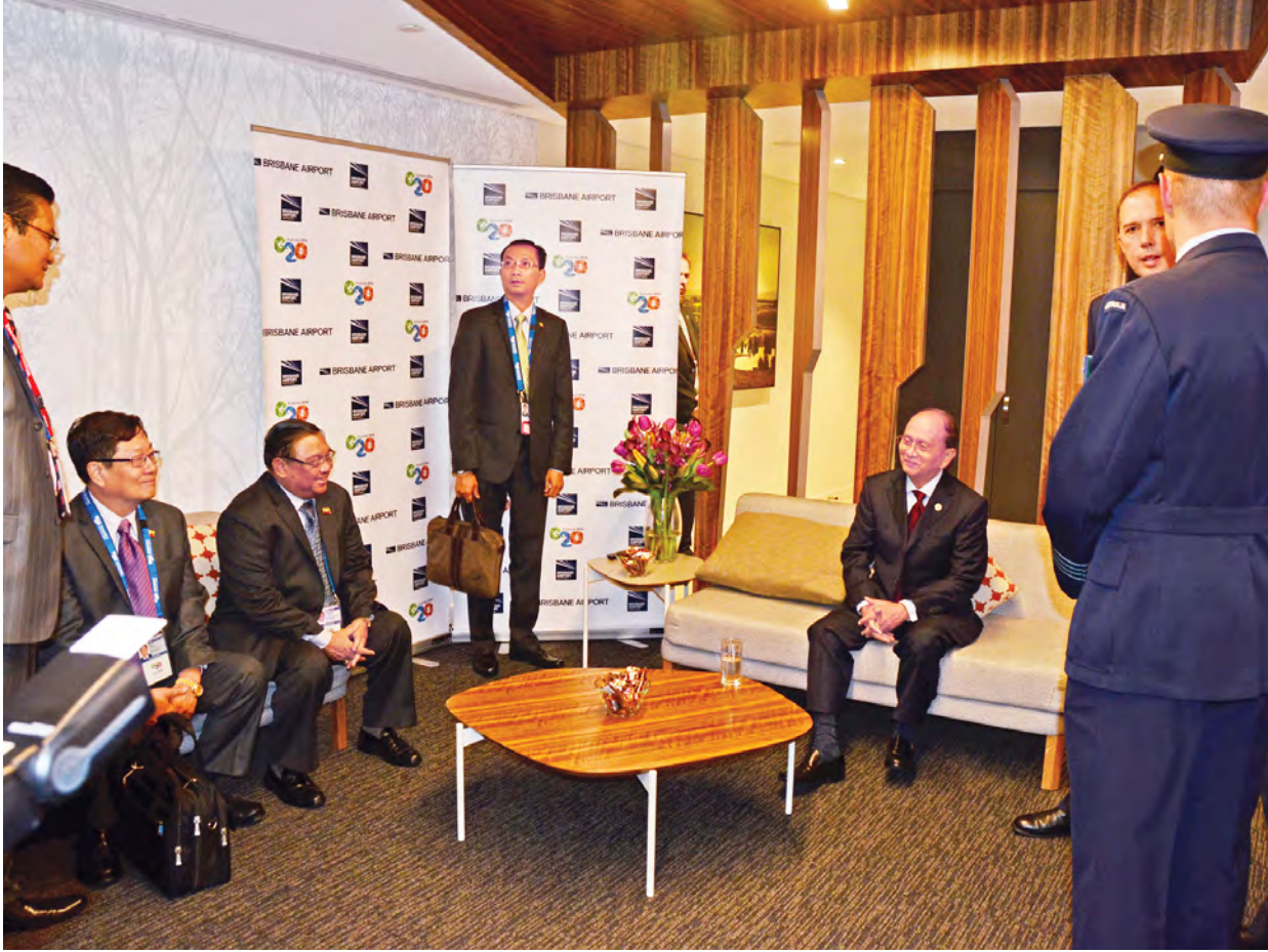
နိုင်ငံတော်သမ္မတ ဦးသိန်းစိန် ဩစတြေးလျနိုင်ငံ ဘရစ္စဘိန်းမြို့ အပြည်ပြည်ဆိုင်ရာလေဆိပ်သို့ ရောက်ရှိစဉ်။ (သတင်းစဉ်)

ယင်းနောက် နိုင်ငံတော်သမ္မတနှင့် အဖွဲ့ဝင်များသည် ခေတ္တတည်းခိုမည့် NOVOTEL HOTEL သို့ မော်တော်ယာဉ်များဖြင့် ရောက်ရှိကြသည်။ (သတင်းစဉ်)