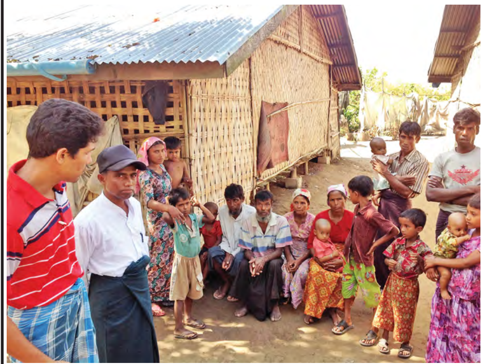
ရသေ့တောင်ရှိ ဘင်္ဂါလီကယ်ဆယ်ရေးစခန်း၌ နေထိုင်သူများကို တွေ့ရစဉ်။