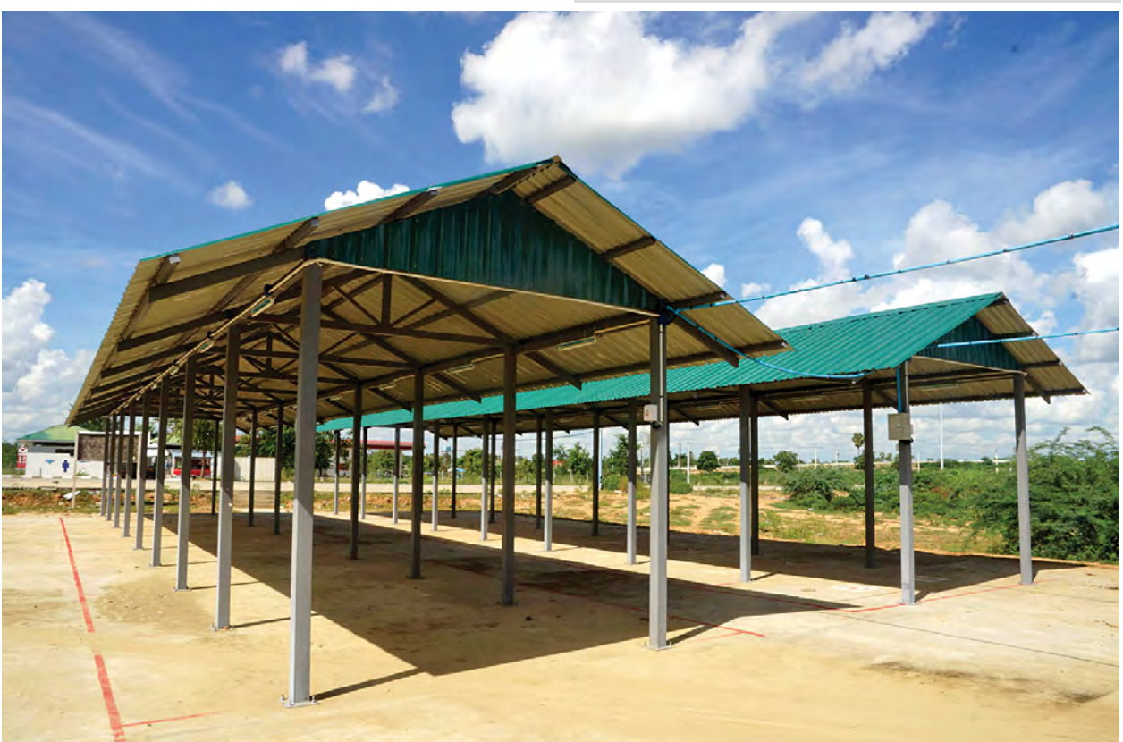
ရပ်၊ ကျေးဇူးက ဈေးဆိုင်ခန်းတွေ

ရပ်၊ ကျေး ဈေးတည်ဆောက်တဲ့ နေရာမှာလည်း လက်ရှိပျံကျဈေးသည် တွေရဲ့ ဈေးရောင်းချမှုကိုထိခိုက်မှု မရှိအောင်၊ ယာဉ်ရပ်နားစခန်းကို အသုံးပြုတဲ့ပြည်သူတွေအနေနဲ့လည်း အဆင်ပြေအောင် ယာဉ်ရပ်နားကွင်း အတွင်းမှာ မူလဈေးဆိုင်ကြီးတွေရဲ့ ဘေးမှာ အကျယ်ပေ (၁၀၀x၂၀၀) ရှိတဲ့မြေကွက်မှာ ခန်းဖွင့်အကျယ် ရှစ်ပေပတ်လည်ရှိတဲ့ ဆိုင်ခန်းပေါင်း ၆၄ ခုပါဝင်တဲ့ ရပ်၊ ကျေးဇူးနှစ်ခုကို တည်ဆောက်ခဲ့ပါတယ်။ တည် ဆောက်တဲ့နေရာမှာလည်း မိုးလုံ လေလုံအောင် ဆောင်ရွက်ပေးထားပြီး ကြမ်းခင်းကိုကွန်ကရစ်ခင်းပေးထား ပါတယ်။ ဒါ့အပြင် ဈေးဆိုင်တွေ အတွက် မီးသွယ်တန်းပေးထားတဲ့ အပြင် ရေရရှိအောင်လည်း စီစဉ်ပေး ထားပါတယ်။ အခုလိုတည်ဆောက် ပေးတဲ့အတွက် နိုင်ငံတော်က ငွေကျပ် သန်း ၇၀ ကျော်ကို အသုံးပြုထားပါ တယ်။