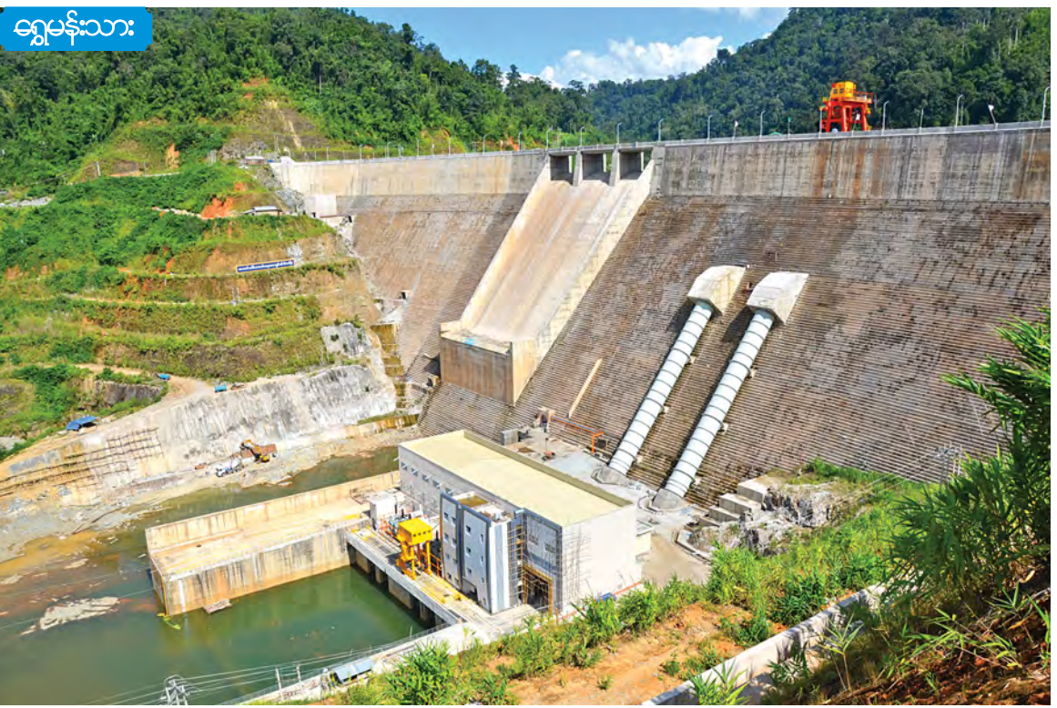
အထက်ပေါင်းလောင်းဓာတ်အားပေးစက်ရုံ။

စစ်တောင်းမြစ်ဝှမ်း ဒေသတစ်လျှောက်မှ Master Plan ပါ စီမံကိန်း ၁၃ ခုအနက်မှ ၁၀ ခု စုစုပေါင်း ၈၃၀ မဂ္ဂါဝပ်မှာ အကောင်အထည်ဖော် ဆောင်ရွက်ပြီးဖြစ်ပါသည်။ ကျန်စီမံကိန်း သုံးခု စုစုပေါင်း ၄၁၀ မဂ္ဂါဝပ်မှာလည်း ဆက်လက်အကောင်အထည်ဖော် ဆောင်ရွက်သွားမည်ဖြစ်ရာ မကြာမီကာလတွင် စစ်တောင်းမြစ်ဝှမ်းတစ်ခုလုံးမှ စီမံကိန်းအားလုံး ပြီးစီးတော့မည်ဖြစ်ပါသည်။