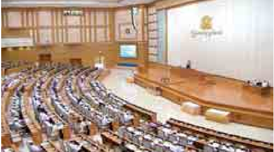
ပထမအကြိမ် ပြည်ထောင်စုလွှတ်တော် (၁၁)ကြိမ်မြောက်ပုံမှန်အစည်းအဝေး (၂၄) ရက်မြောက်နေ့ ကျင်းပစဉ်။ (သတင်းစဉ်)

ကြောင်း၊ ဆောင်ရွက်သည့်အခါ နားလည်မှုရှိရှိဖြင့် နိုင်ငံတော်နှင့် နိုင်ငံသားအကျိုးစီးပွား၊ နိုင်ငံ့ ဝန်ထမ်းများနှင့် အငြိမ်းစားဝန်ထမ်း များ သူ့ဂုဏ်၊ သူ့သိက္ခာဖြင့် နေနိုင်ရေး အတွက် ဆောင်ရွက်ပေးရမည်ဖြစ်ပါ ကြောင်း၊ ယင်းသို့နေနိုင်မှသာ သန့်ရှင်းသောအစိုးရနှင့် ကောင်းမွန် သောအုပ်ချုပ်ရေးအတွက် များစွာ အထောက်အကူပြုမည်ဖြစ်ပါကြောင်း၊ ပြဋ္ဌာန်းပြီးသော အလုပ်သမားဥပဒေ၊ တောင်သူလယ်သမား အခွင့်အရေး ကာကွယ်ရေးနှင့် အကျိုးစီးပွား မြှင့်တင်ရေးဥပဒေများအား အောက် ခြေတွင် ဆောင်ရွက်နိုင်အောင် နည်းဥပဒေ၊ အမိန့်ကြော်ငြာစာနှင့် ညွှန်ကြားချက်များ ထုတ်ပြန်ဆောင် ရွက်ရမည် ဖြစ်ပါကြောင်းဖြင့် ပြောကြားသည်။ ယင်းနောက် ၂၀၁၄-၂၀၁၅ ဘဏ္ဍာရေးနှစ် ပြည်ထောင်စု၏ နောက်ထပ်ဘဏ္ဍာငွေခွဲဝေသုံးစွဲရေး ဥပဒေကြမ်းနှင့်စပ်လျဉ်း၍ ပြင်ဆင် ချက်အဆိုပါရှိသည့် ကာကွယ်ရေး ဝန်ကြီးဌာန၊ သမဝါယမဝန်ကြီးဌာန၊ လယ်ယာစိုက်ပျိုးရေးနှင့်ဆည်မြောင်း ဝန်ကြီးဌာန၊ လျှပ်စစ်စွမ်းအားဝန်ကြီး ဌာန၊ ဆောက်လုပ်ရေးဝန်ကြီးဌာန၊ ပြည်ထောင်စု စာရင်းစစ်ချုပ်ရုံး၊ နေပြည်တော် ကောင်စီနှင့် နေပြည်တော်စည်ပင်သာယာရေး ကော်မတီအဖွဲ့အစည်းများ၏ အသုံး စရိတ်များအပါအဝင် ဥပဒေကြမ်းဖြင့် တင်ပြထားသော ရငွေသုံးငွေများနှင့် ဥပဒေကြမ်းအကြောင်းအရာများကို လွှတ်တော်၏ အဆုံးအဖြတ်ရယူ အတည်ပြုသည်။ ထို့နောက် ၂၀၁၄-၂၀၁၅ ဘဏ္ဍာ ရေးနှစ် ပြည်ထောင်စု၏ နောက်ထပ် ဘဏ္ဍာငွေခွဲဝေသုံးစွဲရေး ဥပဒေကြမ်း တစ်ရပ်လုံးကို လွှတ်တော်တွင် ဆွေးနွေးဆုံးဖြတ်သည့်အတိုင်း အတည် ပြုရန် ပြည်ထောင်စုအစိုးရအဖွဲ့ ကိုယ်စား ဘဏ္ဍာရေးဝန်ကြီးဌာန ပြည်ထောင်စုဝန်ကြီး ဦးဝင်းရှိန်က အဆိုတင်သွင်းရာ လွှတ်တော်က အတည်ပြုသည်။ (သတင်းစဉ်)