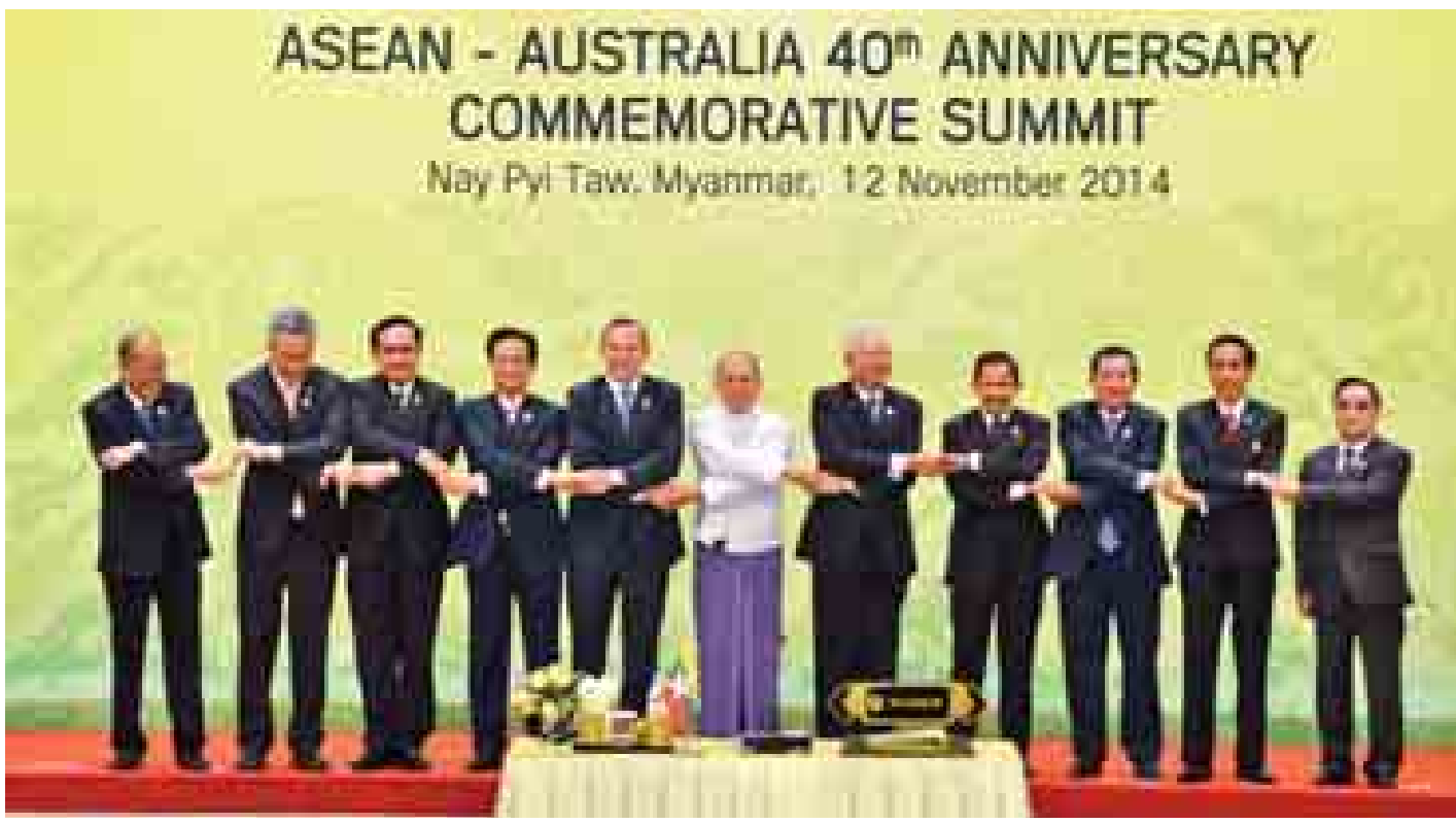
ASEAN - AUSTRALIA 40 th ANNIVERSARY COMMEMORATIVE SUMMIT Nay Pyi Taw, Myanmar, 12 November 2014

နေပြည်တော် နိုဝင်ဘာ ၁၂ (၄၀)နှစ်မြောက် အာဆီယံ-ဩစတြေးလျ ဆွေးနွေးပွဲအထိမ်းအမှတ် ထိပ်သီးအစည်းအဝေးကို ယနေ့ ညနေ ၆ နာရီခွဲတွင် နေပြည်တော်ရှိ မြန်မာအပြည်ပြည်ဆိုင်ရာ ကွန်ဗင်းရှင်းဗဟိုဌာန နီလာခန်းမ၌ ကျင်းပရာ နိုင်ငံတော်သမ္မတ ဦးသိန်းစိန်နှင့် အာဆီယံနိုင်ငံများမှ နိုင်ငံခေါင်းဆောင်များ၊ အစိုးရအဖွဲ့အကြီးအကဲများ၊ ဩစတြေးလျနိုင်ငံ ဝန်ကြီးချုပ် တိုနီအိုဘော့ဘတ်၊ ဝန်ကြီးများနှင့် အာဆီယံအတွင်းရေးမှူးချုပ်တို့ တက်ရောက်ကြသည်။