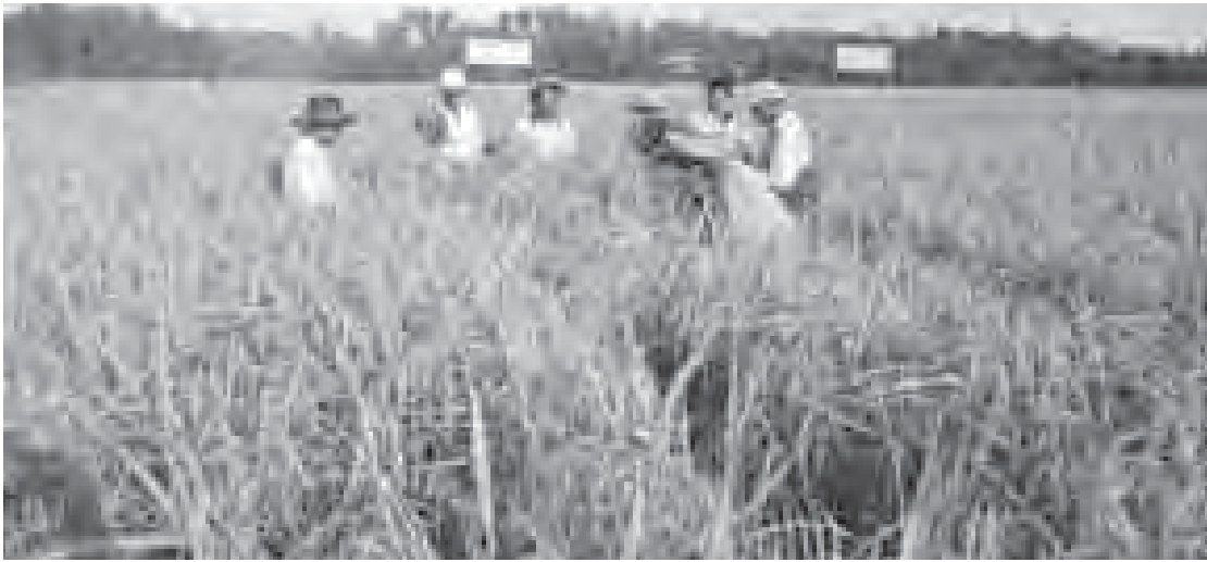
နည်းချက် အားသာချက်များ၊ စပါးမျိုးကောင်းမျိုးသန့် စိုက်ပျိုးခြင်းဖြင့် အထွက်နှုန်းများ ပိုမိုတိုးတက်လာပြီး တောင်သူများအတွက် ဝင်ငွေနှစ်ဆတိုး၍ လူမှုစီးပွားဖွံ့ဖြိုးတိုးတက်လာသည်နှင့်အမျှ ဆင်းရဲနွမ်းပါးမှု လျော့ချနိုင်ရေးကိုလည်း အထောက်အကူဖြစ်စေနိုင်ကြောင်း ပညာပေးစည်းရုံး ပြောကြားခဲ့သည်။