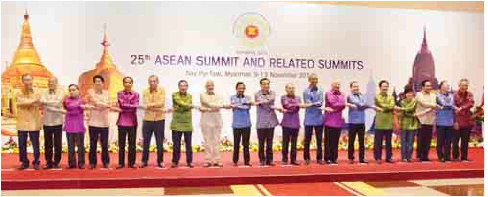
25th ASEAN SUMMIT AND RELATED SUMMITS Nay Pyi Taw, Myanmar, 12 November 2014

နိုဝင်ဘာသမ္မတ ဦးသိန်းစိန် အာဆီယံနှင့် အရှေ့အာရှထိပ်သီးအဖွဲ့ဝင်နိုင်ငံများမှ နိုင်ငံခေါင်းဆောင်များနှင့် အစိုးရအဖွဲ့အကြီးအကဲများအား တည်ခင်းဧည့်ခံသည့် ဂုဏ်ပြုညစာစားပွဲတွင် စုပေါင်းမှတ်တမ်းတင်ဓာတ်ပုံရိုက်ကြစဉ်။ (သတင်းစဉ်)