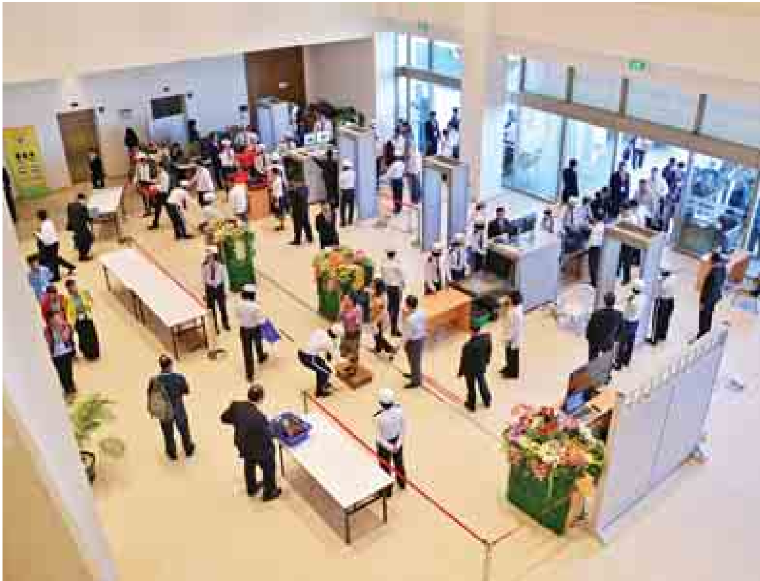
(၂၅) ကြိမ်မြောက် အာဆီယံထိပ်သီးအစည်းအဝေးနှင့် ဆက်စပ်အစည်းအဝေးများအတွက် လုံခြုံရေးဆောင်ရွက်နေမှုကို တွေ့ရစဉ်။

အာဆီယံဝန်ဆောင်မှုဆိုင်ရာ မူဘောင် သဘောတူညီချက်အရ ဝန်ဆောင်မှုလုပ်ငန်း များ လွတ်လပ်စွာစီးဆင်းနိုင်ရန် သတ္တမ မြောက် ကတိကဝတ်ပြုမှုစာရင်းကို ဆောင် ရွက်ခဲ့ပြီး ဖြစ်ပါတယ်။ သို့သော်လည်းပဲ စေ့စပ်ဆွေးနွေးမှုများ ပြုလုပ်ခဲ့တာ ၁၅ နှစ် လောက်ရှိလာခဲ့ပြီဖြစ်ပေမယ့် ဝန်ဆောင်မှုများ လွတ်လပ်ခွင့်ပေးမှုနဲ့ပတ်သက်လို့ သိသာတဲ့ တိုးတက်မှုမရှိခဲ့သေးဘူးလို့ ပြင်ပပုဂ္ဂိုလ်များ က သုံးသပ်ကြပါတယ်။ ဝန်ဆောင်မှုများ လွတ်လပ်ခွင့်ပေးမှုနဲ့ပတ်သက်လို့လည်း မူလ blueprint မှာ အပြည့်အဝပေါင်းစည်းနိုင် အောင်လည်း ထည့်သွင်းဖော်ပြမှုမရှိတာကို တွေ့ရတယ်လို့ဆိုပါတယ်။ အာဆီယံနိုင်ငံများ မှာ အခြားအာဆီယံနိုင်ငံများက ဝန်ဆောင်မှု ကုမ္ပဏီများထူထောင်မှုနဲ့ ပတ်သက်လို့ ၇၀ ရာခိုင်နှုန်းသာ ခွင့်ပြုထားတာဖြစ်ပါတယ်။ ဝန်ဆောင်မှုဆိုင်ရာလူပုဂ္ဂိုလ်များ လွတ်လပ်စွာ ရွှေ့ပြောင်းနိုင်မှုနဲ့ပတ်သက်လို့ ကျွမ်းကျင်သူ များနဲ့ ပညာရှင်များကိုသာ လွတ်လပ်စွာ ပြောင်းရွှေ့လုပ်ကိုင်ခွင့်ပြုတာကို တွေ့ရပါ တယ်။ ဒီလိုခွင့်ပြုမှုမှာလည်း ကင်းလွတ်ခွင့် တွေ၊ အတိုးအလျှော့လုပ်နိုင်မှုတွေ များစွာ ပြုလုပ်ထားတာ တွေ့ရမှာဖြစ်ပါတယ်။