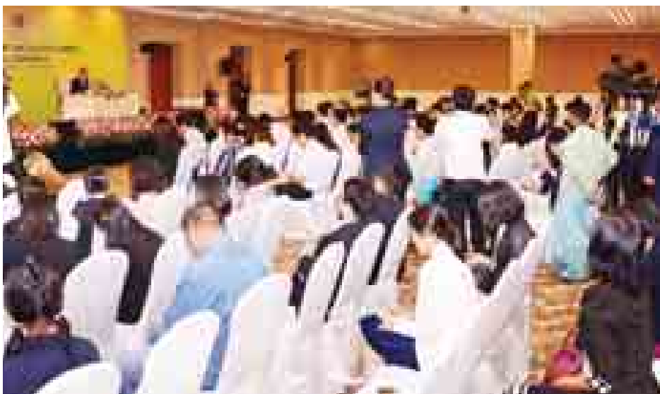
ကုလသမဂ္ဂအတွင်းရေးမှူးချုပ် မစ္စတာဘန်ကီမွန်း နိုင်ငံတကာ မီဒီယာသမားများနှင့် သတင်းစာရှင်းလင်းပွဲပြုလုပ်စဉ်။

ကြောင်း၊ ကမ္ဘာတစ်ဝန်းကြုံတွေ့နေရသော အကျပ်အတည်းများနှင့် စိန်ခေါ်မှုများ ရှိနေကြောင်း၊ အထူးသဖြင့် အကြမ်းဖက်တိုက်ခိုက်မှုအန္တရာယ် ကာကွယ်ရေးနှင့် အနောက်အာဖရိက နိုင်ငံများတွင် ဖြစ်ပွားနေသော ကူးစက်ရောဂါ ကာကွယ်ရေး၊ တိုက်ဖျက်ရေးလုပ်ငန်းများအပေါ် နိုင်ငံအားလုံး နိုးကြားတက်ကြွစွာ ပါဝင်ဆောင်ရွက်သွားရန် တိုက်တွန်းလိုကြောင်းဖြင့် ပြောကြားသွားသည်။ (မိုးသူဇာစိုး)