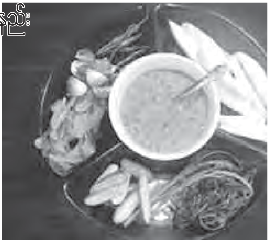
ဝိုင်းမှာ ငါးပိရည်ရနံ့ မွှေးမွှေးလေးကို စိတ်ရှိတိုင်း မစားရကြပါဘူး။ သို့ သော် အထက်မှာဖော်ပြထားသလို

ဆေးဖက်ဝင် ငါးပိရည်ဖျော်နည်း ငါးပိဆိုတာ ငါးကိုရေဆေး၊ ဝိုက်ခွဲ ကာအူတွေထုတ်ပြီး ဆား(အငန် ဓာတ်တွေ)နဲ့ အပုပ်ခံလုပ် ထားတာပဲ လည်း ငါးပိရည်က စားလို့တော့ကောင်း ပါရဲ့ အငန်ဓာတ်ကနေပါတယ်။ ဒါ ကြောင့်လည်း သွေးတိုးရောဂါသည် များနှင့် ဝက်ခြံပေါက်သူများက ထမင်း