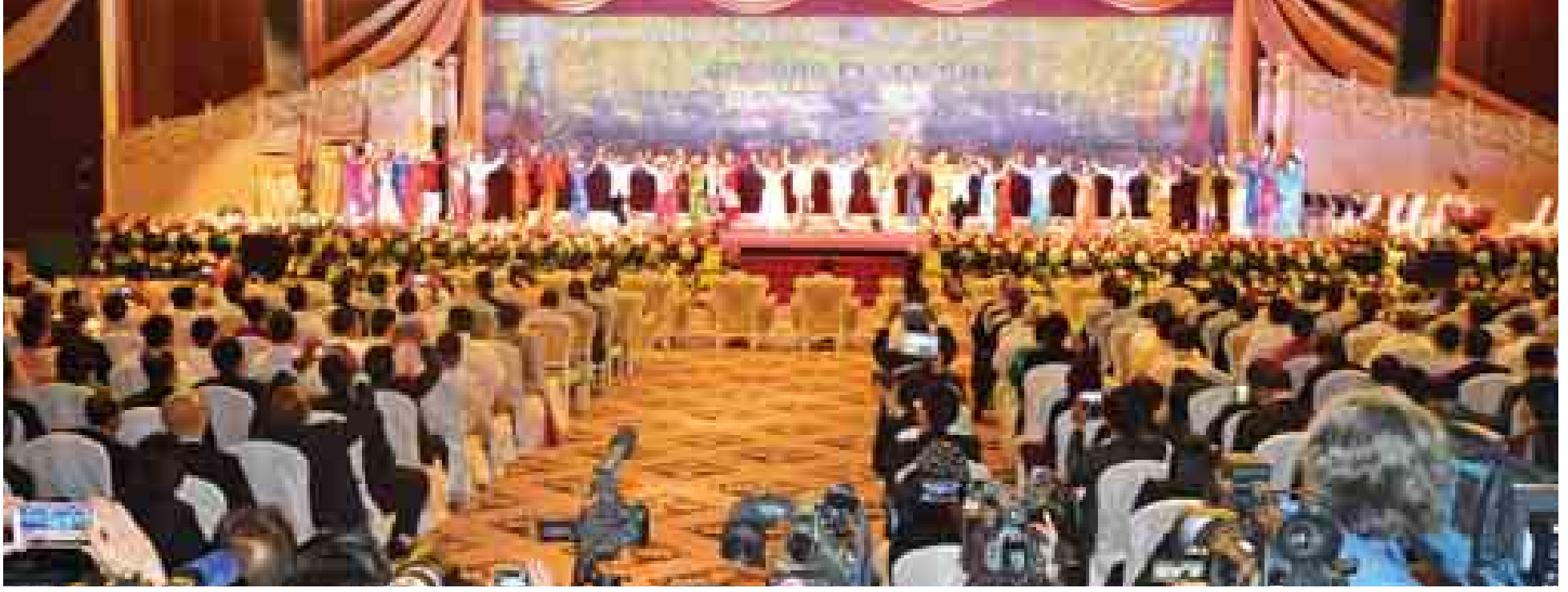
(၂၅)ကြိမ်မြောက် အာဆီယံထိပ်သီးအစည်းအဝေးဖွင့်ပွဲအခမ်းအနားတွင် မြန်မာ့ယဉ်ကျေးမှု အဆို၊ အကများဖြင့် ဖျော်ဖြေတင်ဆက်စဉ်။