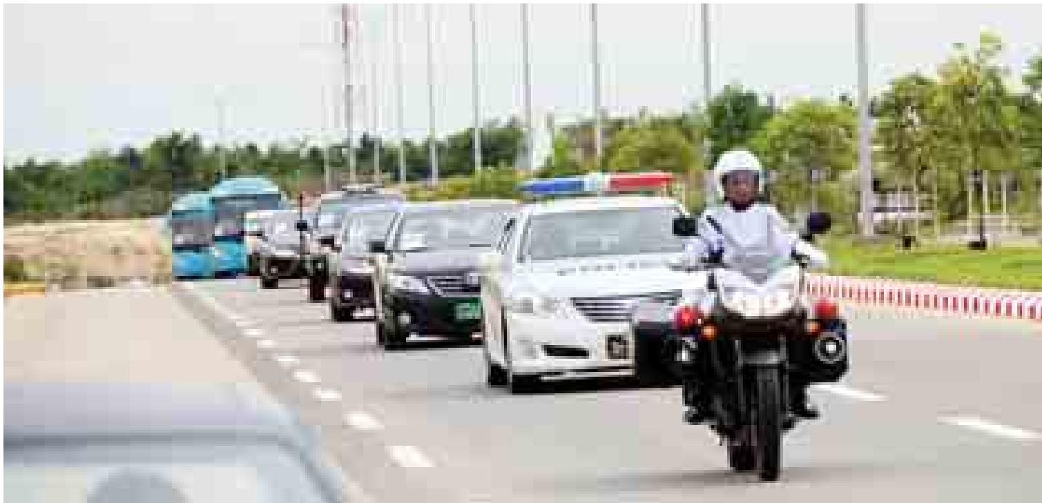
(၂၅) ကြိမ်မြောက် အာဆီယံထိပ်သီးအစည်းအဝေးနှင့် ဆက်စပ်အစည်းအဝေးများသို့ တက်ရောက်ကြသည့် နိုင်ငံခေါင်းဆောင်များ၏ လုံခြုံရေးတာဝန်များကို မြန်မာနိုင်ငံရဲတပ်ဖွဲ့ အထူးတာဝန်တပ်ဖွဲ့ဝင်များက လိုက်ပါထမ်းဆောင်ကြသည်။