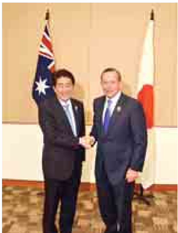
ဂျပန်နိုင်ငံ ဝန်ကြီးချုပ် ရှင်ဒိုအာဘေးနှင့် ဩစတြေးလျနိုင်ငံ ဝန်ကြီးချုပ် တိုနီအဲဘော့တို့ တွေ့ဆုံနှုတ်ဆက်စဉ်။