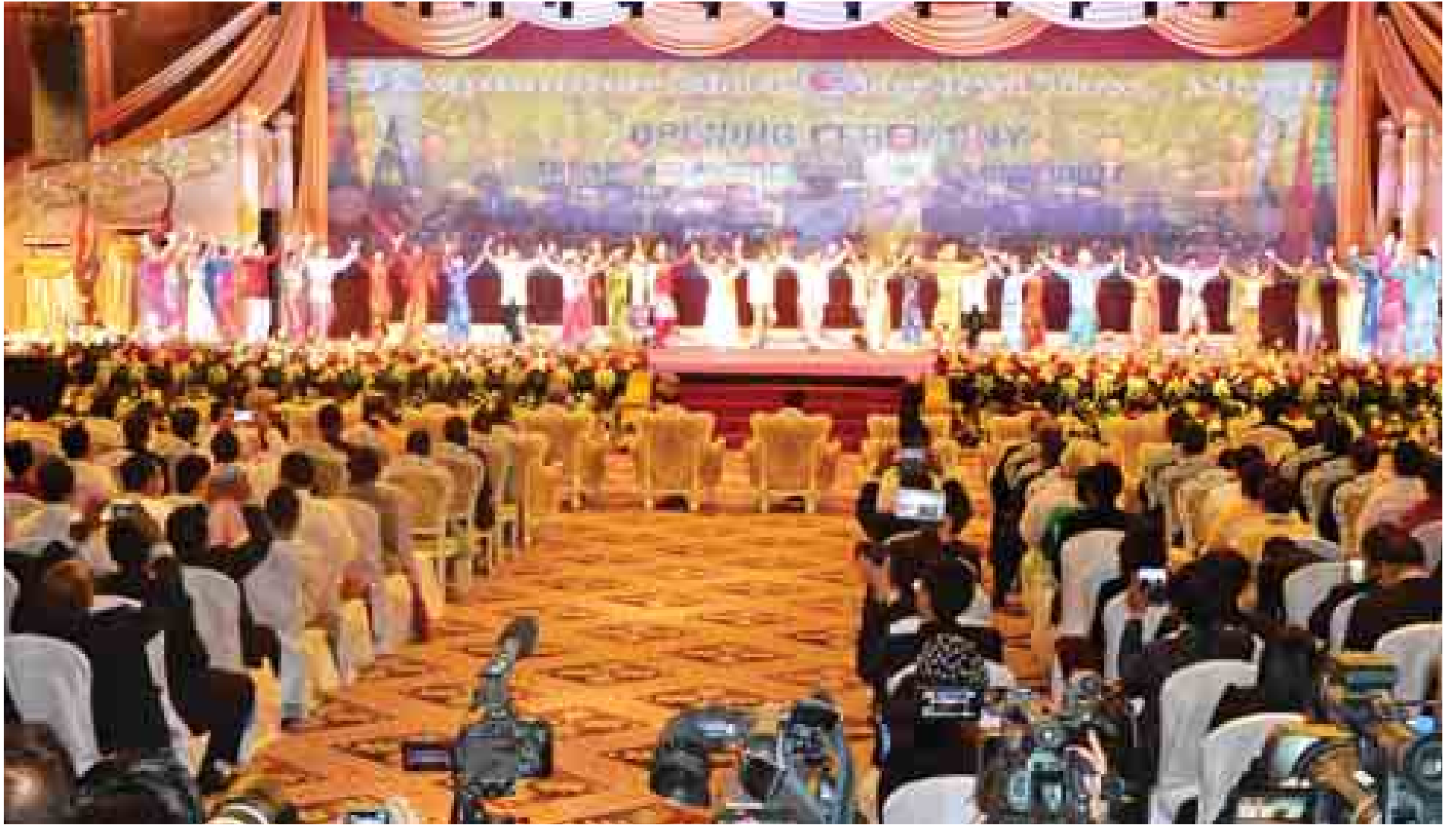
(၂၅) ကြိမ်မြောက် အာဆီယံထိပ်သီးအစည်းအဝေး ဖွင့်ပွဲ၌ အာဆီယံဂုဏ်ပြုတေးသီချင်းသီဆိုဖျော်ဖြေစဉ်။