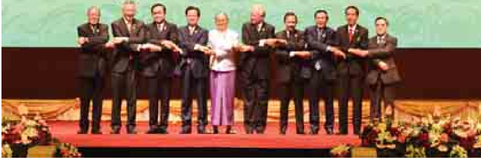
နိုင်ငံတော်သမ္မတ ဦးသိန်းစိန်နှင့် အာဆီယံခေါင်းဆောင်များ စုပေါင်းမှတ်တမ်းတင်ဓာတ်ပုံရိုက်ကြစဉ်။