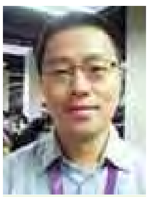
Mr. Li Ning People Daily Newspaper, CHINA

သွားလို့မရပါဘူး။ သတ်မှတ်ထား တဲ့ ကတ်ထဲကအတိုင်းပဲ သွားလာ ရပါတယ်။ ဒီအစည်းအဝေးကတော့ ခမ်းနားပါတယ်။ နိုင်ငံတကာက မီဒီယာသမားတွေအပါအဝင် မီဒီယာ သမားတွေအများကြီးကိုလည်း တွေ့ရ တယ်။ ကျွန်တော်တို့က booth လုပ်တော့ အခန်းထဲသတင်းယူရ တယ်။ အင်တာနက်မြန်နှုန်းတွေက ကောင်းတဲ့အတွက် နိုင်ငံတကာ သတင်းမီဒီယာတွေဟာ သက်ဆိုင်ရာ ကို တိုက်ရိုက်တင်ပို့နေတာတွေ မြင်တွေ့နေရတယ်။ နေရာတိုင်းမှာ ဆိုဒ်ကြီးတဲ့ တီဗွီဖန်သားပြင်တွေထား ပေးမယ်ဆိုရင် ပိုအဆင်ပြေပါမယ်။ မီဒီယာတွေကို အဆင်ပြေပြေ သတင်းရယူနိုင်အောင် ဆောင်ရွက် ပေးထားတဲ့အတွက် ကျေးဇူးတင်ပါ တယ်။ ဒါပေမယ့် အစည်းအဝေး အပြီး ထုတ်ပြန်တဲ့ သတင်းတွေ၊ ကြေညာချက်တွေကို အချိန်နဲ့ တစ်ပြေးညီ ထုတ်ပြန်ပေးစေချင်ပါ တယ်။