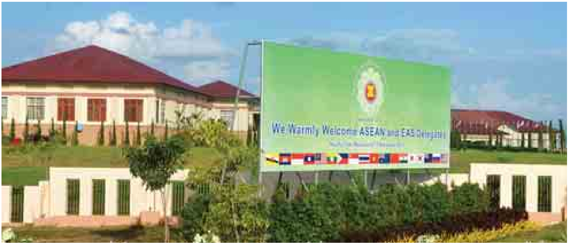
(၂၅) ကြိမ်မြောက် အာဆီယံထိပ်သီးအစည်းအဝေးကာလ၌ နိုင်ငံအကြီးအကဲများတည်းခိုသည့် ဟိုတယ်များကိုတွေ့ရစဉ်။