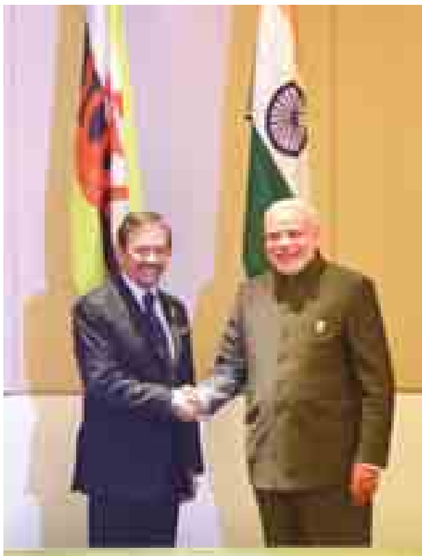
ဘရူနိုင်းဒါရူဆလမ်နိုင်ငံဘုရင် ဆူလ်တန် ဟာဂျီ ဟာဆန်နယ် ဘိုလ်ကီးရာမူအစ်ဇာဒင် ဝါဒေါင်လာနှင့် အိန္ဒိယနိုင်ငံဝန်ကြီးချုပ် နရန်ဒရာမိုဒီတို့ တွေ့ဆုံနှုတ်ဆက်စဉ်။ (သတင်းစဉ်)

ထိုသို့ တွေ့ဆုံရာတွင် ထိုင်းနိုင်ငံဝန်ကြီးချုပ် ပရာယုတ် ချန်အိုချာနှင့် အိန္ဒိယနိုင်ငံ ဝန်ကြီးချုပ် နရန်ဒရာမိုဒီတို့သည် နံနက် ၁၁ နာရီခွဲတွင် လည်းကောင်း၊ ဂျပန်နိုင်ငံ ဝန်ကြီးချုပ် ရှင်ဒိုအာဘေးနှင့် ဩစတြေးလျနိုင်ငံဝန်ကြီးချုပ် တိုနီအဲဘော့တို့သည် မွန်းလွဲ ၂ နာရီခွဲတွင်လည်းကောင်း၊ ဘရူနိုင်းဒါရူဆလမ်နိုင်ငံဘုရင် ဆူလ်တန် ဟာဂျီ ဟာဆန်နယ် ဘိုလ်ကီးရာမူအစ်ဇာဒင် ဝါဒေါင်လာနှင့် အိန္ဒိယနိုင်ငံဝန်ကြီးချုပ် နရန်ဒရာမိုဒီတို့သည် မွန်းလွဲ ၂ နာရီ ၄၅ မိနစ်တွင် လည်းကောင်း၊ အိန္ဒိယနိုင်ငံ ဝန်ကြီးချုပ် နရန်ဒရာမိုဒီနှင့် စင်ကာပူနိုင်ငံဝန်ကြီးချုပ် လီရှန်လွန်းတို့သည် ညနေ ၄ နာရီ ၁၅ မိနစ်တွင် လည်းကောင်း၊ ဩစတြေးလျနိုင်ငံ ဝန်ကြီးချုပ် တိုနီအဲဘော့နှင့် ဗီယက်နမ်နိုင်ငံ ဝန်ကြီးချုပ် ငုယင်တန်ဖွန်း တို့သည် ညနေ ၄ နာရီခွဲတွင်လည်းကောင်း၊ ဂျပန်နိုင်ငံဝန်ကြီးချုပ် ရှင်ဒိုအာဘေးနှင့် ဖိလစ်ပိုင် သမ္မတနိုင်ငံ သမ္မတ ဘီနစ်ဒို အင်ဒိုတို့သည် ညနေ ၄ နာရီ မိနစ် ၅၀ တွင် လည်းကောင်း၊ ကိုရီးယားသမ္မတနိုင်ငံ သမ္မတ ပက်ဂွန်ဟေးနှင့် အိန္ဒိယနိုင်ငံဝန်ကြီးချုပ် နရန်ဒရာမိုဒီတို့သည် ညနေ ၅ နာရီတွင် လည်းကောင်း၊ ထိုင်းနိုင်ငံဝန်ကြီးချုပ် ပရာယုတ် ချန်အိုချာနှင့် ကုလသမဂ္ဂအတွင်းရေးမှူးချုပ် မစ္စတာဘန်ကီမွန်းတို့သည် ည ၇ နာရီတွင် လည်းကောင်း၊ ရုရှားဖက်ဒရေးရှင်းနိုင်ငံဝန်ကြီးချုပ် ဒီမီထရီ မက်ပီဒက်နှင့် ကမ္ဘောဒီးယားနိုင်ငံဝန်ကြီးချုပ် ဆမ်ဒက်ခဲဟွန်ဆန်တို့သည် ည ၇ နာရီ မိနစ် ၅၀ တွင် လည်းကောင်း အသီးသီးတွေ့ဆုံဆွေးနွေးခဲ့ကြသည်။ (သတင်းစဉ်)