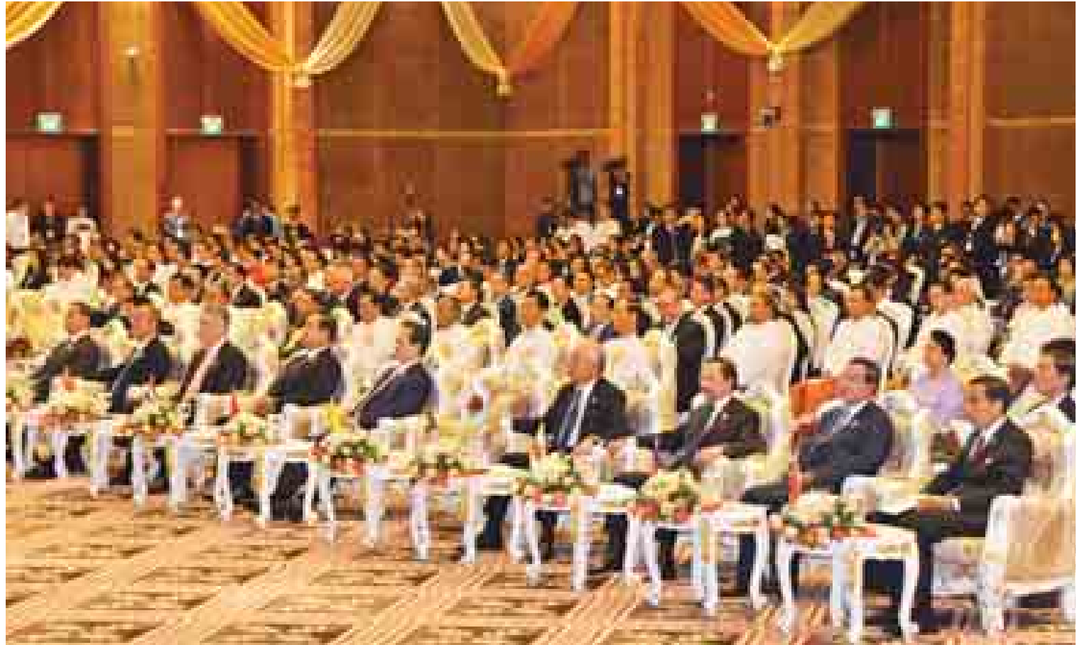
(၂၅) ကြိမ်မြောက် အာဆီယံထိပ်သီးအစည်းအဝေး ဖွင့်ပွဲအခမ်းအနားသို့ နိုင်ငံခေါင်းဆောင်များနှင့် အစိုးရအဖွဲ့အကြီးအကဲများ တက်ရောက်စဉ်။