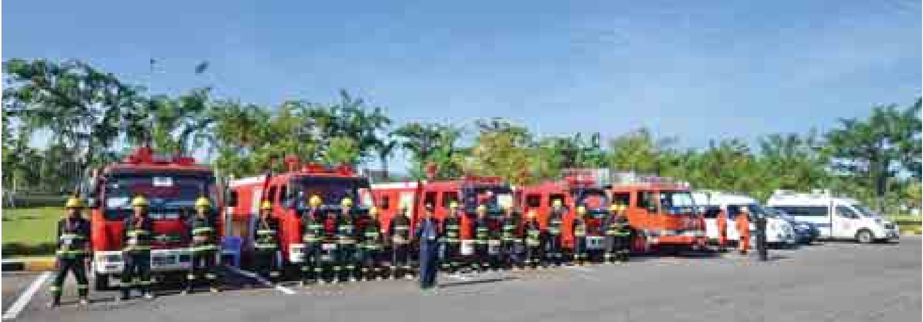
(၂၅) ကြိမ်မြောက် အာဆီယံထိပ်သီးအစည်းအဝေးကာလအတွင်း အသင့်ပြင်ဆင်ထားသည့် မီးသတ်ယာဉ်နှင့် လူနာတင်ယာဉ်များကိုတွေ့ရစဉ်။