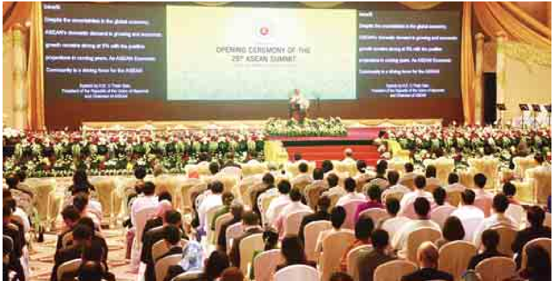
(၂၅)ကြိမ်မြောက် အာဆီယံထိပ်သီးအစည်းအဝေးဖွင့်ပွဲအခမ်းအနား ကျင်းပစဉ်။ (သတင်းစဉ်)

အာဆီယံ - အိန္ဒိယ မိတ်ဖက်ဆက်ဆံရေး အနာဂတ် လုပ်ငန်းစီမံချက်အသစ် ပေါ်ထွက်လာရေး အာဆီယံနှင့် အိန္ဒိယခေါင်းဆောင်တို့ ညှိနှိုင်းဆွေးနွေး