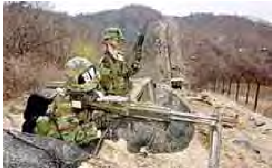
တောင်နှင့်မြောက်ကိုရီးယား နှစ်နိုင်ငံအကြား ခွဲခြားသတ်မှတ်ထားသည့် စစ်မဲ့ဒေသ၌ တောင်ကိုရီးယားတပ်ဖွဲ့ဝင်များအား တွေ့ရစဉ်။