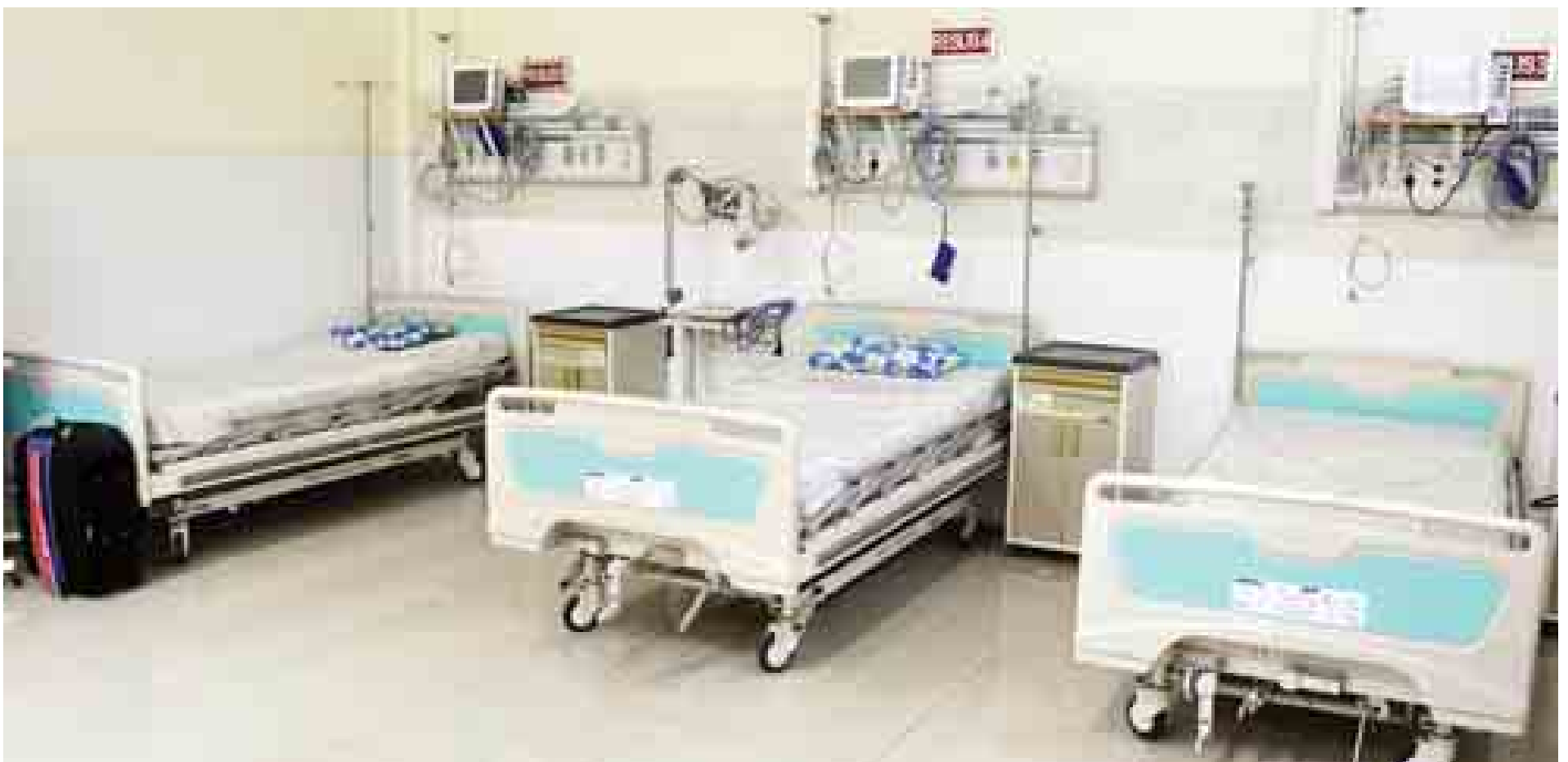
နေပြည်တော် ခုတင်(၁၀၀၀) အထွေထွေရောဂါကုဆေးရုံ အထူးကြပ်မတ်ကုသဆောင်တွင် ကြိုတင်ပြင်ဆင်ထားရှိမှုကို တွေ့ရစဉ်။