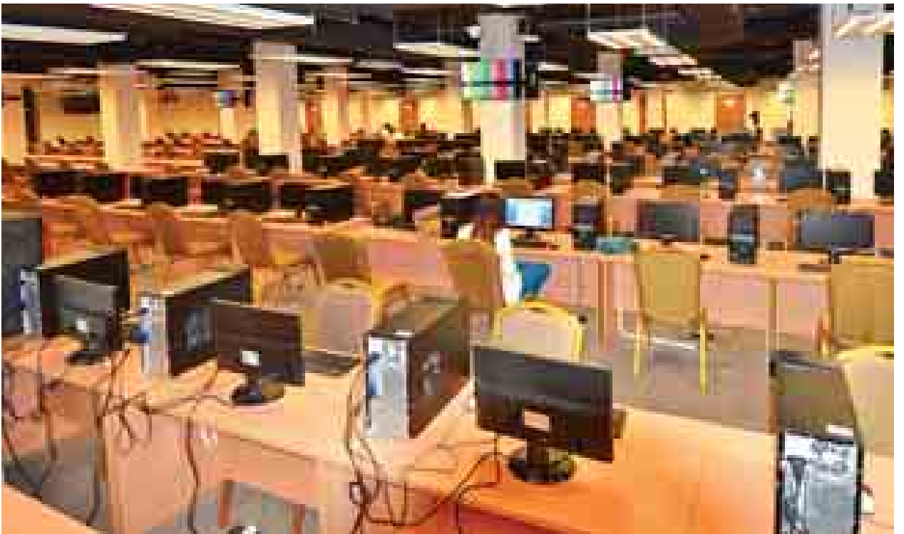
မီဒီယာများအတွက် MICC - 1 အဆောက်အအုံအတွင်းရှိ MEDIA Center(1)ကို တွေ့ရစဉ်။

MICC-1 မှာ ၂၀၁၄ ဇန်နဝါရီလကတည်းက အာဆီယံထိပ်သီးအစည်း အဝေးကြီးအတွက် နေပြည်တော်စည်ပင်သာယာရေးကော်မတီ၊ အခမ်းအနား ပြင်ဆင်ရေးဆပ်ကော်မတီနဲ့အခြားပုဂ္ဂလိကအဖွဲ့အစည်းတွေ ပူးပေါင်းပြီး ကြိုတင်ပြင်ဆင်ရေးလုပ်ငန်းတွေ ဆောင်ရွက်ခဲ့ပါတယ်။ အစည်းအဝေးကြီး အောင်မြင်စွာ ကျင်းပနိုင်ဖို့ အဓိကကျတဲ့အဆောက်အအုံဖြစ်တဲ့ MICC-1 မှာ အစည်းအဝေးဖွင့်ပွဲ၊ ပိတ်ပွဲနဲ့ဥပစာစားပွဲတွေ ကျင်းပလို့ရတဲ့ ခန်းမကြီး ခြောက်ခု ရှိပါတယ်။ ဒီလိုခန်းမကြီးတွေအပါအဝင် အဆောက်အအုံတစ်ခုလုံး အတွက် လိုအပ်တဲ့ ရေလိုင်း၊ မီးလိုင်း၊ အိုင်စီတီ၊ သန့်ရှင်းရေးနဲ့ သစ်ပင်ပန်းမန် စိုက်ပျိုးရေး၊ မိလ္လာစနစ်ထိန်းသိမ်းမှုတွေကို စနစ်တကျဆောင်ရွက်ထားပါတယ်။ လျှပ်စစ်ဓာတ်အားလိုင်းအနေနဲ့ မြန်မာ့လျှပ်စစ်ဓာတ်အားလုပ်ငန်းက ပေးဝေတဲ့ ဓာတ်အားလိုင်းအပြင် အရန်ဓာတ်အားပေးဝေနိုင်အောင် ၅၀၀ ကေပို့အေစီစက် ကြီး ငါးလုံးတစ်ပြိုင်တည်း တပ်ဆင်ထားပါတယ်။ ဒီအပြင် အလိုအလျောက် ဓာတ်အားပေးနိုင်တဲ့ ယူပီစက်စနစ်သုံး ၃၆၉ ကေပို့အေစီတဲ့ ဓာတ်အားလိုင်း တွေက အဆောက်အအုံကြီးတစ်ခုလုံးရဲ့ ၈၀ ရာခိုင်နှုန်းကို တစ်နာရီကြာပေးထား နိုင်တဲ့စနစ်တွေ တပ်ဆင်ထားပါတယ်။ စာမျက်နှာ ၉ ကော်လံ ၁ သို့ ▢