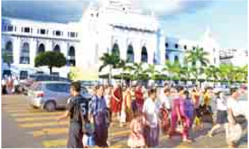
နိုဝင်ဘာ ၁၀ ရက်က ရန်ကုန်မြို့တွင် ခရီးသွားအများပြည်သူများ လမ်းစည်းကမ်းနှင့်အညီ လူကူးမျဉ်းကွားမှ စနစ်တကျဖြတ်သန်းသွားလာမှုကို တွေ့ရစဉ်။

ထိုသို့ ယာဉ်များပြားစွာသွားလာနေမှုနှင့်အတူ ယာဉ်အန္တရာယ်များကလည်း အဟန့်အတားတစ်ခုအဖြစ် ရှိနေပြီး ယာဉ်တိုက်မှုများ၏ ၉၀ ရာခိုင်နှုန်းခန့်မှာ ယာဉ်မောင်းများသည် ယာဉ်ကိုကောင်းမွန်စွာ မောင်းနှင်တတ်ကြသော်လည်း စည်းကမ်းပျက်ခြင်းကြောင့်သာ ဖြစ်ပွားသည်ကိုတွေ့ရှိရကြောင်း ကုန်းလမ်းပို့ဆောင်ရေးညွှန်ကြားမှု ဦးစီးဌာနမှဆိုသည်။ မြန်မာတစ်နိုင်ငံလုံးတွင် ၂၀၁၃ ခုနှစ် တစ်နှစ်တာအတွင်း ယာဉ်တိုက်မှုပေါင်း ၁၃၉၁၀ မှုကျော် ဖြစ်ပွားပြီး