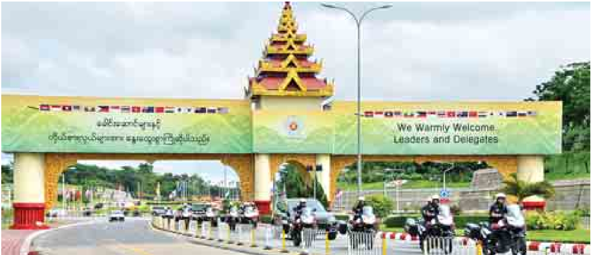
(၂၅) ကြိမ်မြောက် အာဆီယံထိပ်သီးအစည်းအဝေးနှင့် ဆက်စပ်အစည်းအဝေးများသို့ တက်ရောက်ကြမည့် နိုင်ငံခေါင်းဆောင်များ၏ လုံခြုံရေးတာဝန်ထမ်းဆောင်ကြမည့် မြန်မာနိုင်ငံရဲတပ်ဖွဲ့ အထူးတာဝန်တပ်ဖွဲ့ဝင်များ၏ ကြိုတင်လေ့ကျင့်နေမှုကို တွေ့ရစဉ်။