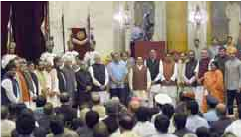
အသစ်တိုးချဲ့ခန့်အပ်လိုက်သည့် အိန္ဒိယအစိုးရအဖွဲ့ဝင်ဝန်ကြီးများနှင့် ဝန်ကြီးချုပ်နရိန္ဒရာမိုဒီအား တွေ့ရစဉ်။

ယခုနှစ်အစောပိုင်းက ကျင်းပခဲ့သော အိန္ဒိယနိုင်ငံ၏ အထွေထွေရွေးကောက်ပွဲတွင် ဘနာတီယာဂျနာတာပါတီက ကွန်ဂရက်ပါတီ အပါအဝင် အခြားပါတီများကိုပါ နှစ် ၃၀ အတွင်း ပြတ်ပြတ်သားသား အနိုင်ရပြီး အိန္ဒိယနိုင်ငံ၏ လွှတ်တော်များအတွင်း၌ အများစုအနေအထားကို ရရှိခဲ့သည်။