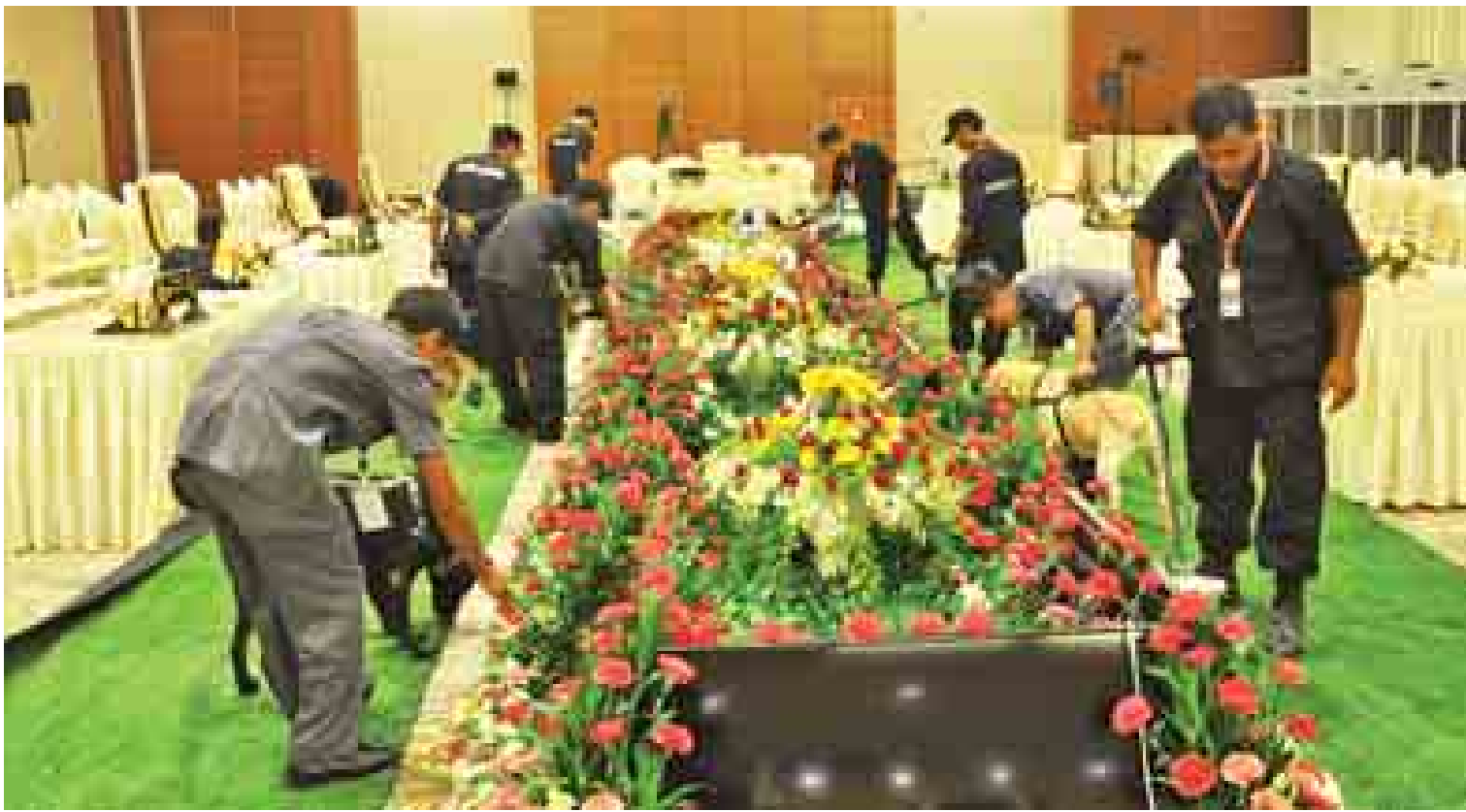
(၂၅) ကြိမ်မြောက် အာဆီယံထိပ်သီးအစည်းအဝေးနှင့် ဆက်စပ်အစည်းအဝေးများ အောင်မြင်စွာကျင်းပနိုင်ရေး လုံခြုံရေးဆောင်ရွက်နေမှုကို တွေ့ရစဉ်။