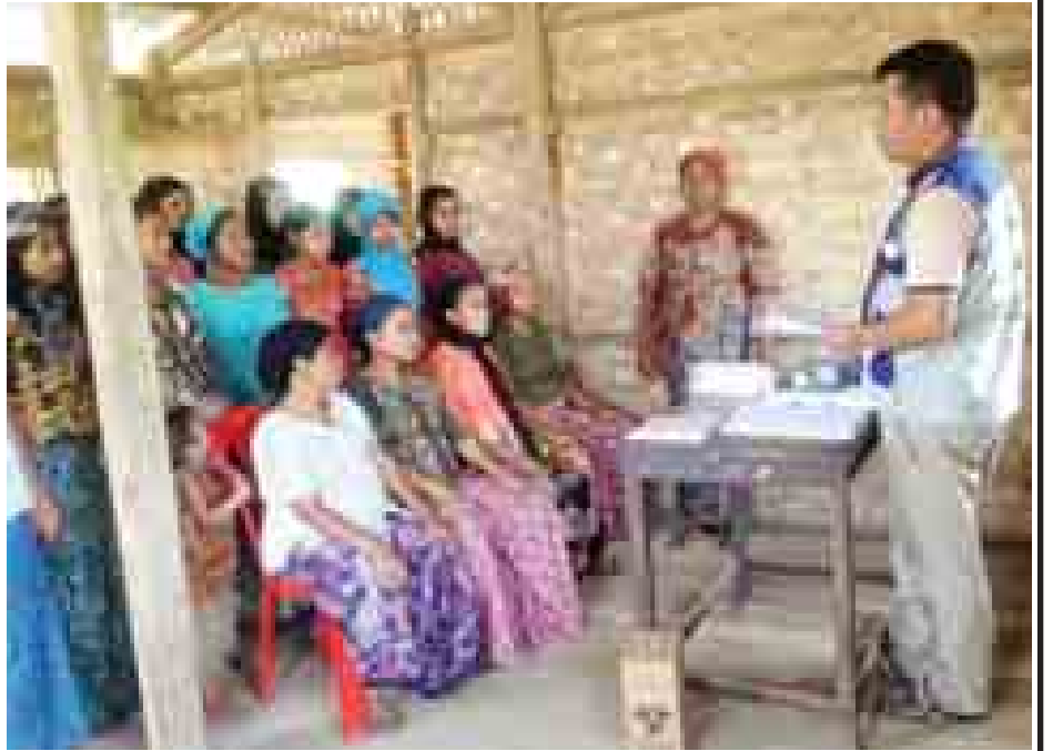
အနောက်စံပြကျေးရွာ(ဘာဆာရာ)တွင် ကိုယ်ဝန်ဆောင်မိခင်များအား ကျန်းမာရေးအသိပညာပေးဟောပြောစဉ်။