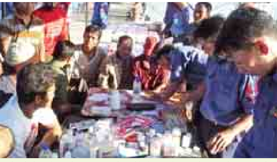
ပင်လယ်ပြင်မျောပါ ရေလုပ်သားများအား တပ်မတော်(ရေ)မှ ဆေးဝါးကုသမှုနှင့် အကူအညီများ ပေးနေစဉ်။

ရန်ကုန် နိုဝင်ဘာ ၁၀ တပ်မတော်(ရေ)မှ ပင်လယ်ပြင် တွင် မျောပါနေသော ကျားဖောင် ရေလုပ်သား ၂၆ ဦးအား တတိယ အကြိမ်အဖြစ် ရှာဖွေပေးနိုင်ခဲ့ပြီး ယနေ့ညနေတွင် သာကေတ ရေတပ် ဆိပ်ကမ်းသို့ ပို့ဆောင်ပေးမည်ဖြစ် ကြောင်း သိရသည်။ “ပင်လယ်ပြင်မျောပါ ကျားဖောင် ရေလုပ်သား ၂၆ ဦးကို တတိယ အသုတ် ရှာဖွေပို့ဆောင်ပေးမည်။ ဒီနေ့ညနေလောက်မှ တွဲဆွဲရေယာဉ် နှစ်စင်း ရောက်မှာဆိုတာက အပြင် မှာ ရာသီဥတု နည်းနည်းဆိုးနေလို့ပါ။ နောက်ပြီးရှာဖွေနေတဲ့ ရေယာဉ် ငါးစင်းကလည်း တစ်စင်းနဲ့တစ်စင်း ချိတ်ဆက်ဆောင် ရွက်နေရတယ်။ ပင်လယ်ပြင်မှာ စစ်ဆင်ရေးတာဝန် ထမ်းဆောင်နေတဲ့ တပ်မတော်(ရေ) က ရေယာဉ်တွေကတော့ ရေလုပ်သား တွေကို ဆက်လက်ကူညီရှာဖွေပေး သွားမှာပါ” ဟု တပ်မတော် ရေတပ် ဌာနချုပ်မှ ဗိုလ်မှူးရဲမာန်ဝင်းက