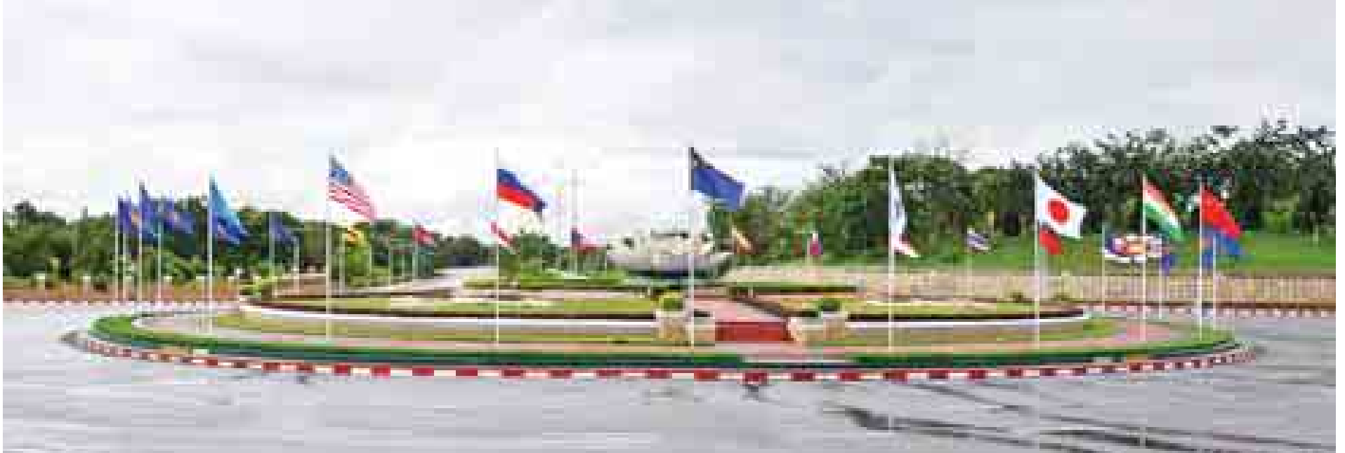
(၂၅) ကြိမ်မြောက် အာဆီယံထိပ်သီးအစည်းအဝေးနှင့် ဆက်စပ်အစည်းအဝေးများကျင်းပနိုင်ရေး ကြိုတင်ပြင်ဆင်ထားရှိမှုကို တွေ့ရစဉ်။