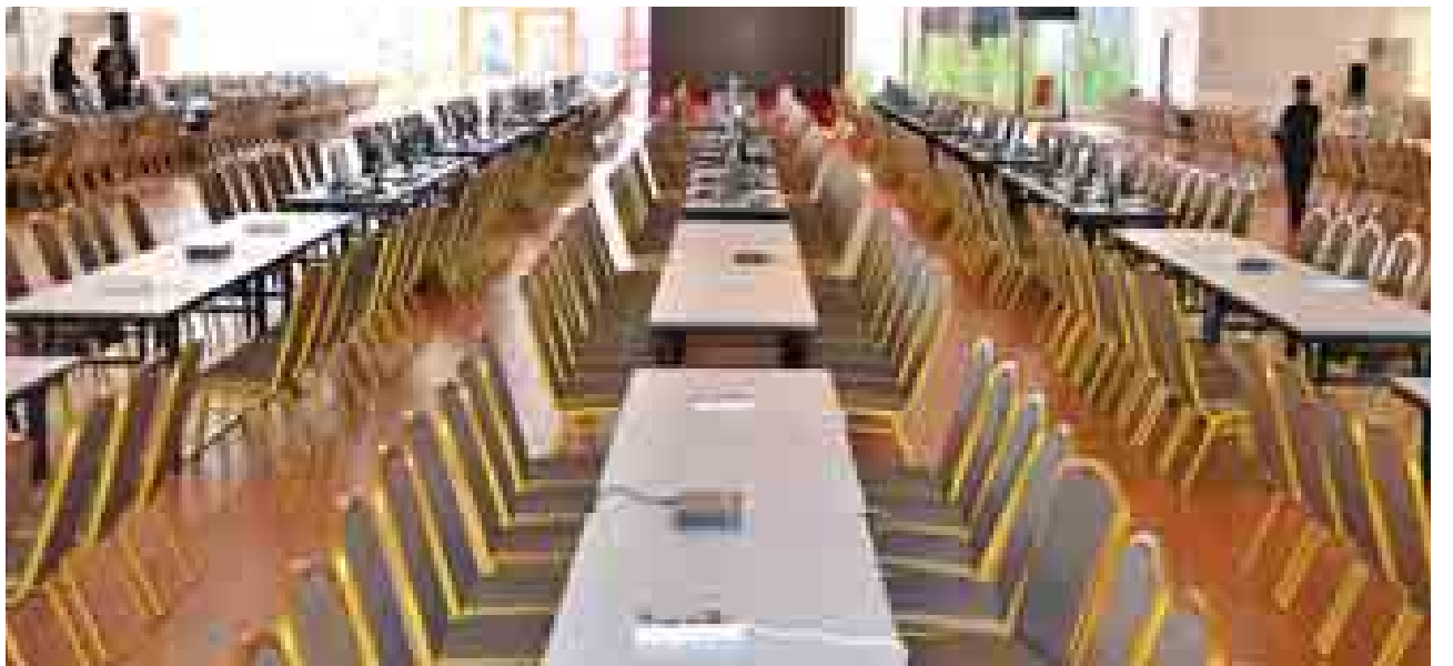
မီဒီယာများအတွက် MICC-1 အဆောက်အအုံအပြင်ရှိ MEDIA Center(2) ကို တွေ့ရစဉ်။

အဆောက်အအုံရဲ့ ရုပ်သံစနစ်သုံးရုပ်သံလှိုင်းနဲ့ အတွင်းအပြင်သန့်ရှင်း ရေးကဏ္ဍမှာ တာဝန်ယူထားပါတယ်။ရုပ်သံလှိုင်းမှာတော့ ဇန်နဝါရီခွဲထားပြီး သက်ဆိုင်ရာဇန်နဝါရီကို EP၊ EC၊ IT အင်ဂျင်နီယာများပါဝင်ပြီး တာဝန်ခံ တစ်ယောက်စီချထားဆောင်ရွက်ပါတယ်။ အဆောက်အအုံအတွင်းနဲ့ အပြင်ကသန့်စင်ခန်းတွေ စနစ်တကျသန့်ရှင်း သပ်ရပ်နေဖို့ စီမံဆောင်ရွက်ရတာဖြစ်ပြီး သန့်ရှင်းရေးဝန်ထမ်းအင်အား အတွင်း