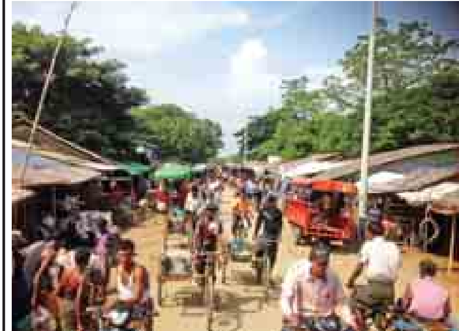
ဒါးပိုင်ရွာရှိ သဲချောင်းဈေး၌ ရောင်းဝယ်ဖောက်ကားသူများဖြင့် စည်ကားလျက်ရှိနေသည်ကို တွေ့ရပေ။