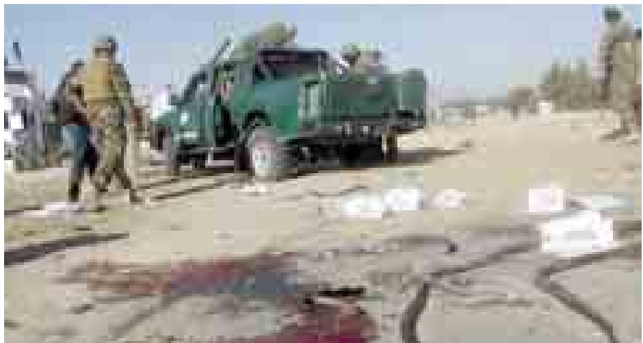
နေတိုးနှင့် အမေရိကန်တပ်ဖွဲ့များ ရုပ်သိမ်းသွားပြီးနောက် အာဖဂန်နစ် တာလီဘန်တို့တိုက်ခိုက်မှုများ မြင့်တက်လာခဲ့သည်။