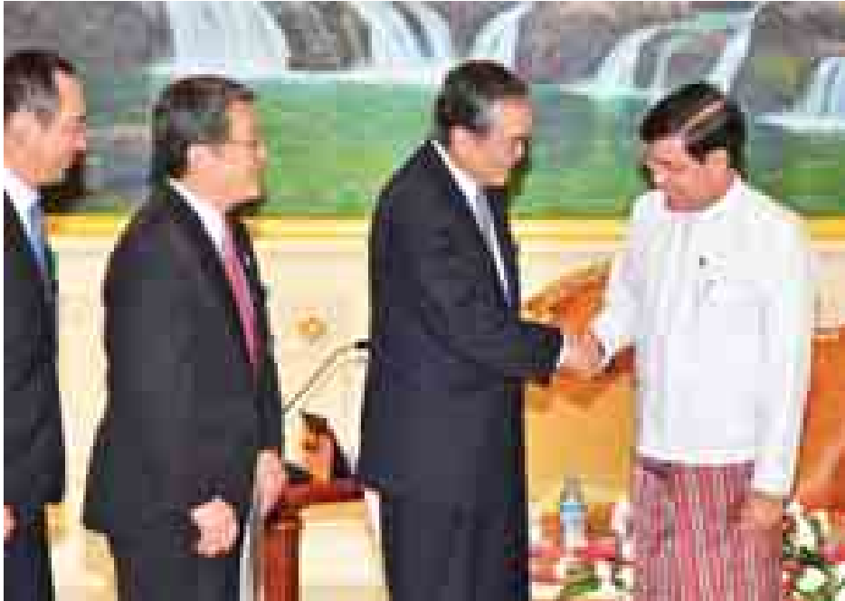
ဒုတိယသမ္မတ ဦးညွှန်ထွန်း ဂျပန်နိုင်ငံ တိုကျို-မစ်ဆူဘီရှိဘဏ် ယူအက်စ်ဂျေလီမိတက် ဒုတိယဥက္ကဋ္ဌအား ရင်းနှီးနှီးနှီးနှီးဆက်စဉ်။ (သတင်းစဉ်)

ပြည်ထောင်စုသမ္မတမြန်မာနိုင်ငံတော် ဒုတိယသမ္မတ ဦးညွှန်ထွန်းသည် ဂျပန်နိုင်ငံ တိုကျို-မစ်ဆူဘီရှိဘဏ် ယူအက်စ်ဂျေလီမိတက် ဒုတိယဥက္ကဋ္ဌ မစ္စတာ တာကရှိ မိုရိုမူရ ဦးဆောင်သည့် ကိုယ်စားလှယ်အဖွဲ့အား ယနေ့ မွန်းလွဲ ၂ နာရီတွင် နေပြည်တော်ရှိ နိုင်ငံတော်သမ္မတ အိမ်တော်သံတမန်ဆောင်ရွက်ခန်းမ၌ လက်ခံတွေ့ဆုံသည်။ ယင်းသို့တွေ့ဆုံရာတွင် ဒုတိယသမ္မတနှင့်အတူ ဒုတိယဝန်ကြီး ဦးတင်ဦးလွင်၊ ဒေါက်တာမောင်မောင်သိမ်း နှင့် မြန်မာနိုင်ငံတော်ဗဟိုဘဏ် ဒုတိယဥက္ကဋ္ဌ ဦးဆက်အောင် တို့ တက်ရောက်ကြသည်။ တွေ့ဆုံစဉ် မြန်မာနိုင်ငံဘဏ်လုပ်ငန်းနှင့် ငွေရေးကြေးရေးကဏ္ဍတွင် ဆက်လက်ပူးပေါင်း ဆောင်ရွက် သွားမည့်ကိစ္စရပ်များအပေါ် ရင်းနှီးစွာဆွေးနွေးခဲ့ကြသည်။ (သတင်းစဉ်)