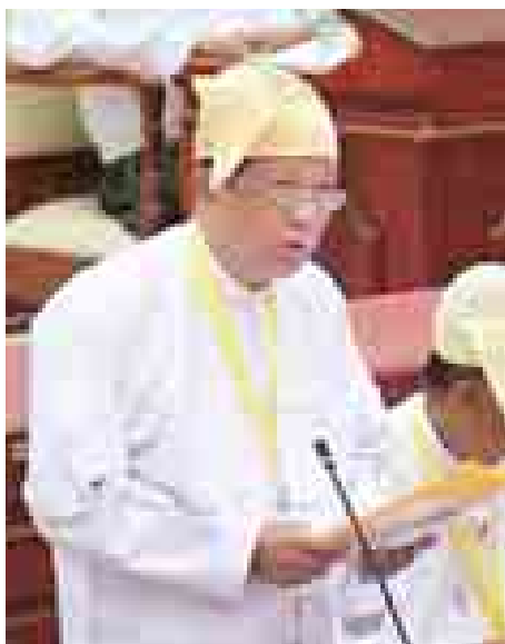
ကျန်းမာရေးဝန်ကြီးဌာန ဒုတိယဝန်ကြီး ဒေါက်တာလင်းအောင်။

အစည်းအဝေးတွင် ဒဂုံမြို့သစ်(မြောက်ပိုင်း)မဲဆန္ဒနယ်မှ ဒေါ်တင်နွယ်ဦး၏ “ကမ်းရိုးတန်းဒေသများ၌ ကြုံတွေ့ရသော ရာသီဥတုဆိုးရွားမှု၊ ငလျင်ဒဏ်၊ မီးဘေးဒဏ်များနှင့်ပတ်သက်၍ ရသုံးမုန့်ခြေငွေစာရင်းတွင် ရေရှည်လုပ်ငန်းစီမံကိန်းအနေဖြင့် သီးသန့်ရန်ပုံငွေချန်လှပ်ထားမှုကို သိရှိလိုကြောင်း” မေးခွန်းနှင့်စပ်လျဉ်း၍ ဘဏ္ဍာရေးဝန်ကြီးဌာန ဒုတိယဝန်ကြီး ဒေါက်တာလင်းအောင်က ပြည်ထောင်စုသမ္မတမြန်မာနိုင်ငံတော်အစိုးရအနေဖြင့် ၂၀၁၂-၂၀၁၃ ဘဏ္ဍာရေးနှစ်မှစ၍ ကြိုတင်မမျှော်မှန်းနိုင်သော သဘာဝဘေးအန္တရာယ်များကျရောက်လာပါက ကယ်ဆယ်ရေးနှင့် ပြန်လည်နေရာချထားရေးလုပ်ငန်းများကို ဆောင်ရွက်နိုင်ရန်နှင့် ဘဏ္ဍာရေးနှစ်အတွင်းမသုံးစွဲလျှင်မဖြစ်သည့် အထူးကိစ္စရပ်များအတွက် သုံးစွဲခိုင်ရန် ပြည်ထောင်စု၏ အရအသုံးခန့်မှန်းခြေငွေစာရင်းတွင် သီးသန့်ရန်ပုံငွေကျပ် (၁၀၀) ဘီလီယံကို နှစ်စဉ်လျာထားခဲ့ပါကြောင်း။