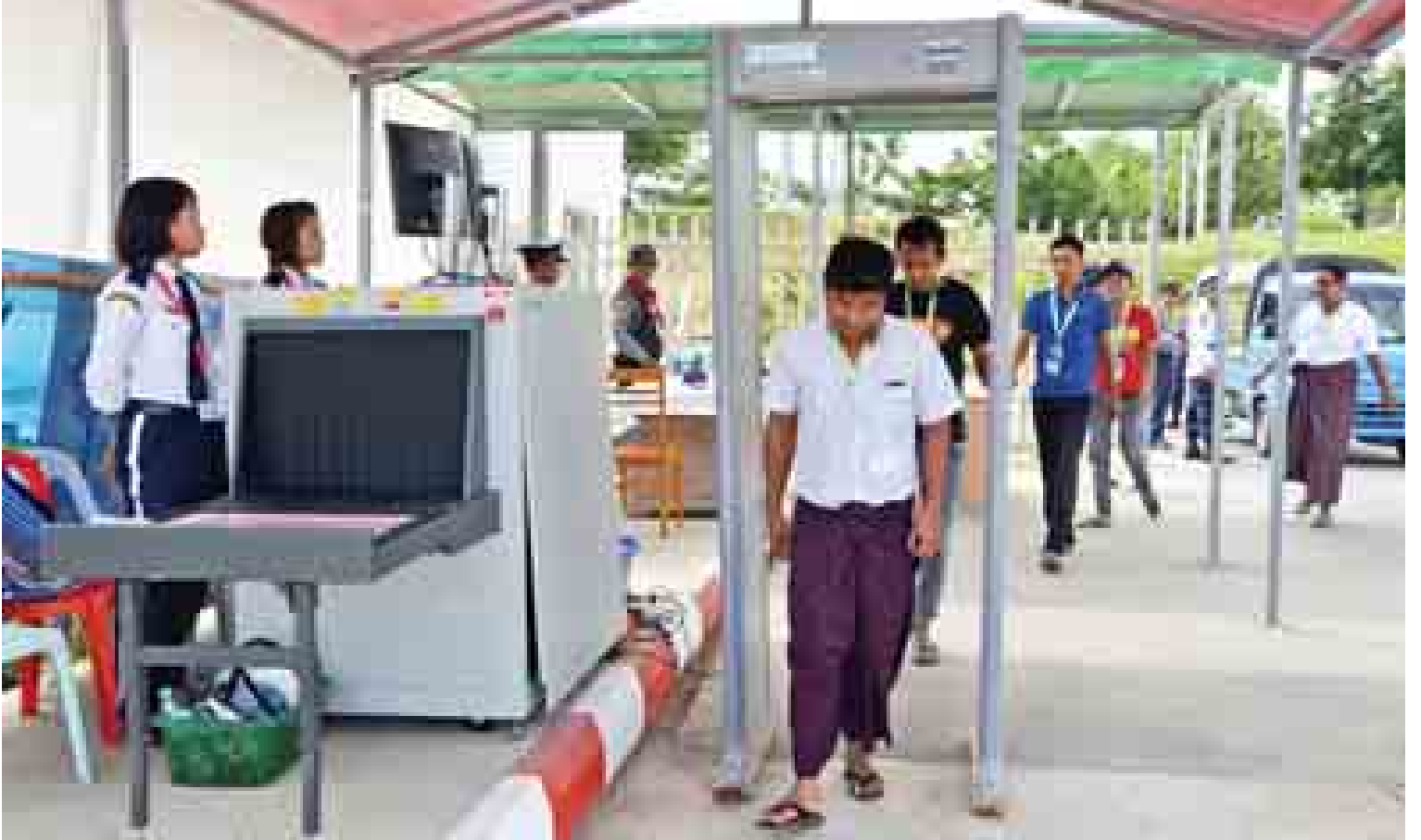
(၂၅) ကြိမ်မြောက် အာဆီယံထိပ်သီးအစည်းအဝေးနှင့် ဆက်စပ်အစည်းအဝေးများ အောင်မြင်စွာကျင်းပနိုင်ရေး လုံခြုံရေးဆောင်ရွက်နေမှုကို တွေ့ရစဉ်။

ကျွန်တော်လည်း ရုတ်တရက်ဆိုတော့ အံ့ဩမင်သက်ပြီး “အေးအေး” တစ်ခွန်းပဲ ပြောလိုက်နိုင်ပါတော့တယ်။ သူငယ်ချင်းက အာဆီယံအကြောင်းကို အပေါ်ယံလေးပဲ ပြောပြသေးတာဆိုပေမယ့် ကျွန်တော်အဖို့ တော့ အာဆီယံအကြောင်း ဗဟုသုတတွေ တအံ့တမကြီးရလိုက်ပါတယ်။ နောက်ပြီးပေါင်း များစွာနဲ့ ထွက်သွားတဲ့ သူငယ်ချင်းရဲ့ နောက်ကျောကိုကြည့်ပြီး ရင်ထဲမှာလည်း မျိုးချစ်စိတ်ဓာတ်အပြည့်ရှိတဲ့ မြန်မာနိုင်ငံသား ပီပီ မြန်မာနိုင်ငံက အာဆီယံဥက္ကဋ္ဌတာဝန်ကို (၁၇)နှစ်ကြာမှပထမဆုံးအကြိမ် ထမ်းဆောင် နေတာကို ဂုဏ်ယူစိတ်နဲ့ အလေးအနက် တန်ဖိုးထားတဲ့စိတ်နဲ့ အာဆီယံနိုင်ငံသား တစ်ယောက်ဖြစ်ရတာကိုလည်း ဂုဏ်ယူတဲ့ စိတ်တွေ တဖွားဖွားဖြစ်လာပါတယ်။ ။