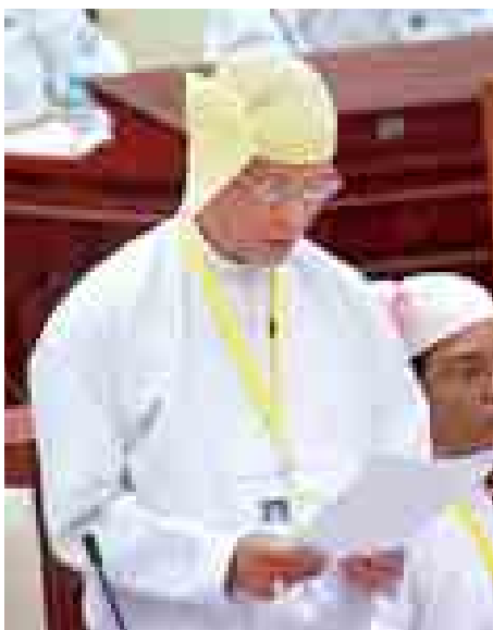
ဘဏ္ဍာရေးဝန်ကြီးဌာန ဒုတိယဝန်ကြီး ဒေါက်တာလင်းအောင်။

တိုင်းဒေသကြီး/ပြည်နယ်များတွင် ကြိုတင်မမျှော်မှန်းနိုင်သော သဘာဝဘေးအန္တရာယ်များဖြစ်သည့် ရာသီဥတုဆိုးရွားမှုနှင့် ငလျင်ဒဏ်၊ မီးဘေး၊ ရေဘေးနှင့် မုန်တိုင်း ကျရောက်မှုများဖြစ်ပေါ်လာပါက လူမှုဝန်ထမ်း၊