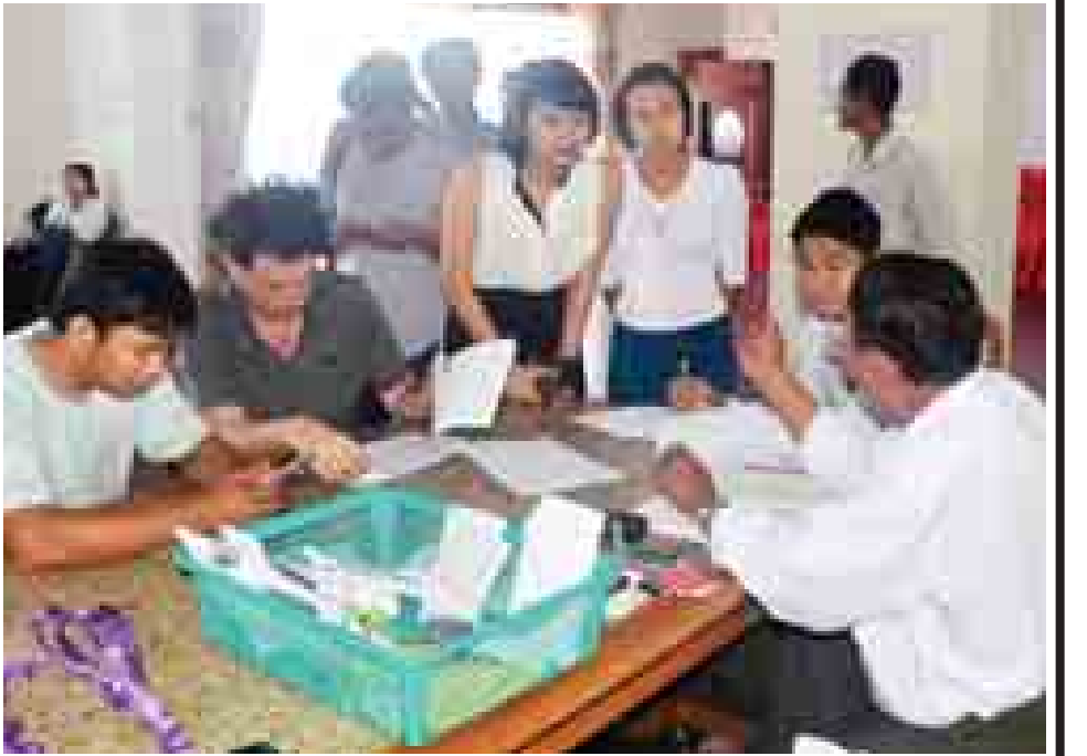
နေပြည်တော် Sky Palace Hotel အထိ မီဒီယာကတ် ၅၀၀ ကျော် ၁၁ ရက်တွင်လည်း ဆက်လက်ထုတ်ပေး တွင် ထုတ်ပေးလျက်ရှိရာ ယနေ့ညနေ ထုတ်ပေးပြီးဖြစ်ကြောင်းနှင့် နိုဝင်ဘာ သွားမည်ဖြစ်ကြောင်း သိရသည်။

သတင်း-မိုးသူဇာစိုး၊ ဓာတ်ပုံ-ကျော်ဇေယျ ဂျပန်၊ တရုတ်၊ ကိုရီးယား၊ နယူးဇီလန်၊ ဩစတြေးလျ၊ အိန္ဒိယနှင့် ရုရှားနိုင်ငံ များမှ နိုင်ငံခေါင်းဆောင်များ၊ ကုလ သမဂ္ဂအတွင်းရေးမှူးချုပ်နှင့် အာရှ ဖွံ့ဖြိုးရေးဘဏ်ဥက္ကဋ္ဌတို့လည်း တက် ရောက်ကြမည်ဖြစ်ရာ မြန်မာနိုင်ငံ တွင်ကျင်းပသည့် နိုင်ငံတကာဆိုင်ရာ ထိပ်သီးအစည်းအဝေးများတွင် အကြီး ကျယ်ဆုံးအစည်းအဝေးကြီး ဖြစ် သည်။ အဆိုပါ အစည်းအဝေးများသို့ တက်ရောက်သတင်းရယူရန် ပြည်တွင်း မီဒီယာများမှ ၁၆၅ ဦး၊ ပြည်ပမီဒီယာ များမှ ၈၀၀ ဦး၊ အစည်းအဝေး တက် ရောက်သော သက်ဆိုင်ရာနိုင်ငံများ မှ မီဒီယာ ၃၅၁ ဦး ရှိကြောင်း သိရသည်။ အစည်းအဝေး တက် ရောက်ကြမည့် သက်ဆိုင်ရာ နိုင်ငံများ ၏ မီဒီယာများပါရှိမှုတွင် အမေရိကန် နိုင်ငံမှ ၁၂၈ ဦး ပါဝင်မည်ဖြစ်ကာ