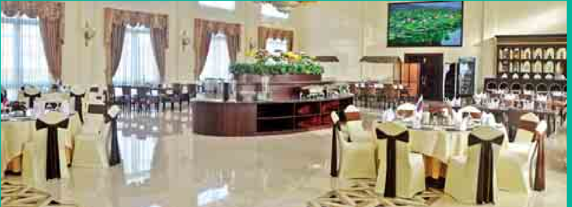
(၂၅) ကြိမ်မြောက် အာဆီယံထိပ်သီးအစည်းအဝေးကာလ၌ နိုင်ငံ့အကြီးအကဲများတည်းခိုမည့် ဟိုတယ်အတွင်း ပြင်ဆင်ထားရှိမှုကို ဤသို့တွေ့ရစဉ်။