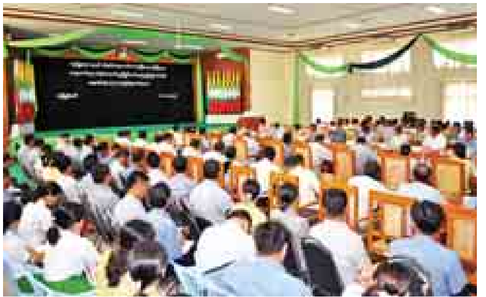
သင်တန်းများ ဖွင့်လှစ်ပေးခြင်းကြောင့် ဝန်ထမ်းများ အောင်မြင်စွာ ဆောင်ရွက်လာနိုင်မည်ဖြစ်ကြောင်း စွမ်းဆောင်ရည်မြှင့်တင်ရေး ကျေးလက်လူငယ်များကို ပြောကြားသည်။ သင်တန်းများ ဆက်လက်ပေးခြင်းဖြင့် ကျေးလက်ဒေသ သင်တန်းသို့ သင်တန်းသား သင်တန်းသူ ၁၂၀ များတွင် ဖွံ့ဖြိုးရေးလုပ်ငန်းများကို ပိုမိုထိရောက် တက်ရောက်ကြကြောင်း သိရသည်။ (ကြေးမုံ)

လိုအပ်ကြောင်း ပြောကြားသည်။ ထို့နောက် ပြည်ထောင်စုဝန်ကြီး ဦးအုန်းမြင့်က နိုင်ငံတော်အစိုးရအနေဖြင့် ဘက်စုံဖွံ့ဖြိုးတိုးတက်ရေး လုပ်ငန်းများကို အားသွန်ခွန်စိုက် အကောင်အထည် ဖော်လျက်ရှိရာ ကျေးလက်လူငယ်စွမ်းဆောင်ရည်မြှင့် တင်ရေးသင်တန်းများကို နေပြည်တော်၊ တိုင်းဒေသကြီး နှင့် ပြည်နယ်အသီးသီးတွင် ဖွင့်လှစ်သွားရန် စီမံဆောင် ရွက်ခဲ့ခြင်းဖြစ်ပါကြောင်း၊ မိမိတို့ဝန်ကြီးဌာနအောက်ရှိ အရာထမ်းများကို နည်းပြသင်တန်းတက်ရောက်စေပြီး သက်ဆိုင်ရာဒေသများတွင် ခရိုင်အလိုက် နည်းပြ(ဆင့်ပွား) သင်တန်းများ ပြန်လည်ဖွဲ့စည်းပေးမည်ဖြစ်ပါကြောင်း၊ သင်တန်းတက်ရောက်ပြီးသူများအနေဖြင့် သက်ဆိုင်ရာ ဒေသများတွင် ကျေးရွာအရောက် ကွင်းဆင်းပြီး ဖွဲ့စည်း ထားသည့် ကျေးလက်လူငယ်များကို ကျေးလက်ဒေသဖွံ့ဖြိုး တိုးတက်ရေးနှင့် ဆင်းရဲမှုလျှော့ချရေးလုပ်ငန်းစဉ်များ တွင် ပူးပေါင်းဆောင်ရွက်ရမည် အစီအစဉ်၊ ပြုစု ကောက်ခံပေးရမည့် စာရင်းဇယားများကို အချိန်တိုကာလ အတွင်း ဆက်လက်သင်ကြားပေးရမည်ဖြစ်ပါကြောင်း၊