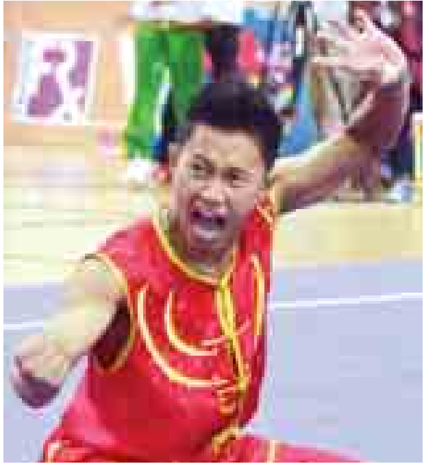
အမျိုးသားအားကစားပွဲတော်တွင် ပါဝင်မည့် အားကစားနည်းများ ပြိုင်ပွဲဝင်နေစဉ်။

တစ်နိုင်ငံလုံးမှ အားကစားသမားများဝင်ရောက်ယှဉ်ပြိုင်နိုင်သည့် အမျိုးသားအားကစားပွဲတော်ကို မကျင်းပနိုင်ခဲ့သည်မှာ ကြာမြင့်နေခဲ့ပြီဖြစ်သည်။ ၁၉၉၇ ခုနှစ်က နောက်ဆုံးကျင်းပခဲ့ပြီး ဆယ်နှစ်ကျော်ကြာ ကျင်းပနိုင်ခြင်းမရှိခဲ့ရာမှ ၂၀၁၄ ခုနှစ် နှစ်ဆန်းပိုင်းတွင် ပြန်လည်ကျင်းပနိုင်တော့မည်ဖြစ်သည်။ စင်ကာပူနိုင်ငံတွင် ကျင်းပမည့်(၂၈)ကြိမ်မြောက် ဆီးရိမ်းပြိုင်ပွဲကြီးကို အထောက်အကူပြုနိုင်ရန်အတွက် အမျိုးသားအားကစားပွဲတော်ကို ပြန်လည်အကောင်အထည်ဖော်ခဲ့ခြင်းဖြစ်သည်။ အမျိုးသားအားကစားပွဲတော်ကို ယခင်က သုံးကြိမ်သာကျင်းပနိုင်ခဲ့ပြီး ယခုကျင်းပမည့်ပြိုင်ပွဲမှာ စတုတ္ထအကြိမ်မြောက် ကျင်းပမည့် ပြိုင်ပွဲဖြစ်လာမည်ဖြစ်သည်။ စတုတ္ထအကြိမ်မြောက် အမျိုးသားအားကစားပွဲတော်ကို ၂၀၁၄ ခုနှစ် ဇန်နဝါရီ ၁ ရက်မှ ၁၈ ရက်အထိ နေပြည်တော်ရှိ ဝဏ္ဏသိဒ္ဓိကွင်း၊ လေ့ကျင့်ရေးကွင်းများ၊ ဝဏ္ဏသိဒ္ဓိ Indoor အားကစားရုံများ၊လယ်ဝေးကွင်း၊ ပေါင်းလောင်းကွင်း၊ ငလိုက်ဆည်တို့တွင် ကျင်းပသွားမည်ဖြစ်သည်။ အမျိုးသားအားကစားပွဲတော်တွင် အားကစားနည်း ၂၆ မျိုးထည့်သွင်းကျင်းပမည်ဖြစ်ပြီး ဆီးရိမ်းပြိုင်ပွဲဝင်မည့် အားကစားနည်းအများစုပါဝင်လာသည်။ ပါဝင်မည့် အားကစားနည်းများမှာ ပြေးခုန်ပစ်၊ ကြက်တောင်၊ ဘတ်စကက်ဘော၊ စာမျက်နှာ ၈ ကော်လံ ၃ သို့ *