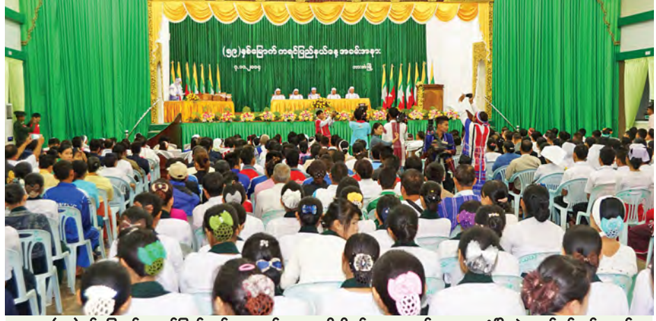
(၅၉)နှစ်မြောက် ကရင်ပြည်နယ်နေ့အခမ်းအနားကို နိုဝင်ဘာ ၇ ရက်က ဘားအံမြို့ ဇွဲတပင်ခန်းမ၌ ကျင်းပ စဉ်။

အနောက်နိုင်ငံများအနက် ကနေဒါနိုင်ငံက ၁၈ ခု၊ အမေရိကန်နိုင်ငံက ၁၅ ခု၊ ဩစတြေးလျက ၁၅ ခုနှင့် နယ်သာလန်နိုင်ငံက ၁၀ ခုရှိပြီး ဗြိတိန် နိုင်ငံတစ်နိုင်ငံတည်းသာ ကုမ္ပဏီ ၇၅ ခုရှိသည်ဟု ဆိုထားသည်။ ထို့အပြင် ဂျပန်နိုင်ငံမှ ကုမ္ပဏီ ၇၅ ခု၊ တောင်ကိုရီးယားနိုင်ငံက ၁၀၀၊ မလေးရှားနိုင်ငံက ကုမ္ပဏီ ၅၀ တို့လည်း မှတ်ပုံတင်ထားကြသည်။ ထို့ကြောင့် လာမည့်ဘတ်ဂျက်နှစ်အစတွင် မြန်မာနိုင်ငံ၏ ပြည်ပရင်းနှီး မြှုပ်နှံမှုပမာဏသည် စုစုပေါင်း အမေရိကန်ဒေါ်လာ ၅ ဘီလီယံအထိရှိမည်ဟု ခန့်မှန်းထားကြသည်။ ယင်းကဲ့သို့ ပြည်ပရင်းနှီးမြှုပ်နှံမှုများ မြင့်မားတိုးတက်လာခြင်းနှင့်အတူ ဒေသတွင်းနိုင်ငံများအတွင်း မျှတသည့် စီးပွားရေးဖွံ့ဖြိုးတိုးတက်မှုရရှိ စေရန် ရည်မှန်းချက်ဖြင့် အာဆီယံစီးပွားရေးအသိုက်အဝန်းထူထောင်မှု ကို လာမည့်နှစ်တွင် အကောင်အထည်ဖော်နိုင်ရန် ကြိုးပမ်းဆောင်ရွက် လျက်ရှိသည်။ သို့ဖြစ်ရာ မြန်မာနိုင်ငံတွင် ရင်းနှီးမြှုပ်နှံမှုမြင့်မားတိုးတက်ပြီး နိုင်ငံ ပွံ့ပြိုးတိုးတက်လာစေရန်အတွက် တရားဥပဒေစိုးမိုးပြီး တည်ငြိမ် အေးချမ်းရေးသည် အထူးအရေးကြီးလှပေသည်။ ထို့ကြောင့် မြန်မာ နိုင်ငံသားအားလုံး ပြည်ထောင်စုစိတ်ဓာတ်နှင့် နိုင်ငံပွံ့ပြိုးရေးလုပ်ငန်းစဉ် များတွင် ညီညွတ်ညွတ်ဖြင့် လက်တွဲပူးပေါင်းပါဝင်ဆောင်ရွက်ကြဖို့ တိုက်တွန်းအပ်ပါသည်။