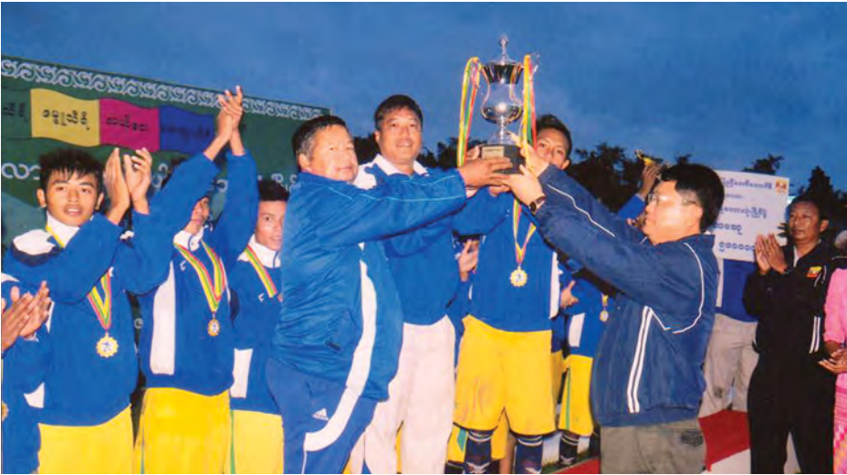
တော်ကောင်စီဝင် ဦးမြင့်ဆွေက ဆု ပေးအပ်ပြီး ပထမရရှိသော ပျဉ်းမနား မြို့နယ်အသင်းအား ဆုပေးပွဲကို ချီးမြှင့်လိုက်ကြောင်း သိရသည်။ (အပေါ်ပုံ)

၂၀၁၄ ခုနှစ် နေပြည်တော်ကောင်စီ ဥက္ကဋ္ဌပလား ချစ်မြို့နယ်ဘောလုံးပြိုင်ပွဲ နောက်ဆုံးပိုလ်လွဲပွဲကို နိုဝင်ဘာ ၅ ရက် ညနေ ၃ နာရီခွဲက ဝဏ္ဏသိဒ္ဓိ လေ့ကျင့်ရေးကွင်း အမှတ်(၃)၌ ကျင်းပရာ ပျဉ်းမနားမြို့နယ် ဘောလုံး အသင်းက တပ်ကုန်းမြို့နယ်ဘောလုံး အသင်းကို သုံးဂိုး-တစ်ဂိုးဖြင့် အနိုင် ရရှိသွားသည်။