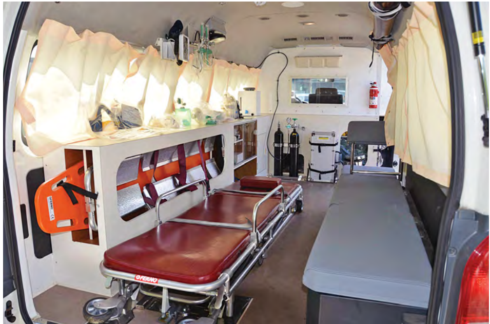
ကျန်းမာရေးစောင့်ရှောက်မှုအတွက် MICC-1 တွင် ထားရှိမည့် ဆေးဝါးအစုံအလင်ပါရှိသော လူနာတင်ယာဉ်ကို တွေ့ရစဉ်။

အားကစားမြှင့်တင် စိတ်လန်းရွှင် ဆန့်ကျင်မှုယစ်ဆေး