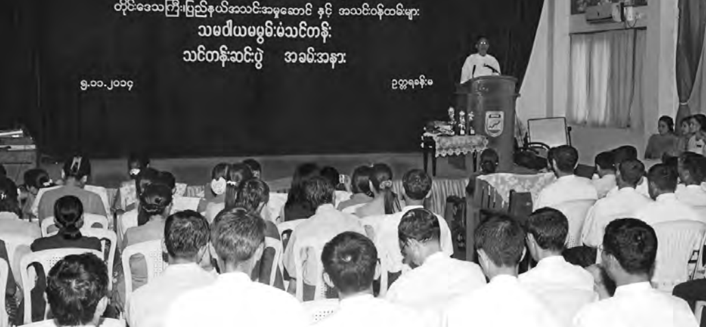
တိုင်းဒေသကြီး၊ ပြည်နယ်အသင်းအမှုဆောင် နှင့် အသင်းဝန်ထမ်းများ သင်တန်းဆင်းပွဲ အခမ်းအနား ၉.၁၁.၂၀၁၄ ၉.၁၁.၂၀၁၄

ရန်ကုန်၊ နိုဝင်ဘာ ၈ - သမဝါယမတက္ကသိုလ်(သန်လျင်) ၌ တိုင်းဒေသကြီး၊ ပြည်နယ် သမဝါယမ အသင်းအမှုဆောင်နှင့် အသင်းဝန်ထမ်းများ မွမ်းမံသင်တန်း (၂/၂၀၁၄) ဆင်းပွဲကို နိုဝင်ဘာ ၅ ရက်က ယင်းတက္ကသိုလ်ခန်းမဆောင်တွင်ကျင်းပခဲ့ကြောင်း သိရသည်။