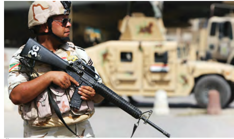
အီရတ်နိုင်ငံတွင် ရောက်ရှိတာဝန်ထမ်းဆောင်နေသော အမေရိကန်တပ်ဖွဲ့ဝင်တစ်ဦးအား တွေ့ရစဉ်။

ဘဂ္ဂဒတ်မြို့တော်ပြင်ပနှင့် အီရတ်နိုင်ငံမြောက်ပိုင်း အိဘီးလ်မြို့များ၌ အကြံပေးရေးနှင့် အထောက်အကူပြုရေး လုပ်ငန်းဌာနနှစ်ခုတည်ထောင်ရန် အမေရိကန်စစ်ဘက်က တည်ထောင်သွားမည်ဟု ပင်တဂွန်၏ ကြေညာချက်တွင် ဖော်ပြသည်။ ဘီဘီစီ။