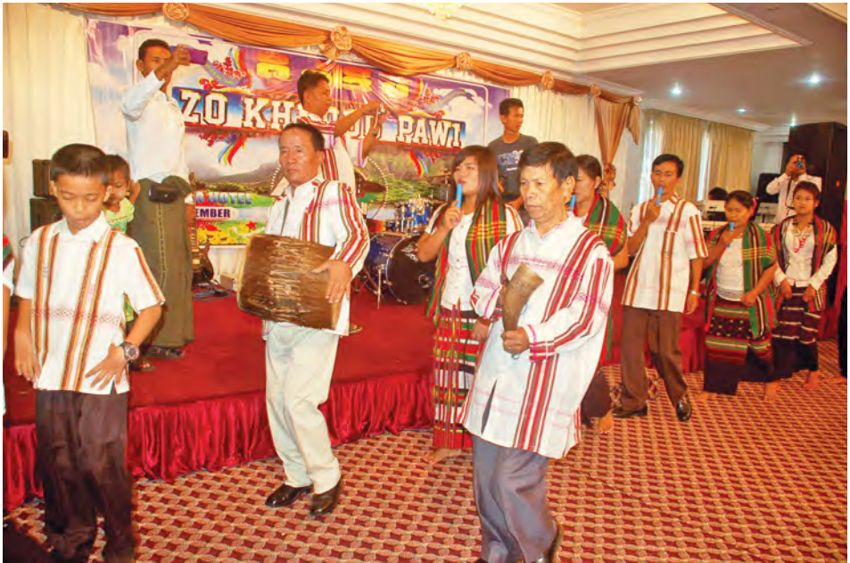
ဇိုလူမျိုးတို့၏ ရိုးရာပွဲတော် ရန်ကုန်၌ ကျင်းပမည့်ကို မြင်တွေ့ရစဉ်။