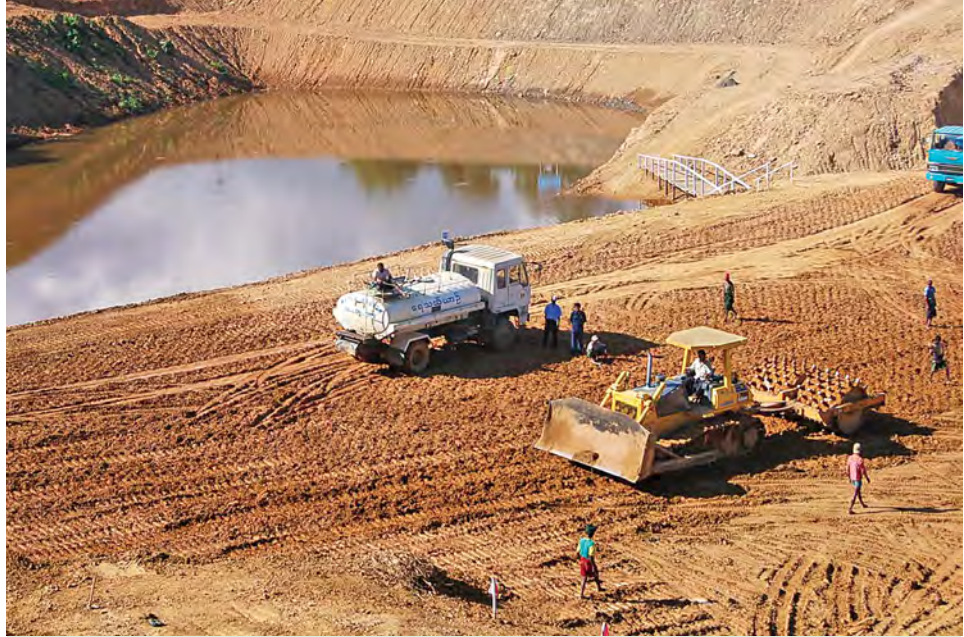
ကျောက်တော်မြို့နယ်ရှိ ရောက်ချောင်းရေလျှောင်တံမံစီမံကိန်းလုပ်ငန်းခွင်အားတွေ့ရစဉ်။

ဆောက်ခြင်းလုပ်ငန်း မြေကြီးလုပ်ငန်းတွင် စုစုပေါင်းလျာထားပမာဏမှာ ၃၉၁၇ ကျင်းရှိပြီး ၃၈၆၀ ကျင်း ဆောင်ရွက်ပြီးစီးပြီဖြစ်၍ ၈၉ ရာခိုင်နှုန်း ဆောင်ရွက်ပြီးစီးပြီဖြစ်ပါကြောင်း။ ရေပိုလွှဲတည်ဆောက်ခြင်းလုပ်ငန်း မြေကြီးလုပ်ငန်းတွင် စုစုပေါင်းလျာထားပမာဏမှာ ၁၇၉၅၈ ကျင်း ရှိပြီး ၁၅၁၀၈ ကျင်း ဆောင်ရွက်ပြီးစီးပြီဖြစ်၍ ၈၄ ရာခိုင်နှုန်း ဆောင်ရွက်ပြီးစီးပြီဖြစ်ပါကြောင်း။ ကွန်ကရစ်လုပ်ငန်းတွင် စုစုပေါင်းလျာထားပမာဏမှာ ၃၀၈ ကျင်းရှိပြီး ၁၄၂ ကျင်း ဆောင်ရွက်ပြီးစီးပြီဖြစ်၍ ၄၆ ရာခိုင်နှုန်း ဆောင်ရွက်ပြီးစီးပြီဖြစ်ကြောင်း။ ယခု ပွင့်လင်းရာသီတွင် လုပ်ငန်းများ ဆက်လက်ဆောင်ရွက်လျက်ရှိပြီး ကျန်ရှိသောလုပ်ငန်းများကို ၂၀၁၅ ခုနှစ် ဇန်နဝါရီလတွင် ပြီးစီးရန် လျာထားဆောင်ရွက်လျက်ရှိကြောင်း ပြောကြားသည်။ သို့ဖြစ်ပါ၍ ရောက်ချောင်း ရေလျှောင်တံမံကို တည်ဆောက်ပေးခြင်းဖြင့် ကျောက်တော်မြို့ရှိ ပြည်သူလူထုအတွက် သောက်သုံးရေကို လုံလောက်စွာ ပေးဝေနိုင်ရုံမျှမကဘဲ နှစ်စဉ်တိုးတက်လာသော ဒေသခံလူဦးရေအတွက် စီးပွားရေး၊ လူမှုရေး၊ ကျန်းမာရေးစသည်ဖြင့် ဘက်စုံဖွံ့ဖြိုးတိုးတက်ရေးကို အထောက်အကူပြုနိုင်မည့် စီမံကိန်းဖြစ်ကြောင်း တင်ပြလိုက်ပါသည်။ ။