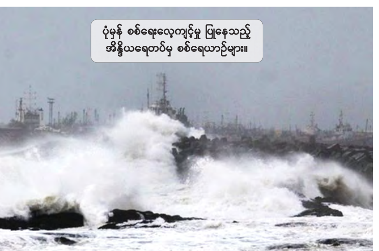
ပုံမှန် စစ်ရေးလေ့ကျင့်မှု ပြုနေသည့် အိန္ဒိယရေတပ်မှ စစ်ရေယာဉ်များ။

အိန္ဒိယရေတပ်၏ ယခုဖြစ်ပွားသော နောက်ဆုံးမတော်တဆမှုမှာ ပုံမှန်ပြုလုပ်နေကျ စစ်ရေးလေ့ကျင့်မှုတော်ပိုဒီပစ်ခတ်မှု လေ့ကျင့်ခန်းလုပ်ဆောင်နေစဉ်အတွင်း အဆိုပါ ရေယာဉ်နစ်မြုပ်သွားခြင်းဖြစ်သည်။ ပီတီအိုင်။