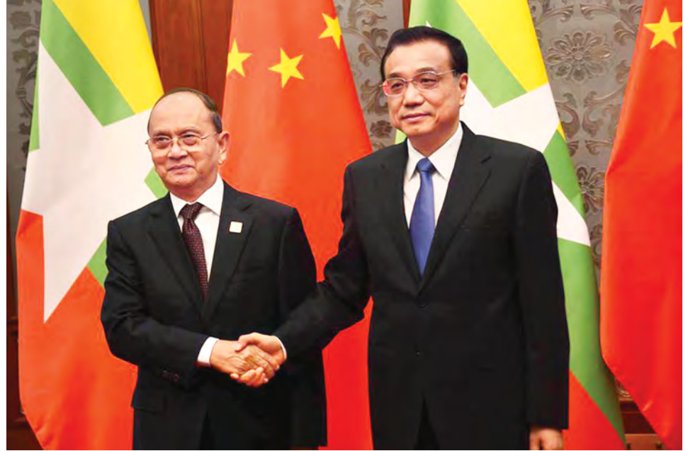
နိုင်ငံတော်သမ္မတ ဦးသိန်းစိန်နှင့် တရုတ်ပြည်သူ့သမ္မတနိုင်ငံ နိုင်ငံတော်ကောင်စီဝင် ဝန်ကြီးချုပ် မစ္စတာ လီခချန်းတို့ ရင်းရင်းနှီးနှီး နှုတ်ဆက်စဉ်။

ပြောင်းလဲရေးကော်မတီ ဒုတိယဥက္ကဋ္ဌ၊ နိုင်ငံတကာ ကုန်သွယ်မှုဆွေးနွေးညှိနှိုင်းမှုနှင့် ကုန်သွယ်ရေးဒုတိယဝန်ကြီးတို့ တက်ရောက်ကြသည်။ နိုင်ငံတော်သမ္မတနှင့် တရုတ်ပြည်သူ့သမ္မတနိုင်ငံ နိုင်ငံတော်ကောင်စီဝင် ဝန်ကြီးချုပ်တို့သည် ယခုနှစ် ဇွန် ၂၈ ရက်ကလည်း ပြည်သူ့ခန်းမဆောင်ကြီး၌ပင် တွေ့ဆုံခဲ့ကြပြီး ဘင်္ဂလားဒေ့ရှ်၊ အိန္ဒိယ၊ မြန်မာ၊ တရုတ်စီးပွားရေးစင်္ကြံ တည်ထောင်နိုင်မည့် အလားအလာများကို ဆွေးနွေးခဲ့ကြကြောင်းနှင့် တရုတ်ဝန်ကြီးချုပ် အနေဖြင့် အာဆီယံထိပ်သီးအစည်းအဝေးနှင့် ဆက်စပ်အစည်းအဝေးများ တက်ရောက်ပြီးပါက မြန်မာနိုင်ငံသို့ တရားဝင်ချစ်ကြည်ရေးခရီး လာရောက်လည်ပတ်မည်ဖြစ်ကြောင်း သိရသည်။