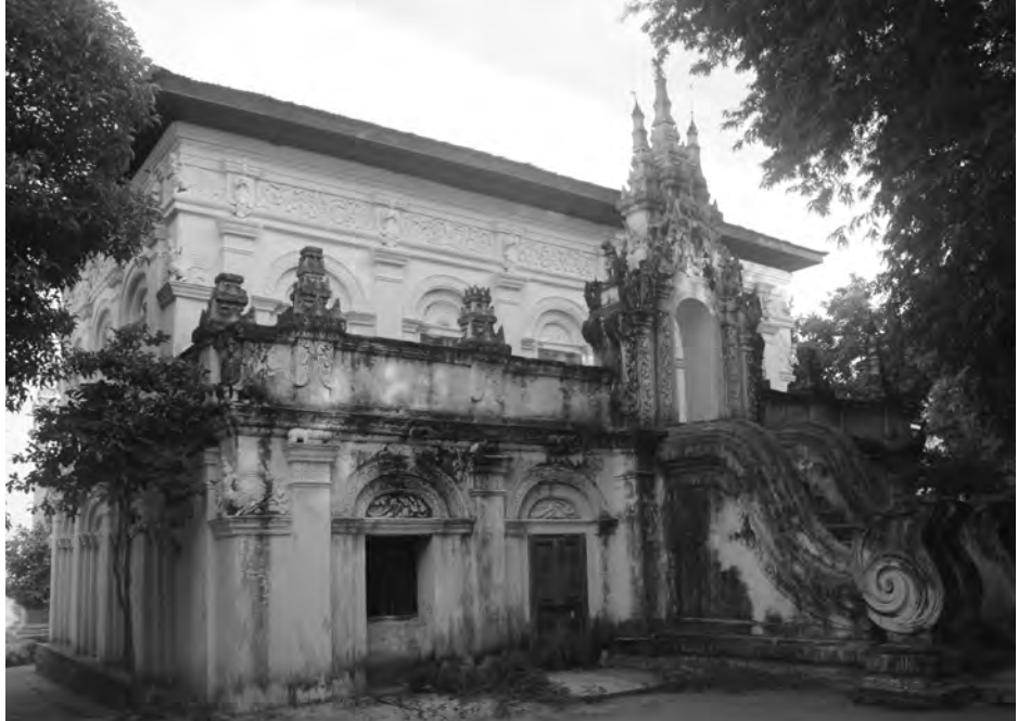
ဒေသကြီးလည်းဖြစ်သည်။ ယင်းအပြင် ရှားပါးမျိုးနွယ်ဝင် သစ်ပင်များနှင့်ဆေးဖက်ဝင်အပင်များ ပေါက်ရောက်ရာဒေသကြီးဖြစ်သည့် အပြင် ရိုင်းမကားတောရကြီးကျောင်းဘေးမဲ့တောတွင် ဘာသာရေးအဆောက်အအုံများ၊ ယဉ်ကျေးမှု အမွေအနှစ်များနှင့် သမိုင်းအမွေအနှစ်များကိုလည်း လေ့လာတွေ့ရှိနိုင်သည်။ မင်းကွန်းဆရာတော်ဘုရားကြီး၏ လမ်းညွှန်မှုဖြင့် တည်ထားကိုးကွယ်သော ရာပြည့်ဘုရားကို ဘေးမဲ့တောအတွင်း ဖူးတွေ့နိုင်သည်။ မြန်မာနိုင်ငံအပူပိုင်းဒေသရှိ သစ်ပင်နှင့် သဘာဝအရင်းအမြစ်များသာမက ဒေသန္တရ ဗဟုသုတများကို ရှာဖွေလေ့လာသုတေသနပြုနိုင်သော ဒေသဖြစ်ပြီး ထိန်းသိမ်းစောင့်ရှောက်သင့်သော သက်ရှိသက်မွေအရင်းအမြစ်များအား လေ့လာရင်း ရိုင်းမကားတောရကြီးကျောင်းဘေးမဲ့တော၏ အရှေ့ဘက်မှစီးဆင်းနေသော ဧရာဝတီမြစ်အလှကို ခံစားကြည့်ရှုနိုင်ပါသည်။

ရိုင်းမကားတောရကြီးကျောင်းဘေးမဲ့တောအတွင်း အမဲလိုက်ခြင်းများကြောင့် သမင်ကောင်ရေများစွာနှင့် သက်ရှိအရင်းအမြစ်များစွာ ဆုံးရှုံးလျော့ကျခဲ့ရခြင်း၊ သို့မဟုတ် သတ္တဝါများကို စားကျက်ချခြင်းတို့ကြောင့် ဘေးမဲ့တောမှ သစ်ပင်များစွာ ဆုံးရှုံးမှုများ ကြုံတွေ့ခဲ့ရခြင်းနှင့် အဓိကလောင်စာအရင်းအမြစ်ဖြစ်သော ထင်းလောင်စာအတွက် သစ်တော၊ သစ်ပင်များကို ခုတ်ယူကြခြင်းတို့ကြောင့် ဘေးမဲ့တော၏ ၃၀ ရာခိုင်နှုန်းခန့် ပြုန်းတီးခဲ့ရသည်။ ၂၀၀၉ ခုနှစ်မှစတင်၍ ရိုင်းမကားတောရကြီးကျောင်းဘေးမဲ့တောအတွင်းသားငှက်တိရစ္ဆာန်များ ထိန်းသိမ်းစောင့်ရှောက်ခြင်း၊ အပူပိုင်းဒေသပေါက် သဘာဝသစ်တောသစ်ပင်များ ပြန်လည်စိုက်ပျိုးခြင်း၊ သဘာဝသစ်တောနှင့် သားငှက်တိရစ္ဆာန်များ မျိုးသုဉ်းပျောက်ကွယ်ခြင်းမှ ကာကွယ်ခြင်း၊ သစ်တောပြန်လည်ပြုစု ပျိုးထောင်ခြင်း၊ ပညာပေးလုပ်ငန်းများဆောင်ရွက်ခြင်းများကို သက်ဆိုင်ရာအဖွဲ့အစည်းများ၊ ဒေသခံများနှင့် ပူးပေါင်းဆောင်ရွက်လျက်ရှိကြောင်း သိရသည်။ ရိုင်းမကားတောရကြီးကျောင်းဘေးမဲ့တောသည် မြန်မာနိုင်ငံအလယ်ပိုင်းဒေသတွင်တည်ရှိပြီး အပူပိုင်းဒေသ ပေါက်ပင်များ ထိန်းသိမ်းထားသောဘေးမဲ့တောကြီးဖြစ်သောကြောင့် ပတ်ဝန်းကျင် ရာသီဥတု၊ ဒေသခံများနှင့် သားငှက်တိရစ္ဆာန်များ အားထားရာဒေသကြီးဖြစ်သည်။ ဘေးမဲ့တောအတွင်း အသားစား သတ္တဝါများ၊ နို့တိုက်သတ္တဝါများ၊ တွားသွားသတ္တဝါများနှင့် ရာသီအလိုက် ရွှေ့ပြောင်းတတ်သောငှက်များကို တွေ့ရှိနိုင်သည်။ အချို့မှာ အပြည်ပြည်ဆိုင်ရာထိန်းသိမ်းမှုအဆင့် အဖြစ်သတ်မှတ်ခြင်းခံရပြီး မျိုးပြုန်းမည်အန္တရာယ်နှင့် ရင်ဆိုင်ကြုံတွေ့နေရသောသတ္တဝါဖြစ်သည့် နိုင်ငံဂုဏ်ဆောင် မြန်မာဌာနေဖွား ရွှေသမင်များ ကျက်စားပျော်မွေ့ရာ