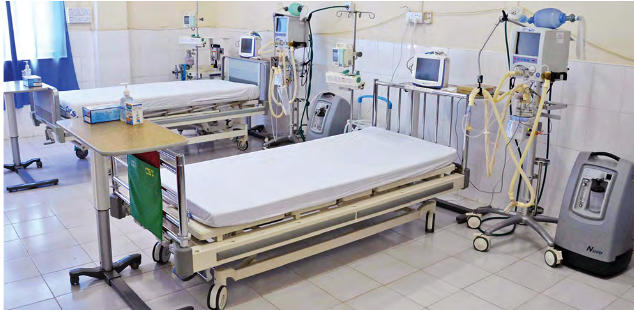
နေပြည်တော် ခုတင်(၁၀၀၀) အထွေထွေရောဂါကုဆေးရုံ အထူးကြပ်မတ်ကုသဆောင်တွင် ပြင်ဆင်ထားပုံကို တွေ့ရစဉ်။

တွေ့ဆုံမေးမြန်း-ဟန်နီဝင်း ကျန်းမာရေးဝန်ဆောင်မှုများအတွက် စီစဉ်ဆောင်ရွက်မှုများကို မြန်မာ့ သတင်းစဉ်(သတင်းအဖွဲ့)က နေပြည်တော်ရှိ ခုတင်(၁၀၀၀)ဆုံ အထွေထွေ ရောဂါကုဆေးရုံမှ တာဝန်ရှိဆရာဝန်ကြီးများအား သွားရောက်မေးမြန်းခဲ့ ပါသည်။ စာမျက်နှာ ၉ ကော်လံ ၁ သို့