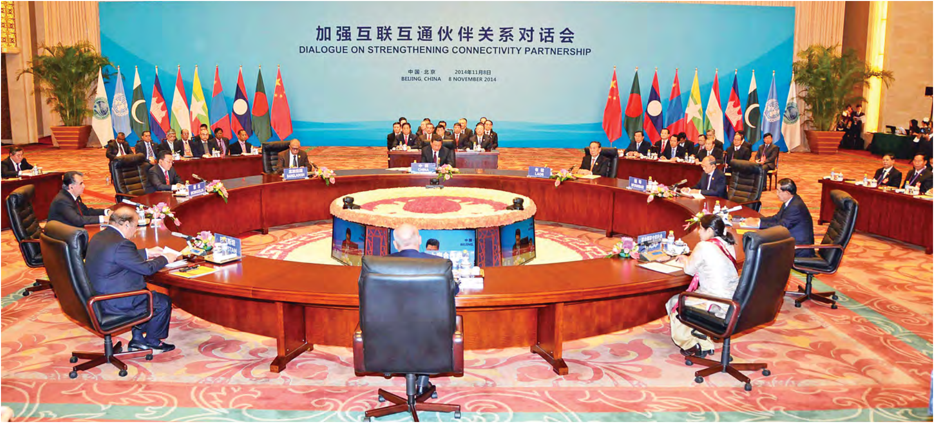
တရုတ်ပြည်သူ့သမ္မတနိုင်ငံ ပေကျင်းမြို့ ကျောက်ယုထိုင် နိုင်ငံတော်ဧည့်ခံရဟော မြေညီထပ်ရှိ ဖန်းဟွာယွမ်ဧည့်ခံရဟော၌ ဒေသတွင်းစီးပွားရေးပူးပေါင်းဆောင်ရွက်ရေးဆွေးနွေးပွဲ ကျင်းပစဉ်။ (သတင်းစဉ်)