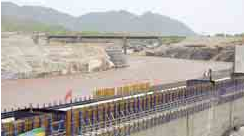
အီဂျစ်နိုင်ငံ နိုင်းမြစ်အတွင်း ဆည်တစ်ခုတည်ဆောက်မှုကို တွေ့ရစဉ်။