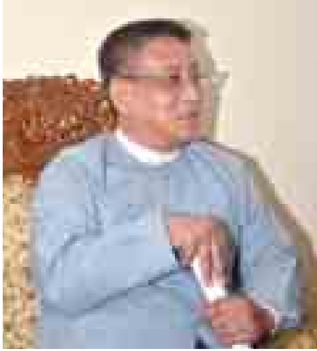
ပညာရေးဝန်ကြီးဌာန အဆင့်မြင့်ပညာဦးစီးဌာန (အောက်မြန်မာပြည်) ညွှန်ကြားရေးမှုချုပ် ဦးဇော်ဌေး။

ထို့ပြင် တက္ကသိုလ်သည် ပြည်သူများအတွက် ပညာရှာမှီးသည့် နေရာသာမက ဘာသာရပ်ဂွာန အသီးသီး၏ သုတေသနလုပ်ငန်းများသည်လည်း ပြည်သူနှင့် နိုင်ငံတော်အတွက် ဖြစ်ရမည်ဟူသော ဆောင်ပုဒ်နှင့်အညီ ဆောင်ရွက်နေခြင်းဖြစ်ရာ ရန်ကုန်တက္ကသိုလ်နှင့်ပတ်သက်၍ ပညာရေးဝန်ကြီးဌာန အဆင့်မြင့်ပညာဦးစီးဌာန(အောက်မြန်မာပြည်) ညွှန်ကြား ရေးမှုချုပ် ဦးဇော်ဌေး၏ ပြောကြားချက်များကို ပြန်လည်ဖော်ပြလိုက်ပါသည်။