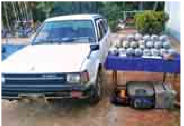
ပိုင်ရှင်မဲ့သိမ်းဆည်းရမိ ဘိန်းစိမ်းများအား တွေ့မြင်ရစဉ်။