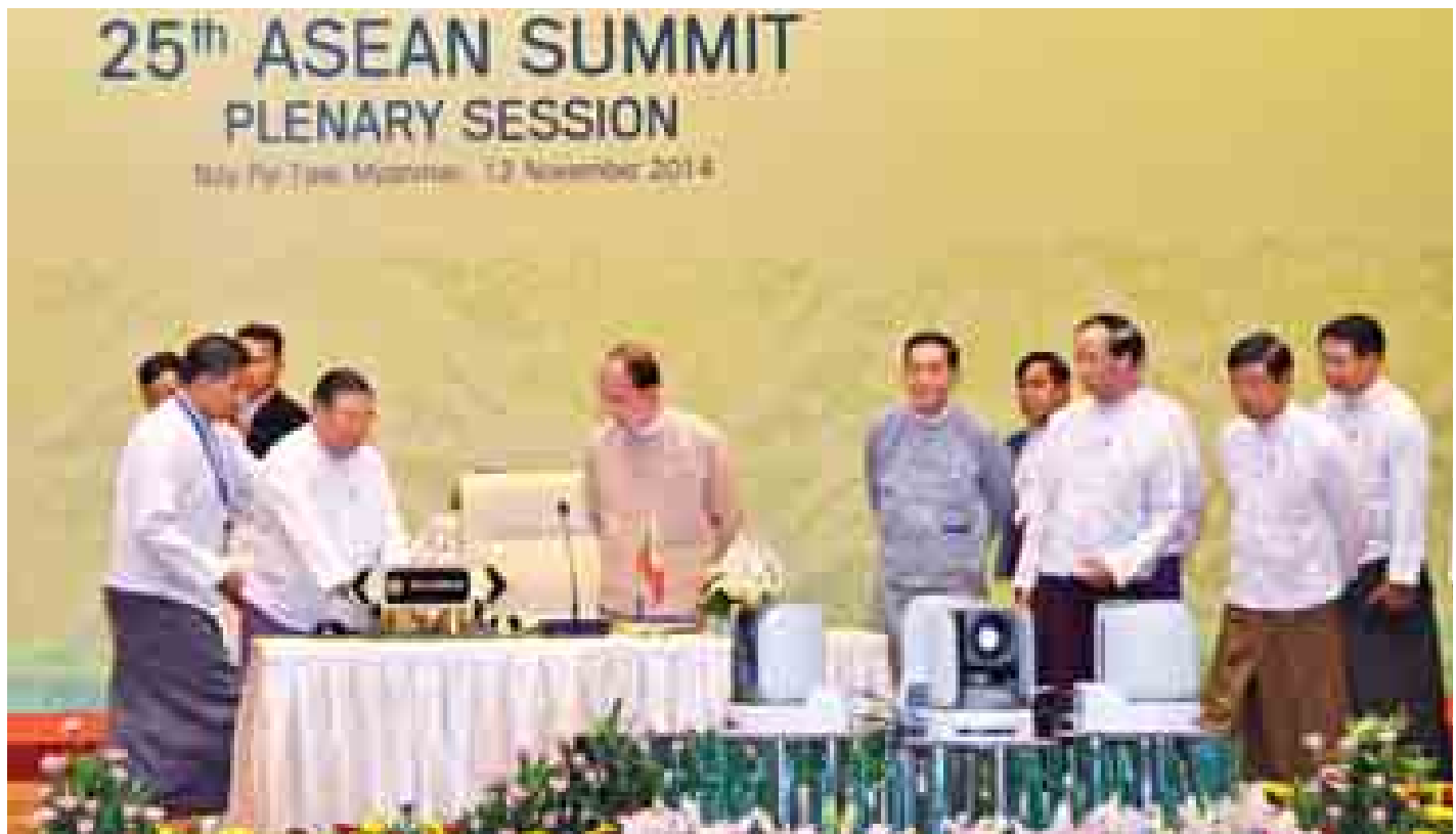
နိုင်ငံတော်သမ္မတ ဦးသိန်းစိန် (၂၅)ကြိမ်မြောက် အာဆီယံထိပ်သီးအစည်းအဝေးနှင့် ဆက်စပ်အစည်းအဝေးများ ကျင်းပနိုင်ရေး ကြိုတင်ပြင်ဆင်ထားရှိမှုအား ကြည့်ရှု စစ်ဆေးစဉ်။