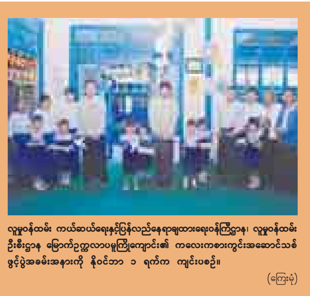
လူမှုဝန်ထမ်း ကယ်ဆယ်ရေးနှင့်ပြန်လည်နေရာချထားရေးဝန်ကြီးဌာန၊ လူမှုဝန်ထမ်း ဦးစီးဌာန မြောက်ဥက္ကလာပုကြီးကျောင်း၏ ကလေးကစားကွင်းအဆောင်သစ် ဖွင့်ပွဲအခမ်းအနားကို နိုဝင်ဘာ ၁ ရက်က ကျင်းပစဉ်။

တက္ကသိုလ်တွေမှာ လေ့လာသင်ယူတဲ့အခါ ဘာသာရပ်တိုင်းအတွက် အင်္ဂလိပ်စာအသုံးပြုလေ့လာရတာကြောင့် နိုင်ငံတကာကျောင်းတွေနဲ့ ဆက် သွယ်တဲ့အခါမှာလည်း အင်္ဂလိပ်လို အသုံးပြုရတဲ့အတွက် တက္ကသိုလ်တွေမှာ ပြိုင်ပွဲတွေပြုလုပ်ပေးပြီး ဆရာ ဆရာမတွေကိုလည်း အင်္ဂလိပ်စာသင်တန်းတွေ ပေးနေပါတယ်။