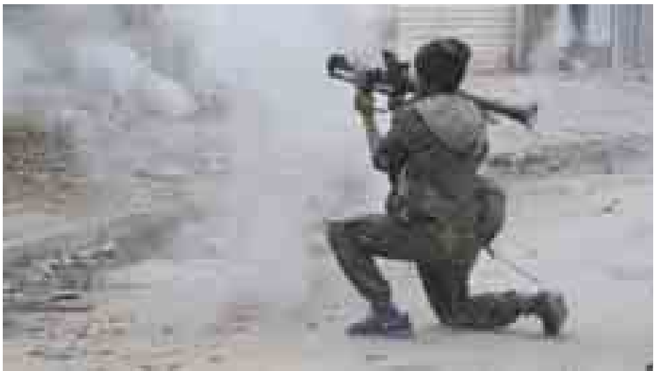
ဘင်ဂါဇီမြို့၌ လစ်ဗျားအစိုးရတပ်ဖွဲ့နှင့် စစ်သွေးကြွအဖွဲ့များအကြား တိုက်ခိုက်မှုများကို တွေ့ရစဉ်။