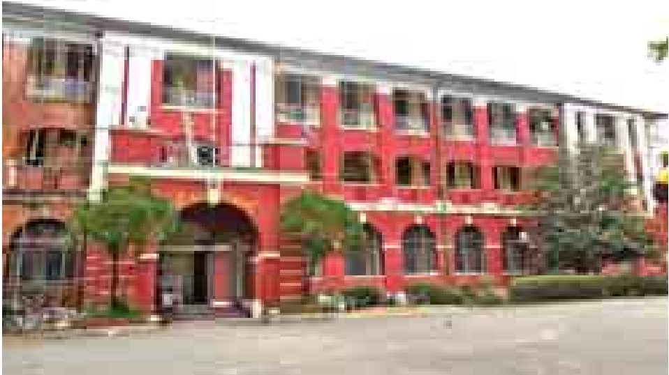
ရန်ကုန်တက္ကသိုလ် ပင်းယဆောင် ပြုပြင်နေမှုကို တွေ့ရစဉ်။

သင်ကြားမှုကတစ်ဆင့် concept ကိုရရှိပြီး ပြန် အသုံးပြုတဲ့ဘက်ကို သွားတာမျိုးဖြစ်လို့ ကျောင်းသား ကိုယ်တိုင်ကလည်း လေ့လာဖို့လိုအပ်လာပါတယ်။ အဲဒီအတွက် အင်တာနက်တို့ စာကြည့်တိုက်တို့ လိုအပ်ပြီးတော့ ပြီးပြည့်စုံ အောင်ဖန်တီးပေးရမယ်။ အဲဒါကလည်း ပြုပြင်ပြောင်းလဲမှု