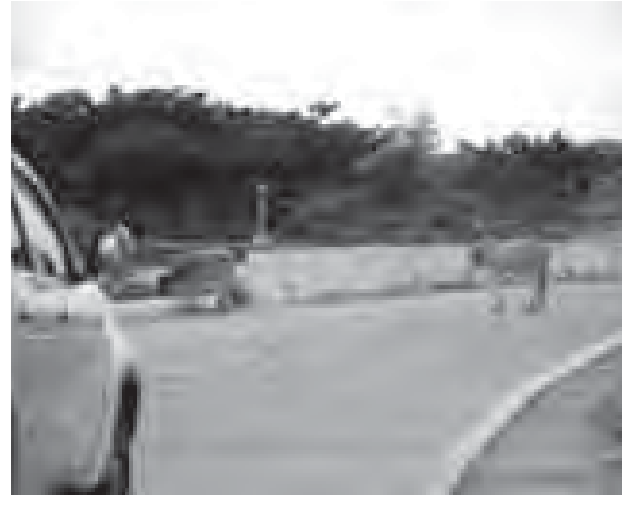
ကိုလွင်(ဆွာ)

ပဲခူးတိုင်းဒေသကြီး ရေတာရှည်မြို့နယ် သစ်တောကြီးပိုင်းဒေသများကို ဖြတ်သန်းသွားသည့် ရန်ကုန်-မန္တလေးလမ်းပိုင်းတွင် မကြာခဏဆိုသလို လွတ်ကျောင်းထားသော နွားအုပ်များကြောင့် ယာဉ်အန္တရာယ် စိုးရိမ်နေရသည်ကို မြင်တွေ့ခဲ့ရသည်။ နိုဝင်ဘာ ၂ ရက် ညနေပိုင်းက ဆွာချောင်းတံတားမြောက်ဘက် အမြန်လမ်း မိုင်တိုင်အမှတ် (၁၆၇/၀) အနီး၌ ယာဉ်အသွားအလာရှုပ်ထွေးနေချိန် နွားများဖြတ်သန်းနေသည့်အတွက် ယာဉ်များကရပ်တန့်ပေးခဲ့ရသည်။