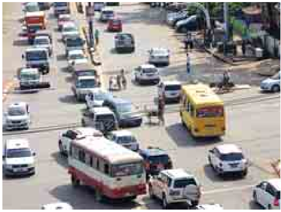
အောက်တိုဘာ ၃၀ ရက်က ရန်ကုန်မြို့ တာမွေမြို့နယ်၌ ယာဉ်များ သွားလာနေမှုကို တွေ့ရစဉ်။ (သတင်းစဉ်)