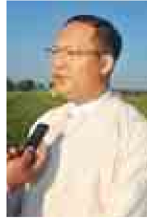
ဦးဇော်စိုင်းတောင် (နယူးဇီလန်ကုမ္ပဏီ)

ခေတ်မီနည်းတွေနဲ့စိုက်ပျိုး၊ ထုတ်လုပ် ပြီး ဥရောပနိုင်ငံအပါအဝင် ကမ္ဘာ့ ဈေးကွက်ကို အသီးအနှံတွေနဲ့ ဟင်းသီး ဟင်းရွက်တွေ တင်ပို့ရောင်းချနေတဲ့ ထိပ်တန်းနိုင်ငံတစ်နိုင်ငံဖြစ်ပါတယ်။