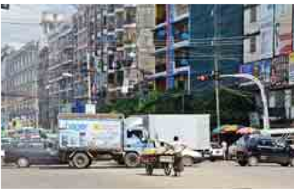
အောက်တိုဘာ ၃၀ ရက်က ရန်ကုန်မြို့ စက်ရုံလမ်းနှင့် ဗညားဒလလမ်း မင်္ဂလာတောင်ညွန့်ဘက်သို့ ဖော်တော်ယာဉ် များ ပိတ်ဆို့နေမှုကို တွေ့ရစဉ်။