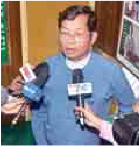
ဦးမြင့်လှိုင် (ပြည်ထောင်စု ဝန်ကြီးလယ်ယာ စိုက်ပျိုးရေးနှင့် ဆည်မြောင်း ဝန်ကြီးဌာန)

တောင် သူလယ် သမားတွေကို လက်မှုလယ်ယာကနေ စက်မှုလယ် ယာစနစ် ကူးပြောင်းနိုင်ဖို့အတွက် ကိုရီးယားနိုင်ငံက လယ်ထွန်စက်တွေ ကို သက်သာတဲ့ဈေးနှုန်းနဲ့ ဝယ်ယူ တင်သွင်းခွင့် ရရှိခဲ့ပါတယ်။ အဲဒီ လယ်ထွန်စက်တွေကို တောင်သူ