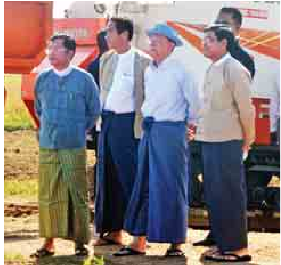
နိုင်ငံတော်သမ္မတ ဦးသိန်းစိန် ခေတ်မီရိတ်သိမ်းခြွေလှေ့စက်ဖြင့် မိုးစပါးရိတ်သိမ်းနေမှုအား ကြည့်ရှုစဉ်။

အလျင်လိုကျေးရွာမှ တောင်သူလယ်သမားများအား ရင်းရင်းနှီးနှီးတွေ့ဆုံ၍ နှုတ်ဆက်အားပေးစကားပြောကြားခဲ့သည်။ ယင်းနောက် ဒုတိယသမ္မတ ဦးဉာဏ်ထွန်းသည် ပုလဲသွယ်စပ်မျိုးစပါး မိုးစပါးစိုက်ကွင်းများနှင့် မျိုးစေ့ထုတ်စိုက်ခင်းဝတ်မှုန်ကူးပွဲတော်အား ကြည့်ရှုအားပေးသည်။ ဆက်လက်၍ ရှင်းလင်းဆောင်ခန်းမ၌ ဒုတိယသမ္မတ ဦးဉာဏ်ထွန်းအား လယ်ယာစိုက်ပျိုးရေးကဏ္ဍဆိုင်ရာလုပ်ငန်းစဉ်များ အကောင်အထည်ဖော်နေမှုနှင့် ပတ်သက်၍ လယ်ယာစိုက်ပျိုးရေးနှင့် ဆည်မြောင်းဝန်ကြီးဌာန ပြည်ထောင်စုဝန်ကြီး ဦးမြင့်လှိုင်က ရှင်းလင်းတင်ပြသည်။ ပြည်ထောင်စုဝန်ကြီးက ရှင်းလင်းတင်ပြရာတွင် တစ်နိုင်ငံလုံး၏ စိုက်ပျိုးစေ ပမာဏနှင့်နှိုင်းယှဉ်တွက်ချက်ပါက ယနေ့အထိ ဆောင်ရွက်နိုင်မှုမာဏသည် နည်းနေသေးသော်လည်း တိုင်းဒေသကြီးနှင့်ပြည်နယ်အလိုက် ဟန်ချက်ညီစွာ အရှိန်အဟုန်မြှင့်ကြိုးပမ်းဆောင်ရွက်နိုင်ကြမည်ဆိုလျှင် တောင်သူလယ်သမားများအတွက် ဝင်ငွေနှစ်ဆ တိုးတက်လာစေပြီး ဆင်းရဲနွမ်းပါးမှုကို ထိထိရောက်ရောက် လျှော့ချနိုင်မည်ဖြစ်ကြောင်း ထည့်သွင်းတင်ပြခဲ့သည်။ ထို့နောက် စိုက်ပျိုးရေးဦးစီးဌာန ညွှန်ကြားရေးမှူးချုပ်က စာမျက်နှာ ၃ ကော်လံ ၁ သို့ ❖