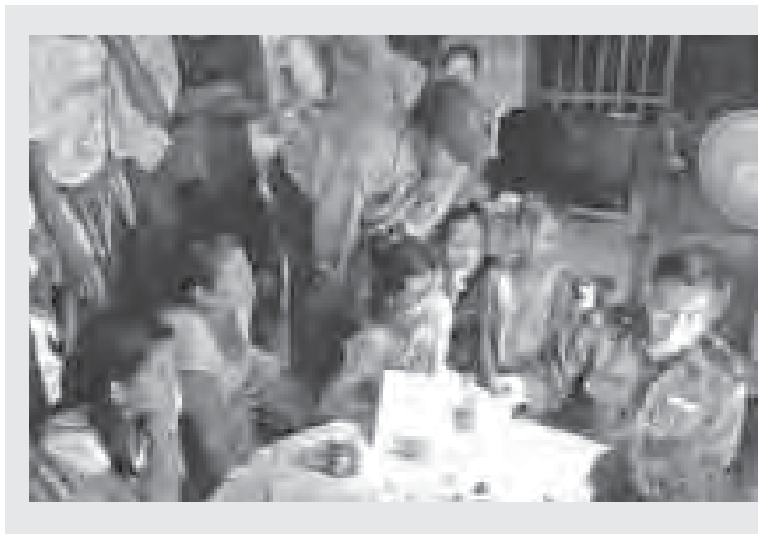
ရန်ကင်းတိုင်းဒေသကြီး၊ တောင်ပိုင်းခရိုင်၊ တွံတေးမြို့နယ်အတွင်း ဆိုးဘိုအရှေ့နှင့် ကျွန်တော်ရပ်ကွက်ရှိ အထက်တန်းကျောင်း(ခွဲ) တို့၌ အောက်တိုဘာ ၂၀ ရက်မှ ၃၁ ရက် အထိ မြို့နယ်လူဝင်မှုကြီးကြပ်ရေးနှင့် အမျိုးသားမှတ်ပုံတင်ဦးစီးဌာန၊ မြို့နယ်ဦးစီးမှူးဦးစော်မြင့်နှင့် ဝန်ထမ်းများက လုပ်သားပြည်သူ ၁၉၇ ဦး၊ ကျောင်းသား၊ကျောင်းသူ ၂၁၂ ဦး တို့အား နိုင်ငံသားစိစစ်ရေးကတ်ပြားများ အခမဲ့ကွင်းဆင်းဆောင်ရွက်ပေးခဲ့ကြောင်း သိရသည်။

မဟုတ်ပါ။ ယဉ်ကျေးမှု မျိုးစုံထွန်းကားခဲ့ပြီး ခေတ်အဆက်ဆက် အင်ပါယာများကို ထူ ထောင်နိုင်ခဲ့သူများ ဖြစ်ပါသည်။ ပုဂံ၊ ပင်းယ၊ အင်းဝ၊ ကေတုမတီ၊ ဟံသာဝတီ၊ ကုန်းဘောင် စသည့် အင်ပါယာများကို ထူထောင်ခဲ့ကြပြီး အရှေ့တောင်အာရှအတွင်း ဩဇာသက် ရောက်ခဲ့သည့်နိုင်ငံဖြစ်ပါသည်။ ဆန်ထုတ် လုပ်ပြီး ဒေသဆိုင်ရာ စားနပ်ရိက္ခာဖူလုံမှု အတွက် အဓိကဆန်အိုးအဖြစ် ရပ်တည်ခဲ့ သည့်နိုင်ငံဖြစ်ပါသည်။ မလေးရှား နိုင်ငံသား ပညာရှင်တစ်ဦးက တစ်ချိန်က မြန်မာနိုင်ငံမှ ရန်ကင်းဆန်သည် မလေးရှားတွင် ကျော်ကြား သည့် ဆန်တစ်ခုဖြစ်ကြောင်းပြောကြားခဲ့ဖူး သည် ကိုလည်း အမှတ်ရမိပါသည်။ ၁၉၆၀- ၁၉၇၀ ပြည့်နှစ်များကလည်း ဂျက်နီဖာတင် လေး၊ မိတုန်းနော် စသည့် မြန်မာအားကစား သမားများသည် အရှေ့တောင်အာရှဒေသ တွင်သာမက အာရှဒေသတွင်းမှာပါ ထင်ရှား ကျော်ကြားခဲ့ကြဖူးပါသည်။ အမိတက္ကသိုလ်ကို ခေတ္တပြန်ရောက်ရင်း အမိတက္ကသိုလ်အနေဖြင့် အတိတ်ကတိုး တက် ထွန်းကားခဲ့သည့် အနေအထားကို ပြန် လည်ရောက်ရှိပါစေ၊ အာဆီယံဒေသအတွင်း အထင်ကရ တက္ကသိုလ်ကြီးတစ်ရပ်အဖြစ် ဖြစ်ပေါ်ရပ်တည်နိုင်ပါစေ၊ စီးပွားရေးတက္က သိုလ်အနေဖြင့် အခွန်ရှည်တိုးတက်ထွန်းကား ပါစေဟု ရန်ကင်းစီးပွားရေးတက္ကသိုလ် ထူ ထောင်သည့် နှစ် ၅၀မြောက် အခါသမယ တွင် ဆုတောင်းမိပါသည်။