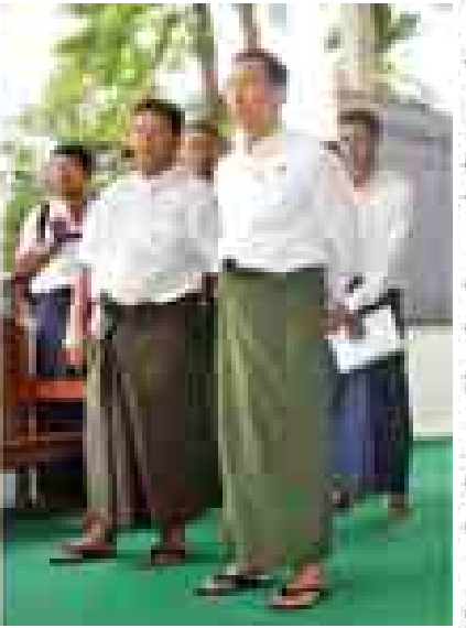
ပြည်ထောင်စုလွှတ်တော်နာယက ပြည်သူ့လွှတ်တော်ဥက္ကဋ္ဌ သူရဦးရွှေမန်း ပြူးမြို့နယ်ခန်းမတည်ဆောက်မည့် မြေနေရာကို ကြည့်ရှုစဉ်။ (သတင်းစဉ်)