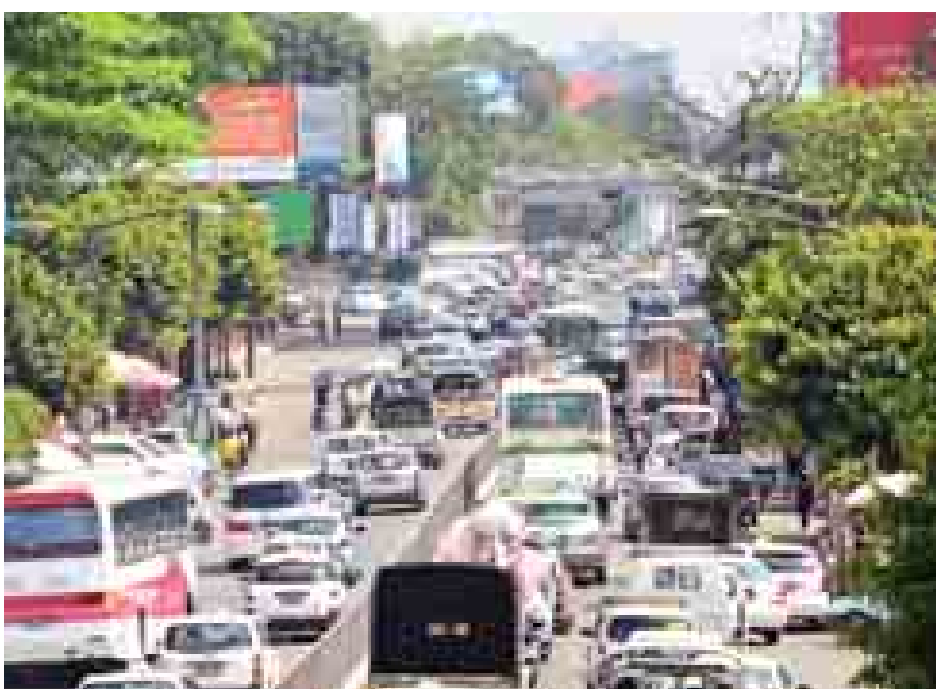
အောက်တိုဘာ ၃၀ ရက်က ရန်ကုန်မြို့ ဗိုလ်ချုပ်အောင်ဆန်းလမ်းပေါ်၌ ယာဉ်များပိတ်ဆို့နေသည်ကို တွေ့ရစဉ်။ (သတင်းစဉ်)