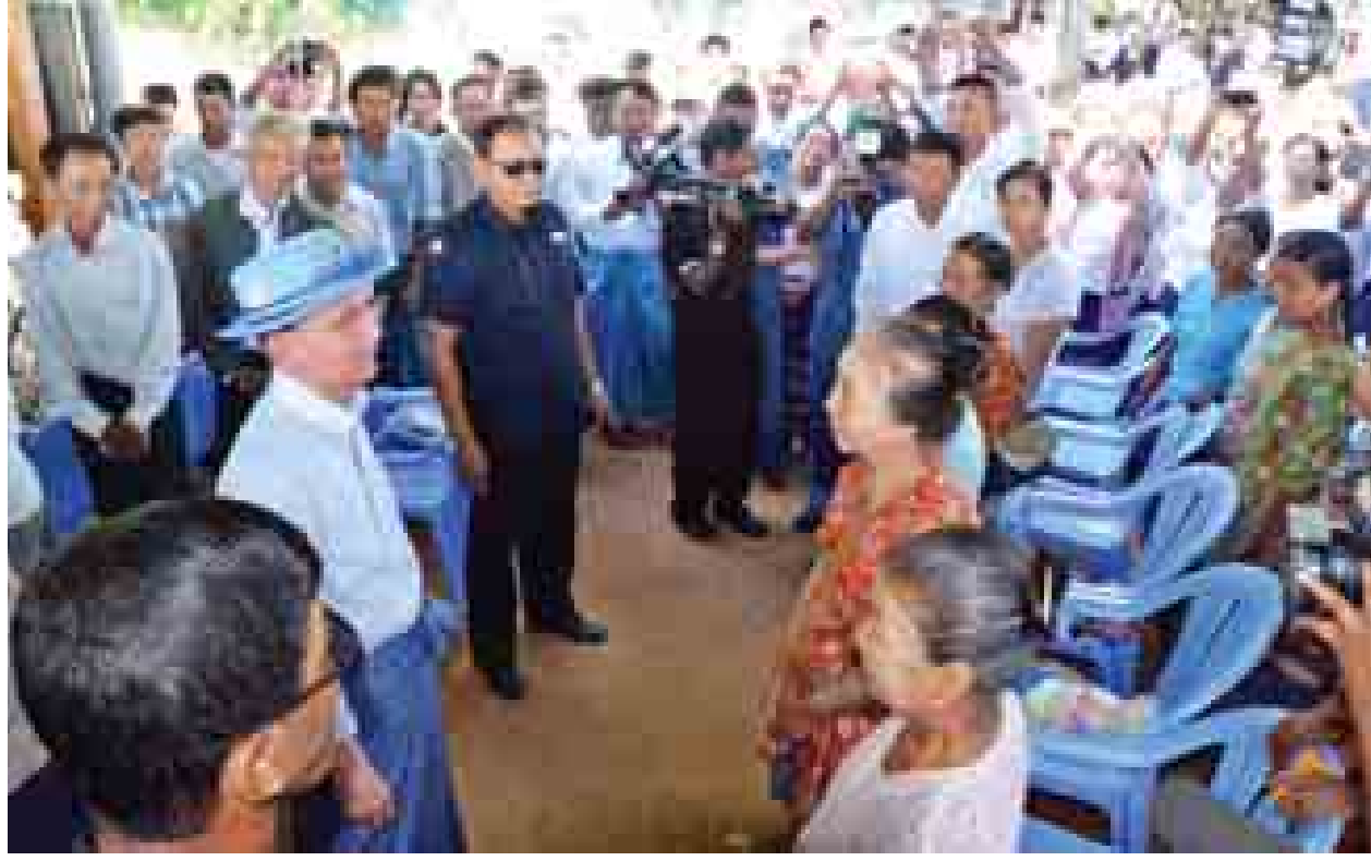
နိုင်ငံတော်သမ္မတ ဦးသိန်းစိန် အလျင်လိုကေးရွာမှ တောင်သူလယ်သမား များအား ရင်းရင်းနှီးနှီး တွေ့ဆုံ၍ နှုတ်ဆက်အားပေးစကားပြောကြားစဉ်။ (သတင်းစဉ်)

အခမ်းအနားအပြီးတွင် ဒုတိယသမ္မတက တက်ရောက်လာသည့် တောင်သူလယ်သမားများအား ရင်းရင်းနှီးနှီး နှုတ်ဆက်အားပေးစကားပြောကြားပြီး ခင်းကျင်းပြသထားသည့် မျိုးစေ့နှင့် သစ်သီးဝလံများ၊ မျိုးစေ့ သန့်စင်စက်ဖြင့် စပါးမျိုးစေ့သန့်စင်နေမှုတို့ကို ကြည့်ရှုအားပေးခဲ့သည်။ (သတင်းစဉ်)