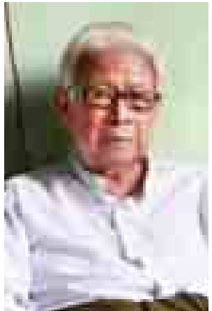
ဆရာကြီး ဦးရဲဒွေး (အမျိုးသားစာပေဆု)

၁၉၇၅ မှာ မြန်မာ-အင်္ဂလိပ်ဘာသာ များနဲ့ သဘင်နဲ့ရုပ်သေးအကြောင်း ဆောင်းပါးရေးဖြစ်ခဲ့တယ်။ ၂၀၁၂ ခုနှစ်မှာ မြန်မာ့ရိုးရာသဘင် အနုပညာရပ်များ စာအုပ်နဲ့ ဆုရခဲ့ တယ်။ ၂၀၁၁ မှာ စာပေဗိမာန် စာမူ ဆုကို Marionettes of Myanmar စာအုပ်နဲ့ ဆုရခဲ့တယ်။ အခုနှစ်ဆုရ ခဲ့တဲ့ စာအုပ်က ၂၀၁၃ ခုနှစ်မှာ Staries From the Myanmar Classical Theatre စာအုပ်နဲ့ဆု ရရှိခဲ့ပါတယ်။ ၁၉၇၅ ခုနှစ်လောက်မှာ စာရေးပါတယ်။ အင်းဝခေတ်မှာ မြန်မာရုပ်သေးသဘင် စတင်ထွန်း ကားလာတယ်လို့ လေ့လာသိရှိရပါ တယ်။ ရာမနဲ့လက္ခဏာ အီနောင်ဇာတ် လိုမျိုးကို တိုက်ရိုက်ပုံမကူးဘဲ ကိုယ့် နည်းကိုယ့်ဟန်နဲ့ မြန်မာမူပြုနိုင်ခဲ့ တယ်။ နှစ်ပေါင်းများစွာ ရုပ်သေးတည် ထောင်ကပြခဲ့တဲ့ အတွေ့အကြုံတွေက အခုစာမူဆုရဖို့အတွက် အထောက် အကူပြုခဲ့ပါတယ်။ အခုလက်ရှိ Myanmar Dance and Drama စာအုပ်ရေးသားပြီးပါပြီ။ ထုတ်ဝေ တော့မှာဖြစ်ပါတယ်။ ယခင်ဝန်ကြီးရဲ့ စကားကို သတိသွားရပါတယ်။ မြန်မာ