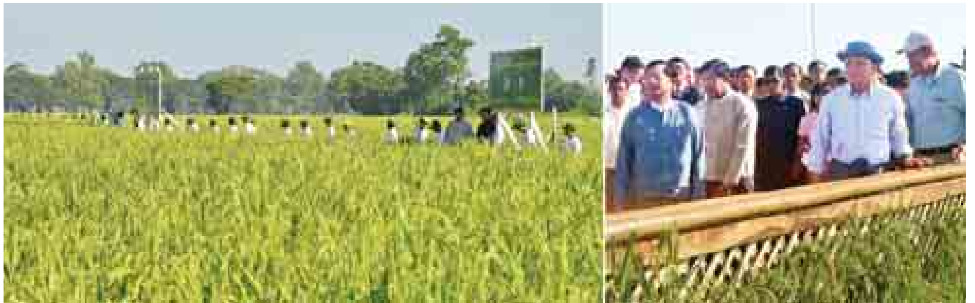
နိုင်ငံတော်သမ္မတ ဦးသိန်းစိန် ပုလဲသွယ်စပ်မျိုးစပါး စက ၁၀၀ မျိုးစေ့ထုတ်စိုက်ခင်း ဝတ်မှုန်ကူးပွဲတော်အား ကြည့်ရှုအားပေးစဉ်။