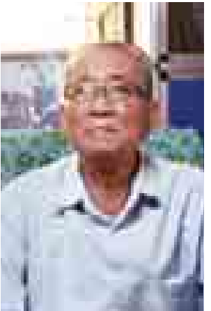
စာရေးဆရာ တိမ်ဦး (အမျိုးသားစာပေဆု)

၁၉၆၅ ကနေ ၁၉၇၄ အထိ ရုပ်သေးတည်ထောင်ခဲ့ပြီး ထူးထူး ခြားခြား တီထွင်ဆန်းသစ်နိုင်ခဲ့ပါ တယ်။ နေရာဒေသ အစုံရောက်ခဲ့ တယ်။ ၁၉၇၄ ခုနှစ်မှာ ရပ်နားခဲ့ပြီး