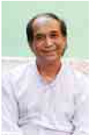
စာရေးဆရာကြီးနိုင်ဇော် (အမျိုးသားစာပေဆု)

ဆရာကြီးတိမ်ဦးကို ကျောင်းဆရာ ကြီးဦးရွှေမြိုင်နှင့် ဒေါ်ကျော်စုတို့က ၁၉၃၃ ခုနှစ် ဖေဖော်ဝါရီ ၁၅ ရက် တွင် ပဲခူးတိုင်းဒေသကြီး ဒိုက်ဦးမြို့နယ် တွင် မွေးဖွားခဲ့သည်။ ၁၉၅၂ ခုနှစ်တွင် တက္ကသိုလ်ဝင်တန်း အောင်မြင်ခဲ့ပြီး ၁၉၅၆ ခုနှစ်တွင် ဘွဲ့ရရှိခဲ့သည်။ ၁၉၅၈ ခုနှစ်တွင် မြေတိုင်းဦးစီးဌာန၏ မြေတိုင်းဝန်ထောက်အဖြစ် တာဝန် ထမ်းဆောင်ခဲ့ပြီး ၁၉၆၀ ပြည့်နှစ်တွင် မြန်မာ-တရုတ် နယ်နိမိတ်တိုင်းတာ သတ်မှတ်ရေး (ဘာစစ်ဆင်ရေး)၌