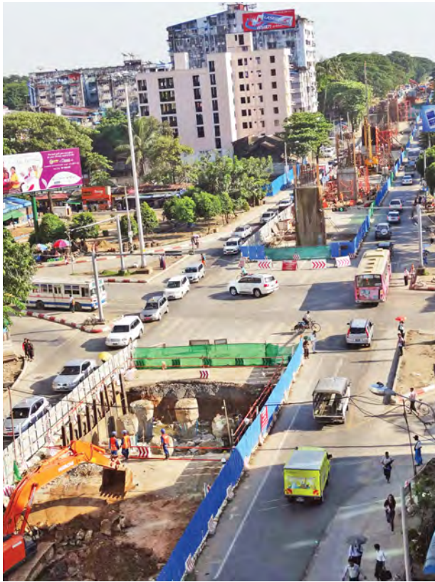
မြေခိုကုန်းခုံးကျော်တံတားအနီး ပြည်လမ်းမပေါ်တွင် ယာဉ်များ သွားလာနေမှုကို အောက်တိုဘာ ၂၉ ရက် နေ့ခင်းပိုင်းကမြင်ရပုံ။

ယာယီလမ်းလွှဲအဖြစ်ယခင်က လျာထားခဲ့ဖူးသော ကျွန်းတောလမ်း၊ ဗဟိုလမ်း၊ အောက်ကြည့်မြင်တိုင်လမ်းနှင့် အထက်ကြည့်မြင်တိုင်လမ်းတို့တွင် နဂိုကတည်းက ယာဉ်ကြောပိတ်ဆို့မှုများရှိနေခြင်းကြောင့် မြေခိုကုန်းမှ ယာဉ် များကိုလမ်းကြောင်းပြောင်းလိုက်ပါက အဆိုပါလမ်းများတွင် ပိုမိုပိတ်ဆို့စေမည့် အခြေအနေမျိုးဖြစ်လာနိုင်သလို မူလလမ်းကြောင်းပေါ်တွင် စီးနင်းသွားလာနေ သော ခရီးသွားပြည်သူများအတွက်လည်း အခက်ခဲများကြုံစေနိုင်ခြင်း ဖြစ်ကြောင်း သိရသည်။