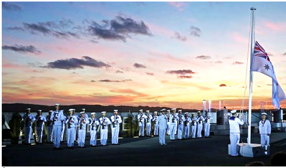
ဩစတြေးလျနှင့် နယူးဇီလန်နိုင်ငံမှ တပ်ဖွဲ့ဝင်များ ပထမကမ္ဘာစစ်ဆင်နွှဲရန် ထွက်ခွာသည့်နှစ် ၁၀၀ ပြည့် အခမ်းအနား ကျင်းပစဉ်။

အယ်လ်ဘာနီ (ဩစတြေးလျ) နိုဝင်ဘာ ၁ ပထမကမ္ဘာစစ်တွင် ပါဝင်တိုက်ခိုက်ရန် အန်ဇပ်အဖွဲ့မှ တပ်ဖွဲ့ဝင် ၃၀၀၀၀တို့ ထွက်ခွာခြင်း နှစ်(၁၀၀)ပြည့် အထိမ်းအမှတ် အခမ်းအနားကို ဩစတြေးလျနိုင်ငံ အယ်လ်ဘာနီမြို့၌ နိုဝင်ဘာ ၁ ရက်တွင် ကျင်းပရာ ဒေသခံများထောင်နှင့်ချီ၍ တက်ရောက်ကြသည်။ ဩစတြေးလျနှင့် နယူးဇီလန်နိုင်ငံတို့မှ ကြည်းတပ်တပ်ဖွဲ့ဝင်များပါဝင်သော (အန်ဇပ်) တပ်ဖွဲ့ဝင်များသည် ၁၉၁၄ ခုနှစ် နိုဝင်ဘာလ ၁ရက်နေ့တွင် ဩစတြေးလျနိုင်ငံ အနောက်ဘက် အစွန်ရှိ အယ်လ်ဘာနီမြို့မှ ဥရောပတိုက်သို့ ရေကြောင်းခရီးဖြင့် ထွက်ခွာခဲ့ကြသည်။ အဆိုပါ အထိမ်းအမှတ် အခမ်းအနားတွင် အဆိုပါ တပ်ဖွဲ့ဝင်များ၏ ရေယာဉ်စု ဥရောပစစ်မြေပြင်သို့ ထွက်ခွာခြင်းကို ပြန်လည်သရုပ်ပြလုပ်ဆောင်ခဲ့သည်။ အခမ်းအနားသို့ ဩစတြေးလျနိုင်ငံ ဝန်ကြီးချုပ် တိုနီအက်ဘော့နှင့် နယူးဇီလန်နိုင်ငံ ဝန်ကြီးချုပ် ဂျွန်ကီးတို့ တက်ရောက်ကြသည်။ ဩစတြေးလျနိုင်ငံသည် အဆိုပါစစ်သည်များ ဥရောပစစ်မြေပြင်သို့ ထွက်ခွာခြင်းမှစကာ ပထမကမ္ဘာစစ်အတွင်း ဝင်ရောက်ခဲ့သည်။ ယင်းစစ်သည်များအား ရေယာဉ် ၃၈ စင်းဖြင့် တင်ဆောင်ကာ ဩစတြေးလျ နယူးဇီလန်တို့မှ စစ်ရေယာဉ်များက ကာကွယ် စောင့်ရှောက်ပေးခဲ့ကြသည်။ ဩစတြေးလျနှင့်နယူးဇီလန်တို့မှစစ်သည်များစွာအား ၁၉၁၅ ခုနှစ်တွင် ဆိုးရွားသော ဂယ်လီပိုလီစစ်မြေပြင်သို့ စေလွှတ်တိုက်ခိုက်စေခဲ့ရာ ယင်းတို့ထဲမှာ စစ်သည် ထောင်နှင့်ချီကာ ကျဆုံးခဲ့ရသည်။ အန်ဇပ်တပ်ဖွဲ့ဝင်များ ဥရောပသို့ ထွက်ခွာခြင်း ပြန်လည်သရုပ်ပြပွဲကို အယ်လ်ဘာနီမြို့၌ ကျင်းပရာ ဩစတြေးလျရေတပ်မှ စစ်ရေယာဉ်ငါးစင်း၊ နယူးဇီလန်ရေတပ်မှ စစ်ရေယာဉ် နှစ်စင်းနှင့် ဂျပန်ရေတပ်မှ စစ်ရေယာဉ်တစ်စင်းတို့ ပါဝင်ခဲ့သည်။