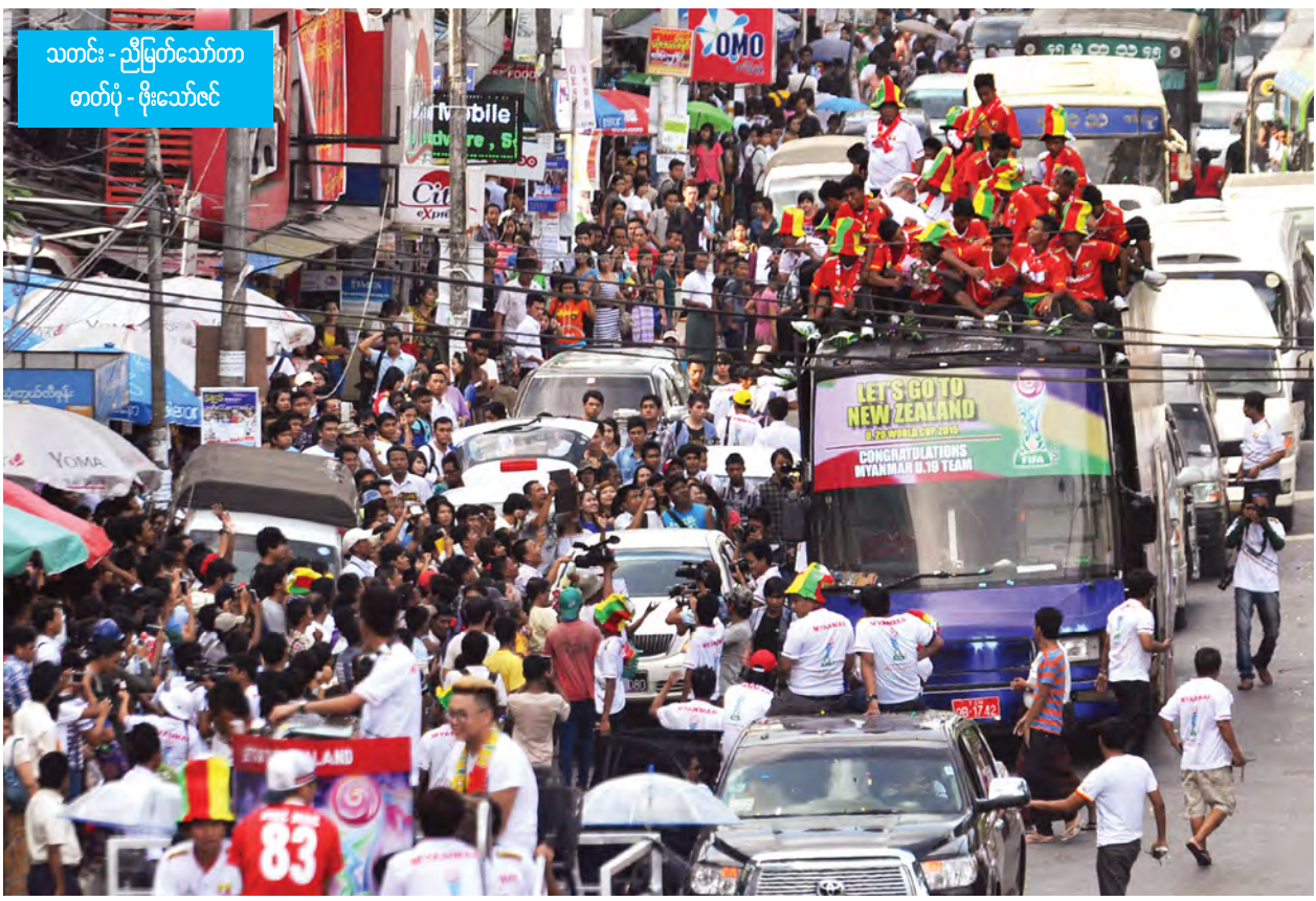
သတင်း - ညီမြတ်သော်တာ