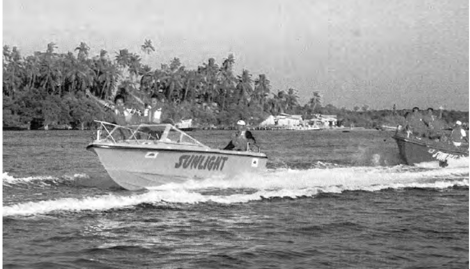
ဧည့်သည်များကလည်း စက်တပ်လှေများဖြင့် ပျော်ပျော်ပါးပါး အနားယူစီးမျောကာ အပန်းဖြေကြသည်။ ထိုကဲ့သို့သော အချိန်အခါတွင် သဘာဝအားအန္တရာယ် မထင်မှတ်ဘဲ ကျရောက်နိုင်သဖြင့် ရေပြင်သက်ကယ်သင်တန်းများ ပို့ချရန် စီစဉ်ပေးလျက်ရှိသည်။ မြန်မာနိုင်ငံတစ်ပွဲဝင်များ၊ ကြက်ခြေနီတစ်ပွဲဝင်များနှင့် မီးသတ်တစ်ပွဲဝင်များက နေ့စဉ်မပြတ်လေ့ကျင့် သင်ကြားပေးလျက်ရှိကြောင်း သိရသည်။

ပုသိမ်၊ နိုဝင်ဘာ ၁ - ရောဝတီတိုင်းဒေသကြီး ပုသိမ်မြို့နယ်အတွင်း တည်ရှိသော ချောင်းသာ၊ ငွေဆောင်ပင်လယ်ကမ်းခြေအလှအပသည် ကမ္ဘာတစ်ဝှမ်း သာယာလှပဆုံးသော အပန်းဖြေခန်းများဖြစ်သည်ဟု ကမ္ဘာလှည့်ခရီးသွားများက စံတင်ပြောဆိုကြသည်။ ထို့ကြောင့် ပွင့်လင်းရာသီကာလတွင် ပြည်တွင်းပြည်ပမှ ခရီးသွားများ၊ အပန်းဖြေလေ့လာသူများ ပျားပန်းခတ်မှု ရောက်ရှိလာကြမည်။ ဒေသခံတို့ကလည်း ခရီးသွားဧည့်သည်များအား ဘေးကင်းလုံခြုံမှုရှိစေရန် အဘက်ဘက်မှ လိုအပ်ချက်များကို ပံ့ပိုးကူညီစောင့်ရှောက်ရန် တာဝန်ရှိသည်။ ထို့အတူ ဟိုတယ်နှင့် ခရီးသွားလာရေးလုပ်ငန်းဝန်ကြီးဌာနကလည်း ခရီးသွားဧည့်သည်များ စိတ်ချမ်းမြေ့စွာ အပန်းဖြေအနားယူနိုင်ရန် ခေတ်မီရေပေါ်လှိုင်းစီး ကစားနည်းများဖြင့် စိစဉ်ဆောင်ရွက်ပေးသကဲ့သို့ ဟိုတယ်ဇုန်များဖွဲ့စည်း၍ ရေပြင်သက်ကယ်လုံခြုံရေးအဖွဲ့များဖြင့် ကူညီရန် စီစဉ်ထားရှိလျက်ရှိသည်။ ငွေဆောင်ကမ်းခြေသည် ပင်လယ်ကမ်းခြေအကျယ် လေးမိုင်ကျော်ရှိသဖြင့် သက်ဆိုင်ရာဟိုတယ်များက ကိုယ်ပိုင်အစီအစဉ်ဖြင့် တာဝန်ယူကြရသည်။ ချောင်းသာကမ်းခြေသည် တစ်မိုင်သာသာခန့်သာ ကျယ်ဝန်းသည်။ ရေတက်၊ ရေကျမတူညီဘဲ လှိုင်းလေကင်းရှင်းမှုအချိန် နာရီသတ်မှတ်ရသည်။ အပျော်စီးရှုပ်ပြေးလေ့ငယ်များ၊ ပင်လယ်ရေလှိုင်းစီး စက်တပ်လှေများဖြင့် ဇိမ်ခံသူများနှင့် ဗဟုသုတ ရှာဖွေလိုသည့် ခရီးသွား