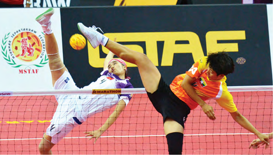
အမျိုးသမီး အကြိုဗိုလ်လှပွဲတွင် မြန်မာအသင်းနှင့် ဗီယက်နမ်အသင်းတို့ ယှဉ်ပြိုင်စဉ်။

မြန်မာအသင်းမှာ ဆီမီးတွင် ကာတာအသင်းကို အချိန်ပို၌ သုံးဂိုး-နှစ်ဂိုးဖြင့် ရှုံးနိမ့်ခဲ့သော်လည်း မြန်မာကစားသမားများ၏ ကြိုးစားမှု၊ စိတ်ဓာတ်တို့ကို မြန်မာဘောလုံးပရိသတ်များကလက်ခံခဲ့ကြသည်။ မြန်မာယူ-၁၉ အသင်း၏ စွမ်းဆောင်မှုမှာ အင်မတန်ပင်ကြီးမားသော်လည်း မြန်မာဘောလုံးမှာ ရှေ့ဆက်သွားရဦးမည်ဖြစ်သည်။ အာရှအဆင့် ပြိုင်ပွဲများတွင် အောင်မြင်မှုရရှိရန်၊ ကမ္ဘာ့အဆင့်ပြိုင်ပွဲများကို ယှဉ်ပြိုင်ခွင့်ရရှိရန်နှင့် ယခုယှဉ်ပြိုင်ခွင့်ရရှိထားသည့် ယူ-၂၀ ကမ္ဘာ့ဖလားပြိုင်ပွဲတွင် အဆင့်မီစွာ ယှဉ်ပြိုင်နိုင်ရေးစသည့် ရှေ့ဆက်သွားရန် အများကြိုးရိုနေပေသည်။ ယခုအောင်မြင်မှု၌ ယစ်မူးမနေဘဲ ဆက်လက်အောင်မြင်ရန် မြန်မာတစ်မျိုးသားလုံး၏ နှလုံးသည်းပွတ်ထဲက အလိုရှိနေပေသည်။