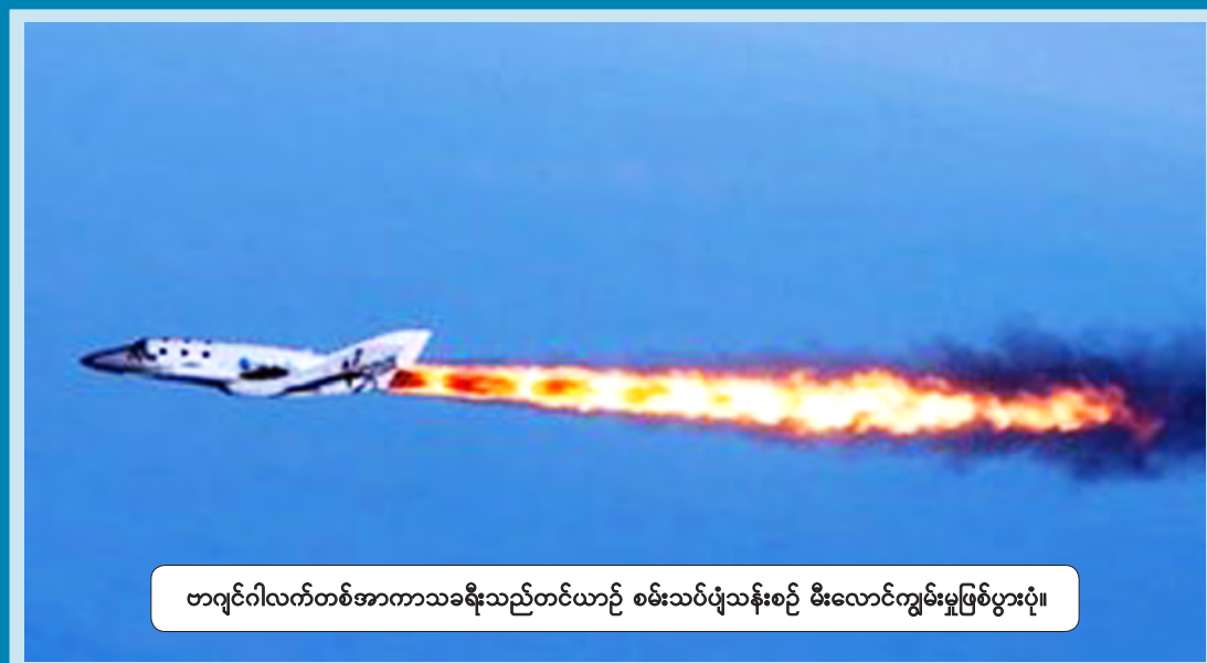
ဗာဂျင်ဂါလက်တစ်အာကာသခရီးသည်တင်ယာဉ် စမ်းသပ်ပျံသန်းစဉ် မီးလောင်ကျွမ်းမှုဖြစ်ပွားပုံ။

နိုင်ငံရပ်ခြားဒေသတွင် နေထိုင်သူ သို့မဟုတ် နိုင်ငံရပ်ခြားဒေသများသို့ သွားရောက်နေထိုင်သူ ပြိတိန်နိုင်ငံသားများ အနေဖြင့် သတိပေးချက်ထုတ်ပြန်ရန် တိုက်တွန်းထားသည်။ အဘယ်ကြောင့်ဆိုသော် အီရတ်နှင့် ဆီးရီးယားတွင် ဖြစ်ပွားနေသည့် ပဋိပက္ခများက ပြိတိန်နိုင်ငံသားများအပေါ် ခြိမ်းခြောက်မှုများ ဖြစ်ပေါ်စေရန် လှုံ့ဆော်မှုများ ပြုနေခြင်းကြောင့် ဖြစ်သည်ဟု ဆိုသည်။