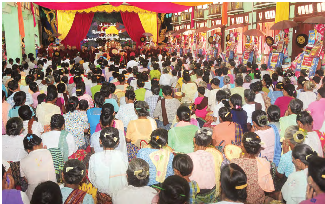
မန္တလေးတိုင်းဒေသကြီး ရမည်းသင်းမြို့ နှစ်(၈၀)ပြည့် မြို့နယ်လုံးကျွတ်မဟာဘုံကထိန်ပွဲတော် ရေစက်ချမင်္ဂလာအခမ်းအနားကျင်းပစဉ်။ (သတင်းစဉ်)

ရမည်းသင်းမှ ငါးပါးသီလ ခံယူဆောင်တည်ကြသည်။ ယင်းနောက် လှူဖွယ်ဝတ္ထုပစ္စည်းပဒေသာပင်များ၊ အထူးလှူဖွယ်ပစ္စည်းများဖြစ်သည့် ကွန်ပျူတာနှစ်စုံနှင့် ဆိုင်ကယ်တို့ကို စာရေးတံမဲချ၍ ရမည်းသင်းမြို့နယ်ရှိ ဘုန်းကြီးကျောင်း ၆၀ သို့ ဆက်ကပ်လှူဒါန်းပြီး အောင်မြင်ရွှေဘုံကျောင်းတိုက်ဆရာတော် ချီးမြှင့်