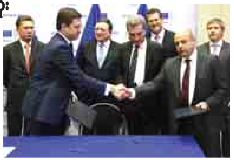
ရုရှားစွမ်းအင်ဝန်ကြီးအလက်ဇန္ဒြားနိုဗတ်နှင့် ယူကရိန်းစွမ်းအင်ဝန်ကြီးယူရီပရိုဒန်(ယာ)တို့ ဆွေးနွေးပွဲအပြီး လက်ဆွဲနှုတ်ဆက်ကြစဉ်။

ရုရှားက ယူကရိန်းနိုင်ငံသို့ ထောက်ပံ့ ခဲ့သော ဓာတ်ငွေများအတွက် ရရန်ကြွေးမြီ ပမာဏ ဒေါ်လာ ၄ ဒသမ ၆ ဘီလီယံရှိရာ ယခုနှစ်ကုန်တွင် ဒေါ်လာ ၃ဒသမဘီလီယံ ပေးချေရန် ရုရှားက ယူကရိန်းအား တောင်းခံ ခဲ့သည်။