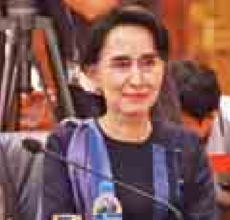
အမျိုးသား ဒီမိုကရေစီအဖွဲ့ချုပ် ဒုတိယဥက္ကဋ္ဌ ဒေါ်အောင်ဆန်းစုကြည်။