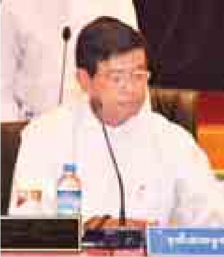
ဒုတိယသမ္မတ ဦးညက်ထွန်း။