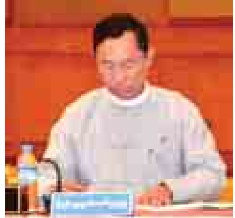
ပြည်ထောင်စုလွှတ်တော် နာယက ပြည်သူ့လွှတ်တော် ဥက္ကဋ္ဌ သူဦးရွှေမန်း။