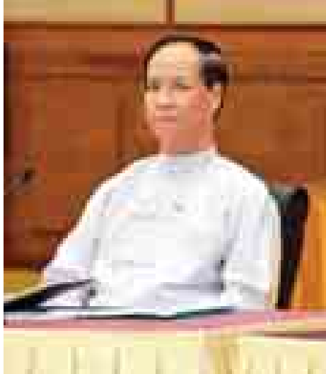
ဒုတိယသမ္မတ ဒေါက်တာ ဝိုင်းမောက်ခမ်း။