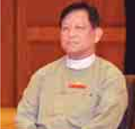
ပြည်ထောင်စုရွေးကောက်ပွဲကော်မရှင် ဥက္ကဋ္ဌ ဦးတင်အေး။