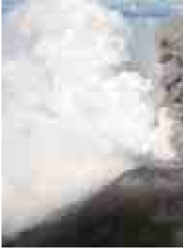
ကော်စတာရီကာနိုင်ငံမှ တူရိယယ်လ်ဘာအမည်ရှိ မီးတောင်ပေါက်ကွဲမှုအား တွေ့ရစဉ်။

ကော်စတာရီကာနိုင်ငံတွင် ပေါက်ကွဲနေသည့် မီးတောင်တစ်လုံးမှ ပြာမှုန်များမှုတ်ထုတ်ပြီးနောက် အာဏာပိုင်များက အရေးပေါ် အခြေအနေ သတိပေးချက်တစ်ရပ်ကို ထုတ်ပြန်ထားကြောင်း အောက်တိုဘာ ၃၁ရက် ဒေသဆိုင်ရာသတင်းများ၌ ဖော်ပြသည်။ မီးတောင်မှ မှုတ်ထုတ်လိုက်သည့် ပြာမှုန်များသည် ကော်စတာရီကာနိုင်ငံ မြို့တော်ဆန်ဟိုဆေးကို ကျော်လွန်ရောက်ရှိခဲ့ကြောင်း သတင်းတွင် ဖော်ပြ သည်။