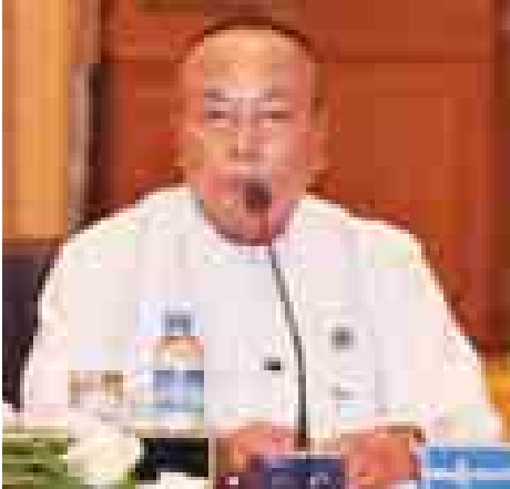
အမျိုးသားလွှတ်တော် ဥက္ကဋ္ဌ ဦးခင်အောင်မြင့်။