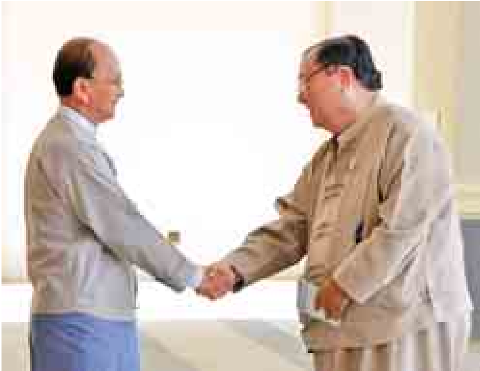
နိုင်ငံတော်သမ္မတ ဦးသိန်းစိန် ညီနောင်တိုင်းရင်းသားများ မဟာမိတ်အဖွဲ့ကိုယ်စားလှယ် ဦးခွန်ထွန်းဦးအား ရင်းရင်းနှီးနှီးနှုတ်ဆက်စဉ်။ (သတင်းစဉ်)