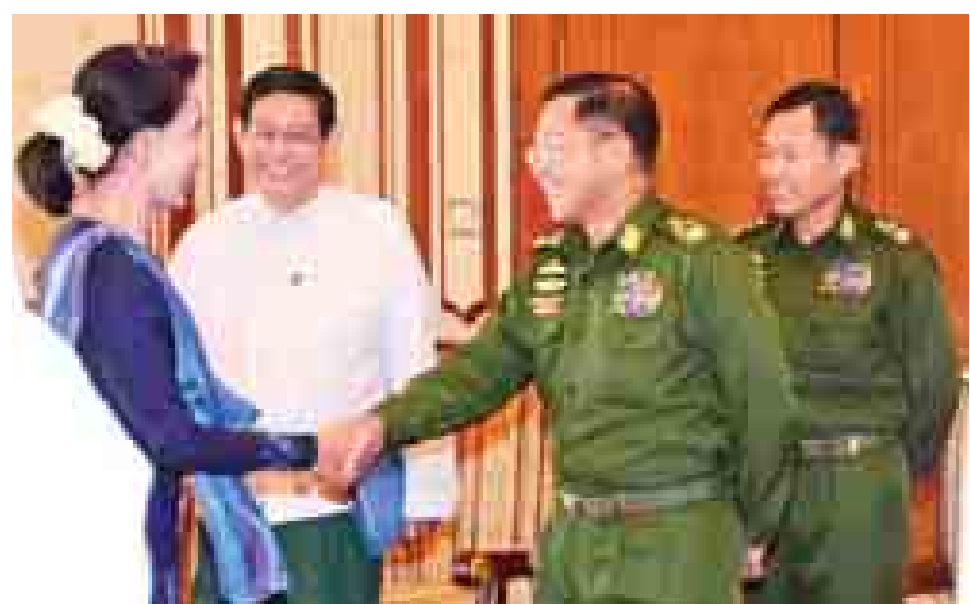
တပ်မတော်ကာကွယ်ရေးဦးစီးချုပ် ဗိုလ်ချုပ်မှူးကြီး မင်းအောင်လှိုင်နှင့် အမျိုးသားဒီမိုကရေစီအဖွဲ့ချုပ် ဥက္ကဋ္ဌ ဒေါ်အောင်ဆန်းစုကြည်တို့ ရင်းရင်းနှီးနှီးနှုတ်ဆက်စဉ်။ (သတင်းစဉ်)