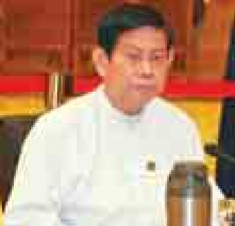
ပြည်ထောင်စုကြံ့ခိုင်ရေးနှင့် ဖွံ့ဖြိုးရေးပါတီ ဒုတိယဥက္ကဋ္ဌ ဦးဌေးဦး။