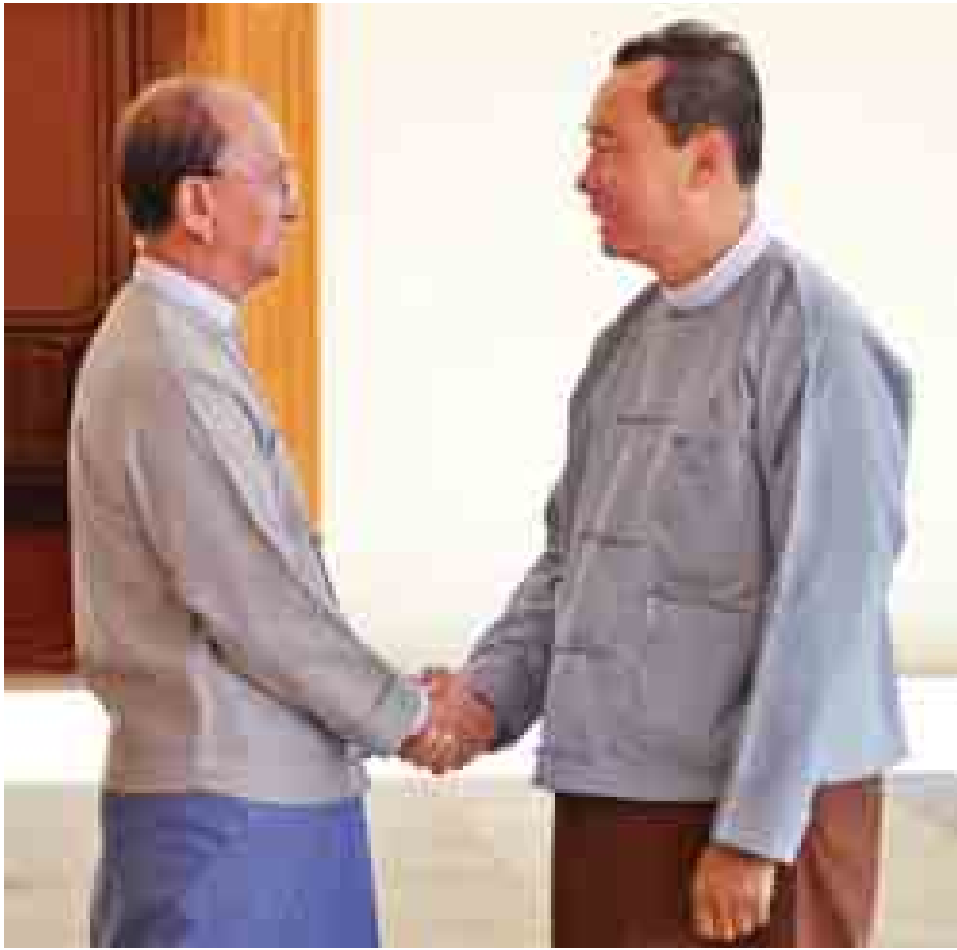
နိုင်ငံတော်သမ္မတ ဦးသိန်းစိန် ပြည်ထောင်စုလွှတ်တော်နာယက ပြည်သူ့လွှတ်တော်ဥက္ကဋ္ဌ သူရဦးရွှေမန်းအား ရင်းရင်းနှီးနှီးနှုတ်ဆက်စဉ်။ (သတင်းစဉ်)