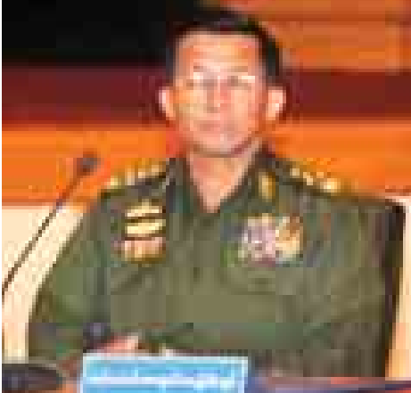
တပ်မတော် ကာကွယ်ရေးဦးစီးချုပ် ဗိုလ်ချုပ်မှူးကြီး မင်းအောင်လှိုင်။