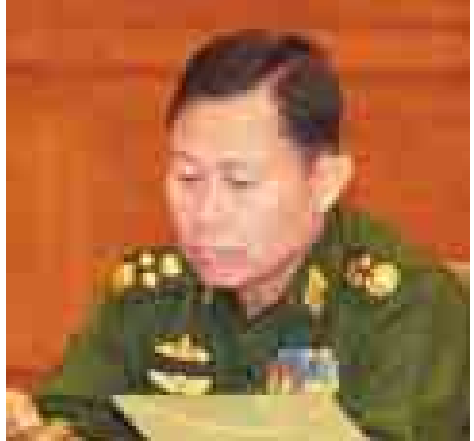
ဒုတိယတပ်မတော်ကာကွယ်ရေးဦးစီးချုပ် ကာကွယ်ရေးဦးစီးချုပ်(ကြည်း) ဒုတိယဗိုလ်ချုပ်မှူးကြီး စိုးဝင်း။