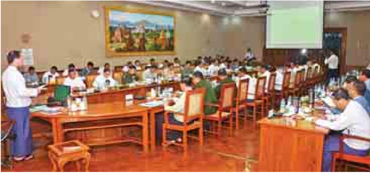
နေပြည်တော် အောက်တိုဘာ ၃၁

၂၀၁၅ ခုနှစ် (၆၇)နှစ်မြောက် လွတ်လပ်ရေးနေ့ ကျင်းပရေးနှင့်စပ်လျဉ်းသည့် ညှိနှိုင်းအစည်းအဝေးကို ယနေ့ မွန်းလွဲ ၂ နာရီတွင် ပြည်ထောင်စုအစိုးရအဖွဲ့ရုံး အစည်းအဝေးခန်းမ၌ ကျင်းပရာ (၆၇)နှစ်မြောက် လွတ်လပ်ရေးနေ့ကျင်းပရေး ဗဟိုကော်မတီဥက္ကဋ္ဌ ဒုတိယ သမ္မတ ဒေါက်တာစိုင်းမောက်ခမ်းတက်ရောက်၍ အမှာ စကားပြောကြားသည်။(ဝဲရံ)