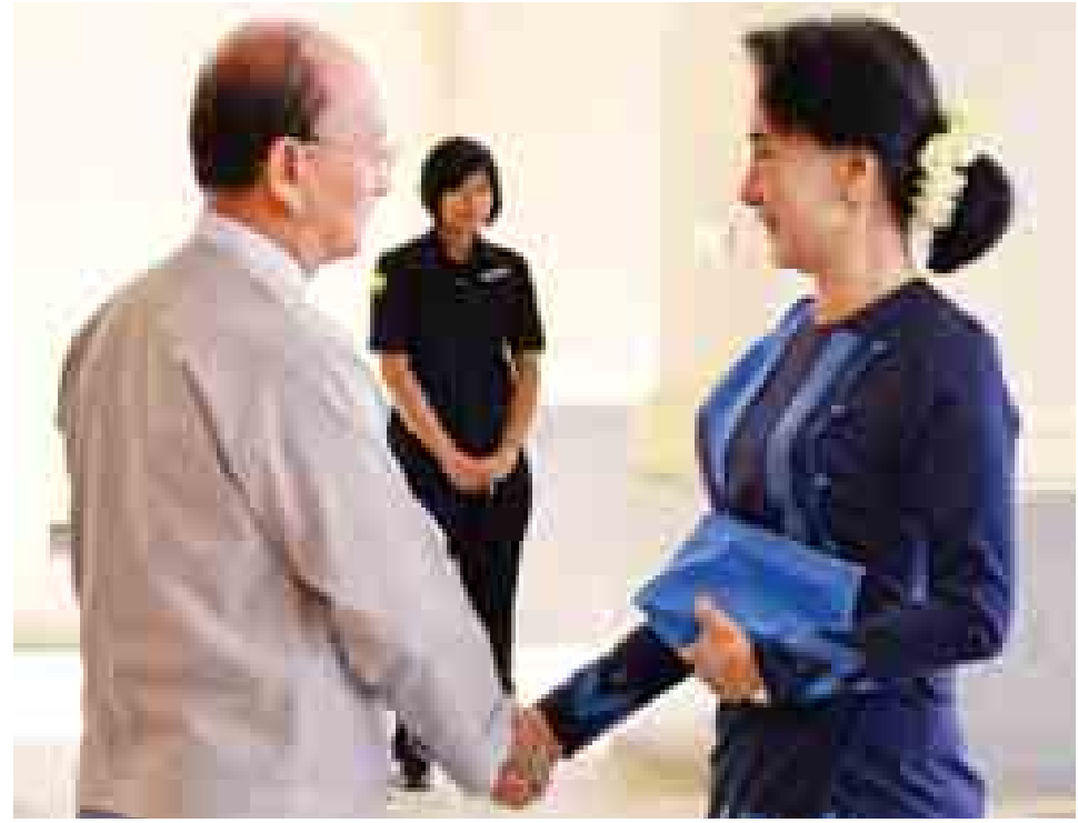
နိုင်ငံတော်သမ္မတ ဦးသိန်းစိန် အမျိုးသားဒီမိုကရေစီအဖွဲ့ချုပ်ဥက္ကဋ္ဌ ဒေါ်အောင်ဆန်းစုကြည်အား ရင်းရင်းနှီးနှီး နှုတ်ဆက်စဉ်။ (သတင်းစဉ်)

မိမိတို့အနေဖြင့် နောင်ပေါ်ပေါက်လာမည့် ဒီမိုကရေစီ နည်းလမ်းအရ ပြည်သူလူထုရွေးချယ်တင်မြှောက်လိုက် သည့် အစိုးရအဆက်ဆက်က ငြိမ်းချမ်းရေးတည်ဆောက်မှု ကို စာမျက်နှာ ၉ ကော်လံ ၁ သို့