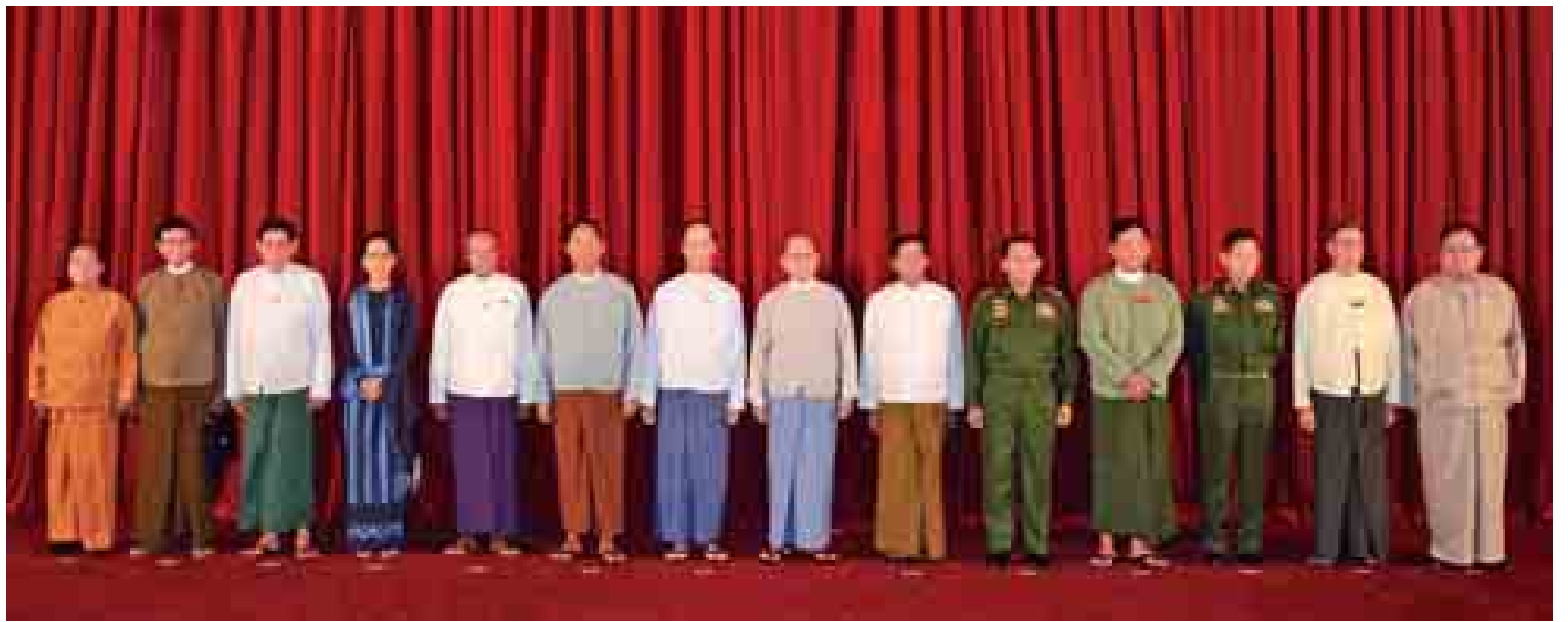
နိုင်ငံတော်သမ္မတ ဦးသိန်းစိန်နှင့် အမျိုးသားနိုင်ငံရေးအင်အားစု(၅)ဖွဲ့မှ ခေါင်းဆောင်များ၏ နိုင်ငံရေးရာဆွေးနွေးပွဲသို့ တက်ရောက်လာကြသူများ စုပေါင်းမှတ်တမ်းတင်ဓာတ်ပုံရိုက်စဉ်။ (သတင်းစဉ်)

★ ရှေ့ဖူးမှ အချိန်မှစ၍ ဒီမိုကရေစီအသွင်ကူးပြောင်းရေးနှင့် အခြေတည်ခိုင်မာရေးဟူသည့်ကိစ္စကို ဘက်ပေါင်းစုံ၊ ရှုထောင့်ပေါင်းစုံမှစဉ်းစားပြီး ကဏ္ဍအားလုံးလွှမ်းခြုံသည့် ပြုပြင်ပြောင်းလဲရေးလုပ်ငန်းစဉ်များအနေဖြင့် အကောင်အထည်ဖော်ရန် ကြိုးပမ်းခဲ့ပါကြောင်း၊ လက်ရှိပြုပြင်ပြောင်းလဲရေးလုပ်ငန်းစဉ်များနှင့် နိုင်ငံရေးဖြစ်စဉ် ရှင်သန်လာမှုသည်