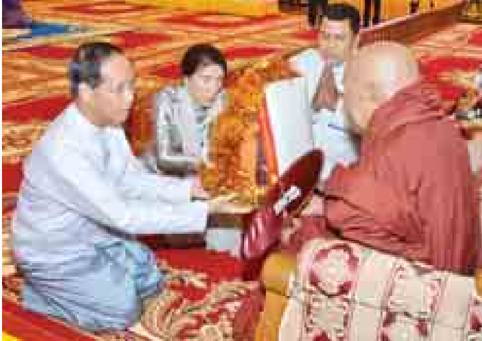
ဒုတိယသမ္မတ ဒေါက်တာစိုင်းမောက်ခမ်းနှင့် ဇနီး ဒေါ်နန်းရွှေမှုန် ဆရာတော်ထံ လှူဖွယ်ပစ္စည်းများ ဆက်ကပ်လှူဒါန်းစဉ်။

အခမ်းအနားအပြီးတွင် ကြွရောက်တော်မူလာကြသည့် ဆရာတော် သံဃာတော်များအား နိုင်ငံတော်သမ္မတနှင့်အဖွဲ့ဝင်များက နေ့ဆွမ်းဆက်ကပ် လှူဒါန်းကြသည်။ (သတင်းစဉ်)