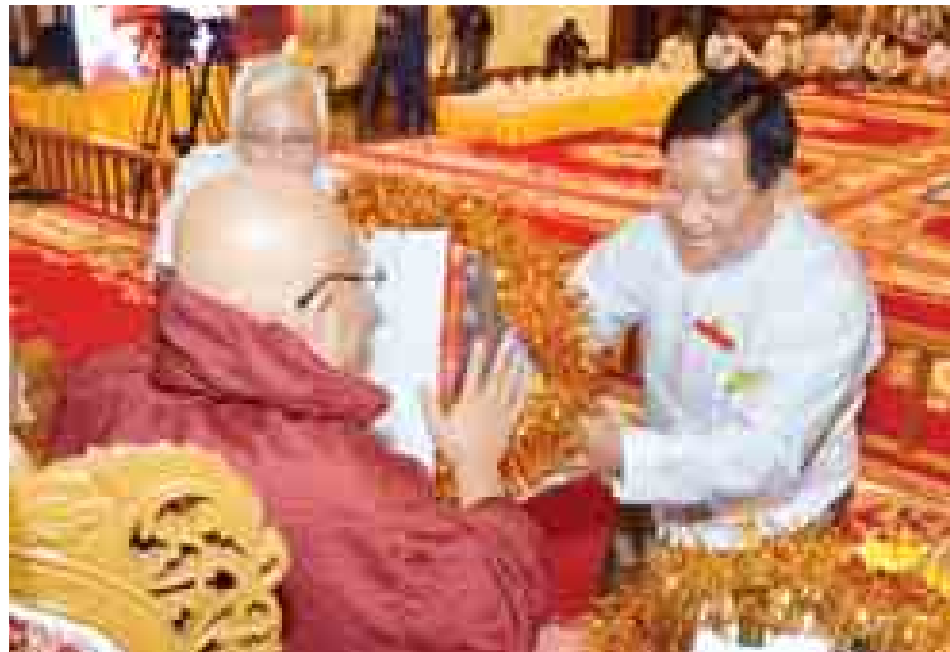
ပြည်ထောင်စုရွေးကောက်ပွဲကော်မရှင်ဥက္ကဋ္ဌ ဦးတင်အေး ဆရာတော်ထံ လှူဖွယ်ပစ္စည်းများ ဆက်ကပ်လှူဒါန်းစဉ်။ (သတင်းစဉ်)