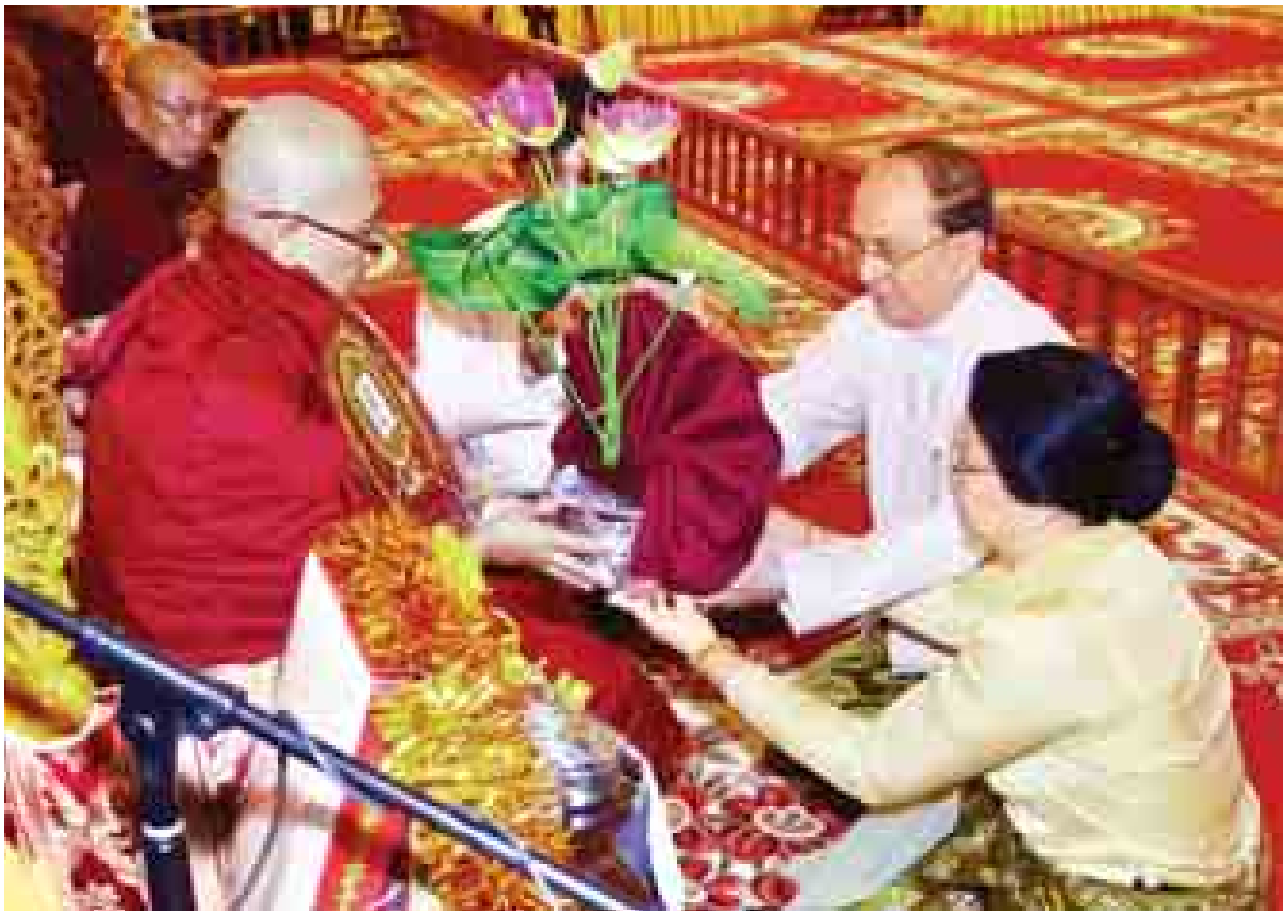
နိုင်ငံတော်သမ္မတ ဦးသိန်းစိန်နှင့် ဇနီး ဒေါ်ခင်ခင်ဝင်း ဆရာတော်ထံ ကထိန်လှာသင်္ကန်းနှင့် လှူဖွယ်ပစ္စည်းများ ဆက်ကပ်လှူဒါန်းစဉ်။ (သတင်းစဉ်)