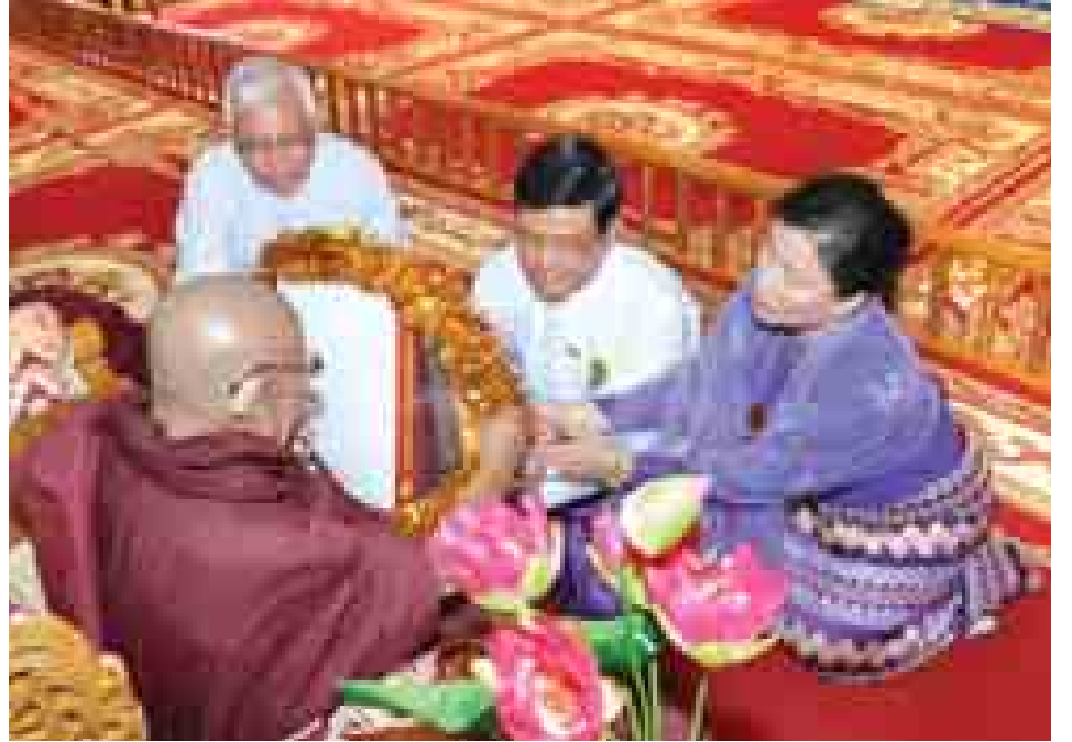
ဒုတိယသမ္မတ ဦးညွှန်ထွန်းနှင့် ဇနီး ဒေါ်ခင်အေးမြင့် ဆရာတော်ထံ လှူဖွယ်ပစ္စည်းများ ဆက်ကပ် လှူဒါန်းစဉ်။