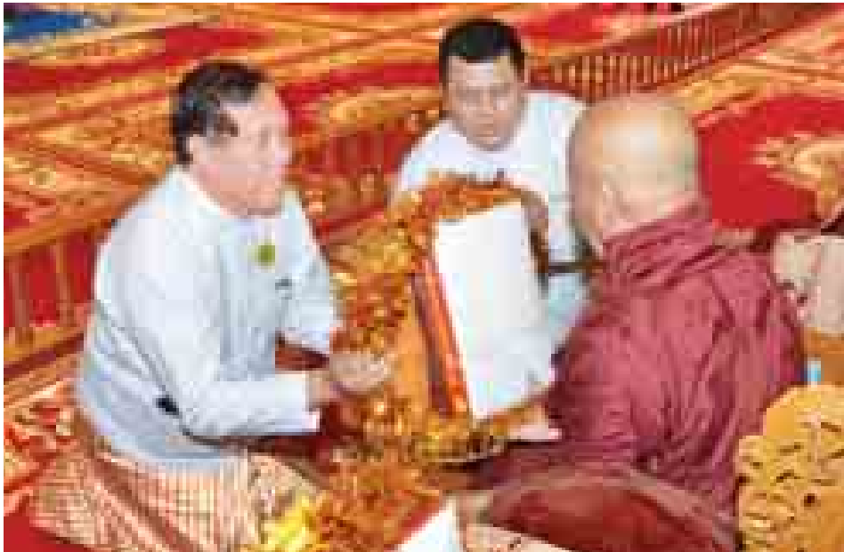
ပြည်ထောင်စုတရားသူကြီးချုပ် ဦးထွန်းထွန်းဦး ဆရာတော်ထံ လှူဖွယ်ပစ္စည်းများ ဆက်ကပ်လှူဒါန်းစဉ်။ (သတင်းစဉ်)

ထို့နောက် နိုင်ငံတော်သံယမဟာနာယကအဖွဲ့ဥက္ကဋ္ဌ မန္တလေးမြို့ ဗန်းမော်ကျောင်းတိုက် ပဓာနနာယကဆရာတော် အဘိဓဇမဟာရဋ္ဌဂုရု အဘိဓဇအဂ္ဂမဟာသဒ္ဓမ္မဇောတိက ဒေါက်တာ ဘဒ္ဒန္တ ကုမာရာဘိဝံသထံမှ နိုင်ငံတော်သမ္မတနှင့် ဇနီးတို့ အမျိုးပြုသော ပရိသတ်များက စာမျက်နှာ ၉ သို့