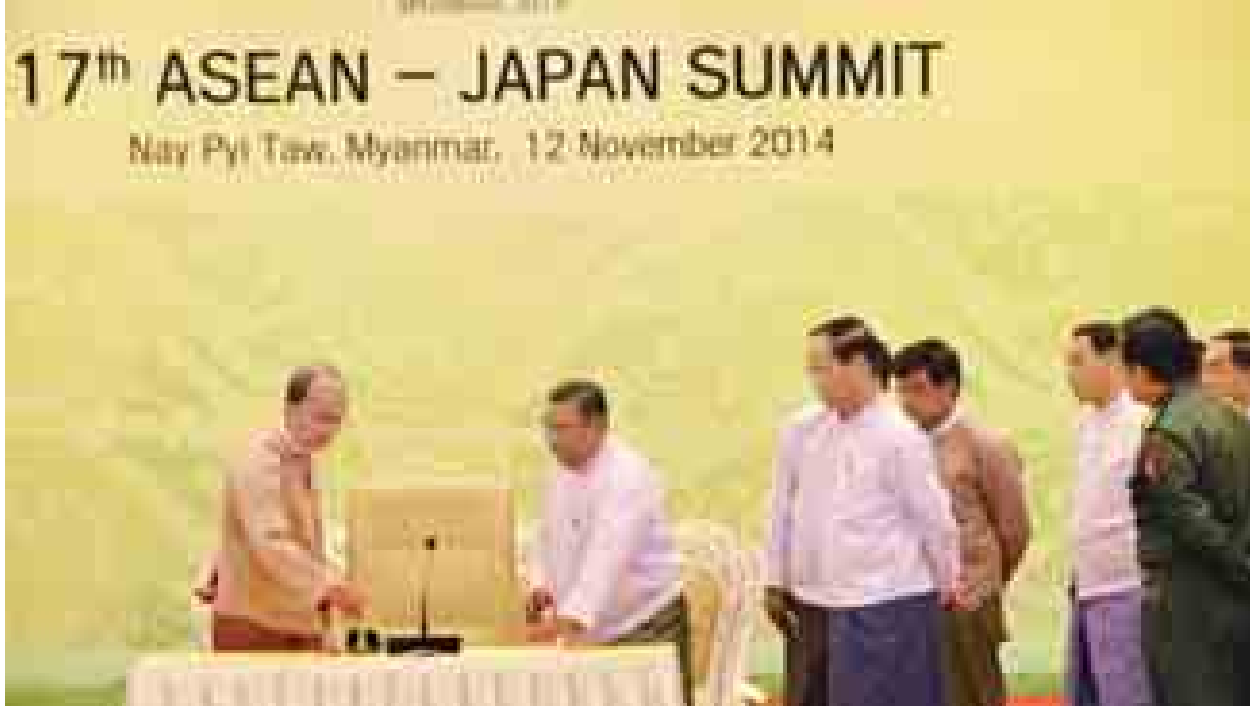
နိုင်ငံတော်သမ္မတ ဦးသိန်းစိန် အစည်းအဝေးကျင်းပမည့် ခန်းမများအား ကြည့်ရှုစစ်ဆေးစဉ်။ (သတင်းစဉ်)

ထိုသို့တွေ့ဆုံရာတွင် မြန်မာနှင့် တရုတ်နှစ်နိုင်ငံစီးပွားရေး ပိုမိုတိုးမြှင့်လာစေရန် ပူးပေါင်းဆောင်ရွက်ရေးနှင့် မြန်မာနိုင်ငံ၏ စီးပွားရေးဖွံ့ဖြိုးတိုးတက်မှုလုပ်ငန်းစဉ်များ ဆောင်ရွက်ရာတွင် ပါဝင်ကူညီဆောင်ရွက်နိုင်ရေးတို့အား ရင်းနှီးပွင့်လင်းစွာ ဆွေးနွေးခဲ့ကြသည်။ (သတင်းစဉ်)