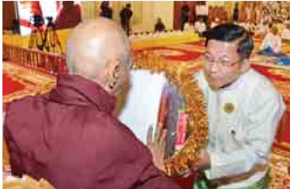
တပ်မတော်ကာကွယ်ရေးဦးစီးချုပ် ဗိုလ်ချုပ်မှူးကြီးမင်းအောင်လှိုင် ဆရာတော်ထံ လှူဖွယ်ပစ္စည်းများ ဆက်ကပ်လှူဒါန်းစဉ်။ (သတင်းစဉ်)