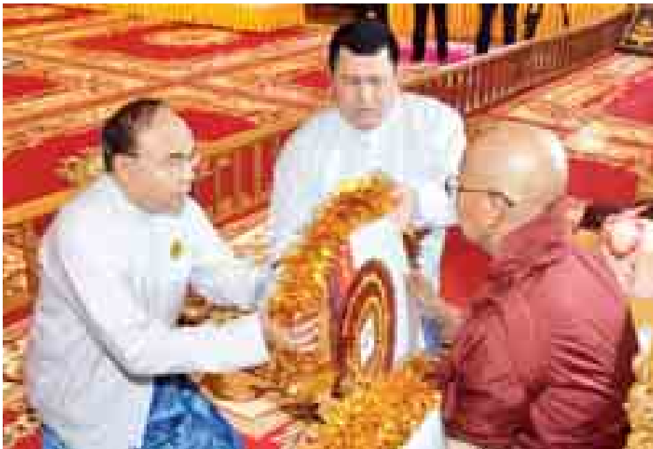
နိုင်ငံတော်ဖွဲ့စည်းပုံအခြေခံဥပဒေဆိုင်ရာခုံရုံးဥက္ကဋ္ဌ ဦးမြသိန်း ဆရာတော်ထံ လှူဖွယ်ပစ္စည်းများ ဆက်ကပ်လှူဒါန်းစဉ်။ (သတင်းစဉ်)