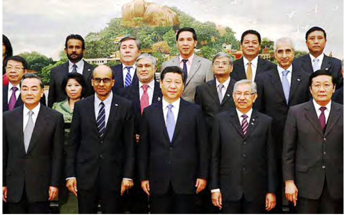
အာရှအခြေခံအဆောက်အအုံဆိုင်ရာ ရင်းနှီးမြှုပ်နှံမှုဘဏ် ထူထောင်ရေး နားလည်မှု စာချုပ်လွှာ လက်မှတ်ရေးထိုးပွဲအခမ်းအနားသို့ တက်ရောက်လာသူများအားတွေ့ရစဉ်။

ကြောင်း တရုတ်သမ္မတ ရှိကျင့်ဖျင်က အခမ်းအနားသို့ တက်ရောက်လာသည့် ကိုယ်စားလှယ်များအား ပြောကြားသည်။ တရုတ်နိုင်ငံက ကျောထောက်နောက်ခံပြုသည့် အာရှ အခြေခံအဆောက်အအုံဆိုင်ရာ ရင်းနှီးမြှုပ်နှံမှုဘဏ်သည် မြို့တော်ပေကျင်း၌ ဌာနချုပ်ရုံး ဖွင့်လှစ်မည်ဖြစ်ပြီး အနောက်နိုင်ငံများက လွှမ်းမိုးထားသော နိုင်ငံတကာ ငွေချေးရေးအဖွဲ့အစည်းများ၏ ပြိုင်ဘက်ဘဏ္ဍာရေး အဖွဲ့အစည်းတစ်ရပ် ဖြစ်လာမည်ဖြစ်ကြောင်း ဝေဖန်မှုများ ပေါ်ထွက်လာသည်။ အဆိုပါဘဏ်သည် ကမ္ဘာ့ဘဏ်နှင့် အာရှဖွံ့ဖြိုးရေးဘဏ်တို့ကို ယှဉ်ပြိုင်လာသည့် ဘဏ်အဖြစ် ရှုမြင်ရကြောင်း၊ ဩစတြေးလျ၊ အင်ဒိုနီးရှားနှင့် တောင်ကိုရီးယားနိုင်ငံတို့က နားလည်မှုစာချုပ်လွှာတွင် ပါဝင်လက်မှတ်ရေးထိုးခြင်း မရှိကြောင်း မီဒီယာသတင်းများတွင် ဖော်ပြသည်။ ပီတီအိုင်။