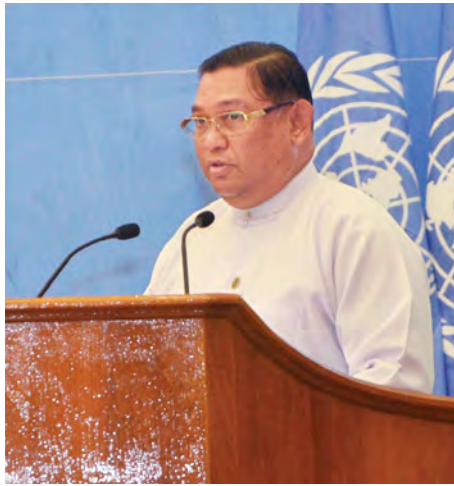
နိုင်ငံတော်သမ္မတ ဦးသိန်းစိန်ထံမှပေးပို့သည့် သဝဏ်လွှာကို နိုင်ငံခြားရေးဝန်ကြီးဌာန ပြည်ထောင်စုဝန်ကြီး ဦးဝဏ္ဏမောင်လွင် ဖတ်ကြားစဉ်။ (သတင်းစဉ်)

◆ ရှေ့ဖူးမှ စုပေါင်းရင်ဆိုင် ကျော်လွှားကြရမည်ဖြစ်ပါကြောင်း။ နိုင်ငံတကာ ငြိမ်းချမ်းရေးနှင့်လုံခြုံရေးသည် ကုလသမဂ္ဂအဖွဲ့၏ ကနဦးရည်မှန်းချက်များအနက် တစ်ခုဖြစ်ပါကြောင်း၊ မြန်မာနိုင်ငံသည် ငြိမ်းချမ်းရေးကို မြတ်နိုးသည့် နိုင်ငံဖြစ်သည်နှင့်အညီ နျူကလီးယားလက်နက်ကင်းစင်သောကမ္ဘာဖြစ်လာစေရန် အစဉ်တစိုက် ထောက်ခံအားပေးခဲ့ပါကြောင်း၊ ကုလသမဂ္ဂအထွေထွေညီလာခံတွင် မြန်မာနိုင်ငံက နှစ်စဉ်တင်သွင်းလေ့ရှိသည့် နျူကလီးယားလက်နက်ဖျက်သိမ်းရေး အဆိုမူကြမ်းသည်လည်း ကုလသမဂ္ဂအဖွဲ့ဝင်နိုင်ငံအများစု၏ ထောက်ခံမှုကိုရနေပါကြောင်း၊ အဆိုပါမူကြမ်းသည် ကမ္ဘာ့ငြိမ်းချမ်းရေးနှင့် လုံခြုံရေးအတွက် မိမိတို့၏ ကတိကဝတ်နှင့် အလေးထားမှုကို ပြသနေခြင်းပင်ဖြစ်ပါကြောင်း။