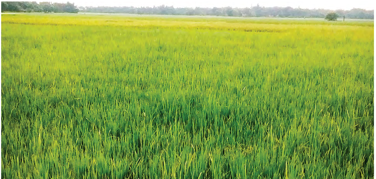
ရခိုင်ပြည်နယ်(ပြန်/ဆက်)

လယ်ယာမြေများ အောင်မြင်စွာ စိုက်ပျိုးနိုင်ခဲ့ကြောင်း သိရသည်။ ထိုသို့ မောင်တောမြို့နယ်အတွင်း စိုက်ပျိုးနိုင်သည့် လယ်မြေများအား ပလပ်မြေများ မဖြစ်ပေါ်စေရေး၊ တောင်သူများ၏ အခက်အခဲများအား ဖြေရှင်းပေးနိုင်ရေးအတွက် မိုးစပါးစိုက် ရာသီအတွင်း တိုင်းရင်းသားများစု စည်းနေထိုင်သည့် ကျေးရွာ ၃၆ ရွာမှ လယ်မြေ ၂၉၇၅ ဧကတွင် စိုက်ပျိုးရန် အတွက် မျိုးစပါး ၄၄၆၃ တင်းနှင့် ထွန်စက်များအတွက် ထွန်ယက်ရေး စက်သုံးဆီများကို ရခိုင်ပြည်နယ် အစိုးရအဖွဲ့က ပေးအပ်ခဲ့သည်။ တစ်ဧကလျှင် ဓာတ်မြေဩဇာ တစ်အိတ် နှုန်းဖြင့် ဓာတ်မြေဩဇာ ၂၉၇၅ အိတ်ကို ပြည်နယ် လူမှုစီးပွားဘဝ ဖွံ့ဖြိုးတိုးတက်ရေး လုပ်ငန်းကော်မတီ က ထောက်ပံ့ပေးအပ်ခဲ့ပြီး ပြည်နယ် စက်မှုလယ်ယာ ဦးစီးဌာနပိုင် ထွန်စက်ကြီး လေးစီးဖြင့် ထွန်ယက်ခြင်း လုပ်ငန်းများကို စက်မှုလယ်ယာ ဦးစီးဌာန ဝန်ထမ်းများက မောင်းနှင် ထွန်ယက်ပေးခြင်း၊ စက်မှုဝန်ကြီးဌာနမှ ပေးပို့ထားသော လက်ထွန်းထွန်စက် ၄၅ စီးဖြင့် ဒေသခံတောင်သူများ ကိုယ်တိုင်ထွန်ယက်၍ စိုက်ပျိုးလုပ်ကိုင် ခဲ့ကြသည်။ ယင်းသို့ တောင်သူများ ကိုယ်တိုင် ထွန်ယက်လုပ်ကိုင်ရာတွင် စက်များကို ကျွမ်းကျင်စွာ အသုံးပြု နိုင်ရေးအတွက် ပြည်နယ်စက်မှု လယ်ယာဦးစီးဌာနမှ ဝန်ထမ်းများက ကျေးရွာအရောက် စက်မောင်း သင်တန်းများ ဖွင့်လှစ်ခြင်း၊ လုပ်ငန်းခွင် သင်တန်းများ ဖွင့်လှစ်ခြင်းများ ဆောင်ရွက်၍ မိုးစပါးစိုက်ပျိုးမှုအား အချိန်နှင့်တစ်ပြေးညီ စိုက်ပျိုးလုပ် ကိုင်နိုင်ခဲ့ခြင်းကြောင့် ယခုအခါ အဆိုပါ လယ်မြေများတွင် မိုးစပါး များ အောင်မြင်စွာထွန်းလျက်ရှိ သည့်အတွက် တောင်သူများ ဝမ်းသာ ပျော်ရွှင်လျက်ရှိကြောင်း သိရသည်။