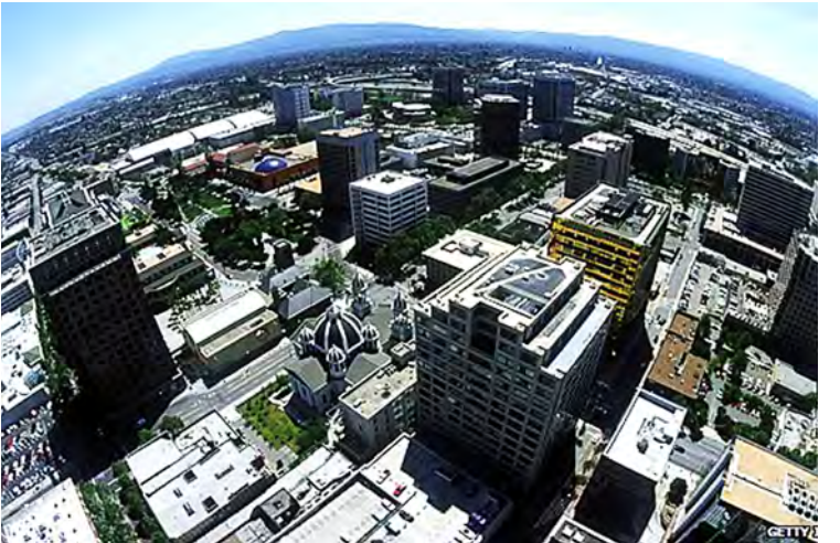
အိန္ဒိယနယ်ဖွား အလုပ်သမားထောင်ပေါင်းများစွာ အလုပ်လုပ်ကိုင်နေသည့် နည်းပညာကုမ္ပဏီများ တည်ရှိရာ ဆီလီကွန်ပယ်လီကို တွေ့ရစဉ်။

အတွက် ပြစ်ဒဏ်နှင့် နောက်ကြောင်းပြန်လုပ်ခအဖြစ် ၎င်းပုံနှိပ်ဆိုင်ရာနည်းပညာကုမ္ပဏီသည် ဒေါ်လာ ၄၃၀၀၀ ပေးရမည်ဖြစ်ကြောင်း သတင်းများတွင် ဖော်ပြသည်။ ၎င်းကုမ္ပဏီက အိန္ဒိယအလုပ်သမားရှစ်ဦးကို အထူးစီမံကိန်းတစ်ခုအတွက် အမေရိကန်ပြည်ထောင်စုသို့ ခေါ်ဆောင်လာခဲ့ခြင်းဖြစ်သည်။ ကုမ္ပဏီက ၎င်းတို့ကို အိန္ဒိယနိုင်ငံတွင် ၎င်းတို့ပုံနှိပ်အလုပ်အတွက် ရရှိသော လုပ်ခအတိုင်းပေးသည့်အပြင် အိန္ဒိယသုံးငွေပေးဖြင့် ပေးချေခြင်းဖြစ်ကြောင်း သတင်းများက ဆိုသည်။ အမေရိကန်ဥပဒေအရ နိုင်ငံခြားသား အလုပ်သမားများကို အနည်းဆုံး အနိမ့်ဆုံး လုပ်ခလစာနှင့်အတူ ရက်သတ္တတစ်ပတ်လျှင် နာရီ ၄၀ ထက်ပိုသော အလုပ်ချိန်အတွက် အချိန်ပိုကြေးပေးရမည်ဖြစ်သည်။ ဘီဘီစီ။