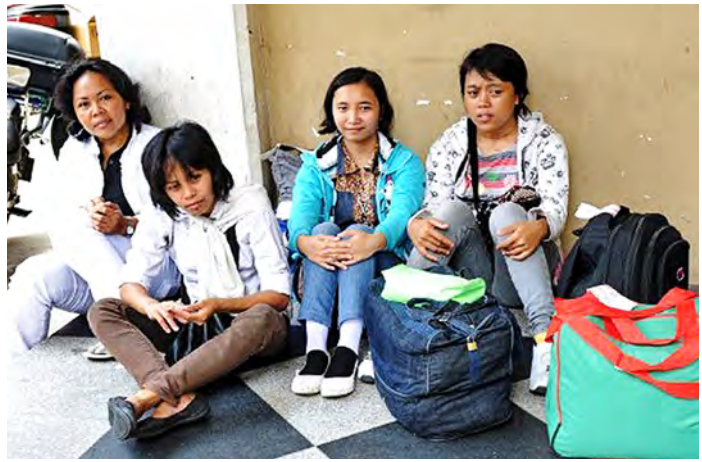
အာရပ်စော်ဘွားများ ပြည်ထောင်စု၌ အလုပ်လုပ်ကိုင်လျက်ရှိကြသော ရွှေ့ပြောင်းအိမ်ဖော်အလုပ်သမားများကို တွေ့ရစဉ်။

ဒူဘိုင်း အောက်တိုဘာ ၂၄ အာရပ်စော်ဘွားများ ပြည်ထောင်စု (ယူအေအီး)၌ ရွှေ့ပြောင်းအိမ်ဖော် အလုပ်သမားများသည် ရိုက်နှက်ခံရခြင်း၊ လုပ်အားအမြတ်ထုတ်ခံရခြင်း၊ အတင်းအဓမ္မစေခိုင်းခံရခြင်းတို့ ရှိနေကြောင်း လူ့အခွင့်အရေးစောင့်ကြည့်ရေးအဖွဲ့က ထုတ်ပြန်သော အစီရင်ခံစာတွင် ဖော်ပြထားသည်။ ယူအေအီး အစိုးရအဖွဲ့သည် အိမ်ဖော် အလုပ်သမားများကို ထိထိရောက်ရောက် ကာကွယ်စောင့်ရှောက်ပေးနိုင်ရန် ပျက်ကွက်ခဲ့ကြောင်း၊ ယင်းအိမ်ဖော်အလုပ် သမားများသည် အများအားဖြင့် ဖိလစ်ပိုင် နိုင်ငံမှဖြစ်ကြပြီး အလုပ်ရှင်များနှင့် အလုပ် အကိုင် ရှာဖွေရေးအေဂျင်စီများ၏ မတရား ပြုမှုများကို ခံစားနေကြကြောင်း အစီရင်ခံစာတွင် ဖော်ပြသည်။ ယူအေအီးနိုင်ငံ၏ ပြည်ဝင်ဗီဇာ ဆိုင်ရာတာဝန်ခံမှု စနစ်အရလည်းကောင်း၊ အလုပ်သမား ဥပဒေအရ ရွှေ့ပြောင်း အိမ်ဖော်အလုပ်သမားများအား ကာကွယ်စောင့်ရှောက်ပေးနိုင်မှု မရှိခြင်းကြောင့်လည်း ကောင်း ယင်းအလုပ်သမားများမှာ မတရားပြုမှု ဆက်ဆံခံနေကြောင်း လူ့