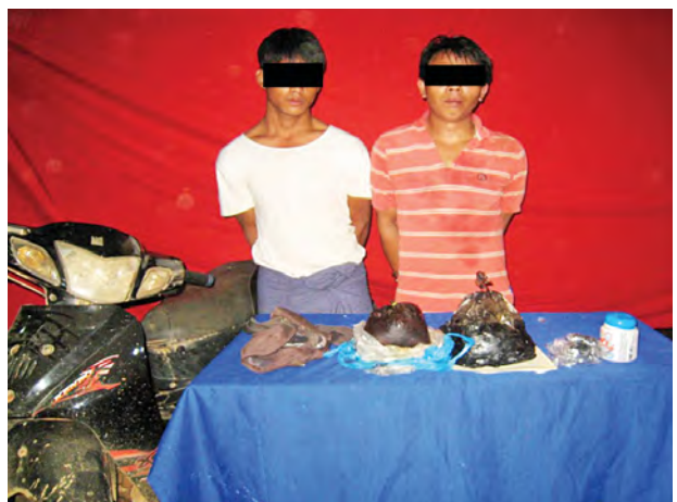
လှတင်နှင့် ယောဟန်(ခ)အားစိတ်ကို နှစ်ဦးအား သိမ်းဆည်းရမိ မူးယစ်ဆေးဝါးများနှင့်အတူ တွေ့ရစဉ်။

မော်လမြိုင် အောက်တိုဘာ ၂၄ မီးလောင်ရာသို့ မော်လမြိုင်မြို့မှ မီးငြိမ်းသတ်ယာဉ် ငါးစီး၊ ရေသယ် ယာဉ်တစ်စီး၊ သန္ဓေမီးသတ်တပ်ဖွဲ့ဝင် ၂၅ ဦးနှင့် အဆိုပါရပ်ကွက်ရှိ အရန် မီးသတ် ၃၀၊ ပြည်သူများက မီးသတ်ဆေးဘူးသုံးဘူးနှင့် ရေပုံးများ အသုံးပြုကာ ဝိုင်းဝန်းငြိမ်းသတ်မှု ကြောင့် မီးလုံးဝငြိမ်းသွားကြောင်း သိရသည်။ (၄၄၀)