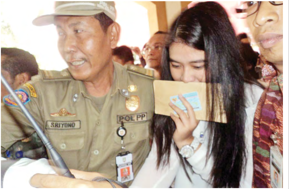
စာမေးပွဲလာရောက်ဖြေဆိုသော အင်ဒိုနီးရှားသမ္မတ၏သမီးကို လုံခြုံရေးတာဝန်ရှိသူများနှင့်အတူ တွေ့ရစဉ်။