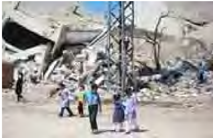
ဂါဇာစီးတီးရီး ပျက်စီးနေသော အဆောက်အအုံတစ်လုံး အနီးမှ ဖြတ်သန်းသွားသော ပါလက်စတိုင်း ကျောင်းသူ၊ ကျောင်းသားကလေးများကို တွေ့ရစဉ်။