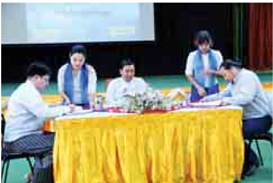
ခဲကြသည်။(အပေါ်ပုံ) ယနေ့စာချုပ်ချုပ်ဆိုပွဲတွင် မြန်မာ့ အသံနှင့် ရုပ်မြင်သံကြားနှင့် Forever Group၊ ရွှေသံလွင် မီဒီယာ၊ မန္တလေး FM၊ ရွှေ FM၊ ပဉ္စဝတီ FM၊ ချယ်ရီ FM၊ ပတ္တမြား FM၊ FM ပုဂံတို့နှင့် မူလစာချုပ်များအပေါ် ပြင်ဆင်ဖြည့် စွက်သည့်စာချုပ်များ လက်မှတ်ရေးထိုး ခဲ့ကြောင်း သိရသည်။