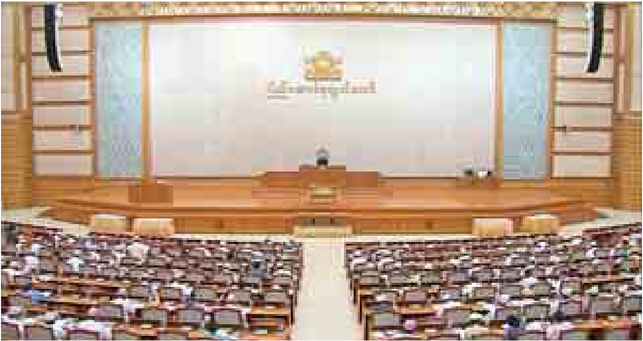
ပထမအကြိမ် ပြည်ထောင်စုလွှတ်တော် (၁၁)ကြိမ်မြောက် ပုံမှန်အစည်းအဝေး (၁၆)ရက်မြောက်နေ့ ကျင်းပစဉ်။ (သတင်းစဉ်)