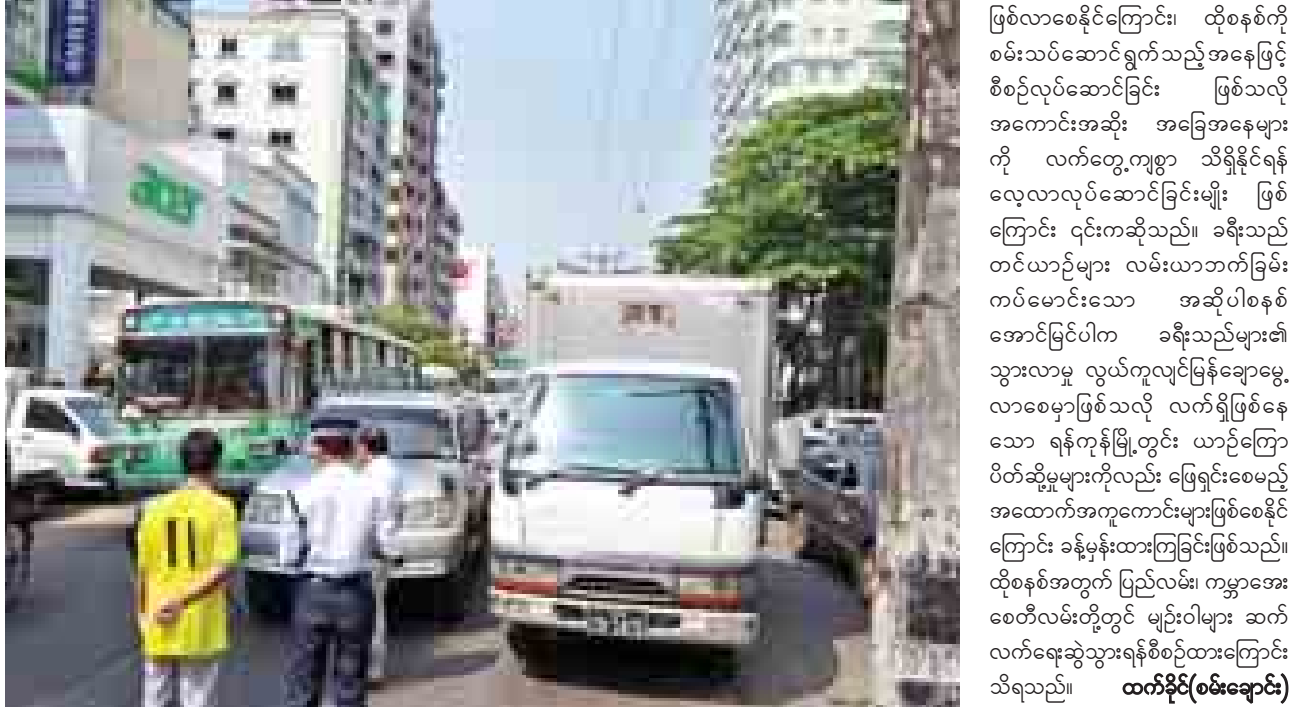
ထက်ခိုင်း(စမ်းချောင်း)