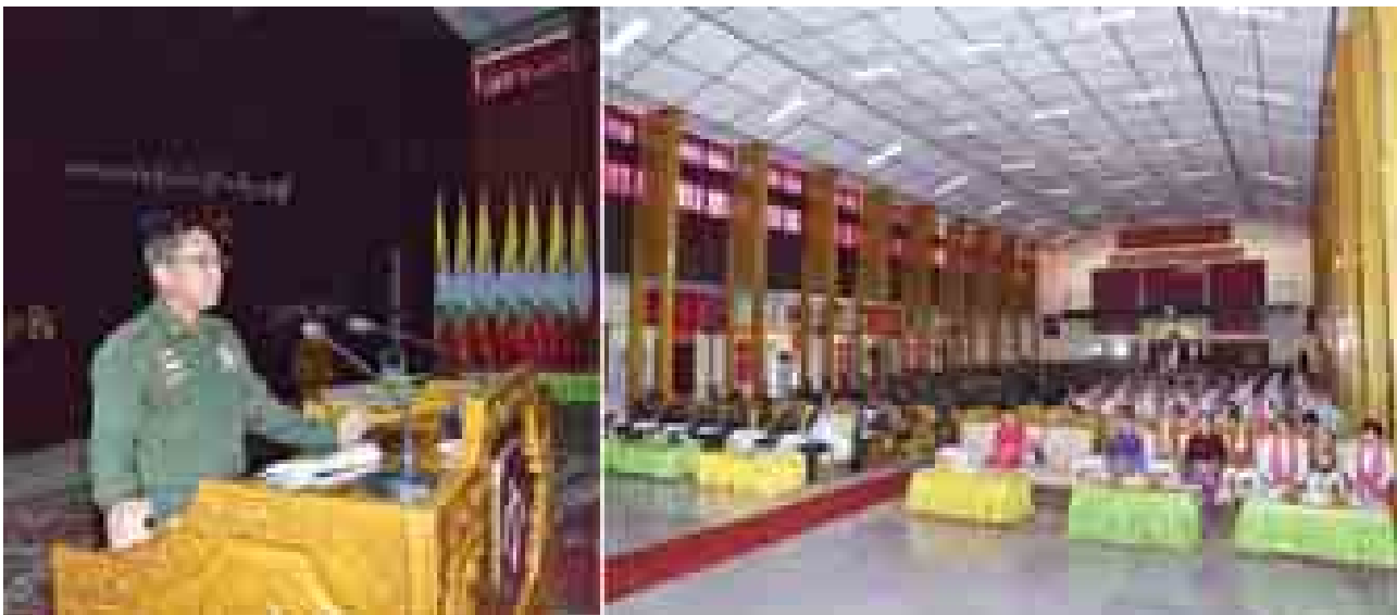
တပ်မတော်ကာကွယ်ရေးဦးစီးချုပ် ဗိုလ်ချုပ်မှူးကြီးမင်းအောင်လှိုင် မုံရွာတပ်နယ်မှ အရာရှိ၊ စစ်သည်မိသားစုများအား တွေ့ဆုံအမှာစကားပြောကြားစဉ်။

တွေ့ဆုံပွဲတွင် တပ်မတော်ကာကွယ်ရေးဦးစီးချုပ်က နိုင်ငံရေးပြုပြင်ပြောင်းလဲမှုများ၌ အမျိုးသားနိုင်ငံရေးဖြစ်သည့် ဦးထိပ်ထားဆောင်ရွက်ရာတွင် တပ်မတော်အနေဖြင့် ခိုင်မာသည့် ရပ်တည်ချက်ဖြင့် ပါဝင်ဆောင်ရွက်နေကြောင်း၊ အုပ်ချုပ်ရေးပြုပြင်ပြောင်းလဲမှုများ၌ မြို့နယ်၊ ခရိုင်အဆင့်များတွင် တရားဥပဒေစိုးမိုးရေး၊ မြို့သာယာလှပရေး၊ မြို့အုပ်ချုပ်ရေးကိစ္စရပ်များ၊ သက်ဆိုင်ရာအုပ်ချုပ်ရေးအဖွဲ့များ၊ မြို့မိမြို့ဖများနှင့်ပေါင်းစပ်၍ ပူးပေါင်းဆောင်ရွက်လျက်ရှိကြောင်း၊ စီးပွားရေးပြုပြင်ပြောင်းလဲမှုများ၌ နိုင်ငံတော်၏ ဈေးကွက်စီးပွားရေးစနစ်ကို အထောက်အကူဖြစ်စေရန် ဥပဒေစည်းမျဉ်းများနှင့်အညီ ဝိုင်းဝန်းလှုပ်ဆောင်နေကြောင်း၊ မိမိနိုင်ငံအတွက် စည်းလုံးညီညွတ်မှုသည် အထူးလိုအပ်သဖြင့် တိုင်းရင်းသားအားလုံး အစွဲများကိုဖျောက်၍ “မြန်မာ” ဆိုသည့်စိတ်ဖြင့် စုစည်းညီညွတ်စွာနေထိုင်လှုပ်ဆောင်ကြရန် လိုအပ်ကြောင်း၊ အဓိကအားဖြင့် ဖွံ့ဖြိုးတိုးတက်မှုအတွက် အလုပ်လုပ်ကြရမည်ဖြစ်ကြောင်း၊ မုံရွာ၊ ပခုက္ကူဒေသများသည် ရာသီဥတုပူပြင်းသောကြောင့် သားစဉ်မြေးဆက်အကျိုးကျေးဇူးဖြစ်ထွန်းစေမည့် သစ်ပင်စိုက်ပျိုးရေးကို အလေးထားလှုပ်ဆောင်ရန် လိုကြောင်း၊ စိုက်ပျိုးပြီးအပင်ရှင်သန်ဖြစ်ထွန်းအောင် ထိန်းသိမ်းစောင့်ရှောက်ရမည်ဖြစ်ကြောင်း၊ ယင်းသစ်ပင်များ ရှင်သန်ကြီးထွားလာပါက ရာသီဥတုကောင်းမွန်မှုကို အထောက်အကူစေနိုင်မည်ဖြစ်ကြောင်းဖြင့် ပြောကြားခဲ့သည်။