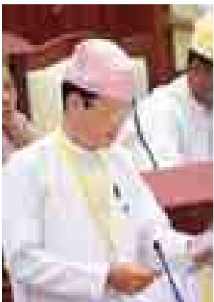
လူဝင်မှုကြီးကြပ်ရေးနှင့် ပြည်သူ့အင်အားဝန်ကြီးဌာန ဒုတိယဝန်ကြီး ဦးဝင်းမြင့်။

စာရင်းစာအုပ်မှ တိုင်းဒေသကြီး၊ ပြည်နယ်အလိုက်လူဦးရေစာရင်းအား ဖူးတွဲဖော်ပြထားပြီး ပြည်သူ့လွှတ်တော်နှင့် အမျိုးသားလွှတ်တော်တို့သို့လည်း ပေးပို့ထားပြီးဖြစ်ပါကြောင်း။ ယင်းရှေ့ပြေးလူဦးရေစာရင်းသည် ၂၀၁၅ခုနှစ်အတွင်းတွင် ထုတ်ပြန်မည့် ပင်မသန်းခေါင်စာရင်းအစီရင်ခံစာနှင့် အနည်းငယ်ကွာဟမှုများရှိမည်ဖြစ်ပါကြောင်း၊ တိုင်းရင်းသားများ၏ လူဦးရေစာရင်းကိုအခြေခံသောထုတ်ပြန်နိုင်မည်ဖြစ်ပြီး လူမျိုး၊ ကိုးကွယ်သည့် ဘာသာ၊ အလုပ်အကိုင် စသည်တို့ကို ထုတ်ပြန်နိုင်မည်မဟုတ်ပါကြောင်း။ ပြည်လုံးကျွတ်သန်းခေါင်စာရင်း၏ ဒုတိယလုပ်ငန်းစဉ်အဖြစ် ထွက်ပေါ်လာမည့် တိုင်းရင်းသားလူမျိုးစု၊ မျိုးနွယ်စုအမည် အရေအတွက်ပေါ်မူတည်ပြီး ပါဝင်ပတ်သက်သော တိုင်းရင်းသားအဖွဲ့အစည်းများဖြင့် ညှိနှိုင်းပြီးမှသာထုတ်ပြန်နိုင်မည်ဖြစ်ပါသောကြောင့် ထပ်မံအချိန်ယူရန်လိုအပ်ပါကြောင်းဖြင့် ဖြေကြားသည်။