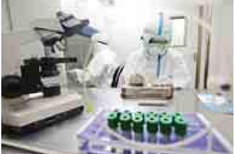
တရုတ်နိုင်ငံ ရှန်တုန်ပြည်နယ် ချင်းတောင်မြို့ရှိ လေဆိပ်၌ ရောဂါပိုးကာကွယ်ရေး ဓာတ်ခွဲခန်းဖွင့်လှစ်ထားသည့် မှတ်တမ်းပုံ။

ဂျီနီဗာ အောက်တိုဘာ ၂၂ အီဘိုလာဗိုင်းရပ်ရောဂါ ကာကွယ်ဆေးကို အစောဆုံးလာမည့် ဇန်နဝါရီလ၌ စမ်းသပ်မှု စတင်ပြုလုပ်နိုင်မည်ဟု ကမ္ဘာ့ကျန်းမာရေးအဖွဲ့(ဒဗလျူအိုဘီအို)က မျှော်လင့်ကြောင်း ကုလသမဂ္ဂ အထက်တန်းတာဝန်ရှိသူတစ်ဦးက အောက်တိုဘာ ၂၂ ရက်တွင် သတင်းထုတ်ပြန်သည်။ အီဘိုလာ ဗိုင်းရပ်ပိုး အဓိကကူးစက်ပျံ့နှံ့နေသည့် အနောက်အာဖရိကနိုင်ငံများနှင့် ယင်းရောဂါပိုး ခြိမ်းခြောက်နေသော ကမ္ဘာဒေသများ၌ တာဝန်ထမ်းဆောင်လျက်ရှိသည့် ကျန်းမာရေးစောင့်ရှောက်မှုလုပ်သား ၂၀၀၀၀ ကျော်ကို အခြေပြု၍ အီဘိုလာရောဂါ ကာကွယ်ဆေး စမ်းသပ်မှုများကို ပြုလုပ်သွားမည်ဖြစ်ကြောင်း ကမ္ဘာ့ကျန်းမာရေးအဖွဲ့ လက်ထောက်ညွှန်ကြားရေးမှူးချုပ် ဒေါက်တာမာရီပေါလ်ကီနီက ပြောကြားသည်။ အနောက်အာဖရိကဒေသ၌ အီဘိုလာရောဂါ ကူးစက်ပြန့်ပွားမှုကြောင့် လူပေါင်း ၄၅၀၀ ကျော် သေဆုံးခဲ့ရသည်။ ပီတီအိုင်။