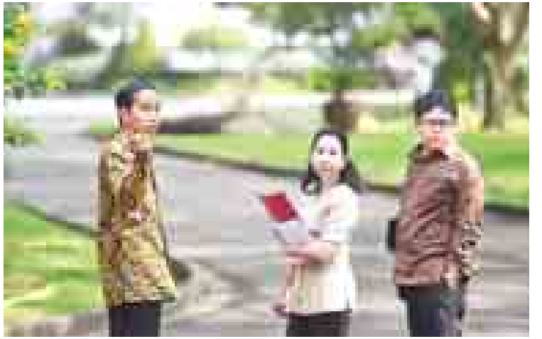
အောက်တိုဘာ ၂၁ ရက်က သမ္မတအဖြစ် စတင်တာဝန်ထမ်းရွက်မှုပထမနေ့တွင် ဂျိုကိုဝီဒိုဒိုအား ၎င်း၏ လက်ထောက်များနှင့်အတူ တွေ့မြင်ရစဉ်။

ခဲ့ခြင်းသည် ယခင်က အစဉ်အလာမရှိခဲ့သော ထူးခြားသည့် လုပ်ဆောင်ချက်တစ်ရပ်ဖြစ်သည်။ အစားထိုး အဂတိလိုက်စားမှု တိုက်ဖျက်ရေးအေဂျင်စီက ကန့်ကွက်မှုရှိသည့် ပုဂ္ဂိုလ်များ၏ နေရာတွင် အခြားပုဂ္ဂိုလ်များဖြင့် အစားထိုးကာ အမည်စာရင်း ထပ်မံတင်သွင်းမည်ဖြစ်ကြောင်း ဝီဒိုဒိုက ပြောကြားသည်။ ရိုက်တာ။