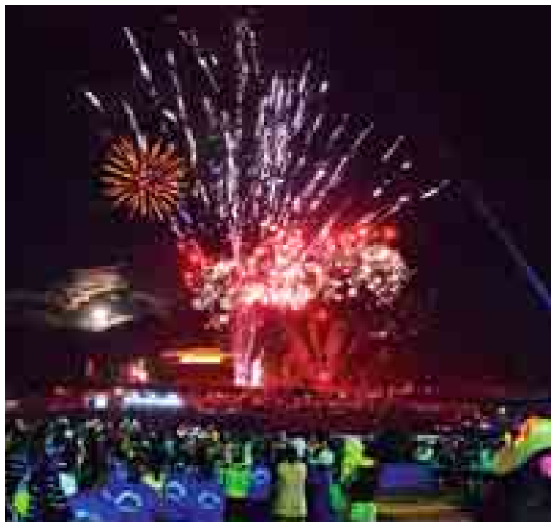
ယမန်နှစ်က မီးပုံးပျံပွဲတော်ကို တွေ့ရစဉ်။