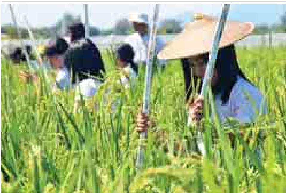
အောက်တိုဘာ ၂၀ ရက်က ကချင်ပြည်နယ် မိုးညှင်းမြို့နယ် စိုက်ပျိုးရေးဦးစီးဌာနက ကြီးပွား၍ ပုလဲသွယ်(၁) အထူးအထွက်တိုးစပ်မျိုးစပါး F-1 ထုတ်လုပ်ရေး ဝတ်မှုန်ကူးပွဲကျင်းပစဉ်။

နေပြည်တော် အောက်တိုဘာ ၂၀ သိပ္ပံနှင့် နည်းပညာဝန်ကြီးဌာန ပြည်ထောင်စုဝန်ကြီး ဒေါက်တာ ကိုကိုဦးသည် အောက်တိုဘာ ၂၀ ရက်