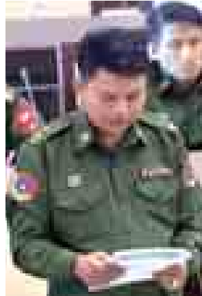
တပ်မတော်သားကိုယ်စားလှယ် ဒုတိယဗိုလ်မှူးကြီး သိန်းလွင်။