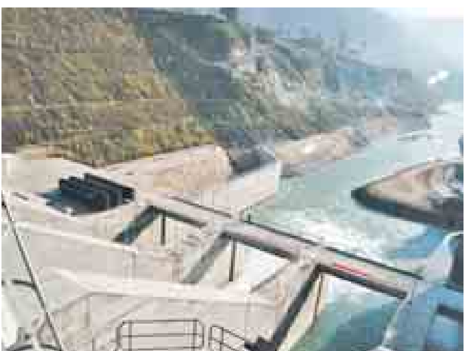
နီပေါနိုင်ငံ၌ တည်ဆောက်လျက်ရှိသော ရေအားလျှပ်စစ် ထုတ်လုပ်ရေးစီမံကိန်း မှတ်တမ်းပုံ။