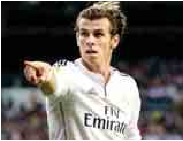
ကစားပေးနိုင်ခဲ့သည်။ လက်ရှိတွင် ဂါရတ်ဘေးလ် ဒဏ်ရာပြဿနာ ကြုံတွေ့နေသော်လည်း ယခုနှစ် ဘောလုံးရာသီတွင် ရီးယဲလ်မက်ဒရစ်

နိုင်ခဲ့ခြင်းမရှိခဲ့ကြောင်း သိရသည်။ ထို့ကြောင့် လီဗာပူးအသင်းနှင့် ကစားရမည့် ချန်ပီယံလိဂ်ပွဲစဉ်အတွက် ကစားသမား ၂၀ ရွေးချယ်ခဲ့ရာတွင်လည်း ရီးယဲလ်မက်ဒရစ်အသင်း နည်းပြအန်ဆယ်လော့တီက တိုက်စစ်မှူး ဂါရတ်ဘေးလ်အား ချန်လှပ်ထားခဲ့ခြင်းဖြစ်သည်။ တိုက်စစ်မှူး ဂါရတ်ဘေးလ်သည် ဘော့စနီးယား၊ ဆိုက်ပရပ်စ်သည့် အသင်းများနှင့် ယှဉ်ပြိုင်ကစားခဲ့သည့် ယူရို ၂၀၁၆ ဝင်ခွင့်ပြိုင်ပွဲတွင်မူ ဝေလအသင်းနှင့်အတူ ပွဲချိန်ပြည့်ပါဝင်