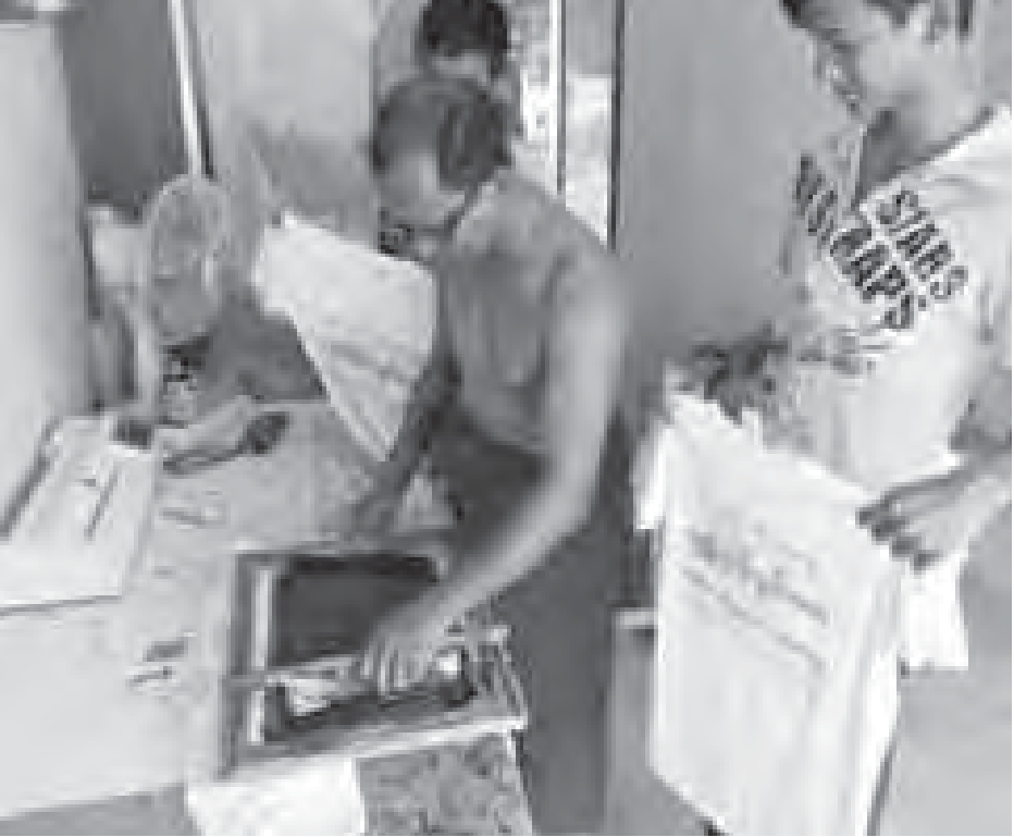
ဖိတ်ကြားမှု ဓလေ့ထွန်းကားလာပြီး တံဆိပ်ရိုက်လုပ်ငန်းများ အနေဖြင့် ကာယကံရှင်၏ မှာကြားမှုကို လိုက် ကာ စွပ်ကျယ်အကျီများ၊ တီရှပ်အကျီ များကို တံဆိပ်ရိုက်ပေးရကြောင်း သိ