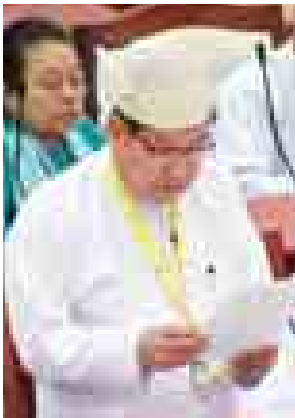
လယ်ယာစိုက်ပျိုးရေးနှင့် ဆည်မြောင်းဝန်ကြီးဌာန ဒုတိယဝန်ကြီး ဦးခင်ဇော်။

ရွှေဘိုမဲဆန္ဒနယ်မှ ဒေါက်တာ အောင်သန်း၏ “ဦးစပါးစိုက်ပျိုးစရိတ် ချေးငွေများကို နွေစပါးစိုက်ပျိုးစရိတ် ချေးငွေပေးသွင်းပြီးမှ ထုတ်ချေးမည် ဆိုသော စည်းကမ်းချက်အား သဘာဝ ဘေးဒဏ်နှင့် ပိုးမွှားများကြောင့် သီးနှံ များ ပျက်စီးဆုံးရှုံး၍ ပြန်လည်ပေး ဆပ်ရန် အခက်အခဲဖြစ်နေသော လယ်သမားများအတွက် ဖြေလျှော့ ပေးရန်ကိစ္စ” နှင့် စပ်လျဉ်းသည့် မေးခွန်းကို လယ်ယာစိုက်ပျိုးရေးနှင့် ဆည်မြောင်းဝန်ကြီးဌာန ဒုတိယ ဝန်ကြီး ဦးခင်ဇော်ကမြန်မာ့လယ်ယာ ဖွံ့ဖြိုးရေးဘဏ်အနေဖြင့် တောင်သူ များသို့ ချေးငွေများထုတ်ချေးပြီး သတ်မှတ်ကာလအတွင်း မြန်မာ့စီးပွား ရေးဘဏ်သို့ အတိုးနှင့်တကွ ပြန်လည်ပေးဆပ်နေရခြင်းဖြစ်သဖြင့် ပြန်လည်ပေးဆပ်ရန် အခက်အခဲဖြစ် သည့် တောင်သူများအတွက် ဖြေလျှော့ ပေးရန်ကိစ္စသည် တစ်စည်းမျဉ်းစည်း ကမ်းများအရ ဆောင်ရွက်ပေး၍ မရနိုင်ပါကြောင်း။