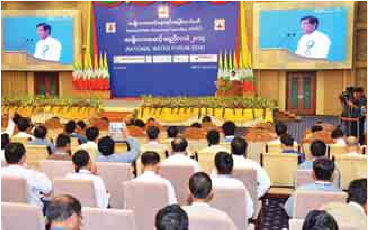
ဒုတိယသမ္မတ ဦးဉာဏ်ထွန်း အမျိုးသားအဆင့် ရေညီလာခံ ၂၀၁၄ အခမ်းအနားတွင် အမှာစကားပြောကြားစဉ်။

နေပြည်တော် အောက်တိုဘာ ၂၀ အမျိုးသားအဆင့် ရေညီလာခံ ၂၀၁၄ အခမ်းအနားကို ယနေ့နံနက် ၉ နာရီတွင် နေပြည်တော်ရှိ မြန်မာ အပြည်ပြည်ဆိုင်ရာ ကွန်ဗင်းရှင်းဗဟို ဌာန၌ ကျင်းပရာ အမျိုးသားအဆင့် ရေအရင်းအမြစ်ကော်မတီဥက္ကဋ္ဌ ပြည်ထောင်စုသမ္မတမြန်မာနိုင်ငံတော် ဒုတိယသမ္မတ ဦးဉာဏ်ထွန်း တက်ရောက်၍ အဖွင့်အမှာစကား ပြောကြားသည်။