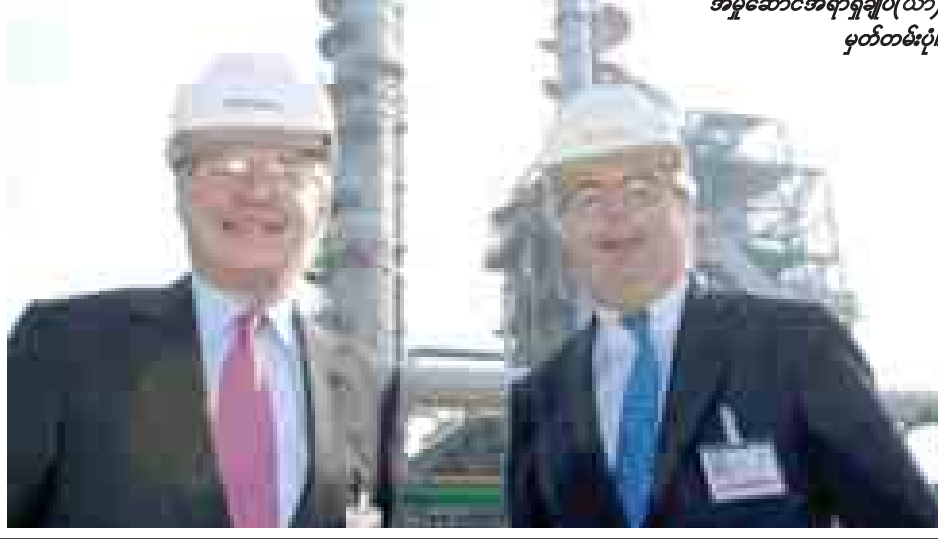
လေယာဉ်ပျက်ကျမှုကြောင့် ကွယ်လွန်ခဲ့ရသူ တိုတယ်လ်ကုမ္ပဏီ အမှုဆောင်အရာရှိချုပ်(ယာ) မှတ်တမ်းပုံ။

ပြင်သစ်နိုင်ငံမှ ရေနံကုမ္ပဏီဖြစ်သော တိုတယ်လ် ကုမ္ပဏီ၏ အမှုဆောင်အရာရှိချုပ် ခရစ္စတိုဖာဒီမာဂီယေးသည် အောက်တိုဘာ ၂၀ ရက်က ရုရှားနိုင်ငံမော်စကိုမြို့တွင် လေယာဉ်ပျက်ကျမှုကြောင့် ကွယ်လွန်သွားကြောင်း ဒေသဆိုင်ရာသတင်းဌာနများက သတင်းထုတ်ပြန်သည်။ ဒီမာဂီယေးနှင့်အဖွဲ့ စီးနင်းလာသော ပုဂ္ဂလိကကျက် လေယာဉ်သည် မော်စကိုလေဆိပ်၌ ဆီးနှင်းခဲ ရှင်းလင်းရေးယာဉ်နှင့် အရှိန်ပြင်းစွာတိုက်မိပြီး လေယာဉ်မီးလောင်ခဲ့သည်။ ယင်းဖြစ်ရပ်ကြောင့် လေယာဉ်ပေါ်ပါ လူလေးဦးစလုံး သေဆုံးခဲ့ရသည်။ ဆီးနှင်းခဲရှင်းလင်းရေးယာဉ် မောင်းနှင်သူမှာ အရက်သေစာသောက်စားထားသည်ဟု ရုရှားစုံစမ်းစစ်ဆေးသူများက ပြောကြားကြသည်။ ဥရောပတိုက်၏ တတိယအကြီးဆုံး ရေနံလုပ်ငန်းကုမ္ပဏီ၏ အမှုဆောင်အရာရှိချုပ်ရာထူးတွင် ၂၀၀၇ ခုနှစ်မှစ၍ တာဝန်ထမ်းဆောင်ခဲ့သူ မစ္စတာဒီမာဂီယေးသည် သေဆုံးချိန်တွင် အသက် ၆၃ နှစ်ရှိပြီ ဖြစ်သည်။ ပြင်သစ်နိုင်ငံသည် ထူးချွန်သော စီးပွားရေးခေါင်းဆောင်တစ်ဦးကို ဆုံးရှုံးခဲ့ရကြောင်း၊ ၎င်းသည် တိုတယ်လ်ရေနံကုမ္ပဏီအား ကမ္ဘာပေါ်တွင် ကြီးမားသော လုပ်ငန်းကြီးအဖြစ် ပြောင်းလဲစေနိုင်ခဲ့ကြောင်း ပြင်သစ်ဝန်ကြီးချုပ်က ပြောကြားသည်။ ဒီမာဂီယေး သေဆုံးခြင်းအတွက် ဝမ်းနည်းကြောင်း သမ္မတတူတင်က ပြောကြားသည်။