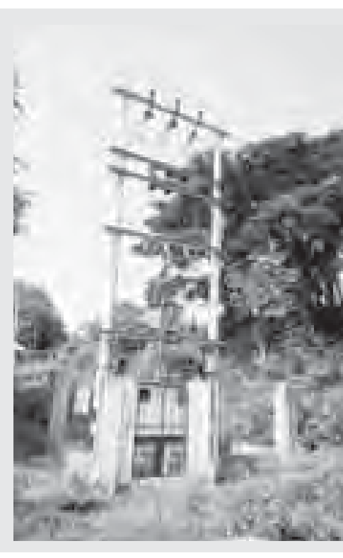
ပဲခူးတိုင်းဒေသကြီး၊ သာယာဝတီခရိုင်၊ နတ်တလင်းမြို့နယ်၊ တာပွန် နယ်မြေရှိ ၁၁ : ၀၃၁၈ ၄ : ၅၀ KBA ထရန်စမော်ဘာသည့် မြန်မာ့ဆက်သွယ်ရေးလုပ်ငန်းပိုင်ဖြစ်ပြီး ထရန်စမော်ဘာနေရာအား ချုံနယ်များရစ်ပတ်နေခြင်းကို အောက်တိုဘာ ၁၆ ရက် နံနက် ၁၀ နာရီတွင် တာပွန်လျှပ်စစ်ဓာတ်အားဖြန့်ဖြူးရေးလုပ်ငန်းနှင့် မြန်မာ့ဆက်သွယ်ရေးလုပ်ငန်းမှ ဝန်ထမ်းများပေါင်း၍ ရှင်းလင်းသွားပြီဖြစ်ကြောင်း သိရသည်။ ယင်းနောက် လျှပ်စစ်အန္တရာယ်ကင်းရှင်းရေးအတွက် အောက်တိုဘာ ၁၇ ရက်တွင် သစ်ကိုင်းသစ်စက်များကို လျှပ်စစ်ဝန်ထမ်းများက ခုတ်ထွင်ရှင်းလင်းခဲ့ကြောင်း သိရသည်။