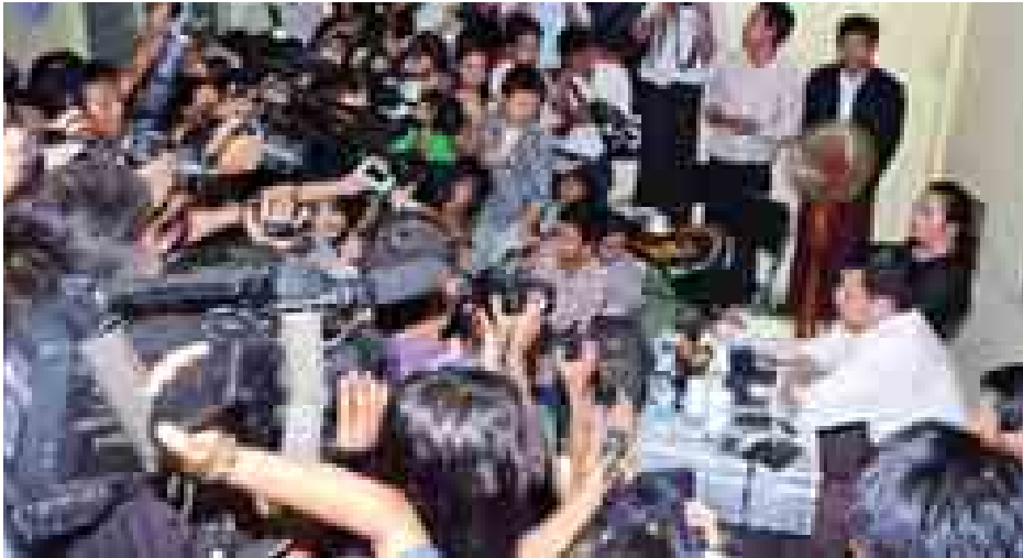
ပြည်ထောင်စုဝန်ကြီး ဦးရဲထွဋ် မြန်မာနိုင်ငံ ဂျာနယ်လစ်ကွန်ရက်ရုံးတွင် သတင်းမီဒီယာသမားများနှင့် တွေ့ဆုံမြေကြားစဉ်။

လူငယ်စာနယ်ဇင်းသမား အများစုဖြင့် ဖွဲ့စည်းထားသော မြန်မာ့ဂျာနယ်လစ်ကွန်ရက် (MJN)နှင့် ပြန်ကြားရေးဝန်ကြီးဌာန ပြည်ထောင်စုဝန်ကြီး ဦးရဲထွဋ်တို့သည် ယနေ့ မွန်းလွဲ ၁ နာရီက ရန်ကုန်မြို့ရှိ MJN ရုံးခန်း၌ ပထမဆုံးအကြိမ် တွေ့ဆုံခဲ့ကြပြီး လတ်တလောဖြစ်ပေါ်နေသည့် သတင်းမီဒီယာ အရေးကိစ္စများကို အပြေရှာရန် ဆွေးနွေးခဲ့သည်။