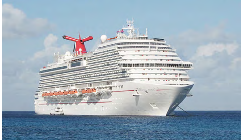
အိတ်လုပ်ခြင်းရပ်စဲပေး ခြောက်လှန့်မှုဖြစ်ပေါ်ခဲ့သော အပျော်စီးသင်္ဘောကြီးကို တွေ့ရစဉ်။