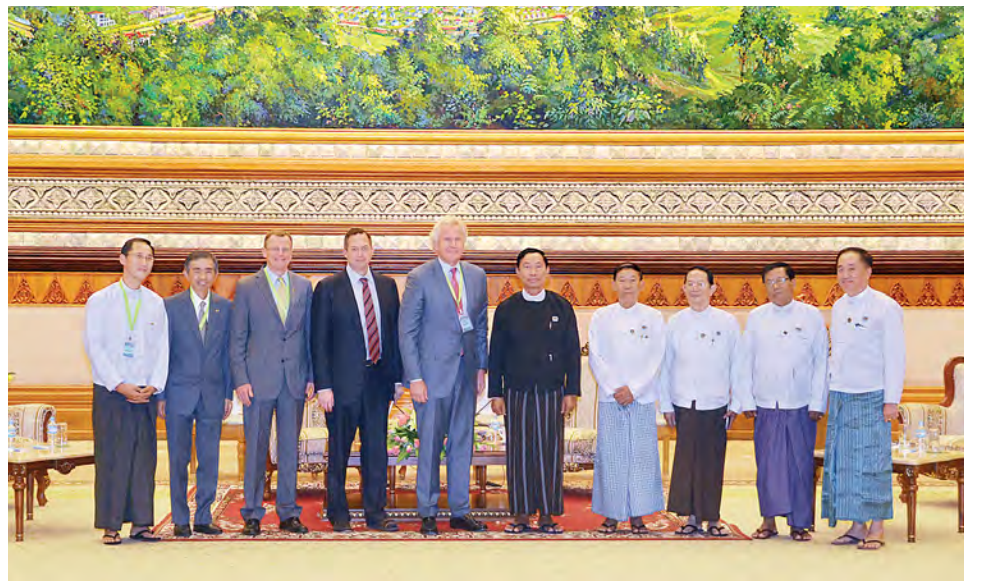
ပြည်ထောင်စုလွှတ်တော်နာယက ပြည်သူ့လွှတ်တော်ဥက္ကဋ္ဌ သူရဦးရွှေမန်း အမေရိကန်ဂျီအီးကုမ္ပဏီဥက္ကဋ္ဌနှင့် အမှုဆောင်အရာရှိချုပ် မစ္စတာဂျက်ဖ်ဖရီအင်မက် ဦးဆောင်သော ကိုယ်စားလှယ်အဖွဲ့နှင့်အတူ မှတ်တမ်းတင်ဓာတ်ပုံရိုက်စဉ်။ (သတင်းစဉ်)