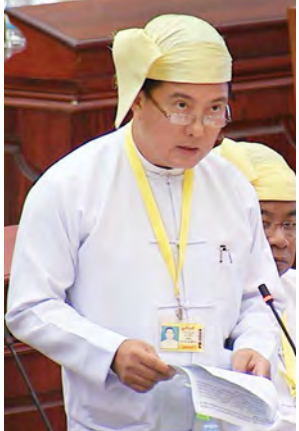
စီးပွားရေးနှင့်ကူးသန်းရောင်း ဝယ်ရေးဝန်ကြီးဌာန ဒုတိယဝန်ကြီး ဒေါက်တာပွင့်ဆန်း။

စည်ပင်သာယာရေးကော်မတီနှင့် မြို့နယ်ဖွံ့ဖြိုးတိုးတက်မှု အထောက်အကူပြု ကော်မတီများက ဆောင်ရွက်လျက်ရှိပါကြောင်း၊ မြို့နယ်အတွင်းဆောင်ရွက် ရန်လိုအပ်သည့် ပညာရေး၊ ကျန်းမာရေး၊ လျှပ်စစ်မီး၊ လမ်း၊ တံတားစသည့် ကဏ္ဍဆိုင်ရာစီမံကိန်းများကိုလည်း သက်ဆိုင်ရာပြည်ထောင်စုဝန်ကြီးဌာန