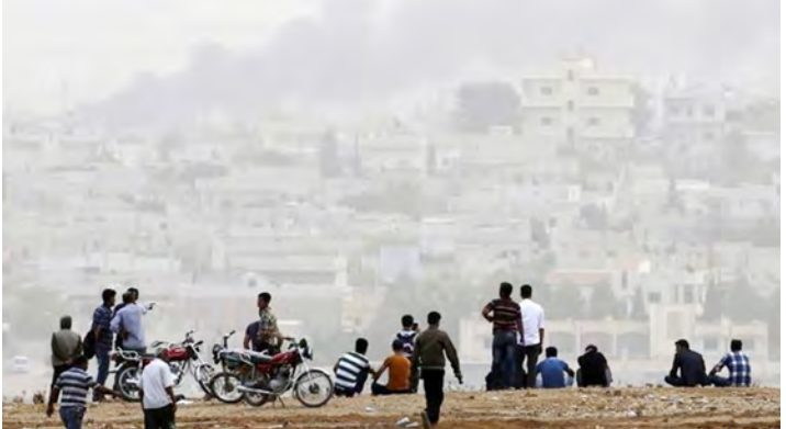
ကိုဘာနီမြို့၌ တိုက်ခိုက်မှုများ ဖြစ်ပွားနေပုံကို တူရကီနယ်စပ်မှ ကာဒ်များစောင့်ကြည့်နေကြစဉ်။