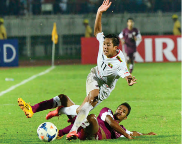
မြန်မာအသင်းနှင့် ကာတာအသင်းတို့ အကြိတ်အနယ် ယှဉ်ပြိုင်နေစဉ်။

ကာတာအသင်းရိုးသမား ကာကွယ်နိုင်ခဲ့သောကြောင့် ပွဲအပြီးတွင် သုံးရိုး-နှစ်ရိုးဖြင့် ကာတာအသင်းအနိုင်ရရှိခဲ့သည်။ အိမ်ရှင်မြန်မာယူ-၁၉ အသင်းသည် ယခုပွဲတွင် ရှုံးနိမ့်ခဲ့သော်လည်း ယူ-၂၀ကမ္ဘာ့ဖလားပြိုင်ပွဲကို ဝင်ရောက်ယှဉ်ပြိုင်ခွင့် ရရှိခဲ့သည်။ အခြားတစ်ဖက်တွင် ယှဉ်ပြိုင်ကစားခဲ့သော မြောက်ကိုရီးယားနှင့် ဥရဘက်ကစွတန်အသင်းတို့ပွဲစဉ်တွင် မြောက်ကိုရီးယားအသင်းက ဝါးရိုး-ရိုးမရှိဖြင့် အနိုင်ရရှိခဲ့သည်။ ဆီမီးပိုင်နယ်တွင် ရှုံးနိမ့်ခဲ့သော အိမ်ရှင် မြန်မာယူ-၁၉ အသင်းနှင့် ဥရဘက်ကစွတန်အသင်းတို့ ပူးတွဲတတိယရရှိခဲ့သည်။ ၂၀၁၄ အာရှယူ-၁၉ ပြိုင်ပွဲ၏ ဗိုလ်လုပွဲစဉ်ကို အောက်တိုဘာ ၂၃ ရက်တွင် ရန်ကုန်မြို့လူငယ်အားကစားလေ့ကျင့်ရေးစခန်း (သုဝဏ္ဏ)ဘောလုံးကွင်း၌ မြောက်ကိုရီးယားအသင်းနှင့် ကာတာအသင်းတို့ ယှဉ်ပြိုင်ကစားကြမည်ဖြစ်ကြောင်း သိရသည်။ မောင်မောင်ဇော်