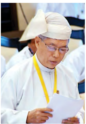
ပို့ဆောင်ရေးဝန်ကြီးဌာန ဒုတိယဝန်ကြီး ဦးဟိန်နီ။

မကွေးတိုင်းဒေသကြီး မဲဆန္ဒနယ် အမှတ်(၉)မှ ဦးသော်ဝင်ဦး၏ “ပခုက္ကူမြို့နယ်ရှိ ဧရာဝတီမြစ်ကူး တံတား(ပခုက္ကူ)၏ အောက်ဘက်တွင် ရှိသော မြစ်ကြောင်းတစ်လျှောက်ရှိ ကျေးရွာများအား ကမ်းပါးပြိုပြီး ကျေးရွာမြေများ၊ စိုက်ပျိုးမြေများ ဆုံးရှုံးနေခြင်းမှ ကာကွယ်နိုင်ရန် အတွက် ဧရာဝတီမြစ်ကြောင်းကို ထိန်းသိမ်းပေးရန် အစီအစဉ်ရှိ မရှိ” မေးခွန်းနှင့်စပ်လျဉ်း၍ ပို့ဆောင်ရေး ဝန်ကြီးဌာန ဒုတိယဝန်ကြီး ဦးဟိန်နီ က ကွင်းဆင်းစစ်ဆေးတွေ့ရှိချက် များအရ ကမ်းပြိုကာကွယ်ရေးကိုသာ ရည်ရွယ်ပြီး Steel Basket ကျောက် ဖြည့်ရေကာ တည်ဆောက်ခြင်းမှာ ကုန်ကျစရိတ်များပြားပြီး ကမ်းပြို ဧရိယာတစ်ခုလုံး ကာကွယ်ပေးနိုင် သည့်အတွက် ဆောင်ရွက်ခြင်းမပြုဘဲ လက်ရှိရေလမ်းကြောင်းကို ပြုပြင် ခြင်းဖြင့် ရေတိုက်စားကမ်းပြိုမှုများကို လျော့နည်းသွားစေရန် ဆောင်ရွက် သင့်ပြီး ထိုသို့ရေလမ်းကြောင်းပြောင်း လဲရန် ပခုက္ကူတံတား တိုင်အမှတ် (၁၃)အနီးမှ သဲကုန်းကျေးရွာရှေ့ရှိ ရေလမ်းပေါက်သို့ နီးကပ်သော ရေလမ်းကြောင်း တူးဖော်ခြင်းကိုသာ ဦးစားပေးဆောင်ရွက်သင့်ပါကြောင်း၊ ရေလမ်းကြောင်းပြုပြင်ရန် သောင်တူး