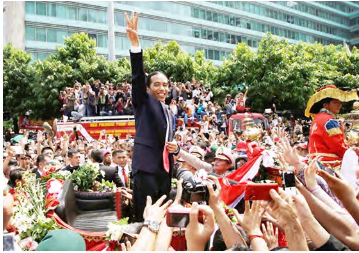
အောက်တိုဘာ ၂၀ ရက်က အင်ဒိုနီးရှား သမ္မတအဖြစ် ကျမ်းသစ္စာ ကျိန်ဆိုပြီးနောက် ပြည်သူများအား နှုတ်ဆက်နေသော ဝီဒိုဒိုအား တွေ့ရစဉ်။